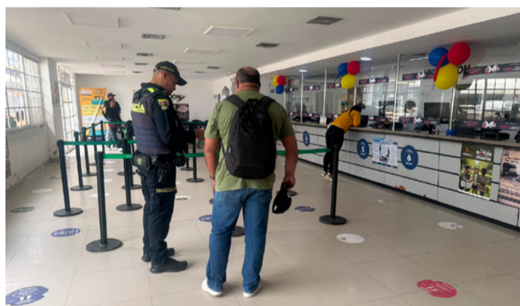
La actividad se desarrolló en las instalaciones de la oficina de Migración y sus alrededores.

El oficial indicó que, aunque lleva pocos días al frente de la Estación de Policía, ya se encuentran priorizados algunos sectores donde se reforzará la presencia institucional, entre ellos los barrios El Amaría, Seis de Abril y El Cafetal, considerados puntos estratégicos para las labores preventivas y operativas.