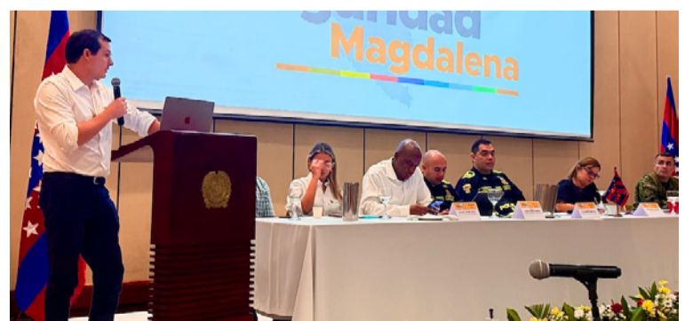
La petición responde al deterioro de la seguridad en Zona Bananera, Ciénaga, El Retén, Aracataca y Fundación.

ductores grandes, medianos y pequeños mediante extorsiones. Su accionar ha llegado a paralizar labores en varias fincas: hombres armados ingresan a las plantaciones, detienen las operaciones y entregan números telefónicos a los administradores para exigir pagos a cambio de supuestas garantías de seguridad. La dimensión del problema queda ilustrada por las cifras del programa Cómo Vamos: Zona Bananera supera los 80 homicidios por cada 100.000 ha-