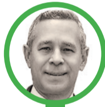
Por Jorge Juan Orozco Sánchez

El concepto de la 'Patria milagro' no pertenece al plan de Gobierno del actual presidente Gustavo Petro, sino a la plataforma del presidente electo de Colombia, Abelardo De la Espriella. Quien anunció medidas para recuperar el orden, la salud, la seguridad y las finanzas públicas, dando inicio a la 'Patria milagro', aquí es donde La Guajira espera que se dé el milagro de agua