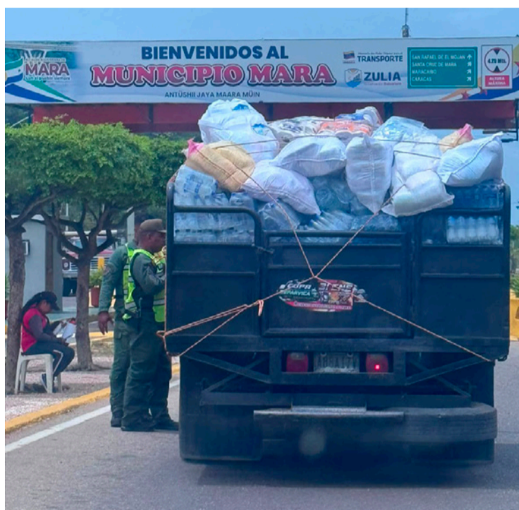
El Distrito reitera que la campaña continuará y que en los próximos días se realizarán nuevos envíos humanitarios.