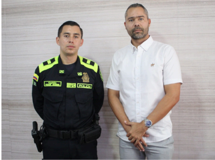
El oficial dijo que se encuentran priorizados algunos sectores donde se reforzará la presencia institucional.

confirmó que, de manera simultánea con su llegada al municipio, fue desplegado un grupo de apoyo conformado por integrantes del Grupo de Operaciones Especiales (Goes) y de la Seccional de Investigación Criminal (Sijín), quienes adelantan investigaciones relacionadas con recientes hechos de violencia registrados en Villanueva.