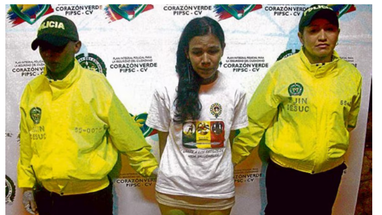
La mujer al momento de la captura no fue agredida física ni verbalmente, respetándole todos sus derechos.

mó que la mujer al momento de la captura no fue agredida física ni verbalmente, respetándole todos sus derechos. Hasta el momento no hay un pronunciamiento oficial por parte de las autoridades competentes para conocer en detalles el momento de la captura y si será enviada al departamento de Sucre donde debe responder por el delito que se le acusa.