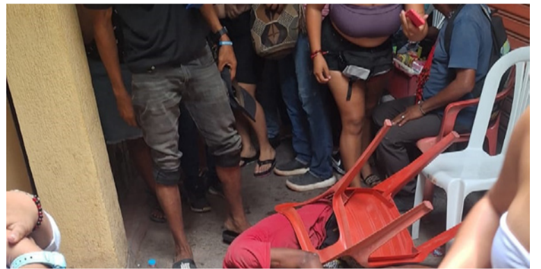
Se conoció que la víctima se encontraba bebiendo con otras personas en una de las cantinas del sector.

Hasta el momento se desconoce la identidad de la víctima. Al lugar se trasladaron miembros de la Policía Nacional para acordonar la zona a espera de los investigadores judiciales para la inspección técnica al cadáver y los actos de urgencia.