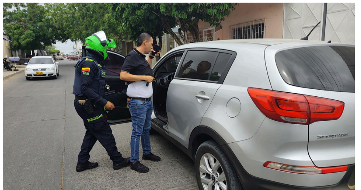
Los uniformados realizaron registros a personas, solicitud y verificación de antecedentes.

La Policía Nacional invita a la ciudadanía a continuar denunciando cualquier hecho que afecte la seguridad y a trabajar de manera conjunta con las autoridades para consolidar entornos más seguros.