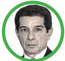
José Félix Lafaurie Rivera @jflafaurie

Como si no fuera suficiente la impunidad de la JEP, los acuerdos entre el Gobierno y bandas criminales no son apenas un escándalo más, sino la evidencia de que la 'Paz Total' escondía un plan de 'Impunidad Total', con normas para minar la justicia y favorecer criminales que com-