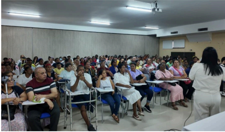
Desde la Administración se enfatizó el compromiso de abrir espacios reales de participación económica.

Con la socialización de la Ruta de Emprendimiento para la convocatoria SAL 005 de 2026, el programa 'Sin Límites' entró en una nueva fase clave. Durante