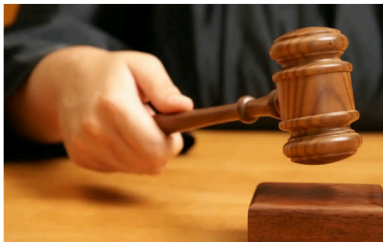
El juzgado le advierte a la Administración departamental se abstenga de negar el acceso a la información pública.

Se precisa que así las cosas, dado que la información solicitada debe ser expuesta de forma natural en las bases de datos de las entidades, no le asistía al ente territorial enjuiciado, negar el suministro de lo solicitado por el actor en su petición, máxime cuando la negativa no fue sustentada de manera adecuada, como quiera que además de la redacción indiscriminada de diferentes normas alusivas a la protección de la información y a reserva de la misma, la Gobernación de La Guajira no sustentó su decisión de acuerdo a las normas aplicables al caso y la jurisprudencia emitida por las altas Cortes.