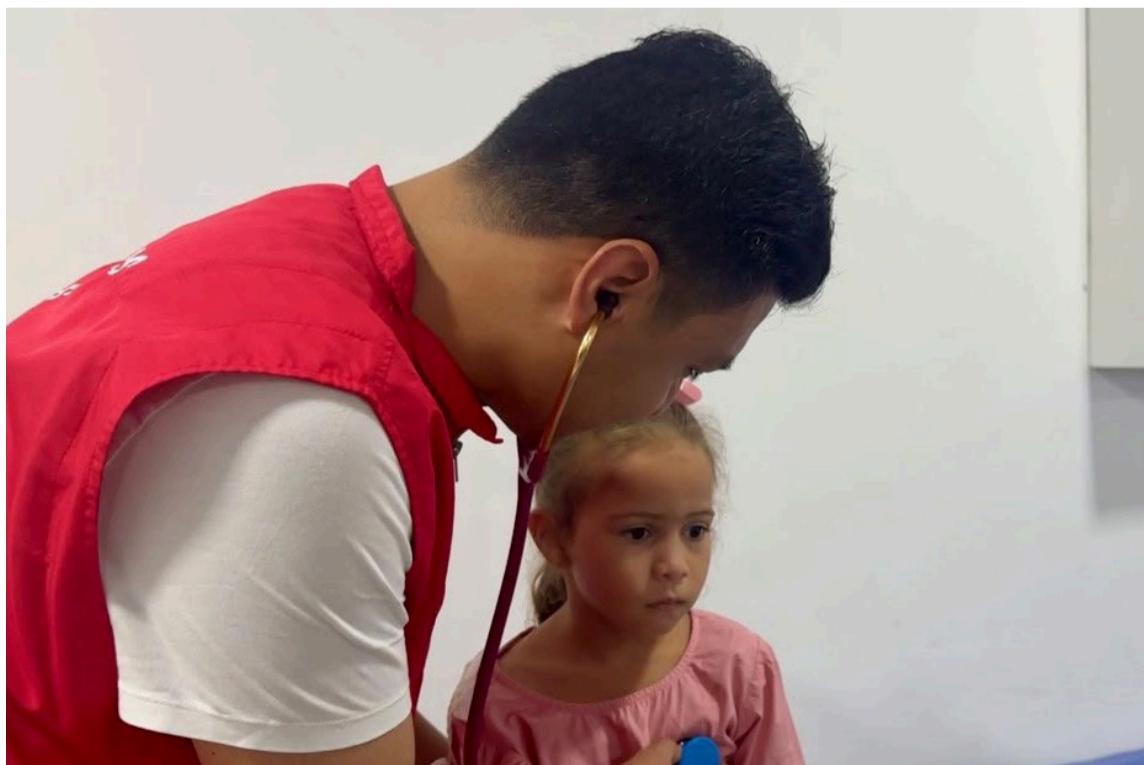
Especialistas en cardiología pediátrica realizaron la valoración clínica de los menores.

Con esta iniciativa, las entidades organizadoras continúan sumando esfuerzos para ampliar el acceso a servicios de salud especializados y garantizar una atención oportuna para la niñez y adolescencia del Departamento.