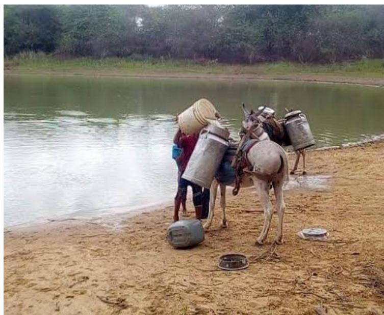
El presidente electo ha puesto el abastecimiento de agua para la Alta Guajira como una prioridad.

Un milagro es un suceso extraordinario e inusual que no puede explicarse mediante las leyes científicas o naturales, por lo que comúnmente se atribuye a una intervención divina o sobrenatural, en el lenguaje común, la palabra se usa de manera más amplia para describir eventos sumamente afortunados, improbables o la resolución de problemas difíciles. Por ejemplo, que los 15 municipios de La Guajira cuenten con agua apta para consumo humano y la continuidad de las 24 horas o lograr una meta que parecía imposible, pero que hoy puede ser una realidad en el Gobierno de la 'Patria milagro', que inicia el próximo 7 de agosto.