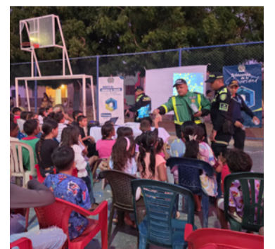
Se busca la construcción de entornos más seguros.

El Departamento de Policía La Guajira reitera su compromiso de continuar desarrollando estrategias preventivas y de acercamiento con la comunidad.