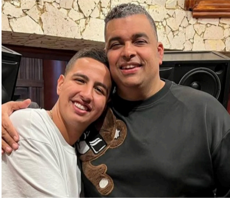
La pasión de Jr. no solo sorprende a quienes lo rodean, también mantiene vivo el legado de su padre,

El joven artista no solo imitó el estilo de su padre: también evocó su presencia, su energía y esa esencia que hizo grande al recordado cantante. Para Rolando, fue como revivir