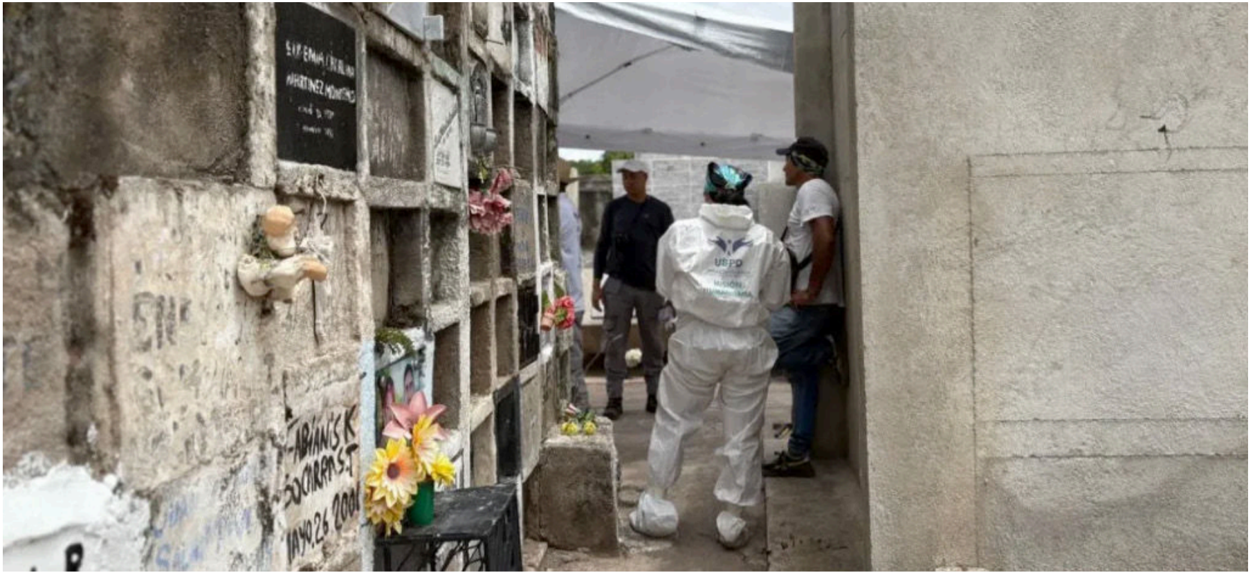
Las más de 5.900 familias que buscan a sus seres desaparecidos en estos departamentos del Caribe comparten el mismo vacío en sus vidas.

La Ubpd ha recuperado más de 350 cuerpos