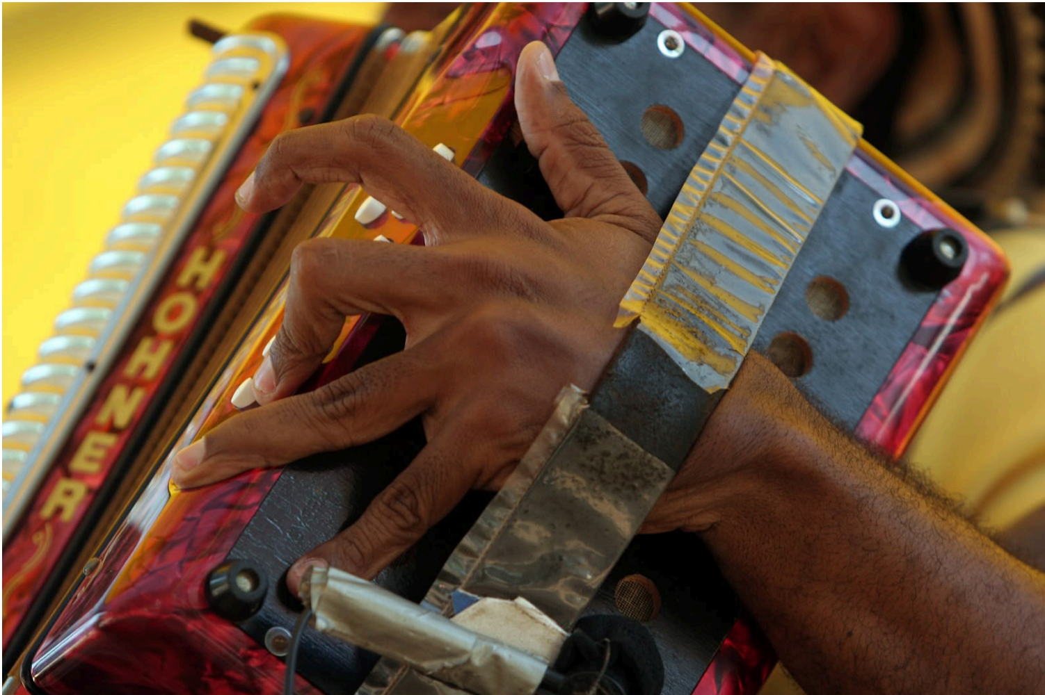
'Francisco El Hombre' es como una puerta de entrada para comprender todo el universo del vallenato tradicional.

El impulso institucional no ha sido suficiente