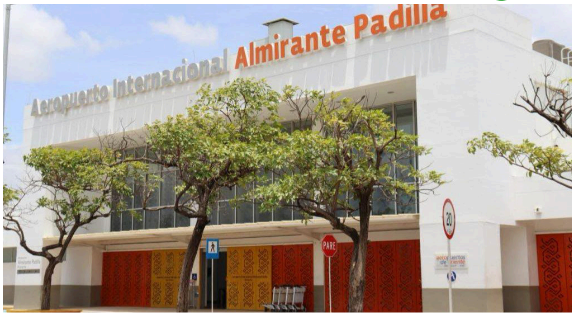
Se trata de una estrategia orientada a ampliar la conectividad aérea de La Guajira.

Durante la jornada se definieron las directrices para la realización de la Mesa de Conectividad Aérea programada para el próximo 30 de julio, espacio que reunirá a entidades públicas, gremios, autoridades territoriales y aerolíneas interesadas en evaluar la viabilidad de estas conexiones desde el Aeropuerto Internacional Almirante Padilla de Riohacha. La iniciativa hace parte de una estrategia orientada a ampliar las oportunidades de conectividad aérea de La Guajira, facilitar el acceso de visitantes al Departamento y generar mejores condiciones para el fortalecimiento de sectores como el turismo, el comercio y la inversión. "Desde la Aeronáutica Civil