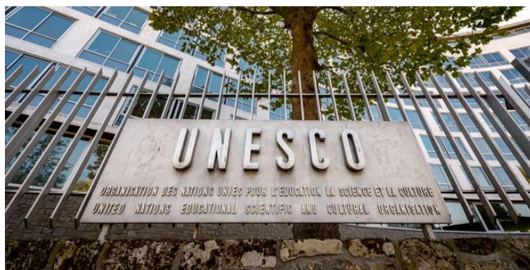
El Plan de Salvaguardia nació para responder a un llamado.

Y mientras haya una voz dispuesta a contar esta historia, Francisco El Hombre seguirá haciendo lo que siempre hizo: vencer al olvido.