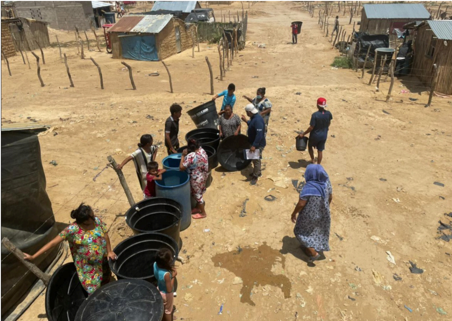
Aquí, la falta de agua potable las 24 horas se debe a un problema histórico de abandono estructural,

La Guajira, un territorio lleno de magia, encanto, inigualables paisajes y tradición ancestral transmitida de generación en generación por los pueblos indígenas que se mantienen vigentes en el territorio. Los wayúu, los kogui, los wiwa, que representan el 42,4% de la población total que vive en las zonas urbanas y rurales del Departamento, más los arijunas que completan el 100% de una población de 1.082.618 habitantes.