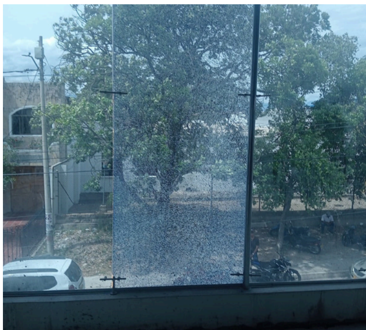
Las directivas dijeron que este tipo de acciones vulneran la tranquilidad y seguridad de un entorno sensible.

DESTACADO El centro clínico reiteró su compromiso con el bienestar, el respeto y el sentido de pertenencia hacia el municipio de Barrancas y sus habitantes.