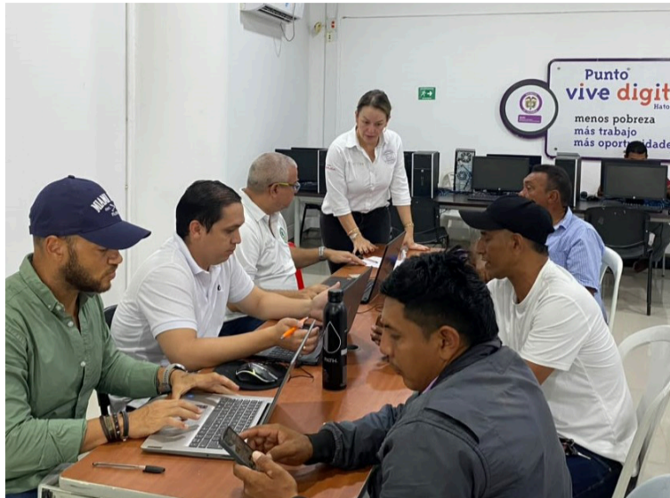
Los asistentes recibieron orientación sobre trámites del impuesto vehicular, impuesto al consumo, registro y otros.

Durante la actividad, el equipo de la Secretaría de Hacienda brindó asesoría personalizada sobre los alivios contemplados en la amnistía tributaria, resolvió inquietudes de los contribuyentes e informó