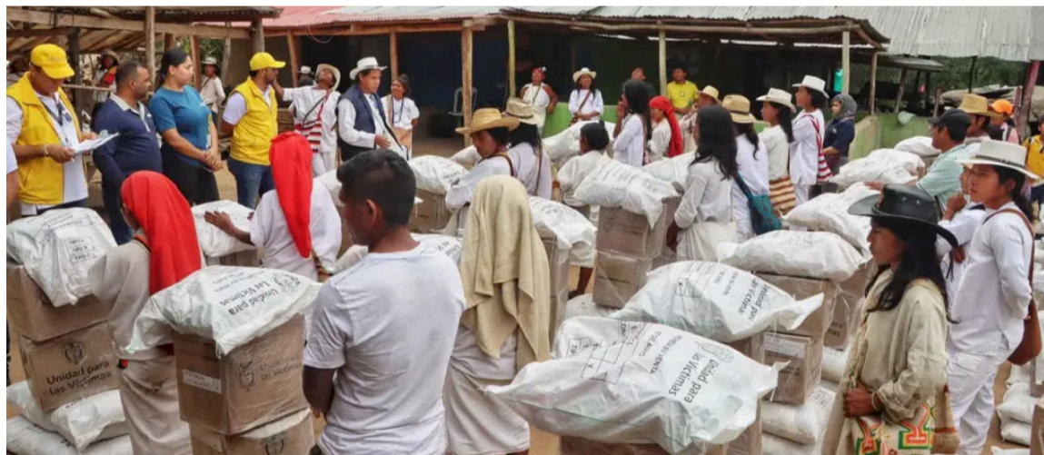
La ayuda fue entregada a las familias de las comunidades de Siminke y Sabana Joaquín.