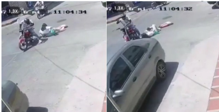
La mujer y su hija cayeron sobre la vía pavimentada, mientras que el conductor de la moto resultó ileso.

Inicialmente se conoció que, el conductor del automóvil se había dado a la fuga, sin embargo, algunos usuarios confirmaron que la persona llevó hasta la clínica Clinivida a las lesionadas para que recibieran atención médica oportuna, pero que al momento del ingreso las heridas estaban presentando problemas para la atención por no tener los