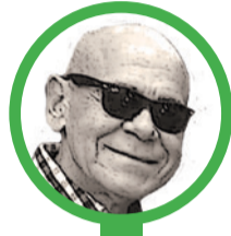
Por Isaías Celedón Cotes

La vida no promete ausencia de dolor. Pero sí nos ofrece la posibilidad de encontrar un significado en medio de esas experiencias y descubrir que, incluso en las situaciones más adversas, todavía existe algo que depende de nosotros. A lo largo de los años he conocido personas que lo perdieron casi todo y, aun así, fueron capaces de comenzar de nuevo. Hombres y mujeres que después de una caída encontraron fuerzas para levantarse, reconstruir sus vidas y descubrir una versión más madura de sí mismos.