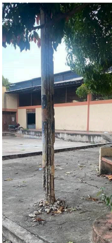
El estado del poste es un riesgo para la gente.

Los residentes esperan una pronta respuesta de las autoridades.