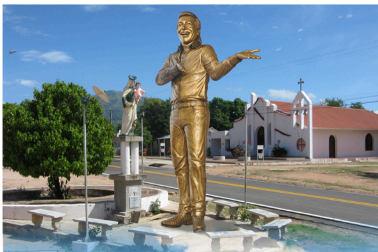
Monumento de uno de los más grandes cantantes vallenatos, Diomedes Díaz en La Junta, su pueblo.

Pasar una noche en La Junta, no es fácil describirla, es algo emocionante y a la vez fascinante. Iniciada la noche, el pueblo vibra con canto estridente de los grillos - noche de grillos - como dijera el poeta, y se escucha como si viniera muy lejos, una música alegre, desgarrando el aire tranquilo de la noche. Se ven los insectos revoloteando incesantemente alrededor de los bombillos, hacienda de la noche un verdadero espectáculo.