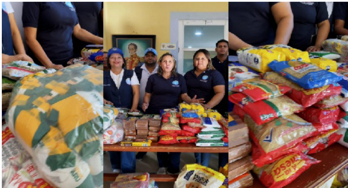
La jornada contó con el respaldo de la comunidad y de entidades públicas y privadas.

Con esta jornada, Villanueva reafirma su espíritu solidario y demuestra que, ante las emergencias humanitarias, la unión y la empatía trascienden las fronteras.