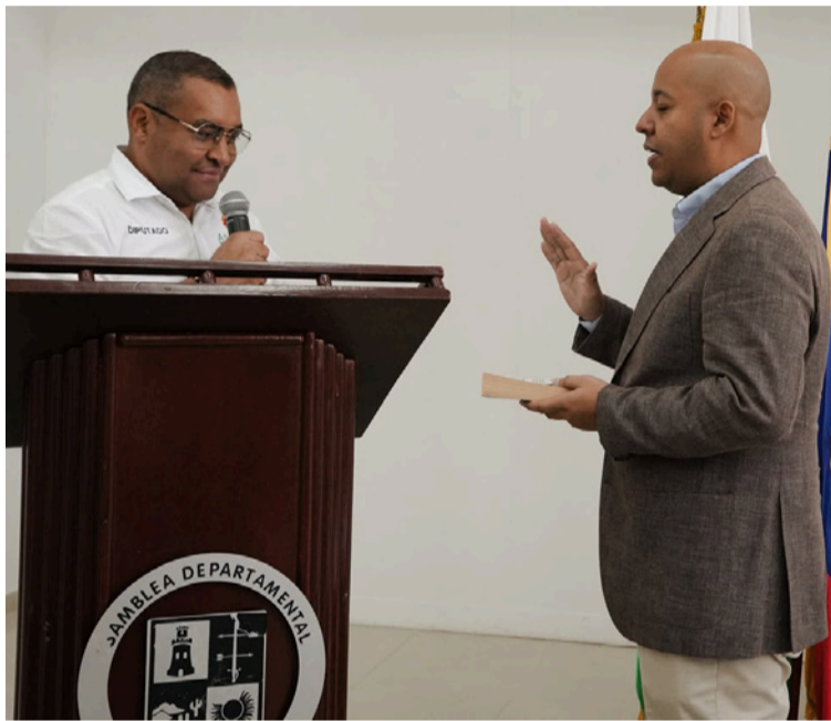
El nuevo diputado llamó a trabajar de manera articulada en pro del bienestar de todos los guajiros.

El nuevo diputado hizo un llamado a continuar trabajando de manera articulada en pro del bienestar de todos los guajiros,