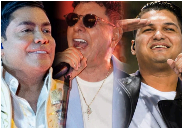
Sin duda alguna, los artistas vallenatos serán los grandes protagonistas de las Fiestas del Mar.