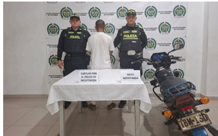
El ciudadano fue capturado por receptación y junto a la moto pasó a disposición de la Fiscalía General.

El procedimiento se desarrolló durante actividades de registro y control a personas y vehículos en la avenida Circunvalar. Al verificar los datos de la motocicleta marca Bajaj, línea Bóxer, de placa TBM-13D, mediante los dispositivos tecnológicos institucionales, los uniformados detectaron una alerta positiva, por lo que realizaron las comprobaciones correspondientes