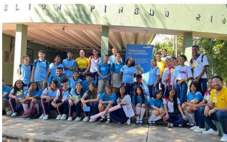
Si existe un proyecto que resume el compromiso social de JCI Wayma es 'Adopta un niño en Navidad'.

Su realización ha sido posible gracias al respaldo de aliados como la Secre-