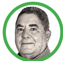
Por Álvaro López Peralta