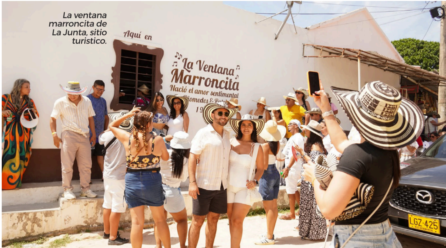
La ventana marroncita de La Junta, sitio turístico.

La Junta, paradisíaco lugar del sur de La Guajira, de gentes nobles, generosas y amables, apacible paisaje de casitas blancas impecables, de techos de paja y caprichosa topografía, también de casas modernas, lleva este nombre porque allí se juntan los ríos Santo Tomás y San Francisco, formando un solo cauce, para luego alimentar el pozo de La Olla, que lo constituye una roca cóncava y espaciosa con capacidades para varios bañistas que llegan en las vacaciones de mediado y fin de año.