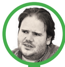
Por Gabriel E. Levy B.

música, según mediciones recientes de la industria. Ese número apenas se mueve año tras año. La capacidad de consumo de la humanidad es un recipiente de tamaño fijo. La producción, en cambio, se comporta como un grifo abierto sin tope. La aritmética resulta cruel: cuando la oferta se multiplica por diez y la demanda permanece plana, la mayoría de las obras se reparte una porción cada vez más delgada de escuchas.