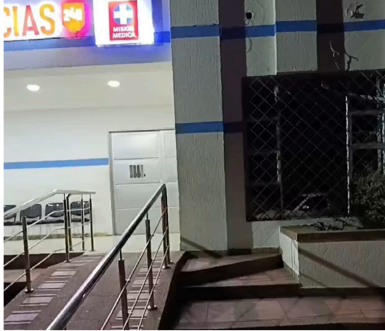
Tras cometer el ataque, los asesinos subieron a la moto y huyeron del lugar con rumbo desconocido.

Este hecho ha causado gran conmoción entre los fonsequeños ya que el joven era muy reconocido en el municipio por su oficio de barbero, sus familiares, amigos y conocidos están consternados ante este hecho por lo que piden a las autoridades esclarecer lo ocurrido y capturar a los responsables.