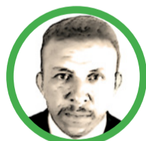
Por Alcibíades Núñez