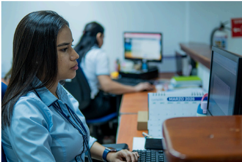
Los interesados en postularse deben presentar el certificado de no ingresos del cónyuge debidamente firmado.

Este subsidio consiste en la entrega de una cuota monetaria ordinaria asignada directamente al esposo, esposa o compañero permanente del trabajador cotizante (quien debe pertenecer a la Categoría A, es decir, con ingresos menores a cuatro salarios mínimos). El beneficio se mantendrá activo y de manera continua mientras el trabajador siga afiliado a la Caja y se valide periódicamente la supervivencia de la persona bajo su cuidado.