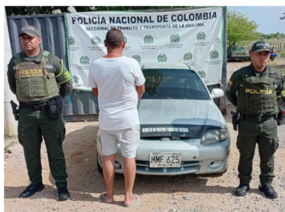
En las vías de La Guajira, fueron capturadas cinco personas, de 18, 22, 29, 47 y 52 años.

tentes. En otros procedimientos, adelantados en las vías Riohacha - Paraguachón, La Paz - Distracción y Río Palomino - Riohacha, fueron capturados tres hombres de 29, 22 y 52 años, respectivamente, quienes presuntamente presentaron licencias de tránsito falsas durante los controles realizados por las patrullas de la Policía Nacional.