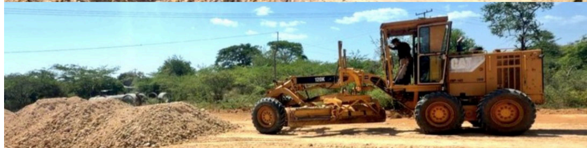
Estas son las acciones que adelanta el Ejército para apoyar el progreso de las regiones.