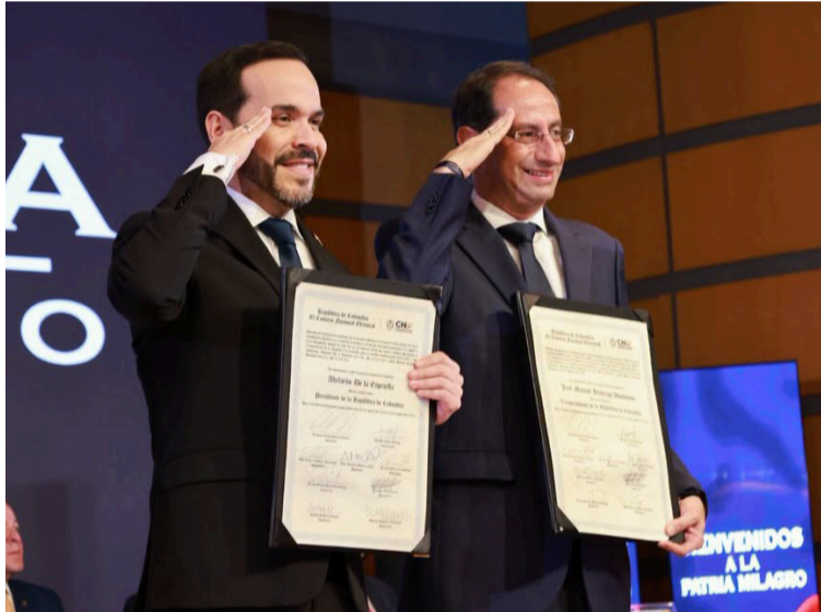
De la Espriella aseguró que gobernará para todos los colombianos y garantizará el derecho a la oposición.

La entrega de las credenciales ratifica los resultados de los escrutinios nacionales y confirma a De la Espriella como sucesor del presidente Gustavo Petro, cuyo mandato finalizará el próximo 7 de agosto. La elección presidencial se definió por un