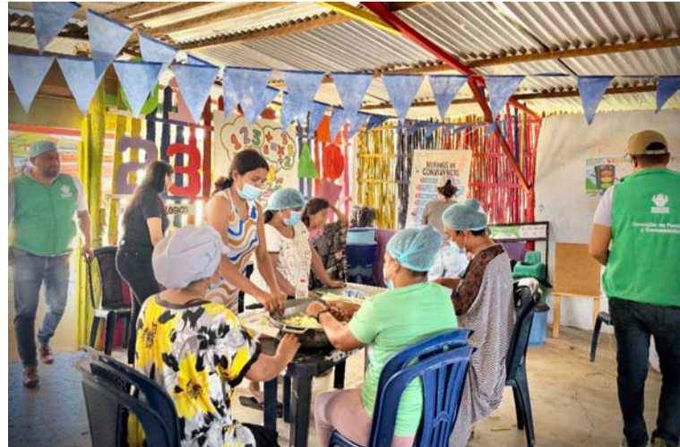
Estos aprendizajes se fortalecen a través de espacios comunitarios donde las familias comparten experiencias.

«Hemos aprendido cómo cuidar mejor a nuestros hijos y fortalecer nuestra familia», señaló. Al tiempo, reiteró el valor que las familias atribuyen a los encuentros donde se abordan temas relacionados con la crianza, el cuidado, la convivencia y la protección de niñas, niños y adolescentes.