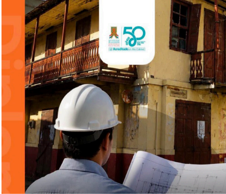
El programa promueve decisiones de intervención sustentadas, compatibles con la conservación patrimonial.

La propuesta académica busca formar a los participantes en criterios, normativa, metodologías