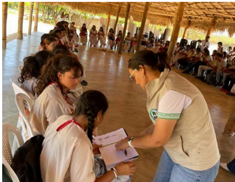
A través de estas actividades se busca sensibilizar a los jóvenes sobre la importancia de los mecanismos de concertación.