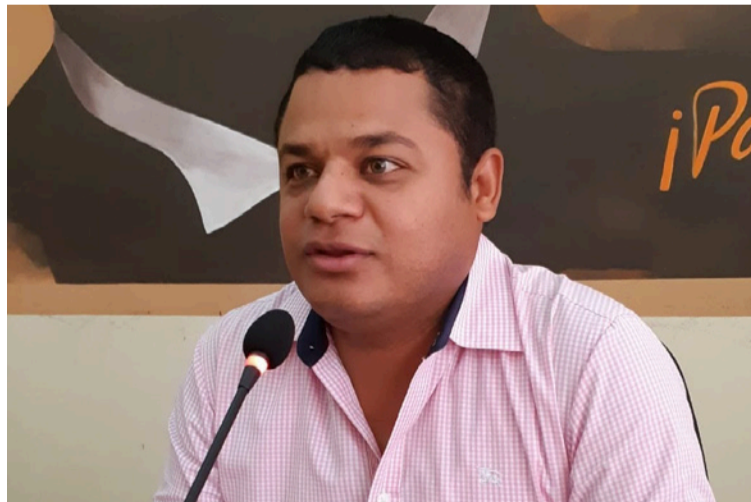
Dice el alcalde que el objetivo es recuperar de una forma integral ese espacio de la zona del mercado viejo.

"Estabamos esperando que pasara la segunda