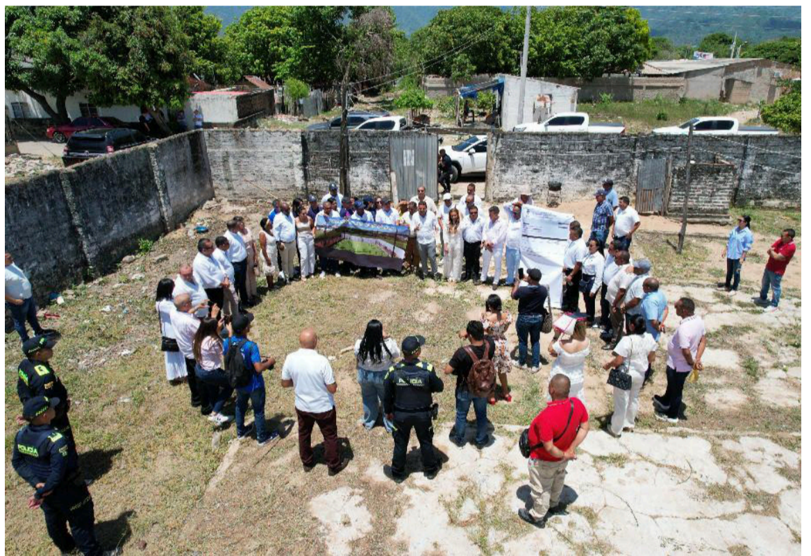
El espacio será recuperado para dar paso a un moderno parque recreodeportivo.

El nuevo escenario tendrá capacidad para recibir entre 150 y 200 personas por evento y estará disponible tanto en horario diurno como nocturno, gracias a la instalación de cuatro postes de iluminación de 14 metros de altura y 16 reflectores LED. Para el desarrollo de la obra se contempla ade-