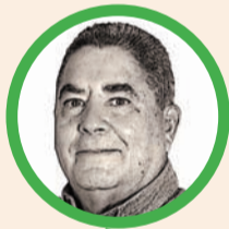
Por Álvaro López Peralta

El empalme vuelve a desnudar una verdad incómoda: se gastó más que nunca, se prometió en exceso y se entregó muy poco. No basta con explicaciones; el país exige responsabilidades.