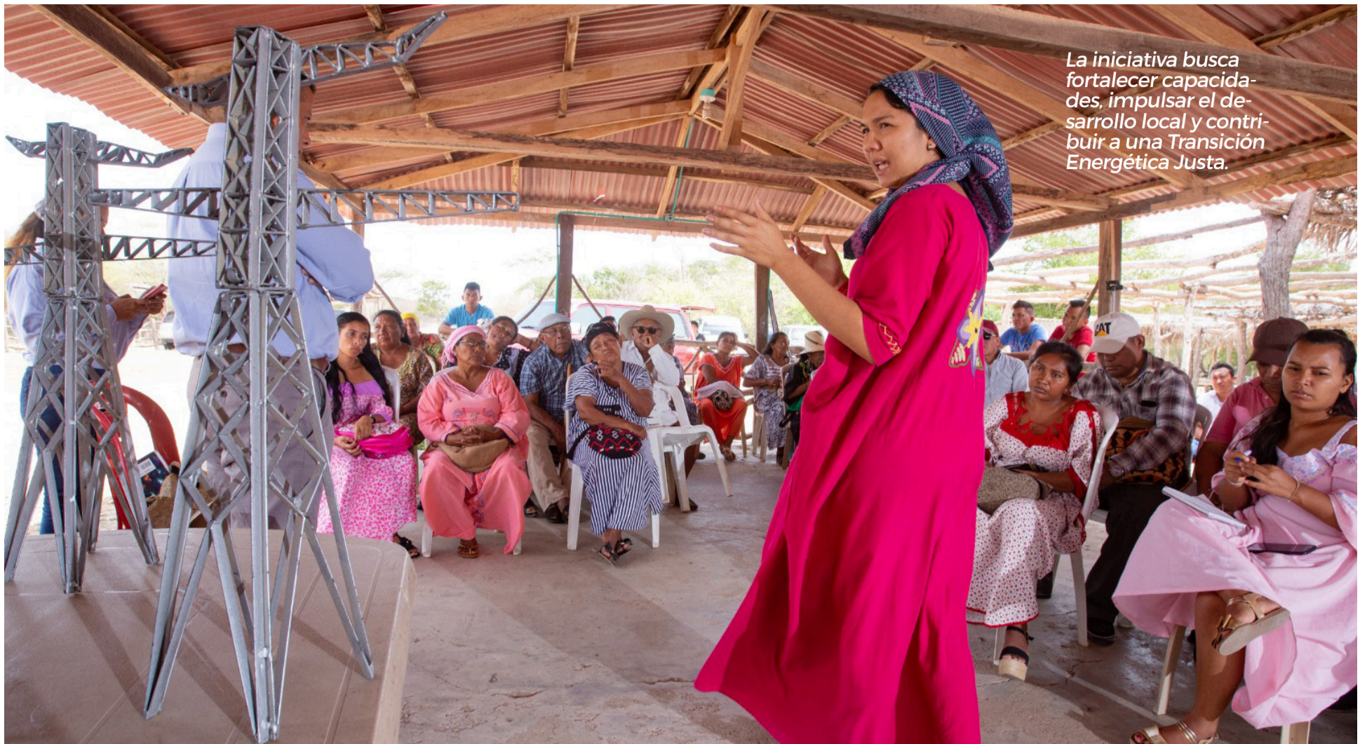
La iniciativa busca fortalecer capacidades, impulsar el desarrollo local y contribuir a una Transición Energética Justa.

La iniciativa beneficia a Riohacha, Uribia y Manaure