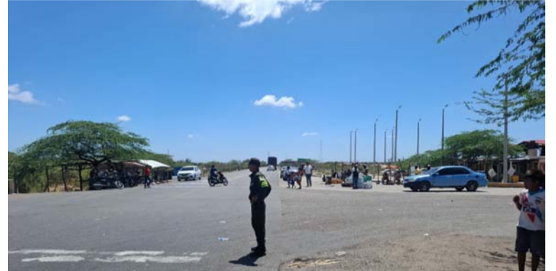
Los pasos a la altura de los kilómetros 77 y 53 de la vía departamental hacia Uribia también fueron levantados.

Luego de este llamado por parte de los transportadores de pasajeros, las autoridades realizaron un compromiso para buscar solución al mantenimiento y reparación de la carretera de Cuatro Vías a Uribia; sin embargo, los manifestantes señalaron que, al no haber solución, volverán a las vías de he-