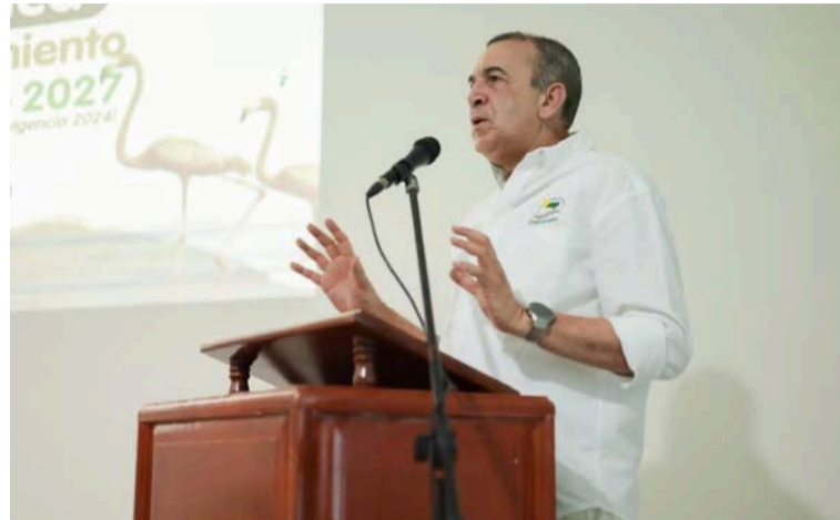
La entidad tuvo una calificación de 93,4 puntos en el Índice de Medición del Desempeño Institucional.

Adicionalmente, precisó que la evaluación evidenció un desempeño sobresaliente en los prin-