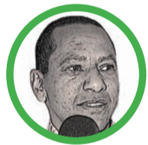
Por Jorge Naín Ruiz Ditta