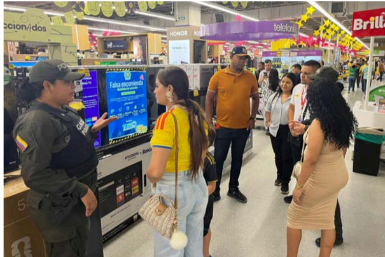
El uniformado reiteró el mensaje de la campaña institucional 'Yo No Pago, Yo Denuncio'.

Durante la jornada, los asistentes pudieron conocer los diferentes modos operandi utilizados por los delincuentes para