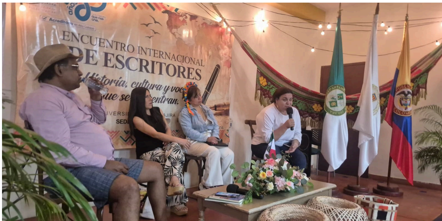
Escritores procedentes de México, Argentina, Perú, Sri Lanka y Colombia compartieron con comunidad universitaria.