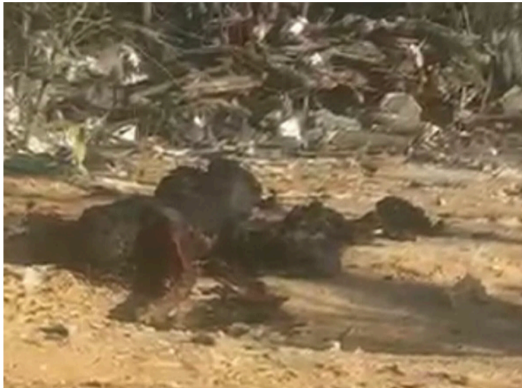
Hasta el lugar de los hechos se trasladaron las autoridades, quienes iniciaron los actos de urgencia.

Al notar la presencia del presunto cadáver, dieron aviso de manera inmediata a las autoridades policiales para que sean las encargadas de determinar si se trata del cuerpo de una persona; sin embargo, el hallazgo ha generado consternación entre los pobladores que