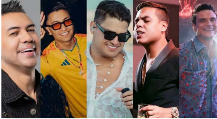
Los artistas vallenatos compartieron mensajes de apoyo, fe y esperanza para las familias afectadas.

Tras el terremoto que sacudió a Venezuela la tarde del miércoles 24 de junio, dejando miles de damnificados, viviendas destruidas, fallecidos, heridos y un número creciente de desaparecidos, los principales exponentes del género han levantado su voz para acompañar al pueblo venezolano en uno de sus momentos