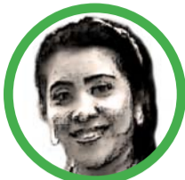
Por Delia Bolaños