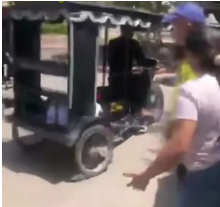
El joven fue auxiliado y llevado en un mototaxi a la urgencia de la E.S.E Hospital San Agustín de Fonseca.

El joven tras el fuerte impacto fue auxiliado y llevado en un mototaxi a la urgencia de la E.S.E Hospital San Agustín de Fonseca, donde recibió atención médica oportuna y fue valorado a ver si debido a la gravedad de las heridas deba ser remitido a un centro de mayor