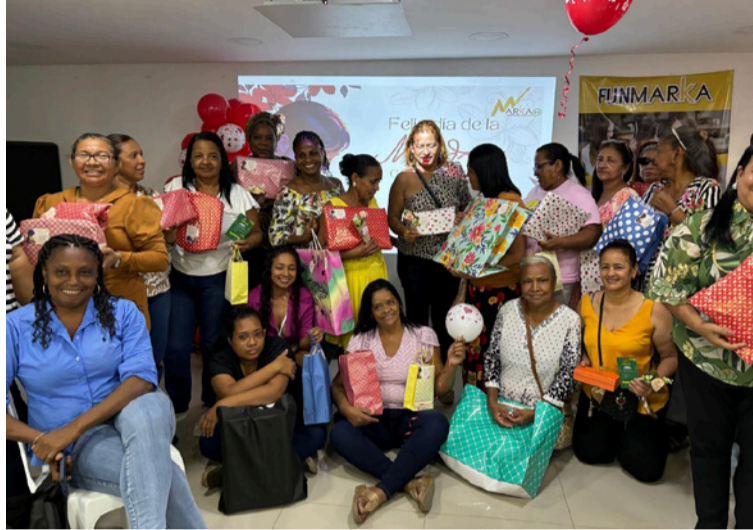
Se tratará de una jornada diseñada para el aprendizaje, la integración y el intercambio de experiencias.

La agenda incluirá espacios de formación en