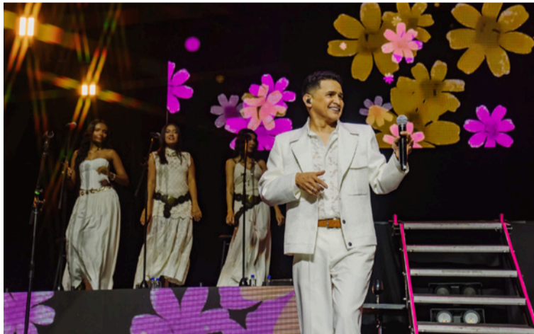
En ambos escenarios, el artista colombiano ofreció un espectáculo impecable de tres horas de duración.

Esta presentación marcó el segundo gran hito de su tour musical en tierras aztecas, el cual arrancó con igual éxito el pasado viernes 19 de junio en la Arena Ciudad de México.