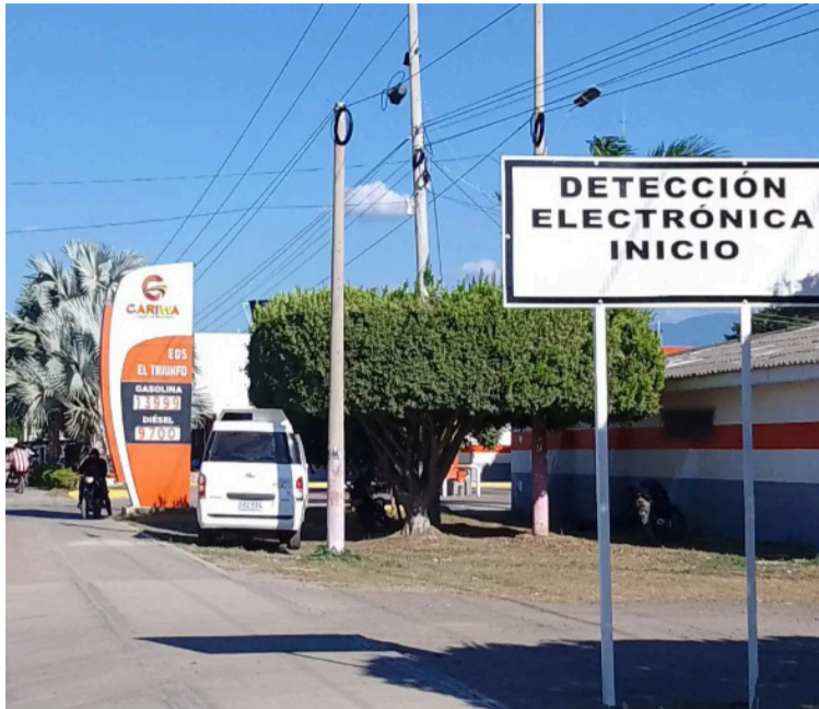
La medida está dirigida a quienes tengan multas con resolución sancionatoria hasta el 31 de diciembre de 2025.

que el beneficio no aplica para infracciones relacionadas con alcoholemia y que los descuentos sobre intereses no podrán combinarse con acuerdos de pago, los cuales deberán realizarse por el valor total de la obligación.