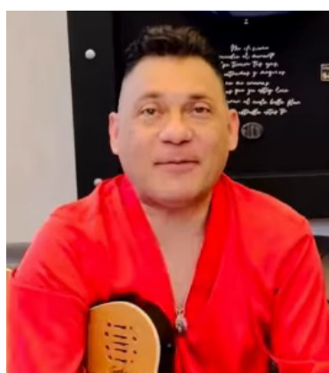
Jean Carlos Centeno, cantante de música vallenata.

El reconocido cantante y compositor vallenato, exintegrante del Binomio de Oro, sorprendió a sus seguidores al contar la verdadera inspiración detrás de 'Un osito dormilón', uno de los temas más queridos de su trayectoria.