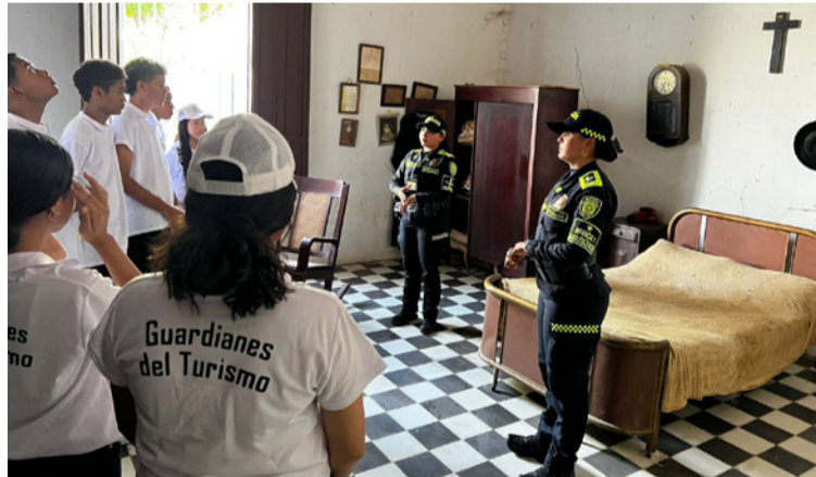
La Policía de Turismo fortalece valores ciudadanos, incentiva el turismo responsable y forma líderes juveniles.

uniformados orientaron a los jóvenes con el objetivo de generar sentido de pertenencia, amor por sus raíces y compromiso