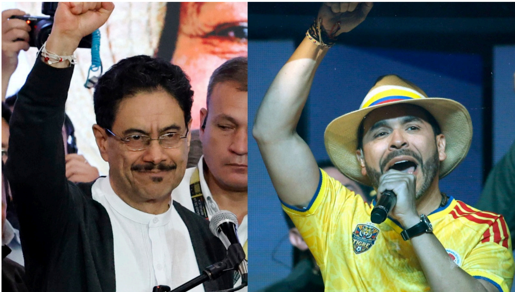
El presidente electo tuvo, en su primer discurso, la oportunidad de elevarse por encima de la coyuntura.