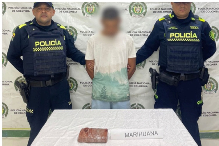
El hombre quedó a disposición de la autoridad para responder por tráfico, fabricación o porte de estupefacientes.

El procedimiento se llevó a cabo durante labores de patrullaje, registro y control en la zona urbana del municipio, cuando los policías observaron a