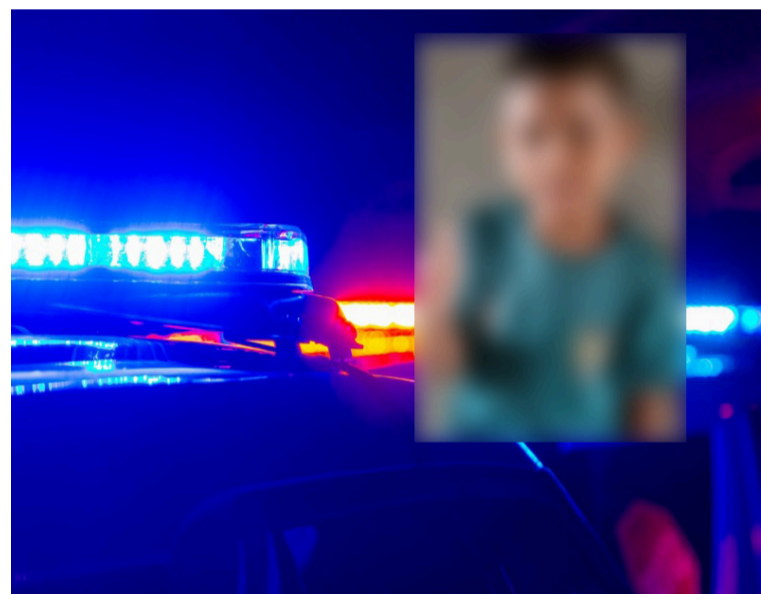
El menor se encontraba en la vía cuando intentó retirar un cable que permanecía sobre la carretera.

Las autoridades competentes acudieron al sitio para adelantar las labores correspondientes e iniciar las investigaciones que permitan establecer las circunstancias en las que ocurrió el accidente. El caso continúa siendo materia de investigación para determinar las responsabilidades y esclarecer este lamentable hecho que enluta a una familia riohachera.