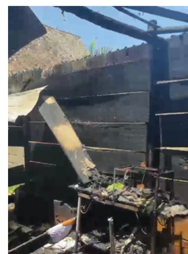
Al parecer se presentó un corto circuito.

permanecen conectados a la red eléctrica y, cuando se restablece el servicio, pueden presentarse variaciones o picos de voltaje que generan riesgos de cortocircuitos e incendios.