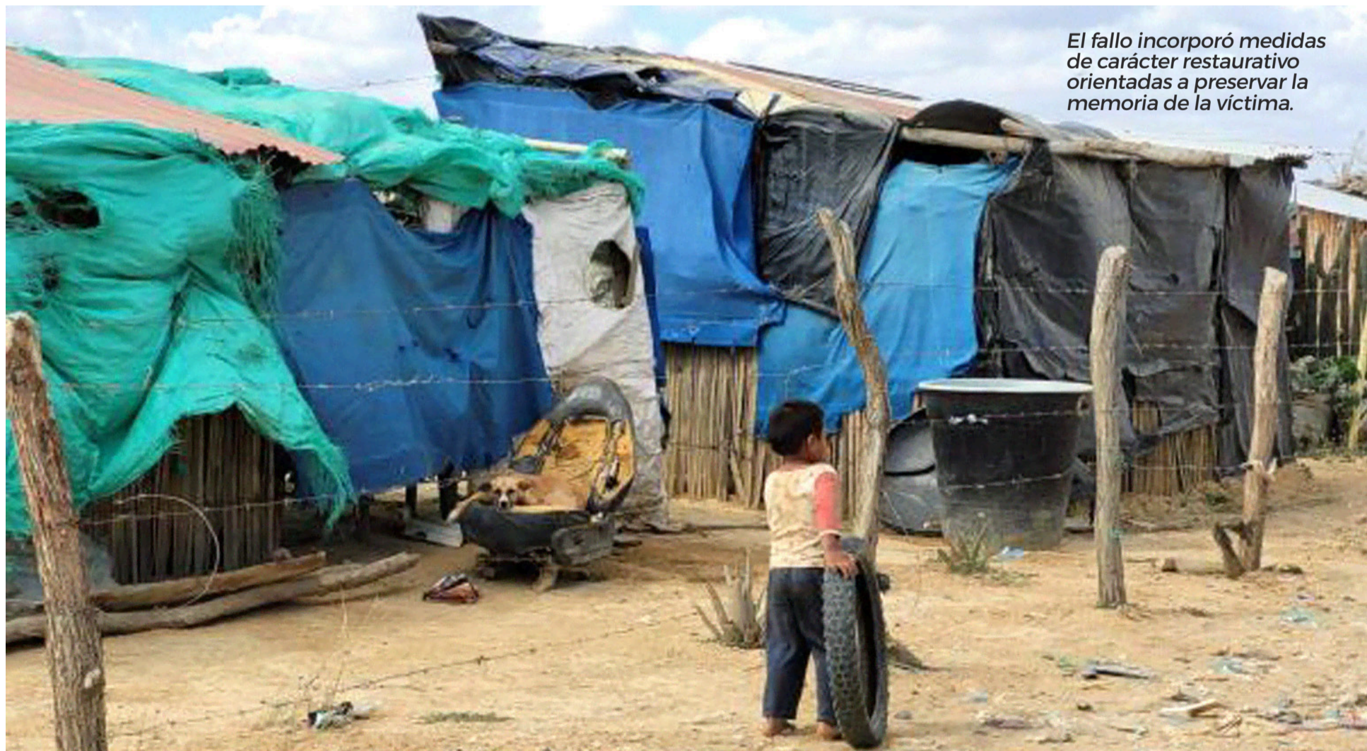
El fallo incorporó medidas de carácter restaurativo orientadas a preservar la memoria de la víctima.

Por Veeduría para la Implementación de la Sentencia T-302 de 2017.