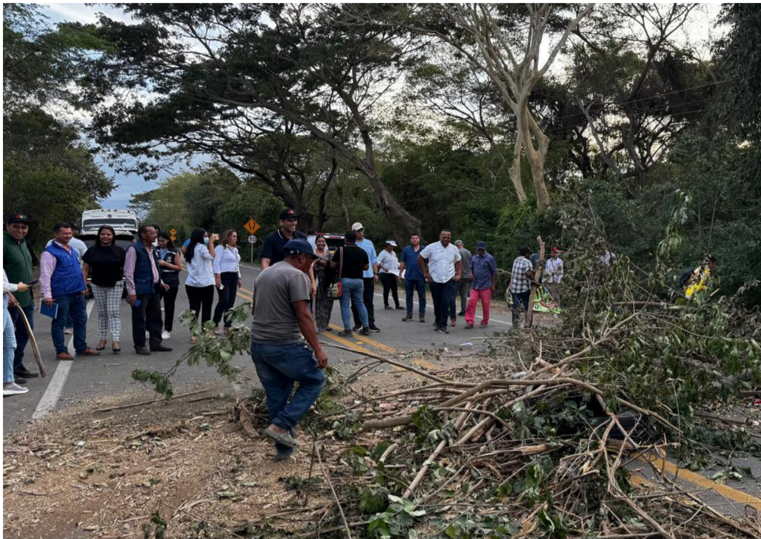
El bloqueo prolongado no puede convertirse en patente para vulnerar otros derechos.