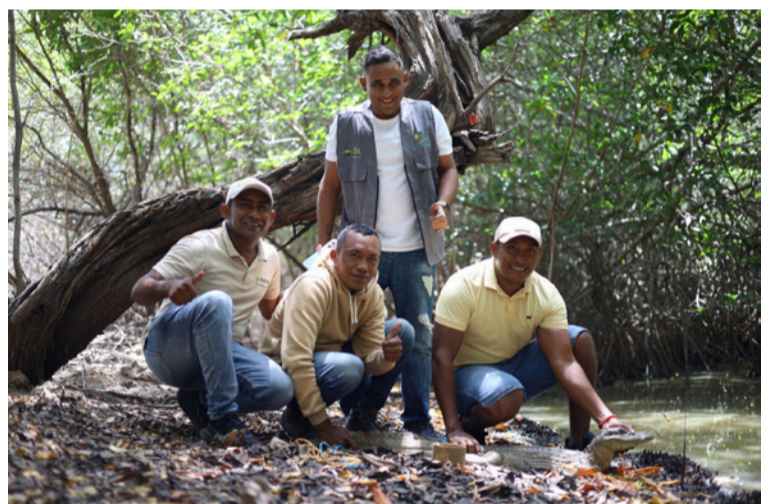
Tras su rescate, la babilla fue trasladada al Centro de Atención y Valoración de Fauna Silvestre de Corpoguajira

Como parte de las acciones de protección y conservación de la fauna