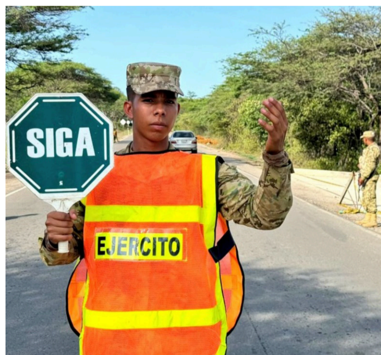
Las acciones permanentes que realiza el Ejército Nacional son para garantizar la tranquilidad de los ciudadanos.