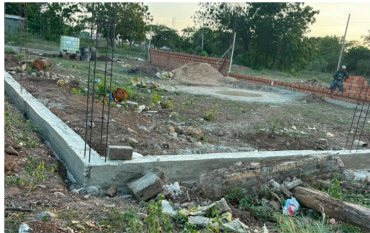
Denuncian que varias personas continúan adelantando construcciones y realizando mejoras sobre los predios.

La organización comunitaria señaló que en re-