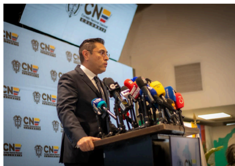
Quiroz dijo que los cinco niveles de verificación garantizan la legitimidad y transparencia total del conteo de votos.

Este escrutinio fue vigilado en más del 96% de las mesas de votación por testigos de las campañas, es necesario precisar que el