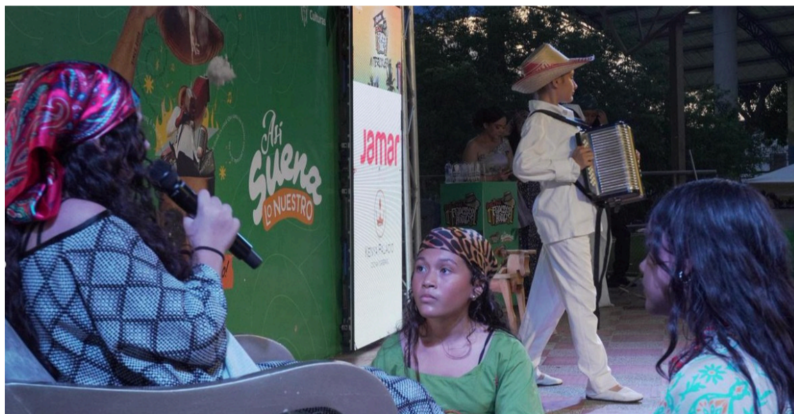
El alcalde destacó la importancia de seguir generando estos escenarios en los barrios.

El festival reunió a 16 instituciones educativas, cerca de 50 jóvenes participantes y más de 300 asistentes, consolidando un encuentro de integración entre estudiantes, familias, docentes y comu-