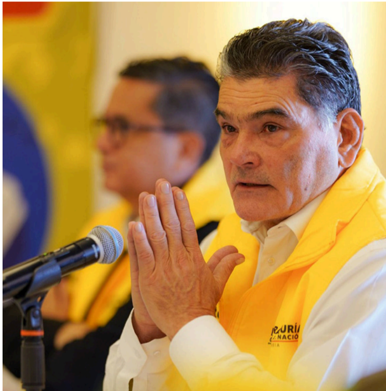
Gregorio Eljach Pacheco, procurador General de la Nación, homenajeado con la canción.

Al resaltar los valores familiares fundamentales del doctor Gregorio, exalto las cualidades que se repiten a lo largo de la canción para enfatizar que el verdadero liderazgo comienza en el hogar.