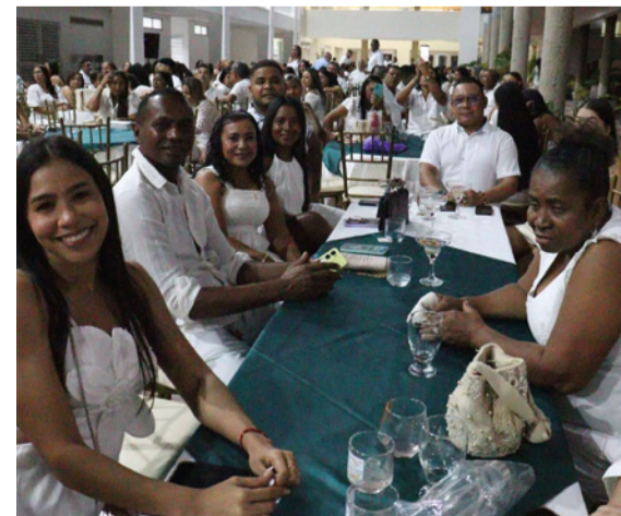
Los maestros y maestras disfrutaron de una tarde llena de diversión.

VISITANOS diariodelnorte.net @diariodelnorteguajira @diario.delnorte @DiarioDelNorte