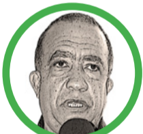
Por Martín Nicolás Barros Choles