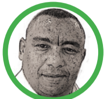
Por José Alfredo Salina Gámez