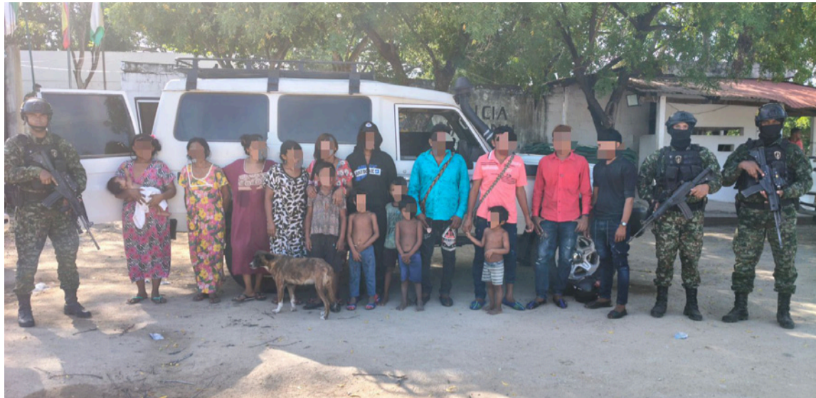
Habían siete menores de edad, privados de la libertad en la vivienda.

Como resultado de la operación fueron rescatadas 17 personas, entre ellas