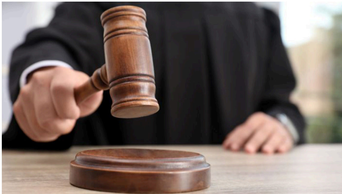
En las diferentes instancias, ratificaron el derecho de propiedad de Yanama.

Manifiestan que durante más de cincuenta años, Yanama ha sido una organización al servicio del pueblo wayuú.