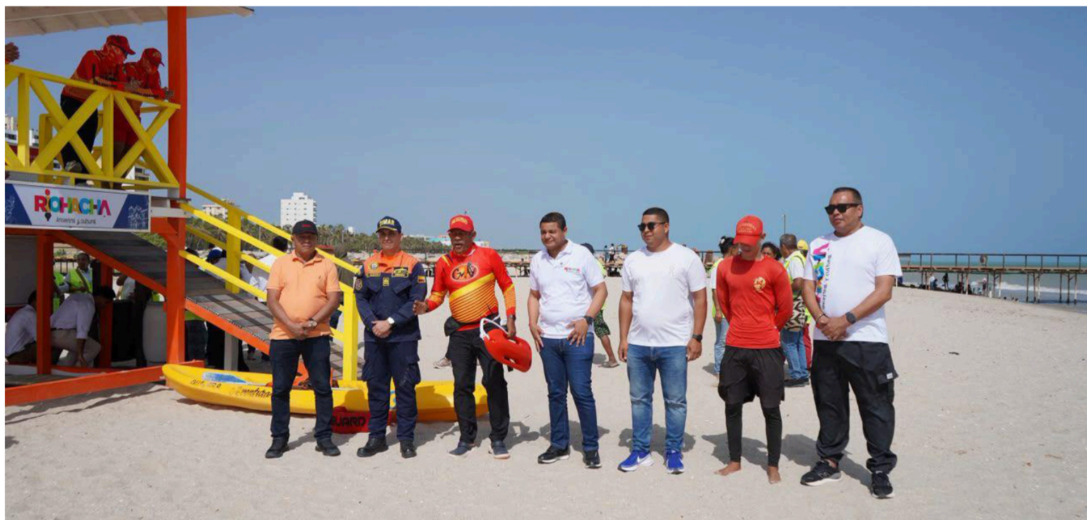
La infraestructura fue entregada por el Distrito a la Fundación Guajira Aventura, encargada del servicio de salvavidas.

La Administración Distrital reiteró que continuará promoviendo alianzas estratégicas con el sector privado para fortalecer la infraestructura turística, mejorar la experiencia de los visitantes e impulsar el desarrollo económico local, convencidos de que la construcción de una mejor ciudad requiere el compromiso de todos los actores del territorio.