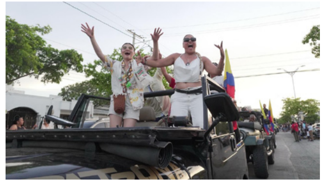
Entusiastas mujeres vallenatas que vinieron a participar en su Jeep del tercer desfile de clásicos realizado en el marco del Festival.

Terminó convirtiéndose en toda una sensación