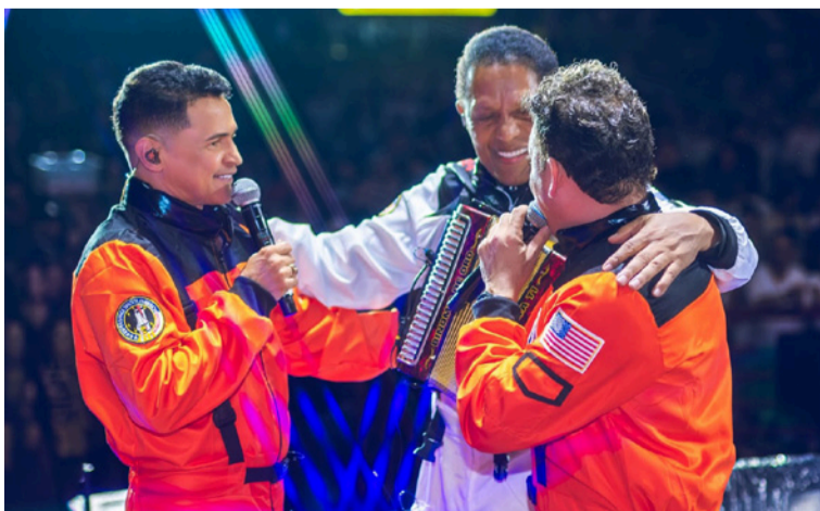
Jorge Celedón hizo parte de la agrupación del Binomio de Oro dirigido por Israel Romero.

Este hijo de El Cafetal, desde su sinceridad valora la amistad, desde la lealtad absoluta, la sencillez y la reciprocidad, entendiéndola como un pilar fundamental tanto en su vida personal como en su trayectoria musical. A lo largo de su carrera, su visión sobre este lazo afectivo se manifiesta a través de sus acciones públicas, sus colaboraciones sociales, artísticas y la herencia cultural de su familia.