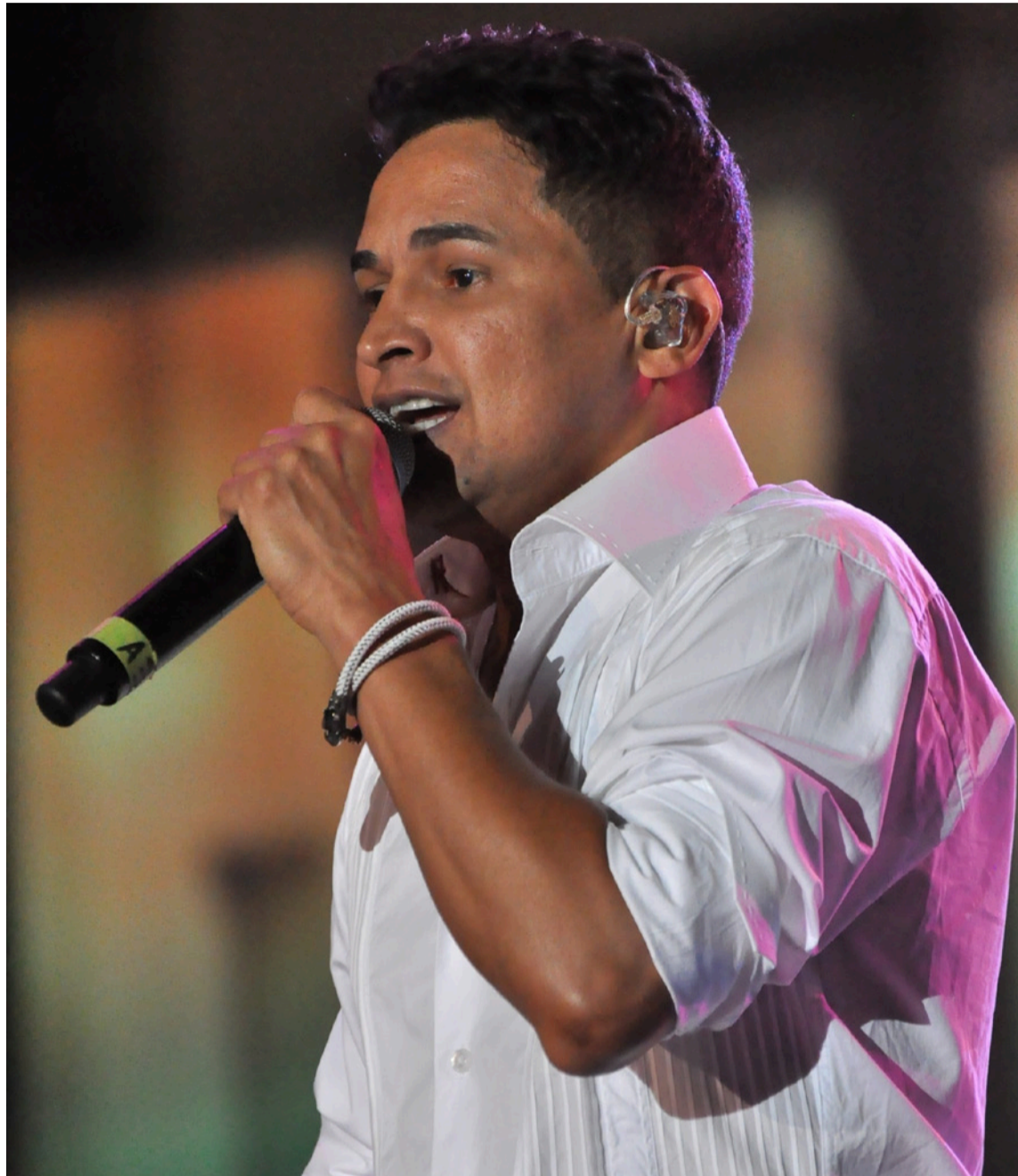
Jorge Celedón, cantante vallenato que ha ganado cuatro Premios Grammy Latinos en la categoría Mejor Álbum de Cumbia/Vallenato.