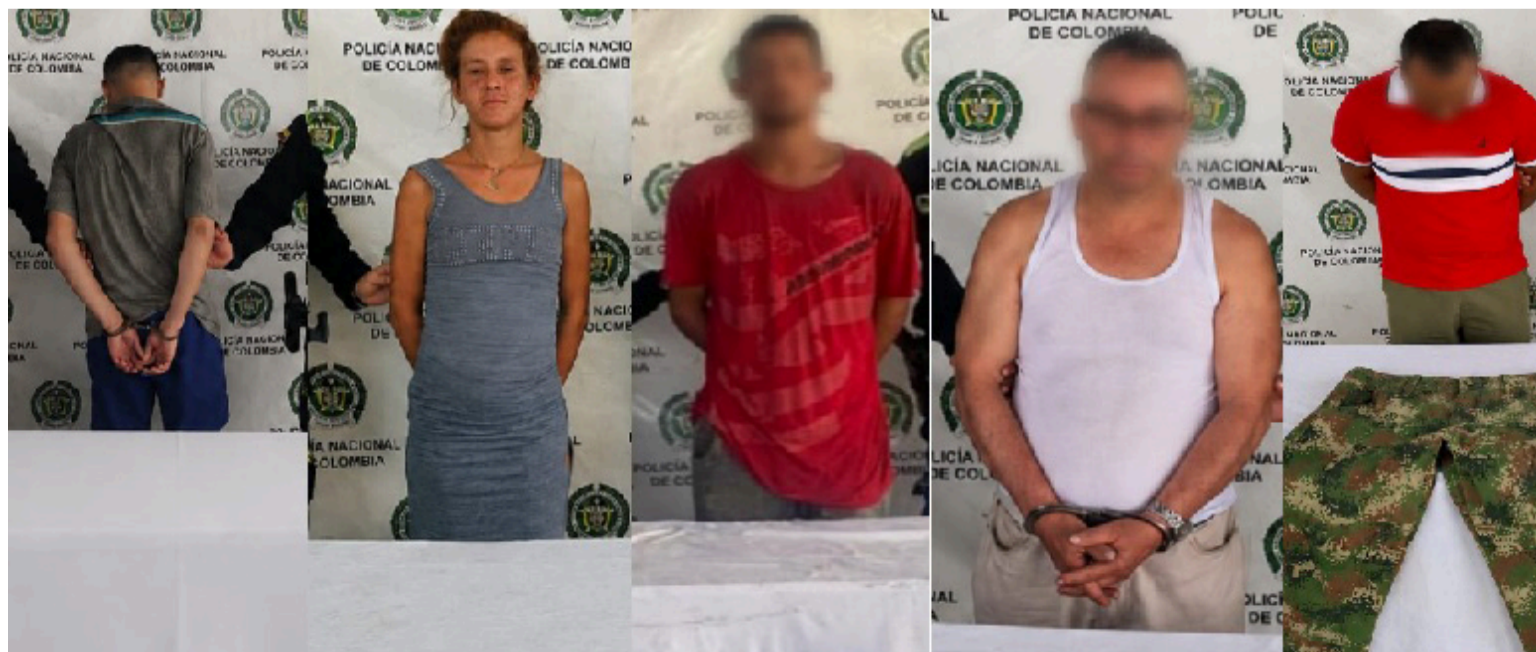
Para la Policía, los resultados reflejan el compromiso permanente de sus hombres y mujeres con la seguridad.

Continuaremos desplegando todas nuestras capacidades institucionales para combatir los delitos que afectan la seguridad ciudadana, proteger a nuestros niños, niñas y adolescentes, enfrentar el tráfico de estupefacientes y hacer efectivas las órdenes judiciales. Invitamos a la comunidad a seguir confiando en la Policía Nacional y a denunciar oportunamente cualquier hecho que ponga en riesgo la convivencia y la seguridad".