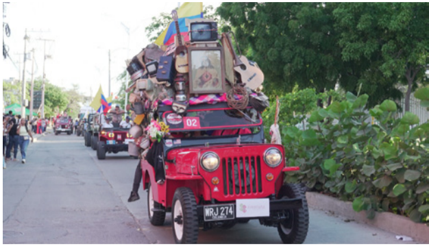
Más de un centenar de vehículos clásicos participaron del desfile. Allí se destacó ese Jeep Willys del eje cafetero con su mudanza.