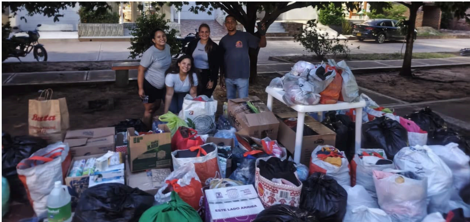
La campaña consiste en recibir alimentos no perecederos, ropa, cobijas, colchonetas y demás elementos de primera necesidad.