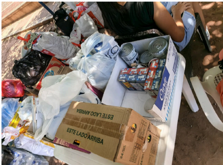
La iniciativa surgió de manera familiar y comunitaria, sin el respaldo inicial de entidades oficiales.

La campaña consiste en recibir alimentos no perecederos, ropa, cobijas, colchonetas y demás elementos de primera necesidad que posteriormente son trasladados hasta los centros oficiales de acopio en Valledupar. Desde allí, las ayudas continúan su recorrido hacia Maicao y luego a Maracaibo para ser distribuidas en las zonas más afectadas.