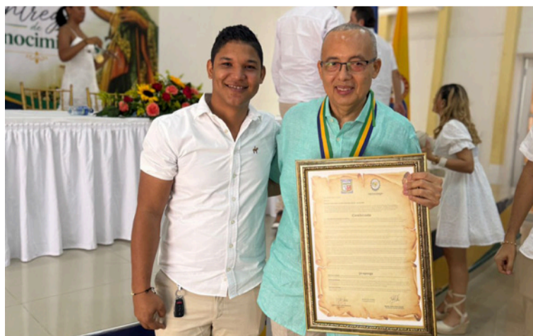
La medalla Félix Arias es la máxima distinción que otorga el Concejo municipal de San Juan del Cesar.