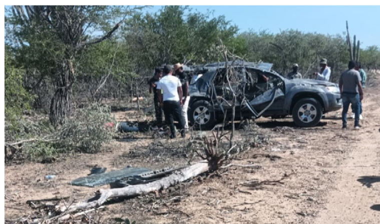
La camioneta en la que se desplazaban las víctimas habría perdido el control, volcándose a un costado de la vía.

Sus familiares se lo llevaron por usos y costumbres