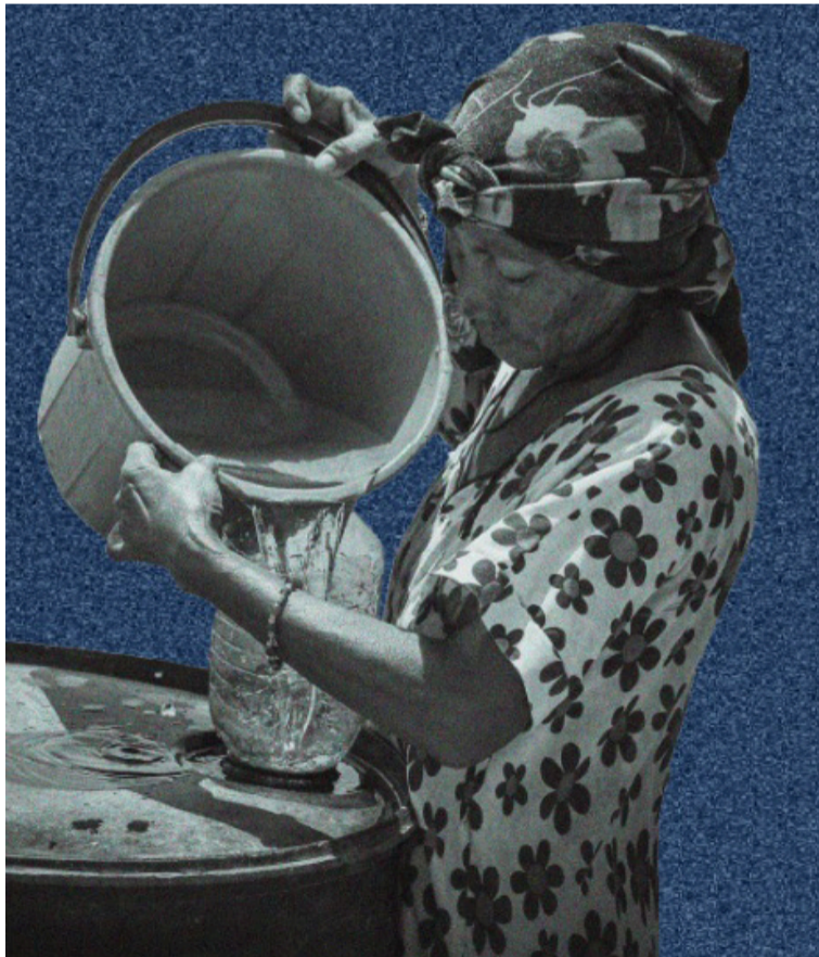
Maicao ha favorecido la presencia de grupos armados ilegales y estructuras de criminalidad organizada.

Un segundo escenario de riesgo se localiza en el