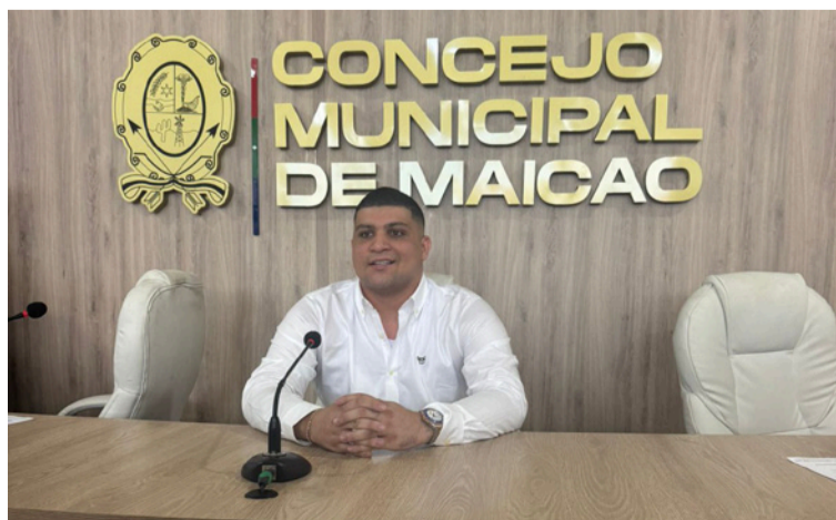
Dijo que trabajará de la mano con la gente del campo.

"Trabajaré de la mano con la gente del campo y de los barrios que más lo