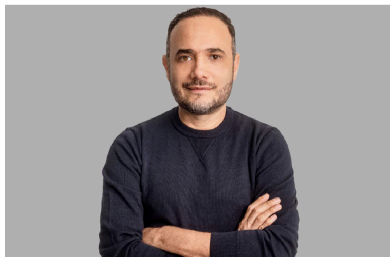
La demanda pretende que la justicia ordene al Ministerio de Hacienda el diseño de una hoja de ruta técnica.

Con la radicación formal del documento, el congresista solicitó al tribunal dar trámite prioritario al proceso para salvaguardar los derechos colectivos de los ciudadanos y mitigar riesgos macroeconómicos de difícil reparación.