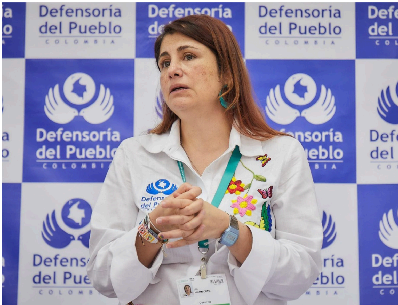
Según la defensora, el escenario de peligro se configura por convergencia de múltiples actores y dinámicas de disputa.