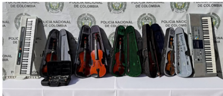
Alumnos, padres de familia, y miembros de la Junta Directiva, siguen solicitando a la comunidad su apoyo.

Alrededor de unos cuatro mil quinientos (4.500) niños se han beneficiado del proceso Fundartes con una formación musical básica, sin ningún tipo de discriminación y con la aplicación de un modelo pedagógico musical propio.