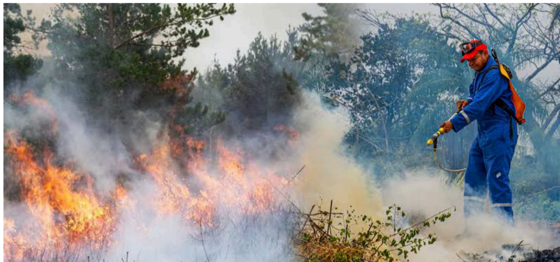
Corpoguajira solicita a alcaldías activar y fortalecer sus planes de contingencia.