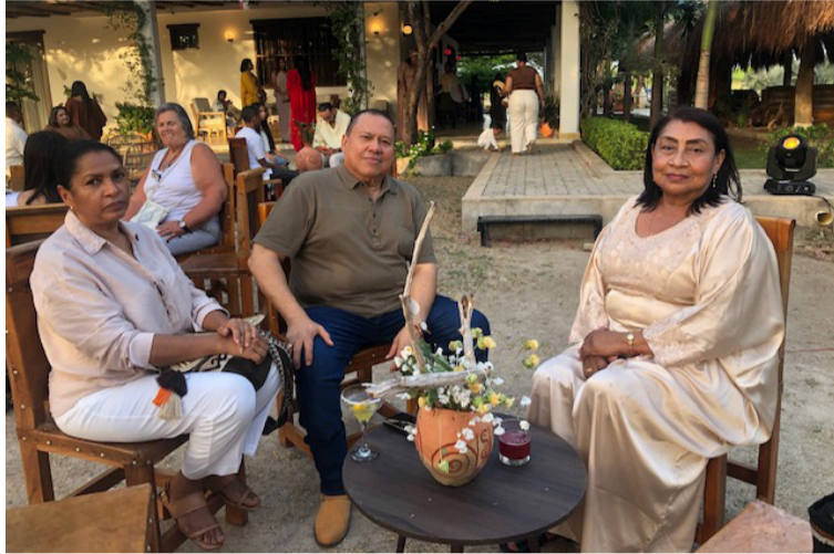
En el taller trabajan 150 artesanas, dedicadas a elaborar los chinchorros, las mochilas, tapetes y otros elementos.

El taller fue ambientado alrededor del tejido, los colores, los hilos, los telares, las figuras, pero lo más importante, hacerle honor al legado cultural de lo que significa ser wayuú.