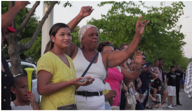
Una multitud de riohacheros se volcó a las calles para admirar y aplaudir el desfile de autos clásicos en su tercera versión.