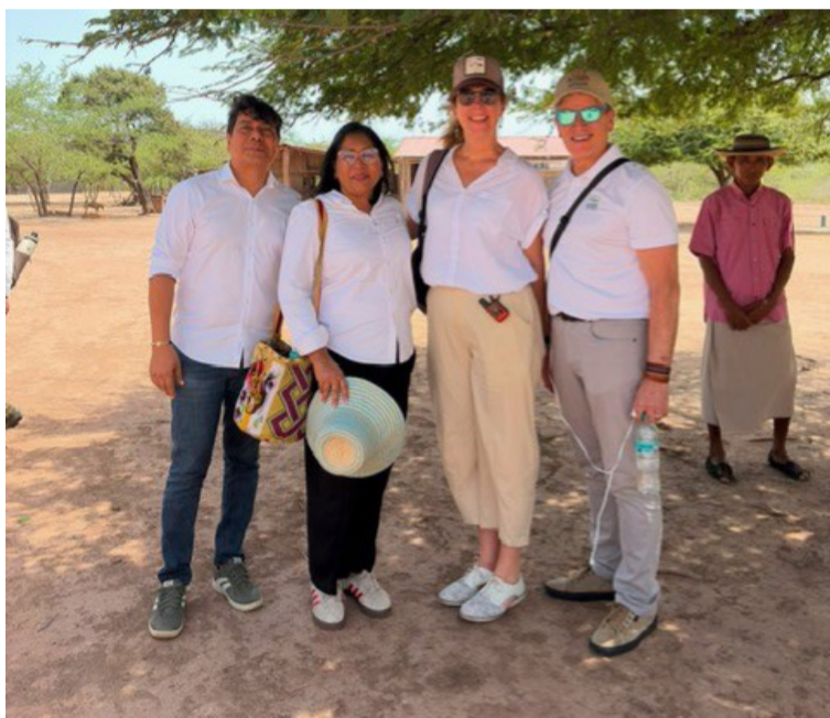
El 'Intercambio Técnico Colombia - Nueva Zelanda en turismo indígena', permitió intercambiar conocimientos.