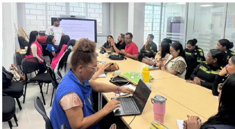
La Alcaldía de Riohacha reafirma su compromiso con la protección de los derechos humanos.

"El compromiso de esta administración es avanzar hacia una Riohacha más equitativa, donde todas las personas puedan vivir