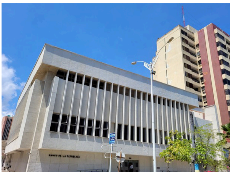
El evento se realizará del 11 al 13 de junio en las instalaciones del Banco de la República en Riohacha.