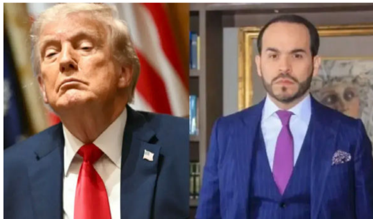
Se resalta la injerencia indebida y peligrosa de apoyo del Gobierno de EE. UU. al candidato De la Espriella.

C ada periodo electoral es una ocasión u oportunidad, para elegir mandatarios y representantes, en territorio nacional, departamental, Distrital y municipal; para escoger a quienes consideren, que pueda ser propicio, útil o necesario para gobernar o representarnos, en corporaciones legislativas.