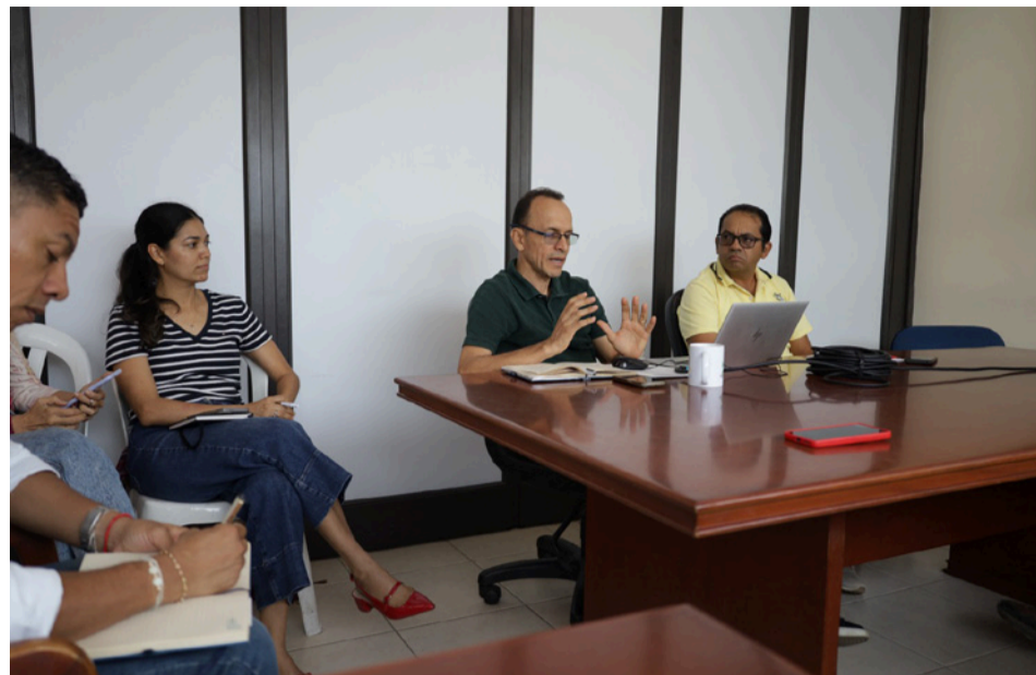
Los consejeros socializaron diversas situaciones y dinámicas ambientales identificadas en sus respectivas cuencas.