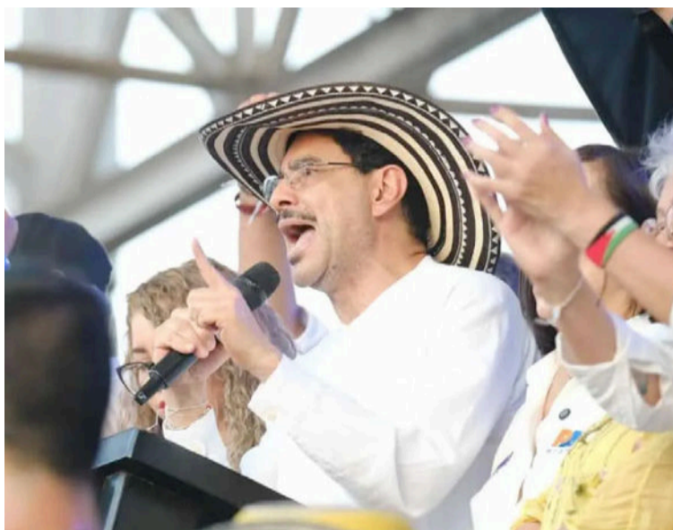
Iván Cepeda Castro llegó a la segunda vuelta respaldado por una importante estructura política.

voto de derecha y de sectores independientes inconformes con el actual Gobierno. Su mensaje encontró eco en empresarios, comerciantes, productores agropecuarios y ciudadanos preocupados por la seguridad.