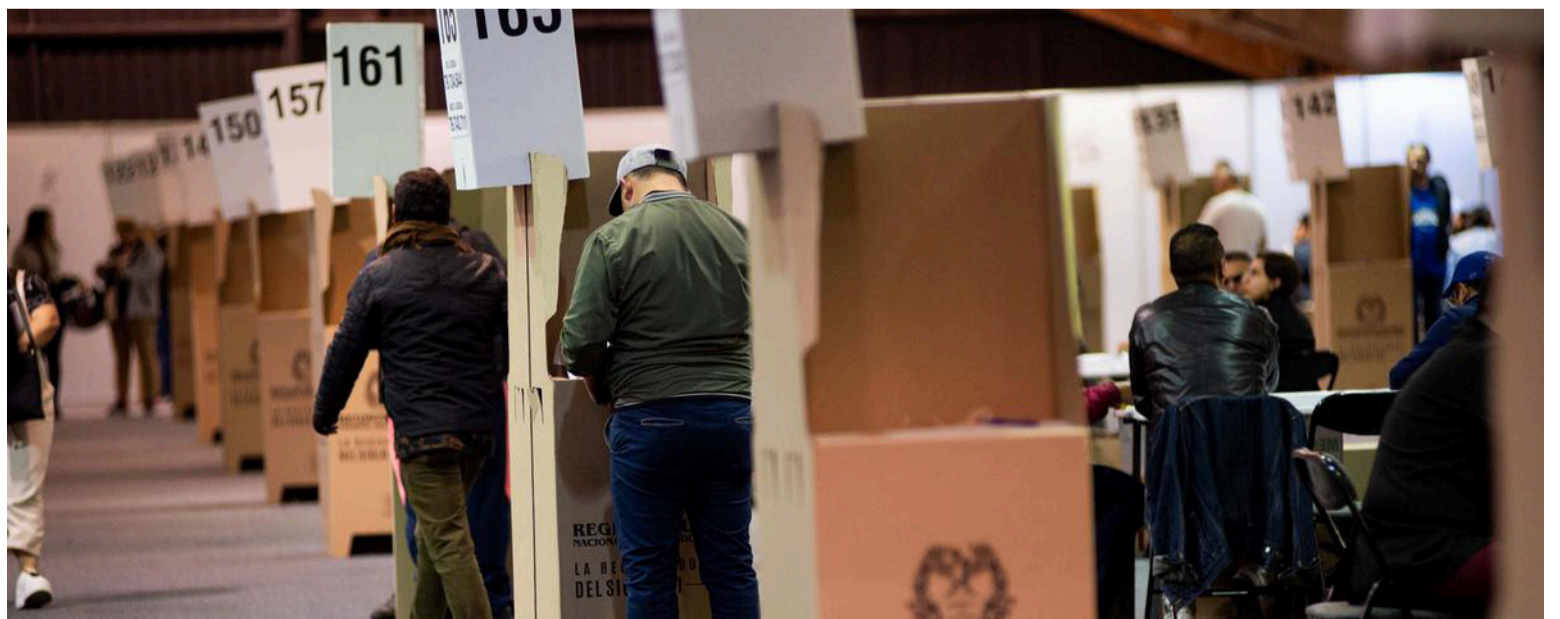
Lo más hermoso de esta segunda vuelta presidencial es la simbiosis perversa entre el tibio y el turbio.

Usted decida si quiere ser el tibio que observa desde la grada con su cerveza tibia y su escepticismo de marca, o si se atreve a bajar al ring. Eso sí, tenga cuidado: en este ring, los que reparten los golpes suelen ser los turbios, y los que terminan con la cara hinchada, casi siempre, somos el resto.