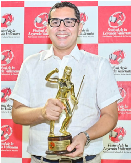
Fabián Leonardo Dangond Rosado, Rey de la Canción Vallenata Inédita.

El listado de ganadores del 59° Festival de la