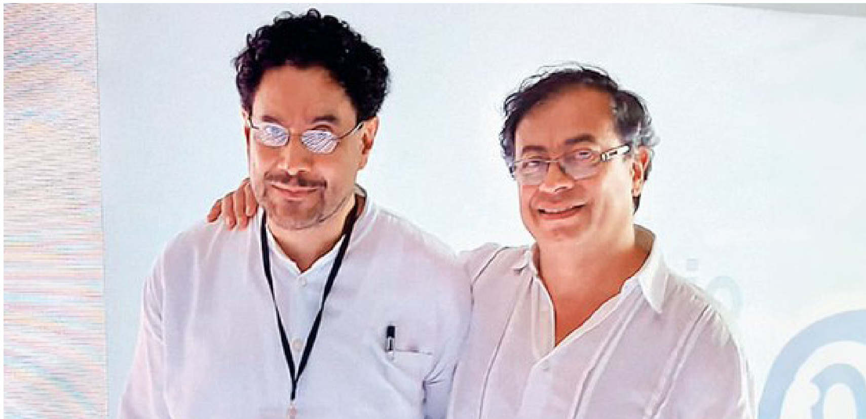
Ganar en primera vuelta no siempre asegura el triunfo final, y eso lo saben Iván Cepeda y el presidente Gustavo Petro.

Las elecciones también comprometen al elector