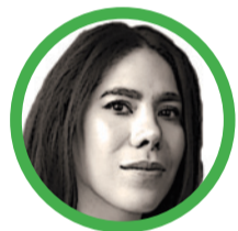
Por Carina Murcia Yela

Ministra de Tecnologías de la Información y las Comunicaciones