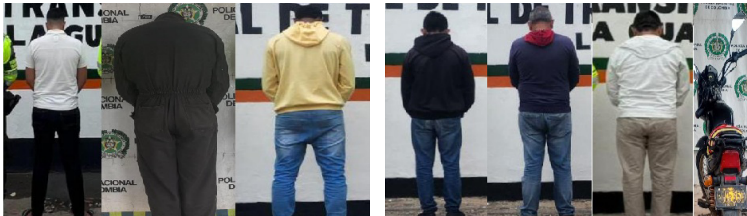
La Policía Nacional capturó a siete personas por diferentes conductas delictivas en carreteras de La Guajira.

En desarrollo de los planes de prevención, control y seguridad vial desplegados por la Policía Nacional, fueron capturadas siete personas por diferentes conductas delictivas relacionadas con la utilización de documentación falsa y la receptación de un vehículo con reporte de hurto.