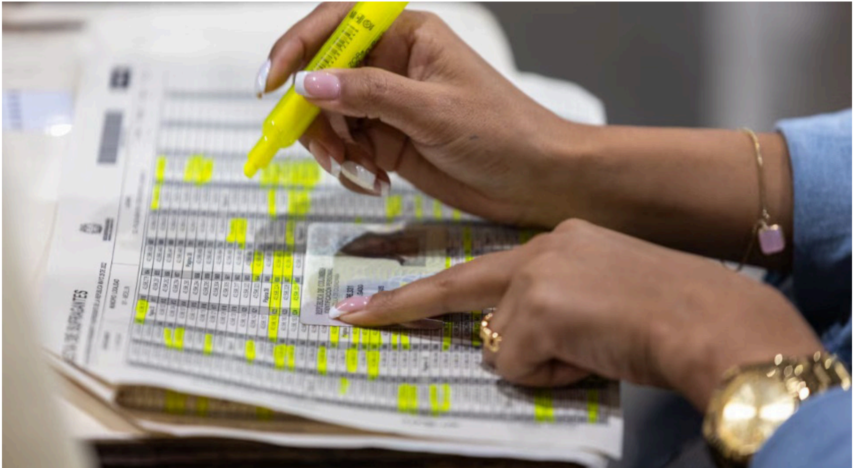
El tibio es ese vecino que no salió a votar en la primera vuelta porque 'el sistema está podrido'.