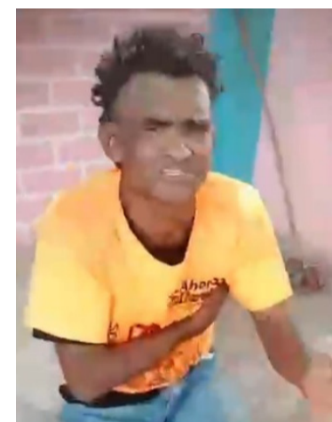
Este hombre quedó a disposición de la Fiscalía.

Hasta el momento no hay mayores detalles de este hecho por lo que se espera un reporte completo por parte de la Policía Nacional, con el fin de saber en detalles sobre el procedimiento que se realizó.