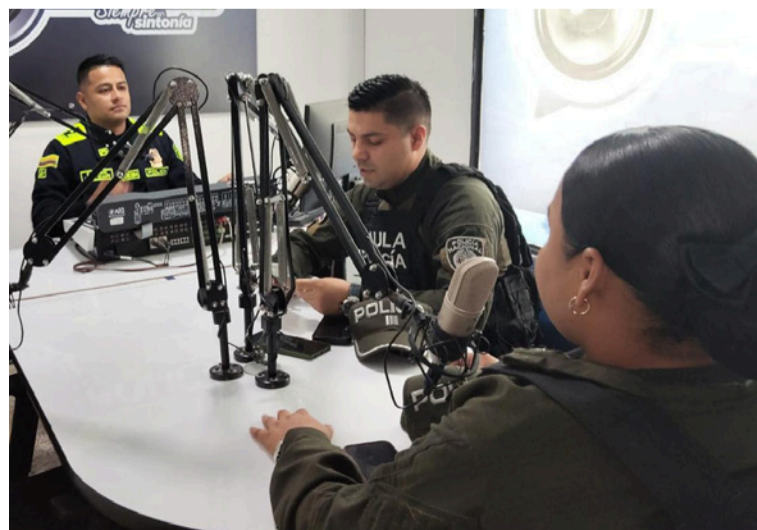
La información suministrada por los ciudadanos es fundamental para proteger la libertad y el patrimonio.

Gaula de la Policía Nacional reafirma su compromiso con la seguridad y la convivencia ciudadana, promoviendo la campaña institucional '¡Yo no pago, yo denuncio!', como una estrategia para combatir estos delitos y proteger a la comunidad en todo el territorio guajiro.