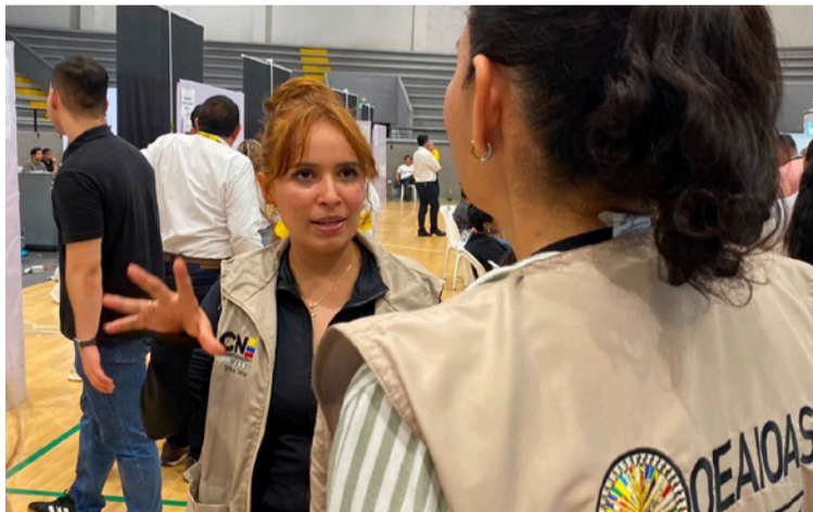
La implementación de Comitium en Línea representó un paso decisivo hacia la digitalización del control electoral.

De esta manera, la corporación las y los acreditará mediante Acto Administrativo electrónico, y les será entregada una credencial digital con código QR que será validado por la Fuerza Pública y los delegados del Registrador Nacional en cada recinto electoral el día de las votaciones, a través de la aplicación 'Comitium en Línea'.