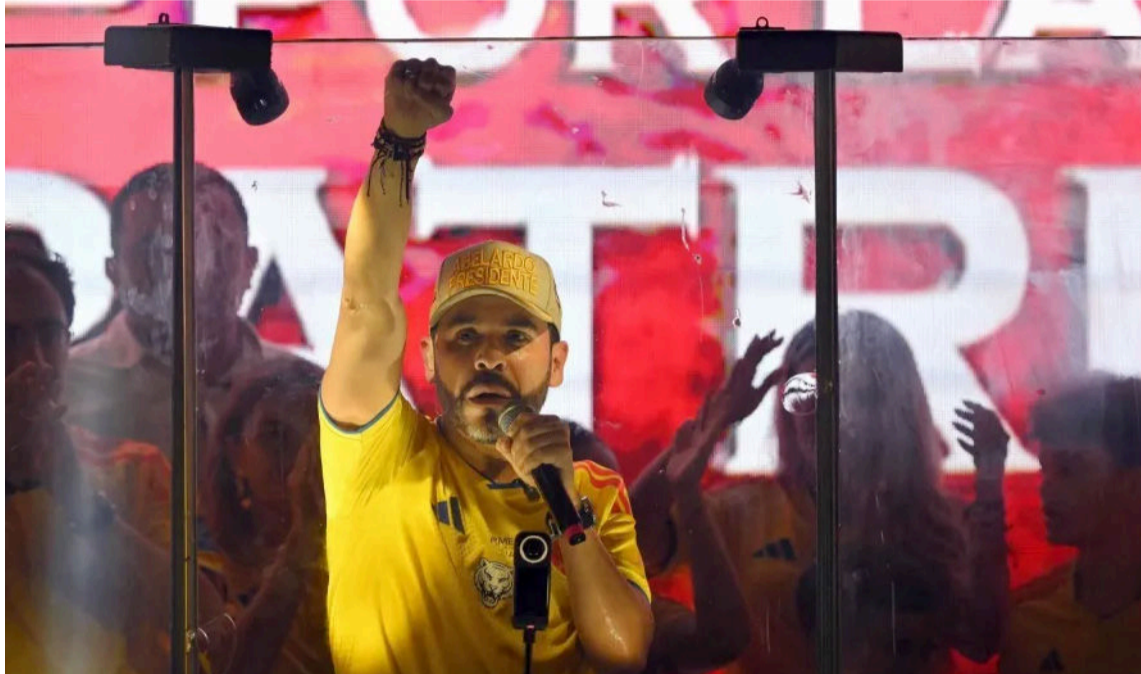
De la Espriella obtuvo el primer lugar con más del 43 % de la votación nacional.

Otra de sus fortalezas radica en haber logrado agrupar gran parte del