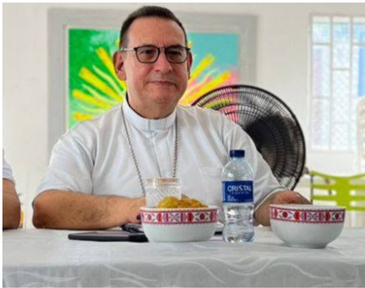
Monseñor pidió que la jornada electoral se convierta en una verdadera fiesta democrática en serenidad y cordura.

Además de qué manera estratégica y degradante, se manipulan emociones sociales como el miedo, la indignación y la venganza, pues la instrumentalización de las emociones en