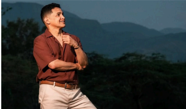
Jorge Celedón reafirma su compromiso con el género y con el público que lo ha acompañado durante años.

'Jorgito', como también se le conoce cariñosamente, trabaja intensamente en la producción de este espectáculo, que busca conectar con sus seguidores a través de los