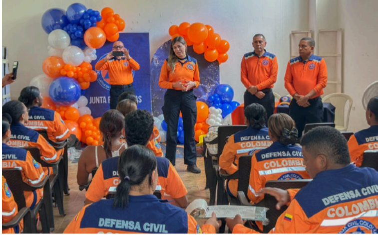
La Defensa Civil Colombiana, realizó la entrega de equipos de brigadas forestal.