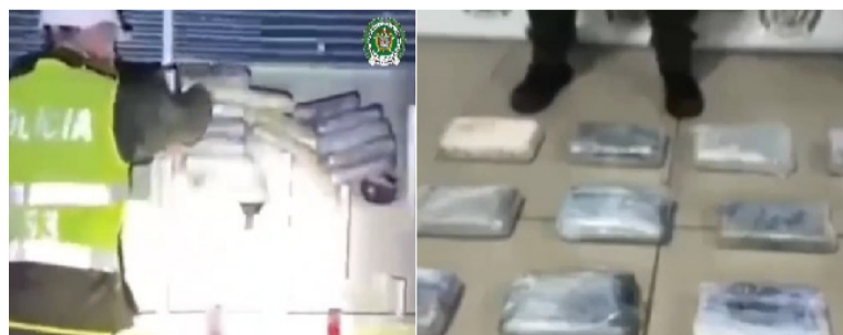
El estupefaciente pertenecería al grupo guerrillero ELN y habría salido de la costa de la Alta Guajira.

En las últimas horas las autoridades informaron sobre un importante resultado en la lucha frontal contra el narcotráfico y el debilitamiento a los grupos criminales dedicados