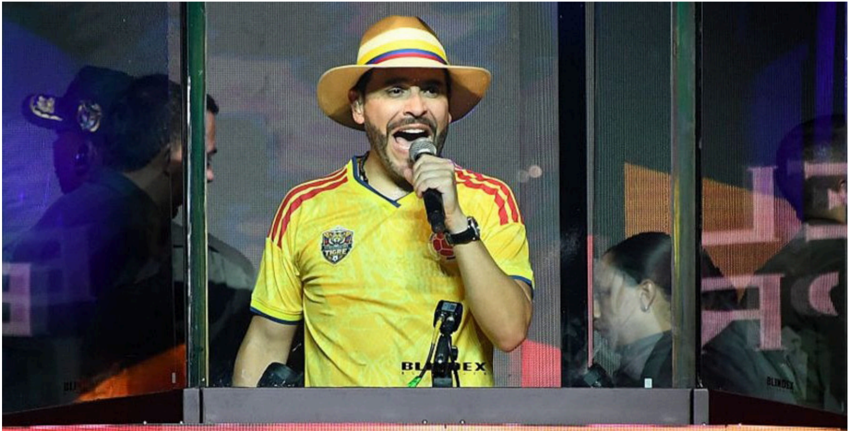
Influye el hecho de que muchos votantes perciben a Abelardo De la Espriella como un hombre ajeno a la política tradicional.