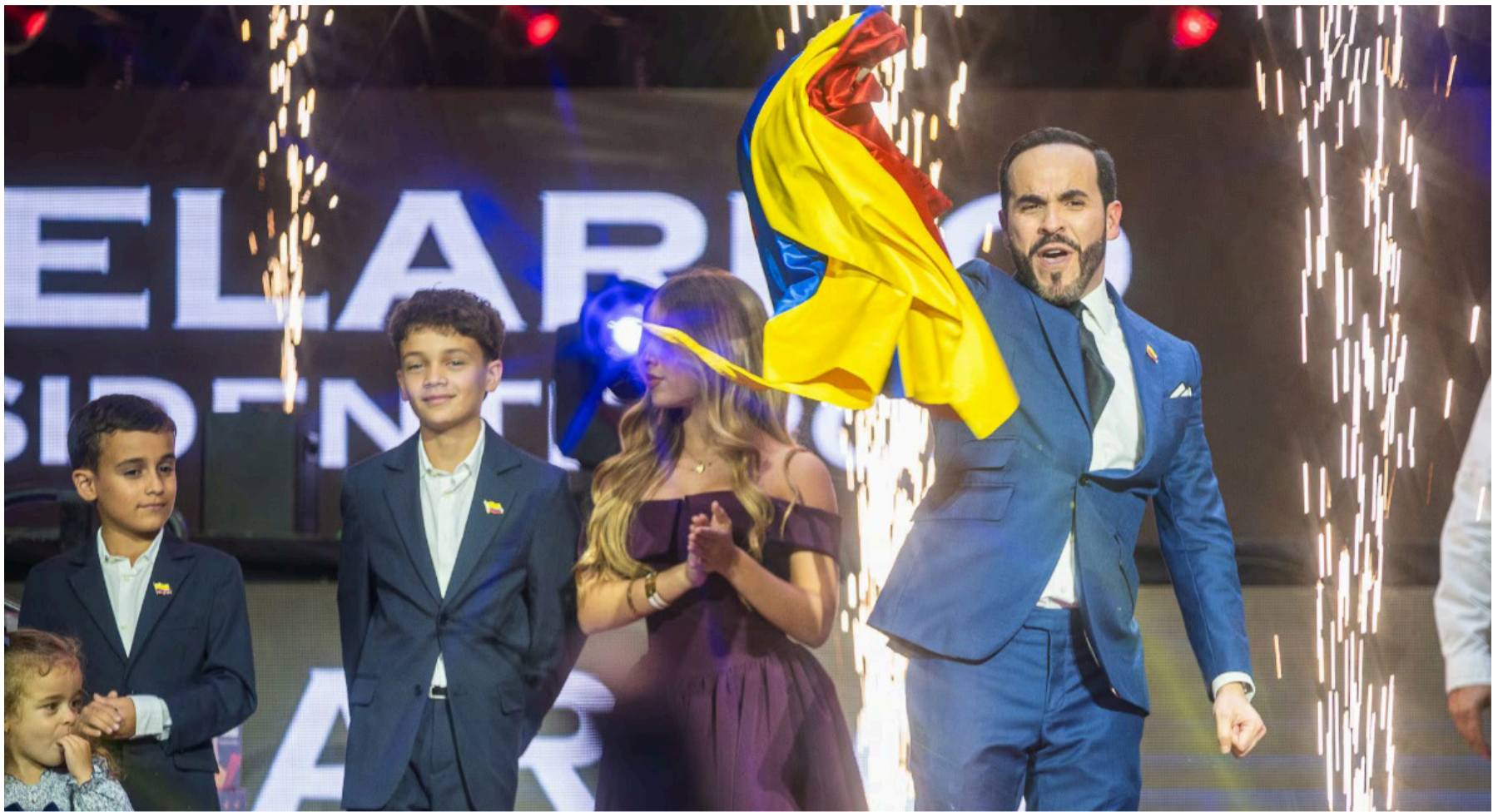
Petro logró ser presidente bajo el discurso anti establecimiento y, por la misma razón, Abelardo De la Espriella tiene tanta popularidad.

El elector fijaba su mirada en la preparación que debía tener un actor político