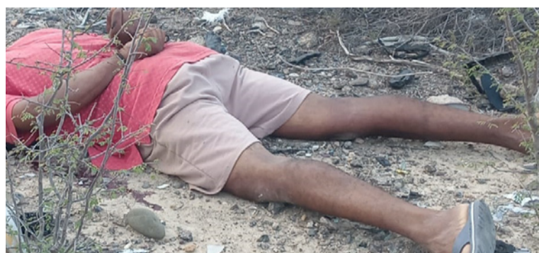
Transeúntes al notar la presencia del cadáver dieron aviso de manera inmediata a las autoridades policiales.