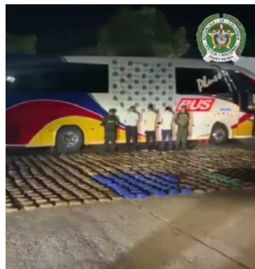
El estupefaciente iba camuflado en el bus.

CONSTANCIA DE FIJACIÓN El presente edicto fue fijado en las carteleras del Palacio Municipal del Municipio de El Molino el día diez (10) de abril de 2026 y desfijado el día primero (01) de junio de 2026.