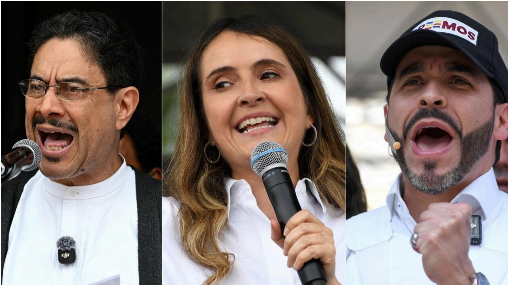
Iván Cepeda, Paloma Valencia y Abelardo De la Espriella siguen liderando la intención de voto de los colombianos.

Antes de Gustavo Petro fue el cartagenero Rafael Núñez