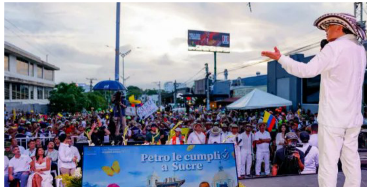
La decisión fue adoptada por la Sección Quinta de la alta corporación al resolver una acción de cumplimiento.

El fallo señala que la acción de cumplimiento no busca imponer sanciones disciplinarias, sino garantizar el respeto y aplicación efectiva de una obligación legal vigente. En ese sentido, el Consejo de Esta-