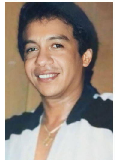
Diomedes Díaz, cantante vallenato.

De avanzar, el 26 de mayo podría convertirse en una fecha oficial para celebrar la música, la tradición y el legado de uno de los artistas más influyentes del país.