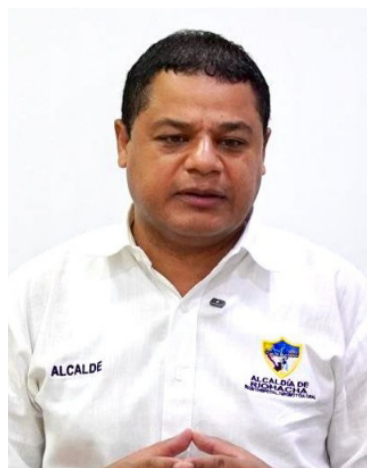
Genaro Redondo, alcalde de Riohacha.