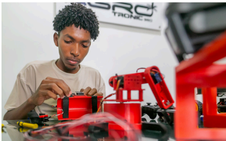
Ministerio TIC ha entregado 156.546 computadores a estudiantes e instituciones educativas por toda Colombia.

el objetivo es sacarle el mayor provecho, también trabajamos con las empresas más importantes del sector para que las personas pudieran formarse gratuitamente en las habilidades digitales que el mundo demanda. La idea era entregar oportunidades y prosperidad a la ciudadanía”, afirmó la ministra TIC, Carina Murcia.