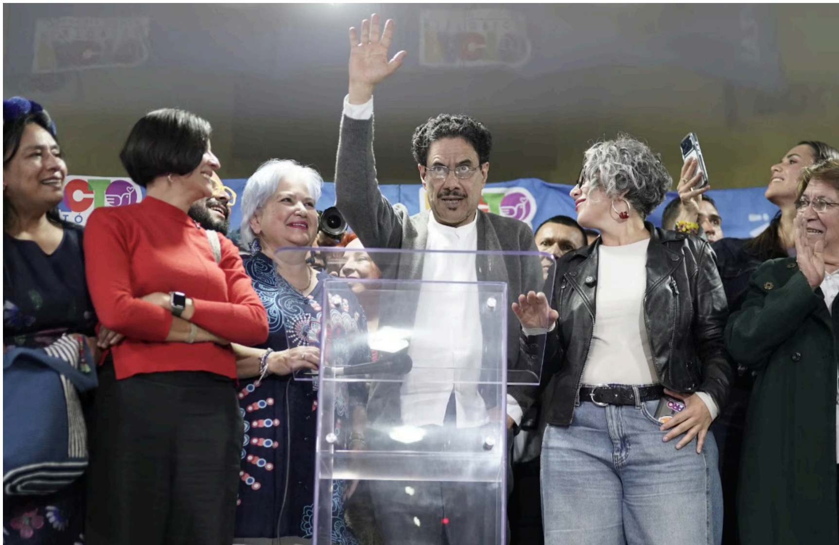
El voto útil es decisivo para completar ese 5.4% que le falta al candidato del Pacto Histórico para ganar en primera vuelta.

¿De dónde y cómo conseguir ese 50% de los votos?