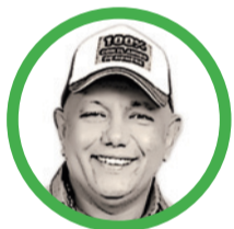
Por Javier Socarrás Amaya

En la publicación anterior decía que el CNE, entidad que muchos miramos como un elefante blanco, por lo costoso que le sale al Estado, sus funciones y resultados son más políticos que jurídicos, debido a que sus magistrados representan los intereses de los partidos.