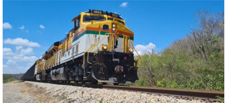
Cerrejón dice que las sentencias y los procesos de consulta previa con las distintas comunidades se han cumplido.

Los líderes de este bloqueo entregaron a la compañía un pliego de peticiones relacionado con diversos temas, entre ellos la solicitud de cumplimiento de sentencias (T-704, 329 256); acciones de industrialización de La Guajira a partir de proyectos energéticos renovables y acceso al agua; acceso y uso del tren de Cerrejón para temas externos a la compañía; participación comunitaria en proyectos energéticos; restitución de condiciones agropecuarias para el pueblo wayuú y comunidades negras; procesos de fortalecimiento organizativo de comunidades étnicas y restablecimiento