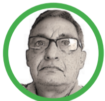
Por José Aragón Jiménez