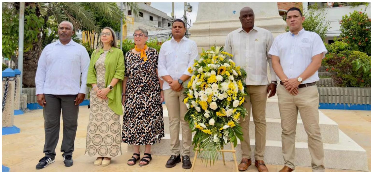
La conversación giraba alrededor de La Guajira, Aruba, Curazao y Bonaire; de nuestras cercanías históricas.