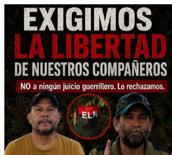
Hicieron un llamado a los secuestradores a permitir el pronto regreso de sus compañeros a sus hogares.

cas ilegales y permitan el pronto regreso de nuestros compañeros a sus hogares.