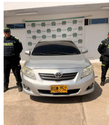
El vehículo fue llevado a la instalación policial.