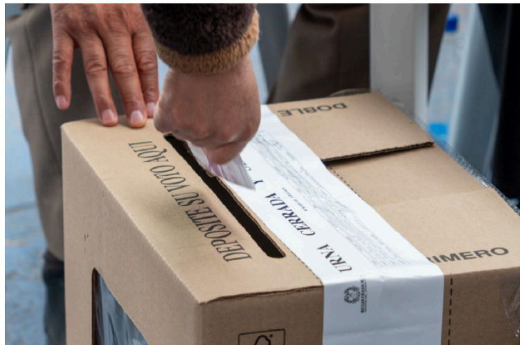
La alcaldesa pidió implementar acciones contundentes que permitan poner fin a esta lamentable situación.

DESTACADO Se evidenció un crecimiento en el fenómeno de la trashumancia, teniendo en cuenta que en las elecciones a la Alcaldía de 2023 se registraban 4.600 personas habilitadas para votar.