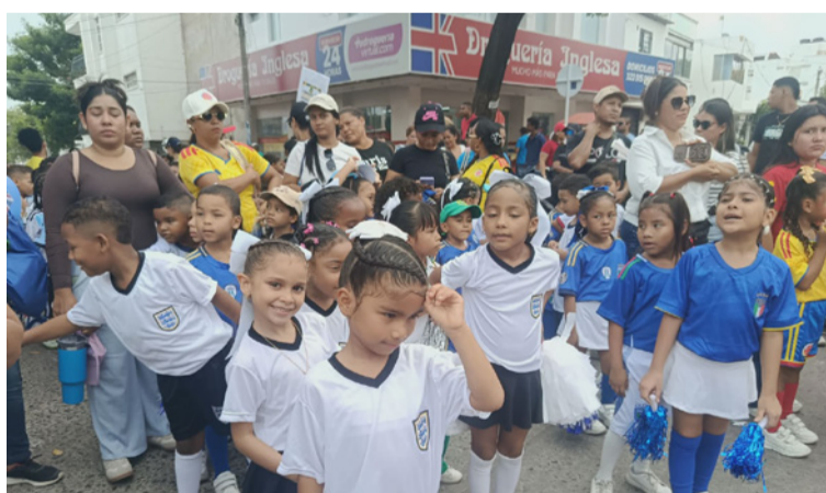
La jornada inaugural, culminó con broche de oro con la presentación de dos partidos de fútbol sala.

empatía y la solidaridad, promoviendo así una convivencia armónica y enriquecedora.