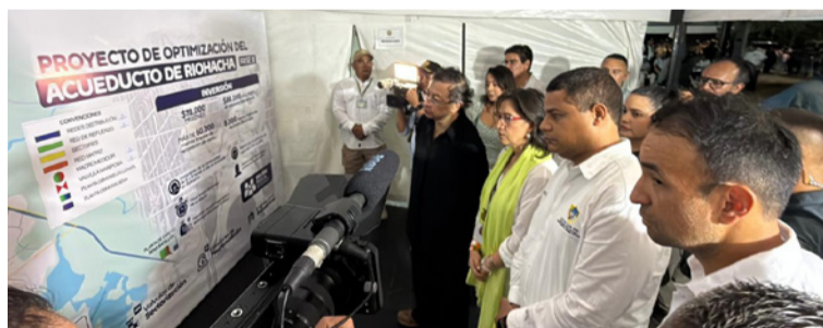
El alcalde Genaro Redondo, valoró la visita del presidente quien en el terreno conoció los avances de la obra.

El presidente de la República, Gustavo Petro Urrego, en su visita a Riohacha, visitó el barrio La Loma, para conocer los avances del programa 'Conéctate con el agua', que ejecuta el Ministerio de Vivienda, Ciudad y Territorio, el Banco Interamericano de Desarrollo, y la Agencia Suiza para el Desarrollo y la Cooperación (Cosude), que se ejecuta en articulación con la alcaldía de Riohacha y la empresa Aqualia.