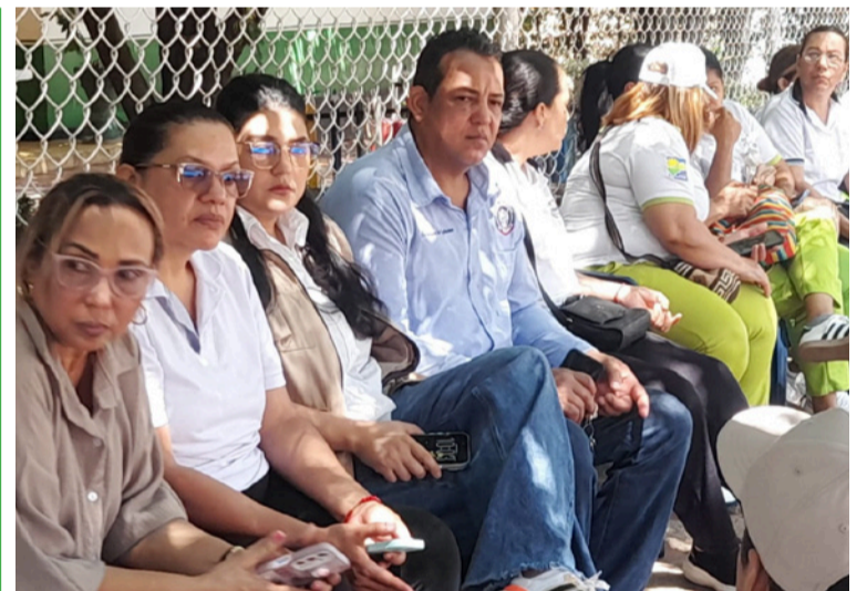
Las autoridades reconocieron la legitimidad de las reclamaciones y se comprometieron a realizar gestiones.

Estos encuentros no solo demostraron el talento deportivo de los jóvenes, sino que también reafirmaron el espíritu de compañerismo y juego limpio que la Institución Educativa Eusebio Septimio Mari busca inculcar en cada uno de sus alumnos.