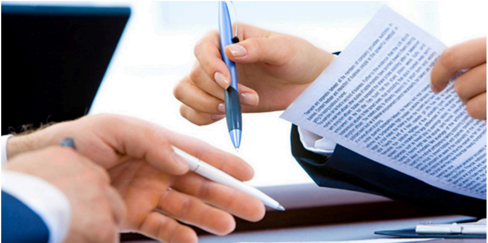
La corrupción ama los laberintos y hay que derribar el laberinto de raíz: menos discrecionalidad.