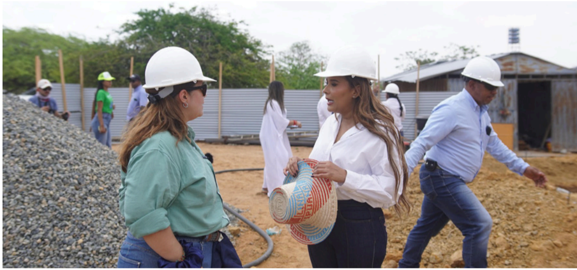
En cuatro años en Esepuga, se ha avanzado lo que no se hizo en los últimos 15 años.

Agregó, que esa situación lleva a soluciones dispersas, porque ya no se puede pensar en un sistema de red. Expresó, que la solución de agua logra disminuir la pobreza, porque una persona que tiene agua en su casa ya puede