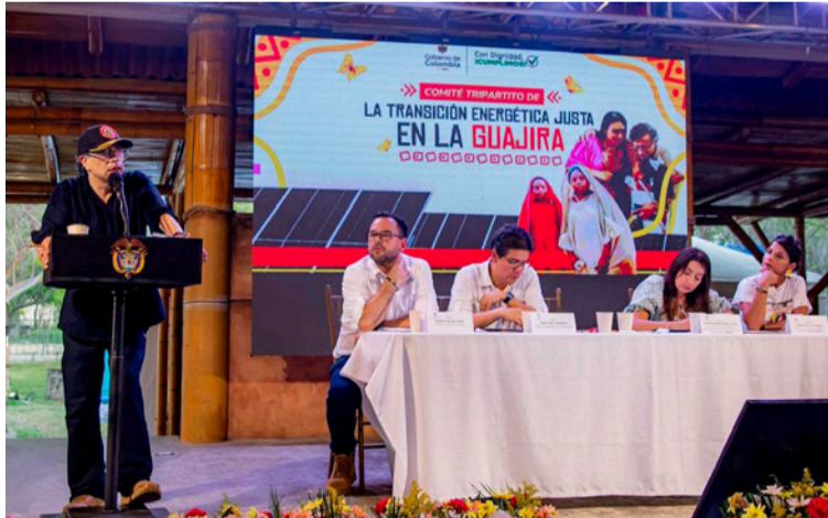
El presidente Gustavo Petro señaló que la energía limpia debe servir primero para el desarrollo regional.

La iniciativa contempla una Unidad Flotante de Almacenamiento y Regasificación (Fsru) frente a las costas de La Guajira, infra-