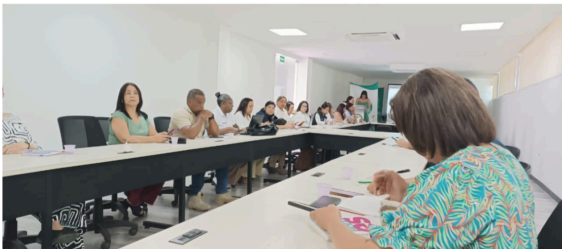
La transparencia, condición estructural de la Sentencia, aparece debilitada.

Por Veeduría Ciudadana para la Implementación de la Sentencia T-302 de 2017.