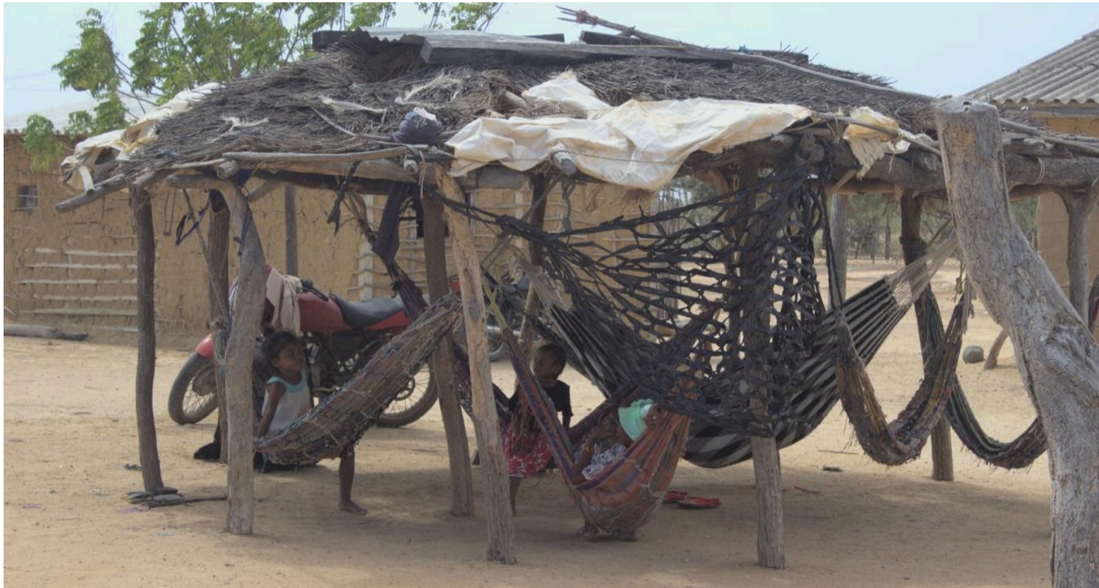
La Corte ordenó formular un plan estructural en seis meses; han transcurrido tres gobiernos.

Incumplimiento prolongado en el tiempo. El plan