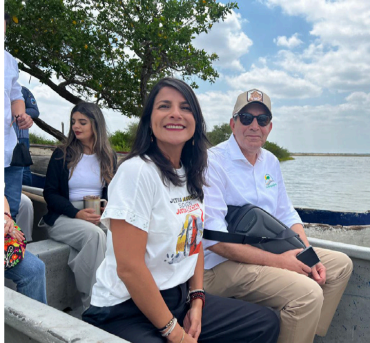
MinAmbiente resalta el trabajo de Corpoguajira al ratificar la negación de la licencia al proyecto Cañaverales.

La jornada reunió a entidades nacionales y territoriales, autoridades étnicas, organizaciones comunitarias y actores estratégicos, en un diálogo orientado a construir acciones conjuntas alrededor de la conservación, la resiliencia territorial y la sostenibilidad ambiental de La Guajira.