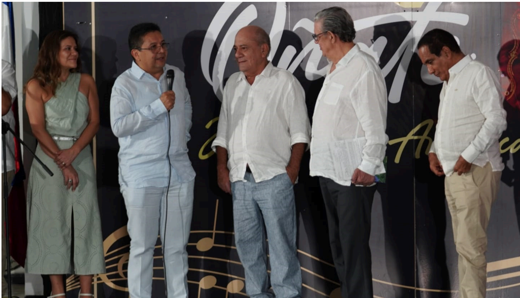
En la celebración de los 40 años de estar al aire Telecaribe, estuvieron presentes sus primeros y actuales colaboradores.

El destino parece tejer una coincidencia en el Canal Regional