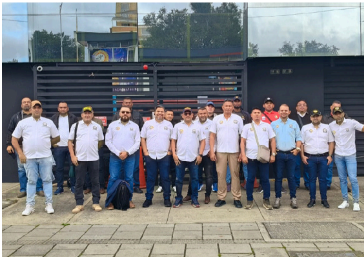
Los escoltas en La Guajira sienten una gran preocupación por el aumento de la inseguridad en el territorio.

Los escoltas en La Guajira sienten una gran preocupación por el aumento de la inseguridad y violencia que hay en el Departamento, en especial, en el Distrito de Riohacha, por la presunta presencia de varios grupos delincuenciales al margen de la Ley o los grupos armados, lo