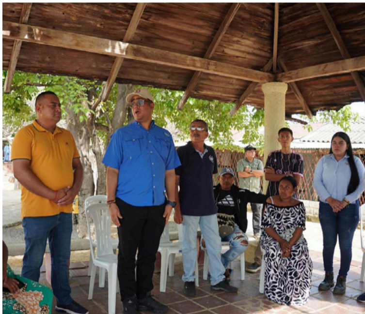
Aguilar destacó que esta obra representa el cumplimiento de un compromiso construido junto a las comunidades.

Durante la visita, el mandatario departamental