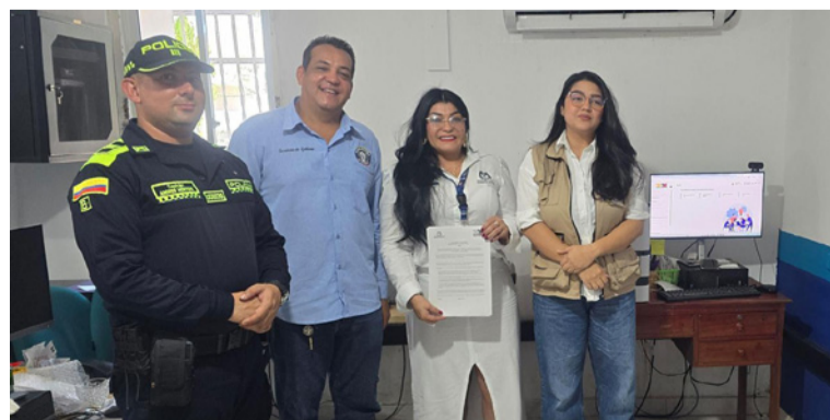
Se escogieron a 426 jurados de votación que estarán distribuidos en las mesas electorales.

se escogieron 426 jurados de votación que estarán distribuidos en las mesas electorales durante la jornada electoral.