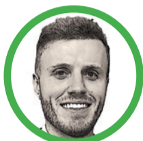
Por Dalton Price

Antropólogo e investigador Doctor en Antropología, Universidad de Oxford