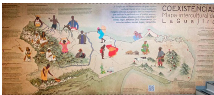
¿Cómo debemos prepararnos para volver a pensarnos como un territorio caribeño, fronterizo, y binacional?

Desde allí debemos pensar esta nueva etapa. Desde nuestras alcaldías, nuestra Gobernación, nuestras cámaras de comercio, nuestras universidades, nuestras autoridades indígenas, nuestros líderes culturales, nuestros transportadores, nuestros comerciantes, nuestros jóvenes y nuestras organizaciones sociales. Desde nuestro profundo conocimiento territorial e histórico. La Guajira no puede limitarse a esperar que otros definan su lugar y relevancia en la relación colombo-venezolana. Debe construir una agenda propia frente a Venezuela.