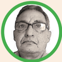
Por José Aragón Jiménez

Lo real es algo, ya hay un ganador amplio, largo y suficiente en la 1ra y si los cálculos no me fallan, no habría 2da y si en caso dado se dé, de esta segunda saldrán derrotados igual que en la primera”.