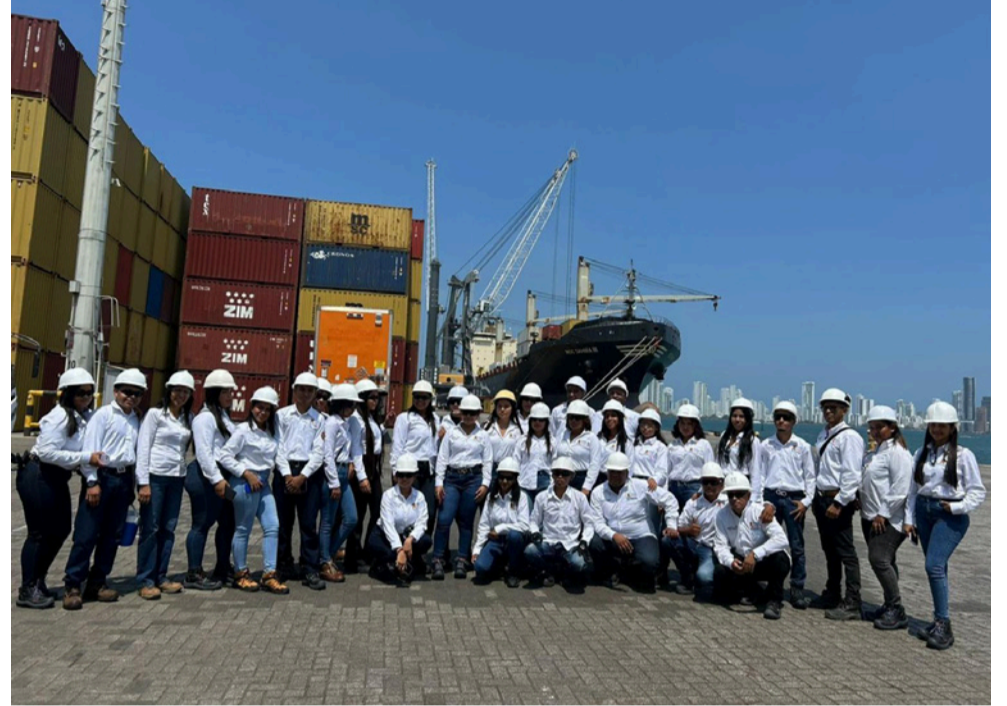
Este espacio permitió, además, un valioso intercambio de experiencias con profesionales del área Hseq.

Para familias indígenas damnificadas en La Guajira