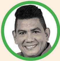
Por Coco Ramos

Toda elección se gana más que con buenas intenciones, con votos, y para una presidencial, mucho, muchísimo más. Claro, el buen dialecto, el respeto, la consolidación de imagen, el discurso, las buenas propuestas y hasta las mentorías, no dejan de ser muy importantes y complementarias las unas y las otras.