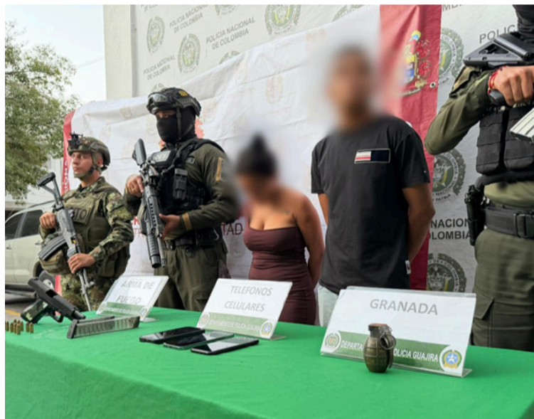
Los capturados y los elementos incautados fueron dejados a disposición de la autoridad judicial competente.

El coronel Salomón Bello Reyes, comandante del Departamento de Policía La Guajira, destacó en un comunicado de prensa la importancia de este resultado operativo y reafirmó el compromiso institucio-