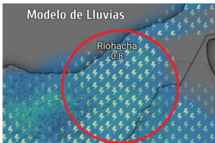
Los valores máximos oscilarán entre los 34 °C y 37 °C, mientras que la sensación térmica estaría entre los 39 y 40 °C.

intensas como en días anteriores. Los valores máximos oscilarán entre los 34 °C y 37 °C, mientras que la