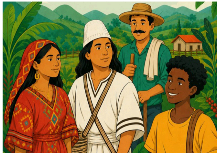
Se desarrollarán concursos orientados a exaltar el talento, la creatividad y el esfuerzo de las comunidades rurales.

gunda Juntanza de Culturas Campesinas reúna a cientos de familias, artistas, agricultores, cocineras tradicionales y líderes