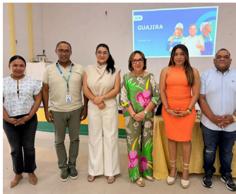
La dirección regional de Air-e se comprometió a trasladarse al municipio para desarrollar una mesa de trabajo.

La Personería municipal de Villanueva informó que continuará realizando seguimiento a cada uno de los compromisos adquiridos, asegurando la defensa de los derechos e intereses de la comunidad y buscando una mejora tangible en la prestación del servicio de energía eléctrica.