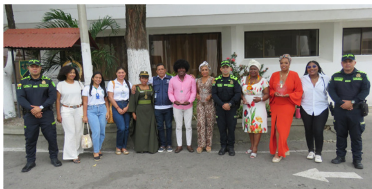
Fueron reconocidos líderes y lideresas afro por su compromiso, trabajo comunitario y defensa de las comunidades.

quienes también se sumaron al reconocimiento de la importancia histórica, cultural y social de las comunidades afrodescendientes en el territorio guajiro y en toda la nación.