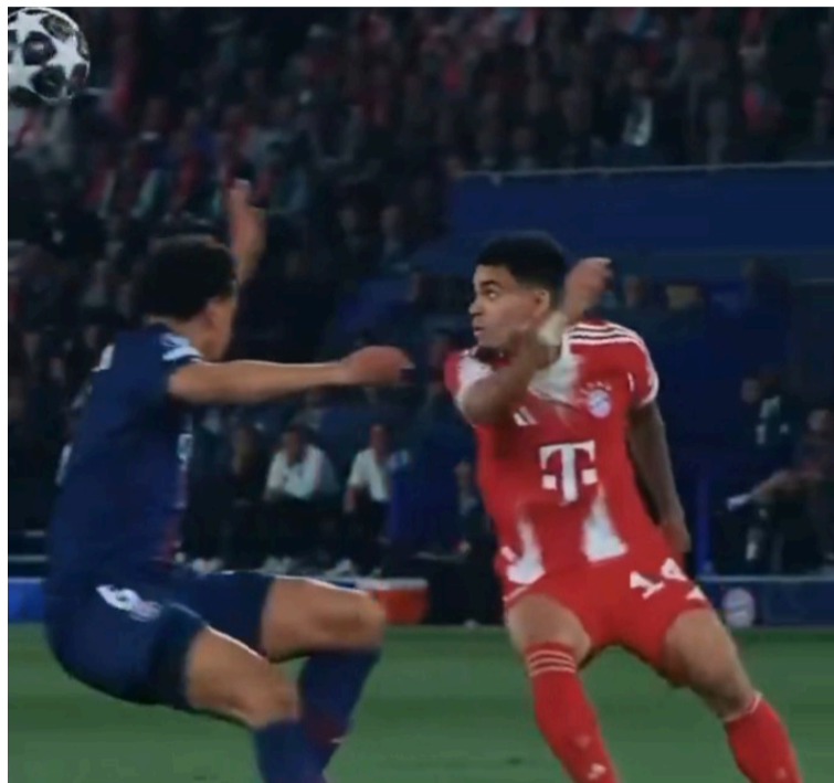
El extremo guajiro será pieza clave para romper el bloque defensivo de los 'suavos'.

Jonas Urbig asumirá la responsabilidad en la portería, tal como lo hizo en los duelos de Bundesliga ante el mismo rival. Las ausencias se extienden a la defensa y el extremo, ya que Alphonso Davies y Serge Gnabry sufren desgarramientos musculares; este último se perderá, además, la cita mundialista.