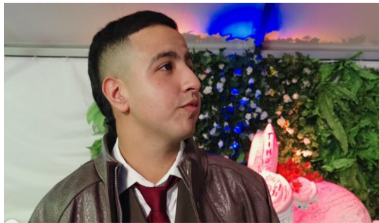
Martín Elías Jr. cantante vallenato.

Martín Elías Jr. encendió las redes al anunciar 'Yo soy mundial', su próxima canción dedicada a su abuelo Diomedes Díaz y al amor histórico de la fa-