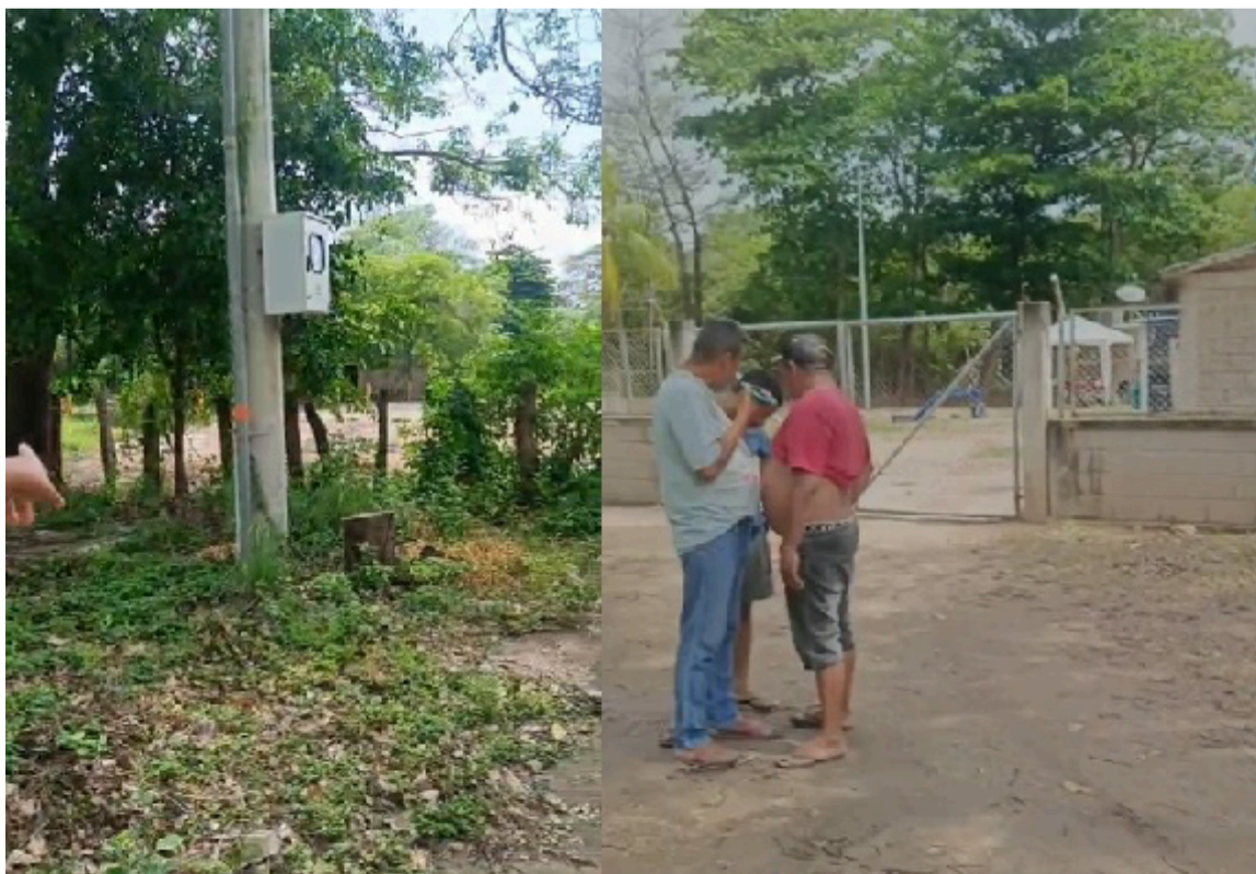
Los manifestantes se tomaron por la fuerza las instalaciones del pozo de Villa Ladys.

de Casas Dúplex, Cuestecita, Sergio Hernández y Ciudad Albania, dejando claro que el pueblo no aguantará un desprecio institucional más mientras los funcionarios gobiernan a espaldas de la necesidad comunitaria.