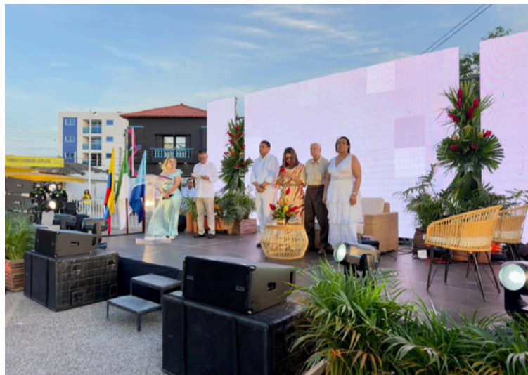
El alcalde destacó la entrada en operación de los buses, como parte del complemento para impactar la movilidad.

"Hoy (ayer) es un día histórico, comienzan a conectarse barrios, zonas comerciales y turismo, en el 60% de la ciudad. Hay que seguir trabajando para que La Guajira tenga servicios así. La llegada de Transpadilla demuestra la capacidad de Riohacha para proyectos de impacto y la confianza que representa para la empresa privada, como ciudad