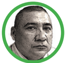
Por Wilfredo Acosta Bolaño