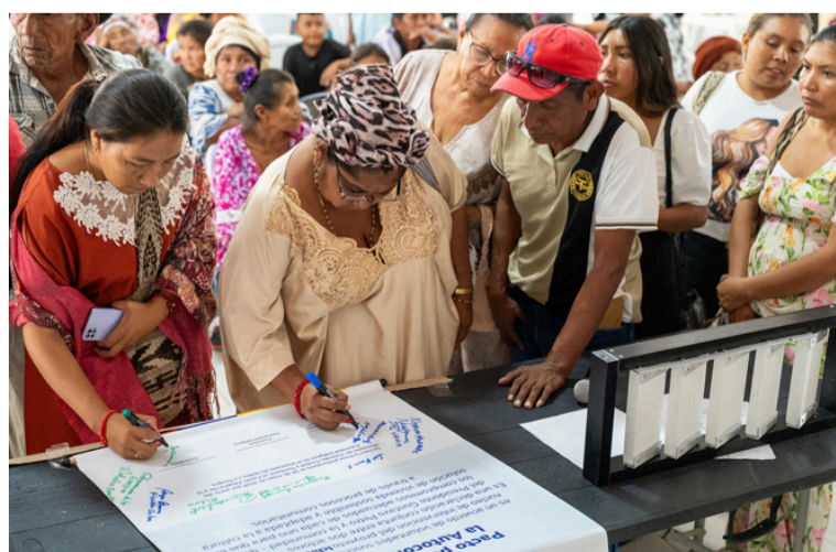
El Fondo Adaptación adelanta acciones complementarias en La Guajira para fortalecer la atención humanitaria.

El Fondo Adaptación y Fonvivienda avanza en soluciones concretas para mejorar la calidad de vida de las comunidades.