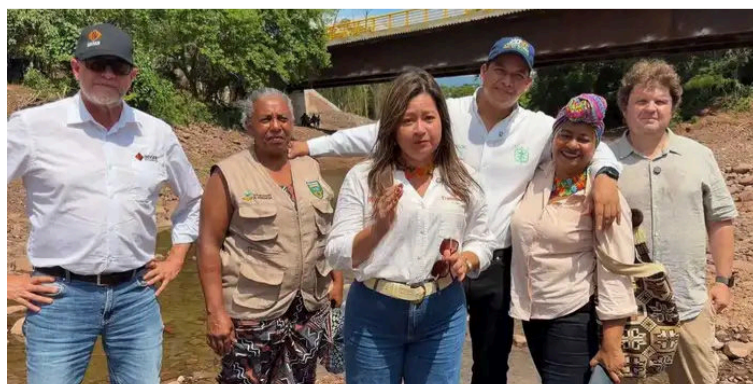
Según la ministra, alrededor de 500 familias campesinas dedicadas al agro se beneficiarán directamente.

Asimismo, la vía tiene un importante impacto para las comunidades indígenas y rurales históricamente apartadas de la región.