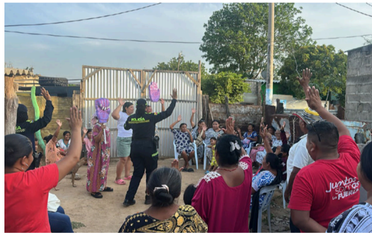
Con las capacitaciones se socializaron las diferentes líneas de emergencia y canales de atención institucional.

En un comunicado de prensa el coronel Salomón Bello Reyes, comandante del Departamento de Policía La Guajira, destacó la importancia de estos escenarios de acerca-