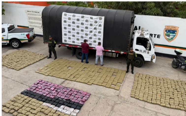
Uniformados hallaron en la parte central del vehículo 954 paquetes de marihuana cubiertos en costales.

Durante el procedimiento, los uniformados detuvieron un vehículo tipo camión de servicio público que cubría la ruta Medellín - Riohacha. Al practicarle un registro al automotor, evidenciaron varios bultos ocultos dentro de canastas vacías de mercado. Tras una verifi-