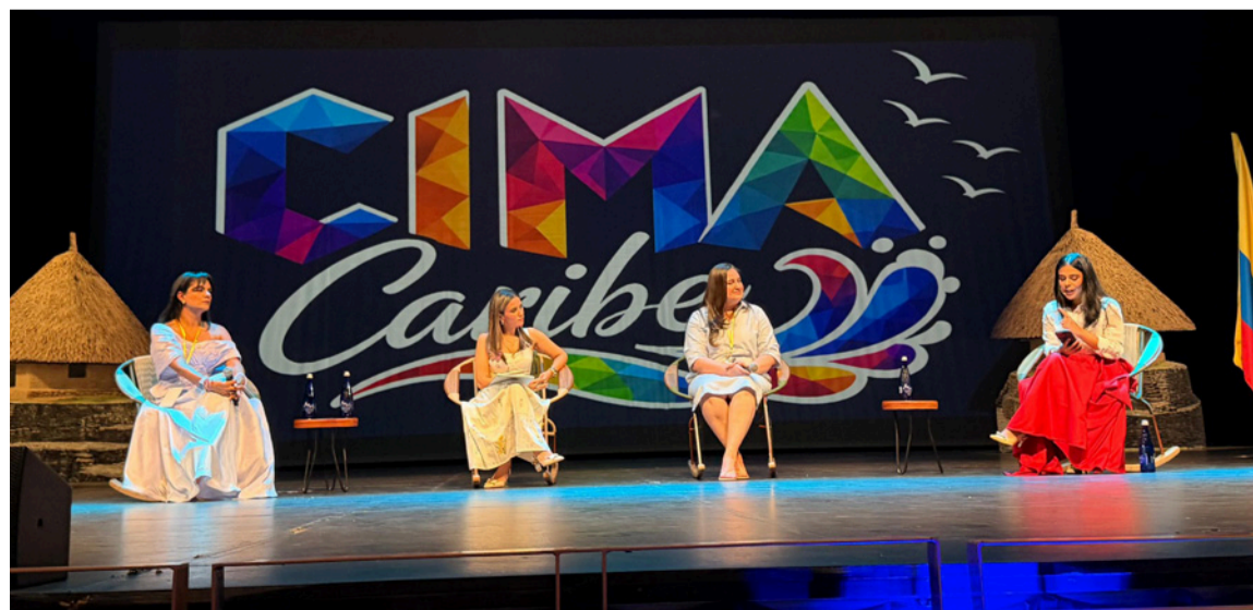
El evento busca visibilizar el liderazgo femenino en los territorios, fortalecer redes de apoyo entre mujeres y motivar a nuevas generaciones.