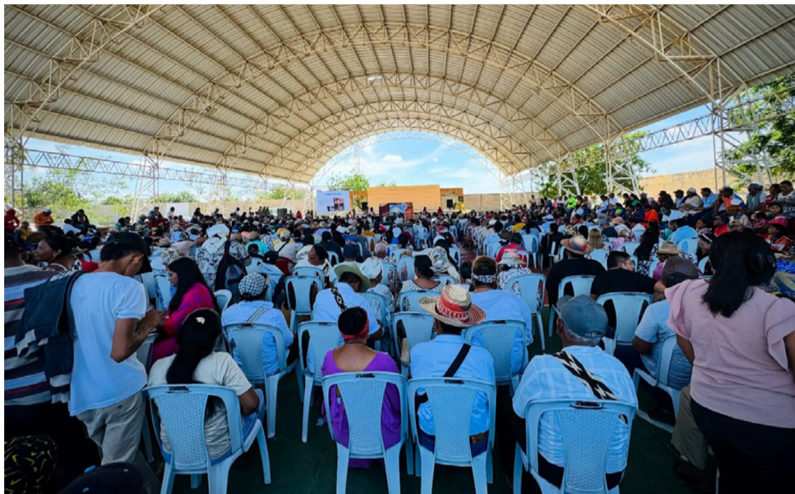
La discrepancia se mantuvo sobre la autonomía del pueblo wayuú.

E n un extenso documento la Gobernación de La Guajira, a través de la Secretaría de Asuntos Indígenas, pidió al Gobierno nacional sostener el diálogo técnico e intercultural sobre la Línea Negra, teniendo en cuenta las afectaciones del Decreto 0514 del 19 de mayo por el cual se precisa el territorio ancestral de los pueblos indígenas de la Sierra Nevada.