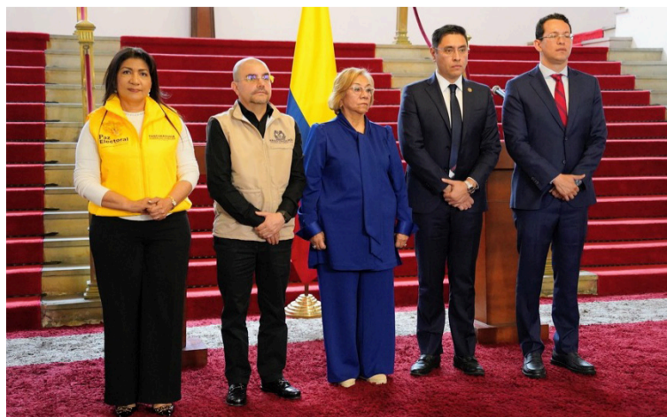
El presidente del CNE Cristian Quiroz, subrayó la dimensión del despliegue de control electoral.

El Consejo Nacional Electoral reiteró el llamado a todos los testigos electorales acreditados —tanto en el exterior como en el territorio nacional— a ejercer sus funciones con responsabilidad, imparcialidad y apego a las garantías democráticas, en una jornada clave para el fortalecimiento de la confianza ciudadana en el sistema electoral colombiano.