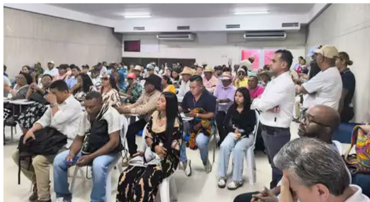
Los tramos a intervenir se realizarán bajo mecanismos de trabajo conjunto con las comunidades wayuú.

toridades tradicionales y habitantes del territorio pudieron conocer de primera mano los alcances de la propuesta Plan de