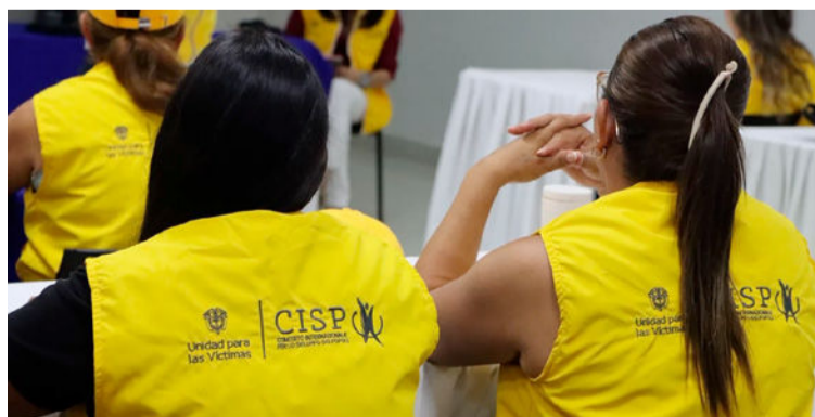
La iniciativa brinda acompañamiento de cerca a los sobrevivientes del conflicto armado, a través de 30 profesionales.

La iniciativa brinda acompañamiento de cerca a los sobrevivientes del conflicto armado, a través