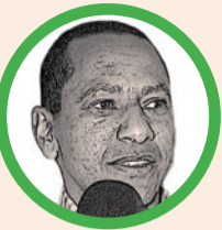
Por Jorge Nain Ruiz Ditta