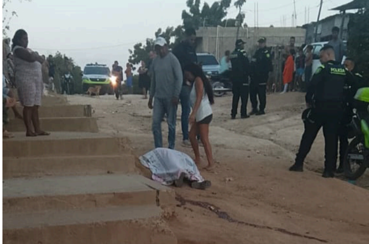
Los hechos ocurrieron a las 3:00 de la madrugada de ayer lunes, en la vía pública del barrio Villa del Sur.

cindario, los hechos ocurrieron aproximadamente las 3 de la madrugada de ayer lunes, en la vía pública del barrio Villa del Sur, mejor conocido como 'Villa Cacho', en la comu-