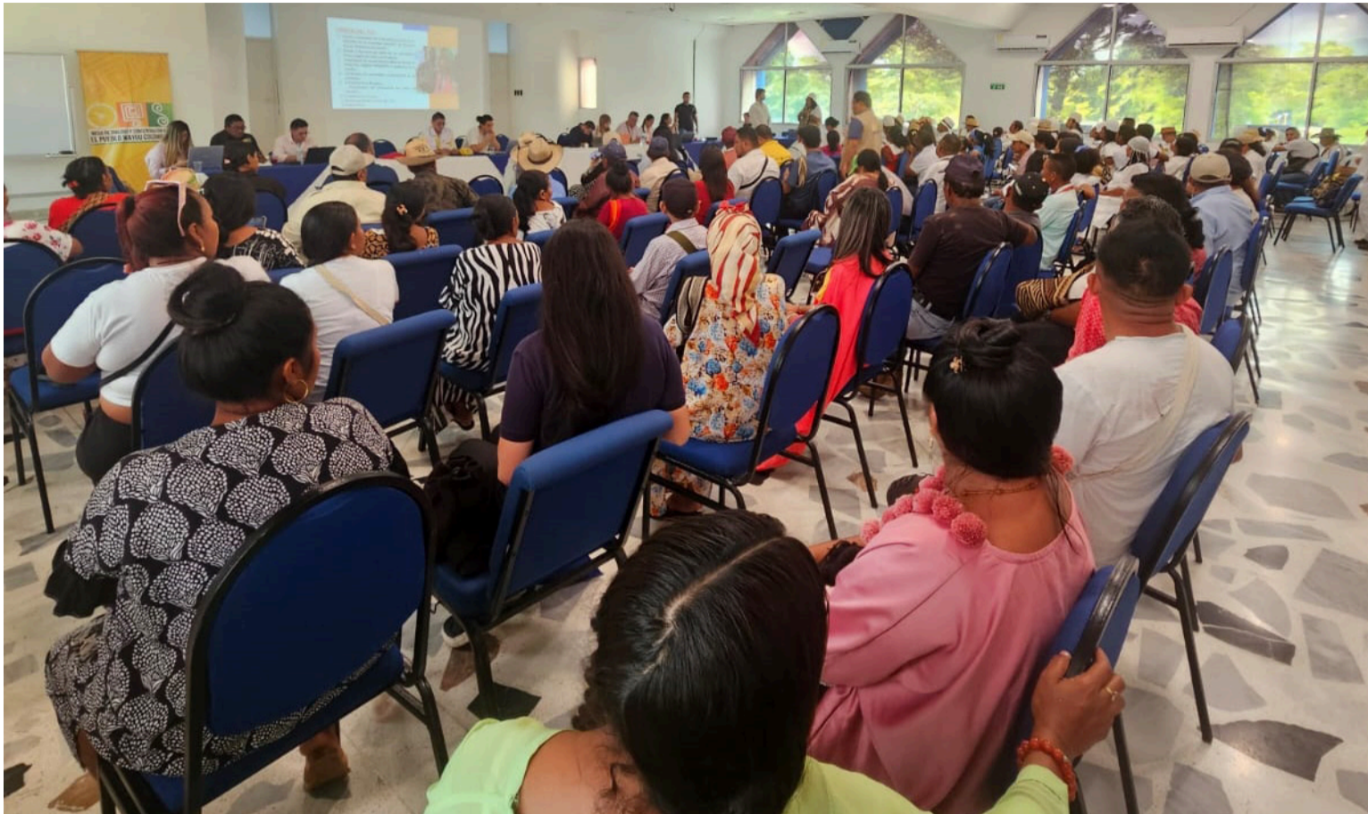
El eje central de la ruta metodológica parte de reconocer que la consulta previa es un derecho fundamental y colectivo.

No puede limitarse a los anuncios institucionales