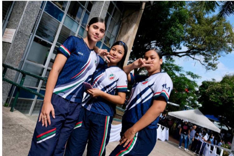
Los recursos cubren costos de matrícula, transporte, materiales y bienestar.

Frente a esa realidad, el Pties actúa en varios frentes al mismo tiempo: fortalece los aprendizajes en lenguaje y matemáticas, ajusta el currículo de los grados 10° y 11° en las instituciones beneficiarias, ofrece orientación socioocupacional pertinente y diseña planes de formación docente, todo ello con la participación activa de entidades territoriales, instituciones de educación superior públicas y las comunidades locales.