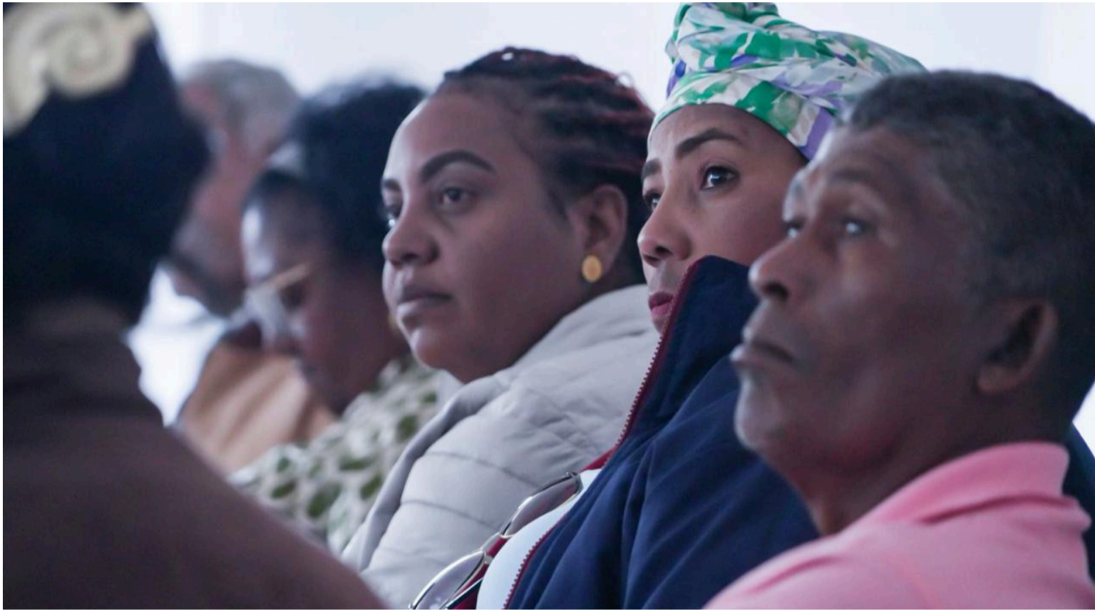
No sé cuál fue el enemigo del presidente que le habló para que firmara ese Decreto sin haberse realizado la consulta.