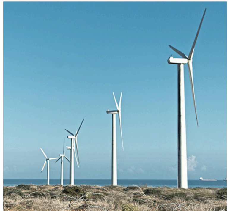
JK1 y JK2 cuentan con una capacidad asignada de 259 MW e incluyen una línea de transmisión de 35 km.

Ecopetrol informará oportunamente al mercado cualquier avance adicional en este proceso, en cumplimiento de la normatividad aplicable, hasta adquirir la totalidad del porcentaje del clúster antes mencionado.