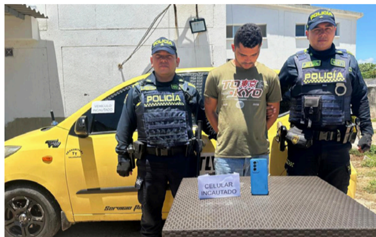
Fueron incautados 300 kilos de carne de res, un vehículo tipo taxi y un equipo móvil. La persona fue capturada.

Profesional U. Secretaria de Planeación.