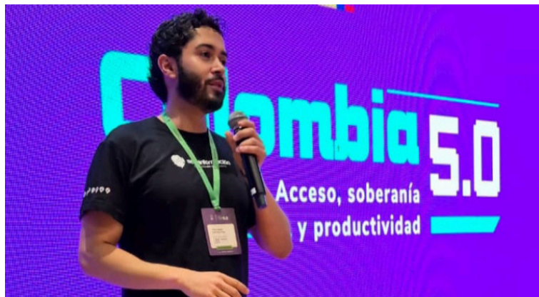
Representantes del ecosistema digital destacan la importancia de llevar estas iniciativas a las regiones.

Durante las jornadas, estudiantes, emprendedores, empresarios y público en general disfrutaron de experiencias interactivas y actividades que mues-