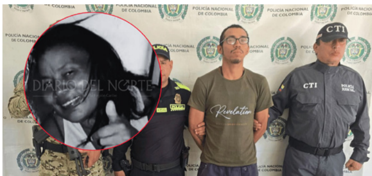
El capturado fue dejado a disposición de la Fiscalía Cuarta Seccional de Vida de Fonseca.