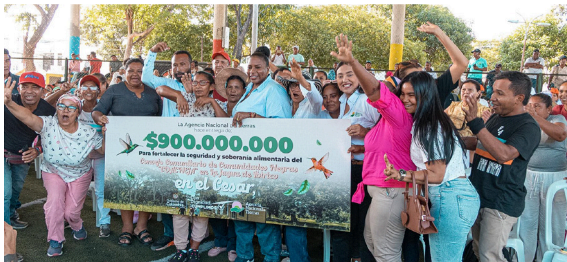
También se realizó la entrega simbólica de cheques por un total de $5.700 millones.

"Estamos avanzando en una Reforma Agraria con enfoque étnico, que reconoce las luchas históricas de los pueblos afrodescendientes por el territorio y por la preservación de sus usos ancestrales. Hoy no solo entregamos tierras; entregamos herramientas para fortalecer la autonomía, la producción y el futuro de las comunidades afro en Colombia", aseguró Perea Rentería.