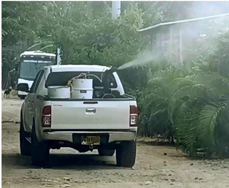
Estas acciones buscan disminuir el riesgo de propagación de la enfermedad y proteger la salud de las comunidades.

Estas acciones buscan disminuir el riesgo de propagación de la enfermedad y proteger la salud de las comunidades, especialmente en territorios