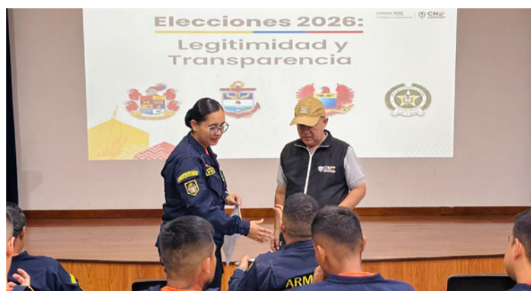
El aplicativo les permitirá a los testigos electorales acreditados registrar incidencias durante la jornada.

conjunto fortalecen la transparencia, la trazabilidad de los comicios y legitiman los resultados electorales.