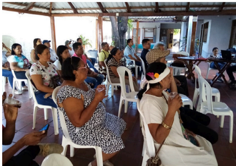
Después se desarrollarán reuniones previas con el pueblo wayú para concertar la metodología definitiva.

La hoja de ruta diseñada para el Plan Estructural tiene como antecedente el proceso adelantado desde 2021, cuando se concertó inicialmente la metodología entre el Gobierno nacional y representantes wayú. Aquella primera etapa permitió