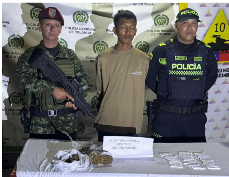
El capturado y el material incautado fueron trasladados hasta las instalaciones de la URI de Maicao.

En desarrollo de las acciones operativas para combatir el tráfico local de estupefacientes y fortalecer la seguridad ciudadana en el municipio de Maicao, uniformados de la Policía Nacional lograron la captura de un ciudadano por el presunto delito de tráfico, fabricación o porte de estupefacientes.