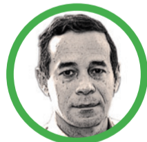
Por Jorge Juan Orozco Sánchez