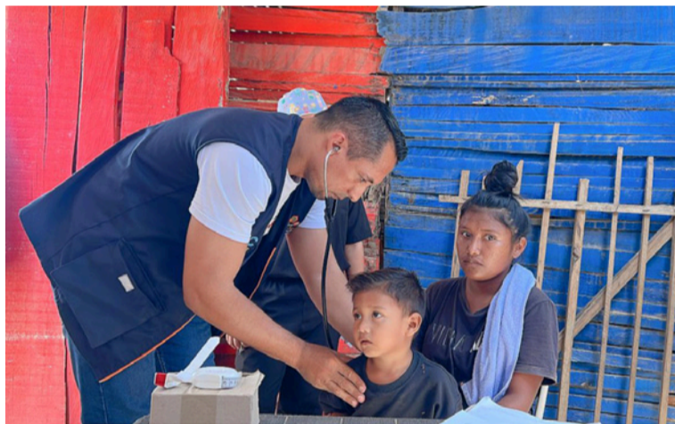
El Distrito de Riohacha está llegando a través del PIC a varias comunidades, barrios y corregimientos.

La Alcaldía Distrital fue constante durante los 3 días de jornada. Sin los aportes del equipo Distrital, no se hubiese desarrollado el proceso que ordenó la Corte a la Procuraduría, convocante del ejercicio de cumplimiento.