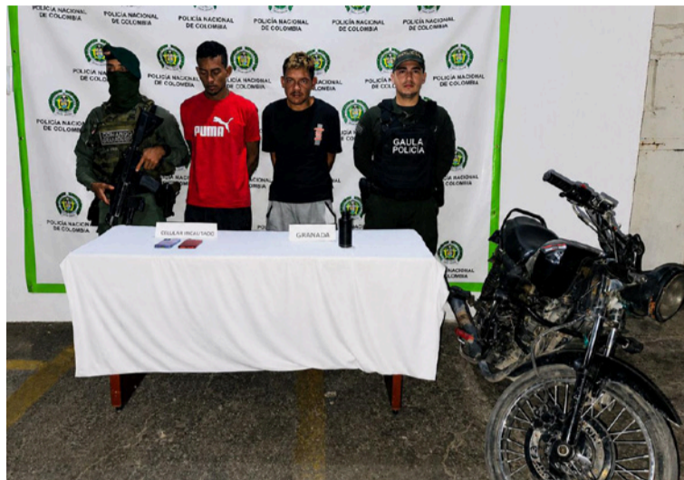
Los hoy capturados serían los encargados de generar temor y presión sobre las víctimas.

De acuerdo con las investigaciones adelantadas por los uniformados del Gaula de la Policía Nacional, esta organización delictiva estaría realizando exigencias económicas a comerciantes y ganaderos, con sumas que oscilaban entre los 50