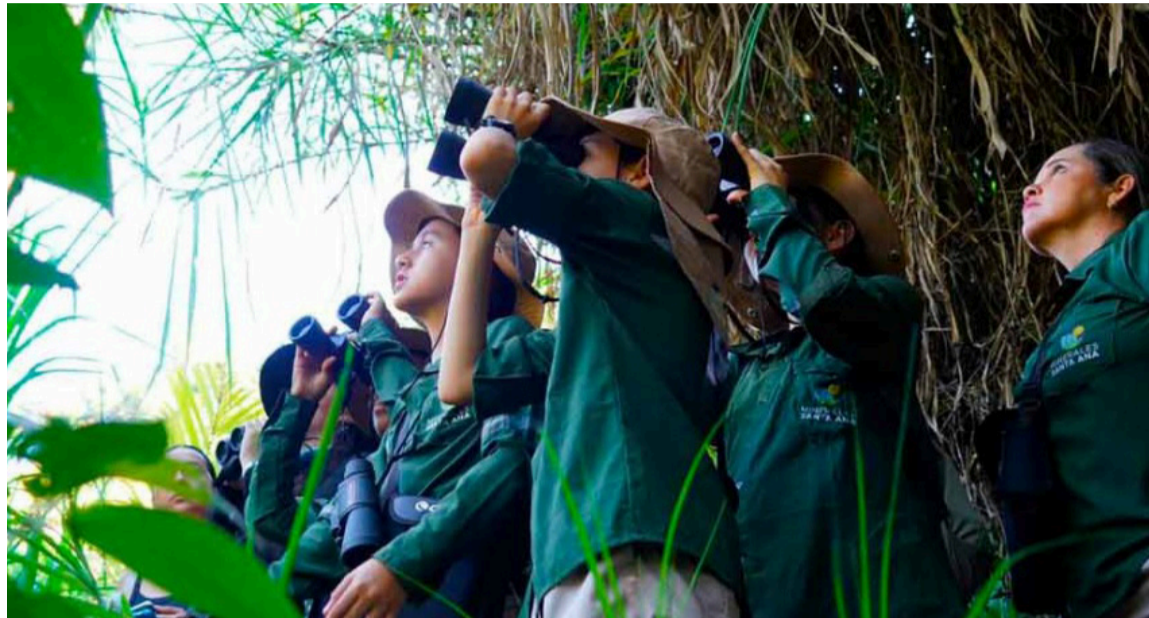
La riqueza natural del territorio guajiro ofrece múltiples ecosistemas.

Iniciar temprano para aprovechar la mejor luz y