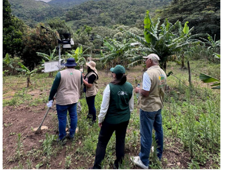
Los equipos permiten medir variables como temperatura, humedad, precipitaciones, velocidad y dirección del viento.

Fueron instaladas en Fonseca y San Juan del Cesar