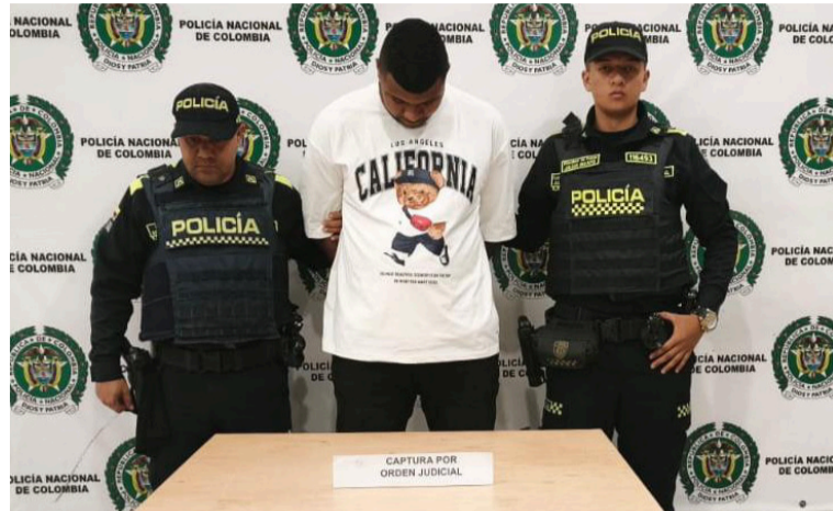
La Policía logró la captura por orden judicial de un ciudadano señalado por el delito de hurto agravado.

“Seguimos desarrollando acciones operativas y preventivas que permitan fortalecer la seguridad y tranquilidad de los ciudadanos. Estos resultados son producto del compromiso y la capacidad de reacción de nuestros uniformados, quienes trabajan día y noche para hacer cumplir la ley y ga-