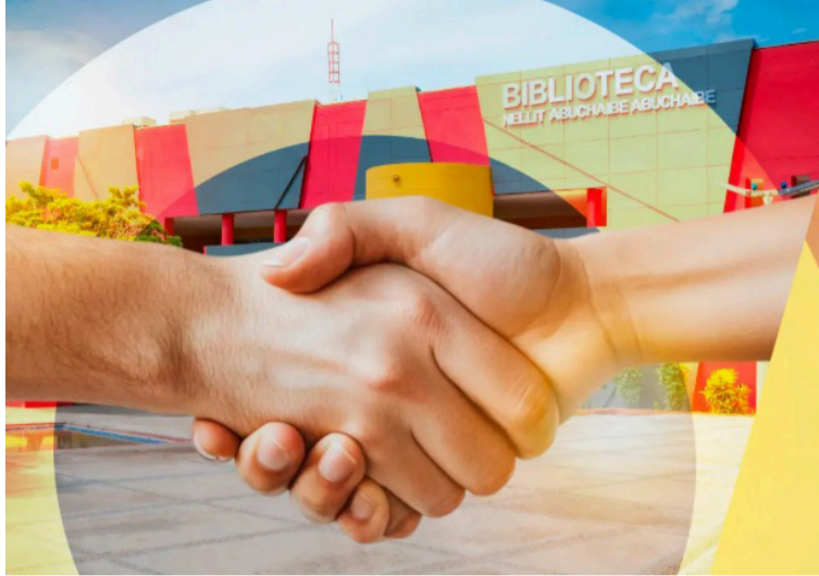
Estudiantes, docentes y administrativos podrán acceder a una oferta integral de servicios en un solo lugar.

El evento, liderado por la Coordinación de Relacionamiento con el Ciudadano y la Secretaría General, tiene como objetivo principal eliminar las barreras entre la administración y sus estamentos.