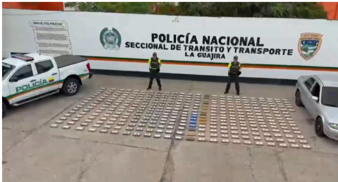
Se indicó que este resultado impacta de manera significativa las finanzas del narcotráfico.

La Policía indicó que este resultado impacta de manera significativa las finanzas del narcotráfico, afectando rentas criminales estimadas en más de 2.275 millones de pesos y evitando la comercialización de cerca de 350.000 dosis.