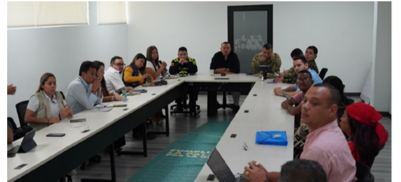
Las autoridades evaluaron la situación de seguridad en distintos puntos del Departamento.

El gobernador encargado destacó la importancia de continuar fortaleciendo el trabajo interinstitucional para brindar mayor confianza a las comunidades y garantizar un Departamento más seguro para todos.