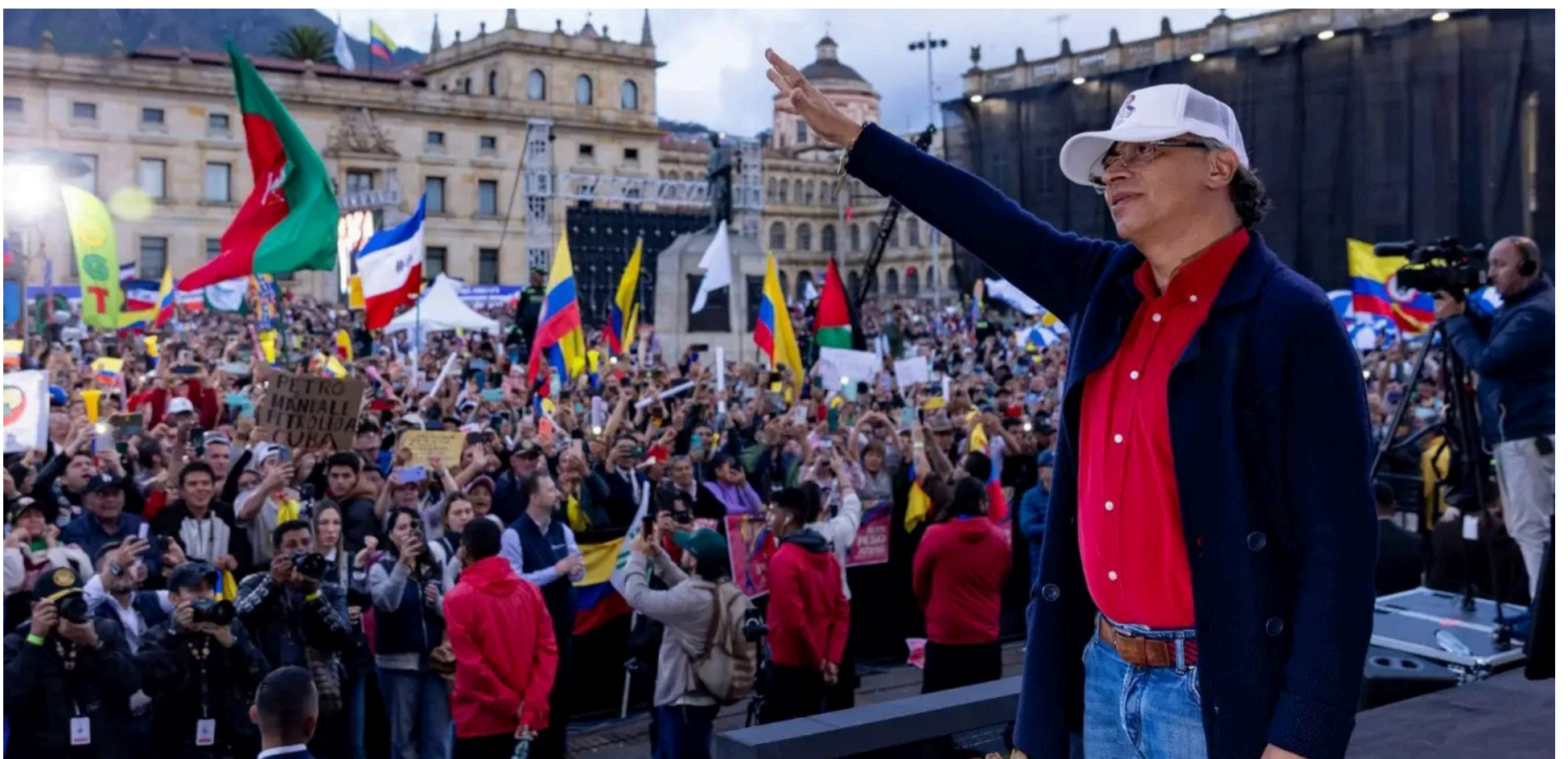
La popularidad de Petro, se evalúa mediante encuestas, enfocándose en indicadores de imagen positiva, aprobación de gestión y favorabilidad.