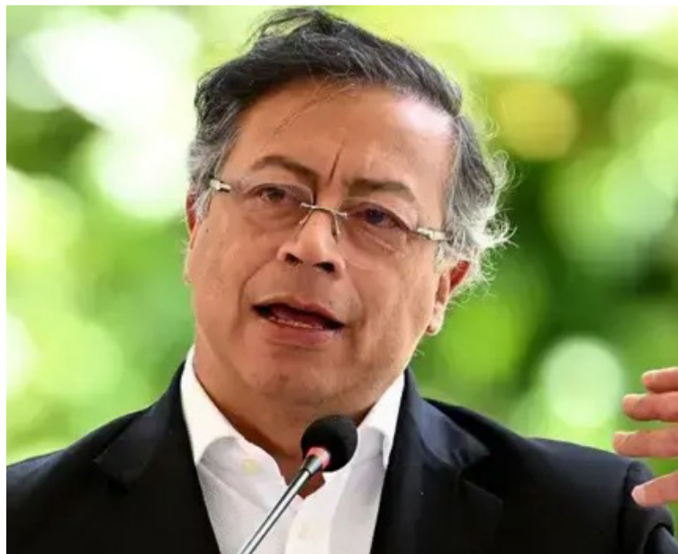
La firma asesora al presidente Petro en asuntos relacionados con las sanciones impuestas por Estados Unidos.