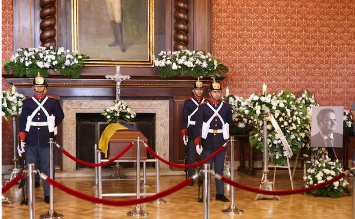
Hoy la Catedral Primada de Bogotá será el escenario de la misa de despedida.

Aunque el país ha seguido de cerca los homenajes, la familia ha solicitado que esta ceremonia religiosa sea un evento