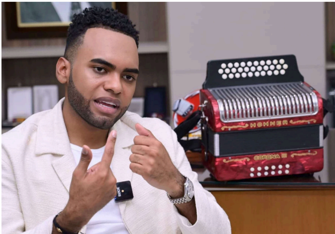
El Rey Vallenato 2026 habló en detalle de su vida y obra en la música vallenata.

Al hablar de ese hecho se regresa en el tiempo y anota que "querer ser Rey Vallenato fue un sueño desde que era niño. Esto demuestra que los sueños