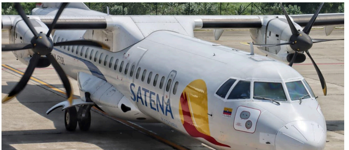
Esta ruta, operada sin escalas, permite un desplazamiento ágil y eficiente.

DESTACADO La operación de esta ruta contribuye al desarrollo económico y turístico de La Guajira, al facilitar el acceso, promover la inversión y mejorar la conectividad.