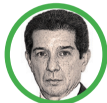
Por José Félix Lafaurie Rivera