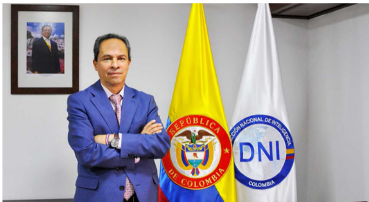
El DNI explica que no desarrolla actividades de inteligencia operativa; es un organismo no armado.

La DNI es un organismo de inteligencia de carácter