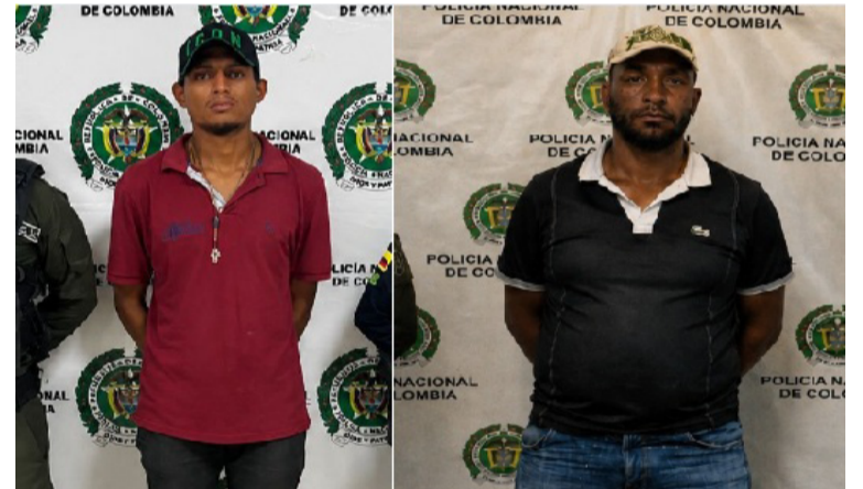
A los capturados se les señala de exigir dinero a comerciantes y ganaderos en municipios del sur de La Guajira.

El capturado registra antecedentes por el delito de falsedad en documento. El coronel Salomón Bello