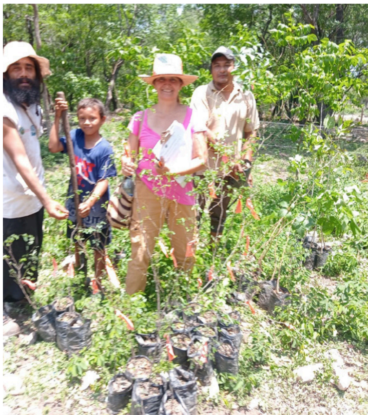
Desde hace 4 años se vienen haciendo viveros comunitarios para reproducir distintas especies de árboles.

Hasta el resguardo de Zahino, comunidad indígena del municipio de Barrancas, La Guajira, llegó la fundación Bachaqueros, después de visitar el manantial de Cañaverales, ubicado en el corregimiento de Cañaverales, municipio de San Juan del Cesar, donde realizaron una jornada de siembra de árboles nativos de la región como parte de las actividades de conservación ambiental.