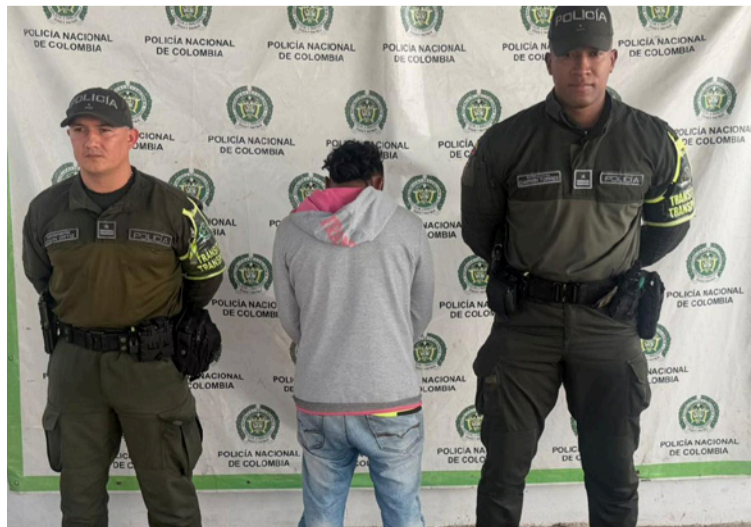
Esta persona portaba una licencia de tránsito que presentaba inconsistencias y, al parecer, sería falsa.

DESTACADO El ciudadano fue informado de sus derechos como persona capturada y dejado a disposición de la Fiscalía General donde deberá responder por el delito señalado.