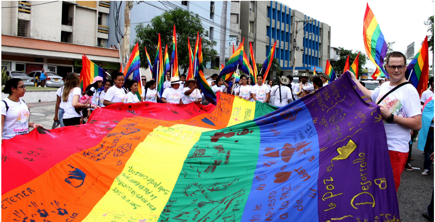
El informe indica que las agresiones contra personas Lgbtiq+ siguen un continuo de violencia que inicia con la discriminación.