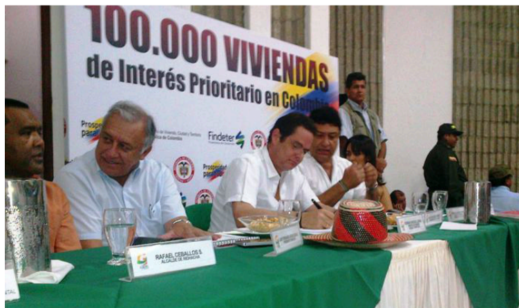
El ministro de Vivienda, Germán Vargas Lleras, inició en Riohacha la construcción de viviendas gratis