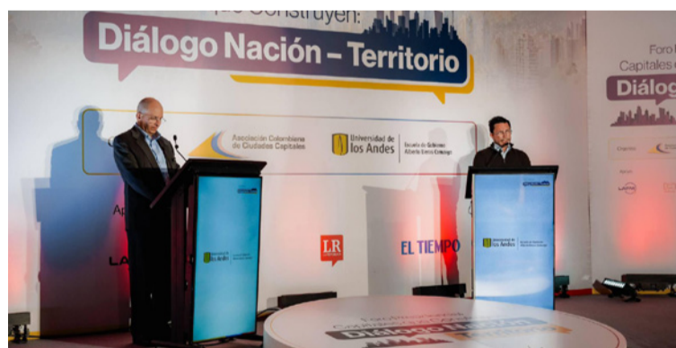
Dijo que se necesitan regiones con capacidad de decidir.