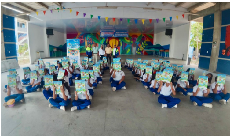
Las jornadas con los diversos participantes están enfocadas en promover el uso responsable del agua.

De otro lado, se han alcanzado a más de 1.000 niños y niñas con el Concurso Digital Educativo Infantil 'El misterio del hilo azul', una estrategia educativa que fortalece la cultura ambiental desde las aulas y se alinea con los Objetivos de Desarrollo Sostenible, en especial el ODS 6: agua limpia y saneamiento, ODS 4: educación de Calidad y ODS 17: alianzas para lograr los objetivos, gracias al trabajo articulado con instituciones, líderes comunitarios y actores locales.