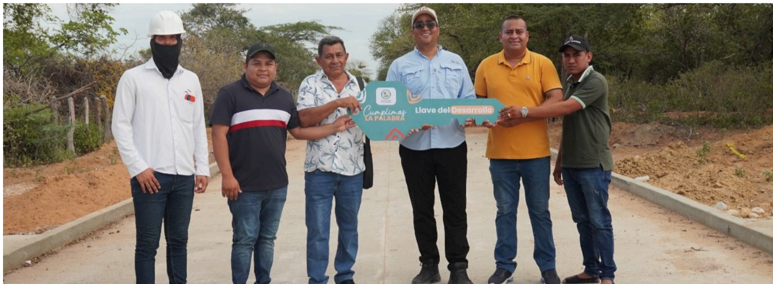
El mandatario departamental inspeccionó las intervenciones que actualmente alcanzan un 98% de ejecución.