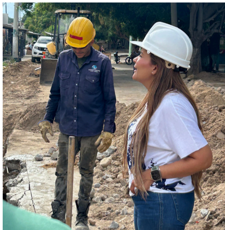
La gerente resaltó el compromiso de la Gobernación de La Guajira, con la supervisión permanente de las obras.

Durante el recorrido, la gerente resaltó el com-