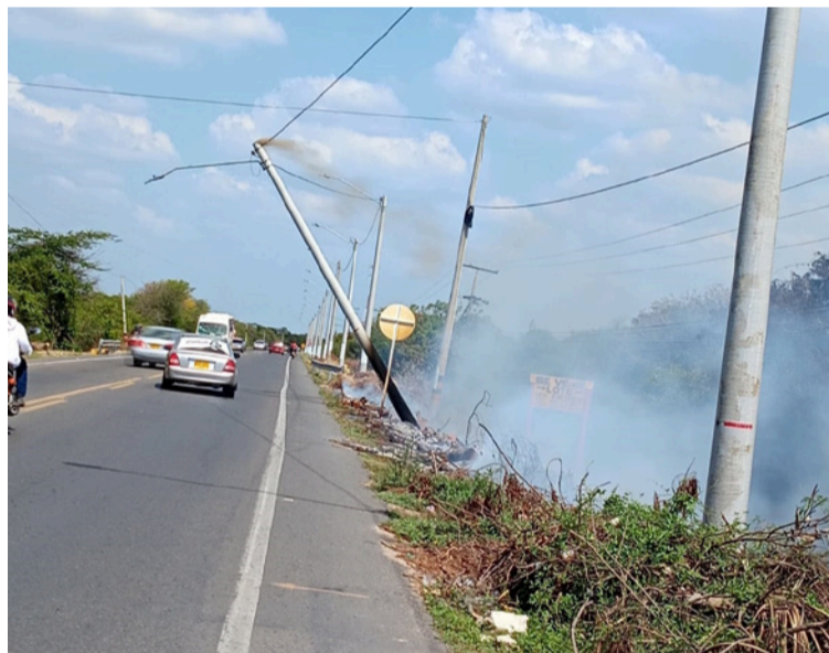
El incendio se propagó por varios metros y dañó el tronco del poste de alumbrado.

"La Alcaldía de Riohacha hace como un mes hizo un operativo de limpieza en esta zona, pero no solo es hacer limpieza