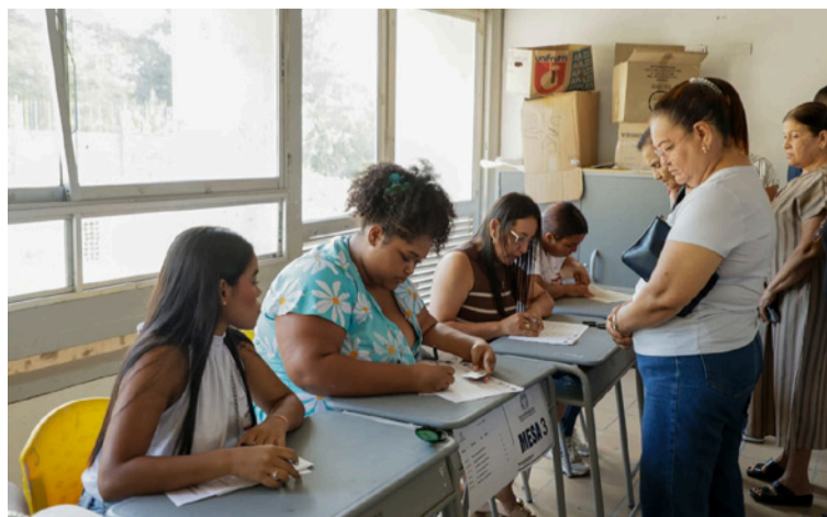
La Comisión Escrutadora 'reasumirá sus funciones' y convocó a audiencia pública de escrutinio para hoy.

La decisión fue notificada a los candidatos participantes, apoderados acreditados, representantes del Ministerio Público y claveros de la Comisión, en cumplimiento de la orden judicial relacionada con el proceso electoral adelantado en el municipio de Fonseca.