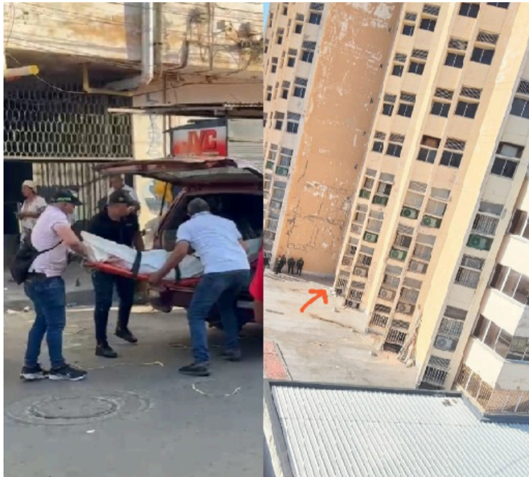
Al parecer un adolescente de 18 años se habría lanzado desde el piso 12 del edificio de un hotel.

El hecho causó gran asombro en los propieta-