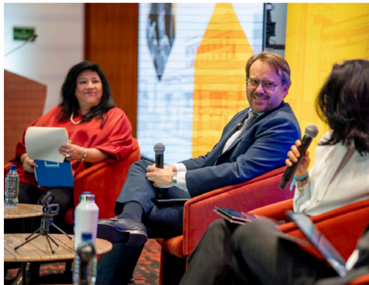
La aplicación Comitium en Línea, una herramienta tecnológica que representa un salto hacia la vigilancia electoral.

mientos electorales en América Latina han girado alrededor de la demora en los reportes, la falta de evidencia inmediata o la imposibilidad de contrastar información en tiempo real. Comitium en Línea rompe con esa vieja lógica burocrática. Ahora, un testigo electoral acreditado podrá informar desde cualquier municipio del país novedades sobre apertura de urnas, material electoral incompleto, presencia de jurados o inconsistencias en mesa, todo conectado directamente con su agrupación política.