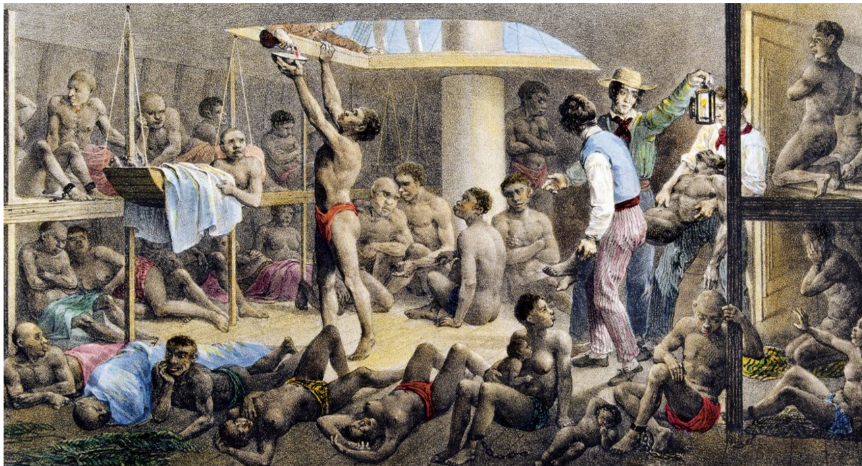
El océano Atlántico y el mar Caribe no fueron únicamente rutas comerciales. Fueron también cementerios sin tumbas.

Perlas, esclavitud y resistencia en el Caribe guajiro