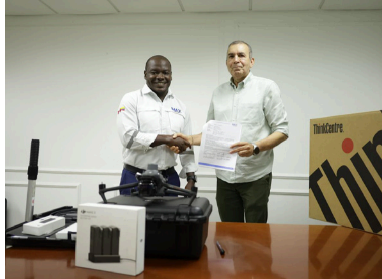
Estas acciones hacen parte del acuerdo de entendimiento suscrito entre Corpoguajira y Max Resource Colombia.

Estas acciones hacen parte del acuerdo de entendimiento suscrito entre Corpoguajira y Max Resource Colombia SAS para fortalecer la gestión ambiental, la protección de ecosistemas estratégicos y el desarrollo sostenible en áreas protegidas del departamento de La Guajira.