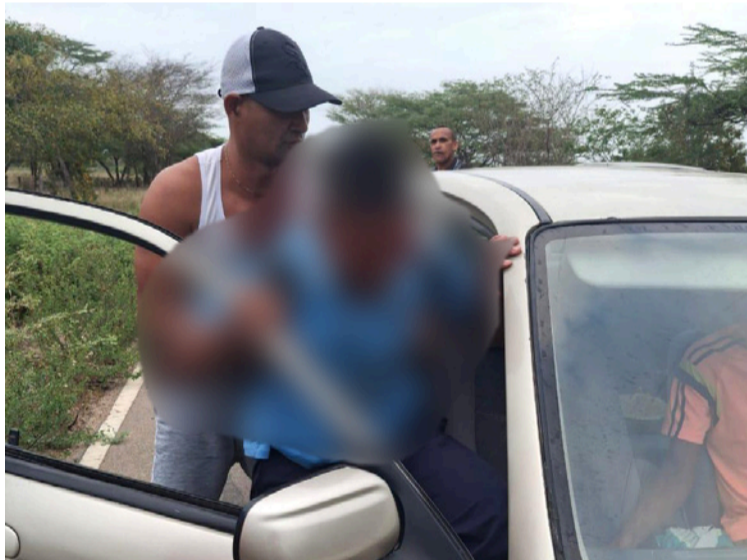
Este sería el tercer caso de estudiantes accidentados en la zona rural de Riohacha.

Este hecho ha causado indignación por la falta de compromiso por parte de la Administración Distrital de Riohacha para resolver el problema del transporte escolar que desde el inicio del calendario esco-