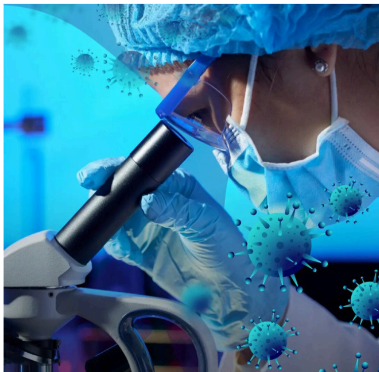
Uniguajira se consolida como un referente en formación científica aplicada en el Caribe colombiano.

DESTACADO La convocatoria está abierta a la comunidad universitaria y externa, dirigida especialmente a estudiantes y profesionales de biología, microbiología, medicina y biotecnología.