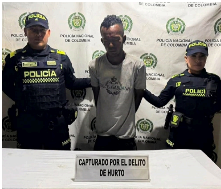
El sujeto fue trasladado y dejado a disposición de la autoridad competente para continuar con el proceso judicial.

En desarrollo de las actividades de patrullaje y control adelantadas por uniformados de la Policía Nacional, fue capturado en flagrancia un ciudadano señalado de participar en un hecho de hurto registrado en el barrio San Martín del municipio de Maicao.