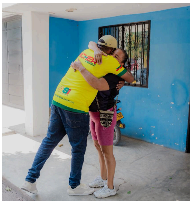
La tutela no es una llave maestra para abrir todas las puertas que el ordenamiento cierra por razones legítimas.

Y como dijo el filósofo de La Junta: "Se las dejo ahí...".