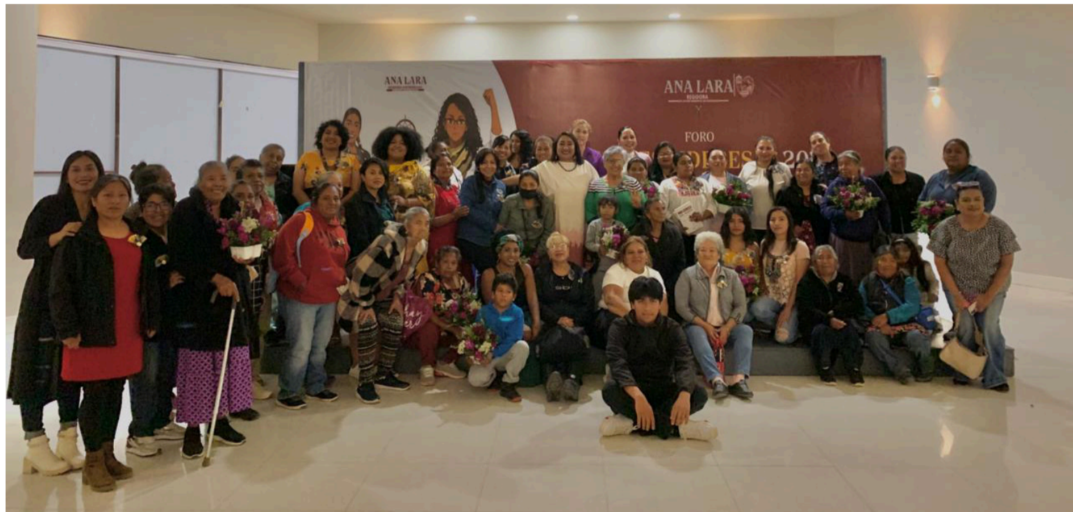
Todas juntas vamos a pensar un modo feminista de hacer política una política en clave femenina.

Y cierro con esta frase de Rita Segato quien recomienda refundar el feminismo para refundar la política: "Esa refundación la trae desde una nueva forma que retoma todo el pasado de todas nuestras luchas, pero en un nuevo momento y ese nuevo momento es un momento en el que todas las políticas patriarcales, todas las políticas de matriz masculina han fracasado. Estamos comenzando una nueva era de la política dónde a nosotras se nos entrega el camino de la política, donde la gran diversidad de los feminismos nos vamos a ver en la calle. El lado pluralista es nuestro lado, el lado monopólico es el lado de los antagonistas del proyecto histórico. Todas juntas vamos a pensar un modo feminista de hacer política una política en clave femenina. Y a eso le estoy llamando una refundación del movimiento feminista".