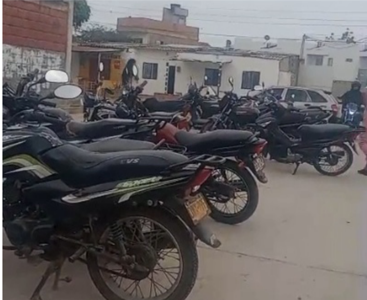
La ciudadanía está alarmada ante estos hechos delictivos y pide la colaboración de las autoridades.

En el lugar, al parecer, no hay cámaras de seguridad que pudieran captar el momen-