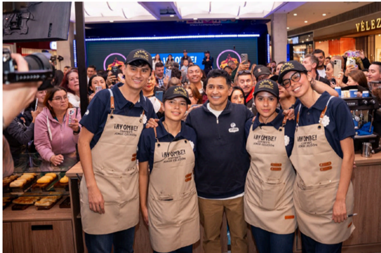
La inauguración desató una alta expectativa entre cientos de seguidores que formaron largas filas para el debut.

Cada una está bautizada en honor a los grandes éxitos de Celedón: La invitación, Esta vida, Cuatro rosas, Parranda en El Cafetal y Sin perdón.