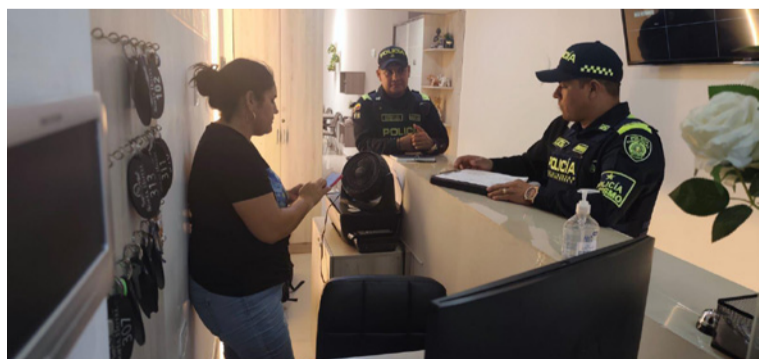
Los establecimientos inspeccionados cumplieron con los requerimientos legales exigidos.

La Policía Nacional adelantó una jornada de vigilancia y control a prestadores de servicios turísticos en el municipio de Hatonuevo,