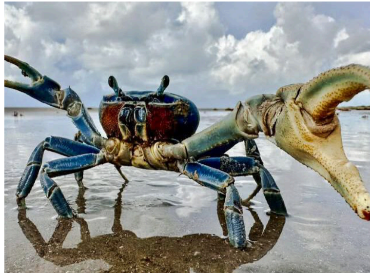
La Corporación reitera que decisiones informadas contribuyen a la preservación de especies y ecosistemas.

ple funciones ecológicas esenciales como la aireación del suelo y el reciclaje de nutrientes. Su disminución impacta directamente la salud de los ecosistemas costeros y la biodiversidad asociada.