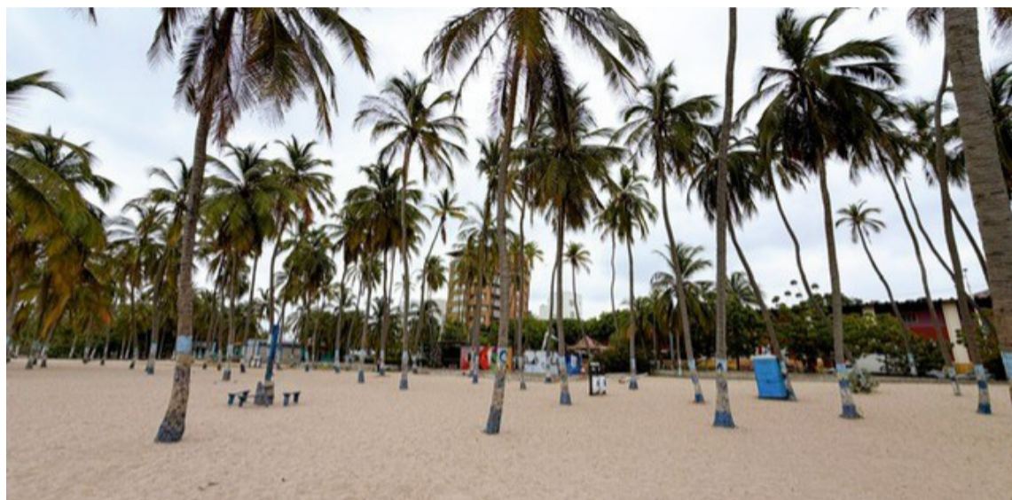
Más de 20 operarios cubrieron cerca de 2.5 kilómetros de playas en jornadas extendidas.

Durante la ejecución de este plan, más de 20 operarios fueron desplegados a lo largo del lito-