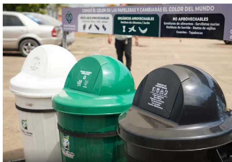
La Gobernación de La Guajira continúa consolidando una gestión ambiental enfocada en la educación.