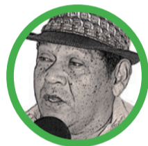
Por Rosendo Romero Ospino