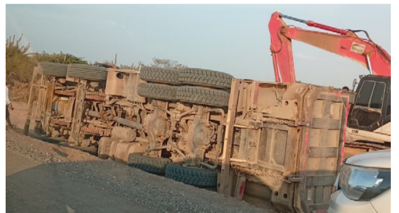
El camión iba con carga, cuando intentó pasar una curva al parecer perdió el control y se volcó.

gaciones que determine lo ocurrido y garantizarle seguridad a la víctima y su núcleo familiar.