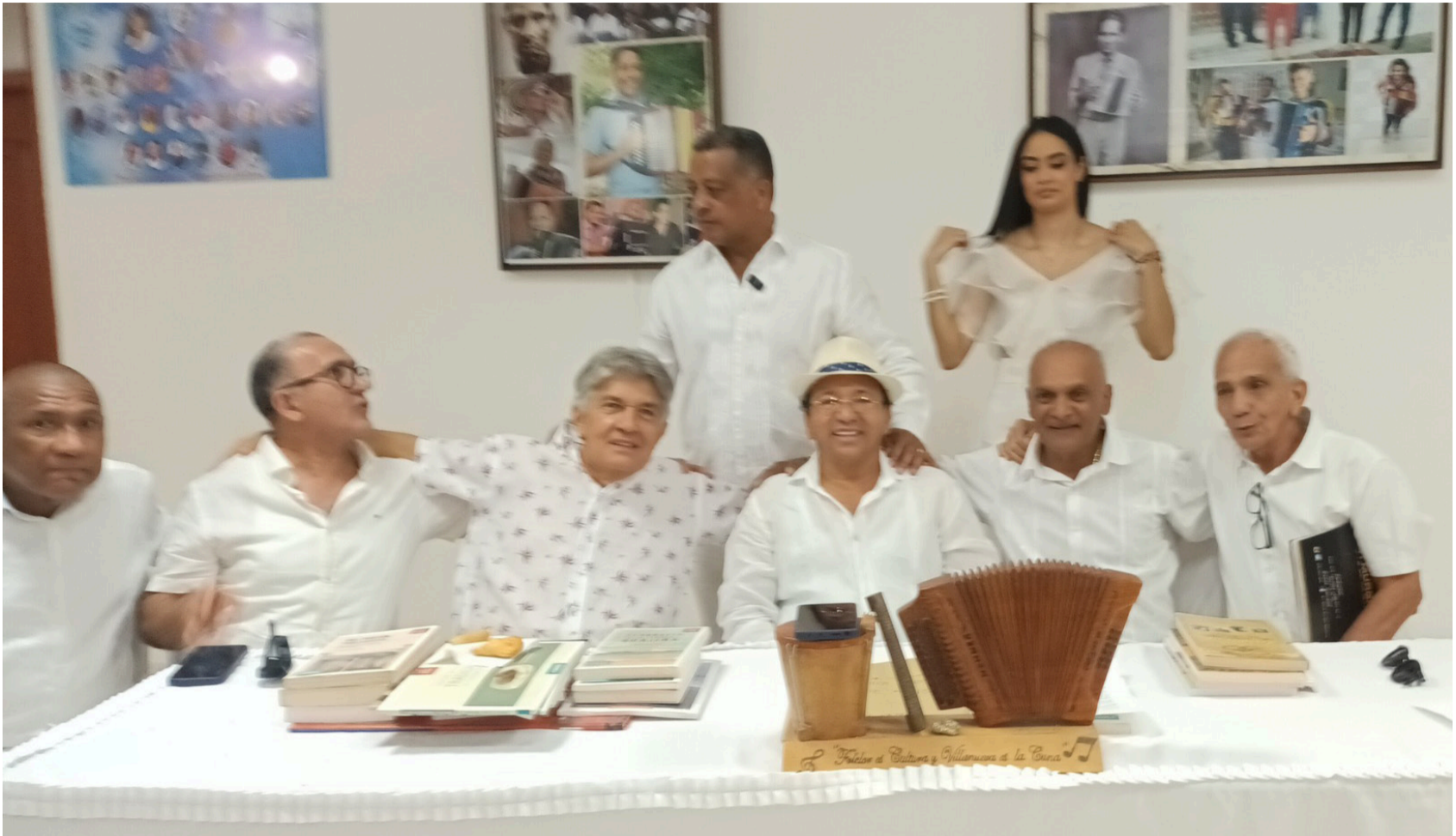
Connotados villanueveros hacen parte del Museo Villanueva Grande, un puente entre la memoria y el presente tecnológico.

Es un puente entre la memoria del pasado y el presente