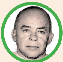
Por Eloy Farfán Bello

Fue una mujer incansable, luchadora, complacía con sus gestos, sus consejos, con su buena sonrisa,