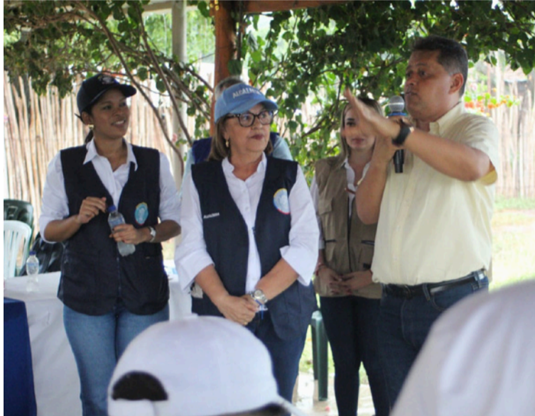
Con este proyecto, la Administración municipal reafirma su compromiso con el progreso de Villanueva.

En articulación con la Secretaría de Planeación y Obras, se llevó a cabo un encuentro con la comunidad para dar a conocer los alcances de estas obras, que contemplan la construcción de 2.17 kilómetros de pavimento en concreto rígido, incluyendo bordillos, con el objetivo de mejorar