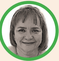
Por Demis Pacheco de Fernández