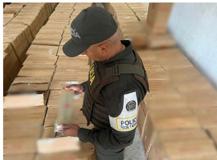
La Polfa hace un llamado a la ciudadanía a denunciar cualquier irregularidad o sospecha sobre la comercialización ilegal de mercancías.