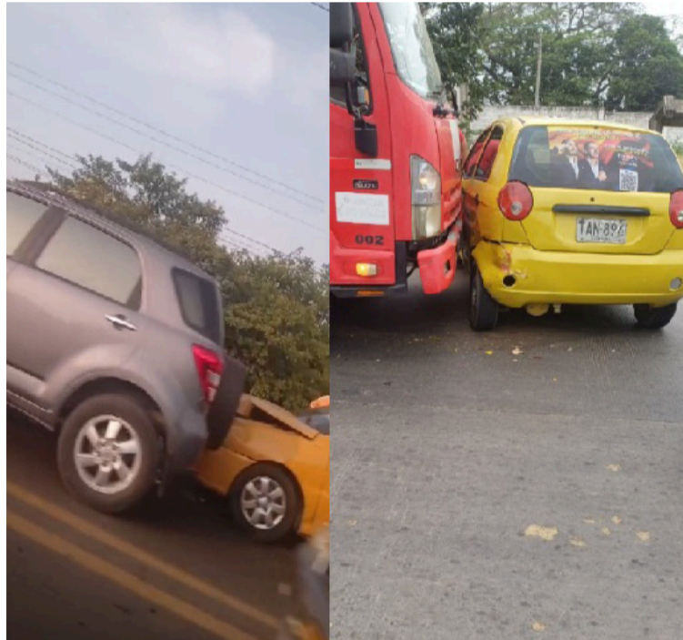
Autoridades hacen el llamado a los conductores a cumplir las normas de tránsito para evitar accidentes.

El primer accidente de tránsito se registró en la salida de Riohacha a Maiacao, cerca de la sede de la Universidad de La Guajira, donde se vieron involucrados un automóvil de pa-