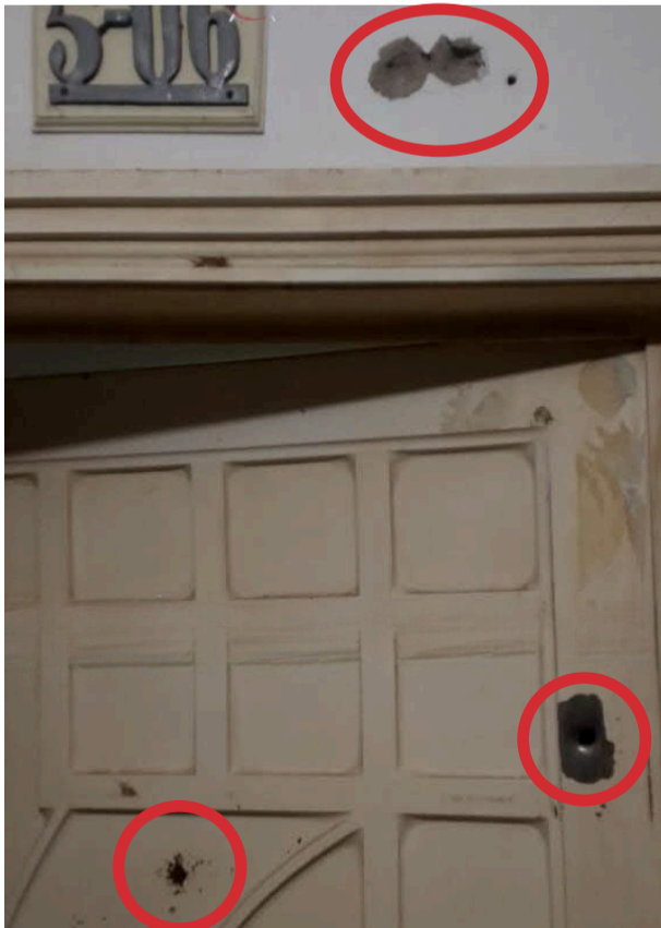
Uniformados de la Policía Nacional, Gaula y Sijín, llegaron al lugar para adelantar las investigaciones.

Hasta el lugar de la residencia de la líder co-