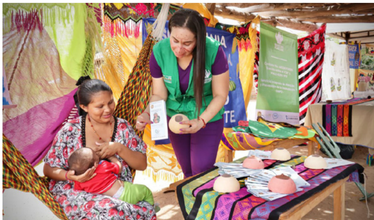
La entrega de mercados o suplementos nutricionales puede aliviar urgencias, pero no modifica las causas.

El documento resalta que la ausencia de un diálogo genuino con el pueblo wayuú y la comunidad afroguajira sigue siendo uno de los mayores obstáculos para transformar la crisis. La participación no puede reducirse a una formalidad institucional. Debe ser una presencia activa y legítima en la toma de decisiones sobre salud, agua, alimentación y territorio. En esa conclusión se concentra quizá la idea más humana y más profunda del informe, que la vida de los niños de La Guajira no puede seguir siendo leída solo desde la emergencia, sino desde la deuda histórica que el país mantiene con sus comunidades. Por Veeduría Ciudadana a la implementación de la Sentencia T-302 de 2017.