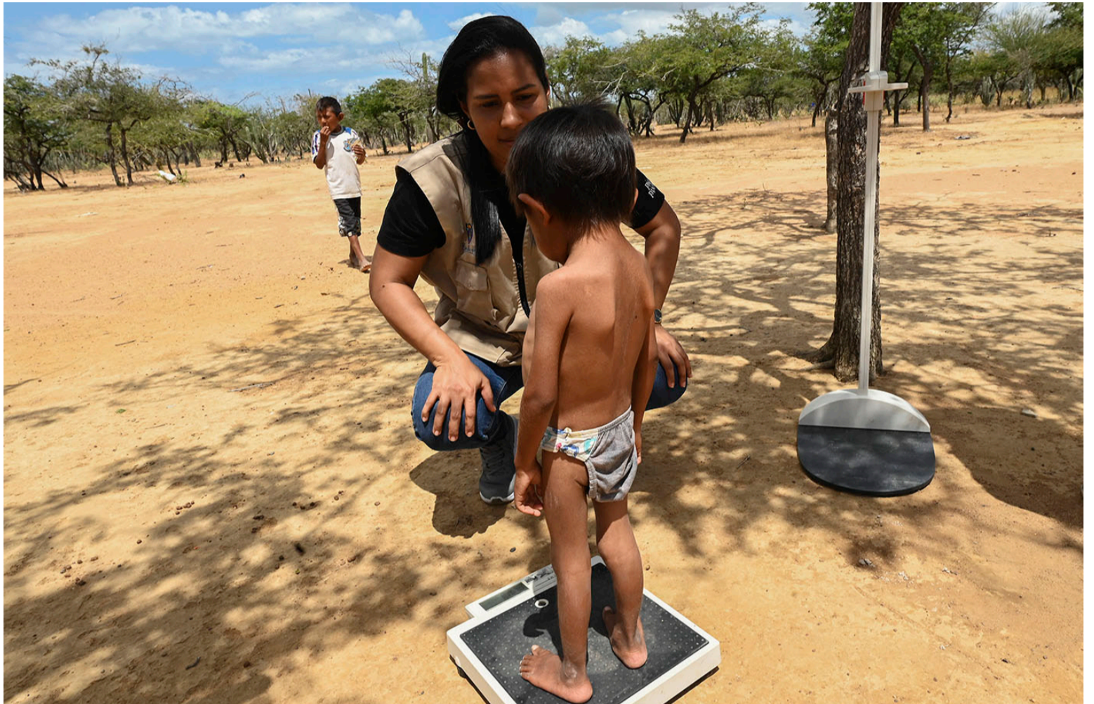
La pobreza que hoy se refleja en los cuerpos de la infancia tiene raíces profundas en modelos de desarrollo.

Desde esta mirada, el informe insiste en que las respuestas centradas únicamente en la asistencia inmediata resultan insuficientes. La entrega de mercados o suplementos nutricionales puede aliviar urgencias, pero no modifica las causas que sostienen la crisis. La comisión plantea la necesidad de respuestas integrales, coordinadas entre instituciones y construidas desde el diálogo real con las comunidades del