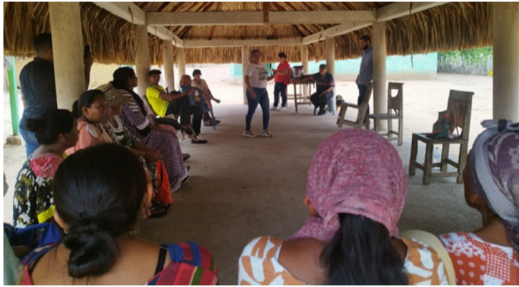
Se busca la restitución de este territorio colectivo, al igual que su formalización como resguardo indígena.

La comunidad de Mayales Quemao está conformada por 134 familias, que agrupan a 439 personas, quienes han habitado históricamente un territorio