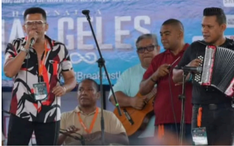
Según algunos jurados, se ha visto un nivel bastante bajo de las obras musicales que han escuchado.