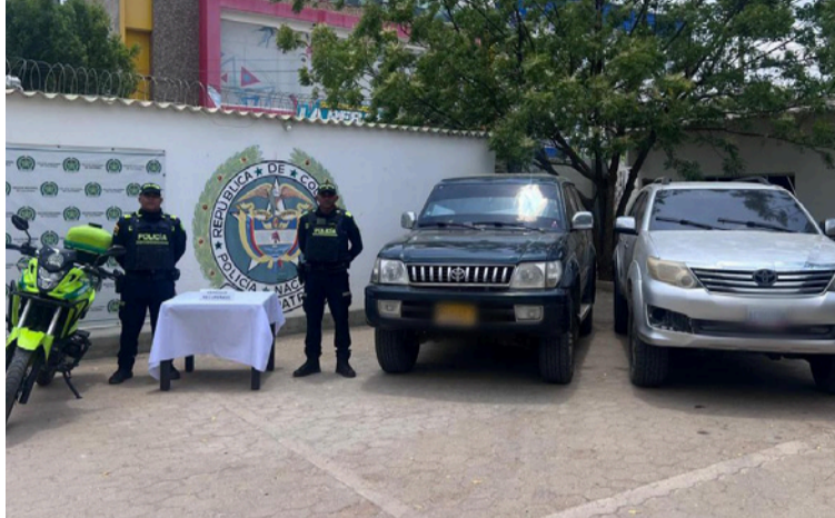
Ambas camionetas fueron llevadas hasta la estación de la Policía en Uribia, donde se iniciaron las investigaciones.

Según se pudo conocer, las camionetas habrían sido abandonadas tras la búsqueda por parte de las autoridades, que realizaron un plan candado en esta zona que va desde Bahía Portete hacia Punta Gallinas, en la Alta Guajira,