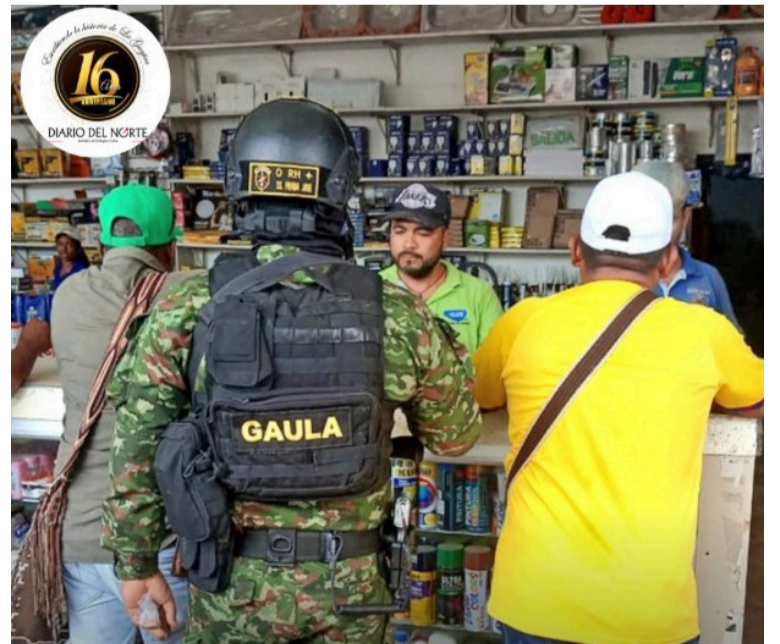
Las acciones hacen parte de su compromiso por fortalecer la seguridad ciudadana.

La institución reiteró que estas acciones hacen parte de su compromiso por fortalecer la seguridad ciudadana y prevenir conductas delictivas que afectan la tranquilidad de la población civil.