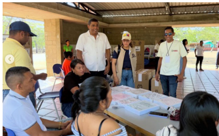
La prioridad institucional es que la ciudadanía de Fonseca acuda a las urnas con la total confianza.

Al tiempo invitan a los 32.543 ciudadanos que conforman el potencial electoral de Fonseca a ejercer su derecho de manera libre y consciente.