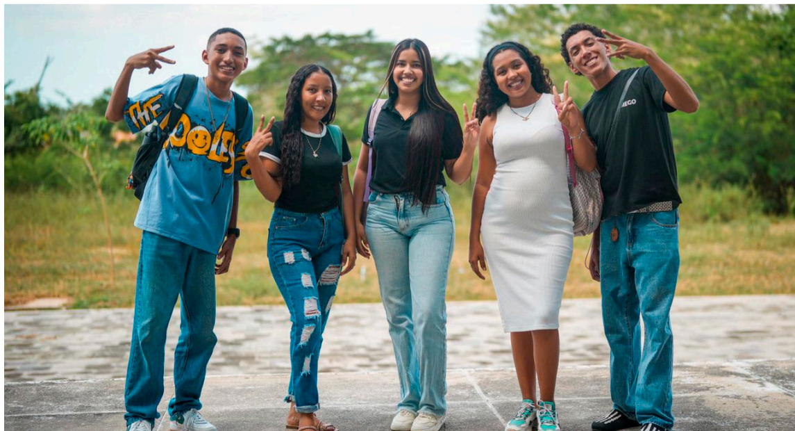
La universidad pública está llegando a territorios donde antes era impensable.

Según se indicó, la gratuidad es solo el punto de partida, en la medida en que la universidad pública está llegando a territorios donde antes era impensable, garantizando el derecho a la educación superior para quienes más lo necesitan.