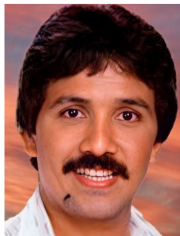
Rafael Orozco Maestre, cantante vallenato.

Definitivamente, Rafael Orozco tuvo la virtud de hacer soñar a sus seguidores con los ojos abiertos, amar con el corazón paseándose por todos los sentimientos, construir esperanzas que dictaba su voz y andar por las aventuras de la vida. Él dejó una huella imborrable.