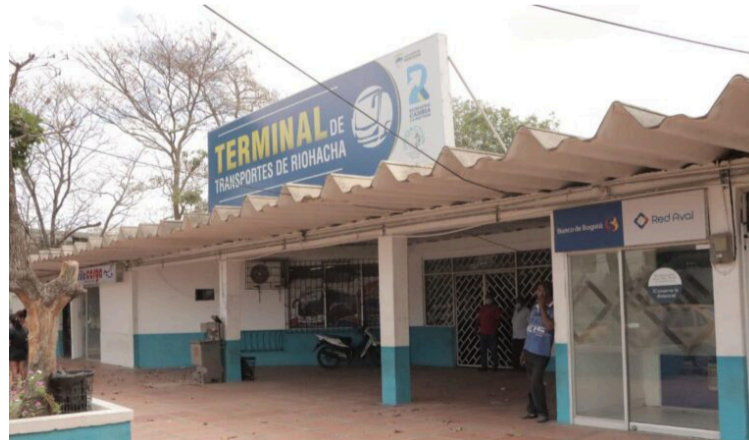
Según la juez, la priorización realizada en el Plan de Desarrollo carece de precisión y se torna genérica y abstracta.

En algunos de los argumentos de la Juez Lilia Romero Hurtado, para tomar la decisión precisa, que esa agencia judicial concuerda con el agente del ministerio público cuando afirma que, si bien el ente territorial ha insistido en que en el plan de desarrollo 2020-2023 se estableció en el componente estratégico No. 5 el proyecto priorizado terminal de transportes Interregional, lo cierto es que, ello no guarda al menos, total relación con la autorización expedida mediante el acto demandado, pues en esta, el objeto principal es