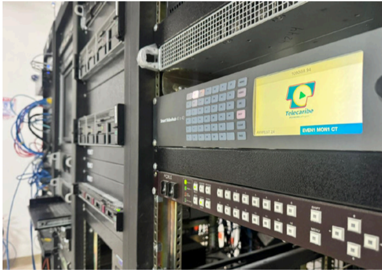
Las mejoras son fundamentales para optimizar la calidad, estabilidad y continuidad de la emisión.

Estas mejoras son fundamentales para optimi-