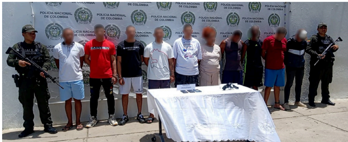
Los afectados por estas estructuras son comerciantes, ganaderos, hoteleros, etc.

La Policía Nacional capturó a 13 presuntos integrantes de las Autodefensas Conquistadores de la Sierra Nevada, también conocidas como 'Los Pachenca', en operativos realizados en Riohacha y el municipio de Dibulla, en cumplimiento de órdenes judiciales por los