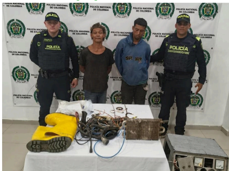
Los capturados quedaron a disposición de la autoridad competente por el delito de hurto.

Gracias a la oportuna reacción de las patrullas de vigilancia y a la articulación con la central de radio, la