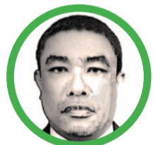
Por Osvilder Pérez Ustate