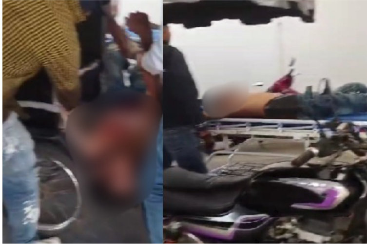
Según testigos, se habría originado una discusión con una mujer que luego lo agredió con arma blanca.

Los hechos se registraron en un sector de la urbanización Villa Ana II del municipio de Distracción al sur de La Guajira, cuando según las versiones de testigos, se habría originado una discusión