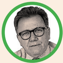
Por Indalecio Dangond