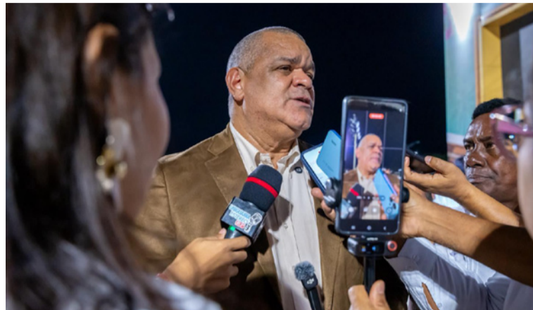
El rector destacó la ampliación de la oferta académica con nuevos programas de pregrado y posgrado.

la oferta en las sedes de Maicao, Fonseca, Villanueva, como también poder llegar a otros municipios donde es difícil que llegue la educación superior en el marco de un proyecto que tiene el Gobierno nacional para la ampliación de cobertura con financiación.