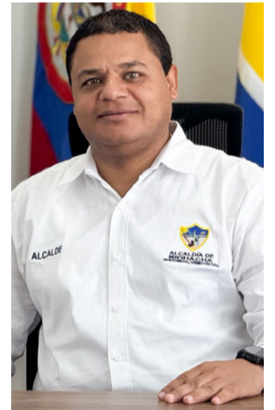
Genaro Redondo, alcalde de Riohacha.

La Alcaldía de Riohacha reitera el llamado a la ciudadanía a informarse únicamente a través de los canales oficiales y a evitar la difusión de información no verificada.