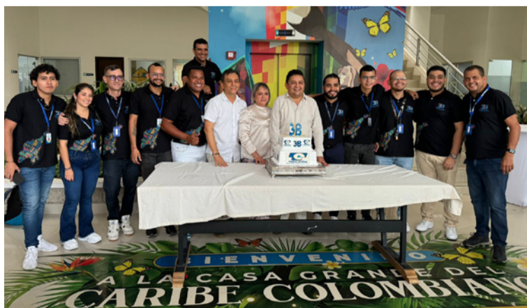
La entidad señaló que el objetivo de estas negociaciones es reconocer las aspiraciones de los trabajadores.

Las directivas del canal regional Telecaribe dieron a conocer que actualmente se viene desarrollando un proceso de negociación laboral con el sindicato de trabajadores Sintratelecaribe S.I., en el marco de lo establecido por la Constitución Política y la legislación vigente.