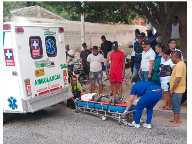
En el accidente se vieron involucradas dos motocicletas; una le habría llegado por la parte trasera a la otra.

VISITANOS diariodelnorte.net @diariodelnorteguajira @diario.delnorte @DiarioDelNorte