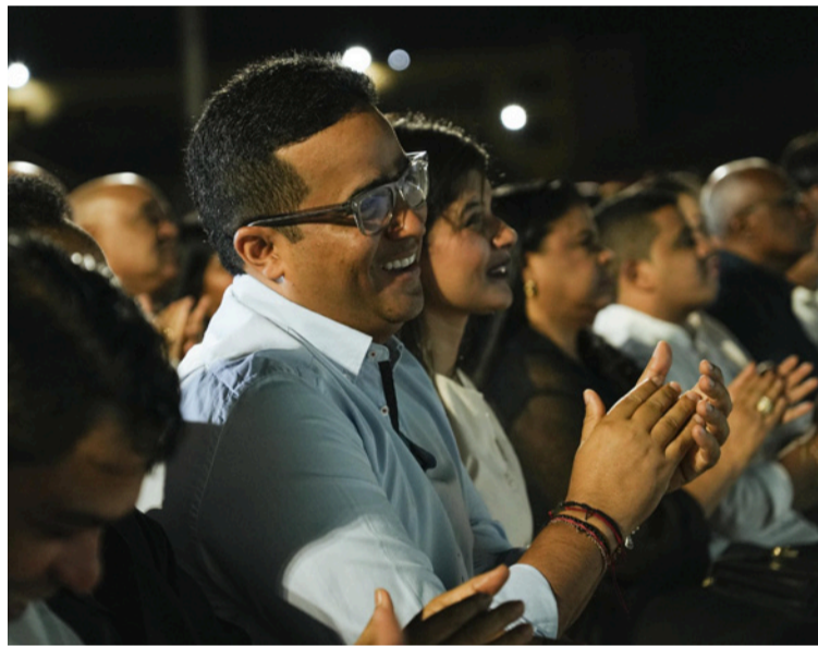
Aguilar explicó que la donación anunciada era del Gobierno de Emiratos por lo que no se logró avanzar.

"Yo soy un comprometido con esta universidad, con su estamento, con sus profesores, con las personas que día a día trabajan para sacar este departamento adelante que principalmente está en el sentido de este estamento que es lo más importante para nosotros",