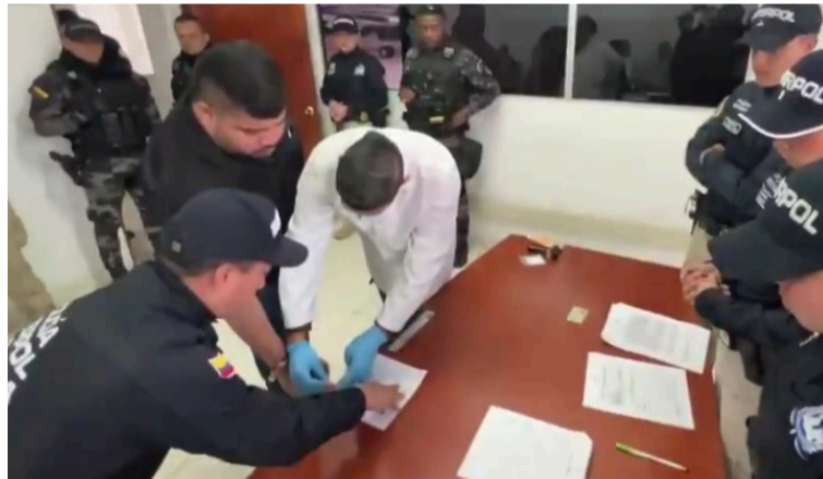
Los seis solicitados por narcotráfico y concierto para delinquir fueron trasladados en vuelo privado a EE. UU.

Según lo refrendado en las investigaciones por parte de las autoridades, se relaciona con el envío de droga entre los años 2021 y 2022 inicialmente hacia República Dominicana; además, sí estaría vinculado a alguna organización criminal que operaba en esta región