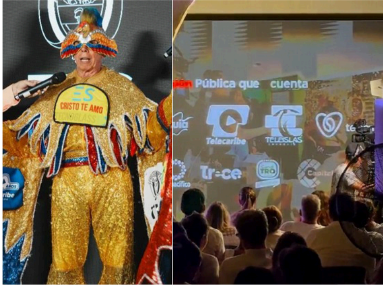
Telecaribe presentó, ante la industria de la televisión pública, dos de sus próximos lanzamientos.

En este espacio, Telecaribe presentó, ante un público de la industria de la televisión pública, dos de sus próximos lanzamientos.