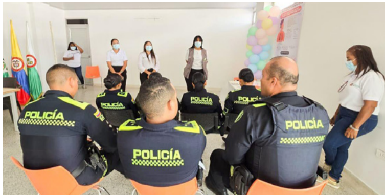
La jornada incluyó atención en salud para las personas privadas de la libertad, grupo de alta vulnerabilidad.

La estrategia se concentró en dos frentes priorizados por su nivel de exposición: la Estación de Policía y la E.S.E. Hospital Nuestra Señora del Pilar. En ambos espacios, equipos técnicos desarrollaron actividades de promoción de la salud, tamizaje y diagnóstico oportuno, dirigidas tanto al personal asistencial como a la población que concurre a estas instituciones.