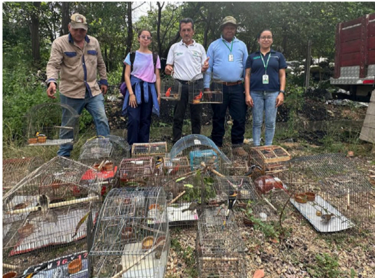
Este logro es resultado de un trabajo articulado entre Corpoguajira, los EPA de Barranquilla y Cartagena, y la Policía.

Este logro es resultado de un trabajo articulado entre Corpoguajira, los EPA de Barranquilla y Cartagena, y la Policía Nacional, que permitió rescatar estas especies del tráfico ilegal y garantizar su re-