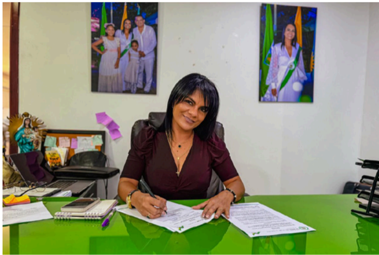
Dijo la alcaldesa que con este logro, la Administración fortaleció el reconocimiento de la memoria histórica local.