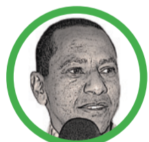
Por Jorge Nain Ruiz Ditta