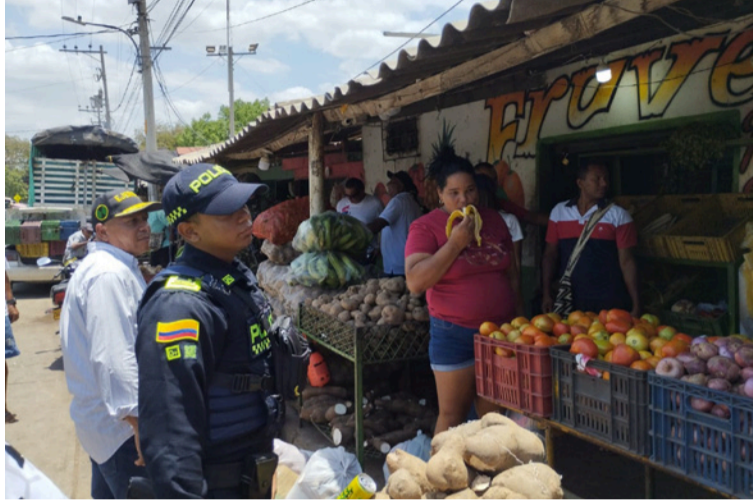
Miembros de la Policía y Ejército se apostaron en los puntos estratégicos para brindar seguridad a los comerciantes.