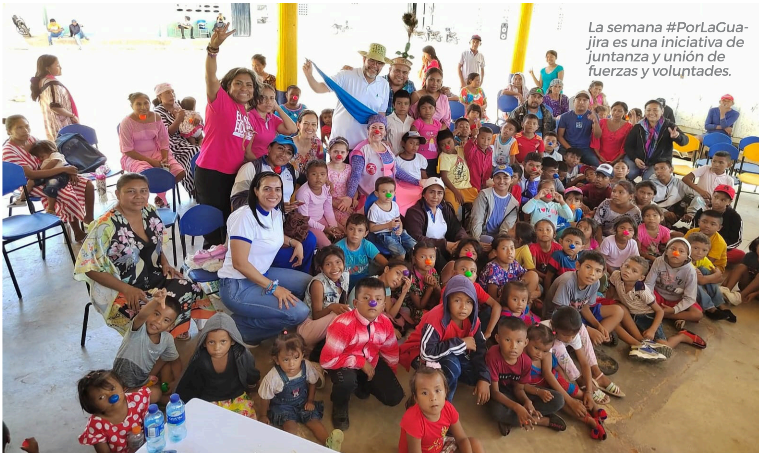
La semana #PorLaGuajira es una iniciativa de juntanza y unión de fuerzas y voluntades.