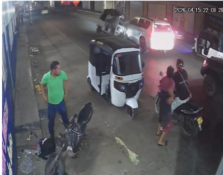
El conductor del motocarro, habría sido el responsable del accidente, ya que invadió el carril contrario.

Según las primeras versiones el conductor del motocarro, habría sido el