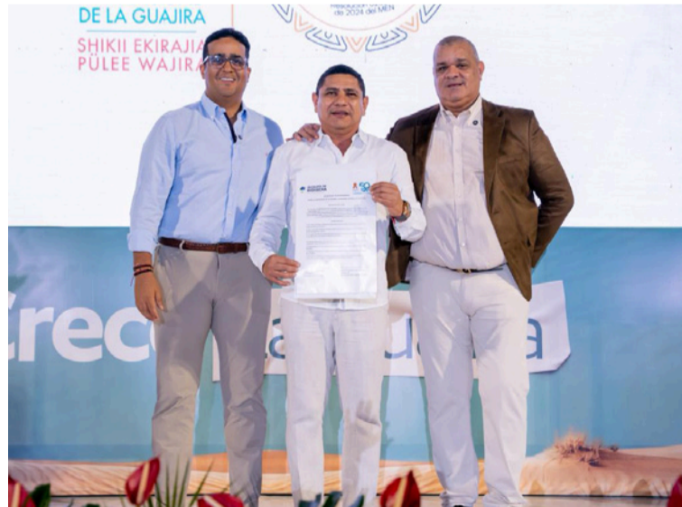
Al presentar el documento, el alcalde delegado, destacó las relaciones fortalecidas entre ambas instituciones.

"Aquí tengo un documento que hemos trabajado muy juiciosamente entre los equipos de la Administración Distrital de Riohacha y la Universidad de La Guajira. Futo de esos encuentros técnicos, tenemos por fin construido y aprobado el documento para que tengamos el principal instrumento dinamizador y constructor