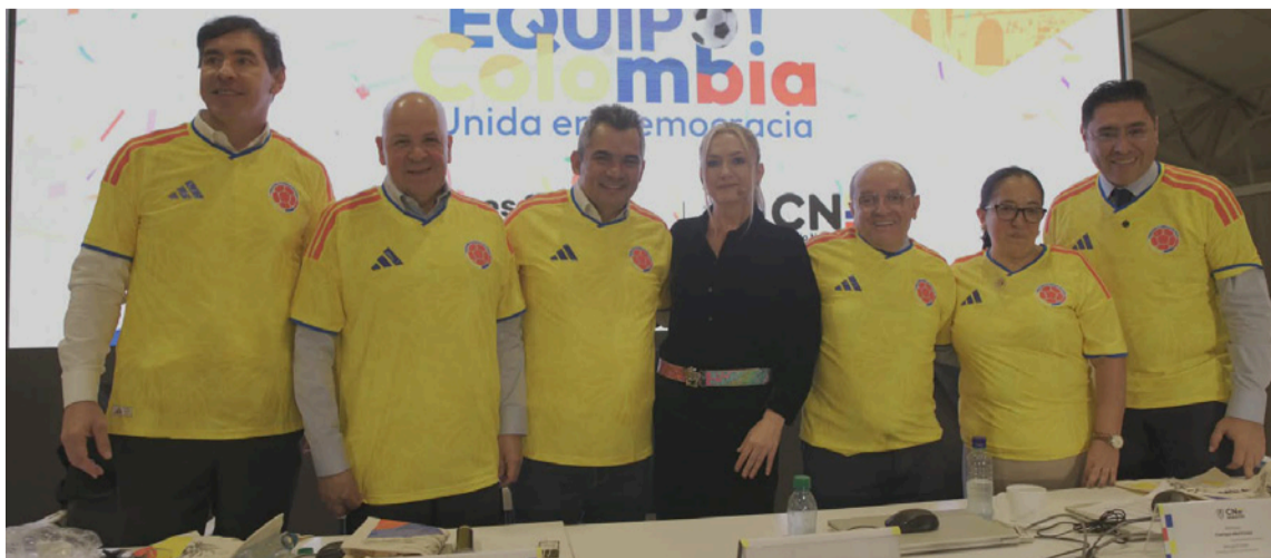
Fue presentada la Plataforma de Postulación y Acreditación de Actores Electorales.

Como cierre de la jornada, el CNE invitó a campañas presidenciales, Ministerio Público, organizaciones de observación y medios de comunicación al gran simulacro de la Plataforma Única, que se realizará el lunes 20 de abril a las 9:00 a.m. en la sede operativa del CNE. En ese ejercicio se demostrarán públicamente las funcionalidades de la plataforma: parametrización de la elección, cargue de archivos con datos simulados, postulación de testigos y generación de credenciales digitales.