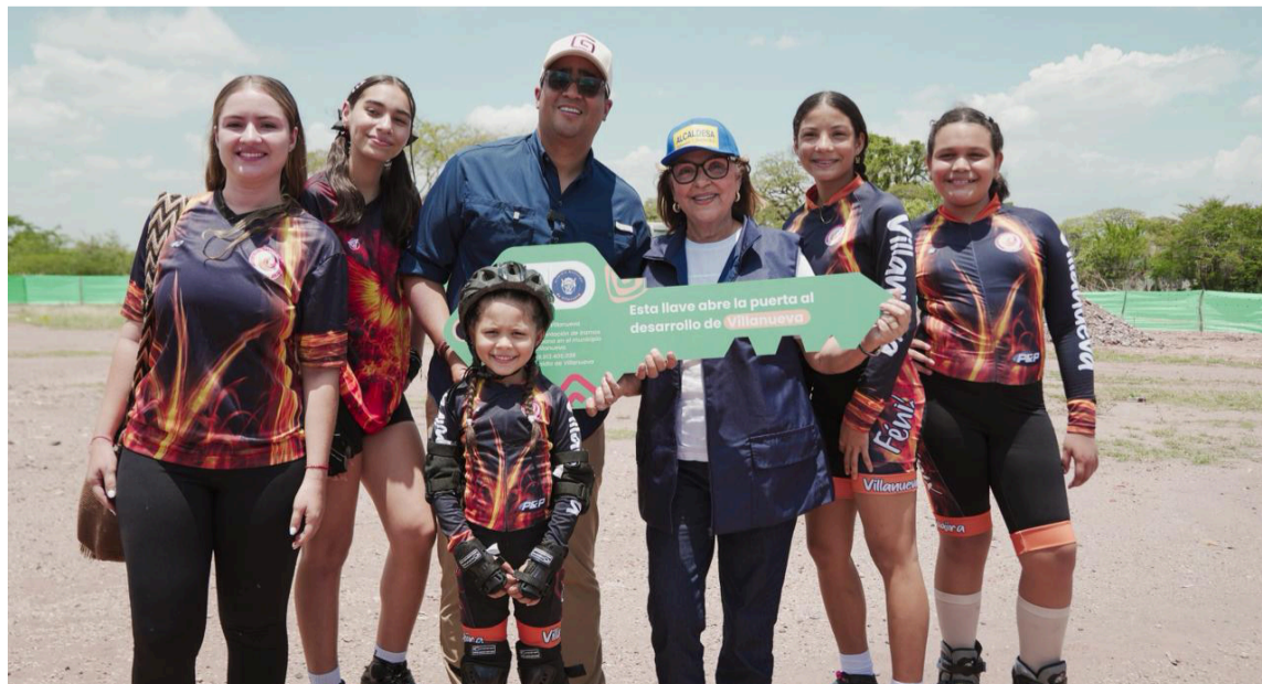
El gobernador Aguilar junto a alcaldesa Cielomar Peñaloza con la llave del desarrollo.

"Hoy estamos cumpliendo la palabra, llevando soluciones reales a los barrios, mejorando la movilidad y resolviendo problemas como las inundaciones que afectan a tantas familias. Así es como transformamos los territorios, con inversiones que se sienten en la vida diaria de la gente", señaló