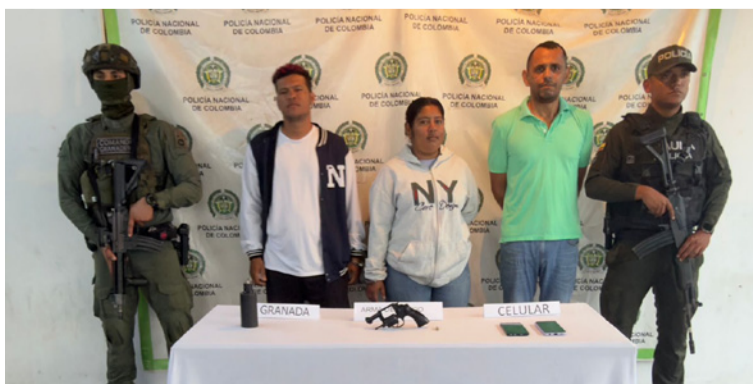
Capturados y elementos materiales probatorios fueron dejados a disposición de la Fiscalía 15 Local EDA.