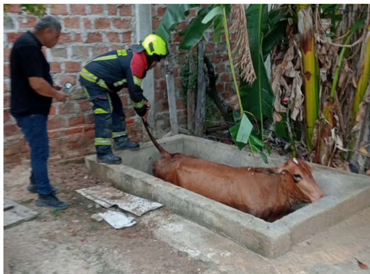
Los animales causaron daños en el interior de la vivienda, específicamente en dos ventanas grandes.