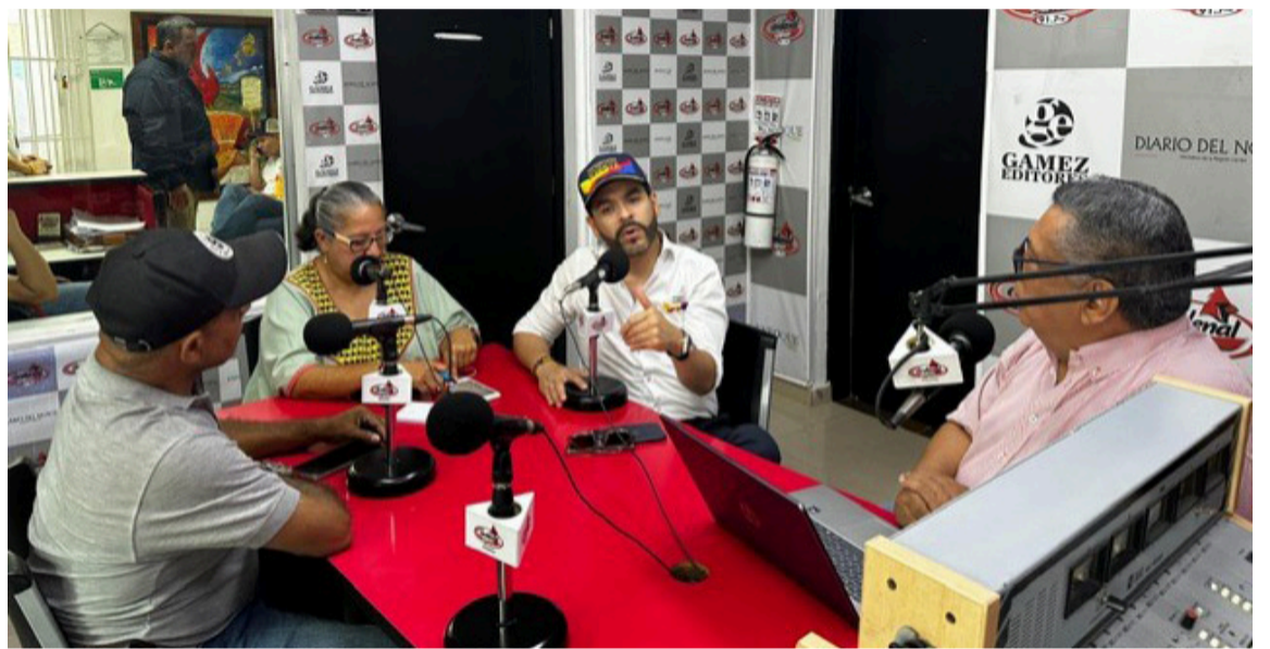
Dice que existe un tema de centralismo que ha dejado a las regiones abandonadas.

"Esto hay que rescatarlo pero no haga nada sino tengo seguridad, hay que darle seguridad a este departamento y a Colombia",