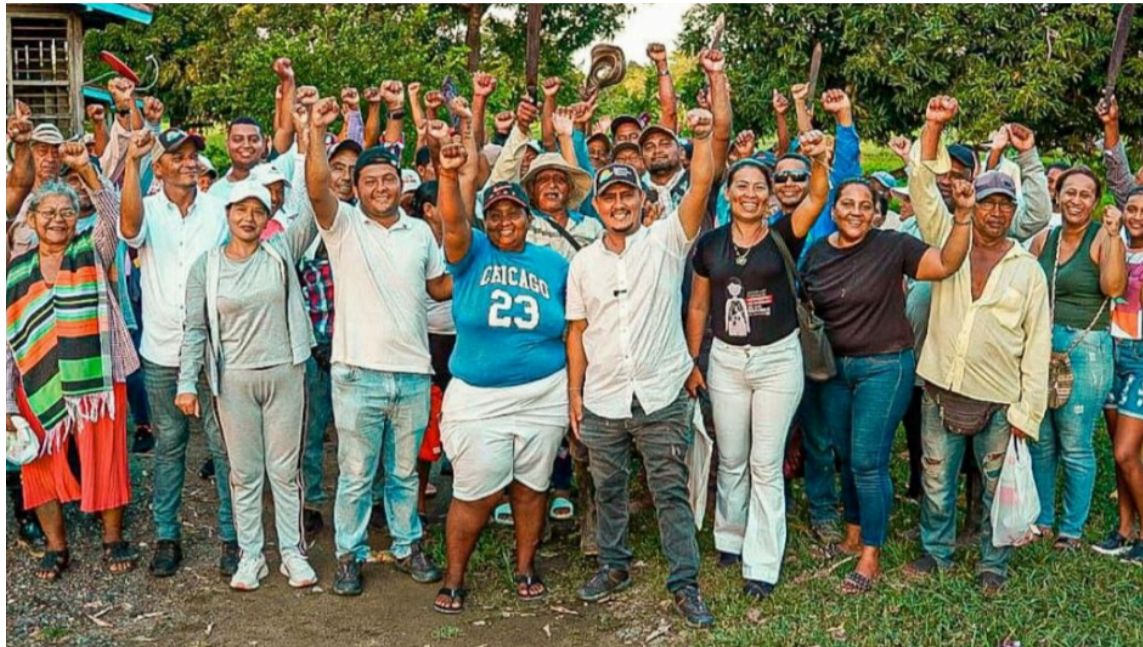
El Gobierno nacional ha entregado a La Guajira cerca de 6.196 hectáreas de tierra.

La entidad, como máxima autoridad de tierras de la nación, se ha encargado de poner las bondades de la Reforma Agraria a su servicio para que sean re-