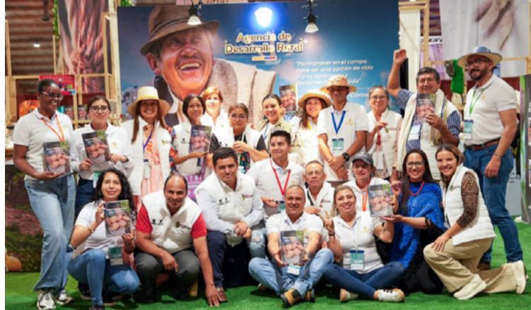
Con esta iniciativa, la ADR reafirma su compromiso con la visibilización del trabajo de miles de familias rurales.

La apuesta reúne asociaciones campesinas, indígenas y organizaciones productivas que reflejan la diversidad del campo colombiano: mujeres artesanas que preservan técnicas tradicionales,