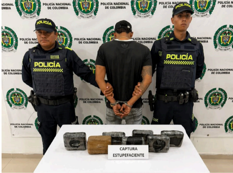
En el procedimiento también fueron incautados la moto en la que se movilizaba y un equipo celular.

El procedimiento se desarrolló durante labores de vigilancia y control, cuando los policías observaron a un ciudadano que, al notar la presencia institucional, mostró una actitud nerviosa, descendiendo abruptamente de una motocicleta e intentan-