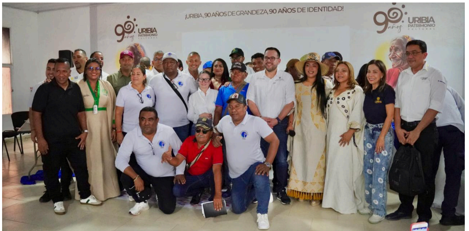
Los actores clave conocieron los alcances del proyecto, su cronograma y los compromisos establecidos.

De manera paralela, la administración departamental impulsó alternativas técnicas, como la subestación móvil, y acompañó la construcción de acuerdos con las comunidades, lo que permitió avanzar hacia la entrega del lote en el territorio, un paso fundamental para la