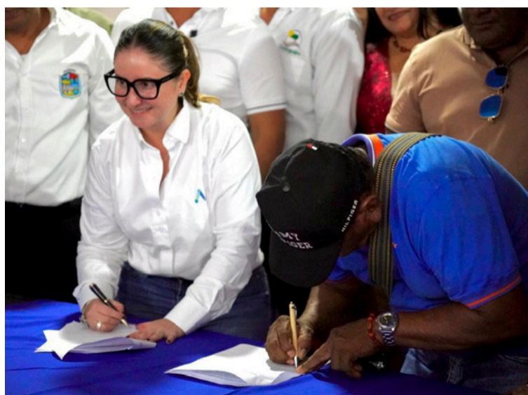
Se destacó la firma del documento que permitirá avanzar en la instalación de la subestación móvil.