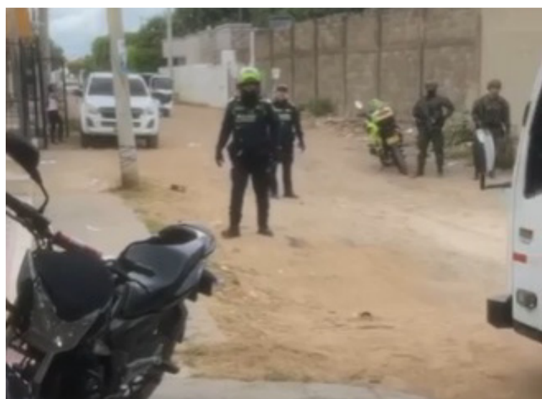
Se desconocen detalles del resultado del allanamiento y si hubo alguna persona capturada.

Uniformados de la Policía y el Ejército Nacional realizaron un allanamiento en una vivienda ubicada en el barrio Mareigua del municipio fronterizo de Maicao, donde encontraron gran cantidad de cigarrillos de contrabando ocultos, informaron algunos vecinos del sector.