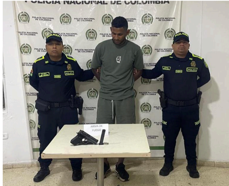
Le fueron leídos sus derechos como persona detenida y posteriormente fue dejado a disposición de la Fiscalía.

Las autoridades reiteran el llamado a la comunidad a denunciar cualquier hecho que ponga en riesgo la seguridad, destacando que la oportuna información ciudadana fue clave para este resultado operativo.