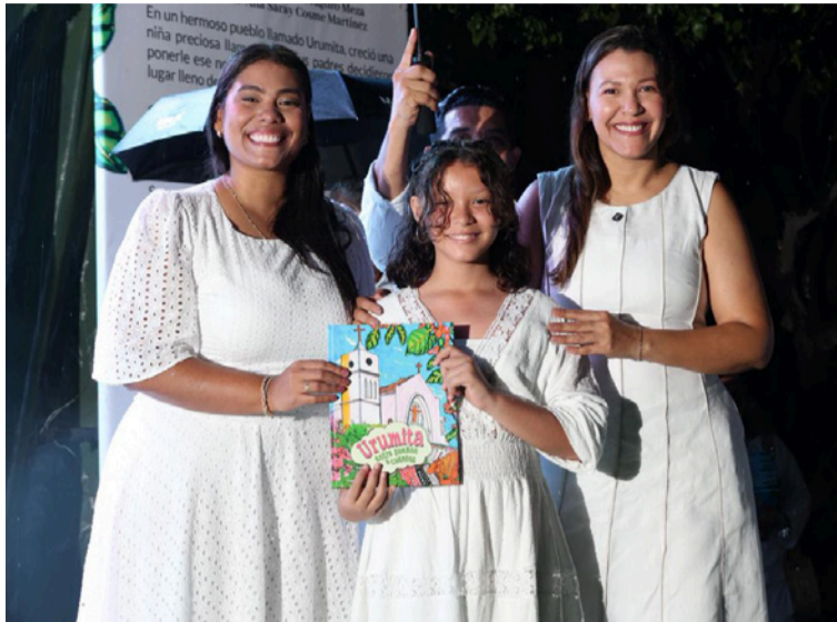
La alcaldesa destacó que esta iniciativa refleja el compromiso de la Administración con la formación de la niñez.

Más allá de su valor literario, 'Urumita entre sueños y cuentos' representa una apuesta institucional por fortalecer las habilida-