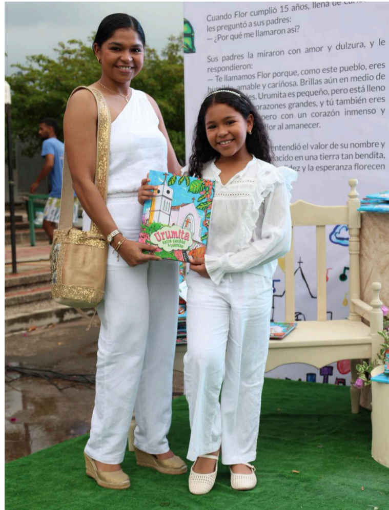
El proyecto reafirma la visión de consolidar a Urumita como un destino de oportunidades.

La obra estará disponible para toda la comunidad en las bibliotecas de