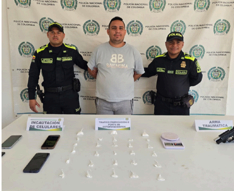
El capturado contaba con medida de aseguramiento domiciliaria y brazaletes electrónicos.

El procedimiento se desarrolló mediante una diligencia de registro y allanamiento en área urbana,