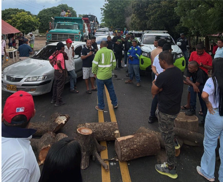
La comunidad indígena de Arenas decidió bloquear la vía, señalando que no hay garantías de seguridad vial.

Según las versiones, el conductor del furgón, luego de presuntamente arrollar a los dos menores de edad, intentó huir del lugar, pero debido a la persecución y la acción de la comunidad, decidió entregarse a las autoridades policiales en el municipio de Albania, donde se en-