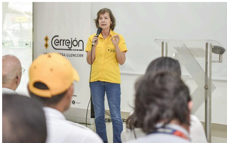
El próximo 7 de agosto inicia un nuevo Gobierno, y La Guajira debe asumir su relación con esta nueva etapa.

A esto se suma una evolución importante en su relación con el entorno. En los últimos años se han destinado más de 440 mil millones de pesos a proyectos sociales y más de 2,1 billones a iniciativas