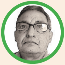
Por José Aragón Jiménez