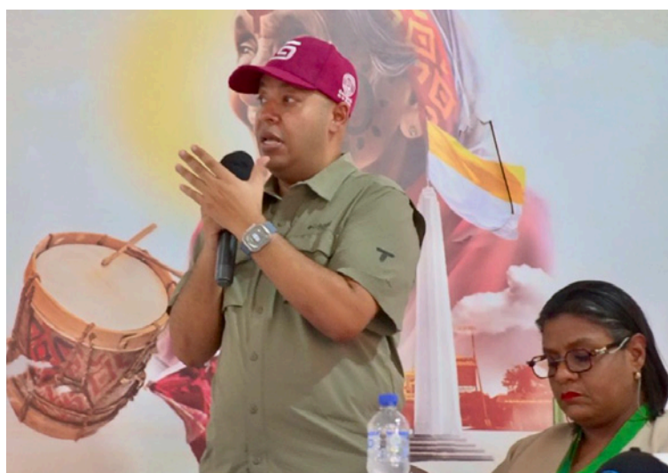
La instalación de la subestación móvil representa un paso clave para mejorar la estabilidad del servicio eléctrico.