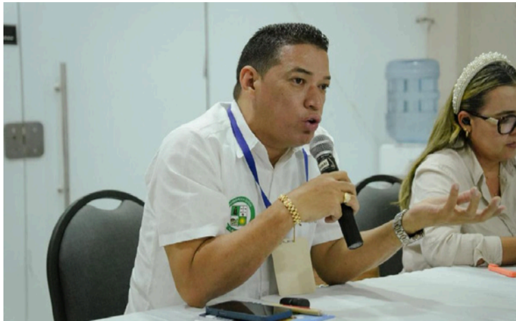
Con este ejercicio, La Guajira se posiciona como un territorio estratégico en la transición energética.

El evento reunió además a entidades como Cámara de Comercio, Andi, Sintracarbón, centrales obreras como CUT Colombia, organizaciones sindicales como Sintramicol y Sindispetrol, así como representantes de comunidades indígenas, afrodescendientes, mujeres, jóvenes, academia, el Sena, Corpoguajira y alcaldías municipales, consolidando un ejercicio participativo con enfoque