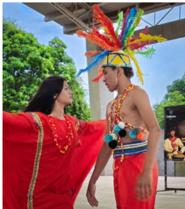
El arte como herramienta de transformación social.

"El tambor es uno de los instrumentos de percusión más antiguos, con evidencias de su existencia desde el año 6000 A. C., es un pilar de la cultura afrodescendiente e indígena, actuando como símbolo de resistencia y comunicación. En América Latina, instrumentos como la tambora, el cumaco y la tambora criolla son fundamentales en la música folclórica". En el corazón del sur de La Guajira, donde la tradición y la memoria laten al ritmo de los tambores, se desarrolló el proyecto 'Al Ritmo del tambor: danza de paz y memoria', una iniciativa cultural que reunió a niños, niñas, jóvenes y comunidad en general en torno al arte como herramienta de transformación social. Un proyecto ejecutado por la Fundación Unión y Cooperación por Colombia, en articulación con la