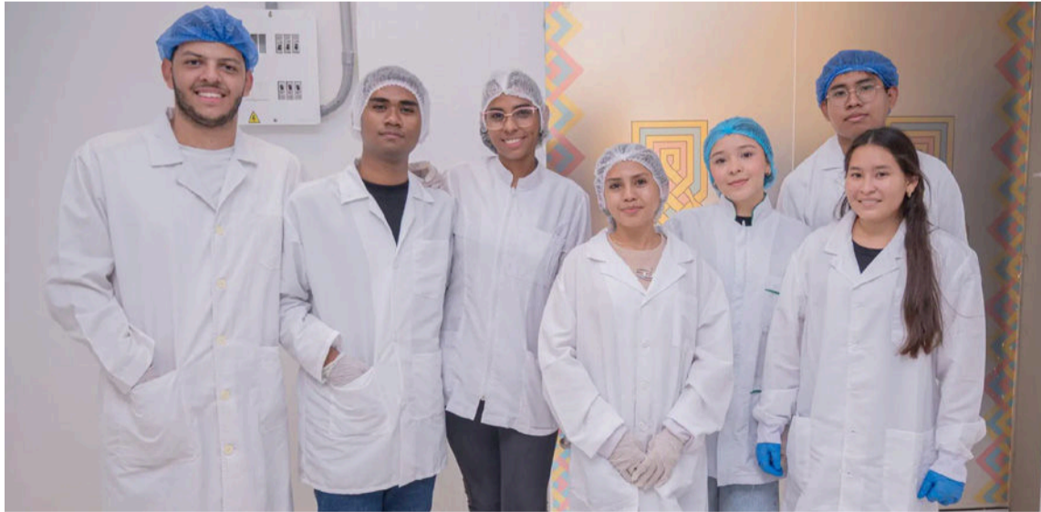
La política de admisión responde a un enfoque de inclusión, equidad y reconocimiento.

Esta política de admisión responde a un enfoque de inclusión, equidad y reconocimiento de las realidades socioculturales del contexto. Del total de estudiantes, el 52 % pertenece a la comunidad indígena wayú y un 6 % a población afrodescendiente, lo que garantiza una representación diversa de la región. La cohorte está conformada por jóvenes provenientes de distintos municipios: el 52 % proviene de la Alta Guajira (Uribia, Manaure y Maicao), el 22 % de la Media