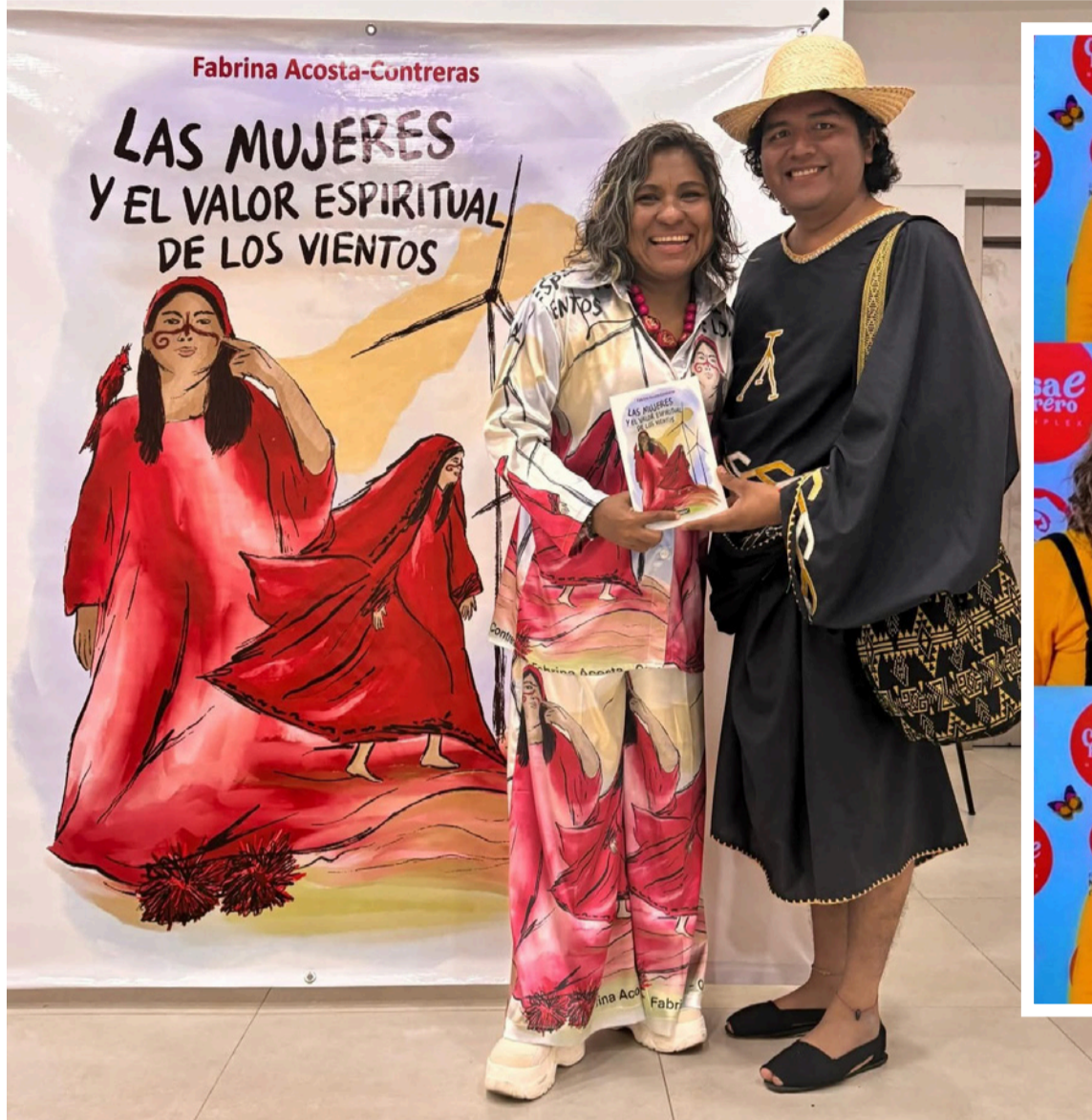
'Las mujeres y el valor espiritual de los vientos', mi más reciente obra publicada por Icono.

En este sentido, me encanta llegar con un poder colectivo en un panel de voces latinoamericanas indígenas que se juntan para seguir estableciendo precedentes a favor del cuerpo-territorio, del origen, del cuidado del planeta, de la cosmovisión y cosmogonía de sus pueblos, para sumar a una humanidad realmente pluralista, antirracista, libre y creadora.