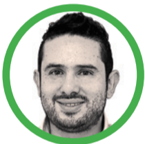
Por Luis Guillermo Baquero