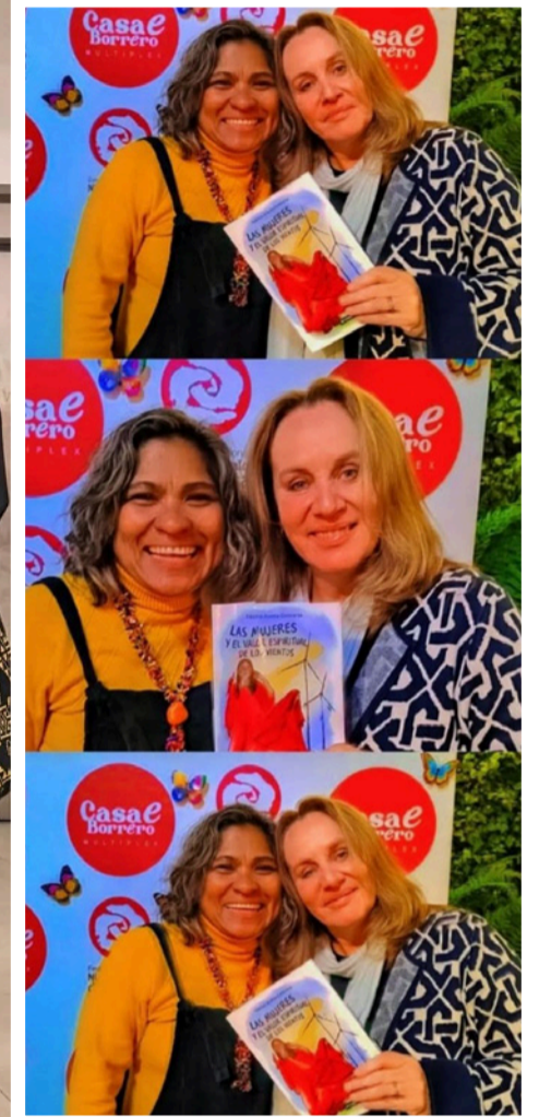
Ojalá ninguna mujer escritora usara seudónimos.