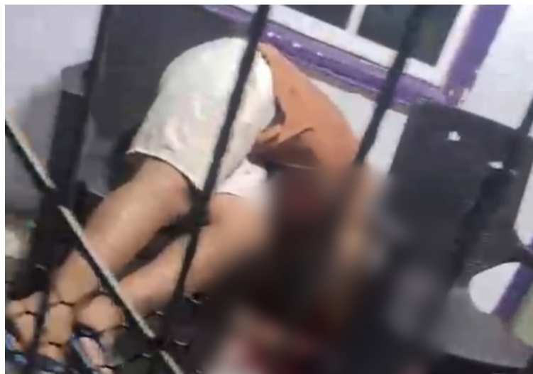
Una persona de sexo masculino fue asesinada de varios impactos de bala en medio de un atentado sicarial.

Los miembros del Cuerpo Técnico de Investigación (CTI) de la Fiscalía llegaron hasta el lugar de