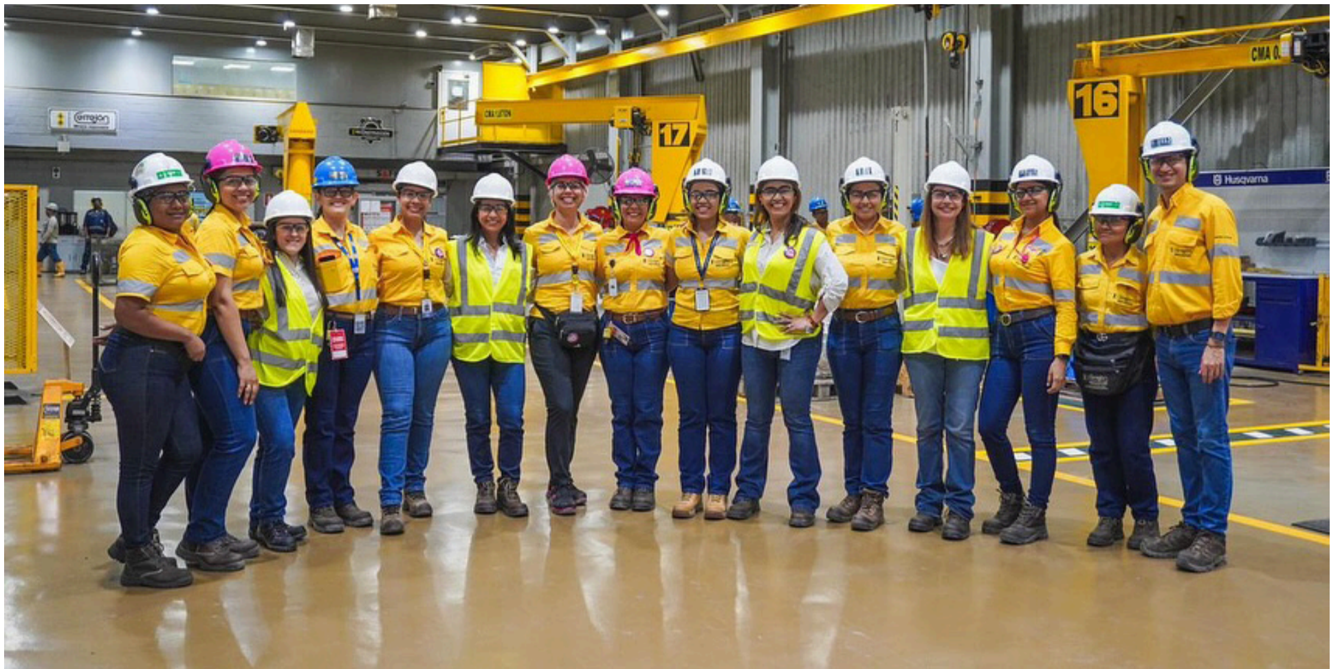
El sector minero-energético sigue siendo uno de los principales activos económicos de La Guajira.