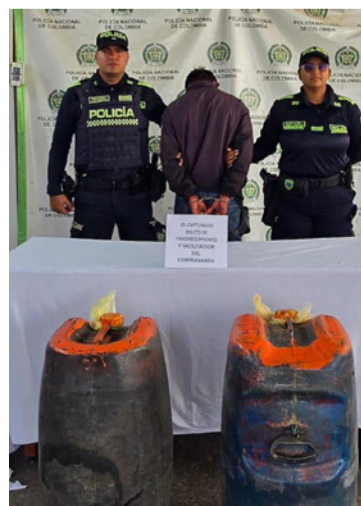
Llevaba combustible de presunto origen ilegal.

Ante estos hechos, se materializó la captura en flagrancia por el delito de favorecimiento y facilitación del contrabando, conducta que sanciona a quienes transporten o almacenen mercancías ingresadas ilegalmente al país sin el cumplimiento de la normativa aduanera.