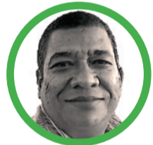
Por Fabio Olea Massa (Negringio)