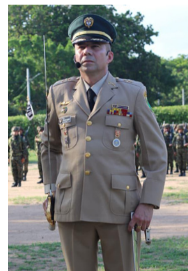
El coronel Carlos Alberto Olaya Avilés.

Al asumir el mando de la Décima Brigada, el coronel Olaya Avilés ratifica su compromiso con la protección de la población civil, mediante el liderazgo de operaciones militares contra los grupos armados organizados que delinquen en los departamentos del Cesar y La