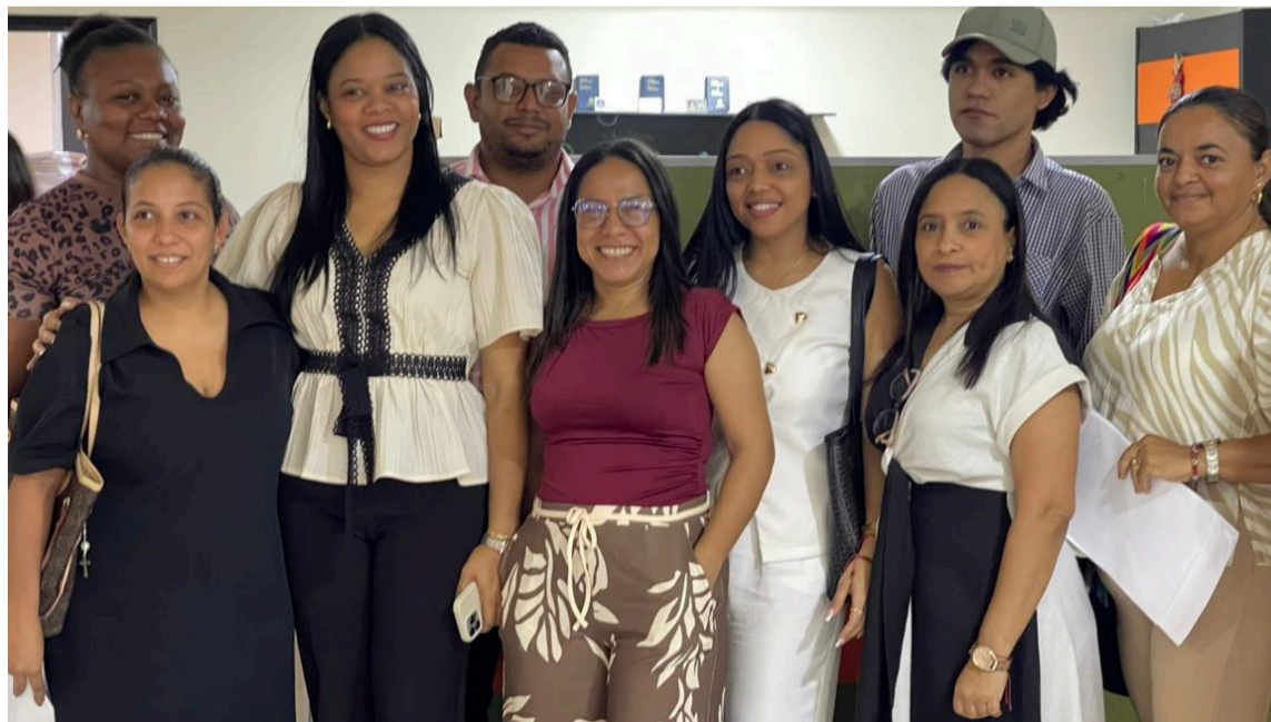
La Guajira avanza hacia una educación más inclusiva y equitativa.

Con estas acciones, La Guajira avanza hacia una educación más inclusiva y equitativa, brindando oportunidades a comunidades que históricamente han enfrentado dificultades para acceder a una educación de calidad.