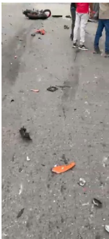
El joven se desplazaba en una moto KTM, la cual, por circunstancias confusas, se estrelló contra una volqueta.