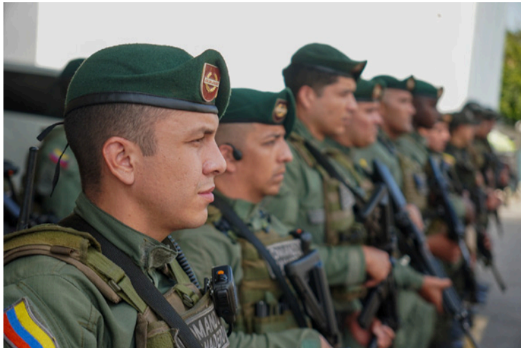
El pie de fuerza incluye la presencia del Grupo Comando de Granaderos de la Policía Nacional.

Esta estrategia, que se ha venido consolidando en las últimas semanas, contempla un despliegue operativo en zonas de alto flujo y vulnerabilidad, como el Parque de la Vida (comuna 10), el Mercado Nuevo, el Mercado Viejo (epicentros del comercio local) y otros puntos estratégicos del territorio, donde se busca impactar de manera directa la reducción de delitos y el acom-