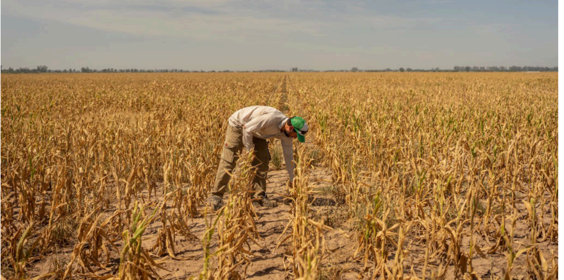
Preocupa lo que advierte el profesor de la universidad estatal de Nueva York en Albany, que en esta oportunidad se trataría de un Súper Niño.

En esta oportunidad se trataría de un Súper Niño