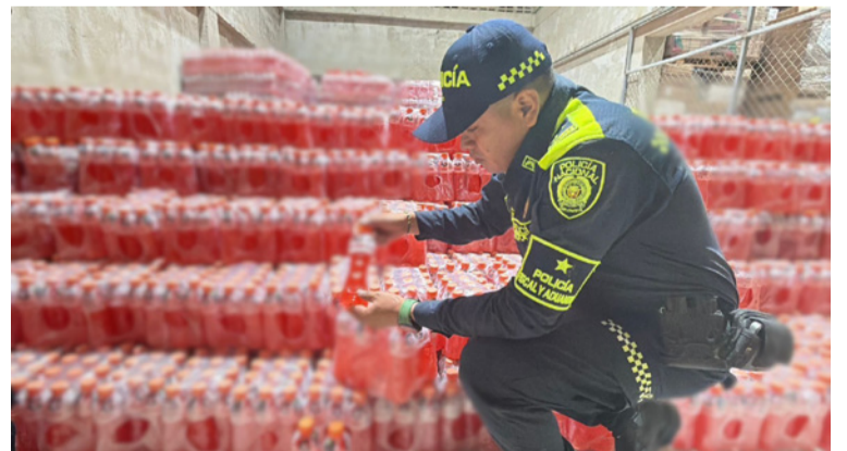
La mercancía no contaba con la documentación que acreditara su legal ingreso al territorio nacional.

Finalmente, la Policía Fiscal y Aduanera invita a la ciudadanía a denunciar cualquier irregularidad relacionada con la comercialización ilegal de