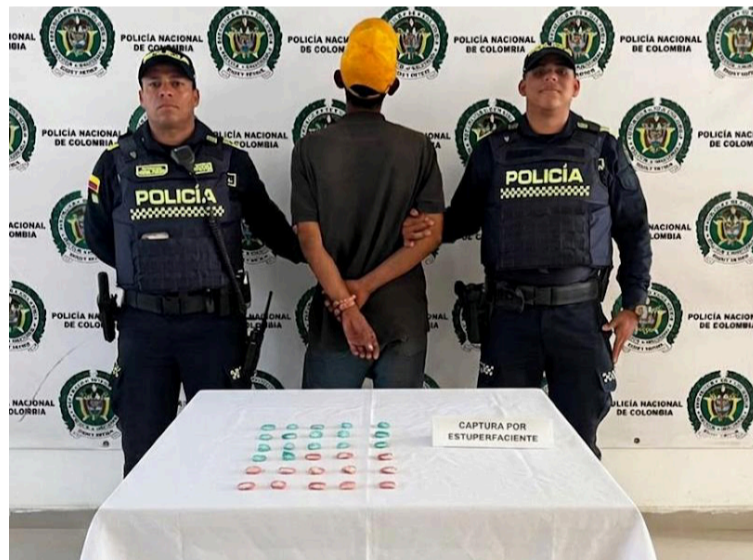
Se hallaron en poder de esta persona 30 envolturas plásticas que contenían clorhidrato de cocaína.

El coronel Salomón Bello Reyes, comandante del Departamento de Policía La Guajira, manifestó que "continuamos desplegando acciones contundentes contra el tráfico de estupefacientes en todas sus modalidades. Estos resultados hacen parte del compromiso institucional por pro-