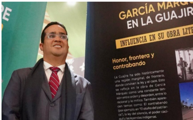
Aguilar aseguró que existe toda la disposición de la feria y de su Administración para que La Guajira participe.

Cabe recordar que la dificultad de la participación este año de La Guajira en la feria, tiene que ver con una deuda de 140 millones de pesos que no logró cubrir el Fondo Mixto de Cultura por la participación del Departamento en la feria del 2025.