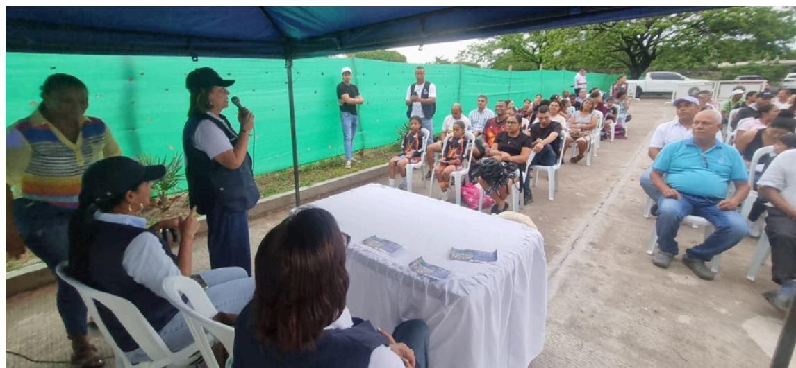
El patinódromo tendrá un tiempo estimado de ejecución de seis meses.

El proyecto se desarrollará en un área de 7.400 metros cuadrados, en el espacio donde anteriormente funcionaba el antiguo Idema, hoy convertido en escenario deportivo del municipio.