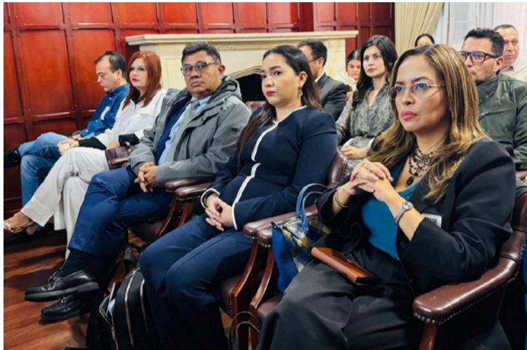
Se expusieron avances y oportunidades en el desarrollo de la política intercultural de educación ambiental.

taçadas se encuentra la construcción del Centro de Información Ambiental, un proyecto estratégico que, a través de la innovación y la tecnología,