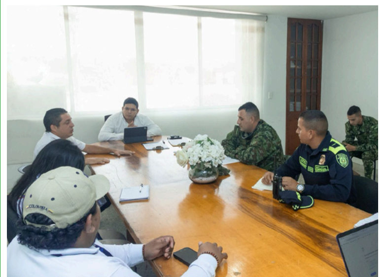
El alcalde hizo un llamado a la comunidad a seguir colaborando con las autoridades y a seguir denunciando.