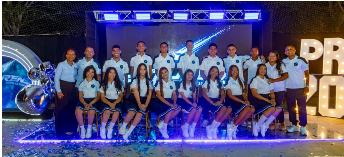
El evento marca el inicio de un año lleno de metas, sueños y logros para los estudiantes.