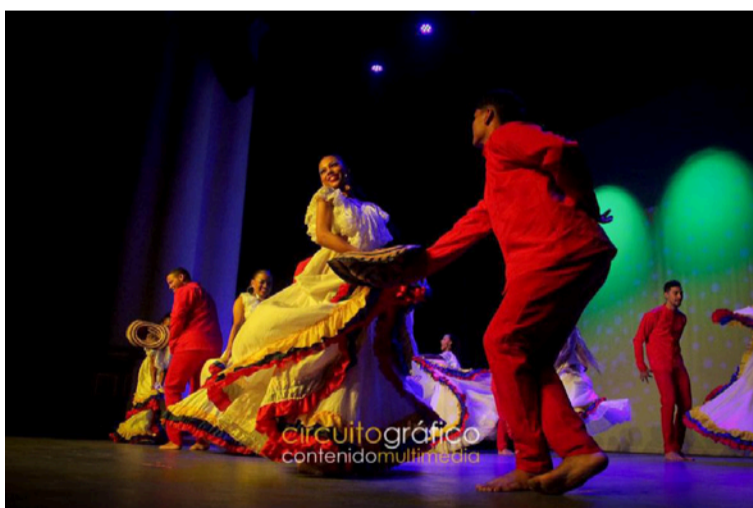
La Academia ha contribuido significativamente a la construcción del tejido social y cultural del territorio.

continúa formando artistas, creando oportunidades y llevando el nombre de La Guajira a nuevos escenarios nacionales e internacionales.