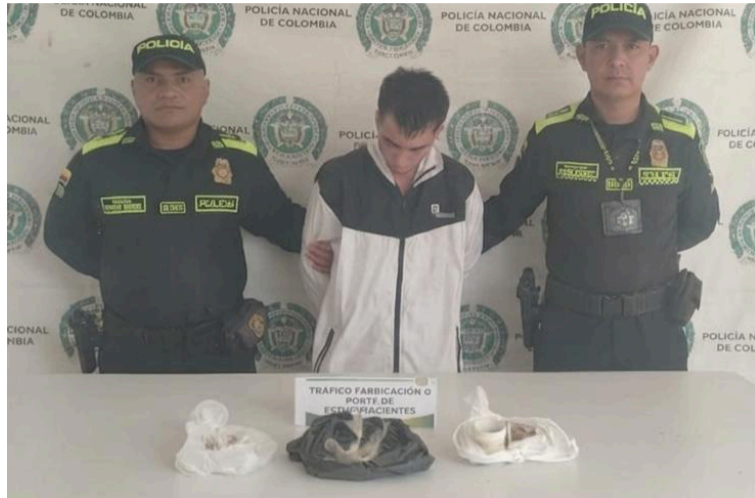
Esta persona fue dejada a disposición de la Fiscalía en turno del municipio de San Juan del Cesar.

El procedimiento se llevó a cabo durante labores de patrullaje, registro y control, cuando los uniformados realizaron un registro personal, hallando en poder del ciudadano