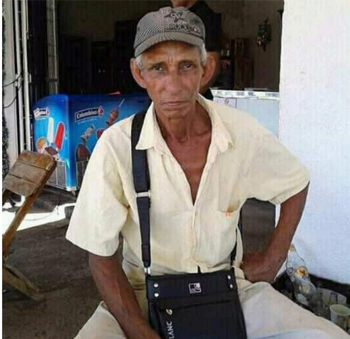
Para Villanueva será siempre 'El Bejuco', pero para mí, será el superhéroe silencioso.

ellas: un hombre trabajador, cercano, firme en su rutina, que no necesitó títulos ni protagonismo para dejar huellas profundas en la vida de tantos niños que crecimos bajo su cuidado cotidiano.