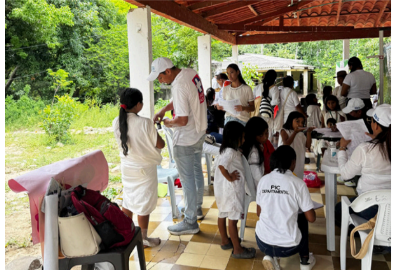
Durante la jornada se realizó inspección de agua para consumo humano con los técnicos de salud ambiental.

La Gobernación de La Guajira, a través de su Secretaría de Salud, continuará desarrollando estas jornadas en los diferentes pueblos indígenas y zonas rurales del Departamento. El objetivo es cerrar brechas de acceso y garantizar el derecho a la salud con pertinencia cultural.