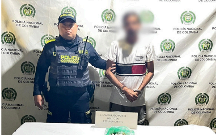
A esta persona se le halló en su poder una bolsa que contenía 78 cigarrillos artesanales de marihuana.

Durante el procedimiento, los uniformados observaron a un ciudadano que, al notar la presencia policial, adoptó una actitud nerviosa, motivo por el cual se procedió a realizar un registro a persona conforme al artículo 159 del Código Nacional