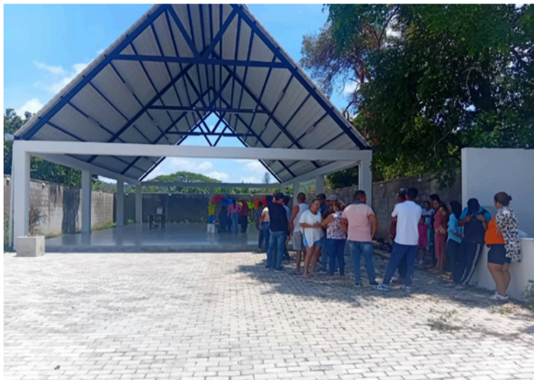
Algunos habitantes de El Plan calificaron la jornada electoral como un presunto fraude que se debe investigar.

En la vereda Berlín, la asamblea general decidió aplazar las elecciones luego de advertir inconsistencias entre el censo poblacional y los nombres registrados en el libro de afiliados. Además, se habrían presentado inconvenientes en la inscripción de planchas, generando