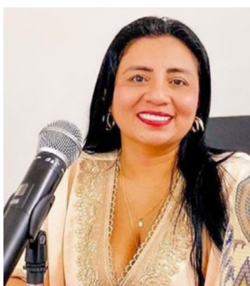
Nera Robles, alcaldesa de Albania.

Agregó que el día viernes 24 de abril se produjo