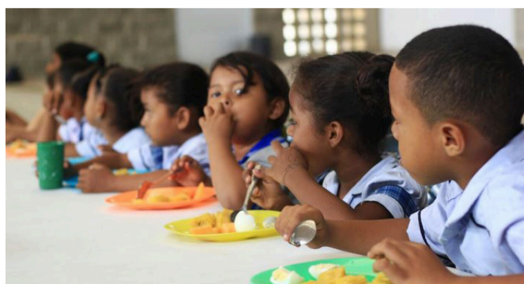
La Gobernación continuará con el seguimiento a la ejecución del programa en los municipios no certificados.

DESTACADO Este ejercicio se enmarca en el propósito de la Administración Departamental de garantizar servicios que favorezcan el acceso y la permanencia de los estudiantes en el sistema educativo.