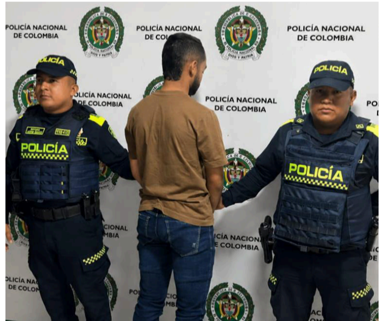
El hombre capturado fue dejado a disposición de la autoridad competente para su judicialización.

La Policía Nacional continúa fortaleciendo las acciones preventivas y operativas para garantizar la seguridad de todos los habitantes del departamento de La Guajira.