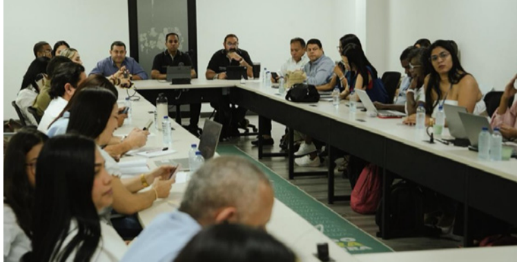
Se acordó impulsar estrategias para la prevención del consumo de sustancias psicoactivas y el acoso escolar.

DESTACADO Se planteó la articulación con la academia, a través de la Universidad de La Guajira, para acercar servicios como consultorios jurídicos, así como el desarrollo de observatorios sociales.