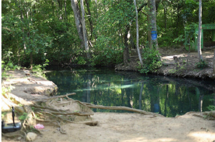
El reconocimiento de la ONU ratifica que en Corpoguajira se están tomando decisiones responsables.

El pronunciamiento reconoce la decisión adoptada por la autoridad ambiental del Departamento, mediante la cual se ratifica la negación de la licencia ambiental al pro-