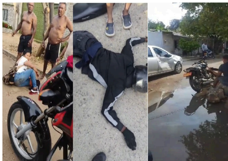
Los tres percances en Riohacha dejaron como resultado dos personas heridas, informaron testigos.

En la mañana de ayer lunes 27 de abril se registraron tres accidentes de tránsito en diferentes sectores de Riohacha, que dejaron como resultado dos personas heridas, informaron testigos del suceso.