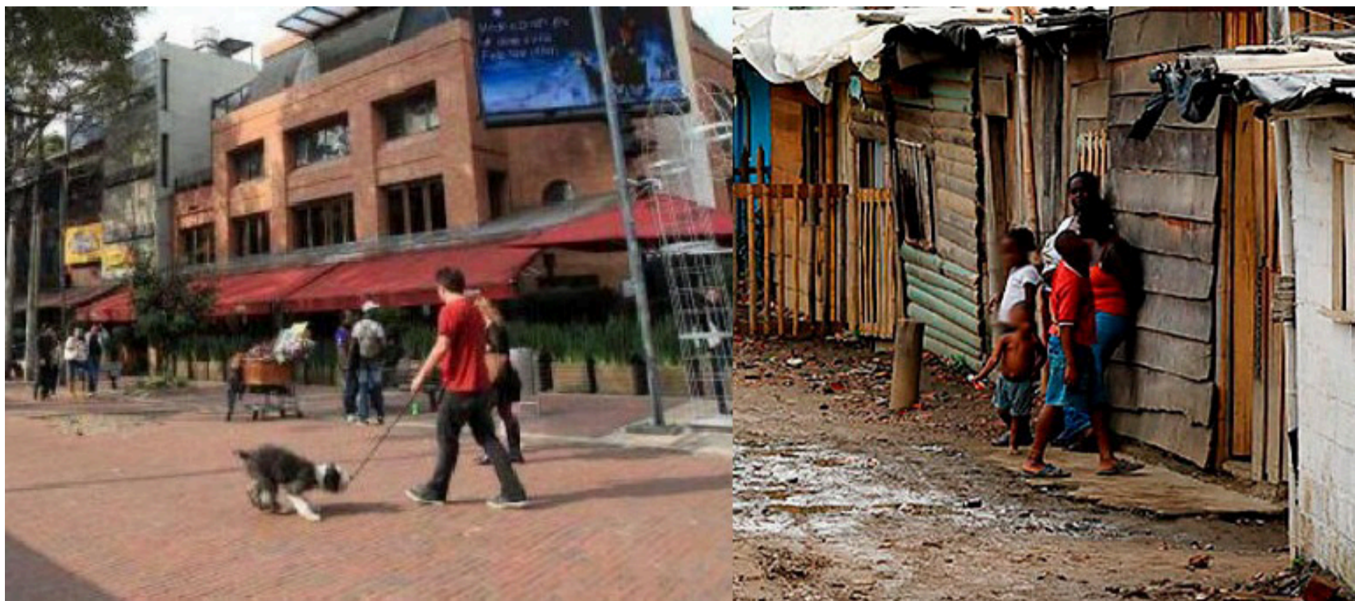
El bienestar no es un rompecabezas que se arma desde Bogotá. Es un ecosistema que se respeta, no se domestica.