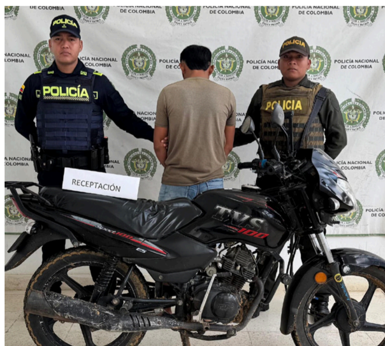
El conductor de la motocicleta fue dejado a disposición de la autoridad competente,

Ante esta situación, los policías procedieron a informarle sus derechos como persona capturada y a dejarlo a disposición de la autoridad competente, donde deberá responder por el delito que se le atribuye.