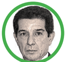
Por José Félix Lafaurie Rivera