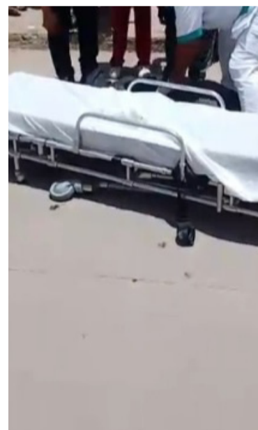
La mujer recibió dos impactos de bala.

Las autoridades policiales iniciaron las investigaciones para poder determinar el móvil de este hecho violento, por lo que aún se desconoce si el ataque a bala se habría registrado por un intento de atraco; se espera el avance de las investigaciones.