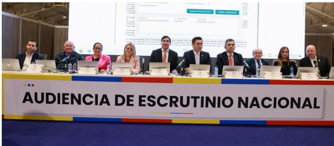
Con esta medida, el CNE refuerza el control sobre la financiación de las campañas.

Con esta medida, el Consejo Nacional Electoral refuerza el control sobre la financiación de las campañas y avanza en la consolidación de la transparencia, la legitimidad y la confianza en las elecciones presidenciales de 2026.