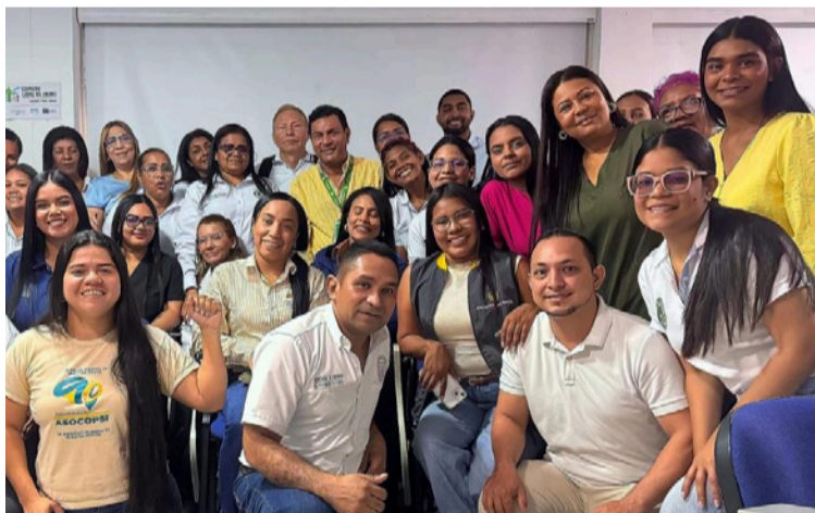
El Consejo continuará sesionando periódicamente para hacer seguimiento a los compromisos.

“Que hoy estén aquí los 15 municipios y las EPS