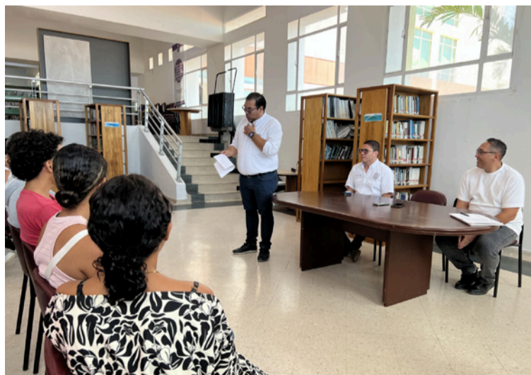
Las clases, tanto teóricas como prácticas, se desarrollarán en el Centro Cultural de La Guajira.

Este proceso formativo es posible gracias al respaldo de la Unión Europea, el Banco Interamericano de Desarrollo y el