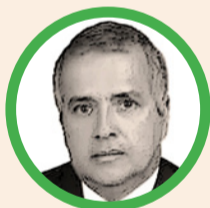
Por Rubén Darío Ceballos Mendoza