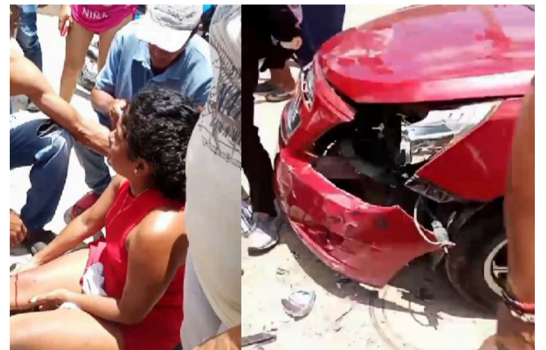
La mujer fue auxiliada y llevada de urgencia hasta un centro asistencial para la valoración médica.

Las autoridades continúan haciendo el llamado a los usuarios viales para que cumplan las normas de tránsito y así evitar situaciones que pongan en riesgo sus vidas y las de sus acompañantes.