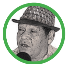
Por Rosendo Romero Ospino