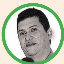
Por Henry Peñalver