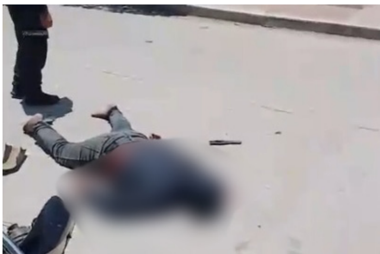
El hecho se habría presentado por el choque entre una motocicleta en la que iba el afectado y un ciclotaxi.

se ha identificado a la persona lesionada; se encuentra bajo observación médica en un centro asistencial en el municipio de Uribia, por lo que se espera un reporte completo por parte de las autoridades para conocer detalles de lo ocurrido.