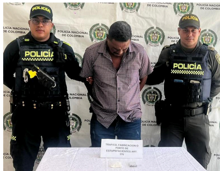
El capturado y los elementos incautados fueron dejados a disposición de la Fiscalía URI.

De inmediato, los uniformados procedieron a hacer efectiva la captura, informándole sus derechos como persona detenida. Tanto el capturado como los elementos incautados fueron dejados a disposición de la Fiscalía URI en turno, donde deberá responder por el delito que se le atribuye.