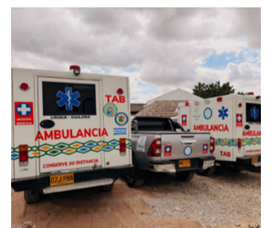
El hecho se registró a la altura del kilómetro 61.

El hecho se registró a la altura del kilómetro 61, cuando varios individuos armados interceptaron el vehículo asistencial y des-