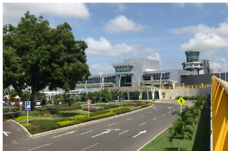
La Procuraduría solicitó informe sobre las instalaciones del aeropuerto Ernesto Cortissoz, en Barranquilla.