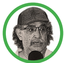
Por Gustavo Múnera Bohórquez