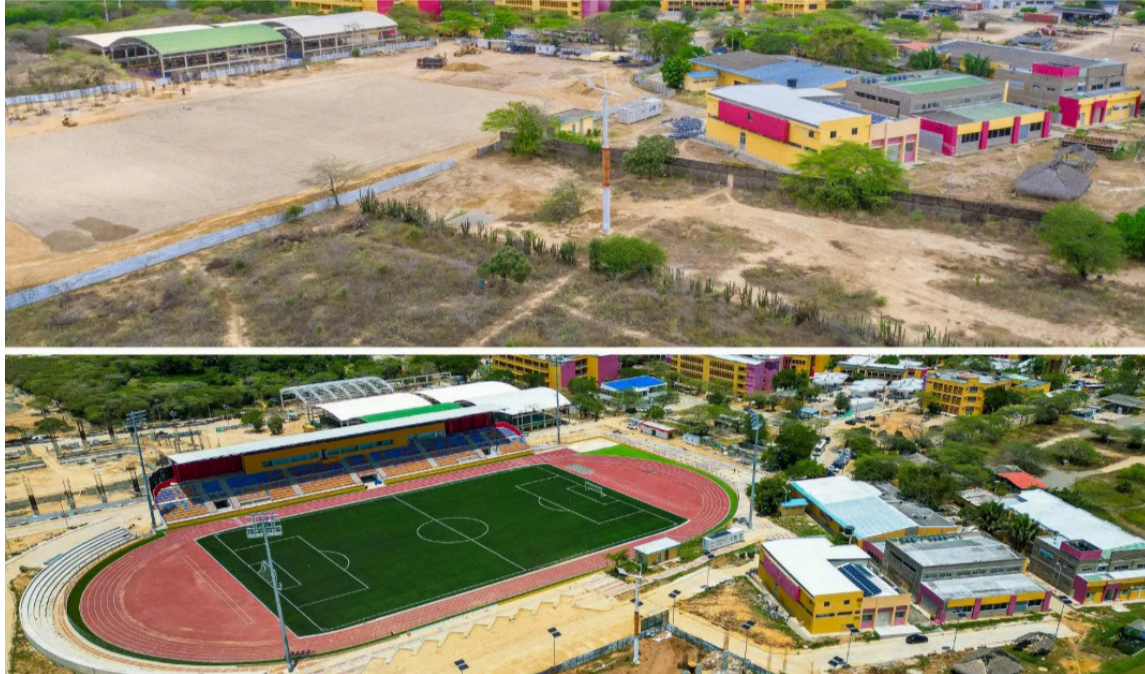
Avance del nuevo escenario deportivo, con capacidad para más de 1.800 asistentes.

Bloques renovados, otros actualmente en proceso de construcción, un escenario deportivo moderno en etapa avanzada