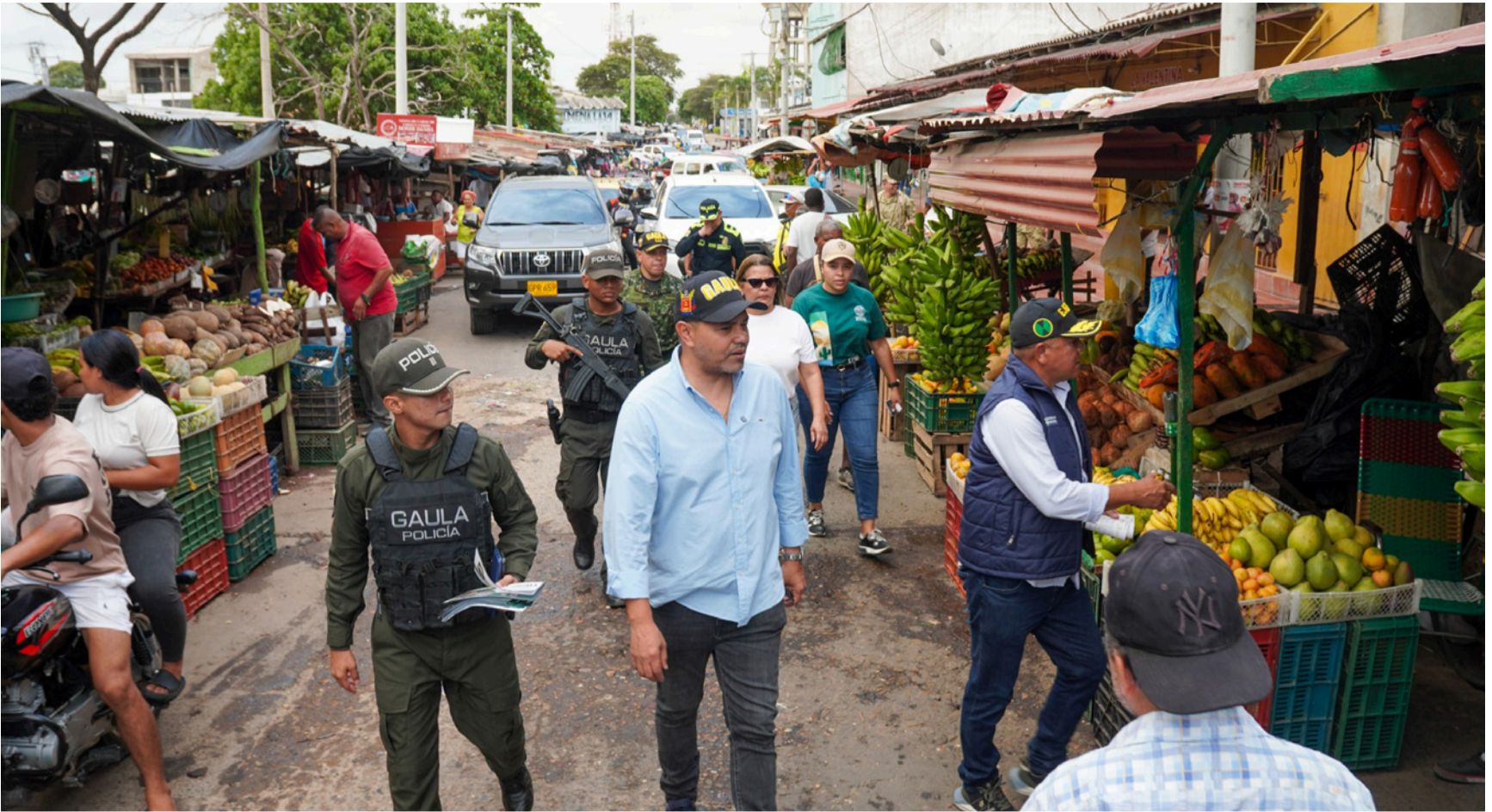
Cuando la institucionalidad no logra ocupar el espacio público ni comunicacional, ese lugar lo llena el miedo.