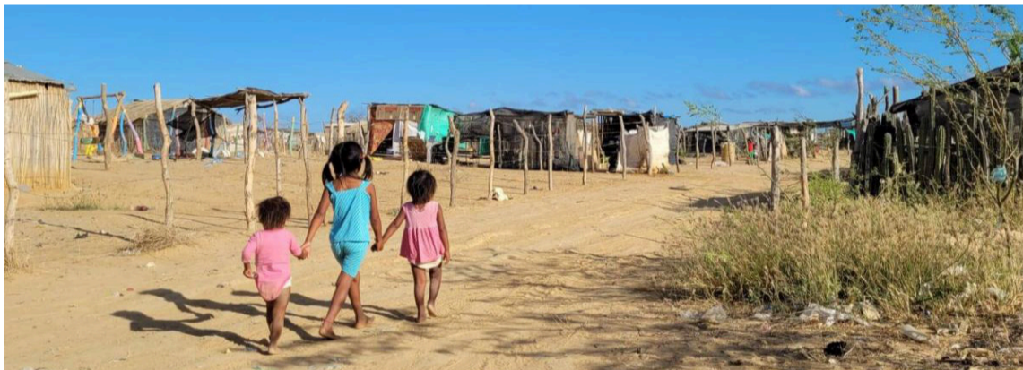
La Consulta Previa tiene una dimensión ética fundamental cuando se trata de la niñez.

Este mecanismo, reconocido como un derecho fundamental de los pueblos indígenas, enfrenta hoy cuestionamientos relacionados con su alcance y su aplicación efectiva.