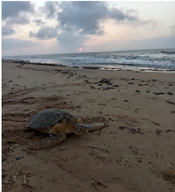
Las tres tortugas, de la especie verde y en estado juvenil, fueron devueltas a su hábitat.