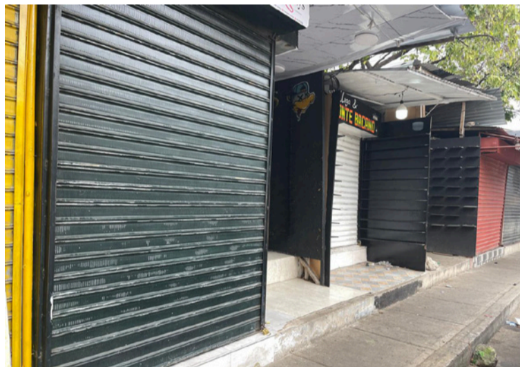
La Fuerza Pública no estuvo presente con la misma intensidad durante los tres días en los mercados populares.

dad es herir el bienestar de todos, pero golpear con mayor fuerza a la población más vulnerable es, sin duda, una consecuencia especialmente grave.