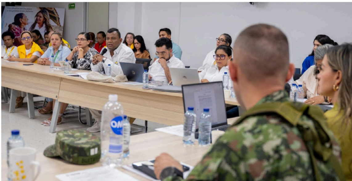
El cabildo gobernador del pueblo kankuamo expuso la situación de su comunidad.