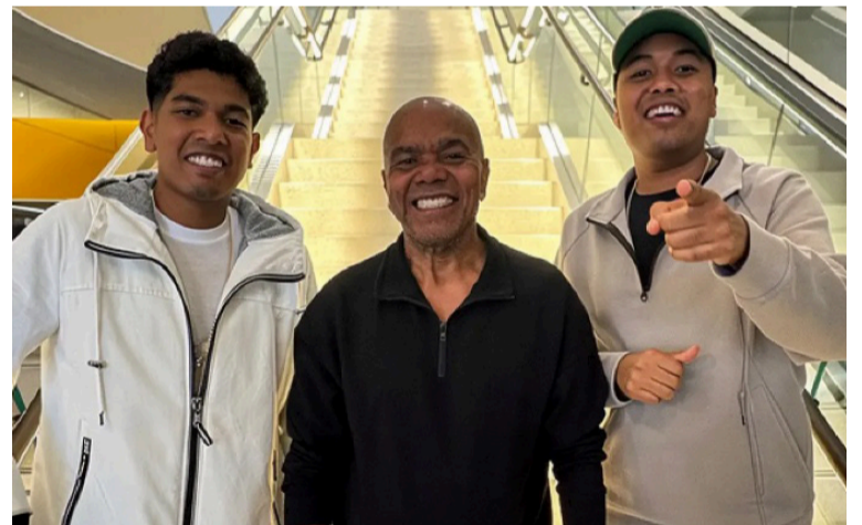
Los artista aseguran que esta propuesta es una deuda de gratitud hacia los clásicos que marcaron sus carreras.

Con este lanzamiento, los Morales demuestran que el legado del Binomio sigue más vivo que nunca.