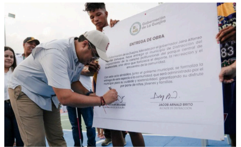
El gobernador Jairo Aguilar Deluque continúa llegando a más municipios, cumpliendo la palabra.

"El compromiso es llegar a los territorios donde más se necesita y cumplir. Hoy estas familias tienen soluciones reales que im-