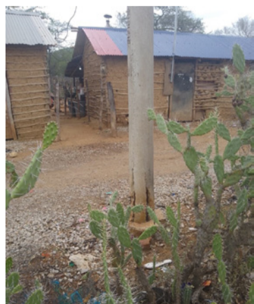
Comunidad pide una visita técnica al caserío para que evalúen el estado de los postes de energía eléctrica.