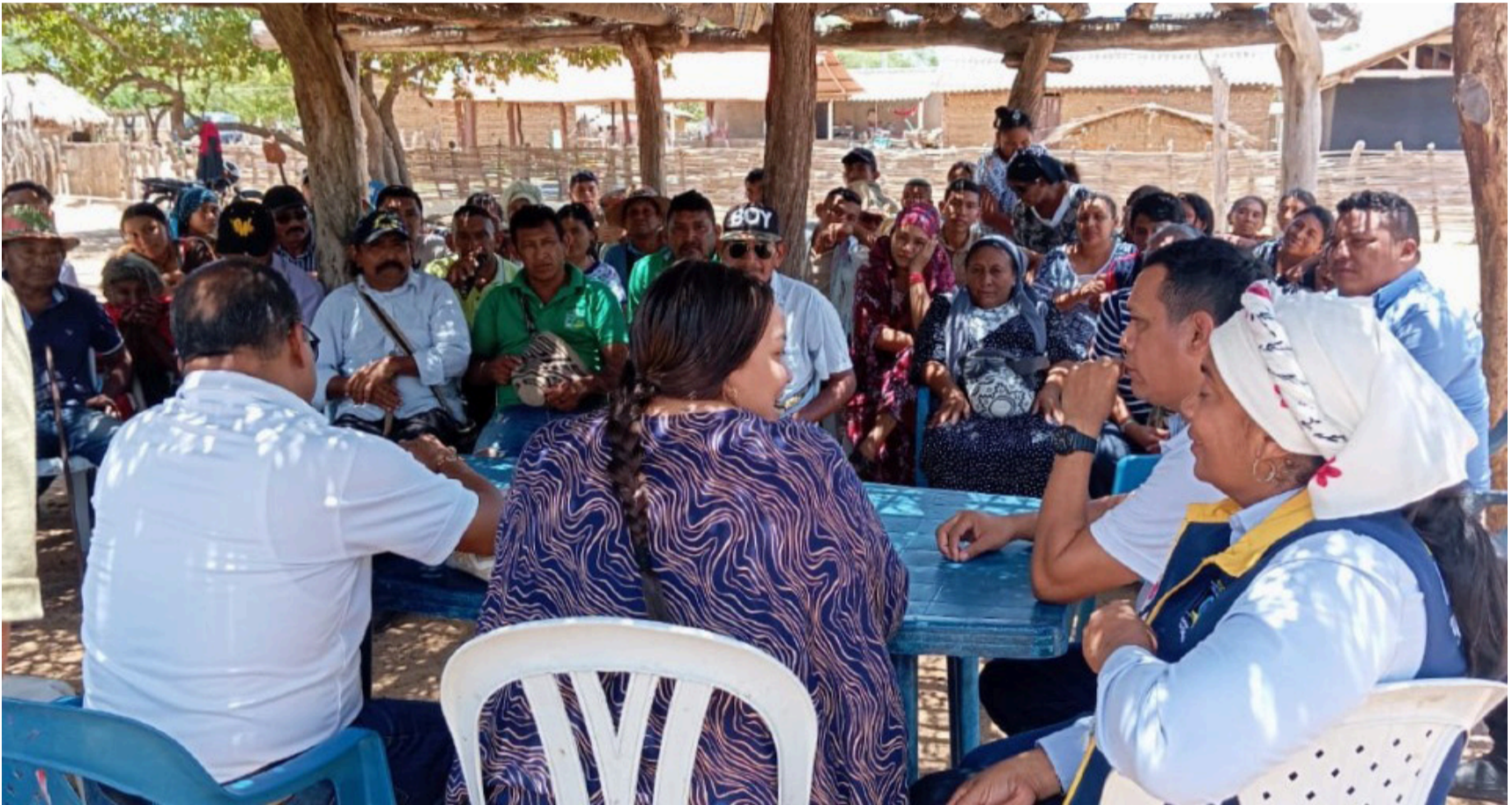
La organización comunitaria no es un obstáculo. Es la base sobre la cual deben construirse las soluciones.

La construcción del Plan Estructural de Acciones en el marco de la Sentencia T-302 de 2017 ha puesto en evidencia un escenario complejo entre la urgencia institucional y la legitimidad territorial en La Guajira.