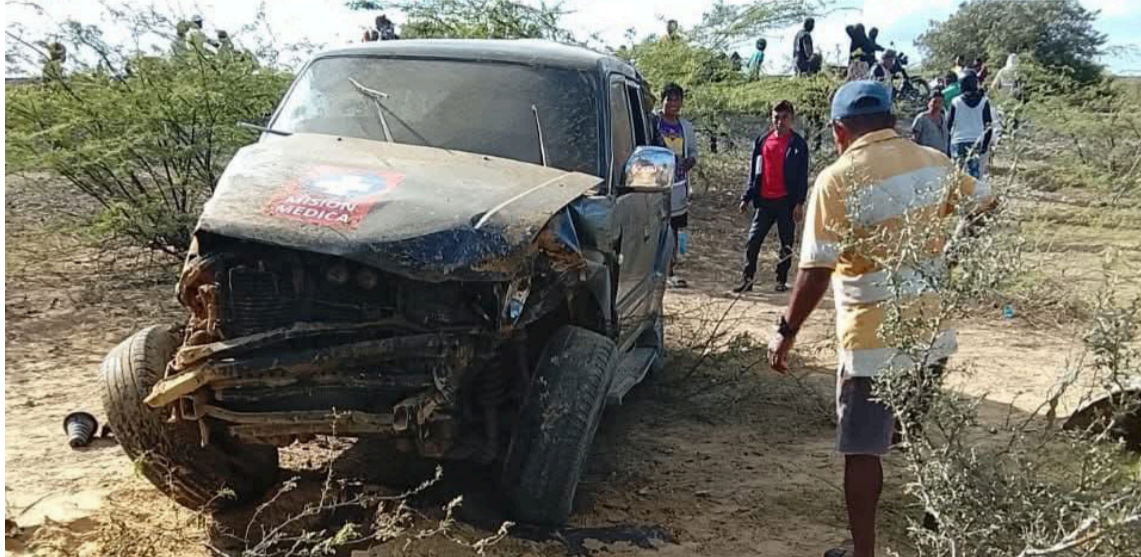
El herido fue trasladado hasta un centro asistencial en el municipio de Uribia.

Los habitantes de la zona y otros conductores se