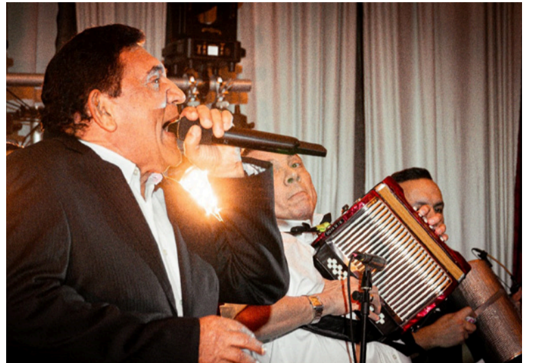
El respaldo masivo del público colombiano, venezolano y mexicano, confirma la vigencia de Zuleta.

Al terminar esta gira, 'Poncho' Zuleta y 'Cocha' Molina regresarán a Colombia el próximo 26 de abril, para integrarse a la agenda del 59 Festival de la Leyenda Vallenata en Valledupar.