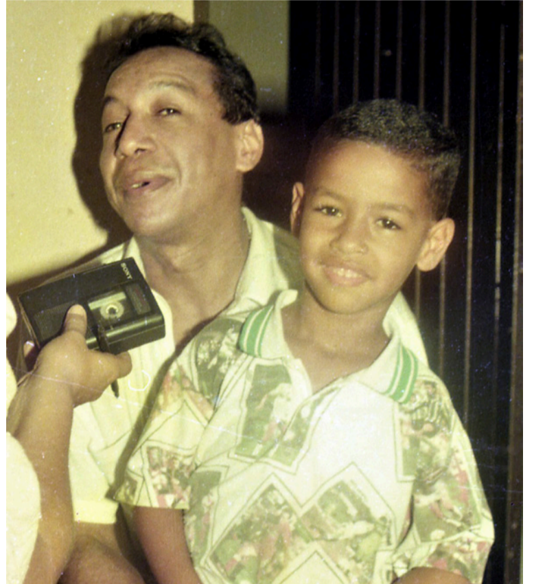
Diomedes tenía a su hijo 'El gran Martín Elías' en un lugar destacado.