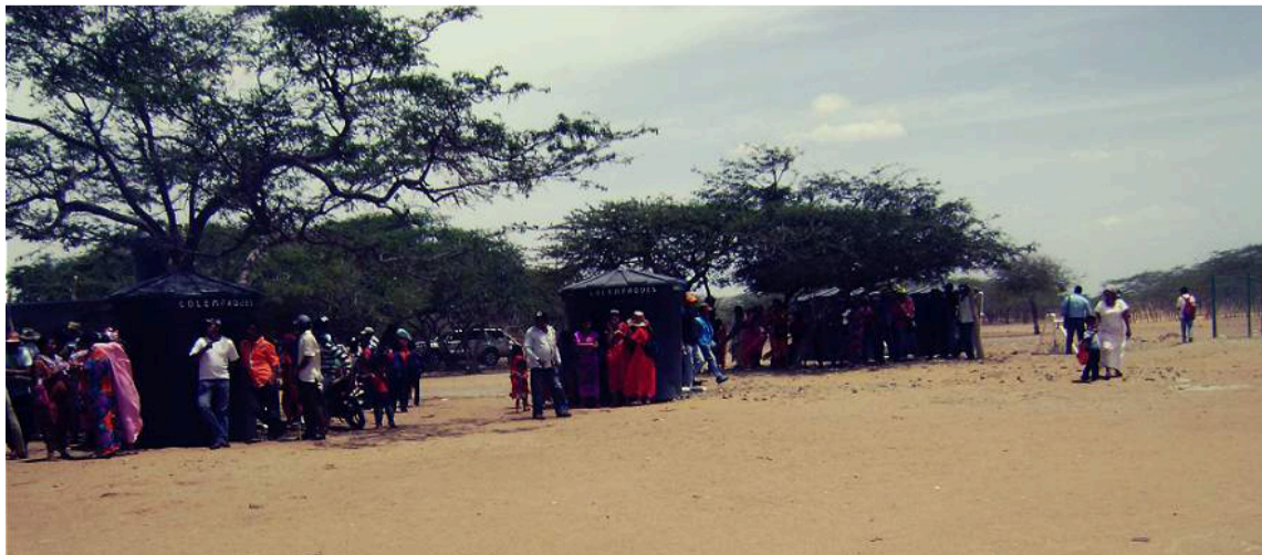
La situación se agrava por la dispersión geográfica de las rancherías y la conectividad.

El informe conjunto es una advertencia institucional contundente sobre la persistencia de la crisis humanitaria en La Guajira, el cual no solo confirma el incumplimiento del objetivo constitucional mínimo de agua, sino que obliga a revisar la coherencia, trazabilidad y efectividad de los planes de acción, especialmente en aquello que respecta a cobertura real, calidad del agua y reducción del riesgo para la niñez menor de cinco años. Por Veeduría Ciudadana para la Implementación de la Sentencia T-302 de 2017.