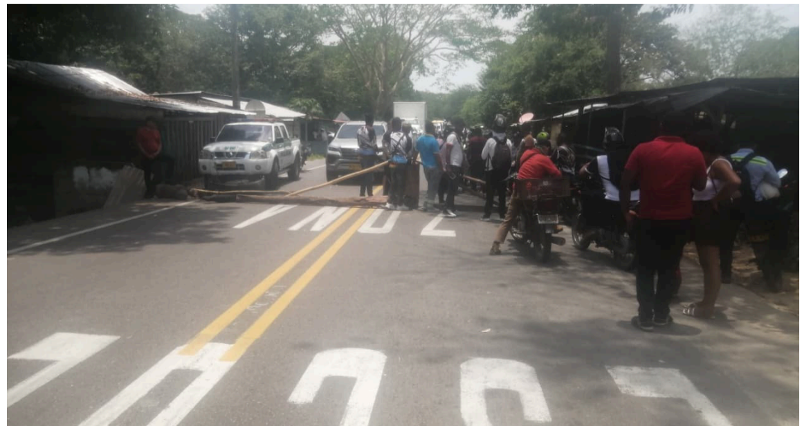
Según se indicó, la empresa prestadora del servicio ha incumplido compromisos.

Tras varias horas de diálogo, las partes avanzaron en acuerdos que permitieron restablecer el tránsito en la Troncal del Caribe. La comunidad reiteró su llamado a soluciones definitivas frente a las fallas en el suministro eléctrico.