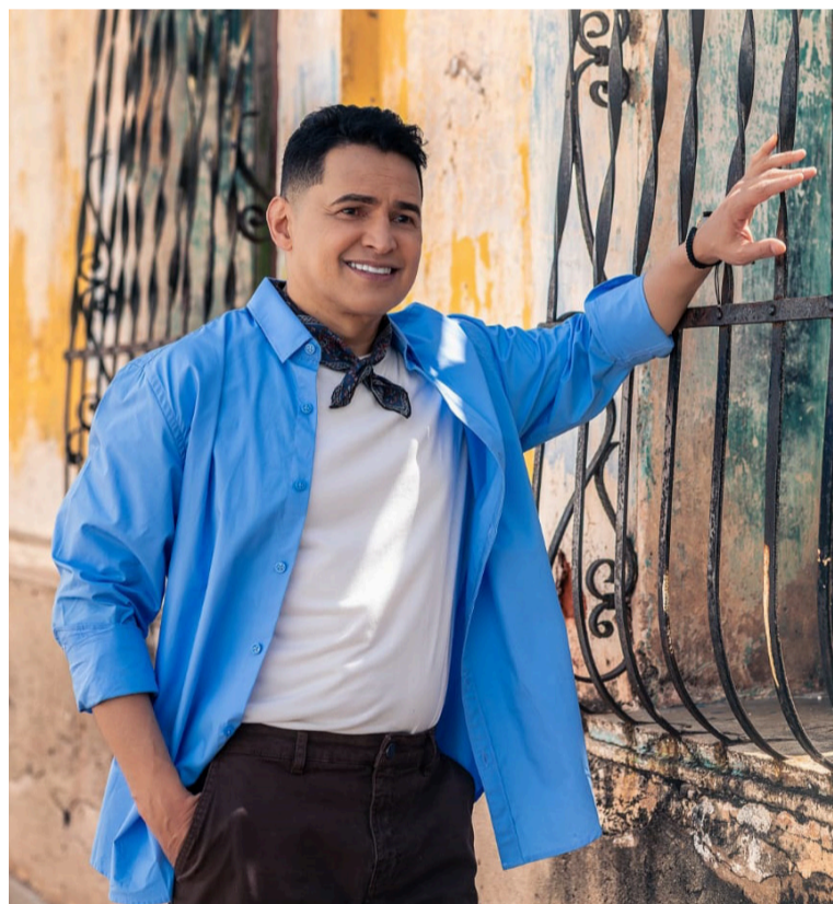
La gira de Celedón promete una puesta en escena renovada, con un despliegue técnico y visual de alto nivel.

Jorge Celedón, el Ídolo Mundial del Vallenato, lanzó el videoclip oficial de 'Me voy de ti', sencillo que actualmente ocupa el primer lugar en el listado de National Report, consolidándose como la canción más escuchada en las emisoras del país.