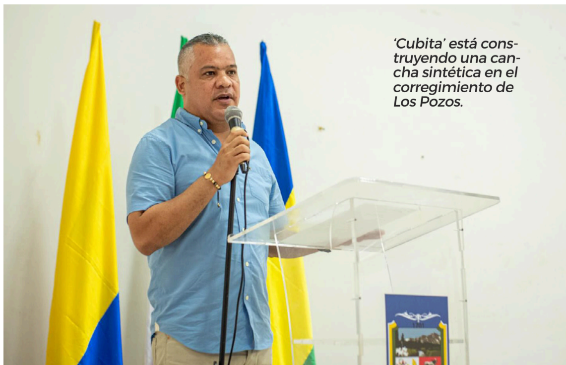
'Cubita' está construyendo una cancha sintética en el corregimiento de Los Pozos.

Pero del mismo modo, 'Cubita' está construyendo una cancha sintética en el corregimiento de Los Pozos y también construye una nueva y moderna avenida con boulevard, doble calzada y andenes estampados en la carrera 15 detrás del Infotep, desde la vía nacional hasta el Estadio Enrique Brito. Así mismo, viene adecuando y mejorando nueve instituciones educativas rurales en este momento del progreso. Del mismo modo, este mes se inaugura el PAS y se inicia la ejecución de más de 2 kilómetros de pavimentación en la carrera 22.