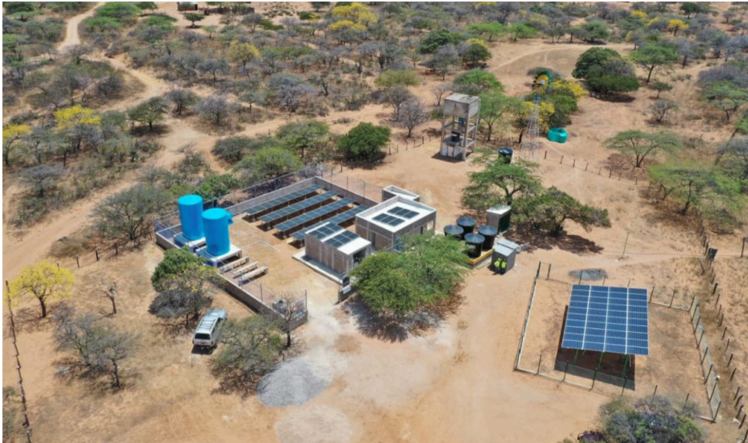
El verdadero cumplimiento está en que ninguna madre wayúu tenga que caminar horas por una pimpina de agua.

La Procuraduría también advirtió una preocupante lentitud en la articulación institucional. Ministerios, alcaldías, operadores y entidades de riesgo no siempre trabajan bajo una hoja de ruta única, lo que genera duplicidades, retrasos y vacíos en la ejecución. En la práctica, esto significa que una comunidad puede estar priorizada por una entidad y permanecer invisible para otra, afectando la trazabilidad de las inversiones y debilitando