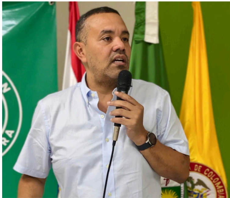
La Gobernación reitera su compromiso de trabajar con el Gobierno nacional y las autoridades locales.

La decisión fue adoptada tras una reunión virtual extraordinaria de seguridad liderada por el Javier Baquero, viceministro para las Políticas de Defensa y Seguridad del Ministerio de Defensa Nacional, con la participación de autoridades nacionales, departamentales y municipales, así como de la Fuerza Pública, la Fiscalía General de la Nación y la Defensoría del Pueblo, con el propósito de dar una respuesta inmediata,