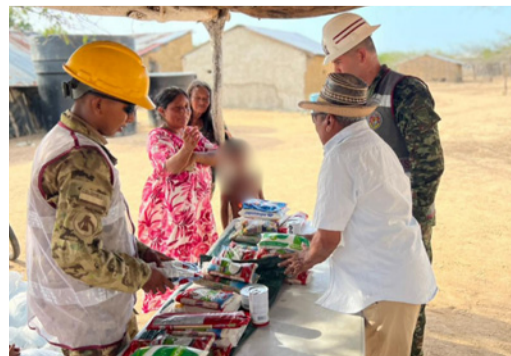
Las acciones buscan contribuir a la atención de necesidades básicas de alimentación y mejorar la calidad de vida de las comunidades wayuú.

La institución reiteró que este tipo de actividades hacen parte de su labor social en el territorio, orientada a fortalecer los lazos con las comunidades y apoyar a los sectores más vulnerables.