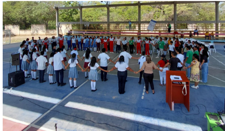
El evento fue organizado por el voluntariado de la Universidad de La Guajira, Club Rotario de Fonseca y Rotario Bucaramanga.