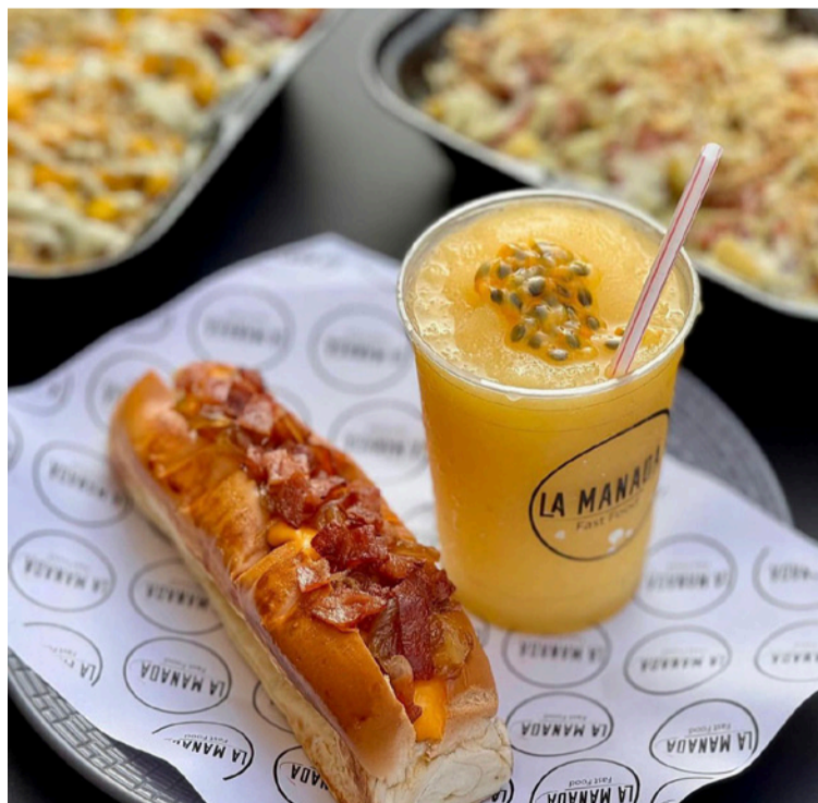
Ahora entiende que cada preparación tiene sus detalles y por ende se lleva su tiempo.

Recuerda con afecto a: ¡Qué Bolis! el emprendimiento que le enseñaría la importancia de la cautela al crear, pues uno de sus intentos por hacer un boli de arequipe lo llevó a indi-