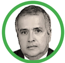
Por Rubén Darío Ceballos Mendoza