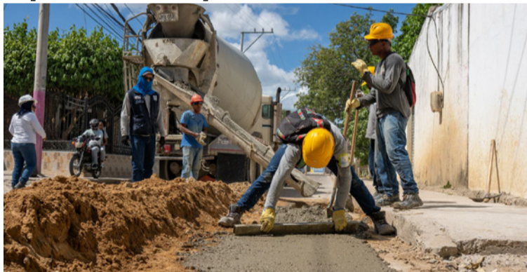
Durante estos cuatro meses, los 40 puntos de intervención se ubicarán en las comunas 1, 4, 5, 6 y 8.

“Seguimos con la estrategia ‘Lo tapamos ya’, que no solo entra a suplir una necesidad vial en el Distrito, sino que con ella también hemos innovado en la optimización de los