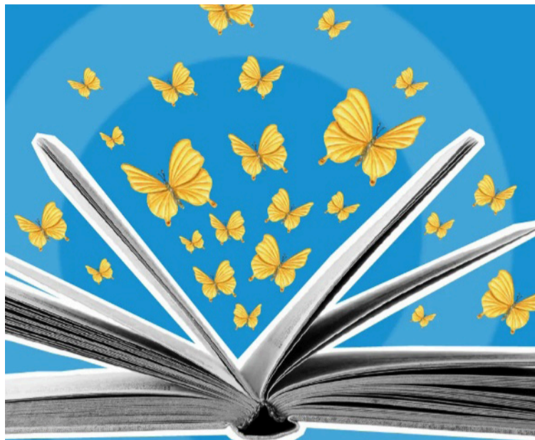
El evento busca consolidarse como un espacio de reflexión sobre el poder transformador del lenguaje.

Para los organizadores, la iniciativa no solo celebra la riqueza lingüística de la región, sino que promueve la interculturalidad como un eje fundamental de la formación académica.