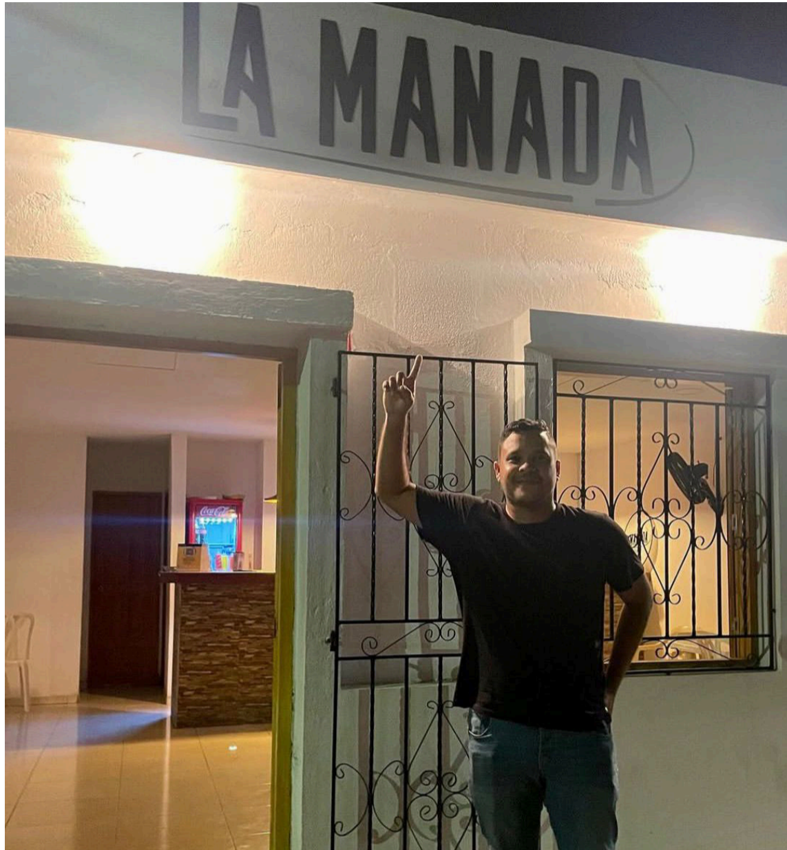
Actualmente como socio, lidera un ejemplar equipo de trabajo en La Manada.