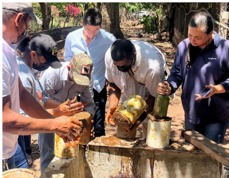
En la jornada, los productores demostraron su interés, compromiso y disposición para adoptar nuevas prácticas.

Con estas acciones, la Alcaldía continúa trabajando por un campo más fuerte, productivo y sostenible, apostándole al bienestar de las familias rurales y al desarrollo económico de la región.