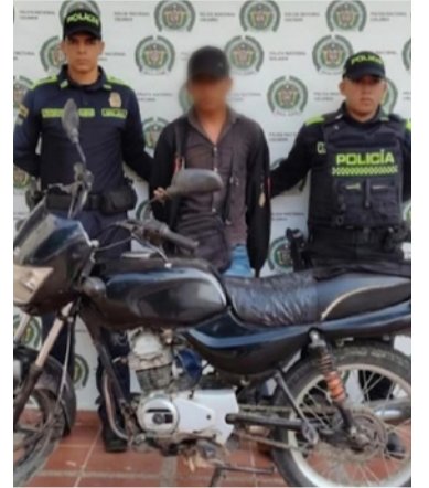
Fue dejado a disposición de la autoridad competente.

En medio de los operativos de control y vigilancia que adelanta la Policía Nacional en zonas rurales de Riohacha, fue capturado un joven de 18 años tras ser sorprendido movilizándose en una motocicleta que presentaba reporte vigente por hurto, en el corregimiento de Cotoprix.