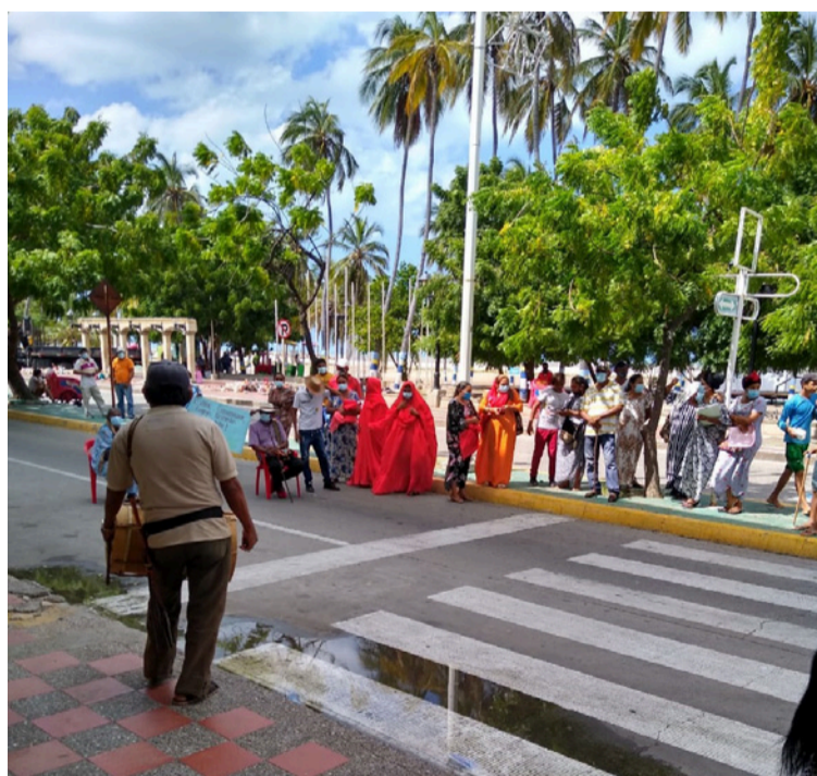
La Corte Constitucional estableció que la Consulta Previa no solamente opera en los proyectos de explotación de recursos naturales y en territorios de grupos étnicos.

La Constitución de 1991 plantea un modelo de relación con los grupos étnicos basado en el reconocimiento de su diferencia cultural como algo digno de respeto y valoración, en tanto contribuye a forjar una sociedad plural e incluyente de las múltiples formas de vivir la humanidad. Asimismo, el constituyente reconoció que la construcción de tal di-