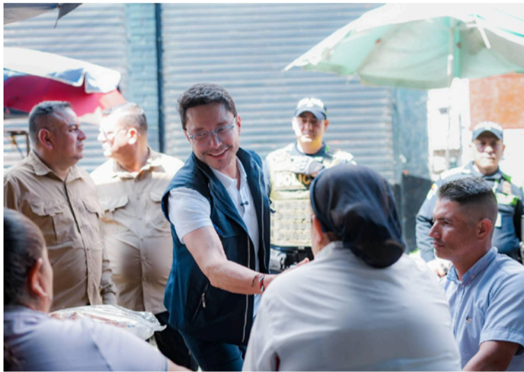
El candidato compartió un sancocho con la comunidad, en un espacio que reflejó cercanía con la gente.

El candidato planteó fortalecer un modelo preventivo que acerque la atención a las personas: “Vamos a extender ‘Médico en tu casa’, para que el médico llegue hasta la vivienda, haga búsqueda