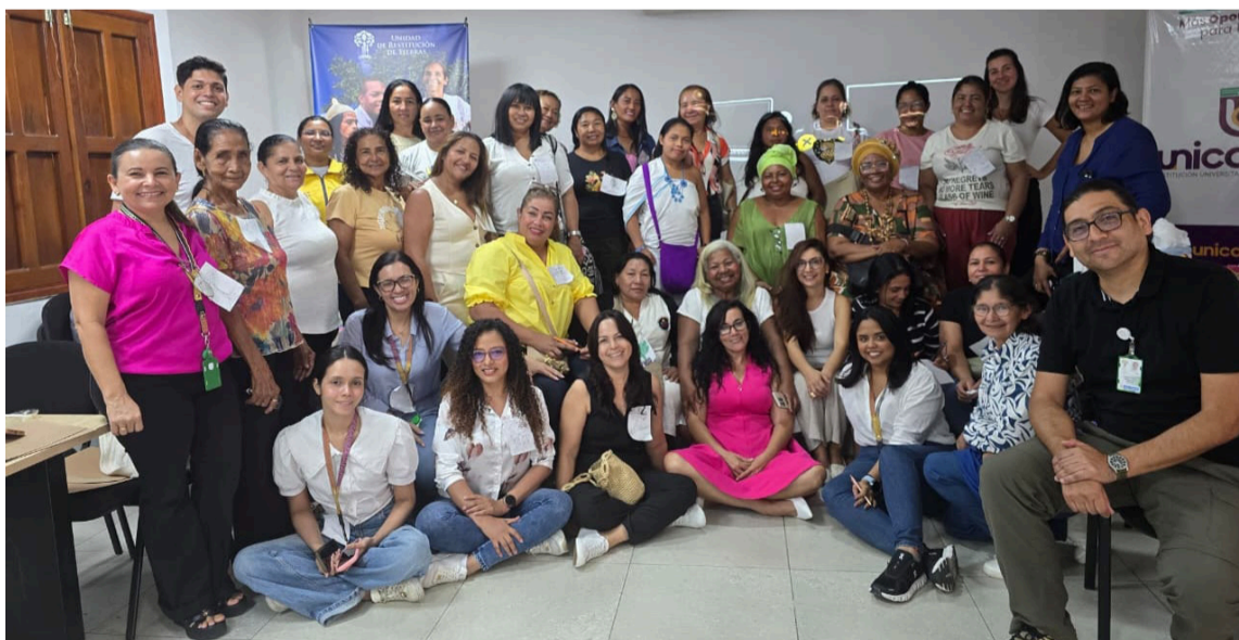
El enfoque de género se consolida como un pilar en la política de restitución.

El encuentro, liderado por la Dirección Social y Dirección Territorial Magdalena y Atlántico de la Unidad de Restitución de Tierras (URT), tuvo varios propósitos, como fortalecer la participación de las mujeres en sus procesos con la entidad, brindar información clara sobre la ruta de restablecimiento de derechos, promover el diálogo sobre las barreras históricas que afrontan en el acceso a la tierra en Colombia, dar a conocer los avances institucionales