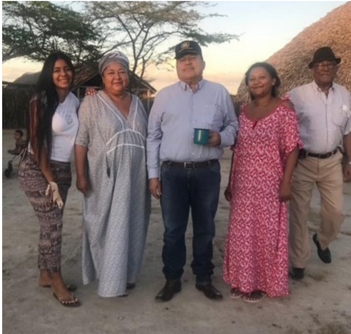
Consultar a los pueblos interesados, establecer reglas de participación para la definición de los medios e instituciones vinculadas con el diseño e implementación de políticas.

No hay duda que en la redacción del Decreto cuya presunción de legalidad fue desvirtuada participaron personas que no nos conocen ni conocen el tema, ni midieron sus consecuencias, para ellos poco importan los artículos 2,7,13, 63 y 246 supe-