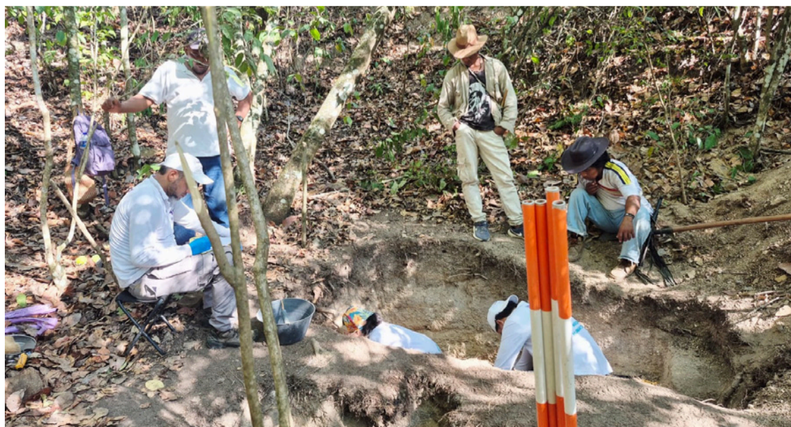
Las acciones hacen parte del Plan Regional de Búsqueda Sur de La Guajira - Cesar.

DESTACADO Según la Ubpd, no se trata solo de encontrar un cuerpo, sino de abrir una puerta para encontrar la posibilidad de dignificar la memoria del ser humano que ya no está.