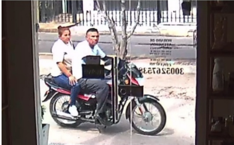
Se conoció que una pareja ingresó al establecimiento haciéndose pasar como clientes.

De acuerdo con la información conocida, una pareja ingresó al establecimiento haciéndose pasar como clientes. En ese momento, la joven encargada del lugar se encontraba