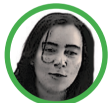
Por Yarlin Carolina Díaz Bonilla