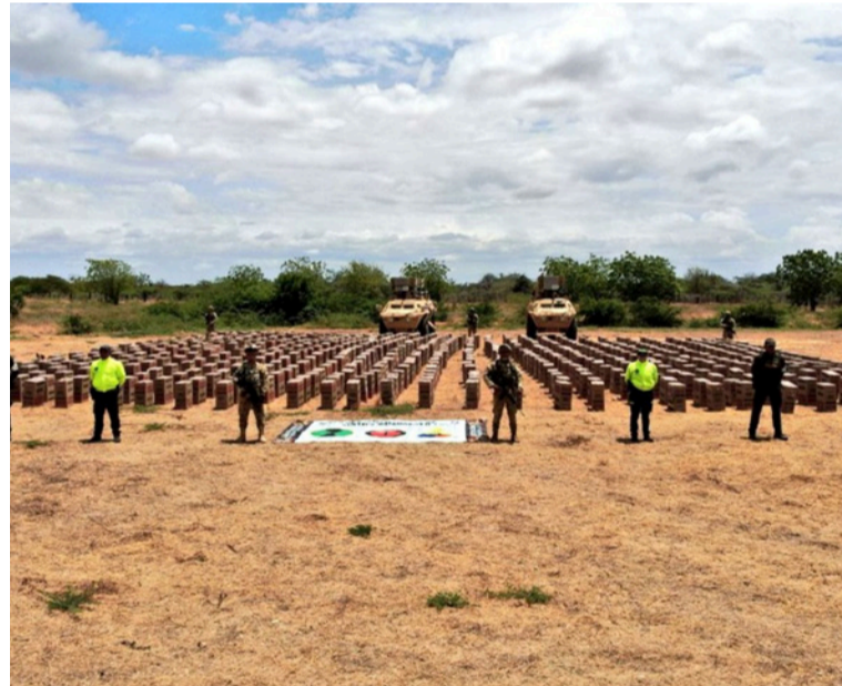
Se informó que el cargamento está valorado en aproximadamente 2.921 millones de pesos.

Las autoridades de policía y aduaneras señalaron que este resultado representa un golpe significativo a las finanzas de las estructuras dedicadas al contrabando en la región.