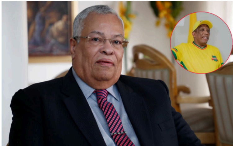
El abogado dijo que la decisión del CNE reafirma el respeto por el Estado de Derecho y normas constitucionales.