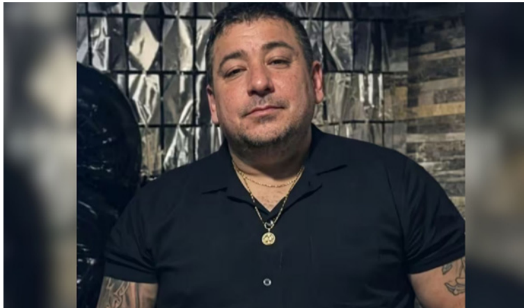
El comerciante fue llevado a un centro asistencial del municipio, donde recibió atención médica.

Tras recuperar su libertad, el comerciante fue llevado a un centro asisten-