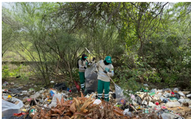
Según la Administración Distrital, este sector venía registrando acumulación constante de desechos.

La intervención se desarrolló en el marco de la estrategia 'Yo limpio, tú limpias', con la participación de más de 100 personas pertenecientes a distintas