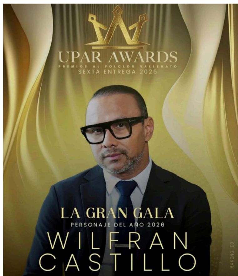
La jornada iniciará con los artistas vallenatos por la alfombra roja, dando paso a una programación musical de lujo.

puntos autorizados como la Alcaldía de Valledupar y la Casa de la Cultura. Esta medida busca garantizar un adecuado control de aforo y una experiencia segura para todos los asistentes.