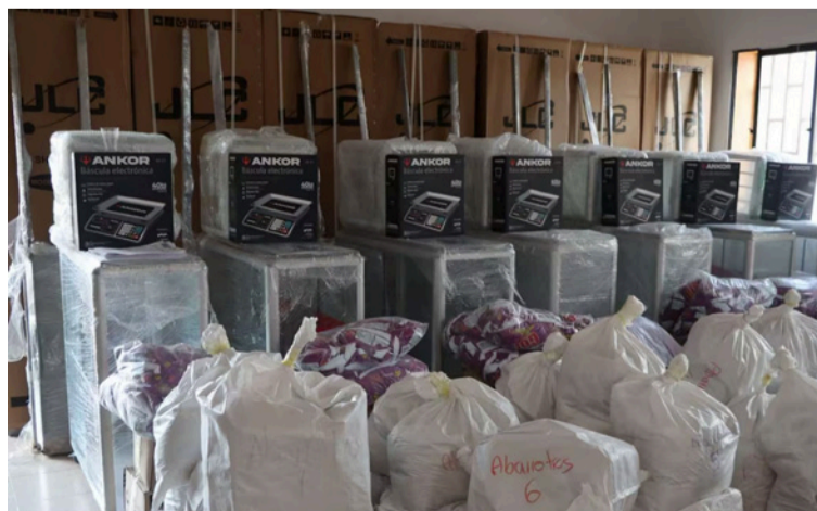
Con este tipo de estrategias, se busca avanzar en la estabilización socioeconómica de las familias beneficiadas.

Los proyectos beneficiados abarcan diferentes