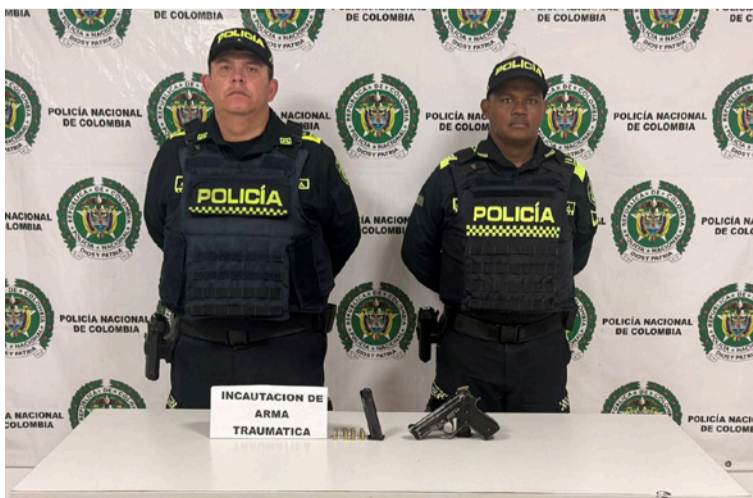
Se informó que el arma fue valorada comercialmente en un millón quinientos mil pesos ($1.500.000).

El arma fue valorada comercialmente en un millón quinientos mil pesos ($1.500.000). El caso quedó a disposición de las autoridades competentes.