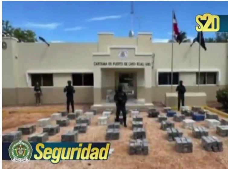
El decomiso representa un duro golpe a redes criminales vinculadas al narcotráfico que operan desde La Guajira.

Según el informe de las autoridades, la droga provenía de la Alta Guajira colombiana, siendo incautada en zona costera de Pedernales, provincia fronteriza suroeste de República Dominicana, en un cargamento que tenía como destino final los Estados Unidos, informó en