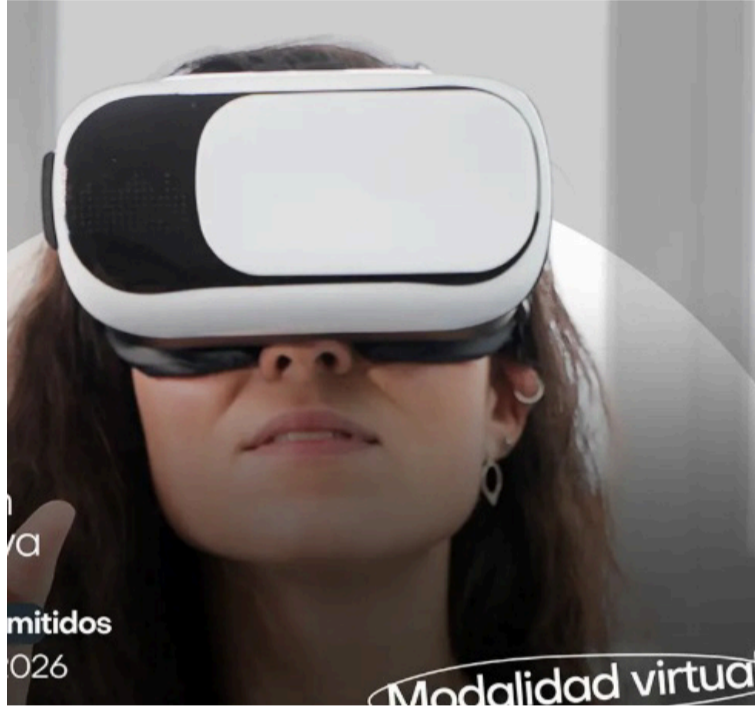
A diferencia de otros cursos técnicos, este programa se centra en la IA como eje de cambio curricular.

A través de 120 horas de formación virtual, los participantes explorarán desde los fundamentos teóricos hasta la creación de proyectos integradores