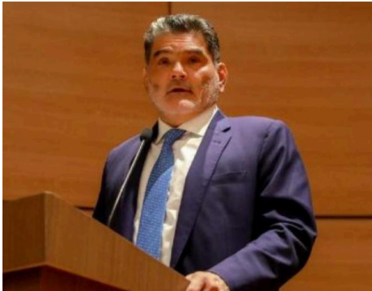
Eljach instó a las autoridades competentes a desplegar acciones contundentes de persecución y castigo.

Exhorta a las autoridades públicas en todos sus