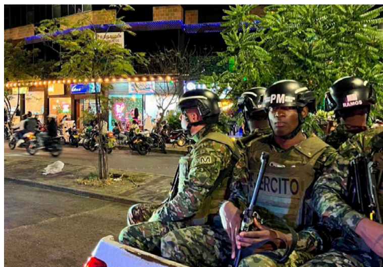
Las acciones buscan ejercer control territorial, disuadir a los terroristas y fortalecer la percepción de seguridad.

Con el objetivo de fortalecer la seguridad y la convivencia ciudadana en Cali, el Gobierno nacional, a través de la Tercera Brigada del Ejército Nacional, adelanta acciones conjuntas con la Policía Metropolitana y la Secretaría de Seguridad de la Alcaldía Distrital, enfocadas en la prevención del delito y la protección de la población civil.