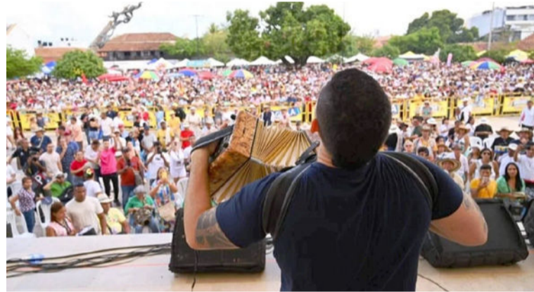
Aunque las boletas no tienen costo, los asistentes deberán reclamar previamente sus entradas en puntos autorizados.

Este homenaje promete despertar emociones