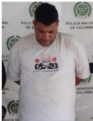
Le fueron incautados 83 gramos de estupefacientes.

El procedimiento tuvo lugar en la carrera 17 con calle 16, en el barrio San Martín, donde uniformados de la patrulla de vigilancia, durante actividades de registro y control,