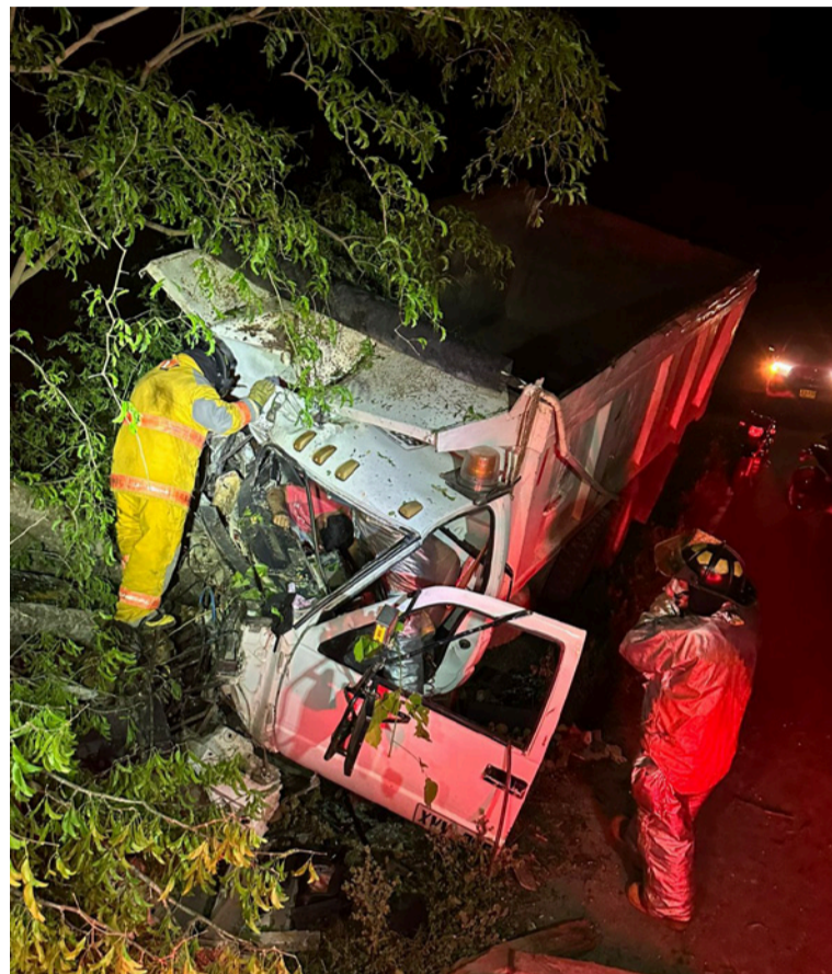
Los organismos de socorro utilizaron herramientas especializadas como gato hidráulico y cizalla hidráulica,

Durante actividades de registro y control