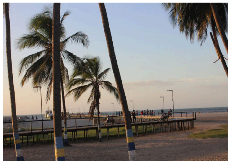
Advierten que La Guajira no es una isla, y vive los mismos fenómenos de seguridad que afectan hoy a todo el país.

con el acompañamiento y la presencia activa del Ejército y la Policía Nacional, por tanto, los circuitos emblemáticos del departamento están siendo monitoreados