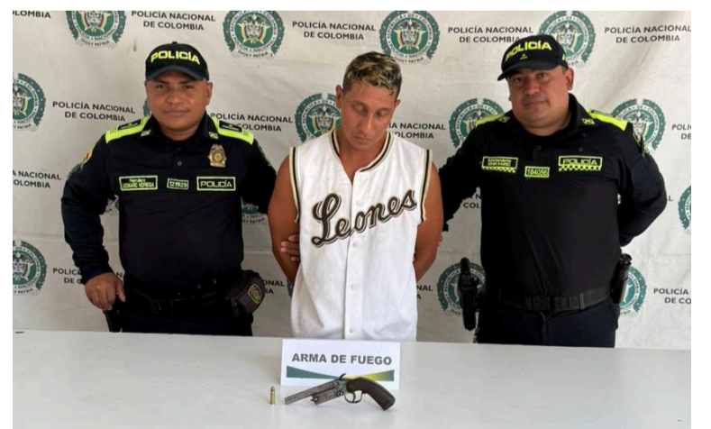
Según la Policía, este individuo presuntamente amenazaba a una persona y portaba un arma de fuego.

El coronel Salomón Bello Reyes, comandante del Departamento de Policía La Guajira, destacó la im-