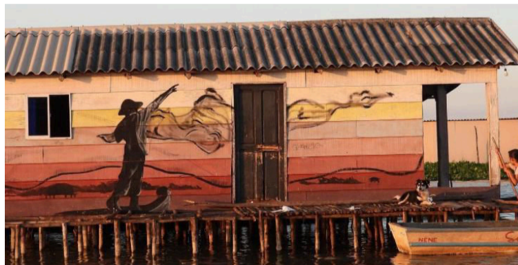
La Procuraduría General reafirma su compromiso con la defensa de la democracia y la transparencia electoral.

El municipio de Sitionuevo cuenta con un censo electoral de 21.839 ciudadanos habilitados para votar, distribuidos en 5 puestos de votación, con un total de 59 mesas. La totalidad de estos puestos y mesas estuvieron bajo vigilancia preventiva del Ministerio Público, a través de los funcionarios de las Comisiones Territoriales de Con-