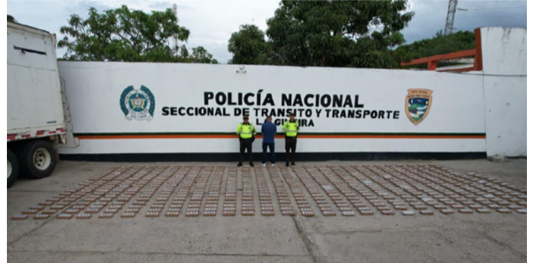
La Policía Nacional informó que en el lugar fue capturado el conductor del vehículo, un hombre de 50 años.

El coronel Salomón Bello Reyes, comandante del Departamento de Policía La Guajira, destacó el operativo. "Este importante golpe al narcotráfico demuestra el compromiso permanente de nuestros hombres y mujeres en la