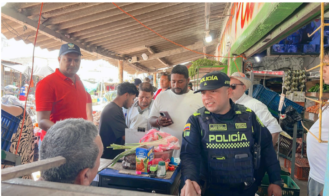
La mesa de trabajo se encuentra en proceso de definición durante esta semana.

Por directrices del alcalde Genaro Redondo Choles, el Gobierno Distrital fortalecerá el acompañamiento al sector productivo, luego de varios hechos ajenos al Distrito que impactaron la dinámica económica de la ciudad.