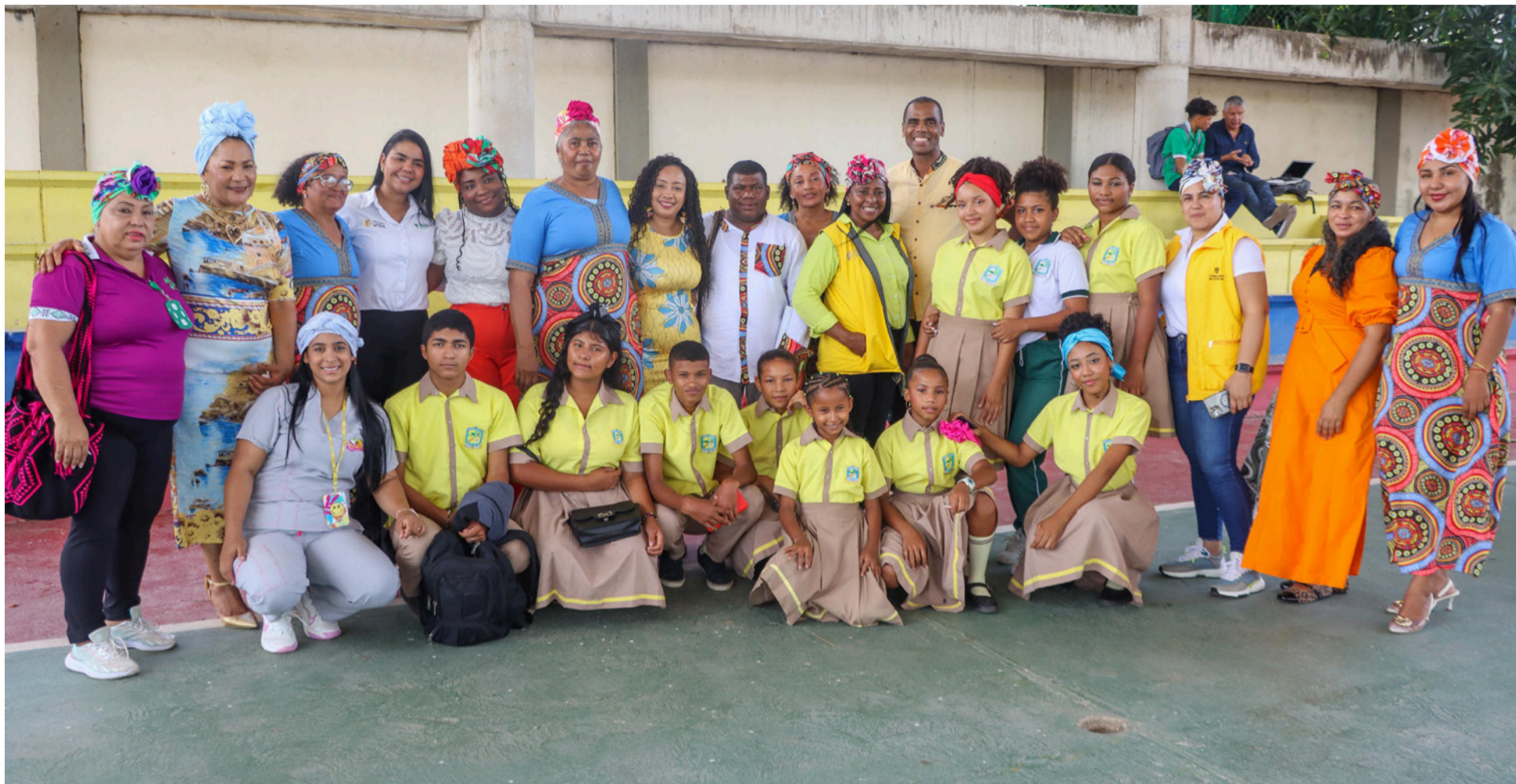
Si el Decreto de la Línea Negra se reexpide sin escuchar a las comunidades afro no estaremos protegiendo el territorio, estaremos fragmentándolo.

Un acto de justicia territorial y epistémica