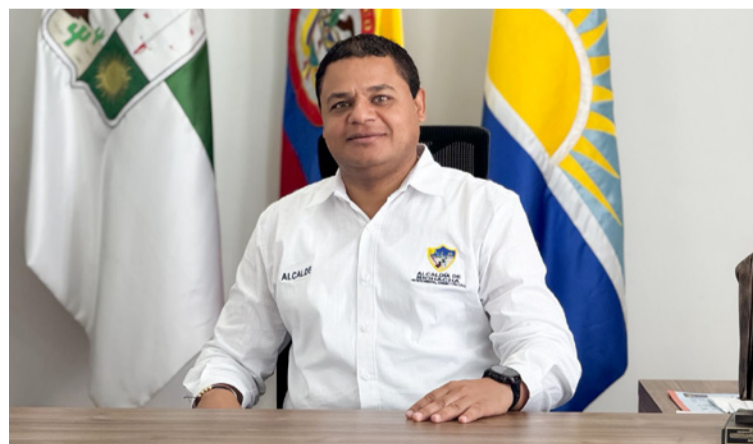
El alcalde hizo un llamado enérgico al comando de Policía y al Ejército Nacional, para que sean más operativos,

Agregó, que la ciudad debe contar con la seguridad necesaria para que los comerciantes sigan trabajando, como también para promocionar al Distrito como un destino de Colombia, pero lo que se está presentando con