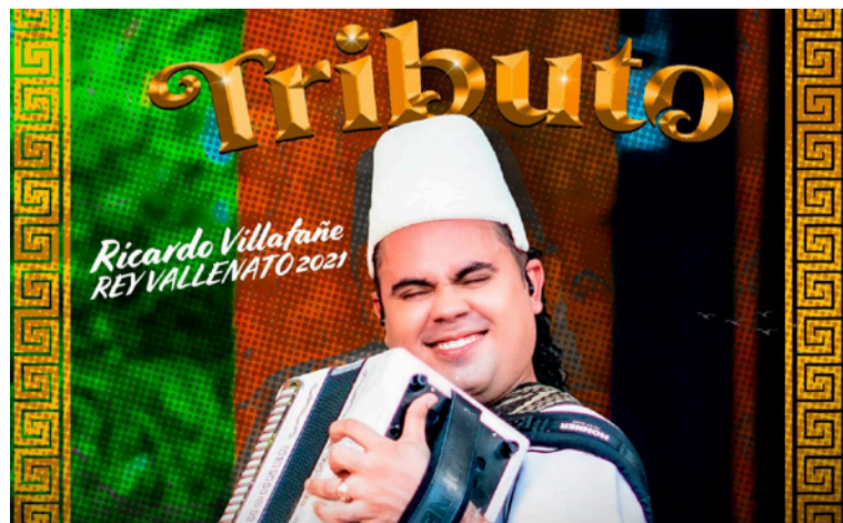
La producción ya se encuentra disponible en su canal oficial de YouTube y en todas las plataformas.

La producción ya se encuentra disponible en su canal oficial de YouTube y en todas las plataformas digitales para calentar motores en la apertura 59 del Festival de la Leyenda Vallenata.