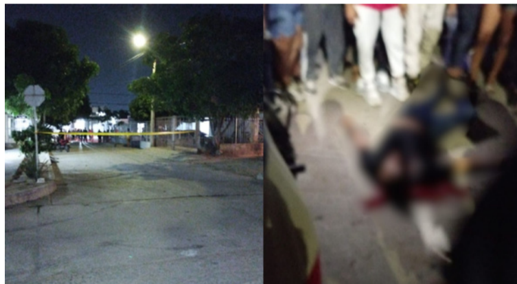
Los dos hechos violentos dejaron como saldo dos personas fallecidas y una más herida.

De acuerdo con el comunicado, el primer caso se presentó en el sector de la avenida Circunvalar, donde un ciudadano de 23 años fue víctima de homicidio luego de ser abordado por un sujeto que se movilizaba en motocicleta, quien le