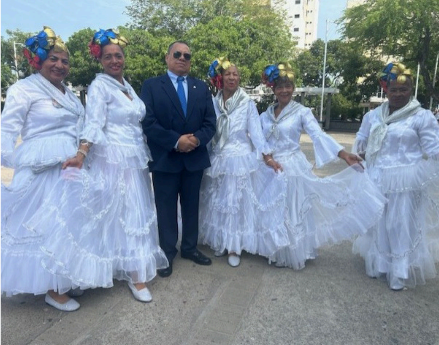
En los escenarios de la violencia todos perdemos, por eso no se debe hacer oportunismo.