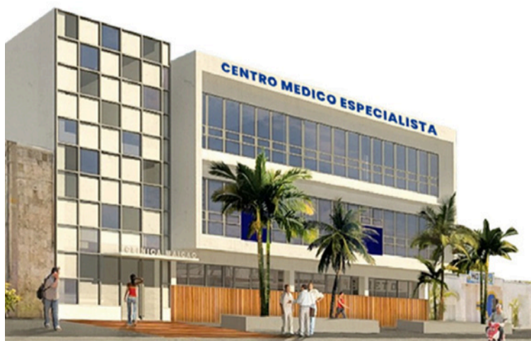
Centro Especializado en Rehabilitación Robótica de La Guajira.

DESTACADO Nuestro propósito sigue intacto: brindar una atención centrada en las personas, basada en la humanización del servicio, el respeto por la diversidad cultural y el compromiso con cada paciente.