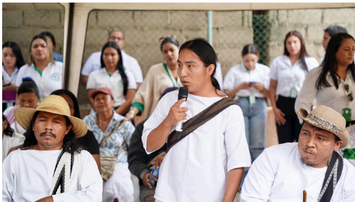
Se busca soluciones concretas a las necesidades históricas de esta comunidad ancestral.