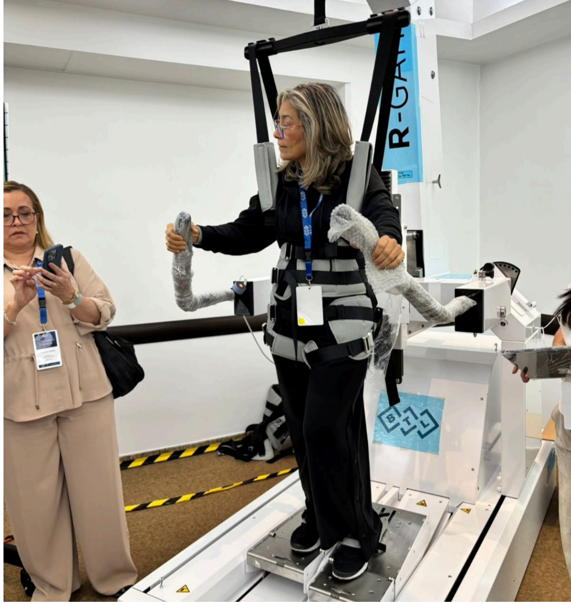
En la Clínica Maicao somos historia, presente y futuro de la salud en La Guajira.

Este crecimiento también proyecta a Maicao como un nuevo punto de referencia en el turismo en salud. La incorporación de