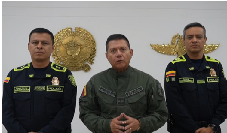
Afirma el general William Rincón Zambrano que no darán tregua a la criminalidad

Como parte de esta respuesta inmediata, fueron incorporados más de 100 uniformados de apoyo y se activaron cinco grupos especializados, con presencia estratégica en 26 puntos priorizados, reforzando el control territorial y la capacidad de reac-