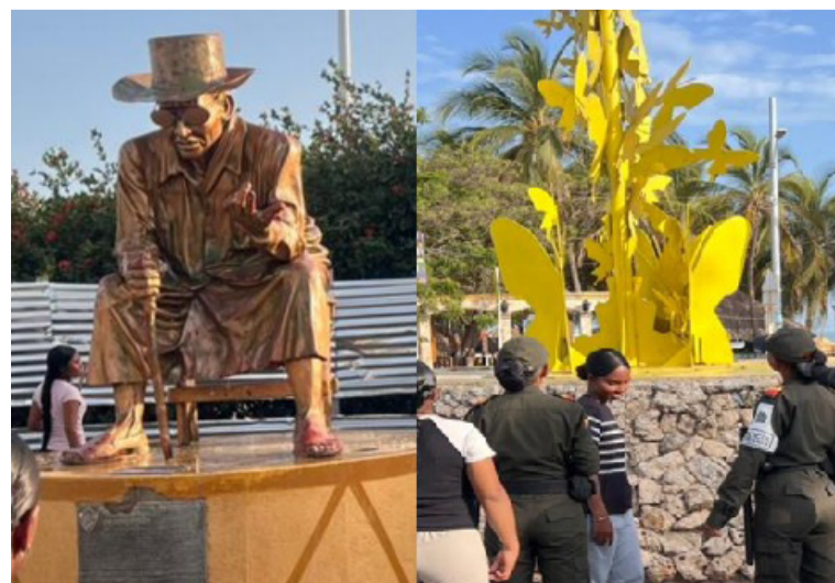
Durante la jornada, uniformados del Grupo de Protección al Turismo intervinieron distintos monumentos.

Estas acciones hacen parte de la campaña 'Quiero mi ciudad', que busca integrar a la ciudadanía y a las instituciones en la protección de los bienes públicos, fomentando una cultura de corresponsabilidad y amor por el territorio.