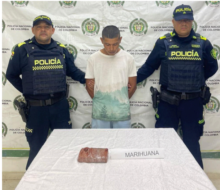
Uniformados le hallaron una sustancia vegetal tipo marihuana, con un peso aproximado de 500 gramos.

y control. Durante el recorrido, los uniformados observaron a un ciudadano que, al notar la presencia