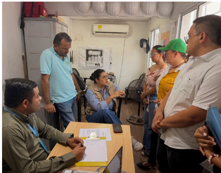
Desde la Personería municipal se anunció el acompañamiento activo durante la jornada.

Durante este encuentro institucional, no solo se definieron aspectos logísticos y operativos de la jornada, sino que además se socializaron los avances de esta significativa obra