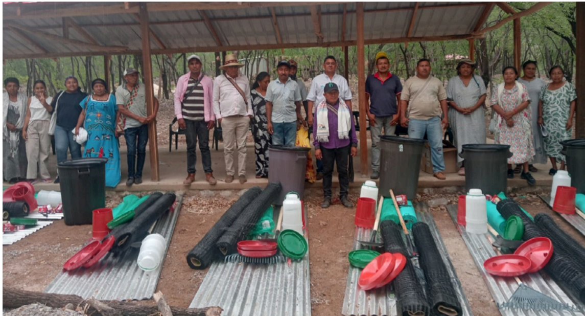
El kit entregado incluye herramientas, gallinas ponedoras, pollos y alimentos.

Todo el proceso cuenta con la supervisión permanente de la Agencia Nacional de Tierras y el acompañamiento técnico de un ingeniero encargado de realizar el seguimiento, con el objetivo de garantizar la correcta