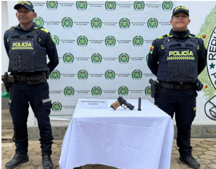
Al ciudadano se le halló una pistola marca Córdoba, con proveedor y nueve cartuchos.

El procedimiento tuvo lugar en la calle 13 con carrera 7F, barrio Centro, cuando uniformados observaron a un ciudadano que adoptó una actitud sospechosa al notar la presencia policial. Durante el registro a persona, se le halló una pistola marca Córdoba, con proveedor y nueve cartuchos.