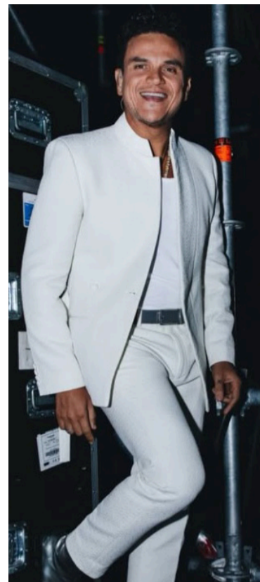
Silvestre Dangond, cantante urumitero.

El artista insistió en que estos anuncios no buscan generar ruido mediático, sino reflejar deseos reales que espera materializar, tal como, según él mismo afirma, ha logrado con la mayoría de sus metas profesionales.