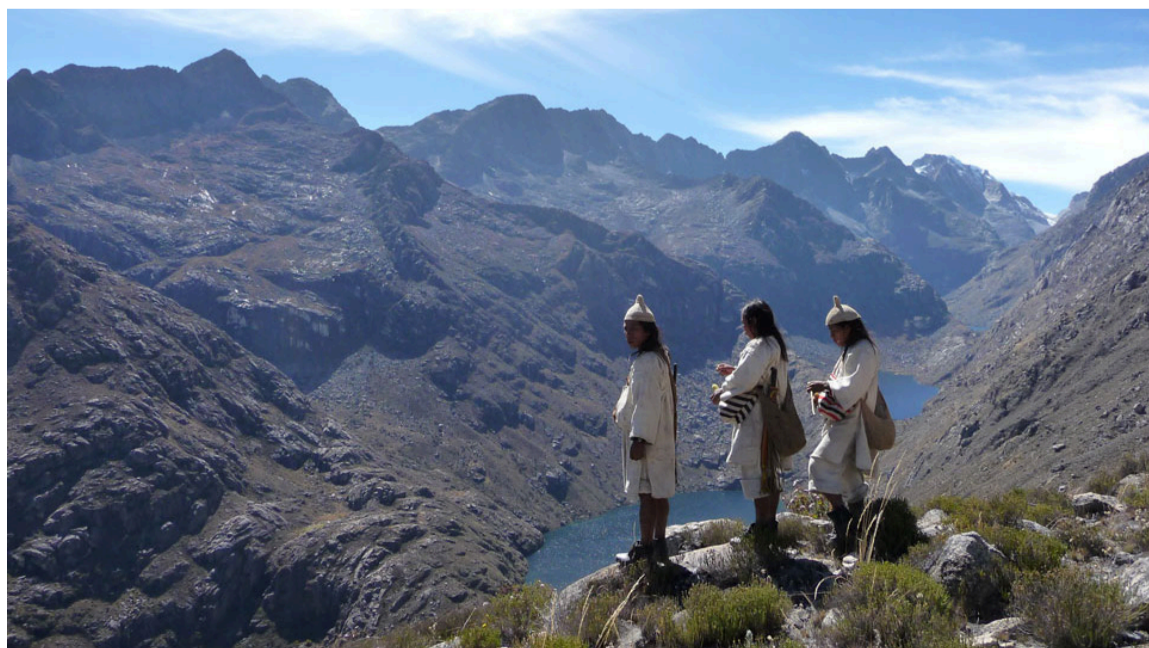
El Estado no puede entender la consulta previa como un acto de validación posterior.

del Decreto no sea solo un trámite legal, sino un ejercicio de memoria viva y de diálogo de saberes. Que en las mesas de consulta previa no solo se escuchen los cantos de los mamos, sino también las voces de los palenqueros, los pescadores de la Ciénaga Grande, las mujeres que siembran en las tierras bajas y los jóvenes que exigen un futuro sin herencia de desplazamiento. Porque en el Caribe colombiano, las líneas que trazamos en el papel solo tendrán legitimidad si, antes, las trazamos con el oído. Escuchar al pueblo afro no es una concesión. Es una condición para que la Línea Negra, en vez de ser un borde de separación, se convierta en un umbral de encuentro.