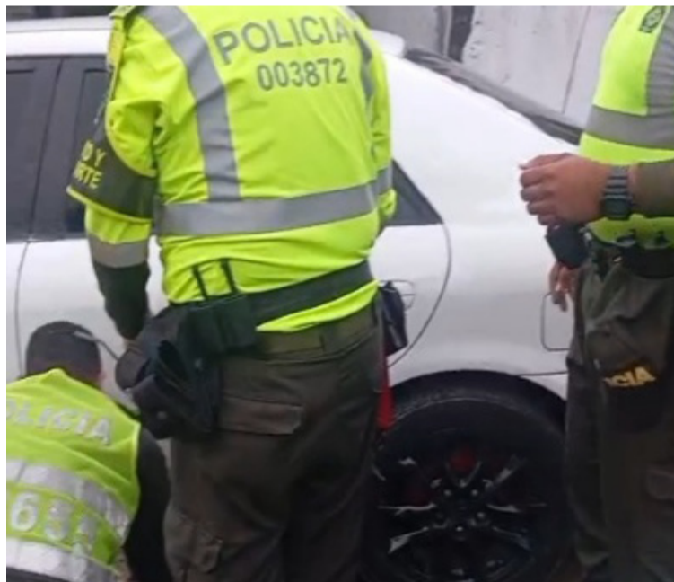
Los uniformados procedieron a la revisión del vehículo, encontrando ocultos los paquetes en bolsas.

DESTACADO El automóvil provenía del sur de La Guajira y, cuando pasaba por el puesto de la Policía en Cuestecita, no se detuvo por lo que los uniformados decidieron perseguirlo.