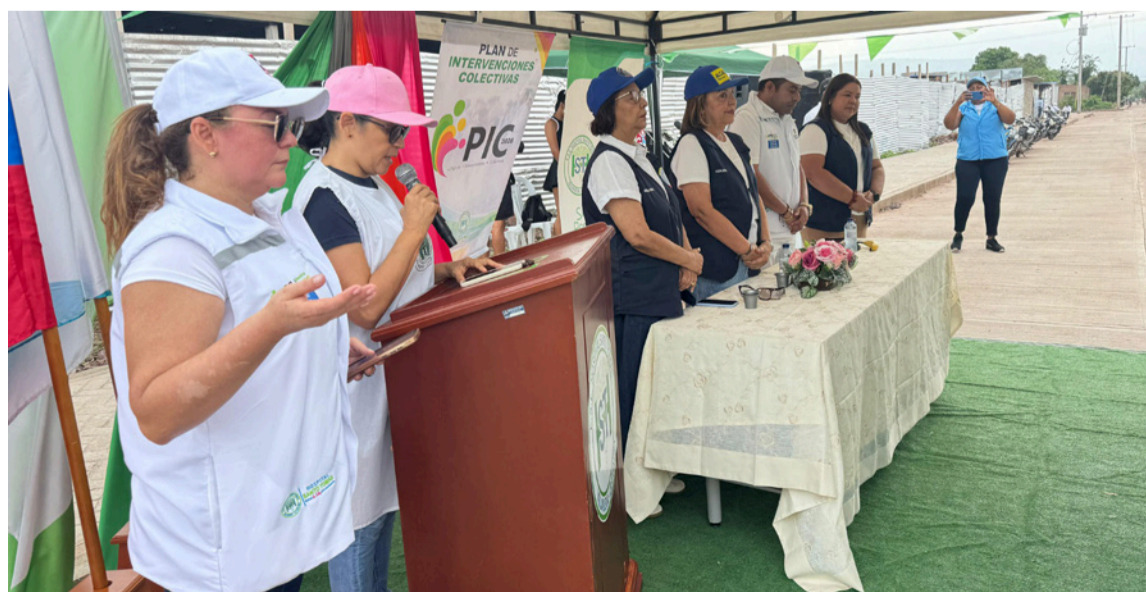
Se trata de una estrategia que busca acercar la oferta institucional a las comunidades.

DESTACADO El Hospital Santo Tomás y las entidades aliadas ratifican su propósito de seguir construyendo un sistema de salud más incluyente, equitativo y al servicio de toda la comunidad.