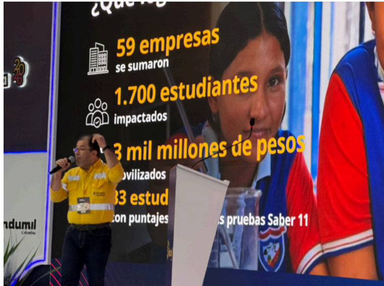
Con esta participación, Cerrejón reafirma que detrás de cada operación hay miles de personas que construyen futuro.

"En Cerrejón creemos en La Guajira, en su gente y en su futuro. Y hay algo que es claro: el carbón ha sido fundamental para