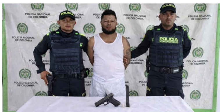
El capturado, un hombre de 31 años de edad, a quien se le halló en su poder una pistola calibre 9 mm.

La Policía Nacional reiteró el llamado a la comunidad para seguir denunciando oportunamente cualquier hecho que afecte la convivencia, recordando que la participación ciudadana es fundamental para consolidar entornos seguros.