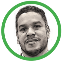
Por Roger Mario Romero