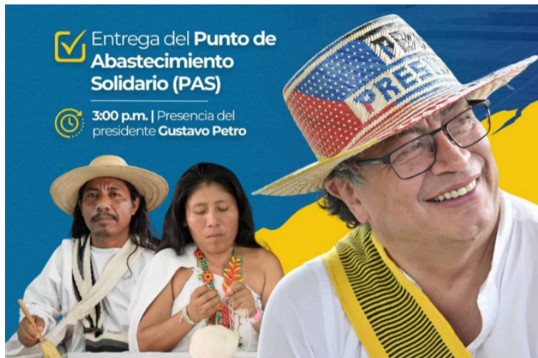
El encuentro se realizará en la Plaza Santander a partir de las 9 de la mañana, apoyado por la Alcaldía.

Estos espacios liderados por Prosperidad Social fortalecen la economía popular y promueven oportunidades para emprendedores, campesinos, tenderos, artesanos, productores y organizaciones comunitarias de la región.