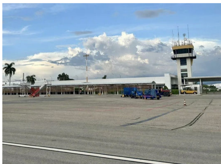
Las cifras ratifican la capacidad del Aeropuerto Alfonso López para atender de manera eficiente la demanda.

La Aeronáutica Civil de Colombia, con base en cifras suministradas por la Oficina de Analítica, proyecta un importante flujo de pasajeros a la ciudad de Valledupar con ocasión del 59° Festival de la Leyenda Vallenata.