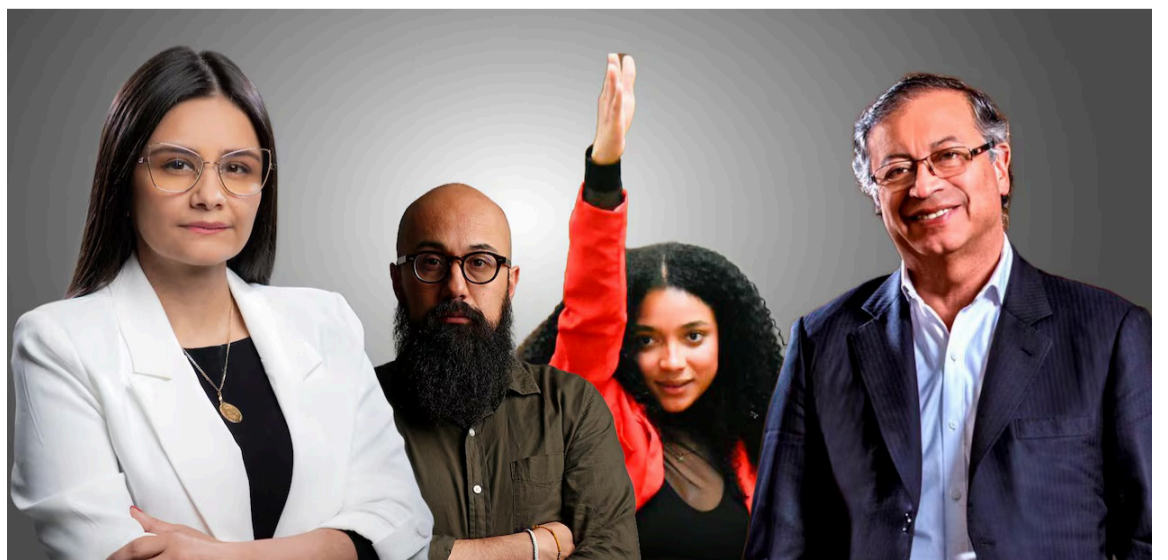
El presidente de la República, si vulnera la Constitución o la Ley debe ser procesado.

Por fortuna, aún queda un dique de contención para sostener la democracia: la Corte Constitucional. El día en que el Gobierno logre cooptar ese tribunal, la democracia colombiana empezará a desaparecer. Cuando el Congreso renuncia a su labor, la Procuraduría calla y la justicia es vista como un estorbo, la democracia no muere por un golpe fulminante, sino por la costumbre del abuso. Ese es el verdadero peligro.