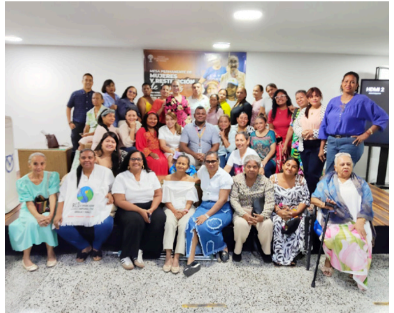
Las participantes compartieron experiencias y fortalecieron herramientas para la defensa de sus derechos.

El funcionario agregó que cumplirle a las víctimas implica generar escenarios de participación, fortalecer el enfoque diferencial de género en cada etapa y articular la oferta del Estado para brindar respuestas concretas.