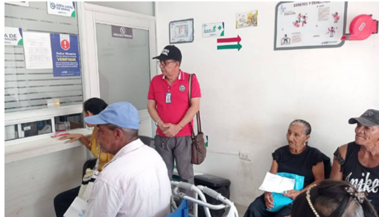
La sala de espera cuenta con una capacidad aproximada para 12 personas, lo que resulta insuficiente.

No obstante, el principal hallazgo de la visita se centra en las limitaciones de infraestructura del dispensario.