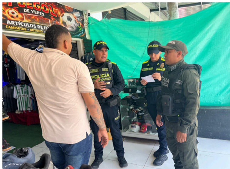
Los uniformados también brindaron orientación sobre cómo identificar modalidades delictivas.

En un trabajo cercano con la comunidad, la Policía Nacional, a través del Grupo de Acción Unificado por la Libertad Personal (Gaula) y la Policía Comunitaria (Polco), desarrolló una jornada de prevención enfocada en proteger a los comerciantes del municipio frente a delitos como la extorsión y el secuestro.