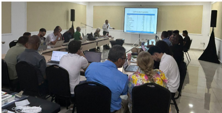
Corpoguajira reafirma su compromiso con la protección del Caribe y la sostenibilidad de La Guajira.