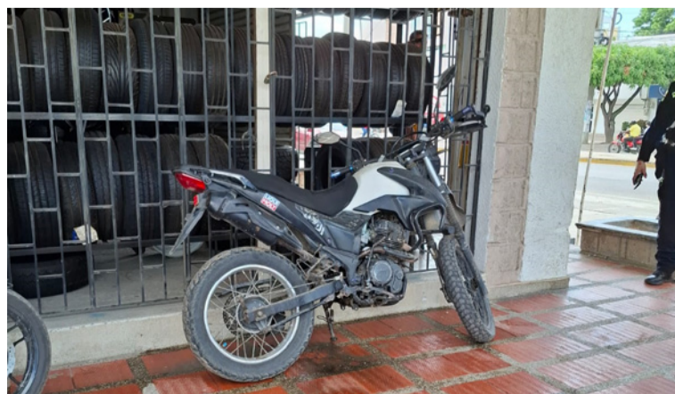
Los sujetos vestidos de buzo negro llegaron hasta el local y dispararon, impactando una motocicleta.

En horas de la tarde de ayer miércoles 29 de abril, se registró un atentado a bala contra un local comercial en la calle 15 con carrera 12A de la Avenida El Progreso de la ciudad de Riohacha, donde dos hombres a bordo de una motocicleta dispararon en varias oportunidades.