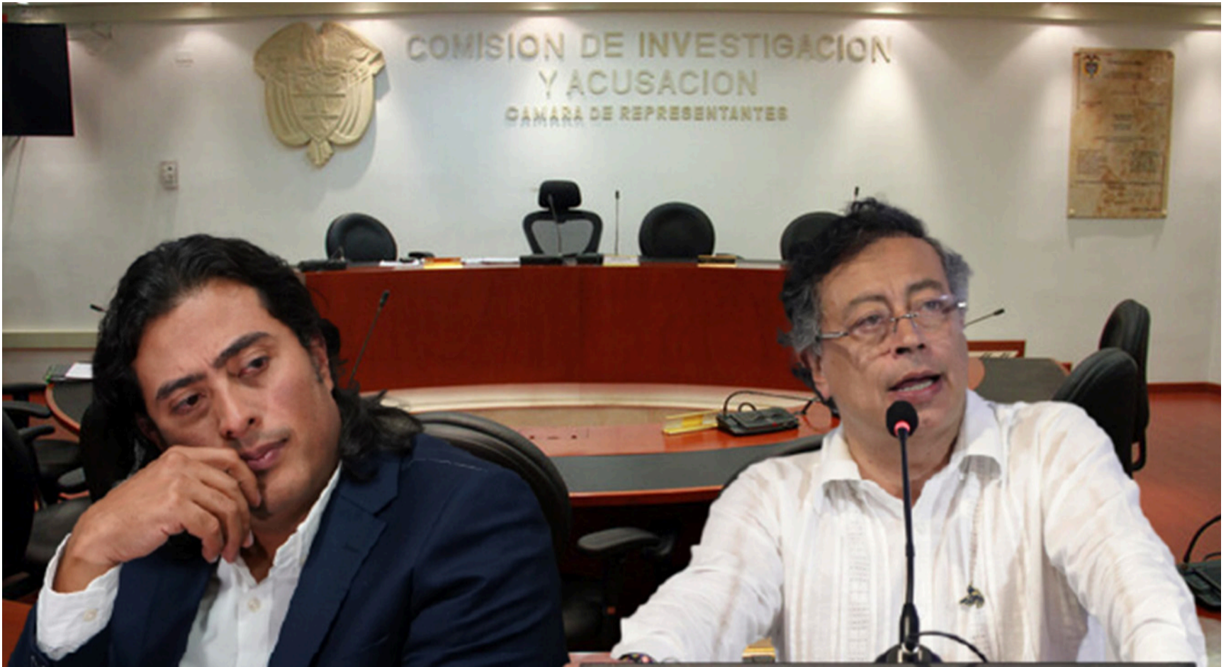
No existió una oposición real que contuviera los abusos de un mandatario al que, en la práctica, se le toleró todo.

Queda un dique de contención para sostener la democracia