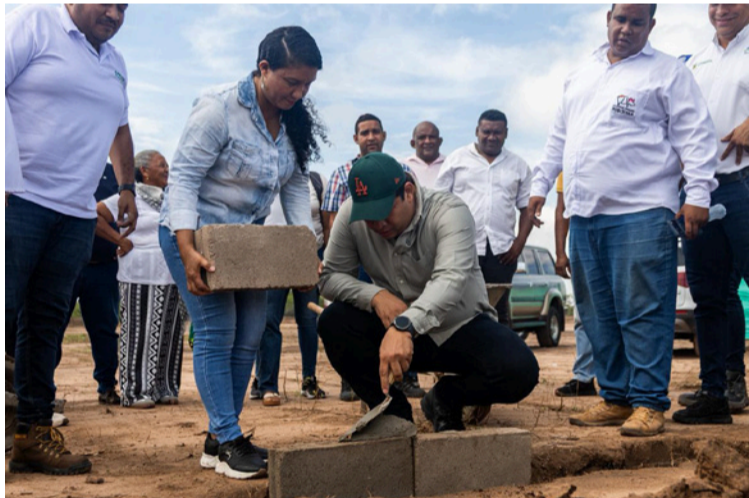
El proyecto por su alcance y capacidad instalada, se perfila como la granja porcícola más grande del Departamento.

mera piedra de esta granja porcícola que se proyecta como la más grande