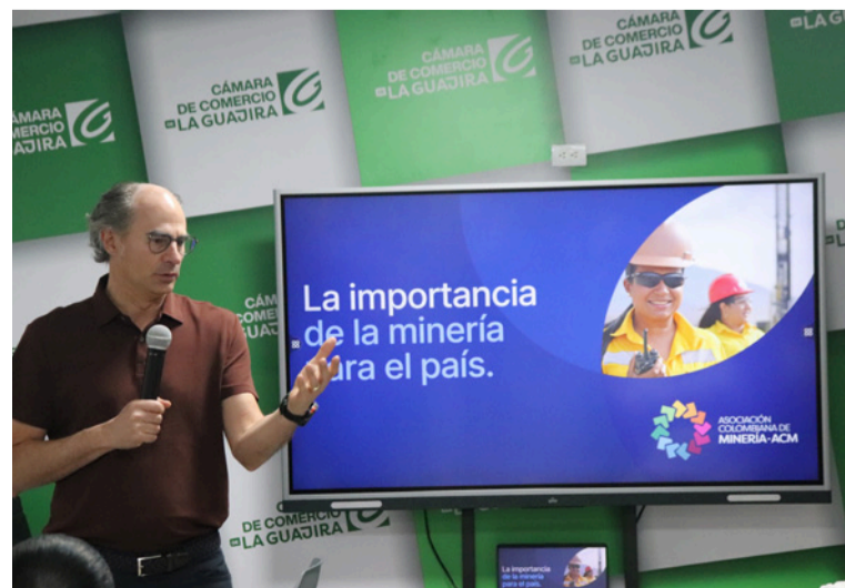
El clúster tendría como propósitos principales articular a los actores de la cadena minero-energética de La Guajira.

El evento incluyó un espacio de participación con los asistentes, quienes compartieron preguntas, reflexiones y propuestas alrededor de este sector tan importante para el desarrollo de La Guajira.