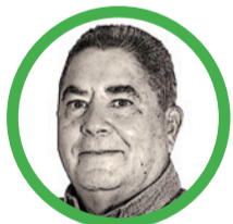
Por Álvaro López Peralta