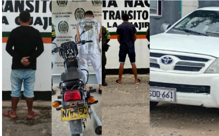
La Seccional de Tránsito y Transporte de la Policía Nacional logró importantes resultados contra el delito.

De igual forma, en la vía Maicao - Paradero, kilómetro 98, fue hallada una camioneta abandonada, valorada en aproximada-