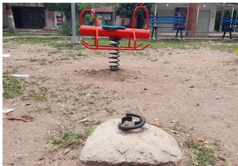
Para la Secretaría de Cultura, los hechos afectan directamente el bienestar de la comunidad.

Preocupación ha generado en distintos sectores del municipio el daño ocasionado por actos vandálicos en varios parques recientemente intervenidos por la Administración Municipal.