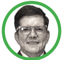
Por Wilson Ruiz Orejuela