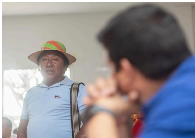
Se definieron mesas técnicas de trabajo para priorizar intervenciones en los ejes de mayor impacto.

De igual manera, durante la jornada los voceros de los pueblos indígenas socializaron el estado actual de sus comunidades frente a necesidades prioritarias en materia de acceso a agua potable, saneamiento básico, cobertura de energía eléctrica, calidad educativa, espa-