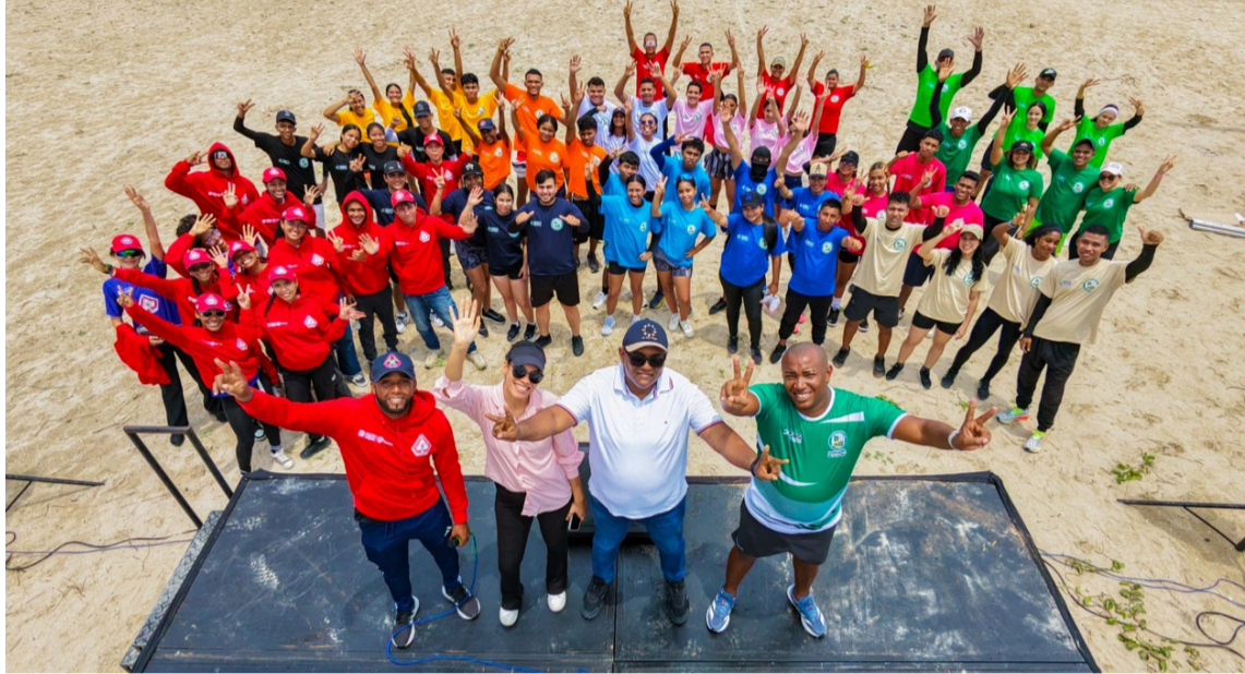
Durante la jornada, los participantes enfrentaron una serie de pruebas tipo desafío.

Durante la jornada, los participantes enfrentaron