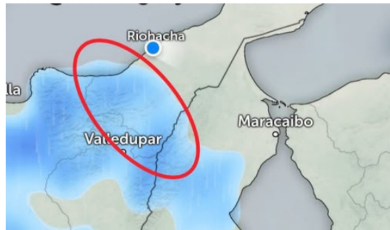
Según el pronóstico, los vientos estarán dentro de rangos normales para esta época.

Se recomienda estar atentos a las actualizaciones de las condiciones meteorológicas a través de los canales oficiales de Meteogujira.