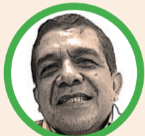
Por Hernán Baquero Bracho