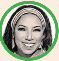
Por Marga Palacio Bruges