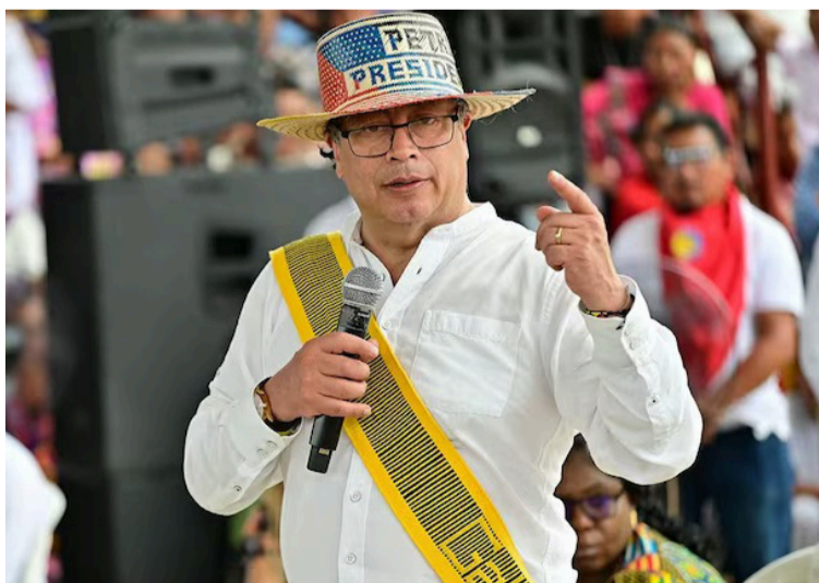
El presidente reconoció que los wayuú son desconfiados porque 'los engañaron con el tema del carbón'.

vez que proyectos nacionales o extranjeros, usando el sol guajiro, vinculan directamente a estas comunidades en este desa-