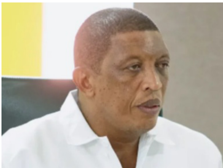
Para el juez, existen elementos razonables que dan cuenta de la posible vulneración de derechos fundamentales.