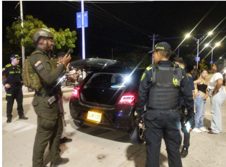
Los uniformados realizan la verificación de antecedentes y documentación de personas y vehículos.

Las acciones vienen ejecutándose con verificación de antecedentes y documentación de personas y vehículos, para prevenir acciones negativas