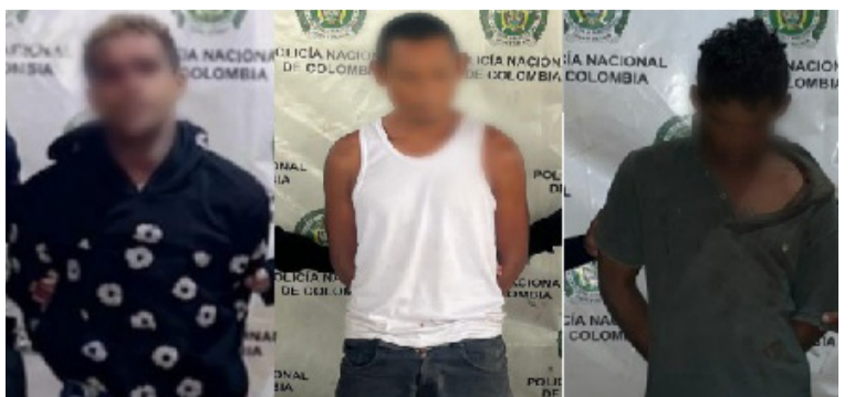
Policía de la Estación Maicao, logró intervenir varios hechos delictivos en diferentes sectores del municipio.