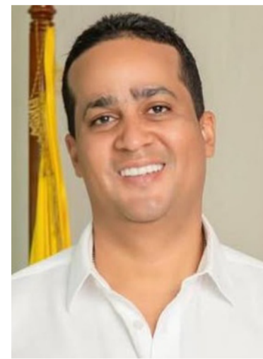
Jairo Aguilar, gobernador de La Guajira.

Los resultados ubican a Aguilar en un grupo destacado de gobernadores de la región, en un ranking que refleja la valoración ciudadana sobre su gestión.