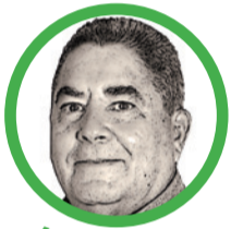
Por Álvaro López Peralta