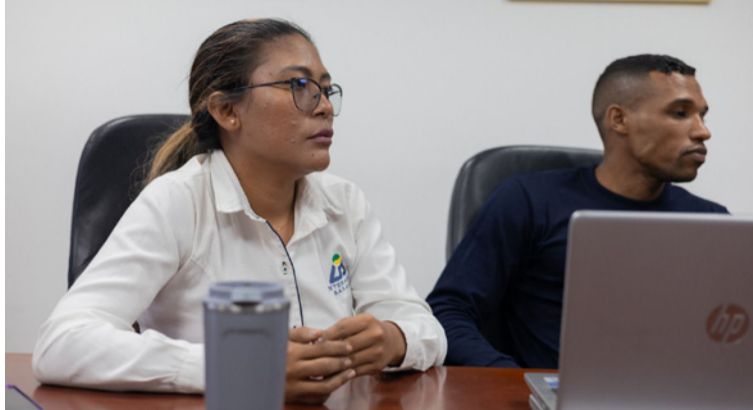
La Corporación reiteró su compromiso de seguir liderando estos espacios de diálogo y planificación.

En este espacio, Interaseo socializó el plan de manejo actual y los procesos que adelanta para