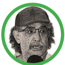
Por Gustavo Múnera Bohórquez