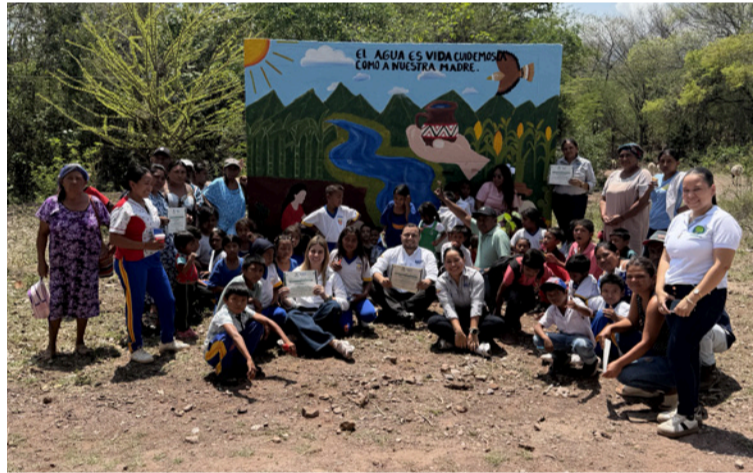
El cierre de la jornada tuvo lugar en el sector El Cerrito, en Barrancas, donde se desarrolló un encuentro comunitario.

En este contexto, la compañía Max Resource se sumó a la agenda como parte de su compromiso con una exploración responsable y del acuerdo de entendimiento que mantiene con la autoridad ambiental. Su participación se desarrolló a través de una serie de actividades académicas,