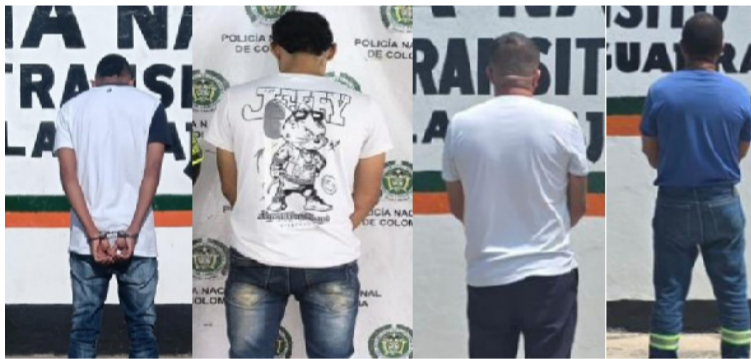
La Policía de La Guajira, destacó que los resultados son producto del trabajo constante de los uniformados en las vías.

En la vía Riohacha - Paraguachón, kilómetro 62,