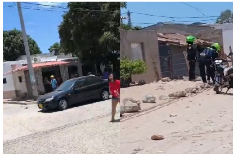
Los ataques armados se registraron en dos tiendas, por el presunto paro armado convocado por las Acsn.

El primer ataque a bala se registró contra una tienda en el barrio Marbella, donde sujetos en moto vestidos de negro llegaron al establecimiento y sin mediar palabra dispararon en varias oportunidades. Tras el ataque huyeron del lugar con rumbo desconocido, causando