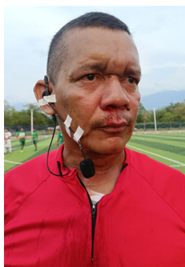
El caso fue llevado hasta la Fiscalía General.

La Gobernación de La Guajira continuará avanzando en estas acciones, garantizando el uso adecuado de la infraestructura institucional y la atención a las comunidades indígenas del Departamento.