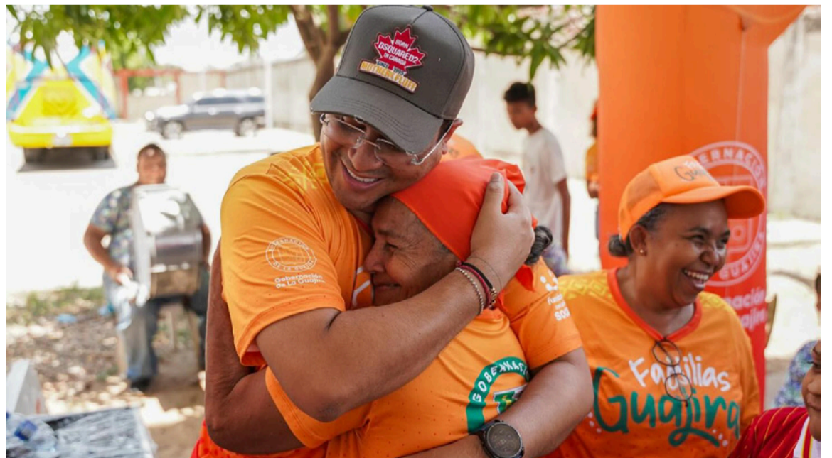
El 'Efecto Jairito' también se explica por una narrativa de cambio generacional.

En conclusión, el 'Efecto Jairito' es una combinación de carisma, gestión eficiente, cumplimiento de promesas y cercanía con la gente. Más que un fenómeno pasajero, se perfila como un modelo de liderazgo que ha logrado reconectar la política con la ciudadanía en La Guajira, marcando un antes y un después en la Administración Pública del Departamento.