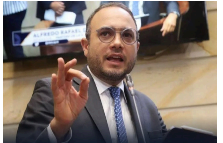
El senador exigió al presidente Gustavo Petro y a las autoridades responsables una reacción inmediata.