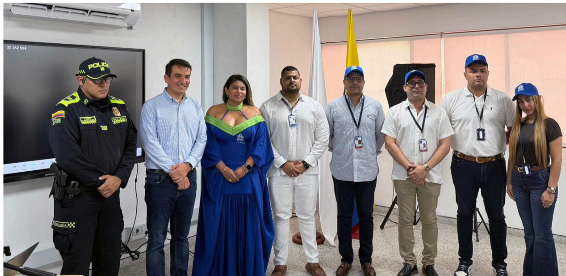
En el nuevo Centro serán atendidos casos como indemnizaciones por daños, entre otros.

En el nuevo Centro serán atendidos casos como indemnizaciones por daños, contaminación auditiva, incumplimientos de acuerdos de pago, cuotas de alimentos, arriendos, riñas, hechos de violencia intrafamiliar, entre otros.