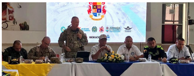
El gobernador Jairo Aguilar Deluque reiteró el compromiso institucional con resultados concretos.

De manera simultánea, el Ejército Nacional, a través de la Décima Brigada y el grupo mecanizado Matamoros, ejecutará el plan “Corredor Seguro Guajira”, enfocado en garantizar la movilidad, proteger a la población civil y asegurar las principales vías del departamento, incluyendo acciones específicas sobre la línea férrea y el fortalecimiento del escuadrón de seguridad vial.