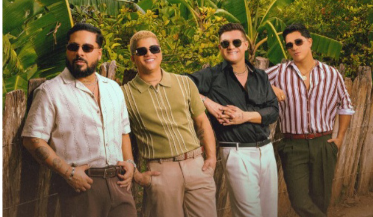
La Banda del 5 reafirma su posición como innovadores de la 'nueva ola'.

Esta cifra marca un cambio radical frente a