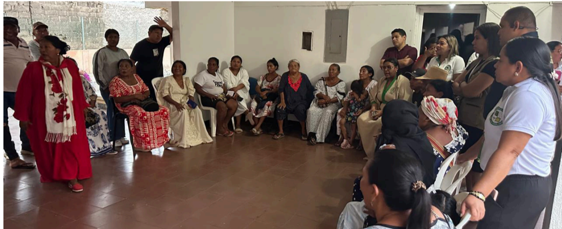
La Secretaría de Asuntos Indígenas lidera el proceso en cumplimiento de sus funciones.

La Secretaría de Asuntos Indígenas lidera este proceso en cumplimiento de sus funciones, con el propósito de ordenar el uso del espacio institucional y garantizar su funcionamiento adecuado.