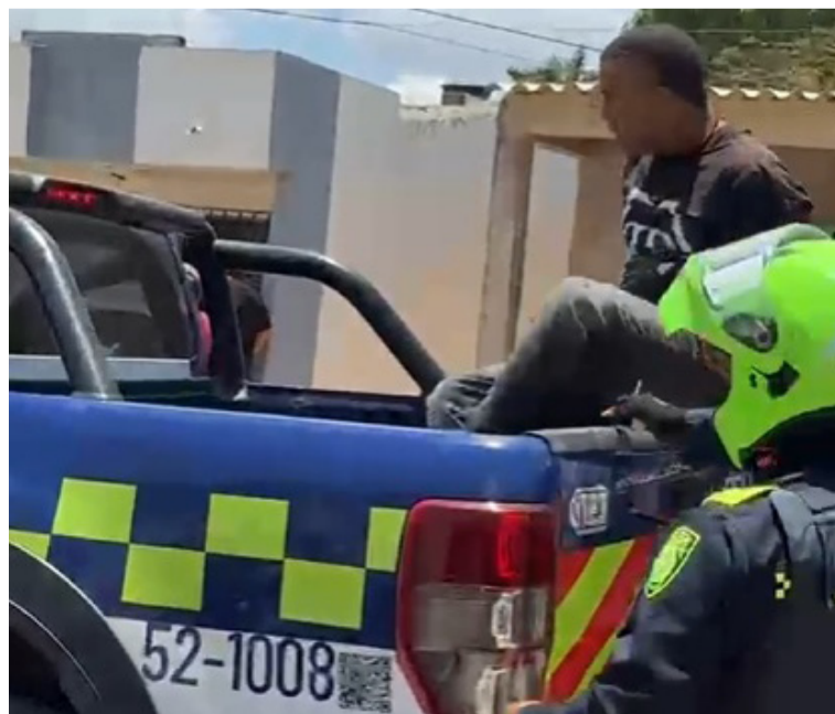
En un plan candado, lograron capturar a uno de los sujetos que estarían disparando contra locales comerciales.