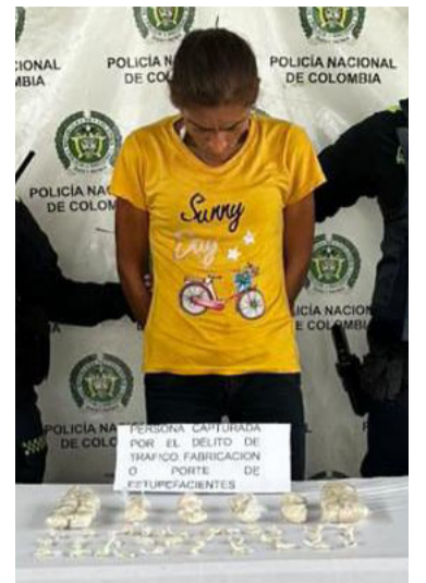
Mujer de 33 años capturada con estupefacientes.

La Policía Nacional continúa fortaleciendo los controles para contrarrestar el tráfico de estupefacientes e invita a la comunidad a denunciar oportunamente cualquier hecho que afecte la seguridad y convivencia ciudadana.