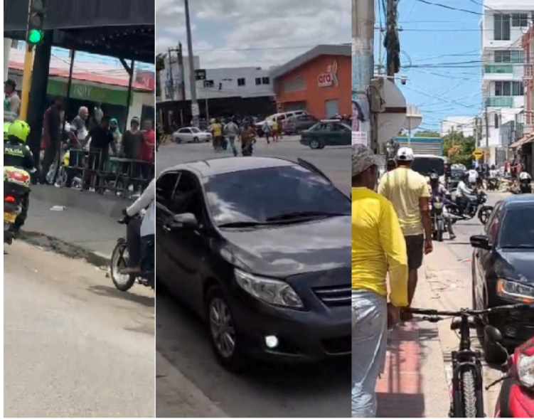
A ambos lugares de los atentados se desplazaron varias unidades de la Policía Nacional, para verificar lo ocurrido.

El primer atentado contra un local se registró en la calle 15 con carrera 26 en la Avenida El Progreso, en el restaurante de razón social 'Calibroster', donde aparentemente sujetos en motocicleta habrían llegado al frente y accionaron un arma de fuego en varias oportunidades.