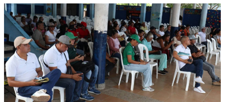
Los trabajadores de la educación se reunieron en la I.E. Almirante Padilla sumándose con firmeza al paro nacional.

La toma a Riohacha por parte de docentes de toda La Guajira fue suspendida debido a la situación de orden público en esta capital.