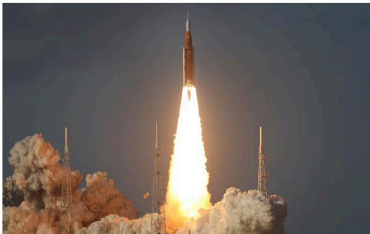
Los resultados obtenidos han inspirado investigaciones en medicina espacial y energías renovables.

Hoy, el legado de Artemis inspira a jóvenes, científicos y visionarios a mirar al cielo con esperanza y determinación; la Luna, que alguna vez fue solo un espejo de nuestra curiosidad, ahora es el puente hacia un futuro compartido, donde el trabajo conjunto y el espíritu de aventura nos acercan, paso a paso, a descubrir nuevos horizontes, el orgullo nacional nuevamente nos hace soñar; las mentes brillantes de regiones como Bogotá, Cali, Cartagena, Caldas, Bucaramanga y Barranquilla; fueron protagonistas silenciosos de una misión que redefine el futuro del mundo, cuarenta mil km/h, 10 días y una muy buena conexión de internet, es la hazaña más grande que el hombre ha realizado, una exploración lunar, que combina; tecnología y ciencia pero, aun en los más alto, sus tripulantes reconocen la grandeza de nuestro Dios; con sentimiento cultural y de pueblo mi opinión para ti.