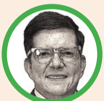
Por Wilson Ruiz Orejuela