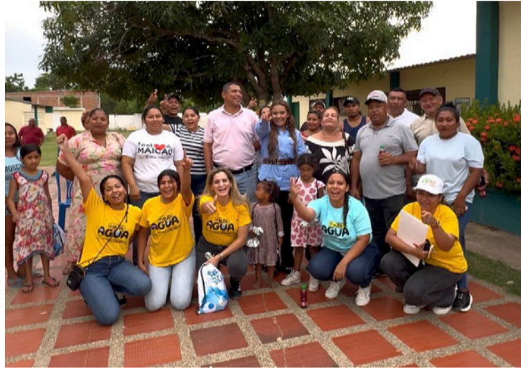
La Gobernación a través de Esepgua, continúa cumpliendo la palabra a las comunidades en agua potable.

Asimismo, se harán obras complementarias como la construcción de una zona administrativa y laboratorio, un tanque de almacenamiento semien-