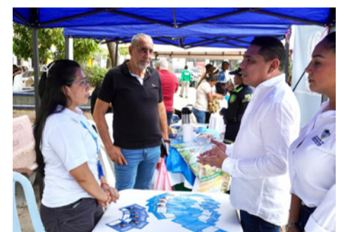
La Alcaldía reafirma su compromiso con la construcción de paz.

Posteriormente, se desarrolló el encuentro “A las plazas por las víctimas” en la Plaza Almirante Padilla, donde la comunidad se