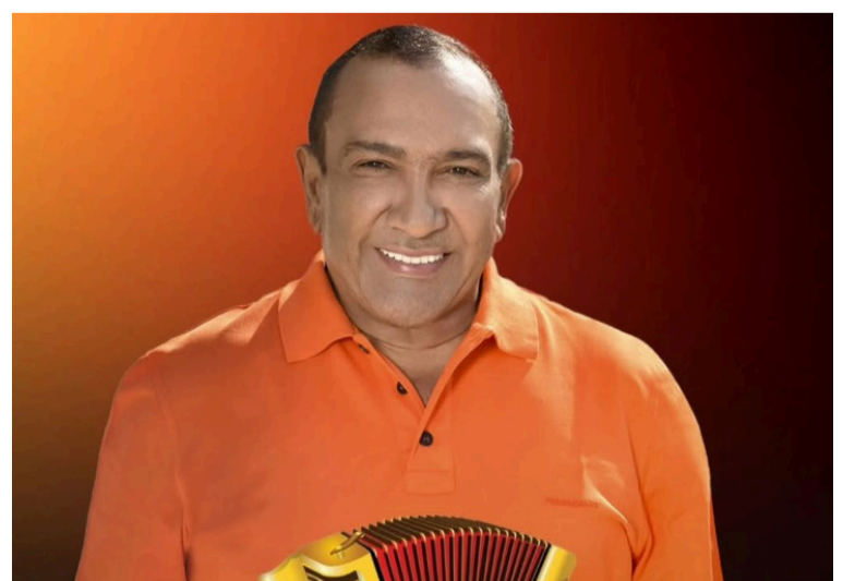
'Beto' Zabaleta anunció en sus redes sociales que se encuentra en la búsqueda de un acordeonero.