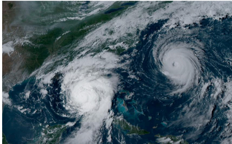
El Caribe está ligeramente más cálido de lo normal, mientras que el Atlántico tropical está más frío.

La principal razón por la que la (CSU) pronostica una temporada de huracanes