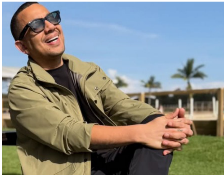
Busca recopilar historias sobre cómo sus canciones han marcado momentos clave en la vida de las personas.

El reconocido cantautor vallenato Felipe Peláez ha sorprendido a su comunidad digital con el anuncio de una iniciativa sin precedentes.