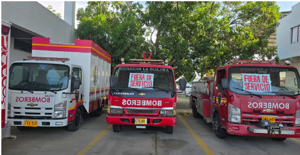
Pese a diálogos con funcionarios de la Alcaldía no ha sido posible la firma del proyecto.

Agregó, que la situación la tiene que definir la alcaldía no el Cuerpo de Bomberos, además que ayer se comprometieron