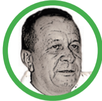
Por Hermes Francisco Daza