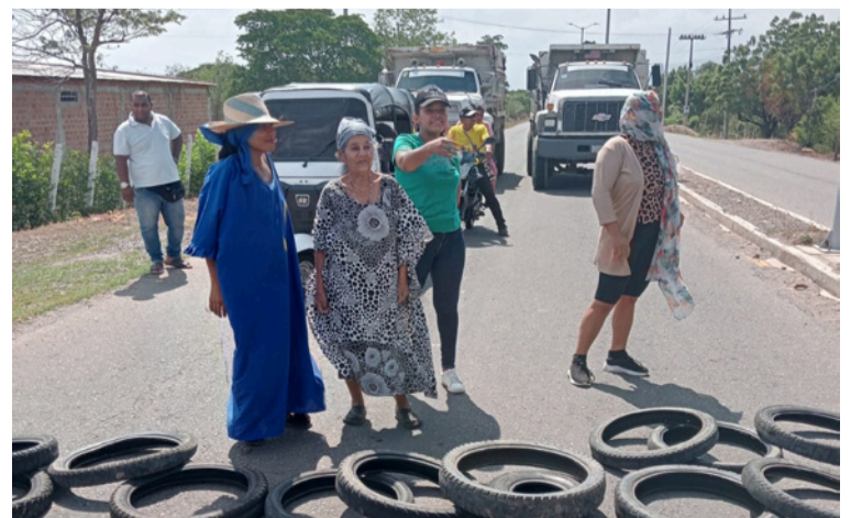
Denuncian que no cuentan con redes eléctricas formales, alumbrado público, alcantarillado, y acueducto.

Según indicó Herrera Carrasquilla, el barrio no cuenta con servicios básicos óptimos como redes eléctricas formales, alumbrado público, alcantarillado, acueducto, pavimentación ni vías de acceso adecuadas, situación que limita la movilidad y aumenta la percepción de inseguridad, especialmente en horas de la noche.