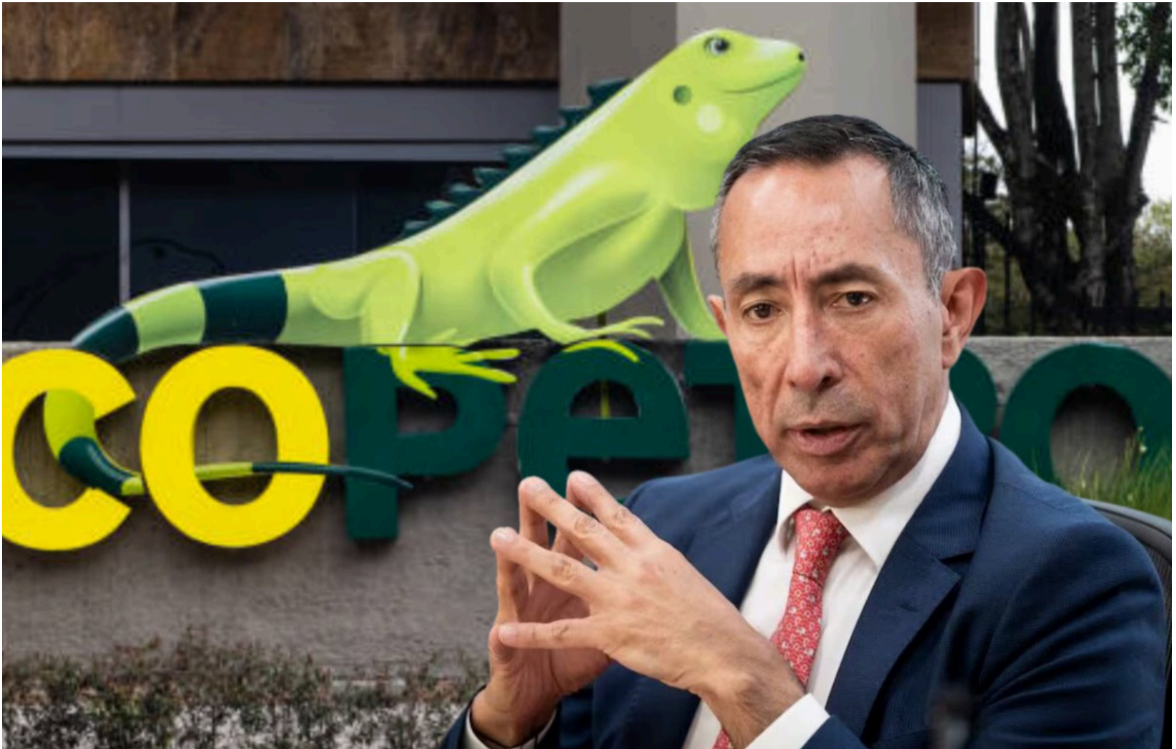
La Presidencia de Ecopetrol no es una responsabilidad para él. Es una coraza. Se usa cuando sirve, se abandona cuando aprieta.

Esta clase política colombiana es adicta