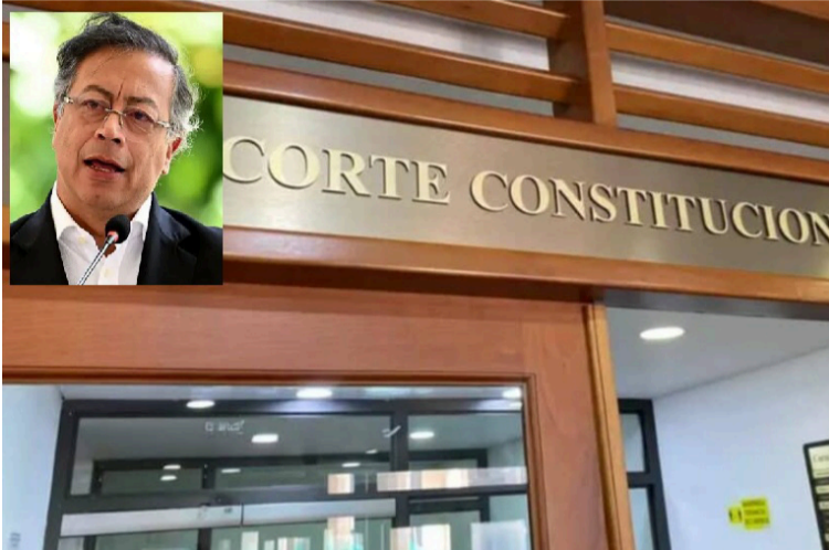
El pronunciamiento, pone un alto a las disposiciones fiscales impulsadas bajo el amparo de una emergencia.

Con una votación de 6-2, la Sala Plena del alto tribunal anuló el Decreto Legislativo 1390 del 22 de diciembre de 2025, el cual declara el Estado de Emergencia Económica, Social y Ecológica en todo el país. La decisión implica que la medida excepcio-