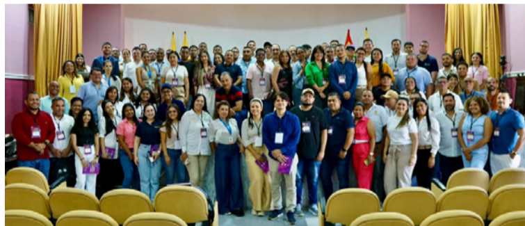
MinTIC impulsa la adopción de herramientas digitales que fortalezcan la prestación de servicios a la ciudadanía.

En la jornada estuvieron representantes de 50