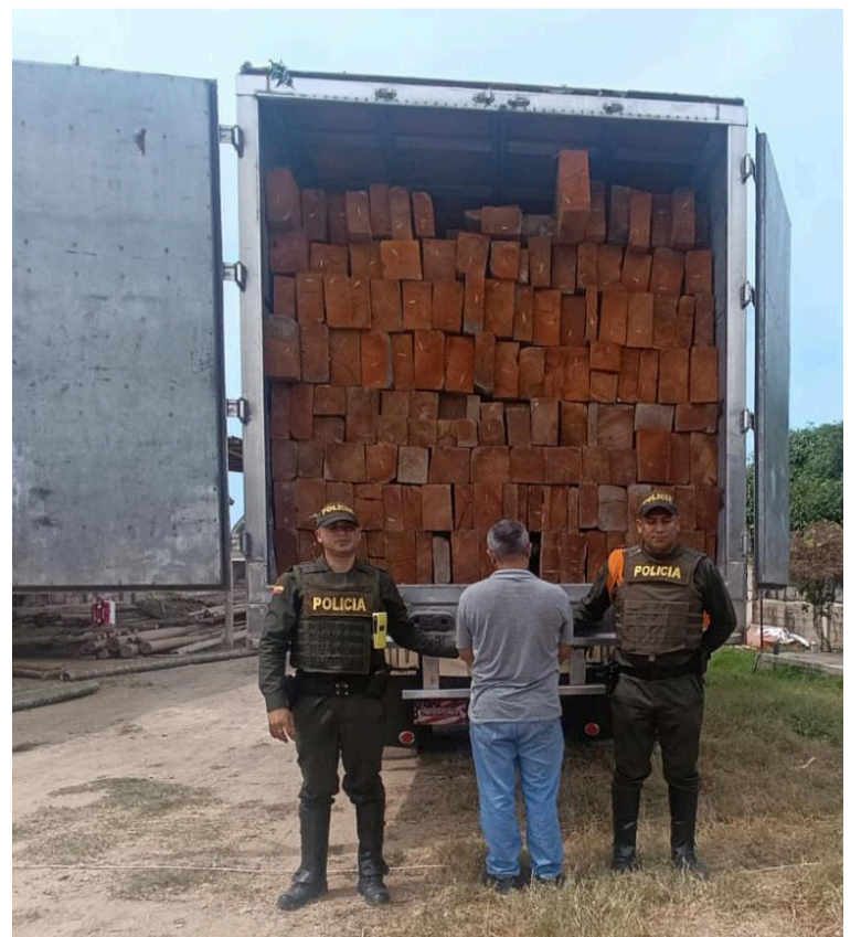
Tanto el capturado como el automotor fueron dejados a disposición de la Fiscalía General de la Nación.

DESTACADO La Policía Nacional evidenció que el conductor no contaba con la documentación que acreditara la legalidad del recurso forestal ni con los permisos exigidos por la autoridad ambiental.