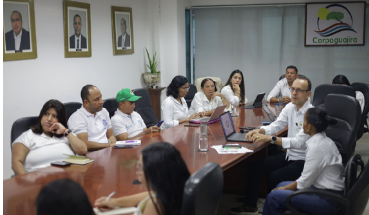
Se presentaron los lineamientos técnicos y los determinantes ambientales para la identificación de estas áreas.

La Corporación Autónoma Regional de La Guajira y la Mesa Más La Guajira lideraron una jornada de socialización con las alcaldías municipales, con el fin de orientar la implementación de las 'Áreas de Vida', en el marco de la Ley 2173 de 2021 y su reglamentación median-