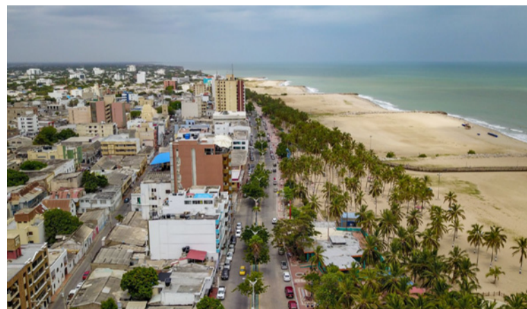
La riqueza histórica de Riohacha que seduce por sus bonitos paisajes, y el valor de su arquitectura colonial.

La riqueza histórica de una ciudad que seduce por sus bonitos paisajes, el incommensurable valor de su arquitectura colonial y toda una amalgama sociocultural de profundas raíces, también son dibujados en 'Mi Rio-