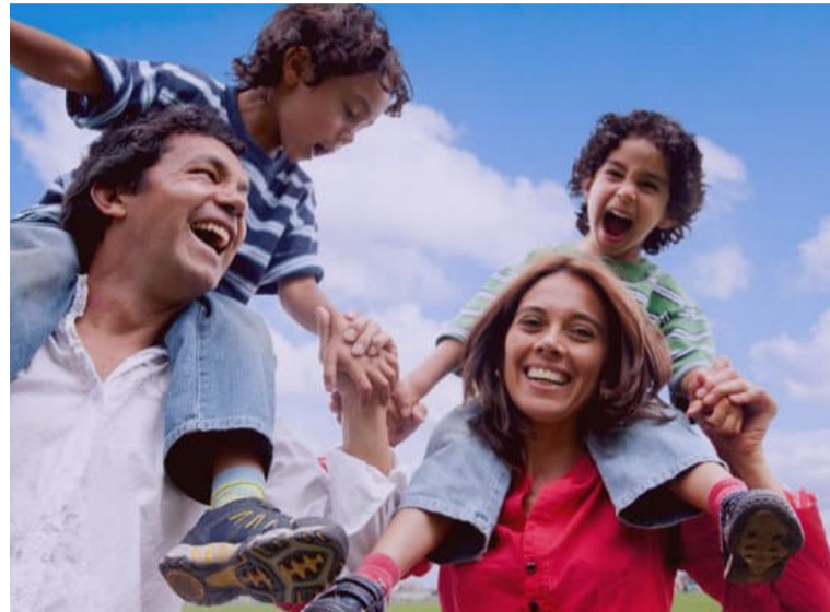
El objetivo central es desglosar cómo las decisiones judiciales han transformado el concepto tradicional de familia.

La invitación se extiende a profesionales de diversas áreas interesados en comprender cómo el sistema legal responde a la realidad social, asegurando que la normativa no se convierta en un obstáculo, sino en un puente para la equidad y la justicia social en el siglo XXI.