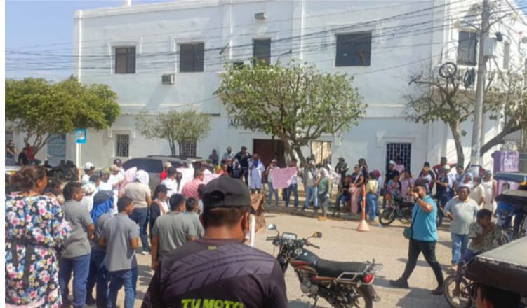
Según lo denunciado por los comerciantes, ellos están siendo víctimas de la delincuencia común y organizada.

Según lo denunciado por los comerciantes, ellos están siendo víctimas de la delincuencia común y organizada que opera en La Guajira y, en espe-