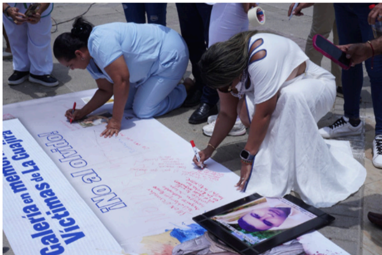
Las víctimas en La Guajira han sido atendidas a través de las mesas que han venido trabajando.