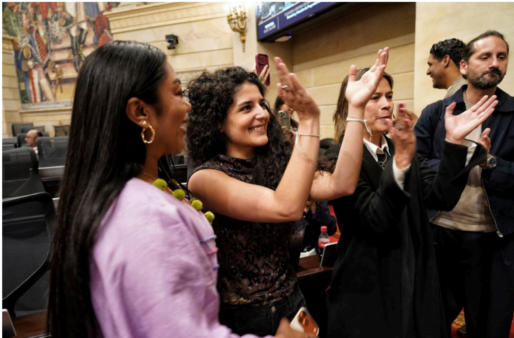
La plenaria de la Cámara aprobó por unanimidad el Proyecto de Fortalecimiento a la Ley General de Cultural.

E ste proyecto fortalece la Ley General de Cultura en cuatro ejes: significación del sector cultural, gobernanza y espacios de participación, fortalecimiento sectorial e intersectorial, y financiación y estímulos.