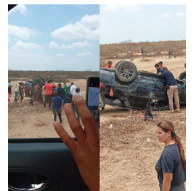
El volcamiento del vehículo dejó dos heridos.

Con ayuda de los conductores lograron mover el vehículo y colocarlo sobre la vía para que el conductor pudiera movilizarlo de