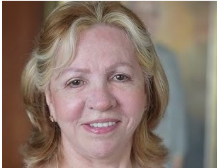
La decisión implica la inscripción formal de Gette ante el MinEducación y un proceso de transición interna.

DESTACADO El juez II penal municipal, Néstor Segundo Primera también restableció los estatutos, el Consejo Directivo y la Sala General vigentes hace más de una década (2013).