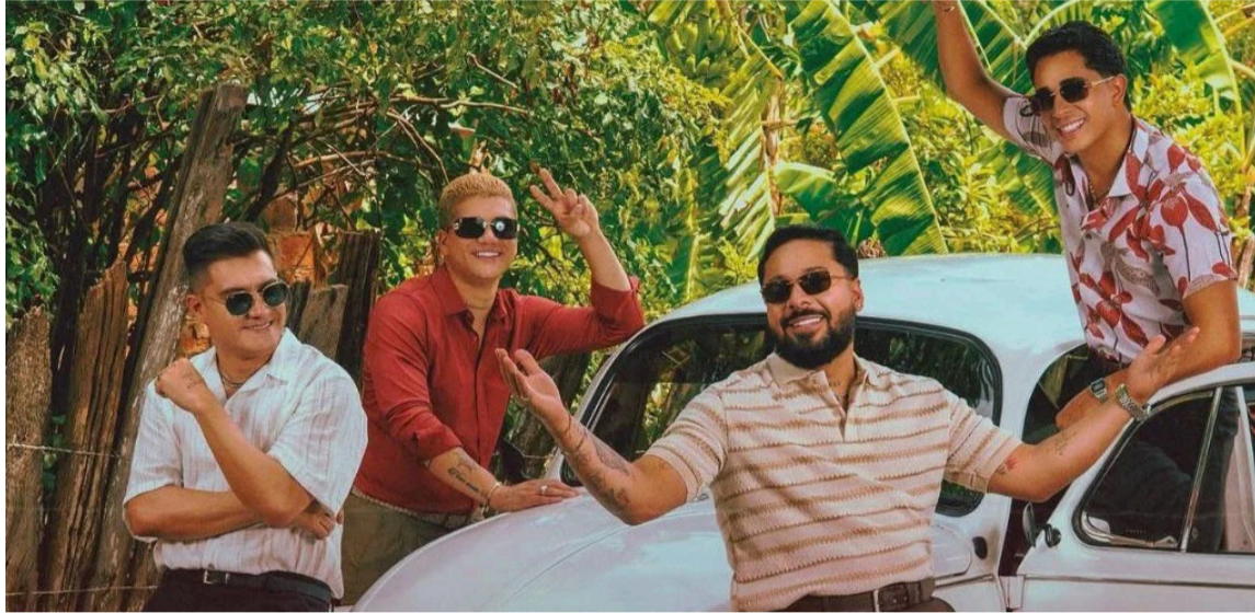
Con 'Vallenato', la Banda abre una etapa que promete reafirmar su identidad musical.

El texto compartido por la agrupación no pasó