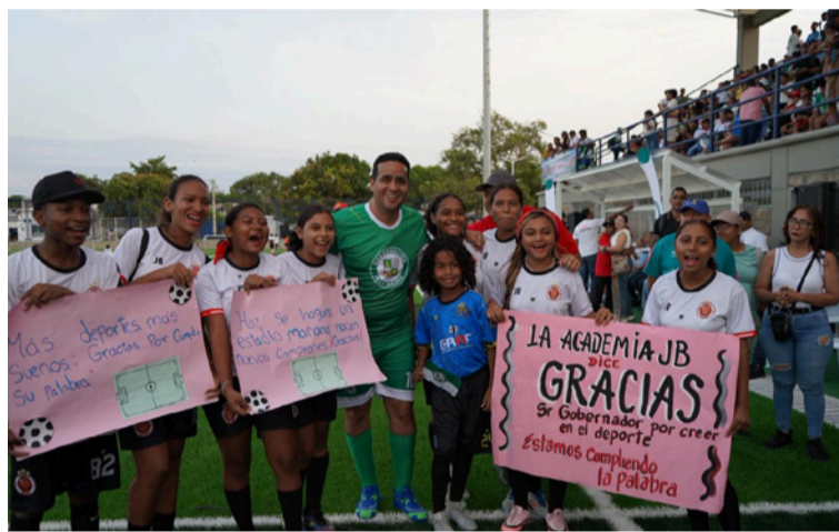
Durante el acto inaugural se disputó un partido simbólico, entre el equipo de la Gobernación y habitantes del barrio.

Con una inversión superior a 6.000 millones de pesos, el estadio El Salaito fue intervenido integralmente para brindar condiciones dignas a los deportistas y a la comunidad. El proyecto inició durante el actual manda-