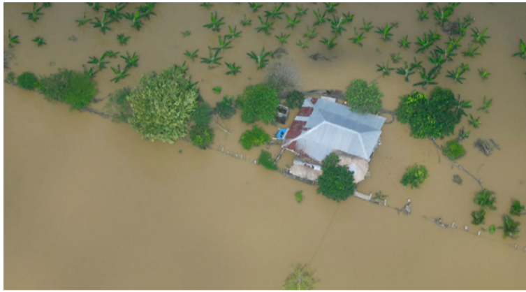
El programa apoyará a pequeños productores, asociaciones campesinas y organizaciones rurales.

El programa, que estará vigente a partir del 7 de abril, movilizará hasta 2 billones de pesos en créditos de redescuento en las zonas afectadas, junto con 153.000 millones de