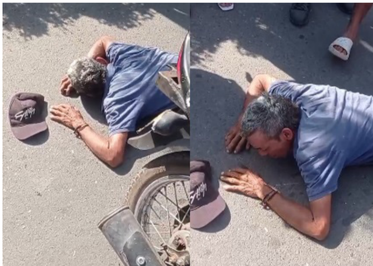
Testigos manifestaron que el adulto mayor sufrió varios golpes de consideración producto del fuerte choque.

Posteriormente, el lesionado fue auxiliado y trasladado de inmediato al área de urgencias del Hospital Santo Tomás de