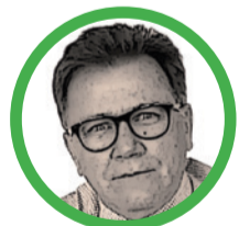
Por Indalecio Dangond @indadangond

La jornada electoral dejó más preguntas que certezas. Como suele ocurrir en Colombia, los números hablaron más que los discursos. Y el primer dato es demoledor: solo votó la mitad del país. De 41 millones de ciudadanos habilitados, apenas 21 millones acudieron a las urnas. Ese vacío electoral no es anecdótico: de-