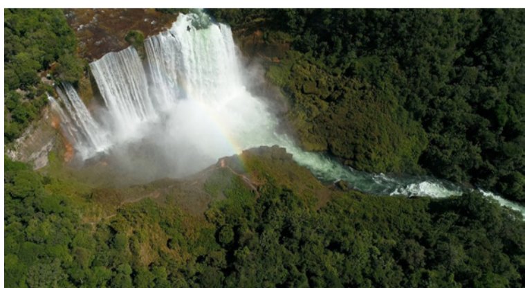
El retroceso de los glaciares de la sierra y las alteraciones en su sistema hídrico no son metáforas ecológicas.

D espués de recorrer en estas páginas el crecimiento de la economía global, los cambios que ha producido en los ecosistemas y la forma en que esos cambios empiezan a hacerse visibles en el territorio, la conclusión empieza a imponerse con cierta claridad: el mundo atraviesa una crisis que ya no puede describirse únicamente como ambiental. Durante mucho tiempo el deterioro ecológico fue tratado como un problema parcial. Algo que podía corregirse con mejores tecnologías o con regulaciones más estrictas. Pero los datos científicos acumulados en las últimas décadas cuentan otra historia. La actividad humana ha alcanzado una escala capaz de alterar procesos fundamentales del sistema Tierra: el clima, la biodiversidad, los ciclos del agua, los suelos de los