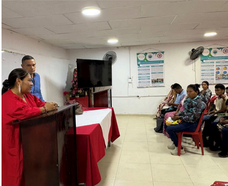
Se han capacitado 140 recolectores de información, y se prevé llegar a las 470 comunidades.

La capacitación tuvo como objetivo principal instruir a los 50 delegados seleccionados por las autoridades indígenas wayuu con la herramienta RIT (Registro de Información Territorial), necesaria para iniciar el proceso de recolección de información sobre los listados censales de las comuni-