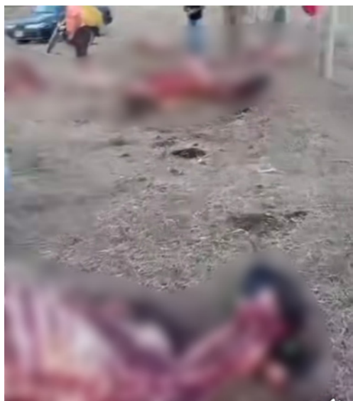
Este tipo de situaciones ha venido afectando la economía y la producción agropecuaria de la región.

En horas de la noche del miércoles y madrugada del jueves se registró un nuevo hecho de abigeato donde de manera ilegal