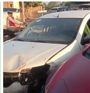
El choque generó congestión vehicular.