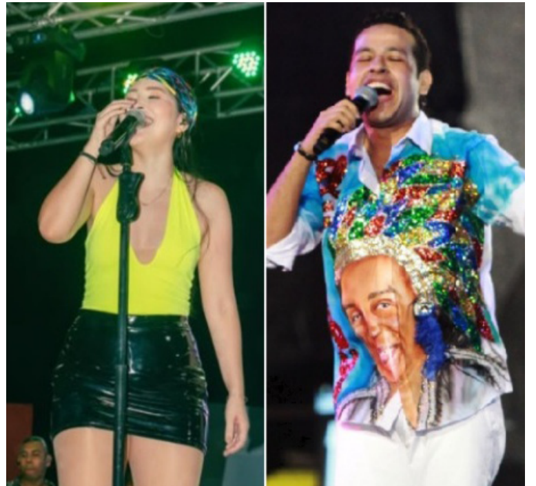
El video no tardó en viralizarse, despertando la nostalgia de los seguidores del 'Martinismo'.

VISITANOS diariodelnorte.net @diariodelnorteguajira @diario.delnorte @DiarioDelNorte