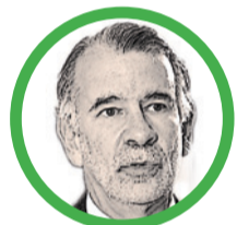
Por Eduardo Verano de la Rosa @veranodelarosa

Contrario a lo que mucha gente cree, la digitalización no reemplaza la capacidad de pensar; la potencia. Leer y comprender lo leído para aprender es el motor que cambia todo velozmente.