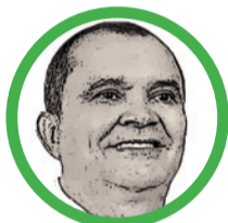
Por Gonzalo Gómez

La civilización moderna organizó su desarrollo como si la economía pudiera expandirse indefinidamente dentro de un planeta finito.