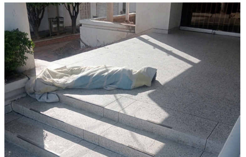
La ciudadanía pide ofrecer soluciones dignas a quienes hoy se encuentran en condición de calle.

Los ciudadanos esperan que las autoridades del municipio de Barrancas, La Guajira, intervengan lo antes posible para ofrecer soluciones dignas a quienes hoy se encuentran en condición de calle.