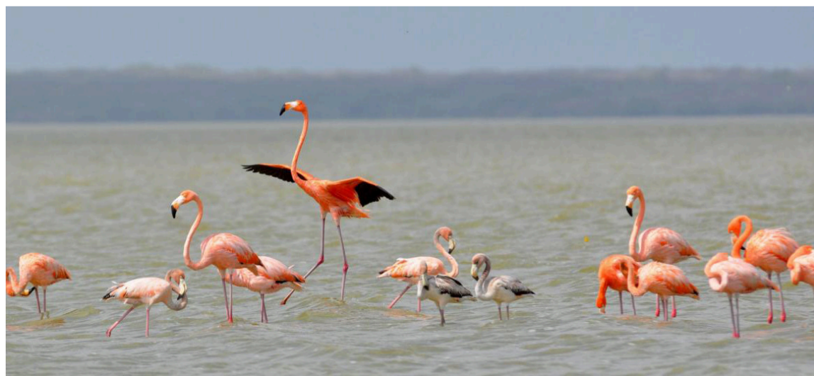
Se busca mejorar las condiciones lagunar donde el Flamenco Rosado descansa.

Con esta estrategia, “la empresa reafirma su compromiso con el desarrollo sostenible, demostrando que la infraestructura eléctrica puede coexistir y de hecho fortalecer la biodiversidad, cuando se gestiona con responsabilidad, rigor técnico y trabajo articulado con el territorio”, finalizó Zuleta.