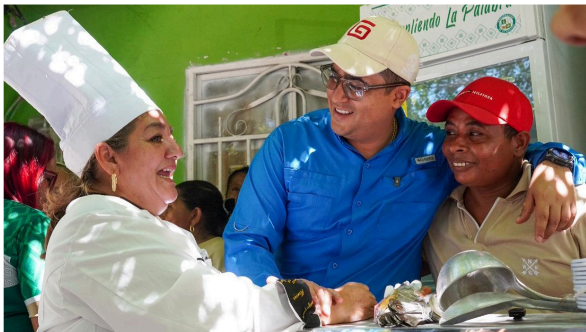
Los beneficiarios participaron en jornadas de capacitación lideradas por un chef.

DESTACADO La Gobernación continúa impulsando estrategias que reactivan la economía rural, promueven el turismo gastronómico y dignifican el trabajo de las familias guajiras.