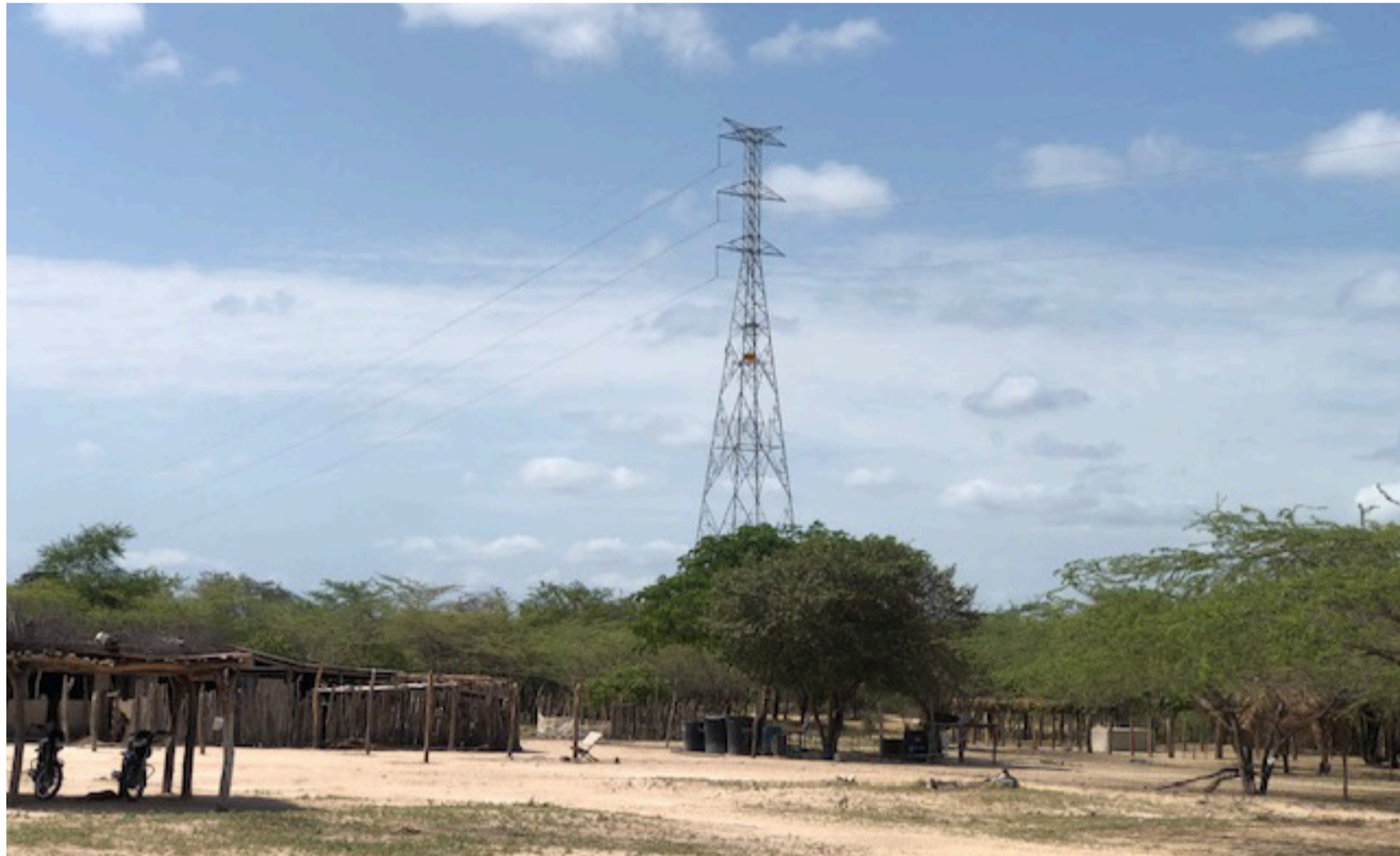
En la comunidad wayuú de Planamana en Riohacha se trabaja el piloto de investigación que permite evaluar la efectividad de desviadores de vuelo luminiscentes colocados en la línea Riohacha-Cuestecita 110 KV para proteger a los flamencos.

Con este objetivo, en el 2024 la compañía instaló 300 dispositivos luminiscentes tipo HawkEye; 200 dispositivos tipo FireFly, e incorporó un tercer sistema, Acas (luz ultravioleta), para comparar su efectividad a partir de dos monitoreos anuales que se realizan con el apoyo y vinculación de 12 comunidades wayuú, con la participación y formación de 24 monitores comunitarios que participan en el con-