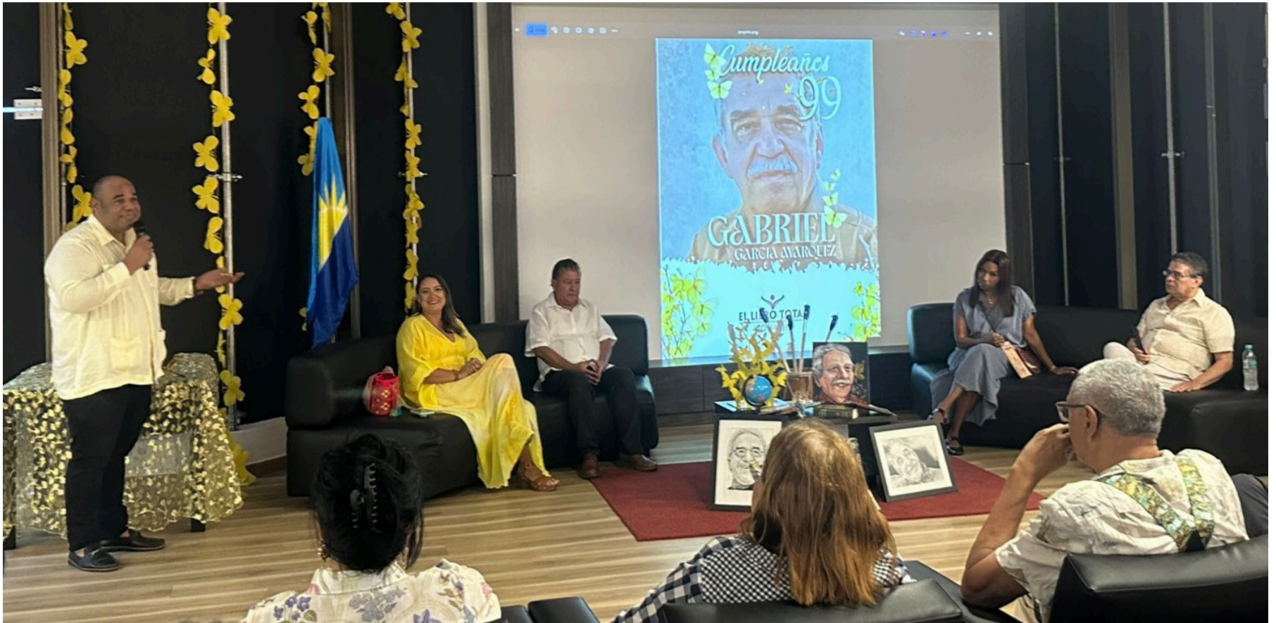
En Riohacha se conmemoraron los 99 años de natalicio del nobel Gabriel García Márquez.