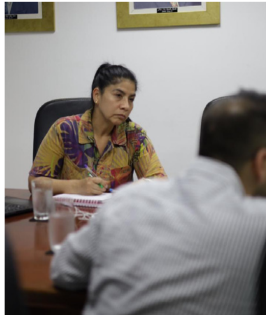
Se evaluaron las acciones orientadas a la recuperación de áreas estratégicas.