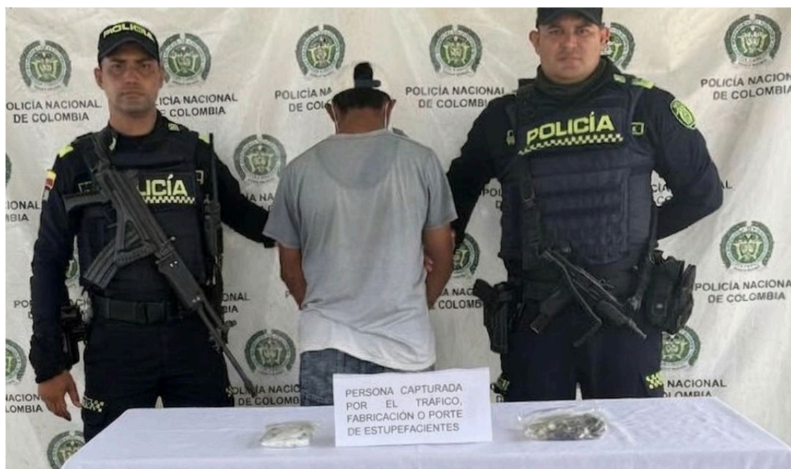
Esta persona fue dejada a disposición de la Fiscalía URI de Maicao.

"Seguimos trabajando de manera permanente en los corredores viales y sectores estratégicos del Departamento para contrarrestar el tráfico de estupefacientes que afecta la tranquilidad de nuestras comunidades. Este resultado refleja el compromiso de nuestros uniformados con la seguridad y la convivencia ciudadana. Invitamos a la comunidad a continuar denunciando cualquier hecho que ponga en riesgo la tranquilidad del territorio", señaló el oficial.