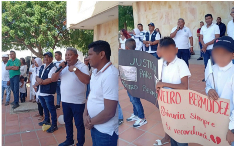
En la concentración, los asistentes insistieron en la necesidad de que las autoridades esclarezcan lo ocurrido.

A la jornada se sumaron integrantes del gremio de transportadores escolares, conductores, estudiantes, docentes y miembros de la comunidad, quienes alzaron su voz para rechazar el hecho violento y pedir que el caso no quede en