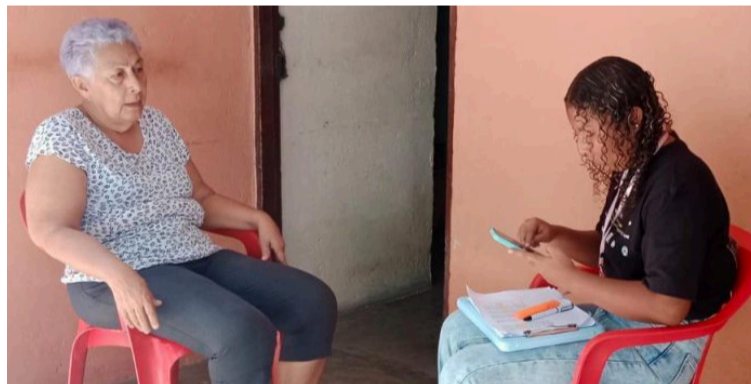
En La Guajira, los municipios beneficiados son El Molino, Fonseca, San Juan del Cesar y Urumita.

Posteriormente, se desarrollarán jornadas en cada municipio, acompañadas de acciones de promoción de hábitos y estilos de vida saludables, así como de fortalecimiento social para impulsar el cuidado, la autogestión