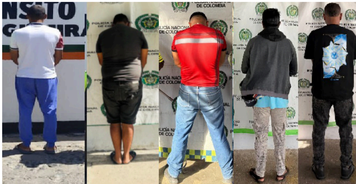
Importantes resultados entregó la Seccional de Tránsito de la Policía en La Guajira.

En otro operativo desarrollado en la vía Riohacha - Paraguachón, a la altura del kilómetro 81, jurisdicción del municipio de Maicao, lograron la captura de un hombre de 34 años, quien conducía