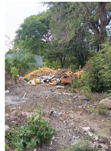
Piden a dueños del lote tomar medidas.

La comunidad espera que esta situación sea atendida con prontitud para evitar que el problema continúe creciendo y afectando la calidad de vida de quienes habitan en la zona.