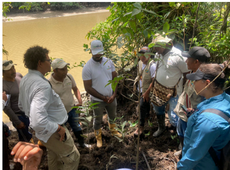
Se reafirma el compromiso de Corpoguajira con la conservación de los manglares como ecosistemas.