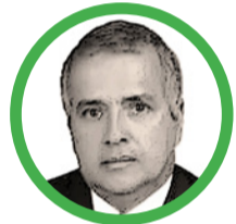
Por Rubén Darío Ceballos Mendoza