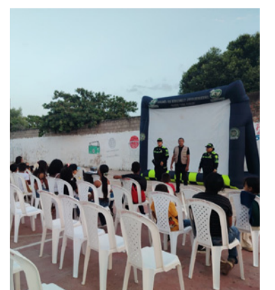
La jornada busca fortalecer los valores y el respeto.

ción Comunal y enmarcados en la estrategia E-pais, en el Modelo del Servicio de Policía orientado a las personas y en los territorios, se fortalecen valores como el respeto, la tolerancia y la convivencia pacífica en la comunidad.