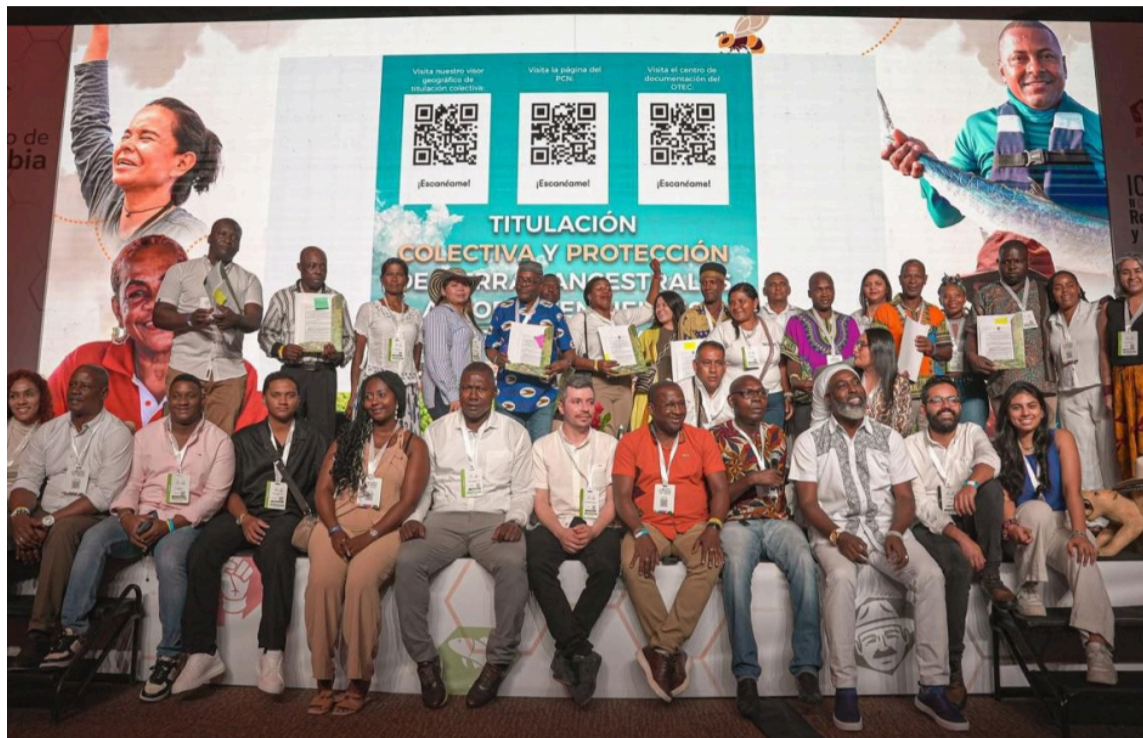
En La Guajira se presentaba un conflicto territorial que puso en tensión a las etnias wiwa.

Entre los predios entregados se encuentran El Ceibal (Riohacha, La Guajira), Peligro o Guineal y El Cauca (El Molino, La Guajira), El Castillo y La Yolima (Villanueva, La Guajira), Villa Lizeth (Puerto Gaitán), El Darién y La Victoria (San