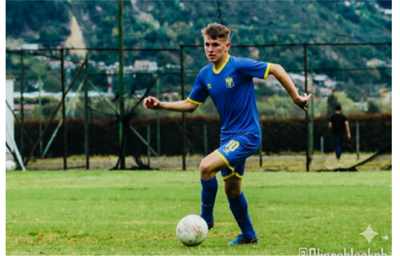
Esta es con el equipo eslovaco.

Con 1.78 de estatura, pone todo su empeño y saber en la cancha, donde se siente muy a gusto, haciendo lo que más