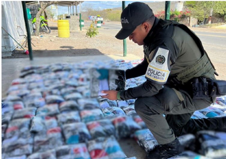
Las 12.000 unidades de confecciones están avaluadas comercialmente en más de $500.000.000.

Durante las actividades en punto de control aduanero en Hatonuevo, uniformados adscritos a la División de Control Operativo Riohacha realizaron la inspección a dos vehículos tipo camión y, al momento de realizar la inspección física, se encontraron ocultos en ali-