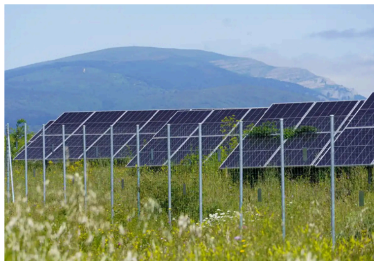
Maristella Svampa nos ayuda a ver que la TE no es un asunto solo ‘verde’. Es holística. Es feminista.

La narrativa la escribimos juntos, con las manos en la tierra y la mirada en un horizonte común, muy ajeno al viejo progreso, pero profundamente familiar al latido ancestral de la vida.