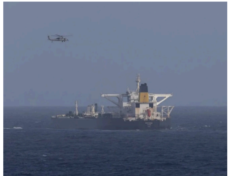
El resultado es un desabastecimiento severo de combustible que explica el colapso actual de la isla.

Es inevitable el efecto dominó de lo ocurrido recientemente en Venezuela, proyectando una sombra larga sobre Cuba. La caída de Nicolás Maduro coloca en la mira de EE. UU. la isla gobernada por el castrismo.