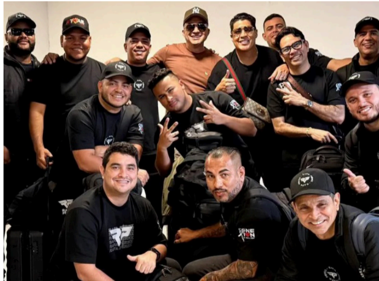
El anuncio, hecho en medio de la tensión del juego, generó una ola de reacciones en redes.

El clímax llegó durante la gala final, un episodio que combinó emoción y picardía. 'Rafa', fiel a su estilo cercano y carismático, salvó a uno de los músicos en medio de bromas y complicidad con los espectadores.