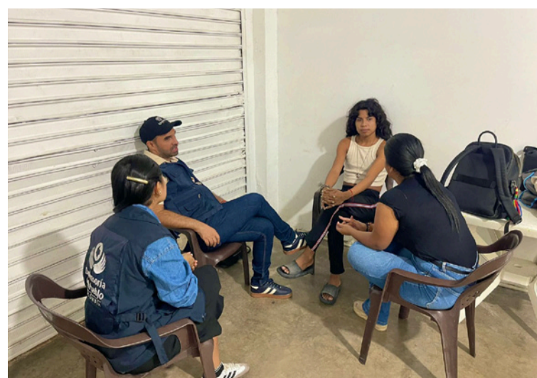
Se realizó acompañamiento en atención psicológica especializada en casos de Violencias Basadas en Género.