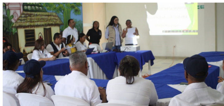
La Personería continuará acompañando y apoyando cada una de las acciones contempladas en el plan anual.

"El día de hoy se realizó el primer plenario del año, en el cual participó la Administración municipal con toda su oferta institucional. Se debatió lo que cada secretaría tiene planeado en el tema de víctimas y se socializaron las actividades y conmemoraciones que se desarrollarán durante el año", indicó.