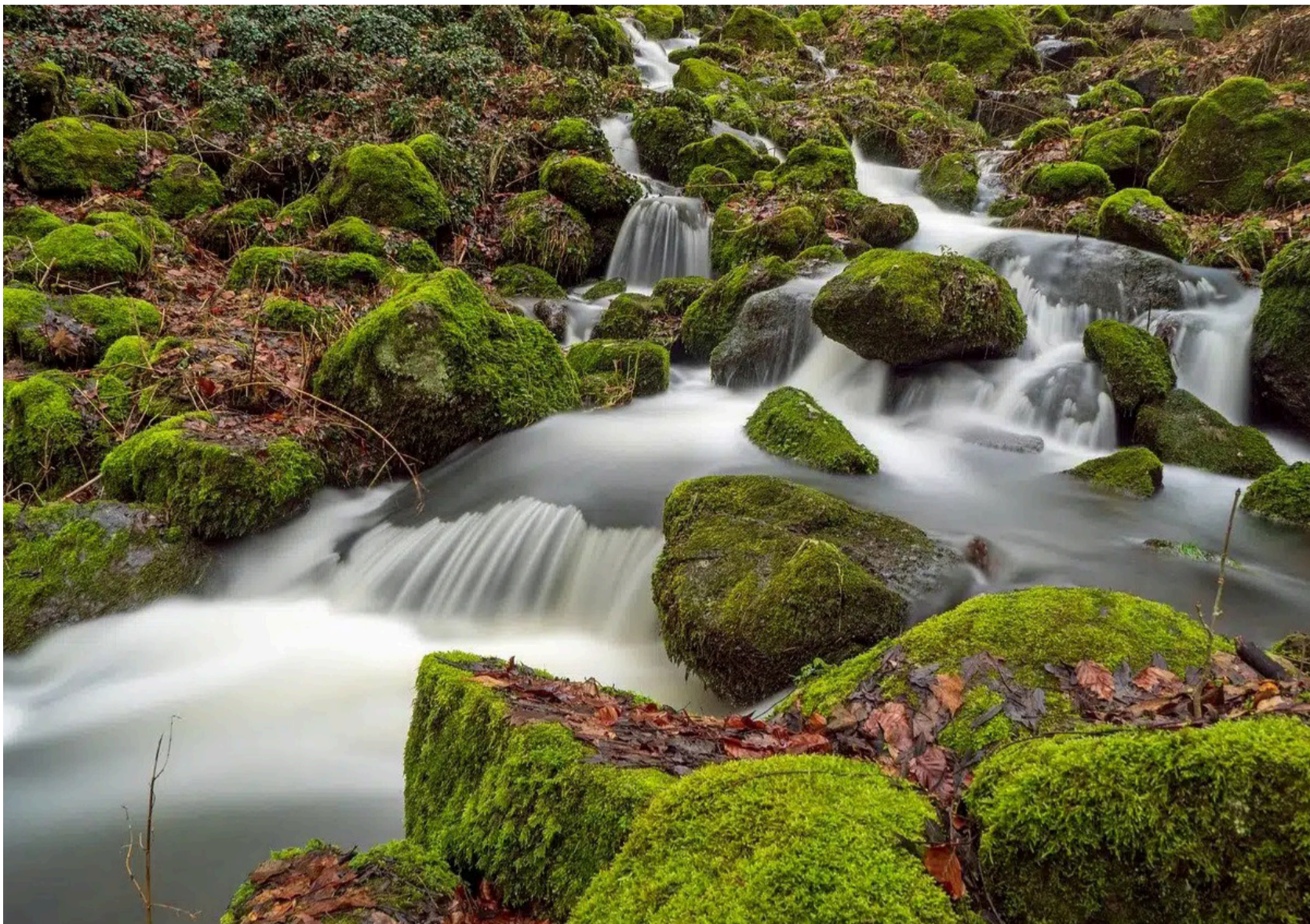
La TE nos exige, con una claridad que duele, entender que la naturaleza es sujeto de derechos. No es un recurso, es un pariente.

Nos pide recuperar las epistemes originarias