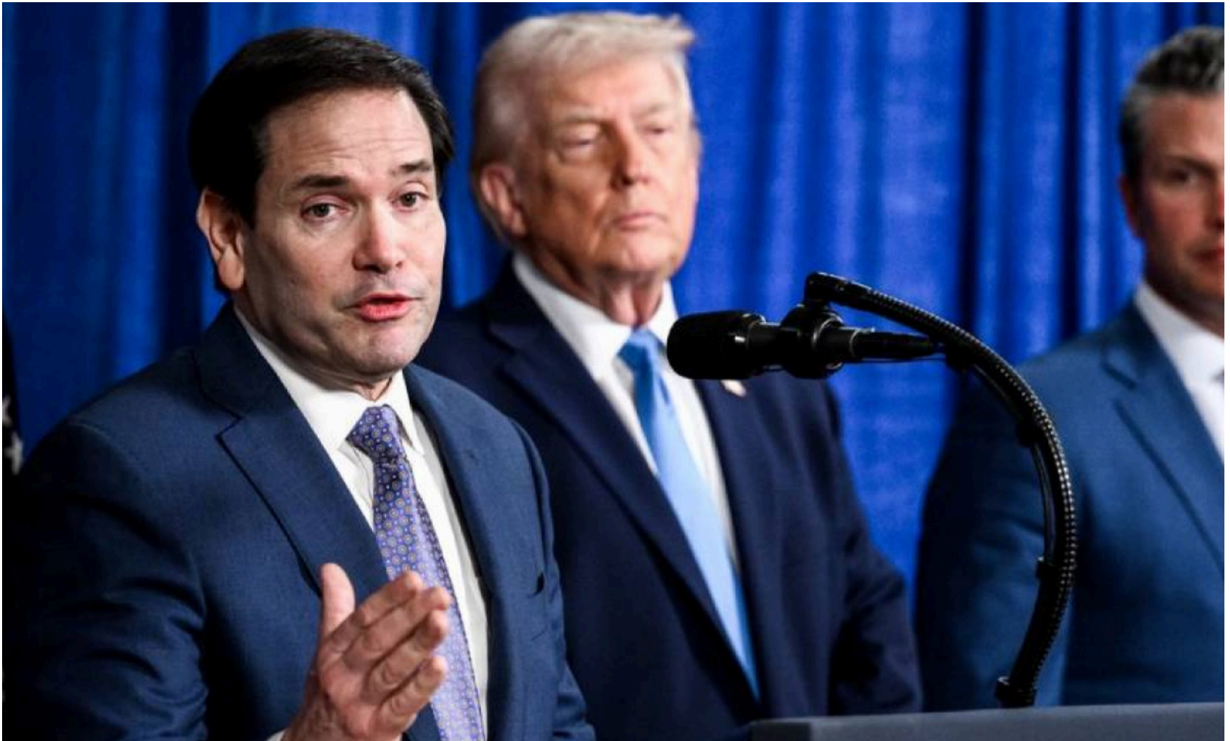
Cuba es ahora la prioridad del binomio Donald Trump–Marco Rubio, y el presidente estadounidense no lo oculta.