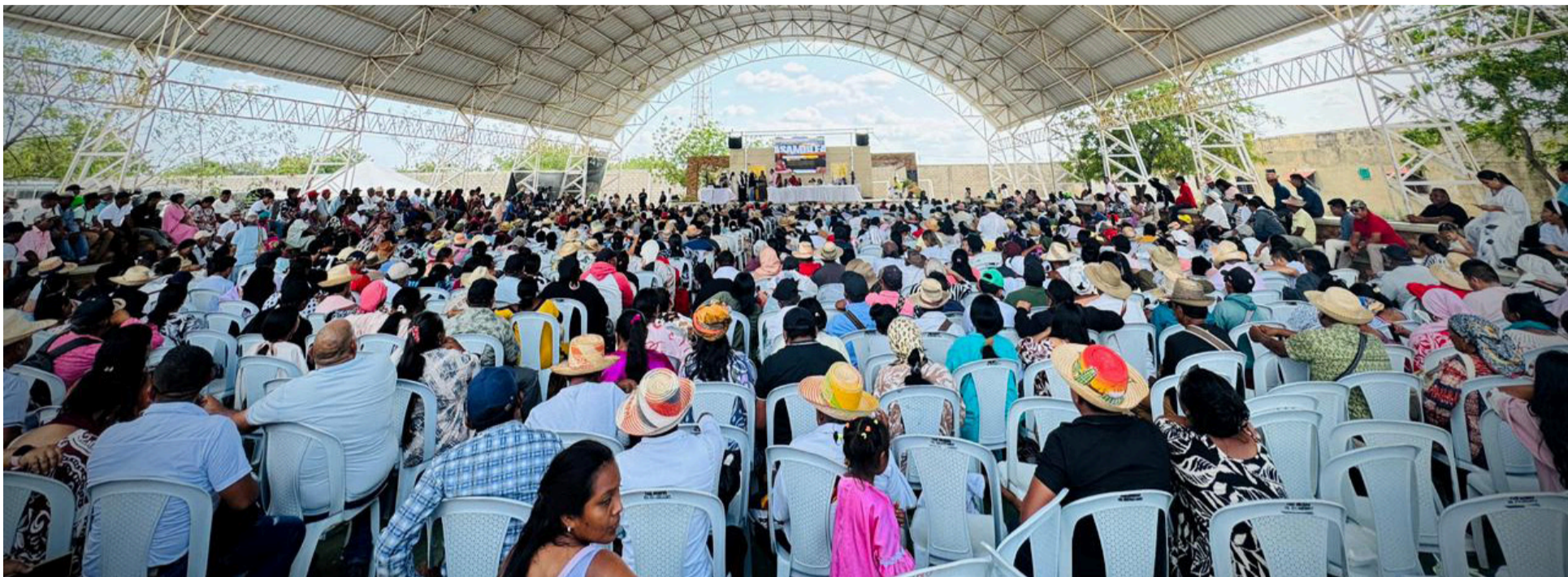
En la Asamblea se denunciaron deficiencias en acceso al agua potable, salud, seguridad alimentaria, infraestructura educativa y conectividad vial.

En la más reciente Asamblea General Wayuú realizada el 18 de febrero en Uribia, autoridades tradicionales, líderes y comunidades emitieron un mandato colectivo que reafirma su derecho al gobierno propio. La decisión, adoptada en la capital indígena de Colombia, trasciende la coyuntura política y se consolida como una expresión organizada de autonomía territorial.