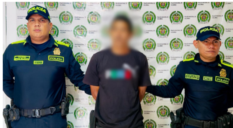
A esta persona le hallaron en su poder un paquete plástico con marihuana, con un peso de 437 gramos.

Profesional U. Secretaria de Planeación.