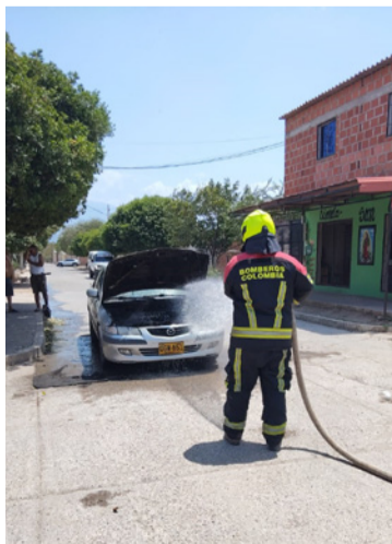
El vehículo es marca Mazda, color gris.

En esta emergencia no se presentaron personas lesionadas, sino pérdidas materiales. La rápida respuesta de los Bomberos Voluntarios de Barrancas evitó que esta emergencia pasara a mayores.