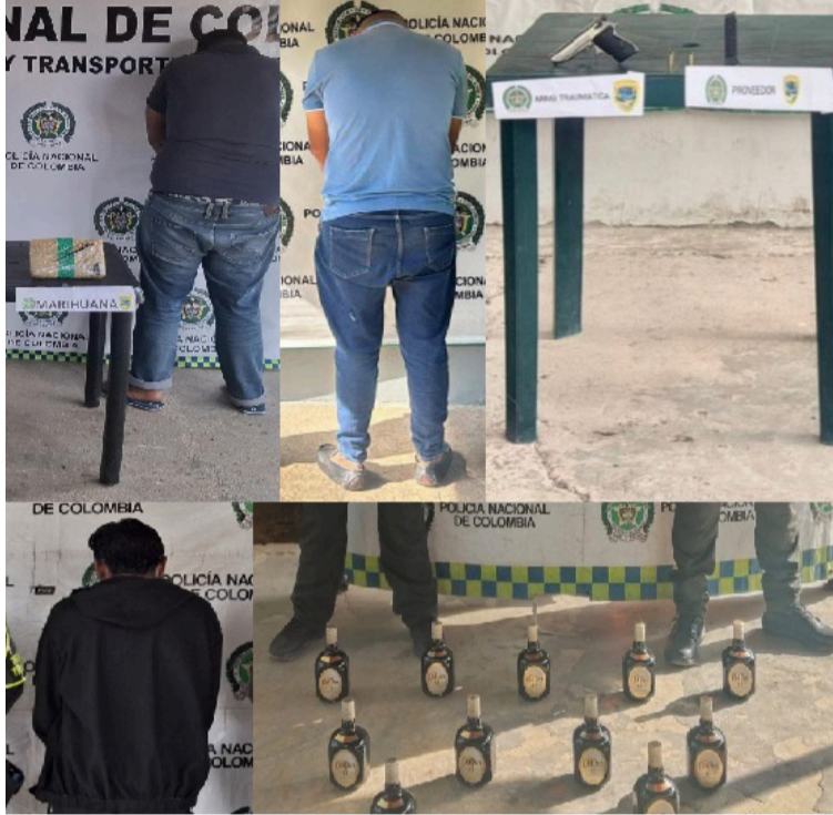
La Policía de Tránsito logró importantes resultados operativos en diferentes ejes viales del Departamento.

En uno de los procedimientos, fue capturado un hombre por el delito de tráfico, fabricación y/o porte de estupefacientes, luego de hallársele en su poder 483 gramos de marihuana. En el mismo caso, fue inmovilizada una motocicleta marca Suzuki, modelo 2007, color negro, avaluada en 1.500.000 pesos. El capturado y el material incautado fueron