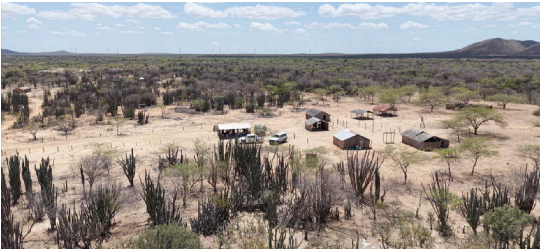
Mientras la infraestructura energética avanza sobre el paisaje árido, muchas familias que habitan esta comunidad no tienen energía eléctrica.