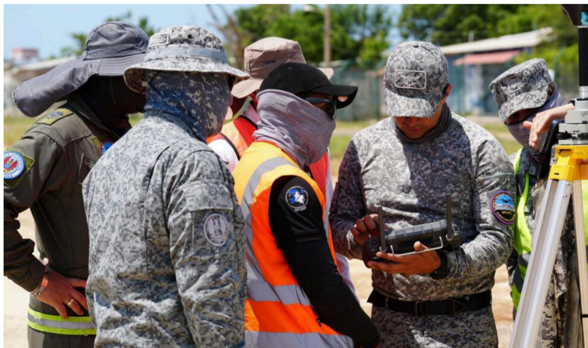
La entidad reafirma su compromiso con la modernización del sistema aeronáutico.

Estas acciones consolidan el avance hacia un sistema aeroportuario más seguro, eficiente y sostenible, que contribuye a mejorar la calidad del servicio y ampliar las oportunidades de desarrollo para los habitantes y visitantes del departamento de La Guajira.