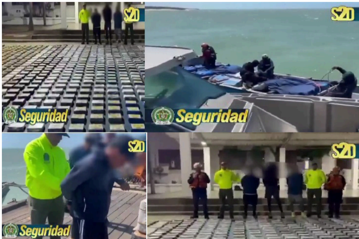
La droga pertenecía al Clan del Golfo. En la acción fueron capturados tres sujetos.

Asimismo, se espera conocer en detalle en un informe completo sobre la operación y las identidades de las tres personas que fueron capturadas en este procedimiento en zona marítima de La Guajira.