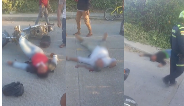
Los tres heridos fueron auxiliados y llevados de urgencia hasta un centro asistencial en Maicao.

Las autoridades hacen un llamado a los conductores y usuarios viales, para que cumplan las normas de tránsito y no conduzcan bajo efectos del alcohol.