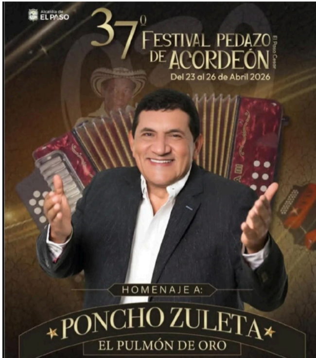
El evento cultural en esta oportunidad rinde homenaje a 'Poncho' Zuleta Díaz.

El acto de develación tuvo lugar en la plaza principal del municipio, donde la comunidad pasera asistió al representativo evento, quienes además disfrutaron de los grandes clásicos del artista que