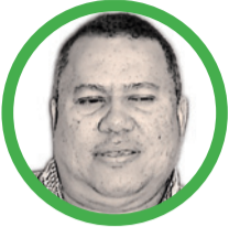
Por Luis Eduardo Acosta Medina