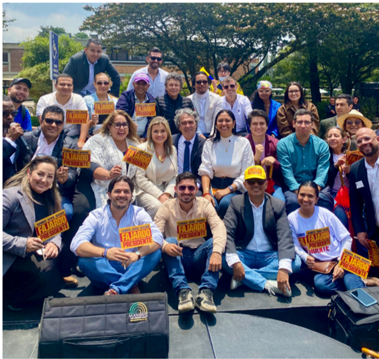
Cordero destacó la importancia de que territorios como La Guajira tengan una voz en la conversación nacional.

La presencia de Cordero en este escenario nacional tiene un significado especial para La Guajira. Su participación refleja el creciente papel de nuevos liderazgos regionales que buscan abrir espacios en la política nacional desde una agenda basada en la educación, la transparencia y la construcción de consensos.