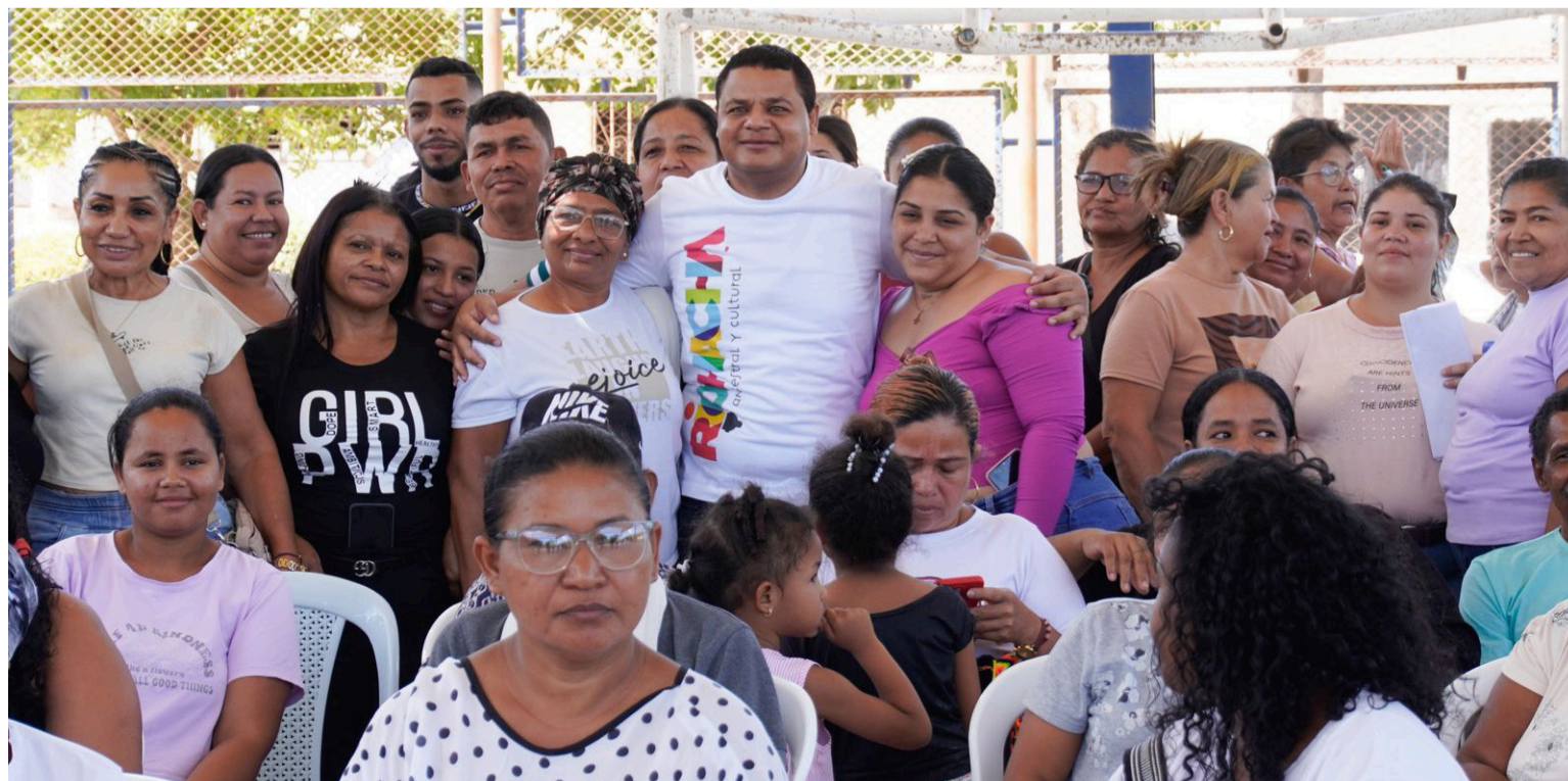
Explicó el alcalde Genaro Redondo que las ayudas llegan a más de mil personas impactadas con inundaciones.

La Alcaldía Distrital, a través de varias sectoriales y las empresas de servicios públicos, siguen avanzando en la búsqueda de soluciones que mitiguen los impactos generados por estos fenómenos climáticos y, en el diseño y realización de obras y proyectos para mejorar las condiciones de vida de las comunidades.