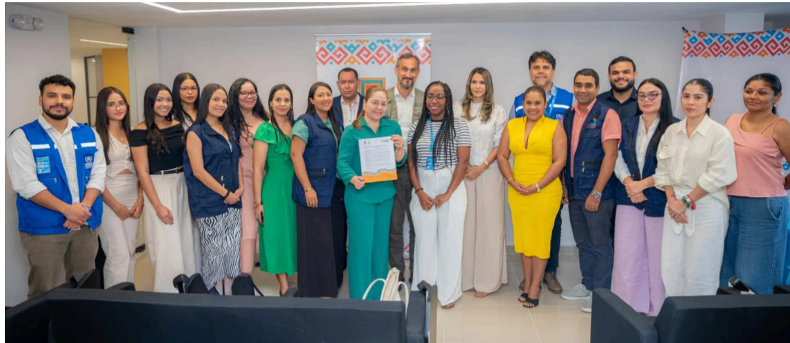
Uniguajira plantea que su compromiso no es solo legalista, sino profundamente social.

La Universidad de La Guajira y la Agencia de las Naciones Unidas para los Refugiados (Acnur) renovaron su carta de entendimiento para continuar el programa de Asistencia Legal Comunitaria para Personas Migrantes, desarrollado desde 2019. En 2025, esta iniciativa permitió brindar apoyo a más de 350 personas a través