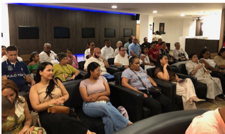
Empezó a escribir en el 2024 al cursar 7° grado.

Está dividido en cinco eras del enamoramiento que explora todas las facetas que se pueden sentir en el amor. La era del na-