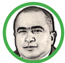
Por Arcesio Romero Pérez