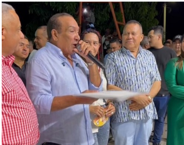
El corregimiento de Monguí, siempre ha sido una tierra 'betista', seguidores de la música de 'Beto' Zabaleta.

bolsillo nos regalaron dos producciones más, 'La Ley del Embudo' en 1977 y 'Lo máximo' en 1978 dejándonos para el recuerdo bellas paginas musicales que nadie olvida; ese proyecto musical tuvo su final después de un encuentro social propiciado por unos y unas estudiantes de la Universidad Autónoma en Barranquilla en donde se conocieron los dos 'Betos' Villa y Zabaleta, así grabaron su primer LP 'El cantor Triunfante' posicionando de entrada los éxitos 'El enfermo' y 'Mi mala estrella' de 'Nando' Marín, 'El Cantor triun-