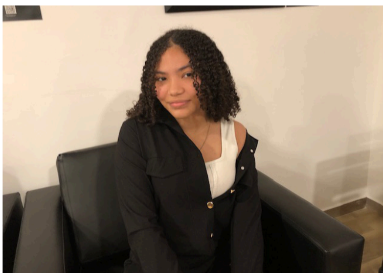
Este año logró terminar de escribir los poemas de su libro, que fue editado por la editorial Maicatama.

cimiento, el amor hecho realidad, el punto incierto, el desamor y la sombra del rencor.