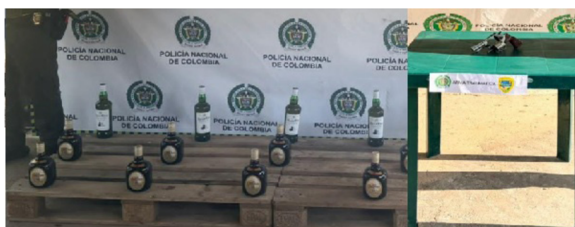
Los capturados y los elementos incautados quedaron en poder de las autoridades.