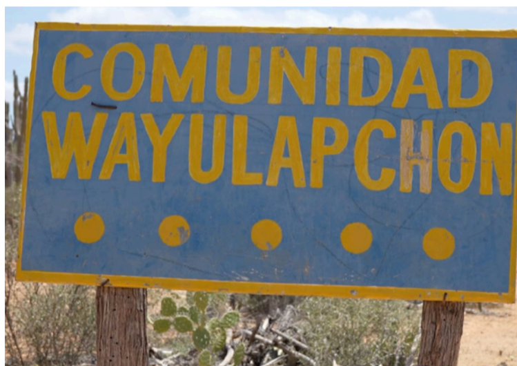
Una de las cosas que más inquieta a los líderes indígenas es la cercanía de transmisores a un cementerio ancestral.

Uno de los aspectos que más inquieta a los lí-