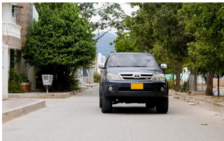
La Gobernación invita a todos los propietarios de vehículos a revisar oportunamente esta información.

Esta medida, que se realiza en cumplimiento de lo establecido en la Ley 1819 de 2016, permitirá a los propietarios de vehículos conocer el estado de sus obligaciones tributa-