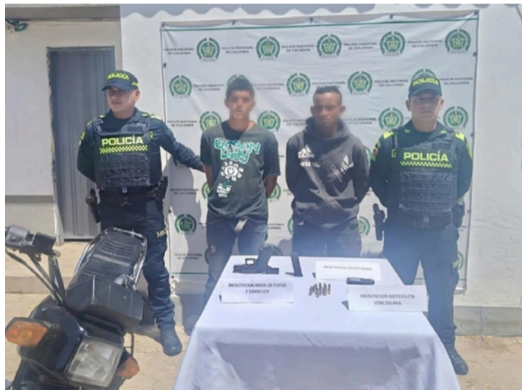
La situación fue neutralizada gracias a la oportuna intervención de los policías que realizaban labores de control.

Durante el procedimiento policial fue incautada una pistola marca Glock 19, un proveedor con 15 cartuchos calibre 9 milímetros, un teléfono celular y una motocicleta en la que se movilizaban los hoy capturados.