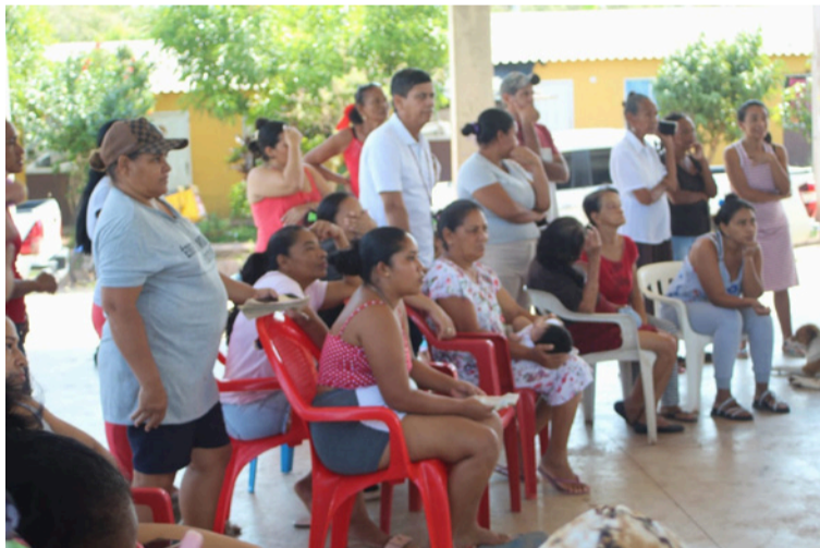
Las partes comprometidas continúan dialogando con el propósito de encontrar una solución concertada.

Según indicó el líder comunitario, la población de este sector está conformada en su mayoría por familias de bajos recursos, lo que ha dificultado el cumplimiento oportuno de algunas facturas del servicio. “Aquí hay recibos de diferentes valores; algunos llegan por 30 mil