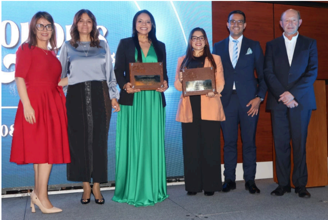
Cerrejón es reconocida gracias a su modelo integral de formación en Salud y Seguridad.

Cerrejón es la primera empresa minera en Colombia que cuenta con una Uvae - Unidad Vocacional de Aprendizaje en Empresas, registrada y avalada por el Ministerio de Trabajo y certificada por la ARL Positiva. Esta