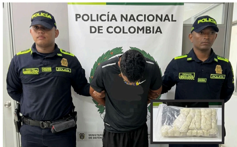
Los uniformados hallaron en su poder una bolsa que contenía 1.500 papeletas con base de coca.

La Policía Nacional reiteró su llamado a la comunidad para denunciar cualquier hecho relacionado con el tráfico de drogas, recordando que la información ciudadana es fundamental para seguir debilitando las estructuras que afectan la tranquilidad de los territorios.