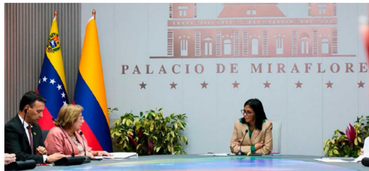
Durante el encuentro, las autoridades de defensa acordaron dos líneas estratégicas de acción.

El jefe de la cartera de Defensa explicó que estas decisiones hacen parte de la estrategia que Colombia impulsa con la comunidad internacional para enfrentar la criminalidad transnacional, que utiliza las fronteras como corredores para el tráfico de drogas, armas y otras actividades ilícitas, por lo que la cooperación entre países resulta fundamental para cerrarle el paso a estas estructuras.