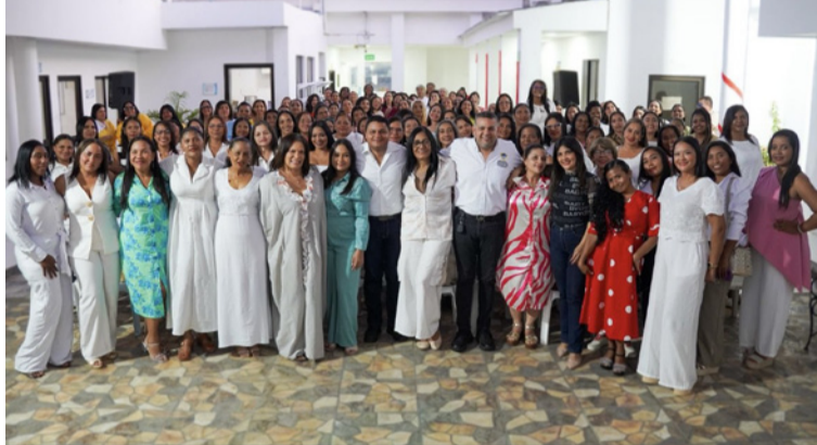
Este es el primer grupo de docentes contratadas tanto en propiedad como en provisionalidad.

En agosto de 2025, Riohacha inició el proceso para asumir a los niños