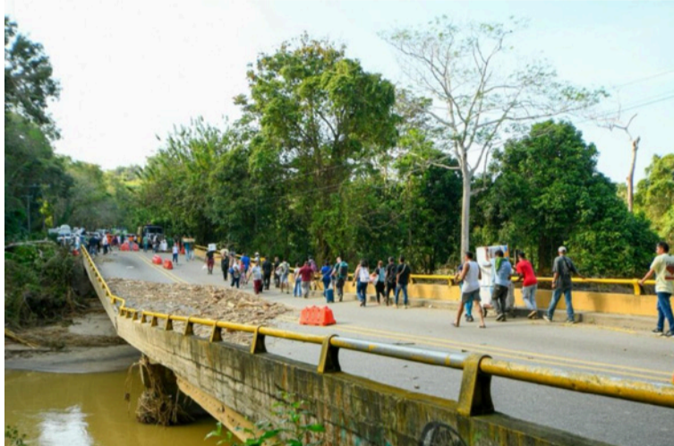
El objetivo es superar la crisis vial generada tras la afectación del paso vehicular por las fuertes lluvias.

Durante la visita, los ingenieros plantearon dos opciones para la ubicación de la estructura temporal: instalar el puente militar sobre la base del puente existente o ubicarlo al costado izquierdo del lugar donde se encontraba el antiguo paso vehicular. Ambas alternativas