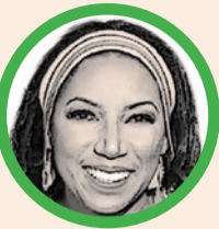
Por Marga Palacio