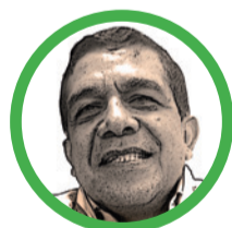
Por Hernán Baquero Bracho