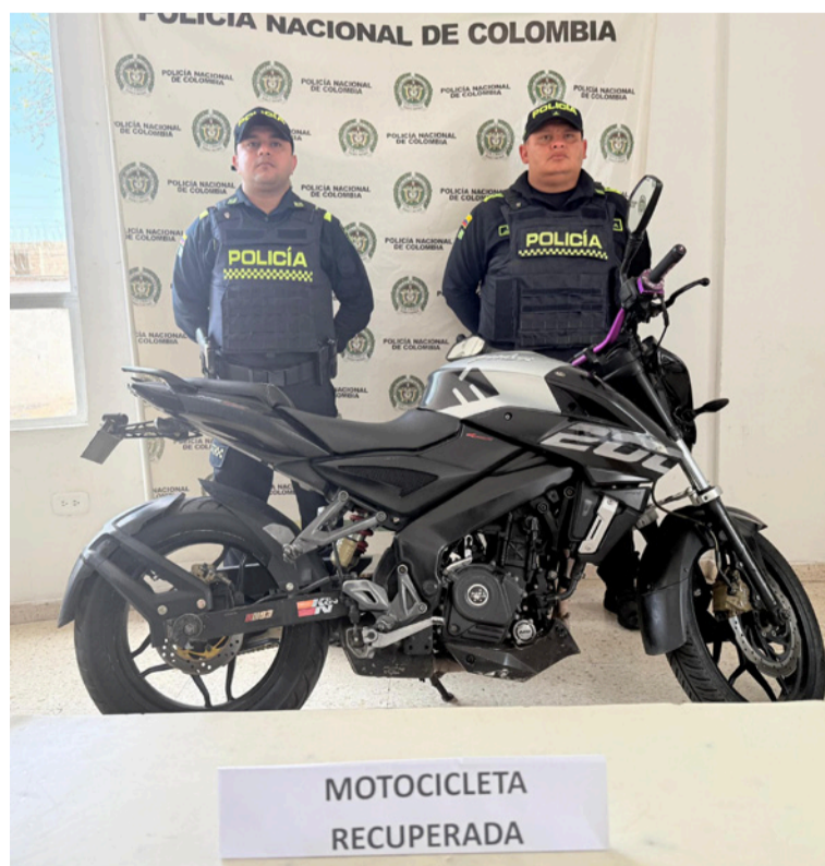
La moto presentaba una inmovilización solicitada por la Fiscalía Local, Unidad de Hurto 411 de Bogotá.

VISITANOS diariodelnorte.net @diariodelnorteguajira @diario.delnorte @DiarioDelNorte