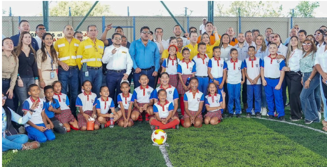
En materia ambiental, las inversiones de Cerrejón ascendieron a $446 mil millones.

En materia ambiental, las inversiones ascendieron a $446 mil millones. En acceso al agua, Cerrejón entregó 50 millones de litros a 164 comunidades cercanas a la línea férrea y en Puerto Bolívar. En educación, se beneficiaron 16.956 personas entre empleados, hijos de empleados y comunidades, y se otorgaron auxilios escolares a 20.440 personas, principalmente a hijos de empleados.