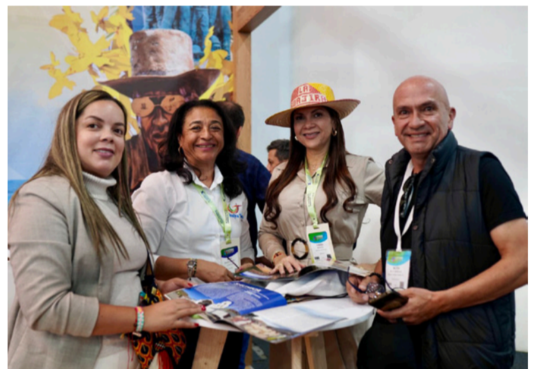
El Distrito logró la priorización de empresarios abandonados en la articulación turística en territorio.

Los seleccionados son: Guajira Casa del Mar, Kai-maapalaa Tours, casa museo Pionera de Turismo Ranchería Divi Divi, Caribbean Sea DT, Asotelca capítulo Guajira, Sumaj Tours SAS, Guajiro Dream, Wanneshia Tourd, Ilsho Tours, Siruma Tours, Amazing Guajira, Sol Guajiro Tours. Como parte de la apuesta por el fortalecimiento del turismo desde el territorio, la institución IE Rural Luis Antonio Robles de Cama-