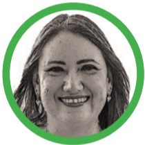
Por María Isabel Cabarcas Aguilar