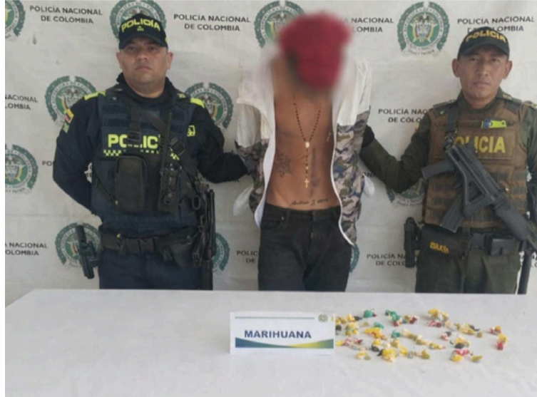
El capturado fue trasladado hasta la URI de San Juan del Cesar, donde quedó a disposición de la autoridad.

El procedimiento se llevó a cabo en la calle 21 con carrera 7, donde uniformados observaron a un ciudadano en actitud sospechosa. Al solicitarle un registro a persona, se halló en el interior de un bolso una bolsa plástica de color amarillo que contenía una sustancia vegetal que,