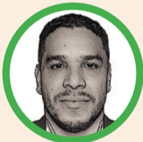
Por Mario Romero

Yo la tengo clara: todos somos América. Y ya que acabo de llegar a mi país, quiero inmortalizar cada momento vivido en mi zapateadero para deleitarme viéndolos a mi regreso al Viejo Continente. Nadie me quita 'lo bailao' y, así, voy a la fija para no tener que decir 'Dtmf' en estos carnavales. Así que prepárate, 'muela picá', que lo que te viene es panela.