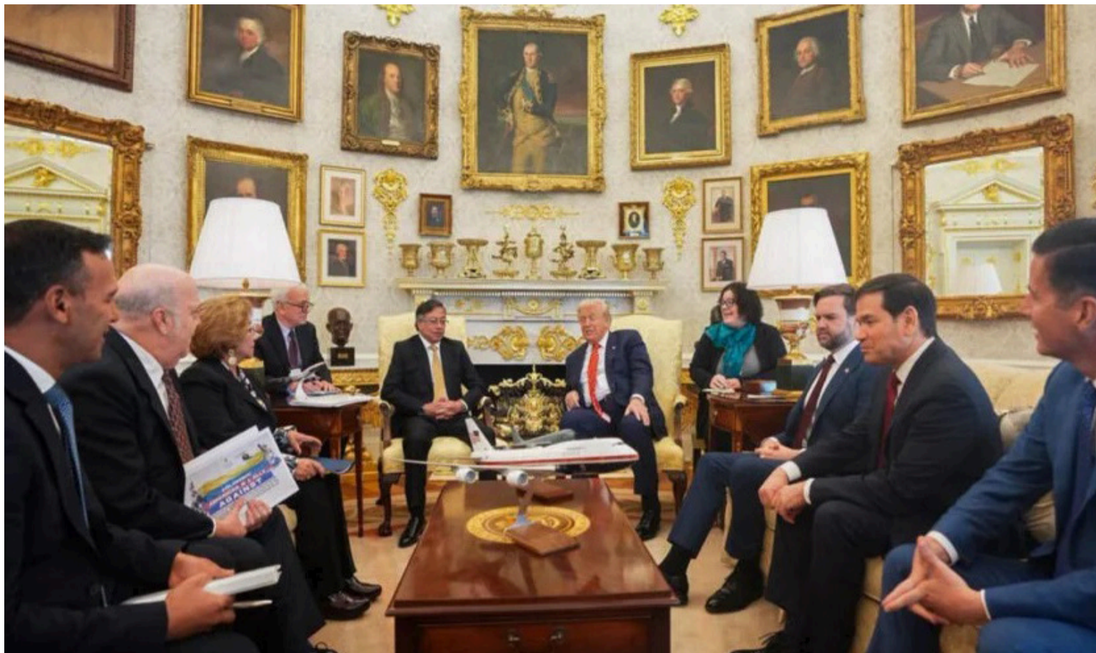
El presidente Donald Trump tuvo un comportamiento excepcional, fuera del lunático que lo caracteriza.