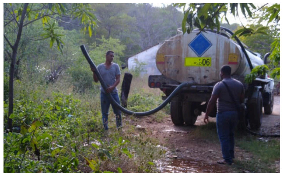
Según la Administración, se están gestionando inversiones estructurales.