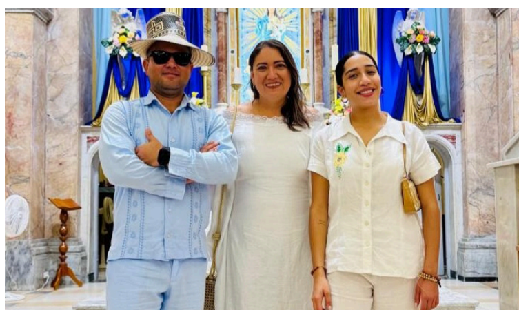
En la Catedral Nuestra Señora de los Remedios después de cantarle a la virgen.