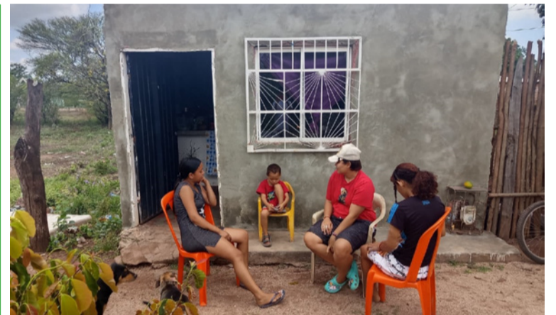
Esta familia, actualmente se encuentra alojada de manera provisional en el barrio El Carmen.

Con esta intervención, Samuel Lanao Robles, Director de Corpoguajira, manifestó "que en este micro acueducto, la entidad hizo el mayor aporte económico, reafirmando el compromiso para el fortalecimiento de los servicios públicos y el desarrollo integral de las comunidades rurales de este municipio y el Departamento".