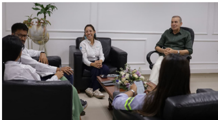
En la jornada también participaron funcionarios de Corpoguajira y miembros del equipo de Enlaza.

Durante el encuentro se abordaron diferentes