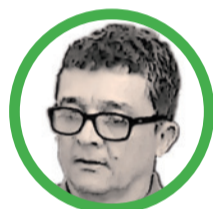
Por Luis Hernán Tabares Agudelo