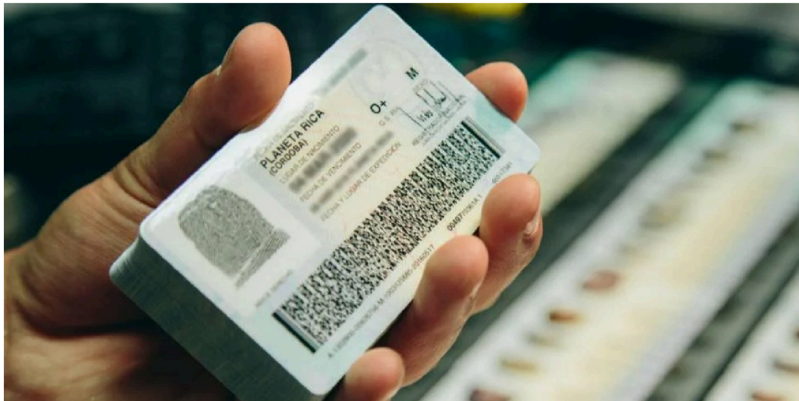
En algunos territorios donde se han llevado a cabo elecciones atípicas, el proceso de inscripción de cédulas se ha visto afectado.

Con ese corte, entre el 8 de marzo de 2025 y el 8 de enero de 2026, un total de 1.795.794 personas en el territorio nacional inscribieron su cédula por cambio de residencia y 281.484 realizaron su inscripción en las sedes consulares de Colombia en el exterior, para un total de 2.077.278 personas inscritas.