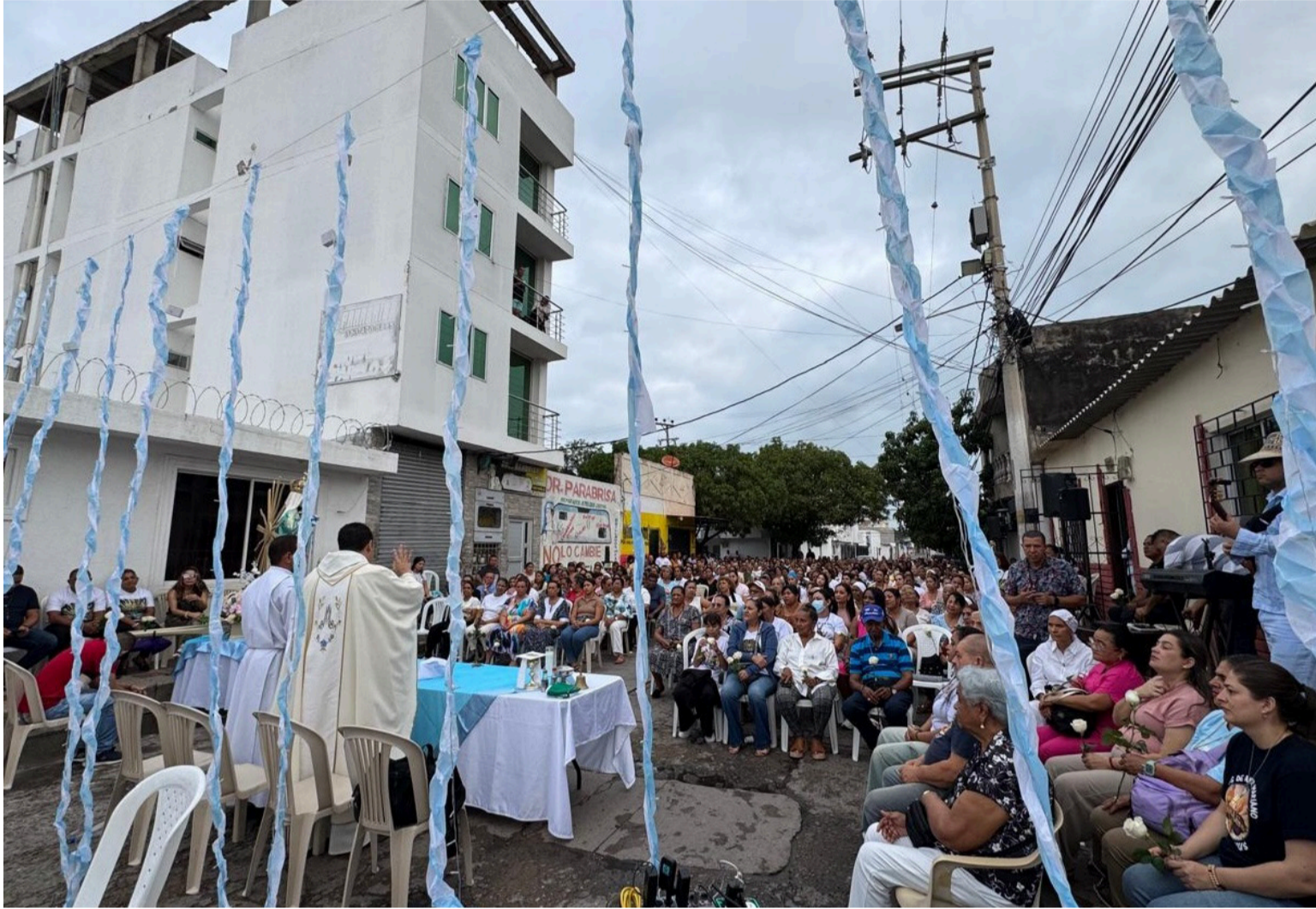
La última eucaristía previa al día solemne estuvo bastante concurrida por la feligresía.