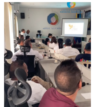
Están invitados comunidad y líderes sociales.

De esta manera, el honorable Concejo de Riohacha invita a las comunidades y líderes sociales de nuestro territorio a participar de manera activa en este espacio que busca aportar soluciones concretas en materia de agua y saneamiento básico al Distrito de Riohacha.