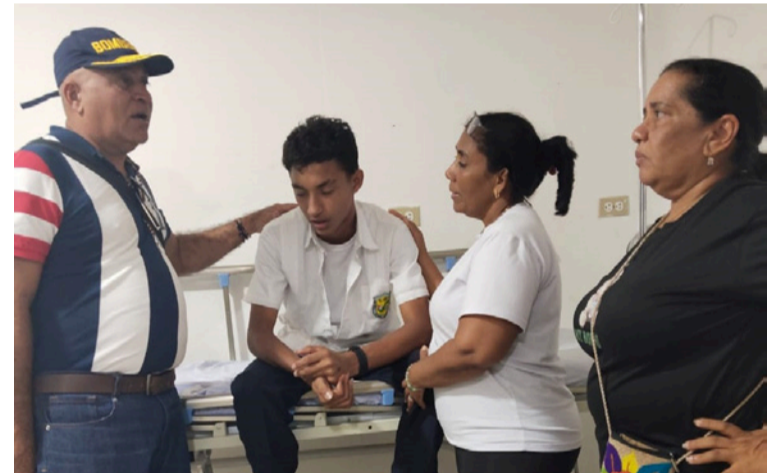
El estudiante fue estabilizado y quedó bajo observación médica, mientras se evalúa su evolución.

La comunidad solicita una intervención inmediata de los organismos de gestión del riesgo y control ambiental, con el fin de garantizar la seguridad de los estudiantes y del personal educativo, así como prevenir posibles consecuencias mayores.