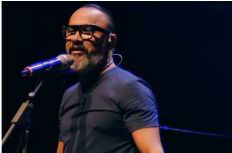
Con más de 600 composiciones, su catálogo ha sido interpretado por múltiples artistas de renombre.

La organización del evento, junto con la cuenta oficial de los premios, anunció que esta versión estará dedicada a exaltar