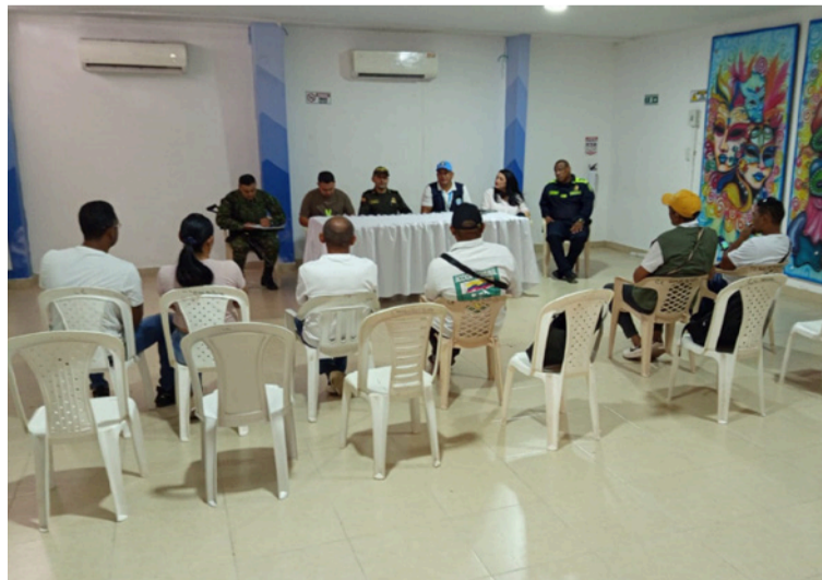
Se anunció el refuerzo de la seguridad rural mediante el envío de unidades de Carabineros.

refuerzo de la seguridad rural mediante el envío de unidades de Carabineros, compromiso adquirido en el Consejo Departamental de Seguridad, para fortalecer la vigilancia en las zonas rurales de Villanueva y municipios vecinos como San Juan.