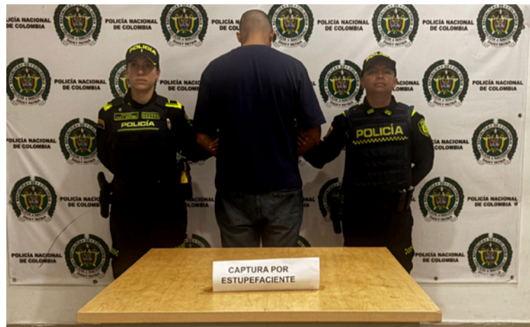
La policía halló en el interior del vehículo una bolsa de color verde con una libra de marihuana.

El capturado fue puesto a disposición de la Fiscalía General de la Nación, a través de la Unidad de Reacción Inmediata (URI) en turno, donde deberá responder por el delito antes