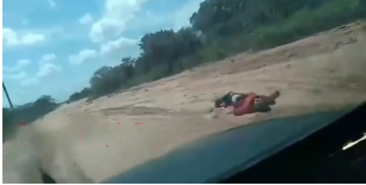
Una fuente militar informó que el cuerpo estaba en el camino que conduce hacia la comunidad indígena Urina.

De manera inmediata, al lugar de los hechos acudieron miembros del Ejército Nacional y del Cuerpo Técnico de Investigación