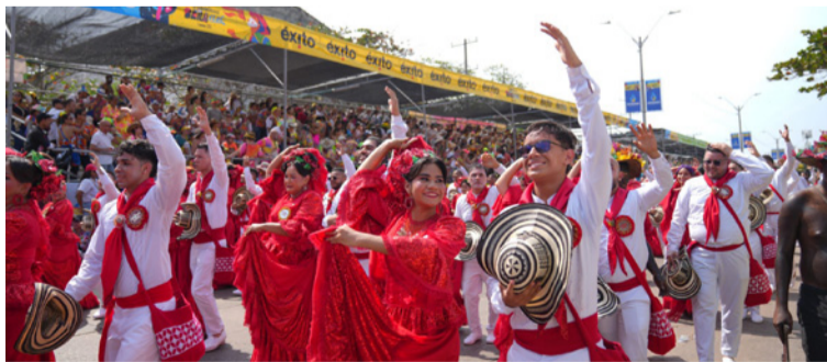
Carnaval de Barranquilla invita a turistas y barranquilleros a vivir esta fiesta 2026 del 14 al 17 de febrero.

El sábado 14 de febrero, la Batalla de Flores dará inicio a las 10:30 de la mañana, llenando el Cumbiódromo de la Vía 40 de color, música, tradición y alegría. Ese mismo día, el Desfile del Rey Momo comenzará a las 2:00 de la tarde en la Calle 17, exaltando el goce popular de algunos de los barrios más carnavaleros y