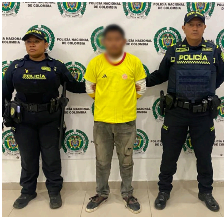
Los uniformados informaron a la persona sus derechos como capturado y su traslado a la URI.

el documento fue verificado con la documentóloga de la Fiscalía General de la Nación en turno, quien confirmó que la licencia no era auténtica.