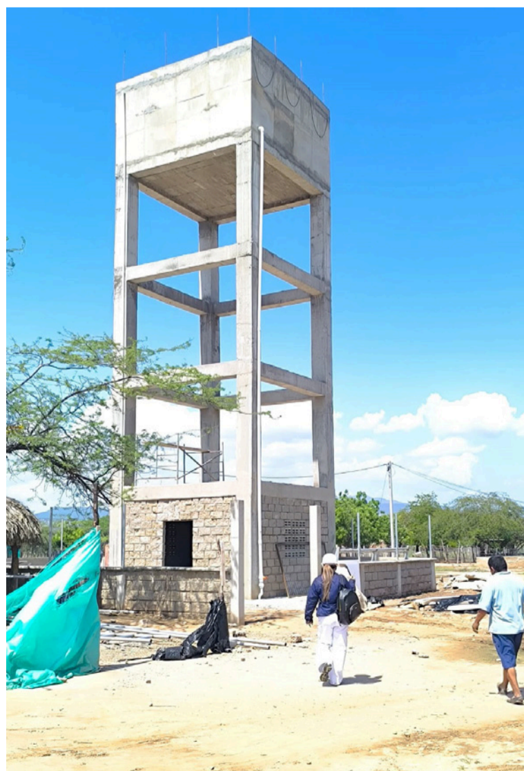
El director de Corpoguajira, manifestó "que en este micro acueducto, la entidad hizo el mayor aporte económico".

El proyecto consistió en la construcción de un tanque elevado en concreto, con una capacidad de almacenamiento de 50 metros cúbicos de agua,