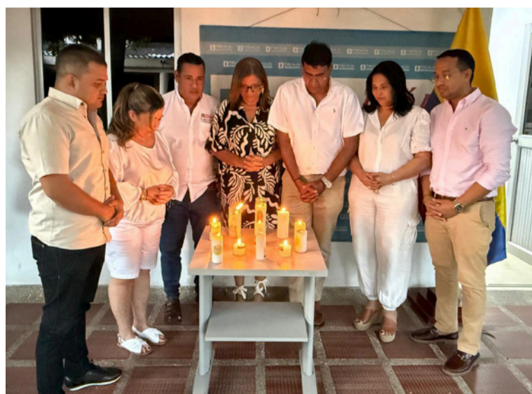
Sus compañeros piden la liberación de dos funcionarios adscrito a la institución en la sede de Arauca.