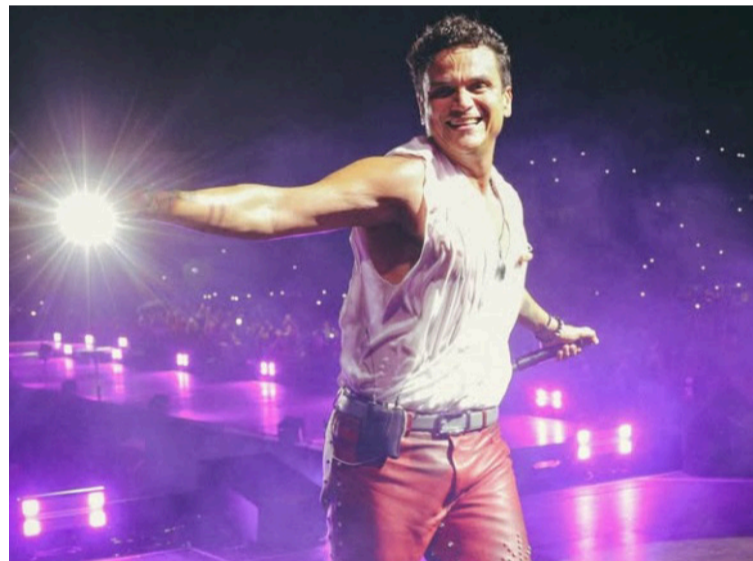
La iniciativa en Córdoba refleja el constante compromiso del artista con las poblaciones vulnerables.

fundación señalaron que estas acciones continuarán mientras las familias afectadas lo requieran. "Nuestro propósito es estar donde la gente nos necesita. Silvestre siempre ha dicho que su público es su familia, y hoy esa familia está pasando por un