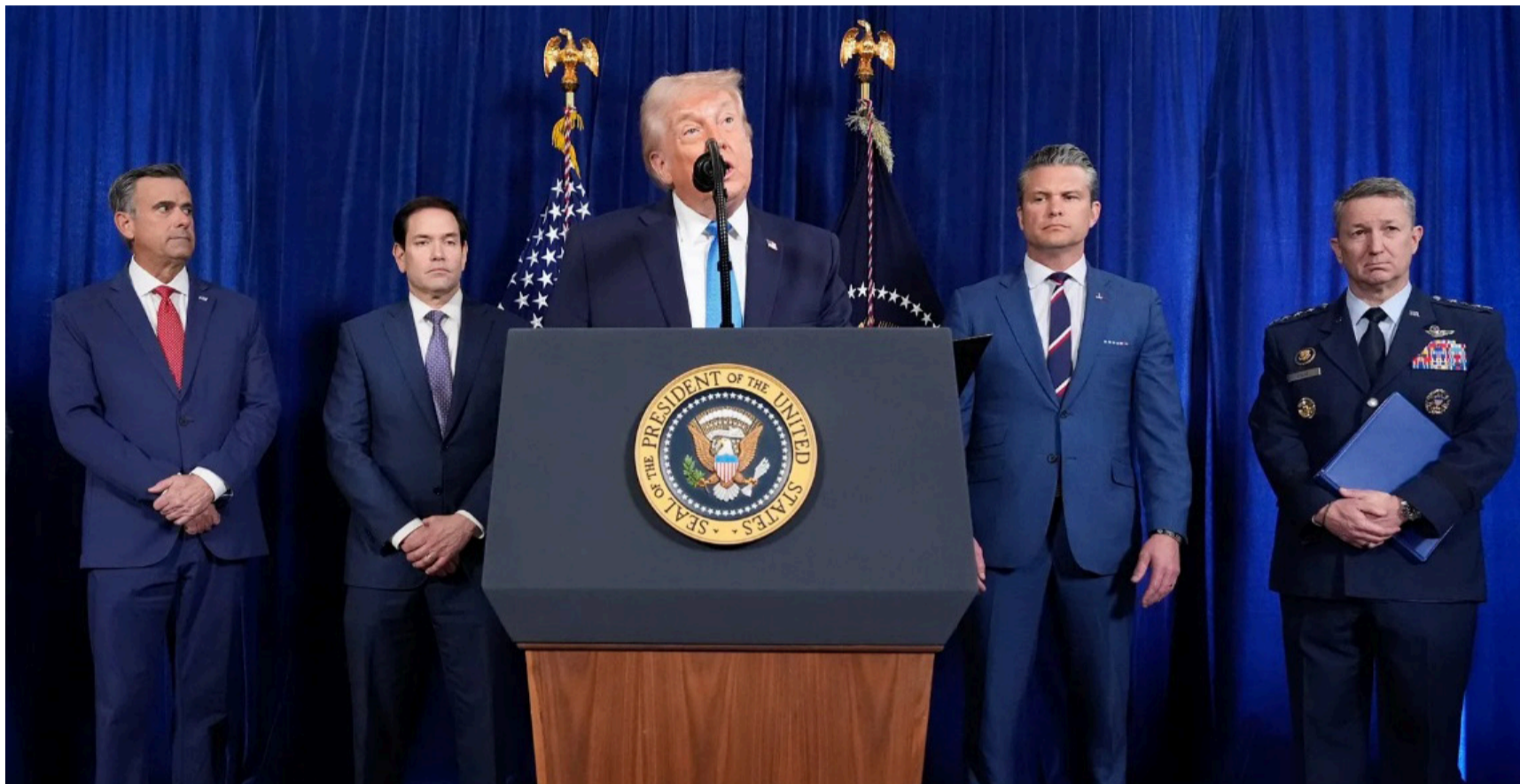
El presidente Trump no parece tener prisa por convocar elecciones mientras el control estratégico sea total.