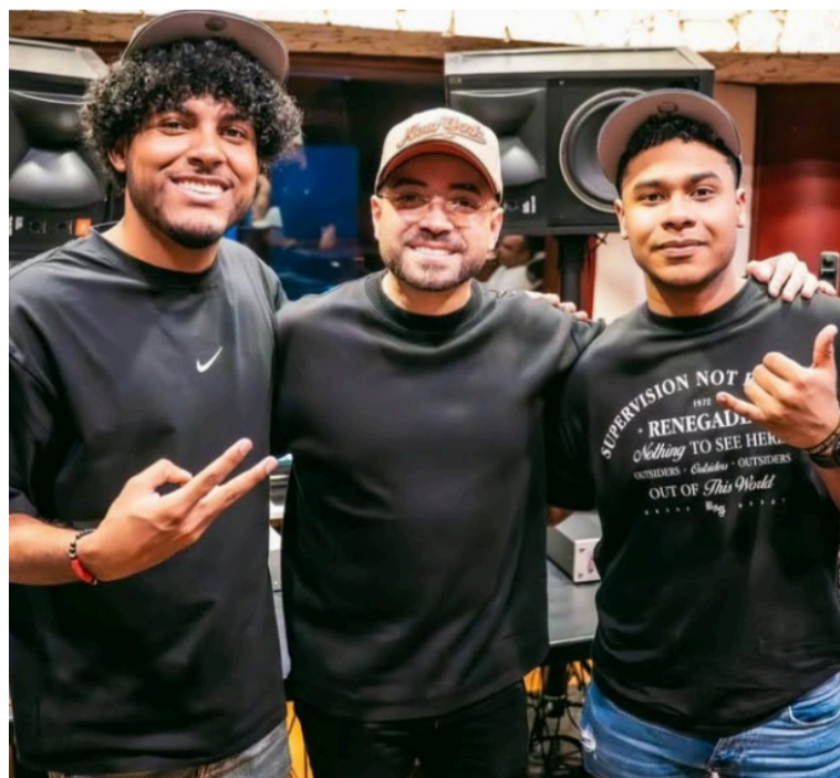
'Nacho' ha sido un artista exitoso impactando con sus canciones 'Niña bonita', 'Destino', y 'Me voy enamorando'.

Esta colaboración marca un puente generacional y de géneros, uniendo a los 'Silvestristas' con el fenómeno del 'Ferxxo' en una pieza musical que ya es tendencia antes de su estreno.