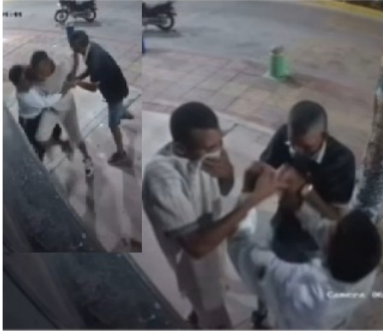
Las autoridades están analizando y verificando la información de las cámaras de seguridad.

En el video que se difundió en redes sociales se observan dos jóvenes en motocicleta, uno vestido de suéter negro con pantaloneta azul y el otro todo de blanco, quienes, ocultándose el rostro, intimidaron al vigilante di-