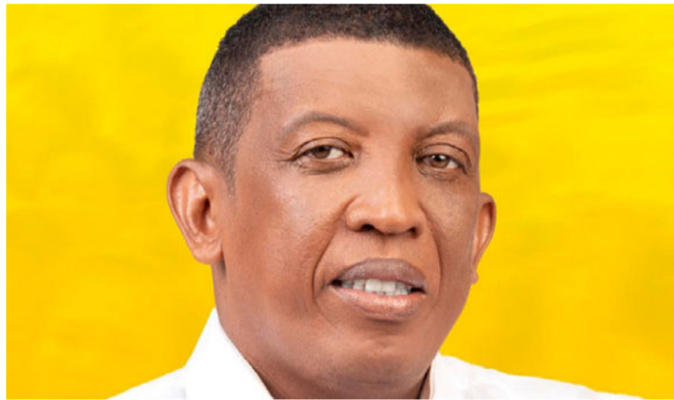
La Sala encontró reprochable la consecuencia aplicada por la comisión escrutadora departamental.

No obstante, resulta claro que, con ocasión de la