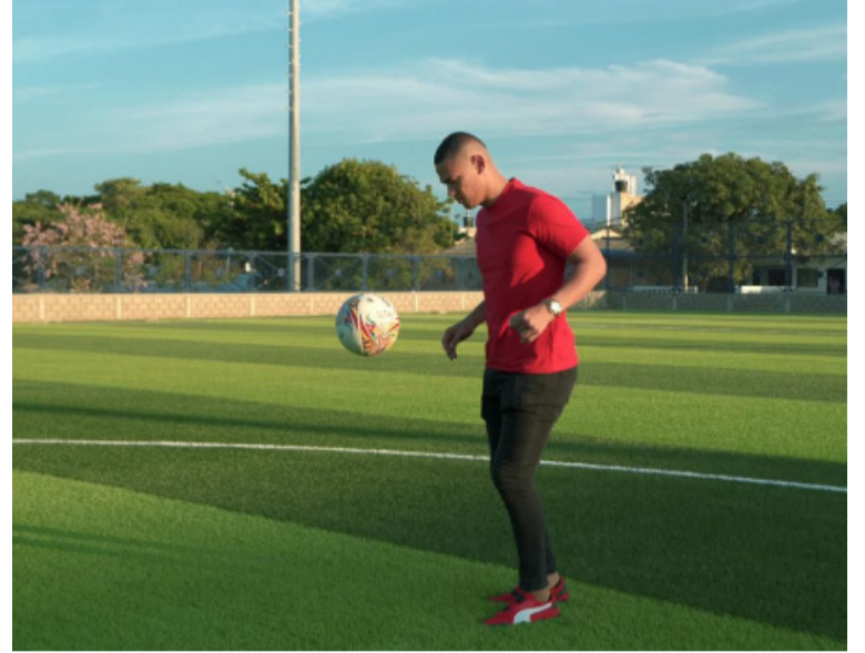
Con esta obra, la Gobernación de La Guajira ratifica su compromiso con el fortalecimiento del deporte.

Gracias a su esfuerzo, disciplina y vocación, muchos talentos lograron debutar en equipos nacionales e internacionales, incluso en ligas de países como Dubái. Más allá del fútbol, el profesor Rafael fue un guía y una figura