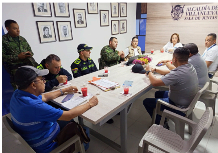
El secretario de Gobierno hizo un llamado a vivir los carnavales con alegría, pero también con responsabilidad.

Finalmente, la Administración municipal aseguró que se mantendrá atenta y brindando todo el apoyo logístico y operativo necesario para que las acciones de seguridad sean efectivas y permitan que Villanueva disfrute de unas fiestas culturales en paz y armonía.