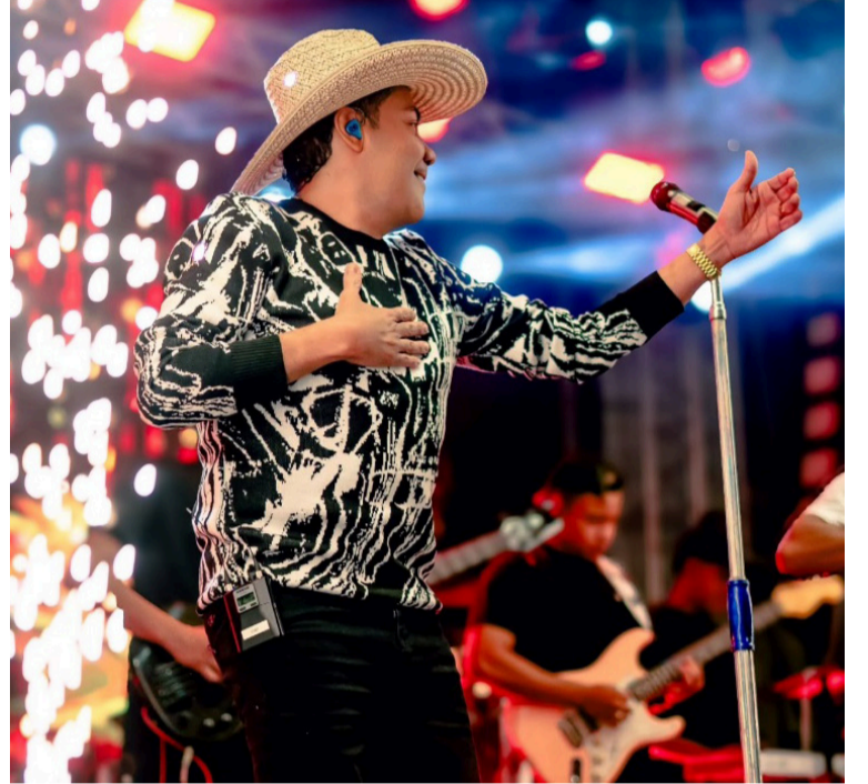
Para coronar este ambicioso lanzamiento, Díaz ha anunciado un desafío a la altura de su éxito.

Para coronar este ambicioso lanzamiento, Díaz ha anunciado un desafío a la altura de su éxito: la presentación oficial del álbum contará con dos fechas consecutivas en el Parque de la Leyenda Vallenata. Este histórico escenario será el termómetro que mida el impacto de una producción que busca equilibrar el sentimiento tradicional con la energía moderna que caracteriza al 'Churismo' en todo el país.