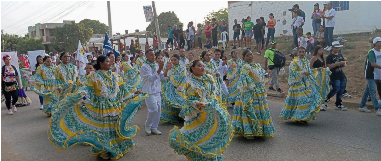
El Carnaval sale a la calle, pero lo hace en medio de una precariedad que se ha vuelto recurrente.