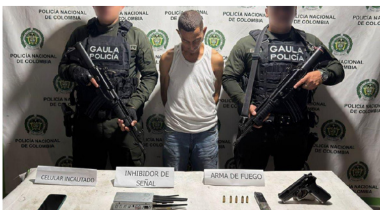
Alias 'El Viejo' estaría encargado de realizar amenazas y exigencias económicas a comerciantes y comunidad.

La Policía Nacional continuará adelantando acciones contundentes para garantizar la seguridad, la convivencia y el control territorial en el municipio de Maicao y en todo el departamento de La Guajira.