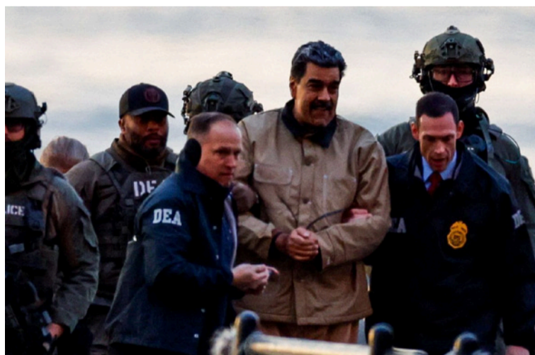
EE. UU. comprendió que no necesitaba demoler el edificio estatal para tomar el control de los servicios y recursos.