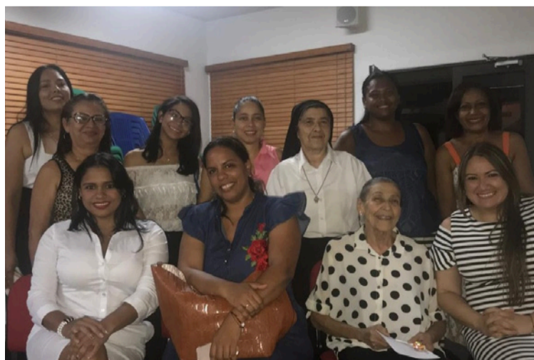
Sus nobles actos quedan como una imborrable huella en la vida de quienes la conocimos y compartimos con ella.

corazón para siempre independientemente del momento de la vida en el que estuviéramos. Ella siempre supo llegar con una palabra, una muestra de cariño o hasta una queja, pues también reclamaba afectuosamente ante cualquier atisbo de ausencia por larga o corta que está fuera.