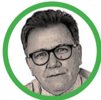
Por Indalecio Dangond

El crédito agropecuario debería ser el motor que impulse productividad, innovación y movilidad económica.