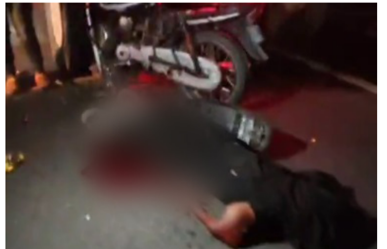
Se pudo conocer que tras el fuerte impacto la motocicleta quedó casi debajo del camión.

Hasta la zona llegaron las autoridades competentes quienes procedieron con los actos de urgencia. Se espera que para hoy se ofrezca un reporte completo para conocer en detalles cómo ocurrió este accidente de tránsito.