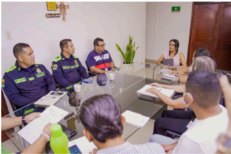
Las autoridades evaluaron los principales riesgos electorales, entre ellos la trashumancia electoral.