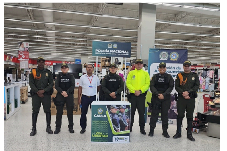
En caso de ser víctima de extorsión, comuníquese de inmediato con la línea de atención 165.