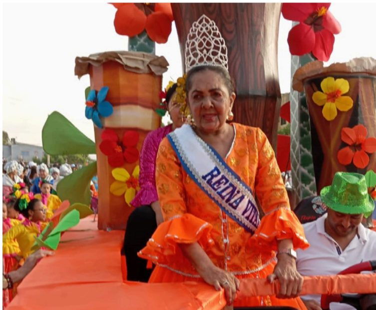
El Carnaval continúa realizándose gracias al compromiso de sus portadores, gestores y comunidades.

En ese proceso se evidenciaron con claridad las fortalezas del talento humano que gestiona y sostiene la festividad, así como los esfuerzos de fortalecimiento organizacional asumidos por varias agrupaciones de danza y música que hoy actúan como proveedores creativos del Carnaval. Quedaron, como en todo proceso institucional, tareas pendientes relacionadas con la continuidad de alianzas, el mayor empoderamiento de los actores culturales y la gestión de recursos adicionales. No obstante, ese período dejó instalada una base creativa y organizativa sólida, así