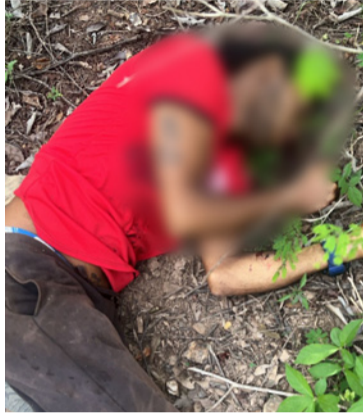
En la acción sicarial, dos hombres murieron y varias personas resultaron heridas.

junto al otro herido que huyó trabajaban en una finca donde ocurrieron los hechos, informaron algunos testigos que habitan en esta zona rural.