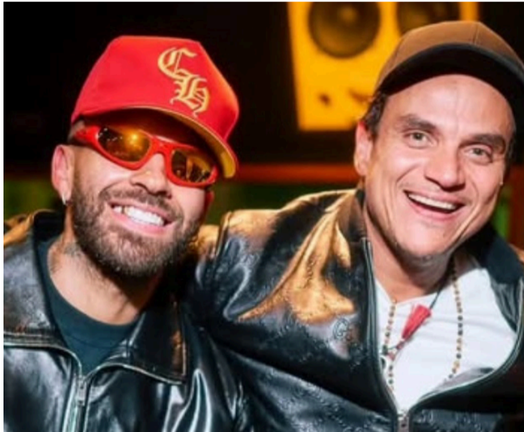
La expectativa estalló en plataformas digitales tras una publicación de Silvestre Dangond.

La expectativa estalló en plataformas digitales tras