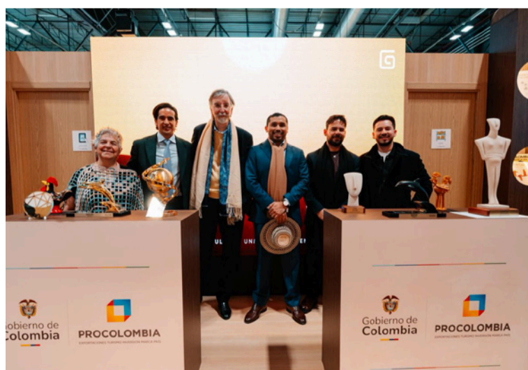
En doce meses, el Departamento incrementó en más de 100 % el flujo de visitantes internacionales.

Con este nuevo paso, el gobernador Jairo Aguilar Deluque a través de la dirección de turismo reafirma su compromiso con una promoción turística basada en resultados, respeto cultural y desarrollo territorial de largo plazo.