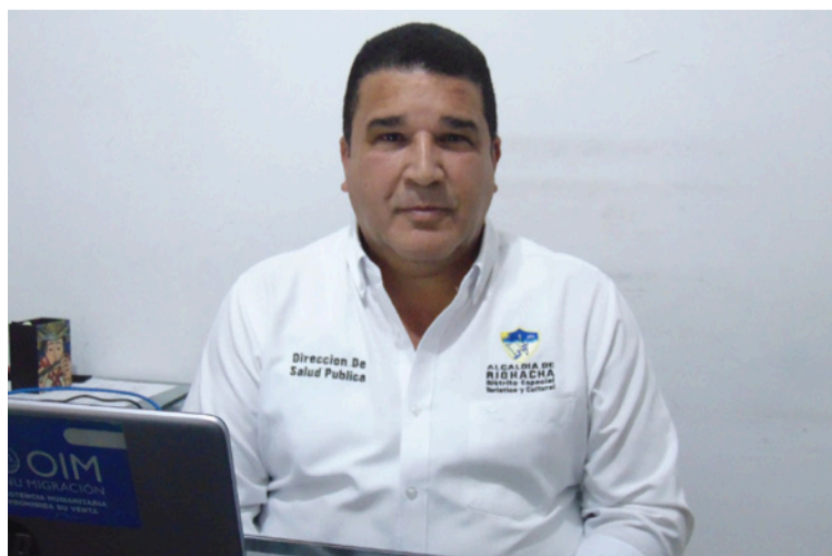
El director de Salud Pública destacó que hay variedad de biológicos según lo ha dispuesto el Gobierno nacional.

DESTACADO La Secretaría de Salud insistió en que es fundamental que la ciudadanía acuda a vacunarse y esté atenta a las visitas de los equipos que recorrerán todo el Distrito.