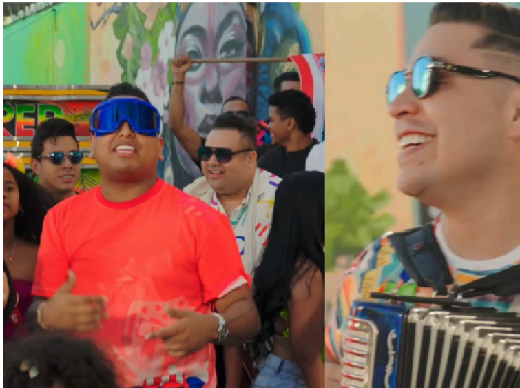
'Con la punta del palo' se presenta como una canción pensada para la fiesta, la calle y la parranda.