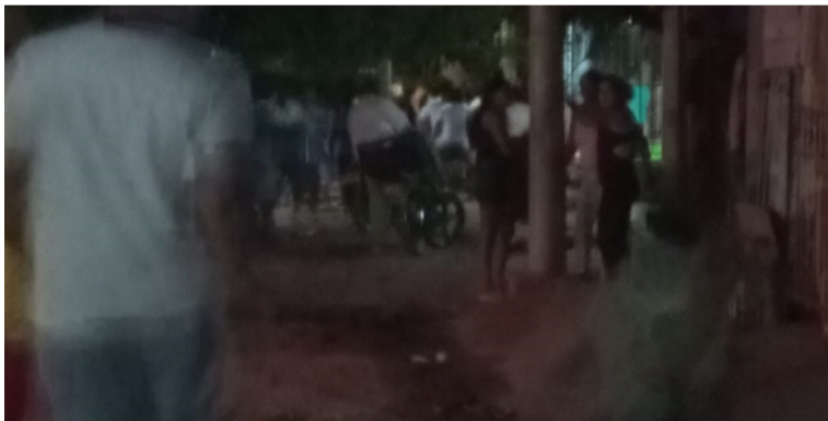
Se desconocían mayores detalles del suceso y si la víctima del atentado había fallecido.

Hasta el lugar de los hechos llegaron las autoridades competentes quienes procedieron con los actos de urgencia, recolección de evidencias y labores de vecindario en la zona, de igual forma, se trasladaron hasta el centro asistencial para proceder con el levantamiento del cadáver y el traslado a la morgue de Medicina Legal de Maicao.