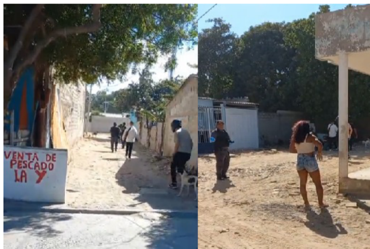
El operativo estaría relacionado con un allanamiento a un bien inmueble y la captura de varias personas.

Hasta el cierre de esta edición no se había entregado detalles oficiales sobre el resultado del procedimiento del operativo. Se espera que las autoridades emitan un reporte para esclarecer el alcance de la intervención adelantada en esta zona de la capital de La Guajira.