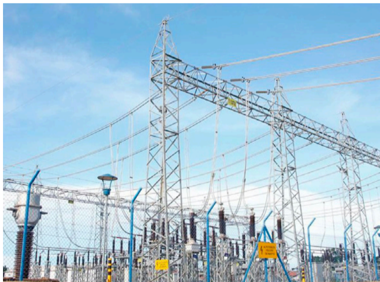
La contribución especial está contenida en el Decreto 0044 expedido al amparo del estado de excepción.

En el marco de la Emergencia Económica y Social, el Gobierno nacional estableció una contribución parafiscal del 2,5% a las empresas generadoras de energía, recursos con los que se busca "garantizar la continuidad, calidad, cobertura y sostenibilidad de la prestación del servicio público domiciliario de energía eléctrica" en todo el país.