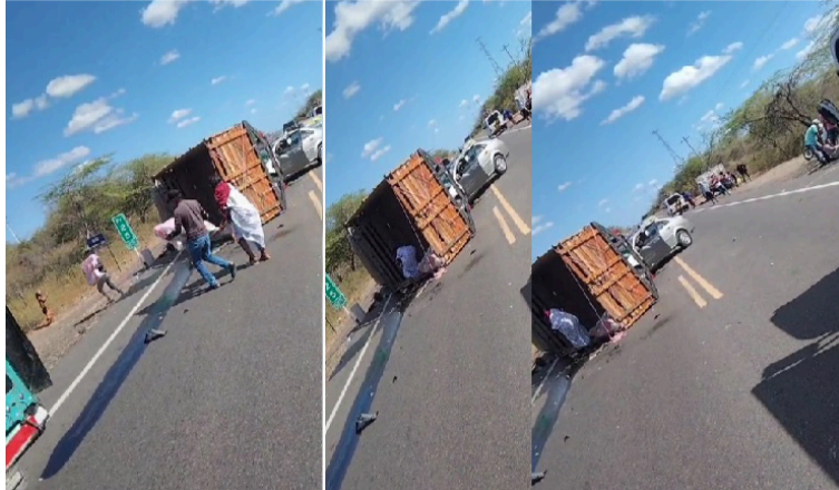
En video quedó registrado el momento en que personas de la etnia wayuú sacan bolsas y sacos de la camioneta.

Este accidente vial dejó como resultado varias personas heridas, quienes fueron auxiliadas y trasladadas a clínicas en