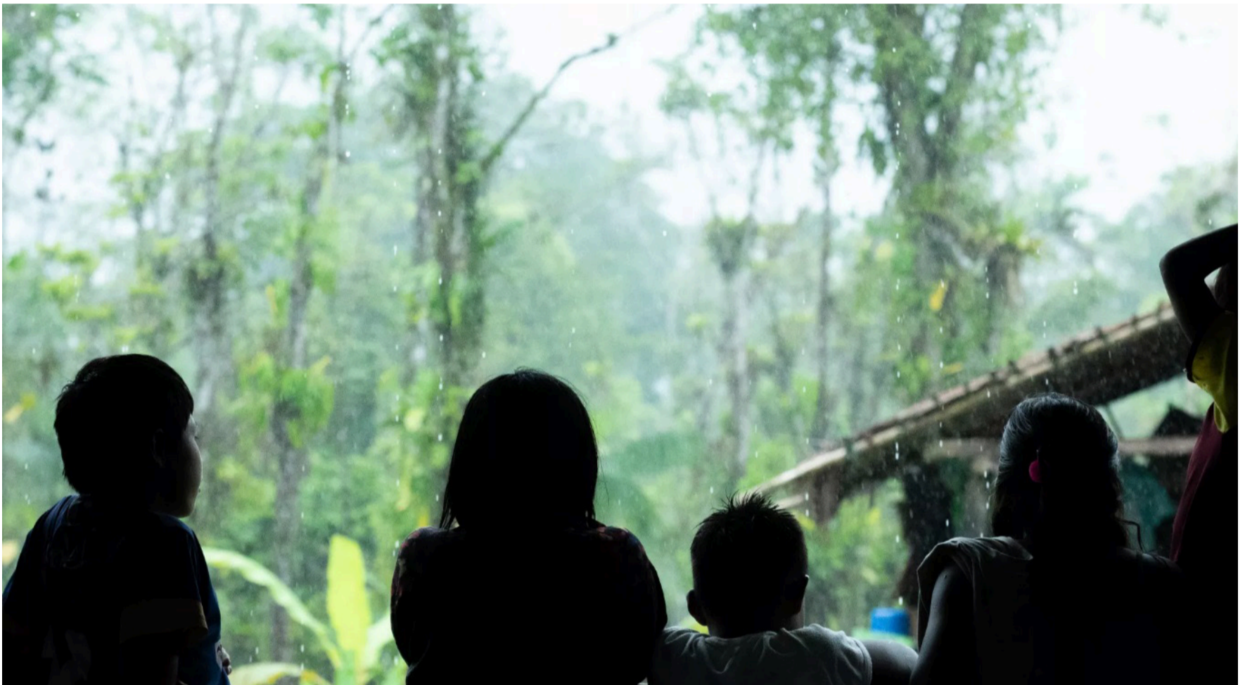
La mayoría de las víctimas son niños y adolescentes hombres, aunque las niñas siguen representando una proporción significativa.

Casi la mitad de los casos corresponde a población indígena, lo que evidencia un impacto desproporcionado en comunidades étnicas.