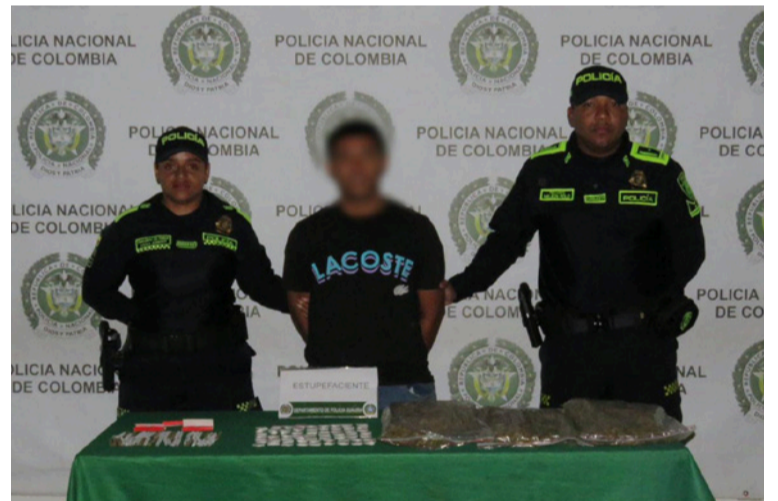
La persona capturada sería la encargada de la venta dosificada de sustancias estupefacientes en Riohacha.

quier hecho que afecte la seguridad, a través de las líneas de emergencia y los canales institucionales.