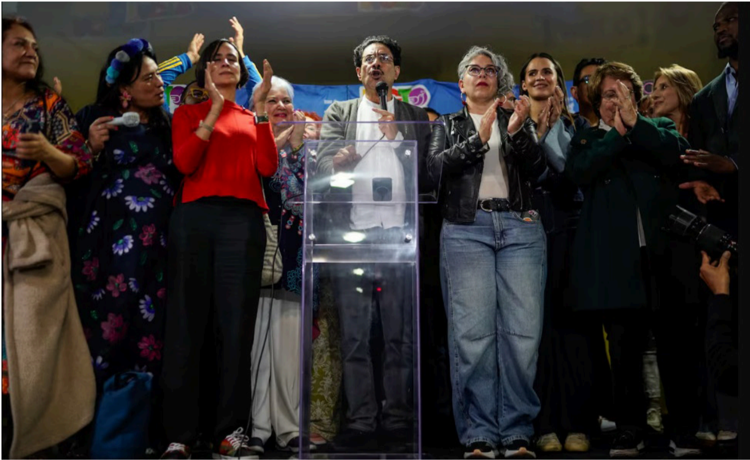
El error de Iván Cepeda no es solamente infantil; es conceptual, normativo y jurisprudencial.