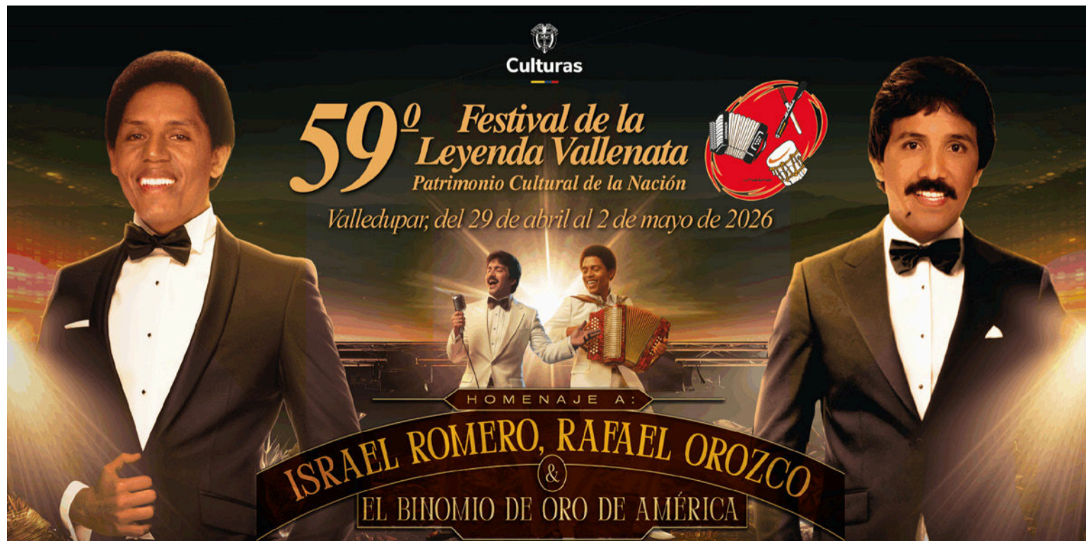
La ciudad de Valledupar se prepara del 29 de abril al 2 de mayo de 2026, para recibir a miles de visitantes.

Valledupar se prepara del 29 de abril al 2 de mayo de 2026, para recibir a miles de visitantes en una grandiosa celebración cultural, folclórica y musical que unirá tradición, memoria y evolución en una sola voz, la del vallenato que sigue escribiendo su propia historia y contando detalles de la vida diaria.