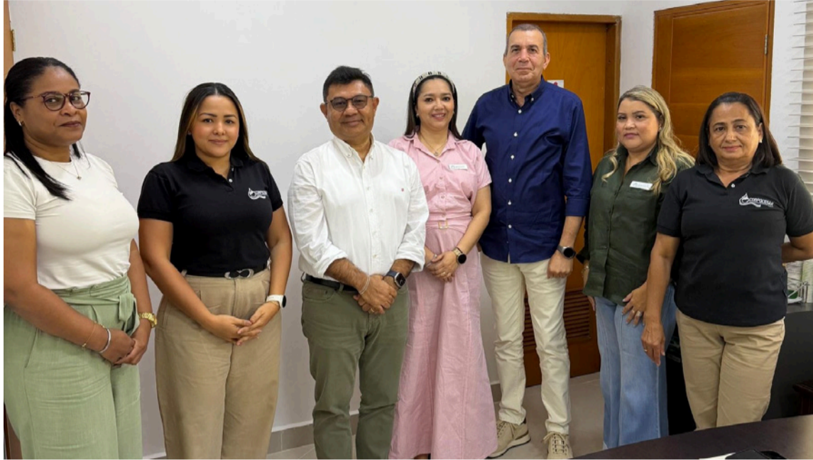
Se busca articular estrategias con las comunidades indígenas de los tres departamentos.

De igual manera, se definieron actividades para avanzar en la formulación del Pomca del río Ariguani y se concertó una agenda de trabajo conjunto para la implementación