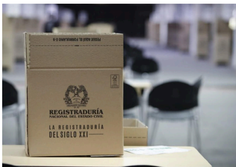
Hoy algunos candidatos al Congreso llegan a las comunidades a criticar y a juzgar a los líderes guajiros.

Por todo esto, y para concluir, los invitamos a votar por convicción, por las propuestas que redunden en beneficio de nuestra comunidad guajira. 'A lo tuyo tú', haga suya esta frase puesto que al propio le duelen las necesidades de su gente más que al que viene de otro departamento o región para recoger los votos y luego en sus agendas no aparecen las necesidades de nuestro Departamento o región. Vote por el que quiera, pero vote bien.