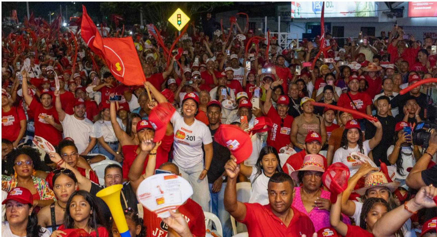
Hacer una campaña política de manera civilizada y respetuosa implica respetar la diversidad en medio de un diálogo con empatía.