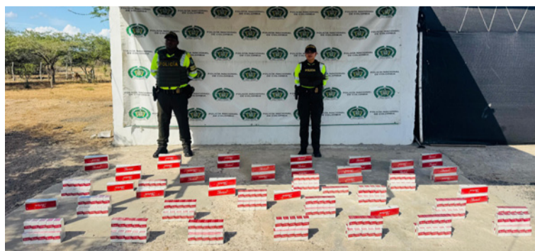
Un ciudadano no presentó documentación que acreditara la legalidad o procedencia de la mercancía.

La mercancía incautada fue dejada a disposición de la Dirección de Impuestos y Aduanas Nacionales (Dian), entidad encargada de adelantar los trámites administrativos correspondientes.