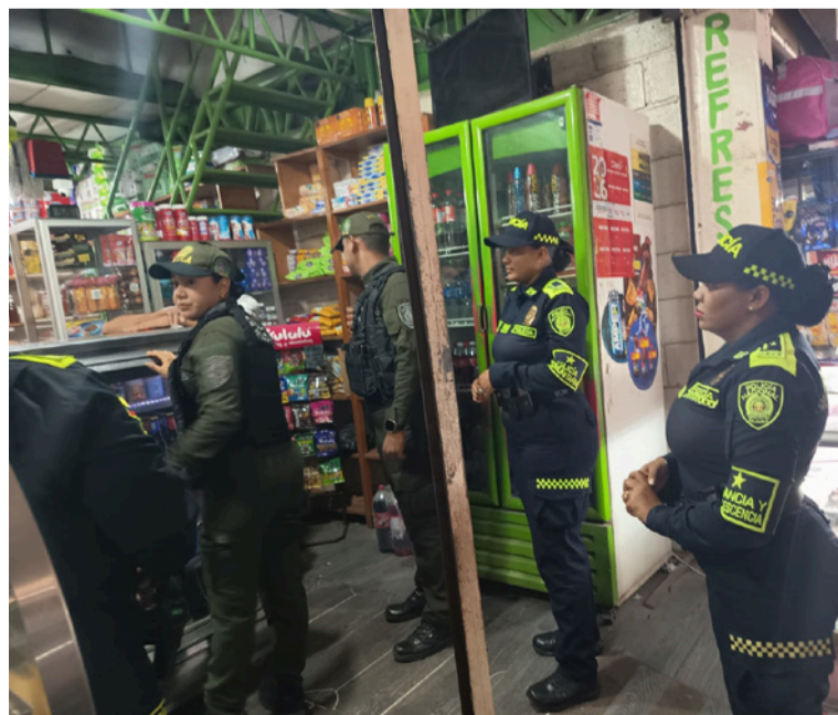
En la jornada, los agentes de policía brindaron recomendaciones de seguridad a comerciantes y ciudadanos.

En el marco del Trinomio de la Seguridad, la Policía Nacional, a través de la Policía Comunitaria, en articulación con el Gaula y el grupo de Infancia y Adolescencia, adscritos a la Estación de Policía Maicao, desarrolló jornadas de sensibilización orientadas a la prevención de delitos como el hurto al comercio, el homicidio, la extorsión y otras conductas delictivas en sus diferentes modalidades.