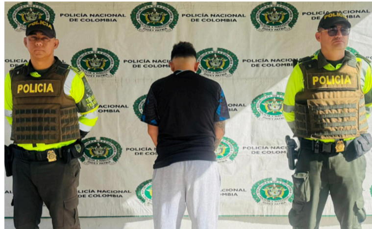
El capturado fue puesto a disposición de la Fiscalía General de la Nación para que responda por el delito.

El coronel Salomón Bello, comandante del Departamento de Policía La Guajira, se refirió al resultado