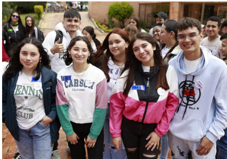
Se están revisando las condiciones de los ciclos de entrega posteriores, cuyas fechas podrían modificarse.

Asimismo, se están revisando las condiciones de los ciclos de entrega