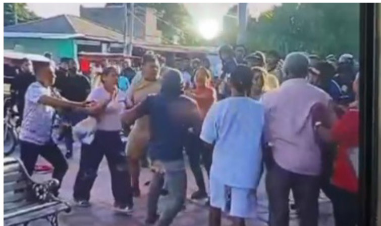
Especial preocupación genera lo ocurrido en el Hospital Santo Tomás, donde se presentaron alteraciones.

Las autoridades fueron enfáticas en rechazar cualquier tipo de violencia derivada de la pérdida de un juego o una apuesta. "No aceptamos como villanueveros que por perder un juego se llegue a riñas, pleitos o agresiones. Quien decide participar en estos espacios debe tener la ma-