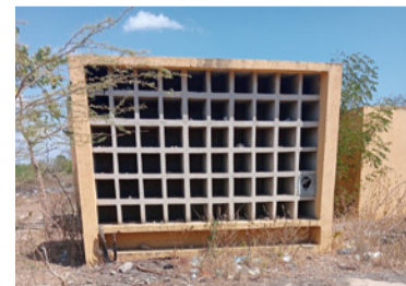
El camposanto había quedado abandonado.

debía servir para el descanso digno de los fallecidos se ha convertido en un basurero público y en una zona de consumo de drogas. La comunidad hizo un llamado para que recuperen el cementerio.