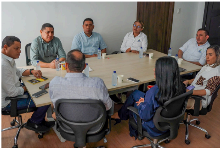
El alcalde señaló que el enfoque de esta estrategia es ordenar el servicio y generar corresponsabilidad ciudadana.

Durante el encuentro se socializó el diagnóstico actualizado del servicio de aseo, que identifica 27 puntos críticos asociados a la disposición inadecuada de residuos. A partir de este análisis, las entidades acordaron un plan de choque para priorizar la atención de estas zonas, reducir riesgos ambientales y sanitarios, y mejorar los tiempos de barrido y recolección.