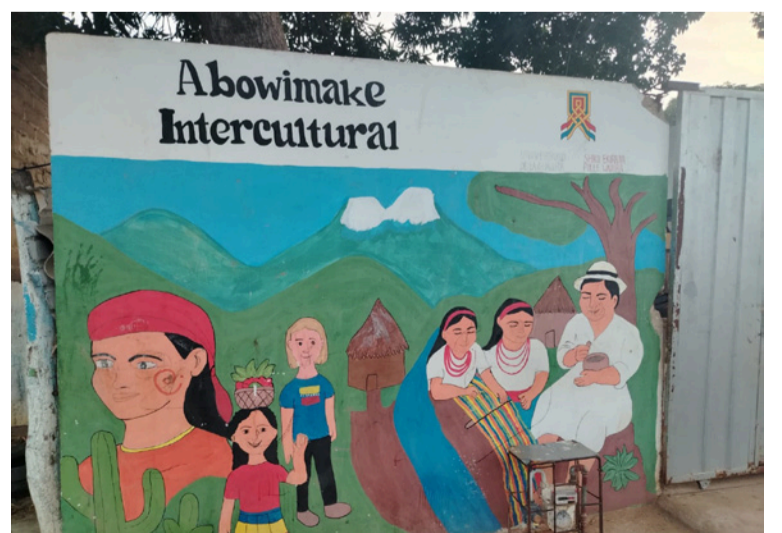
Con la intervención en Abowimake se demuestra que la escasez de recursos se suple con voluntad.

Bajo la estrategia País, los uniformados trabajan hombro a hombro con estos docentes para asegurar que el entorno escolar esté libre de riesgos. No es solo pintar paredes o vigilar accesos; es garantizar que cada estudiante, desde el más pequeño de primaria, sienta que su colegio es un territorio sagrado de paz y aprendizaje.