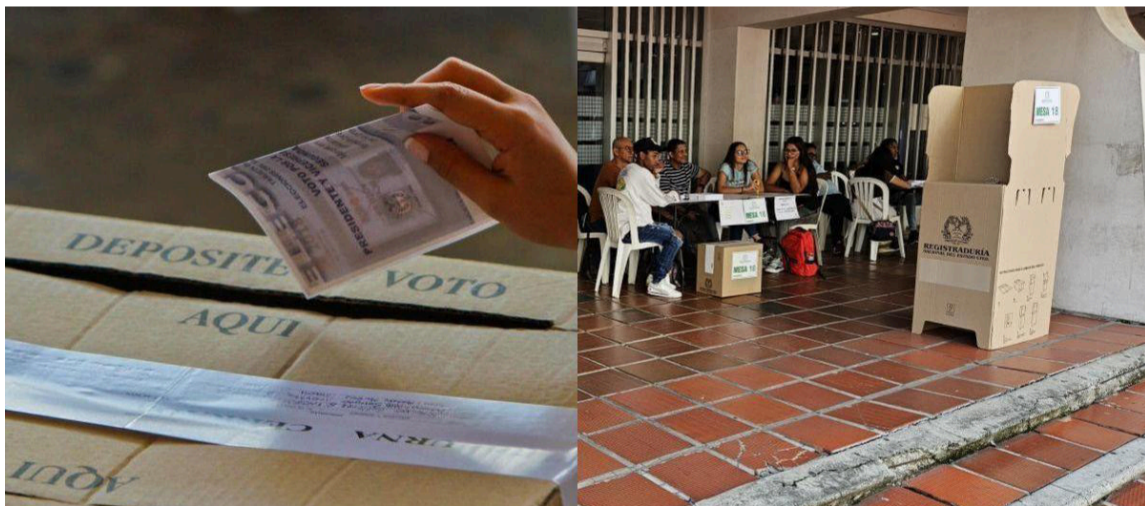
La obsesión de Cepeda por parecer 'bueno' y éticamente superior choca con la realidad.

El error de Cepeda no es solamente infantil; es conceptual, normativo y jurisprudencial. Al presentarse a una nueva contienda después de que el electorado ya se manifestó en las urnas en octubre, el senador envía un mensaje devastador, la voluntad popular es válida solo cuando coincide con sus intereses o cuando los nú-