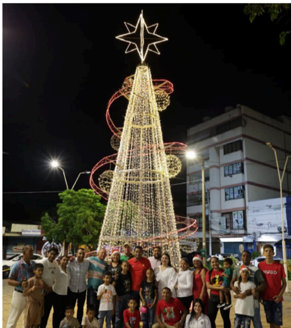
Se busca que visitantes y turistas encuentren espacios iluminados y atractivos para realizar sus compras.

El proyecto de iluminación, instalado principalmente en la zona céntrica, contempla puntos estratégicos donde tradicionalmente se concentra el comercio formal e informal. La iniciativa busca garantizar que los maicaeros, visitantes y turistas encuentren espacios seguros, suficientemente iluminados