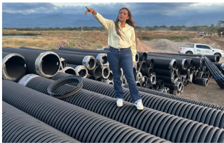
Explica la ingeniera que la obra representa un beneficio directo para todo el casco urbano de San Juan del Cesar.

Durante la inspección, se pudo verificar que la obra presenta un avance general del 30%, evidenciando progresos significativos en diferentes frentes de trabajo.