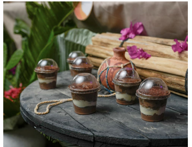
Bocados de dulce y sal que llenaron de sabor al jurado. El Tiramisu hecho con café guajiro, toda una delicia al paladar.