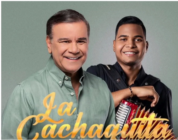
Se trata de un paseo vallenato cargado del tradicional sabor picaresco y la energía de las fiestas decembrinas.

De la autoría del reconocido compositor ‘Dachi’ Moya, ‘La cachaquita’ promete convertirse en el himno indiscutible para ‘prender las velitas’ en Colombia y el mundo. La grabación se realizó en