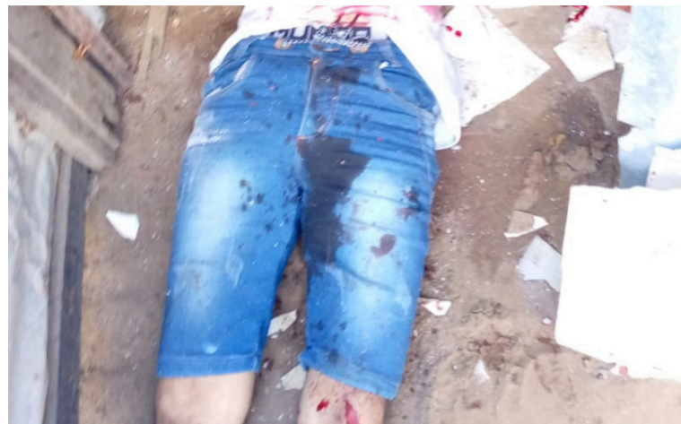
Se conoció que al parecer la víctima era sobrino de un líder comunal del barrio José Antonio Galán.

Asimismo, se estableció que esta persona se dedicaba al lavado de vidrios en el semáforo del Palacio de Justicia en Riohacha; además, según las investigaciones, el hombre habría estado privado de la libertad en el 2022 por el delito de hurto de celulares y porte ilegal de arma de fuego.