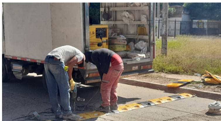
El supervisor indicó que la meta es reducir la velocidad de motos y vehículos, facilitando una movilidad más segura.

Según Noriega, la instalación de los nuevos resaltos tiene como objetivo principal proteger la vida y prevenir accidentes, especialmente en sectores donde el flujo de estudiantes y peatones es mayor. “Estos resaltos tienen la