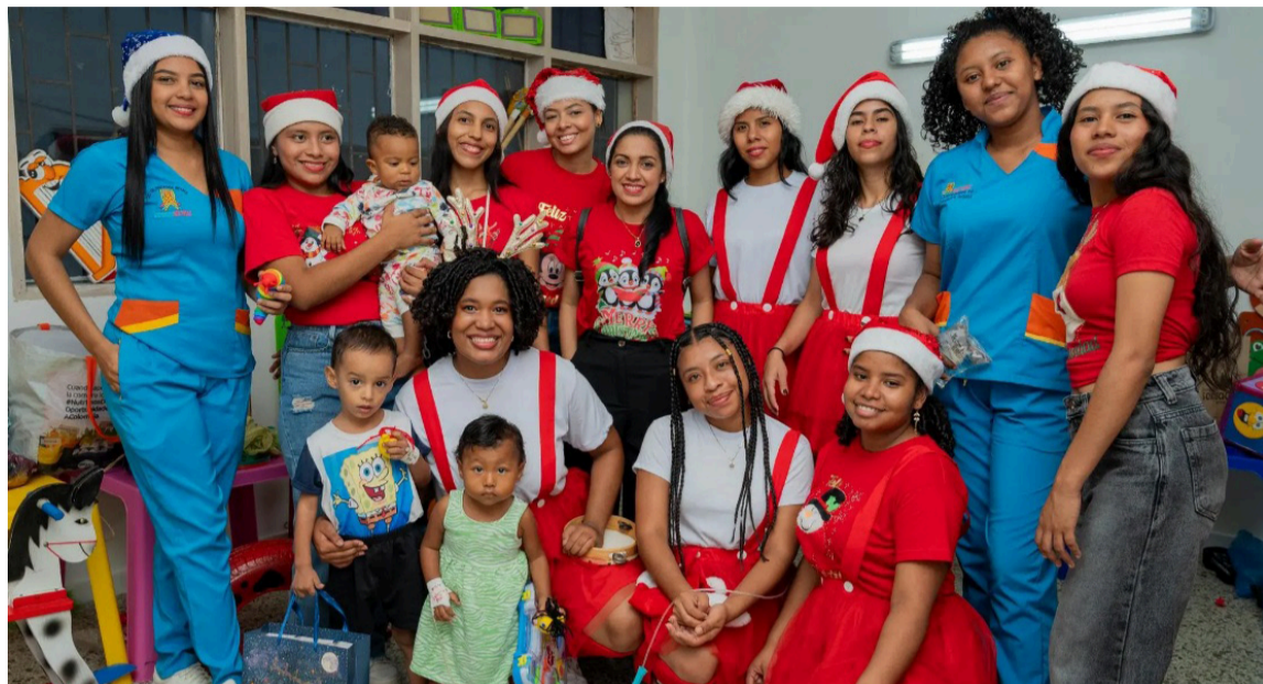
Estudiantes de Licenciatura en Educación Infantil compartieron con los pequeños.

Estudiantes de Licenciatura en Educación Infantil compartieron un momento lúdico con un bebé durante la jornada navideña realizada en el