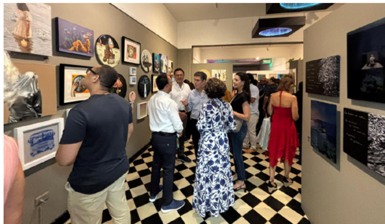
La feria ha impulsado un modelo de circulación accesible y dinámico que fortalece el coleccionismo.

Desde su creación, Sie7e 5inco ha evolucionado a partir de su primera edición —en la que contó con la participación de 35 artistas—, para convertirse en una feria que este año reúne a 150 creadores con más de 400 obras, reafirmando su compromiso con la