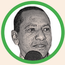
Por Jorge Nain Ruiz Ditta