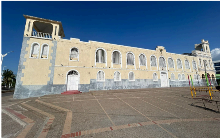
Monseñor explicó que, aunque la diócesis costea la formación de los seminaristas, las vocaciones han disminuido.

nera un vacío especialmente en la parroquia Divina Pastora, que requerirá una reorganización del clero local para garantizar la continuidad de los sacramentos y la guía pastoral.