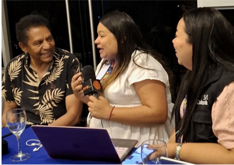
Codiscos señaló que es un honor inmenso renovar esta alianza en una ciudad tan simbólica para el vallenato.

Hablar de El Binomio de Oro es hablar de una revolución musical. Su estilo modernizó el vallenato sin perder su esencia; lo llevó a nuevas fronteras y lo convirtió en un referente internacional. El Binomio no es solo un grupo: es un movimiento que transformó el género y lo proyectó al mundo con elegancia, romanticismo y autenticidad.