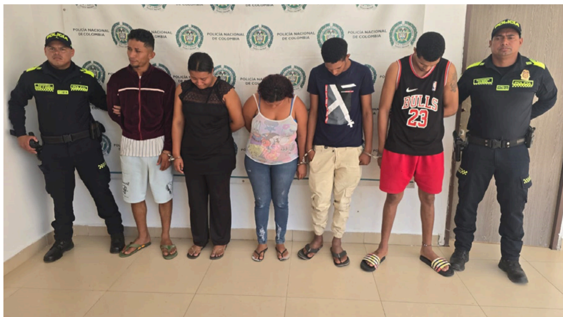
En operativos realizados en Fonseca, Barrancas y Riohacha, fueron capturados 7 presuntos integrantes del Clan del Golfo en el sur de La Guajira.