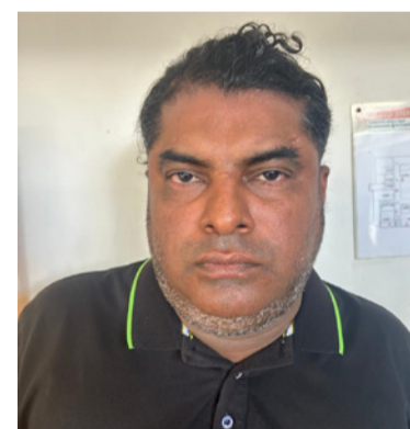
Se resalta la orden judicial en contra de alias 'XL'.

garantizar la seguridad de los habitantes de La Guajira y seguirá actuando con contundencia contra las estructuras criminales que amenacen la vida y la convivencia en el Departamento".