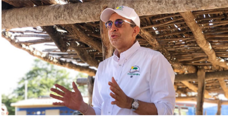
Corpoguajira invita a las comunidades wayúu, líderes tradicionales y ciudadanía apropiarse de esta herramienta.