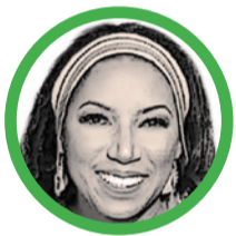
Por Marga Palacio