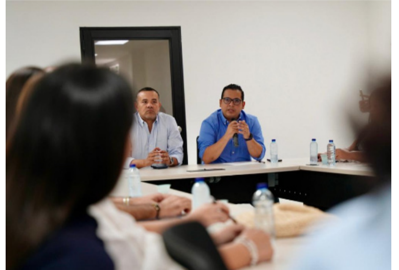
Representantes de cada municipio de La Guajira presentaron avances, retos y compromisos.

La Administración departamental reconoce y agradece el compromiso de cada municipio y de las instituciones convocadas, que asumieron la responsabilidad de avanzar en la implementación de acciones concretas para mejorar las condiciones de vida de la niñez y adolescencia guajira. Con este IV Conpos 2025, La Guajira reafirma su compromiso con una ges-