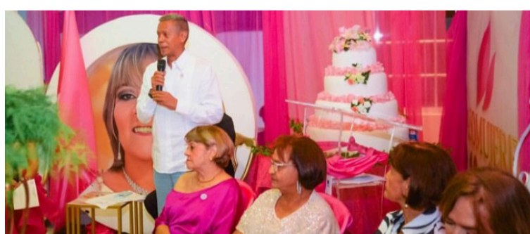
Asomujeres se centra en el apoyo comunitario directo, la equidad de género y la visibilización de las mujeres.

El momento que más nos impactó: 'el día diferente', un día en que un número de mujeres vulnerables, dejan atrás por completo sus sombras ese día, sus miedos, sus angustias y después de pasar por retoques como maquillajes, arreglo de ca-