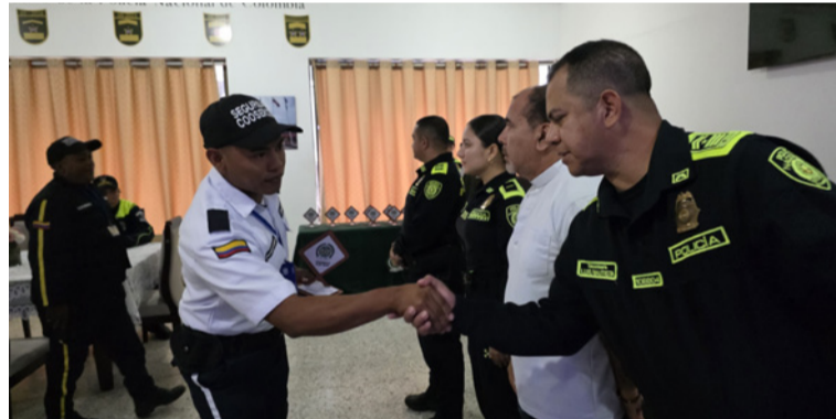
Durante el evento, se destacó el papel de la vigilancia privada como 'la quinta fuerza de seguridad del país'.

El Departamento de Policía Guajira, bajo el liderazgo del coronel Salomón Bello Reyes, conmemoró el Día nacional de la vigilancia y seguridad privada en una ceremonia dedicada a reconocer la labor silenciosa, disciplinada y esencial que cumplen quienes integran este sector en todo el país.