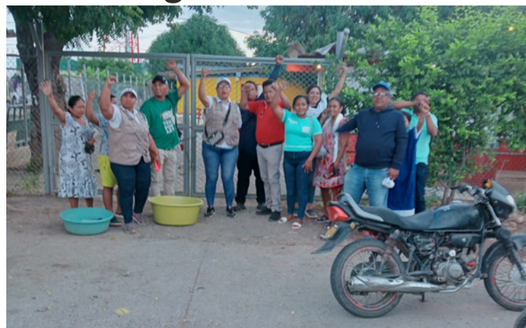
La comunidad protestó por las constantes fallas en la prestación del servicio de agua potable en varios barrios.

Los líderes comunitarios aseguraron las entradas del lugar colocando candados en las puertas, lo que impidió el ingreso del personal operativo de la