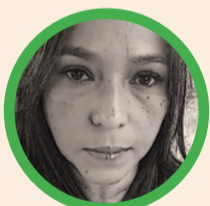
Por Anais Suárez Cerpa

Al final, el tecnofeudalismo no es un destino inevitable. Es una configuración de poder que puede, y debe, ser desmontada. Porque no cambiamos posesión por acceso. Cambiamos economía por dependencia. Y esa dependencia —disfrazada de innovación, envuelta en promesas de conexión— es la nueva cadena. Desatarla requiere algo más antiguo que cualquier algoritmo: conciencia colectiva, ética política y el coraje de imaginar un mundo donde la tecnología sirva a la vida, y no al revés. Porque: "Quien controla el acceso, controla el comportamiento. Y quien controla el comportamiento, ya no necesita reyes ni congresos: basta con un servidor y un contrato que nadie leyó."