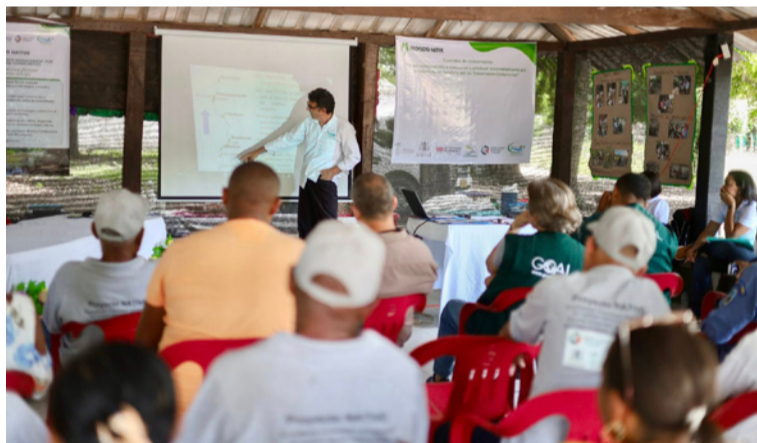
La iniciativa promueve la restauración ecológica, gestión participativa y sistemas productivos sostenibles.

Con el propósito de avanzar en la conservación de la biodiversidad y promover el manejo sostenible de los recursos naturales en La Guajira, Corpoguajira, la Fundación Herencia ambiental Caribe, la Fundación Centro recuperación de ecosiste-