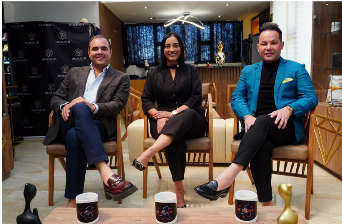
'El equipo' promete ser una producción que aporte información a la comunidad.

Desde ayer martes 2 de diciembre, el canal Telecaribe emite 'El equipo', la serie de 25 capítulos creada para ofrecer una mirada clara y responsable sobre los procesos físicos, psicológicos y sociales que pueden llevar a una persona a optar por procedimientos bariátricos o estéticos. A través de testimonios reales y conversaciones con especialistas, la producción busca informar, orientar y sensibilizar a la audiencia.