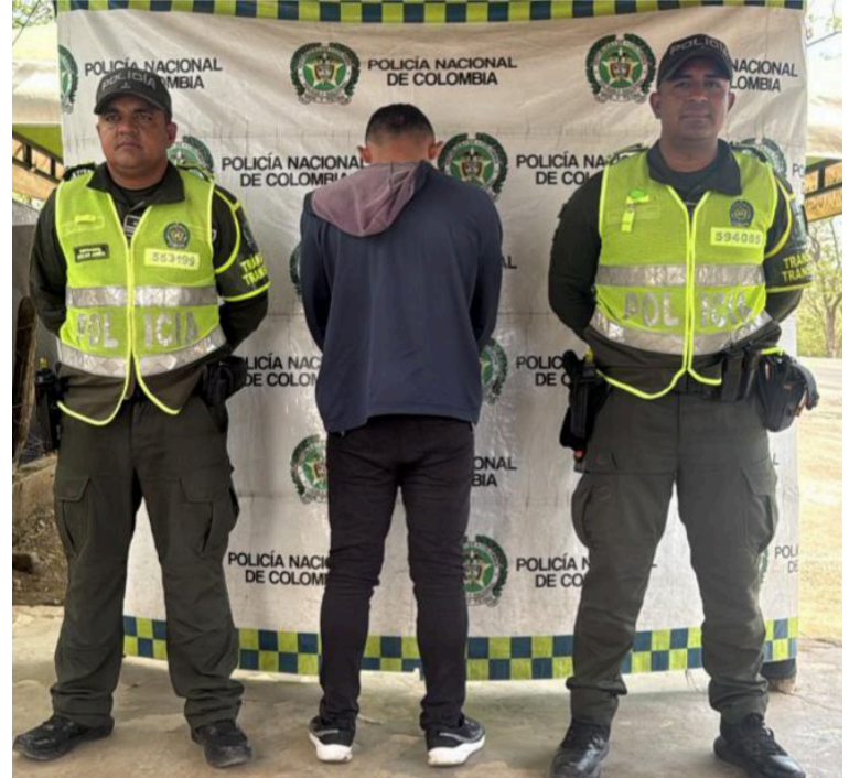
Los policías identificaron que la licencia de tránsito no cumplía con las características de autenticidad.

"Estas acciones permiten garantizar que quienes transitan por las vías del departamento cumplan con la normatividad vigente. La utilización de documentos falsos no solo constituye un delito, sino que pone en riesgo la movilidad y la seguridad vial", señaló el oficial.