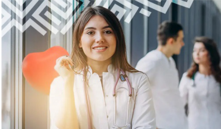
El evento contará con la participación de invitados especiales de reconocimiento nacional e internacional.

Bajo el lema 'Compromiso académico con la salud de La Guajira', el Primer Encuentro de Médicos de La Guajira tiene como propósito conmemorar el Día del Médico mediante un espacio dedicado al reconocimiento, intercambio académico y fortalecimiento de alianzas con quienes contribuyen diariamente al bienestar y la salud de la población, además busca consolidar un escenario de diálogo, actualización y