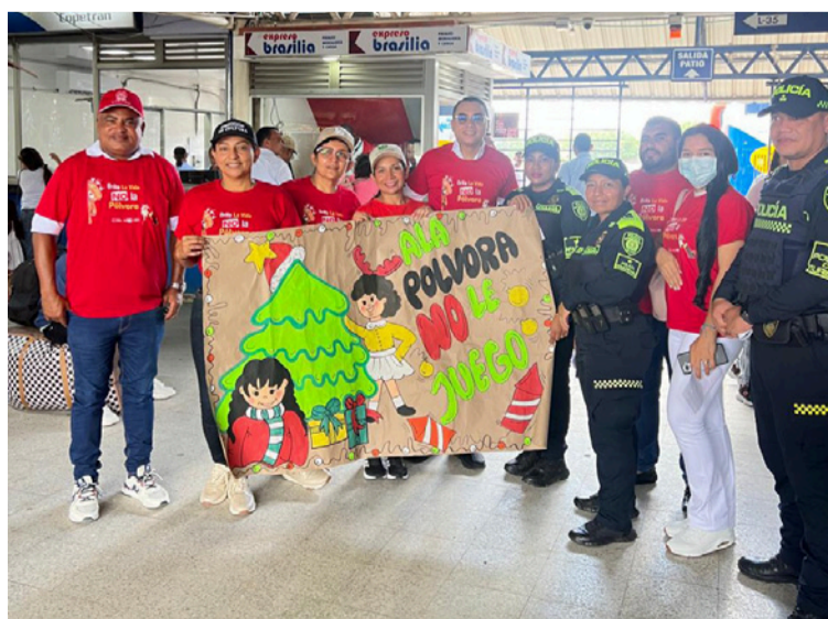
La iniciativa de la Policía Nacional busca proteger la integridad de niños, niñas, adolescentes y adultos.

Durante la jornada, los equipos policiales recordaron a la ciudadanía la importancia de cumplir estrictamente las disposiciones del Decreto, que busca proteger la integridad de niños, niñas, adolescentes y adultos, reduciendo los riesgos asociados a la manipulación de