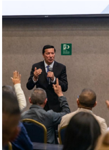
Hernán Penagos, registrador Nacional.

ampliada por la Secretaría de Transparencia, la iniciativa contra la corrupción cuenta con el apoyo de la Embajada de Estados Unidos, a través de la Sección de Asuntos Antinarcóticos y Aplicación de la Ley (INL), así como de la Oficina de las Naciones Unidas contra la Droga y el Delito (Unodc). Dicho respaldo, advirtió la entidad electoral, se limita a la promoción de la denuncia ciudadana y "no tiene ninguna relación con el proceso ni con el software de escrutinio en Colombia".