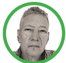
Por César Augusto Celedón

Debemos admitir sin contraréplicas ni artilugios dilatorios que la juventud colombiana, por supuesto es una destacada y apreciada minoría que no vive ni actúa para perder el tiempo en cuestiones superfluas, debemos conceptualizar que existen en la actualidad jóvenes preparados y distintos que bajo el manto animoso del liderazgo social poseen en su interior sangre nueva para nuestras vidas y para cambiar el mundo, ellos buscan en la