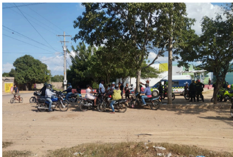
La mujer quedó herida en plena vía pública, mientras que el sicario huyó del lugar a bordo de una motocicleta.

Pasó a disposición de la autoridad que lo requería