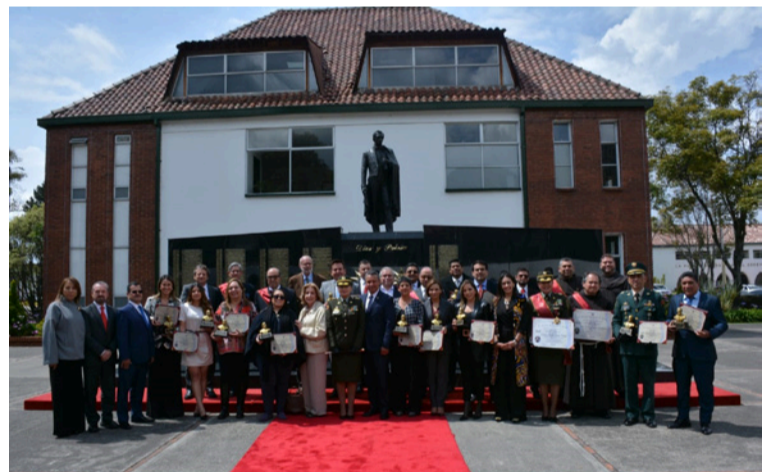
Periodistas y autoridades galardonadas por la Sociedad Colombiana de Prensa y Medios de Comunicación.