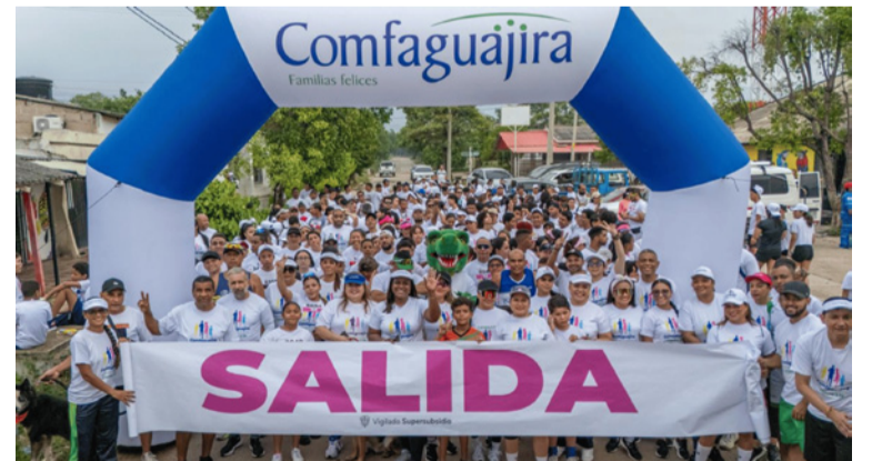
El torneo contará con 200 jugadores de cuatro grupos etarios -niñez, adolescencia, juventud y adultez.

La agenda integrará prácticas responsables con el ambiente, protocolos HSE para alimentos y acompañamiento de personal hablante de wayuunaiki para garantizar inclusión cultural. La convocatoria es abierta y gratuita a través de perifoneo, medios locales y canales digitales,