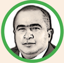
Por Arcesio Romero Pérez