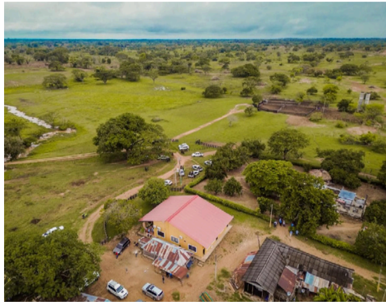
La entidad subraya que esta decisión, que negó la suspensión del acto de venta, fortalece la seguridad jurídica.

La Unidad para la atención y reparación integral a las víctimas (Uariv) destaca la decisión del Tribunal Administrativo del Cesar, que negó la medida cautelar de suspensión provisional de la venta solicitada en el proceso de nulidad y restablecimiento del derecho contra la Resolución 00158 de 2025, relacionada con la transferencia del predio 'La América' para su entrega a asociaciones