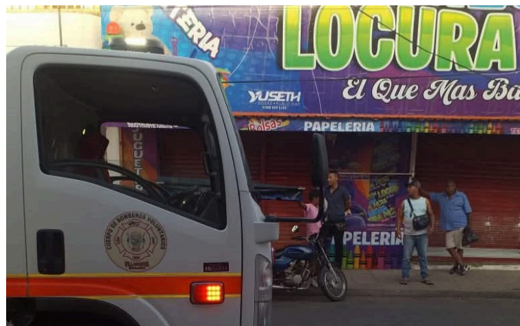
Tras controlar la situación, se efectuó una verificación del área, garantizando que no quedarán puntos calientes.

El organismo de socorro reiteró a la comunidad y al sector comercial la im-