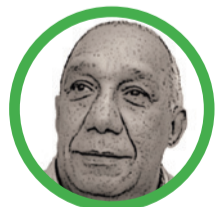
Por Hugues Gámez Gámez - Hugaga