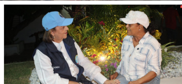
La alcaldesa recordó que esta obra es solo una de las varias intervenciones que se realizarán en Villanueva.