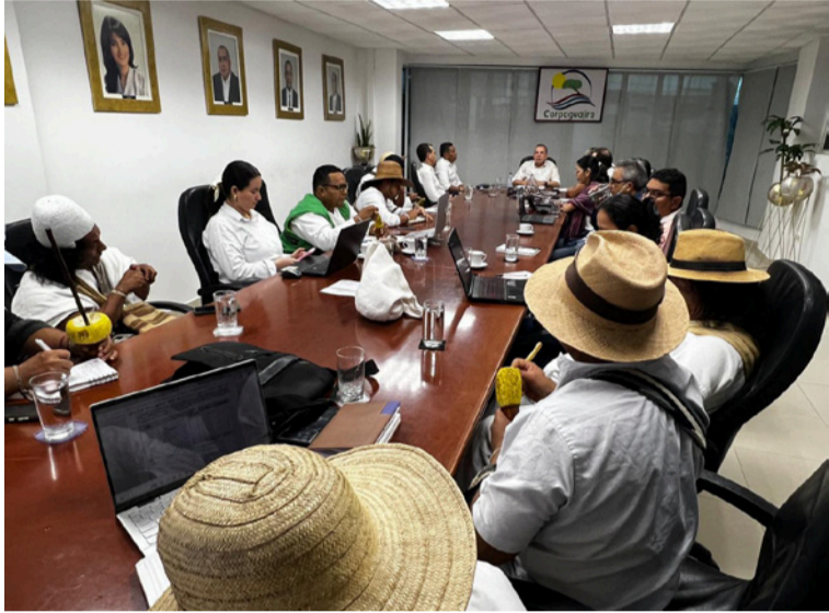
Se presentaron los acuerdos pactados conjuntamente para la preservación de este importante ecosistema.