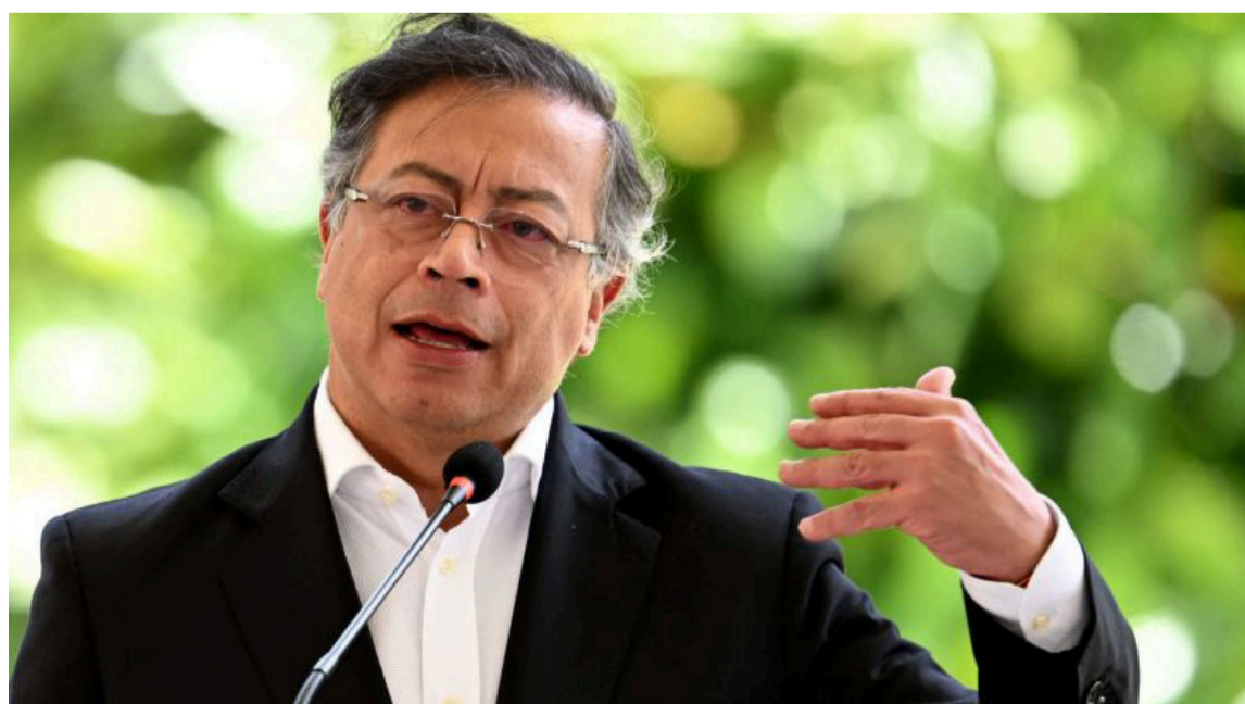
El CNE determinó la existencia de financiación irregular y una violación de topes.

DESTACADO La corporación resaltó su participación en la organización de la Semana por la Paz, iniciativa que se realiza anualmente y que, a nivel nacional, es liderada por Redepaz.