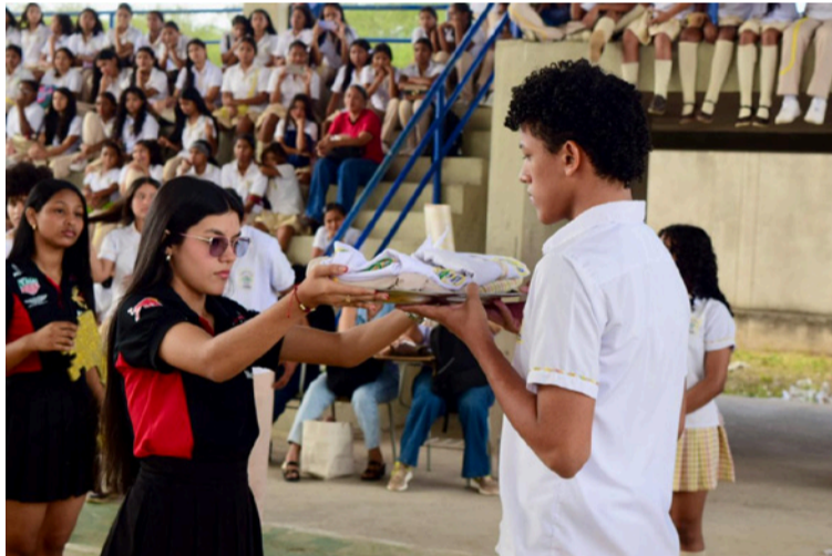
Ceremonia de entrega del uniforme, uno de los símbolos en la I.E. Técnica Remedios Solano de Barrancas.

Durante la ceremonia, los estudiantes de grado once entregaron los símbolos que representan la identidad de la institución: el escudo, la bandera, el himno, las llaves, el Proyecto Educativo Ins-