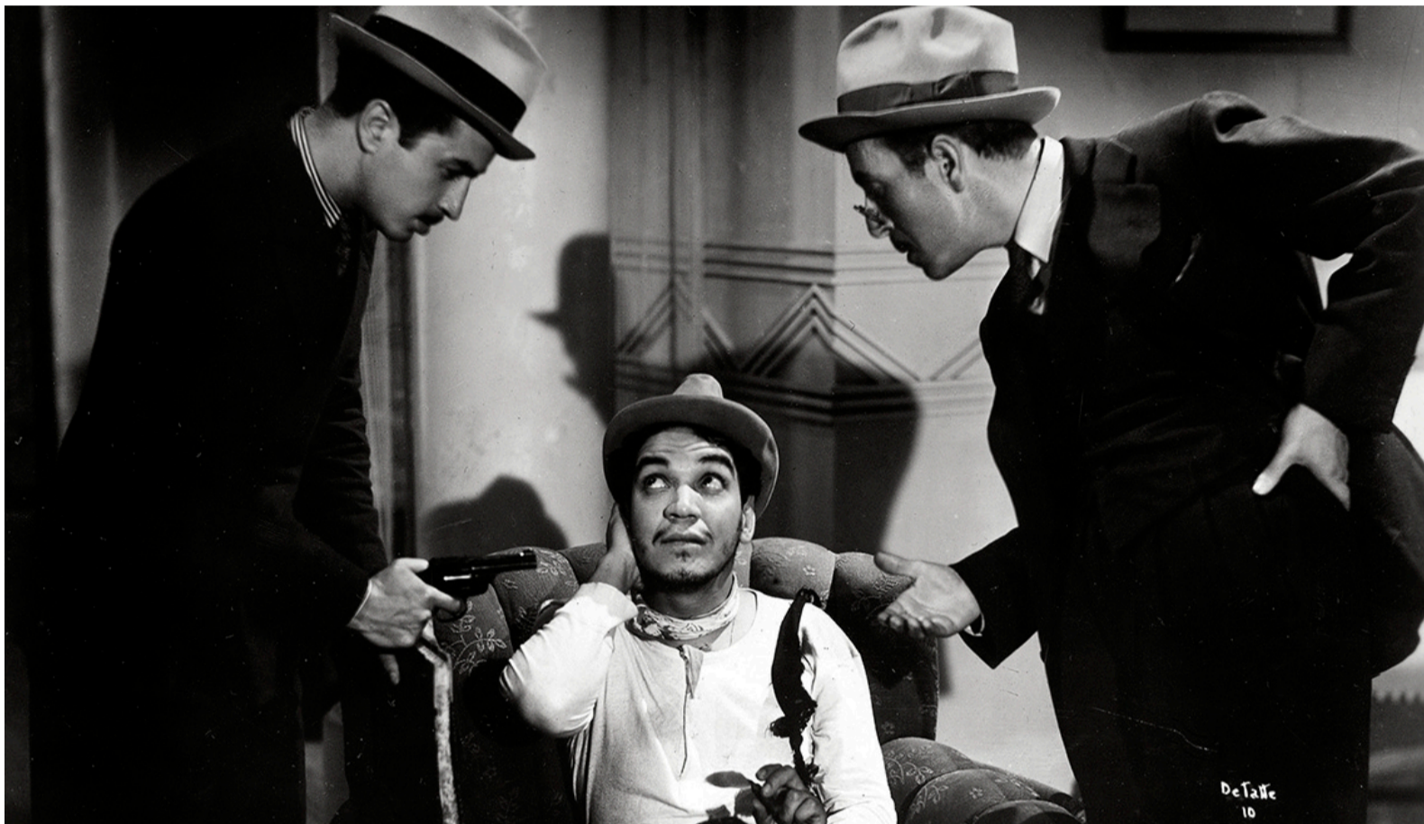
Uno de los actores preferidos por el público de esa sala: Cantinflas, quien este año hubiera cumplido 114 años.