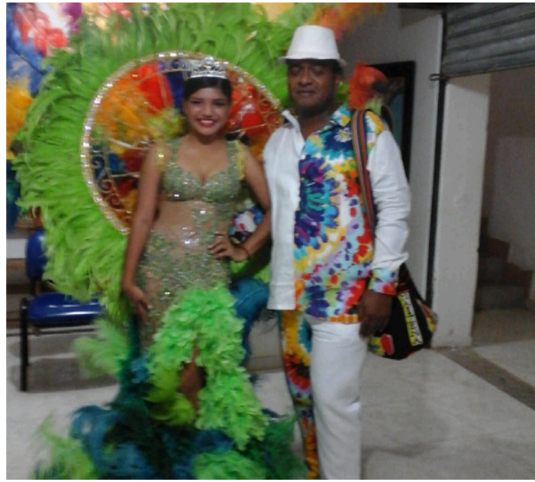
Como presidente del Carnaval de Uribia desde 1997, 'Pasi' ha logrado unir comparsas, barrios y sueños, regando alegría como quien riega maíz.

desde la forma amorosa y firme en que nos enseñó a reconocernos valiosas, a levantar la mirada, a no pedir permiso para brillar.