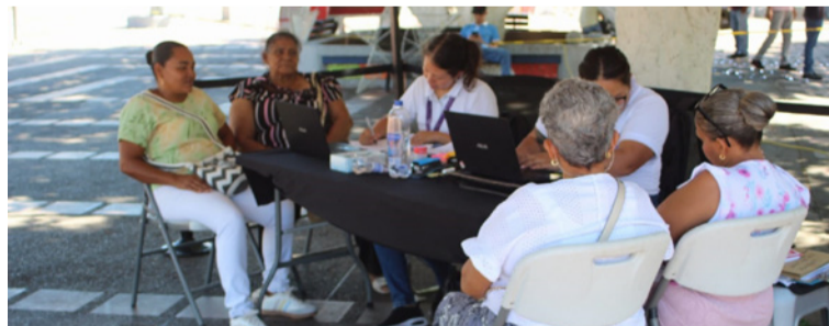
El Gobierno local de Villanueva, recuerda que muchas familias aún no saben qué pasó con sus seres queridos.

► 43 personas reportadas como desaparecidas quedaron asociadas a solicitudes formales de búsqueda.