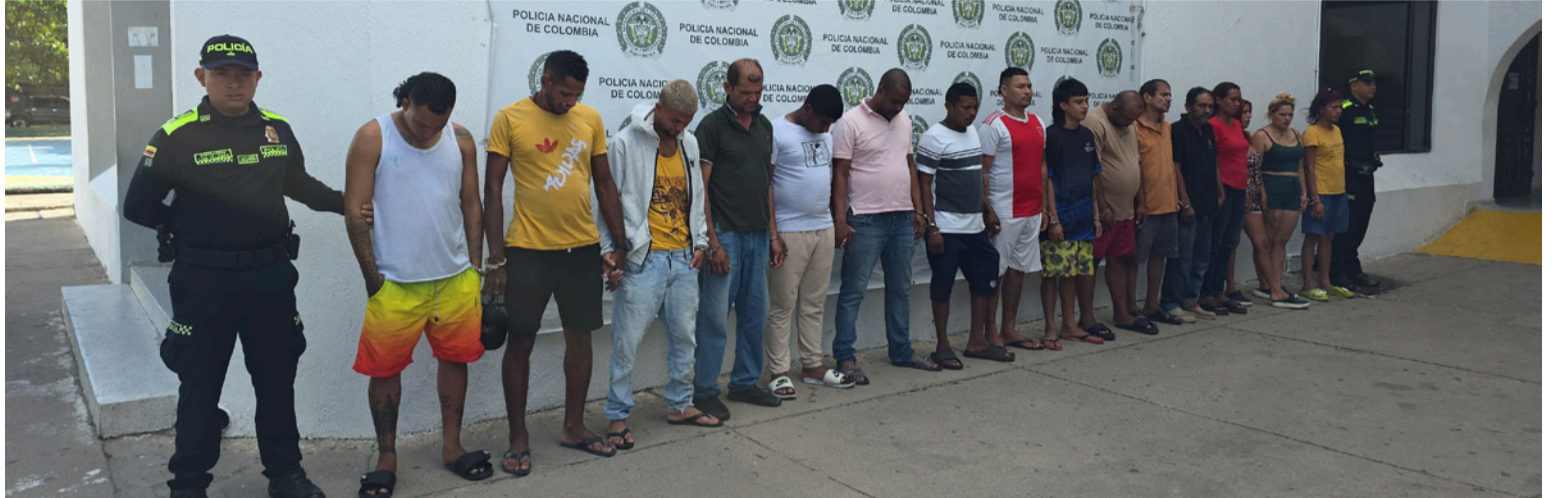
El grupo delincuencia expendía más de 5.000 dosis diarias, generando una renta criminal cercana a $20 millones.

Durante aproximadamente 10 meses de investigación, los uniformados recopilaban elementos probatorios y evidencia física que permitieron establecer el funcionamiento criminal de