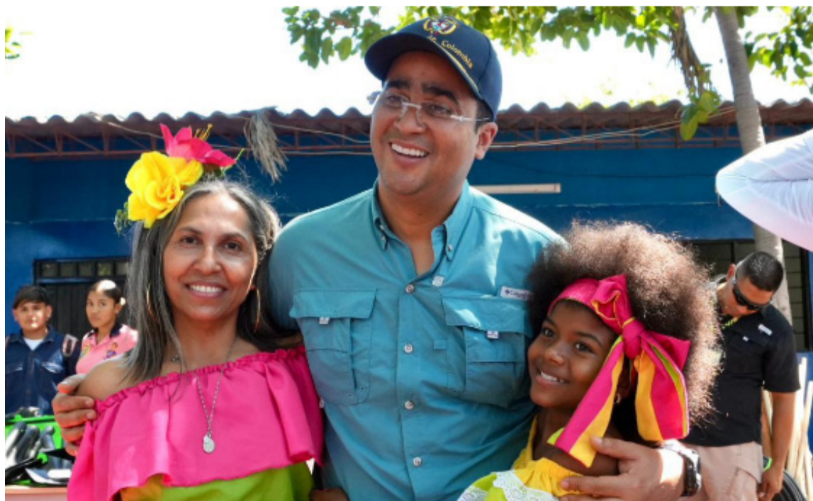
El mandatario lideró la entrega de insumos agropecuarios para tres instituciones.

A través de este trabajo y llegada a cada municipio del Departamento, la Administración, a través de la Secretaría de Educación, reafirmó su compromiso con el sur de La Guajira, llevando acciones concretas para transformar la educación y garantizar mejores condiciones de aprendizaje.