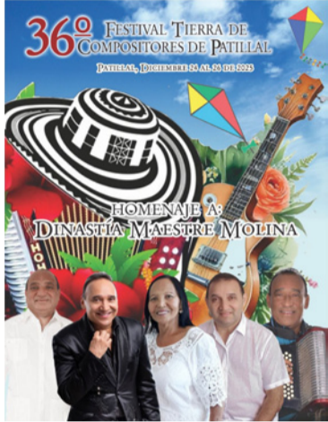
Serán tres días de festival, 24, 25 y 26 de diciembre.

Las inscripciones para los mencionados concursos se cerrarán el sábado 13 de diciembre de 2025 a