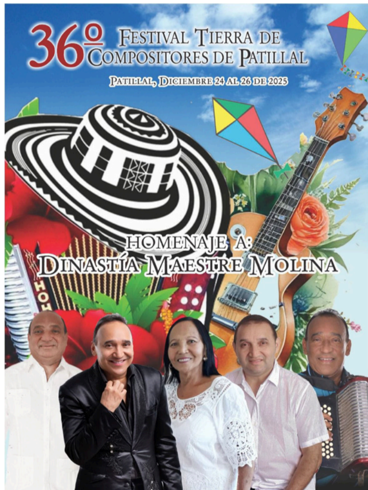
Afiche promocional del 36º Festival Tierra de Compositores de Patillal.