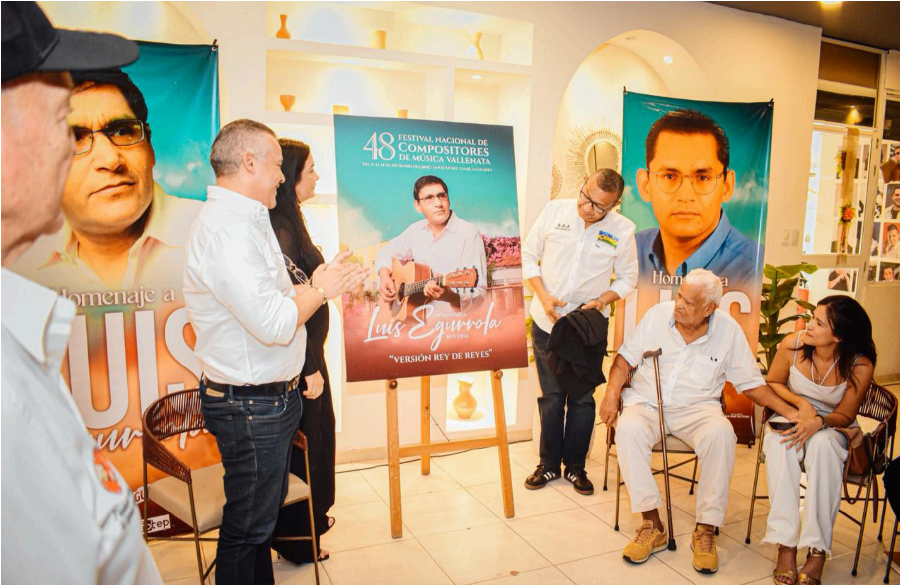
La versión 48 del Festival Nacional de Compositores es en homenaje al desaparecido maestro Luis Egurrola.