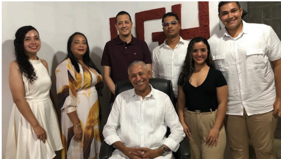
El director de LGH, rodeado de sus seres queridos, quienes han sido su apoyo.