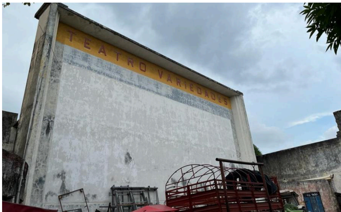
Al Cine Variedades (lo llamábamos teatro) para ver las películas que allí se exhibían.

Pero además de las películas cómicas y de muchísimas dramáticas y de vaqueros, nos deleitaban las bailarinas famosas de la época: María Antonieta Pons, Ninón Sevilla, 'Tongolele', 'Meche' Barba, Rosa Carmina y Amalia Aguilar, entre otras. Conformaban un verdadero 'ramillete de molinillos humanos' que hacía delirar a los cinéfilos de los años cuarenta hasta principio de los sesenta. ¡Qué recuerdos nos dejaron los cines de Santa Marta! Sobre todo el Variedades, con su clientela fiel, aunque sin remordimientos a la hora de buscar películas de su agrado en las pantallas de La Morita, el Colonial, el Paraíso, el Popular y el Carioca... El teatro Santa Marta -el único que existía en la ciudad- era cosa aparte. Su merecida distinción no se prestaba para que el espectador expresara sus emociones sin ataduras. Era, se decía, 'de caché'. Los cines sin techo desaparecieron para siempre. ¡Es el progreso!, te van a decir.