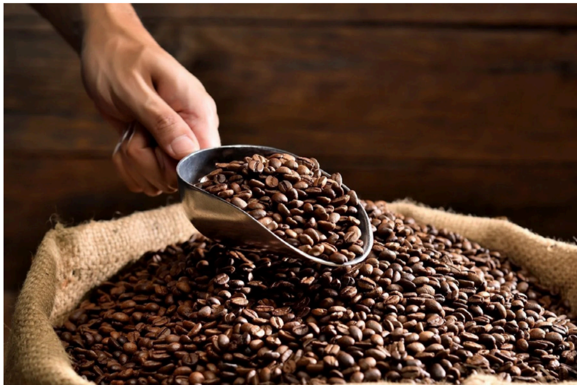
Es normal que por las calles de Villanueva, especialmente en el barrio El Cafetal, los cafeteros sequen el producto para su venta a la Federación de Cafeteros.