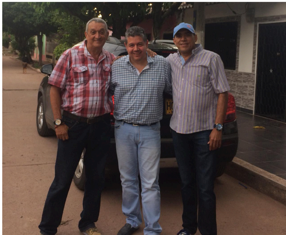
En El Cafetal, el barrio de Villanueva en donde todos se consideran hermanos, predomina el respeto en un ambiente folclórico y cafetero.

leas que el excelente dirigente gremial dio en foros y en reuniones de toda índole.