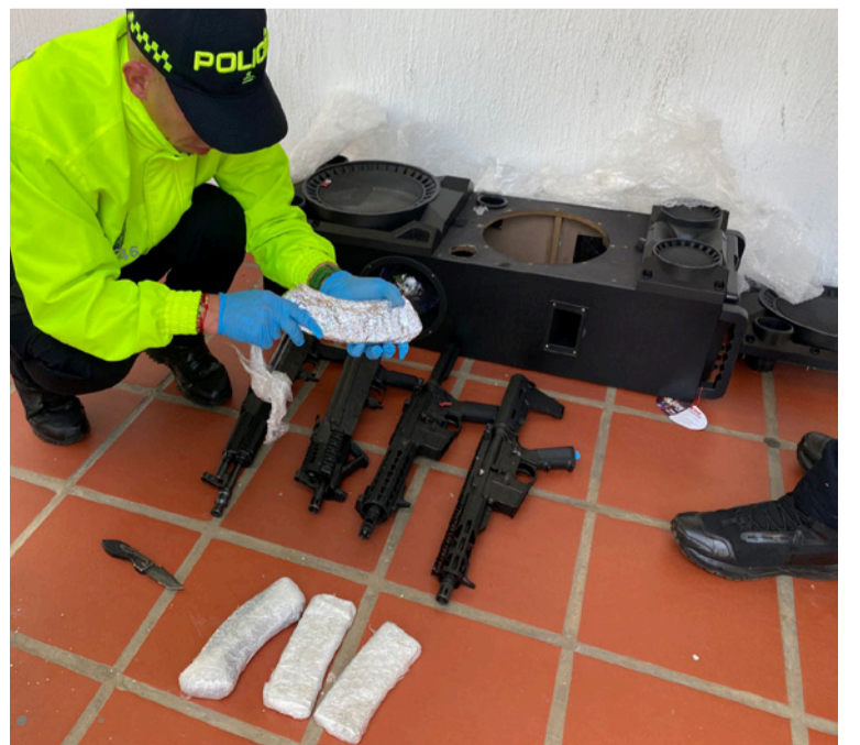
La Policía Nacional indicó que el capturado y las armas de fuego incautadas fueron puestas a disposición de la autoridad judicial competente.