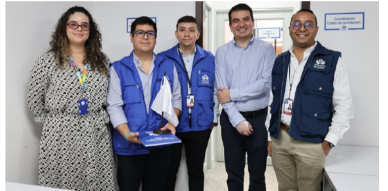
Cualquier persona natural o jurídica puede acceder de manera gratuita a los servicios que se ofrecen.

Cualquier persona natural o jurídica puede acceder de manera gratuita a estos servicios para tramitar asuntos de carácter civil, familiar o comunitario, así como procesos susceptibles de mediación penal. El servicio incluye acompañamiento de conciliadores y mediadores certi-