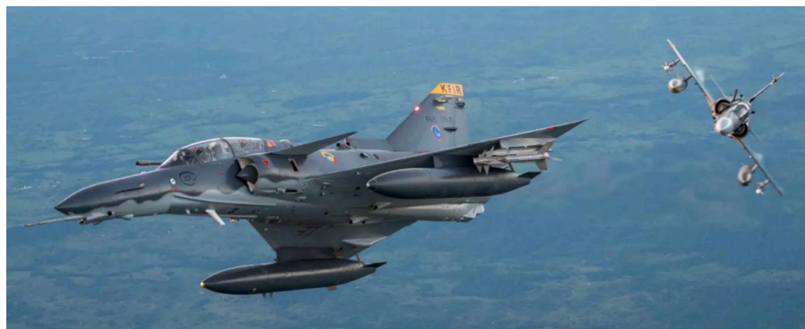
El Estado aparece con fuerza para la foto, pero desaparece para proteger a ciudadanos.

Colombia no necesita ministros que bombardeen con palabras, necesita líderes que actúen con responsabilidad. Porque mientras el poder juega a la ficción, la gente sigue cayendo en la realidad. Pero la verdad, tarde o temprano, emerge entre los escombros y cuando eso ocurra, el humo se disipará, dejando al descubierto lo que siempre fue, un espectáculo vacío en medio de la tragedia nacional.