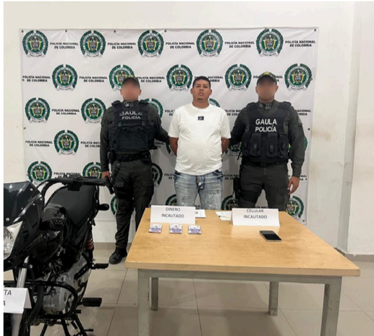
Al capturado se le incautó un celular y material probatorio de importancia para el proceso judicial en curso.

Gracias a labores de inteligencia, seguimiento y a las denuncias oportunas de la comunidad, se logró establecer el modus operandi de una estructura criminal que exigía sumas de dinero a comerciantes locales, afectando su tranquilidad y actividad económica.