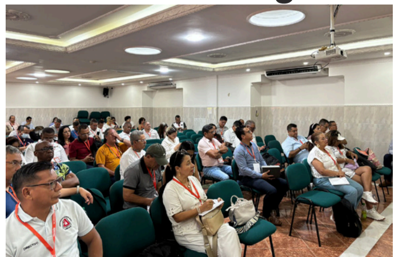
Luego del encuentro, los maestros esperan que sea ejecutado el modelo de salud del Magisterio.

Luego de este encuentro los maestros esperan que avance y sea ejecutado de manera positiva el modelo de salud del Magisterio colombiano.