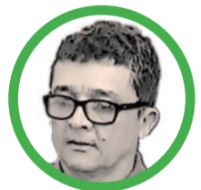
Por Luis Hernán Tabares Agudelo