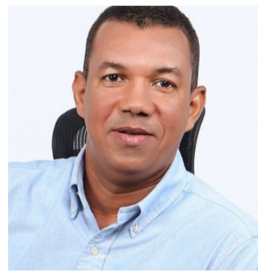
Olimpo Núñez, diputado de La Guajira.

El diputado, expresó que es urgente tomar las medidas para garantizar la vida de quienes transitan en las vías de La Guajira.