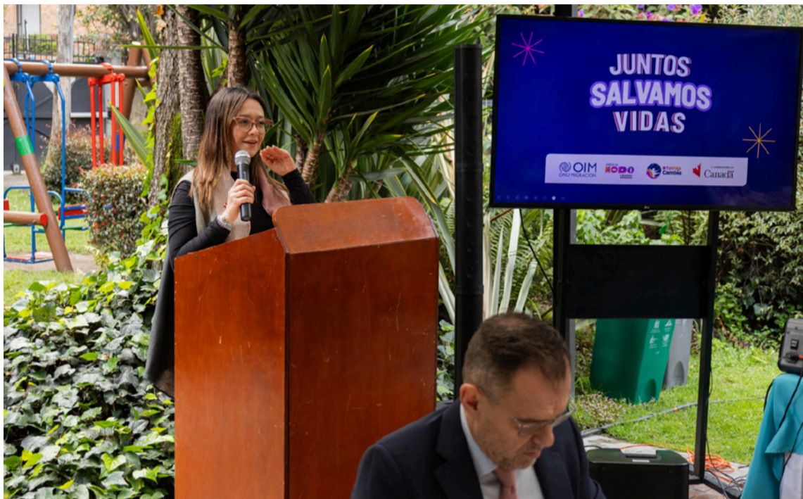
En Colombia, las zonas con mayor incidencia del delito de trata son regiones fronterizas.

Desde hace casi 25 años, la OIM viene apoyando los esfuerzos de diferentes entidades del Estado colombiano a nivel nacional, departamental y local (como el Ministerio del Interior, Icbf, Migración Colombia, Cancille-