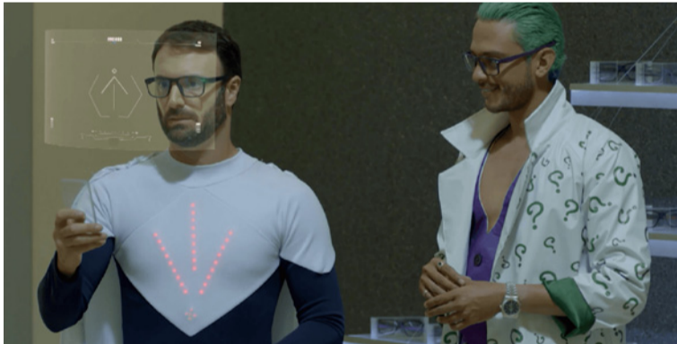
'Móvil' sumerge al público en una trama intensa que explora los límites entre lo real y lo virtual.

Telecaribe, Internacional de Medios y De la tierra producciones, con el apoyo de MinTIC, presentan 'Móvil', una serie que redefine la manera de interactuar con los contenidos audiovisuales al permitir que el público influya sobre una decisión de los protagonistas semana a semana.