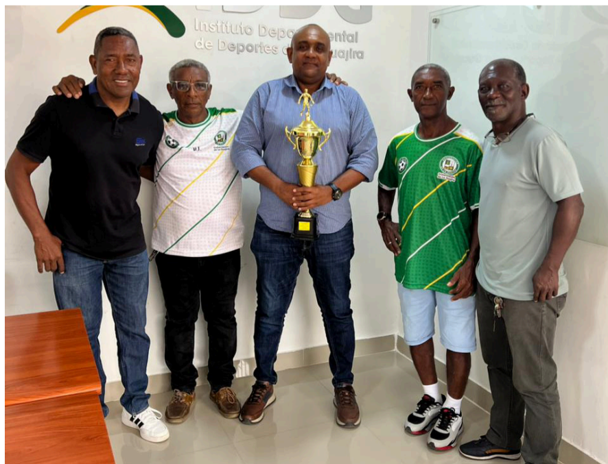
El Iddg reconoció el desempeño, la experiencia y el trabajo en equipo de los deportistas.