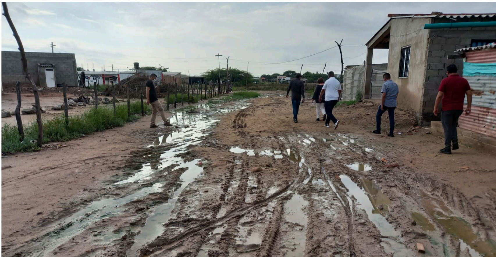
La Guajira no puede avanzar sola. Se necesita construir alianzas con el sector privado, universidades y organizaciones sociales.