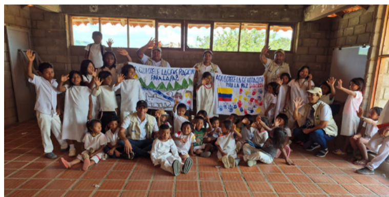
Durante la jornada, niñas, niños y adolescentes fueron protagonistas de actividades lúdicas y reflexivas.

Con el propósito de fortalecer la convivencia y el bienestar emocional de