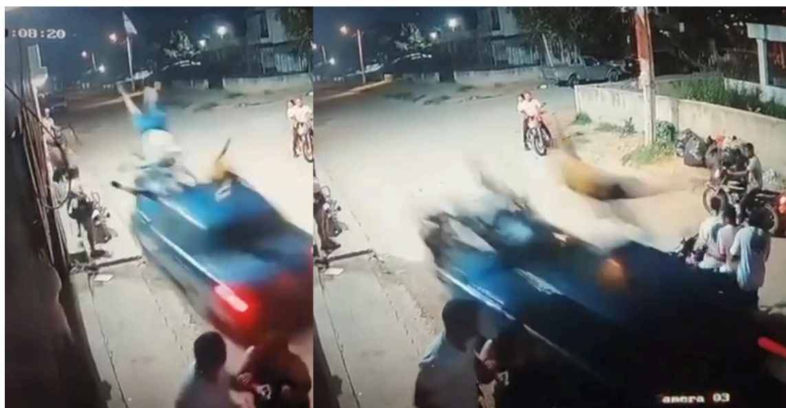
No se dieron a conocer las identidades de los heridos y del conductor.

Ante lo ocurrido, algunas personas que se encontraban en la zona lograron auxiliar a los heri-