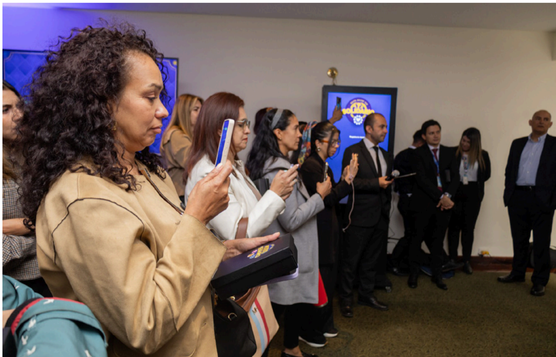
La lucha contra este delito exige coordinación entre Estados, sociedad civil y ciudadanía.

se combate con justicia, equidad y acción real, por esto nos complace apoyar esfuerzos y colaborar conjuntamente en una respuesta frente a este crimen que destruye sueños y vulnera la dignidad humana", manifestó Elizabeth Williams, embajadora de Canadá.