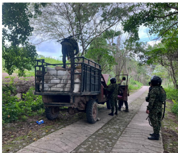
También fueron capturados dos hombres que quedaron a disposición de las autoridades.

En el desarrollo de una operación militar contra el narcotráfico, soldados del Grupo de Caballería Mediano N° 2 coronel Juan José Rondón de la Décima Brigada, en coordinación con la Policía Nacional, lograron la captura en flagrancia de dos sujetos que transportaban 105 kilogramos de marihuana en zona rural del municipio de Villanueva, La Guajira.