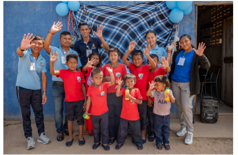
La actividad integró saberes y prácticas tradicionales de la comunidad wayuú, promoviendo su herencia cultural.

Se busca la recuperación de áreas degradadas