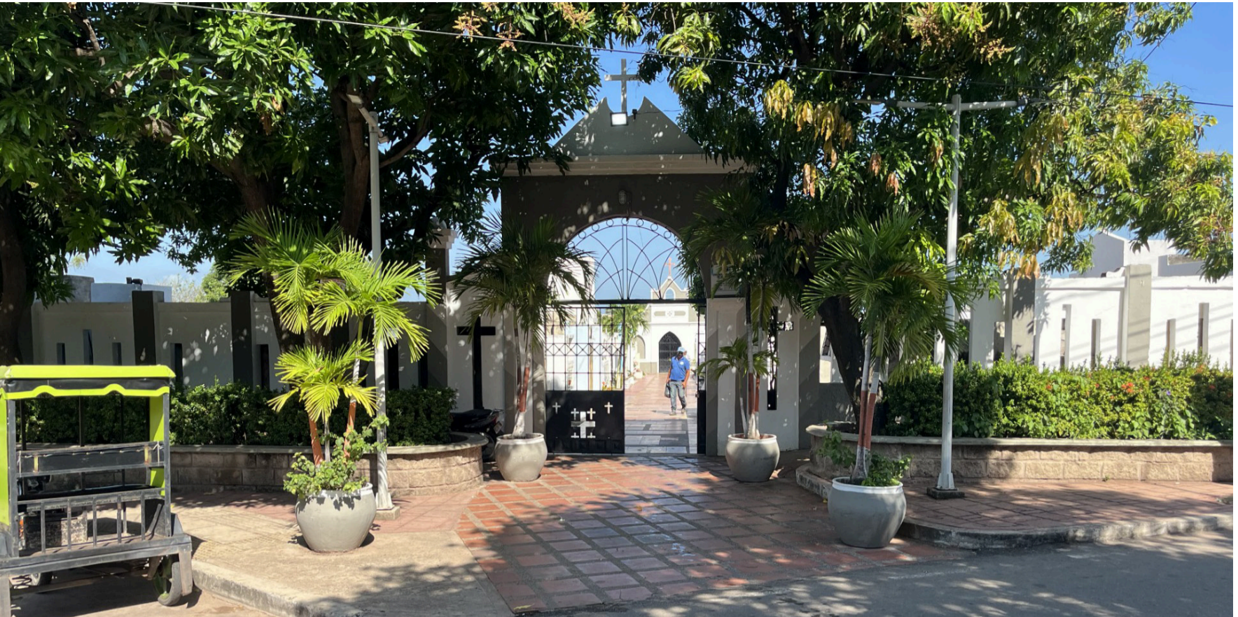
Un cementerio es un sitio de recuerdos que debe inspirar respeto por la que será la última morada terrenal de los seres humanos.

Nuestro cementerio ha vivido épocas de orfandad