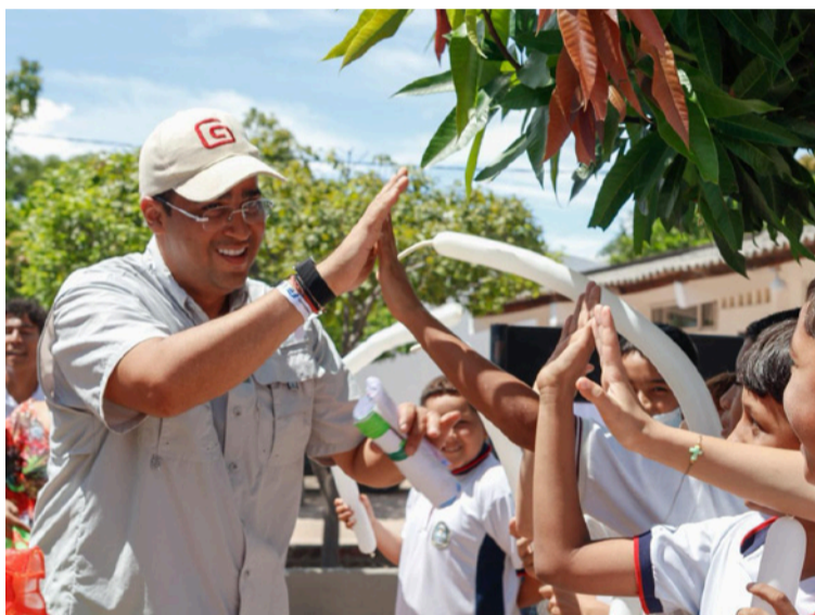
El respaldo refleja la confianza en una Administración que ha fortalecido la presencia institucional en el territorio.