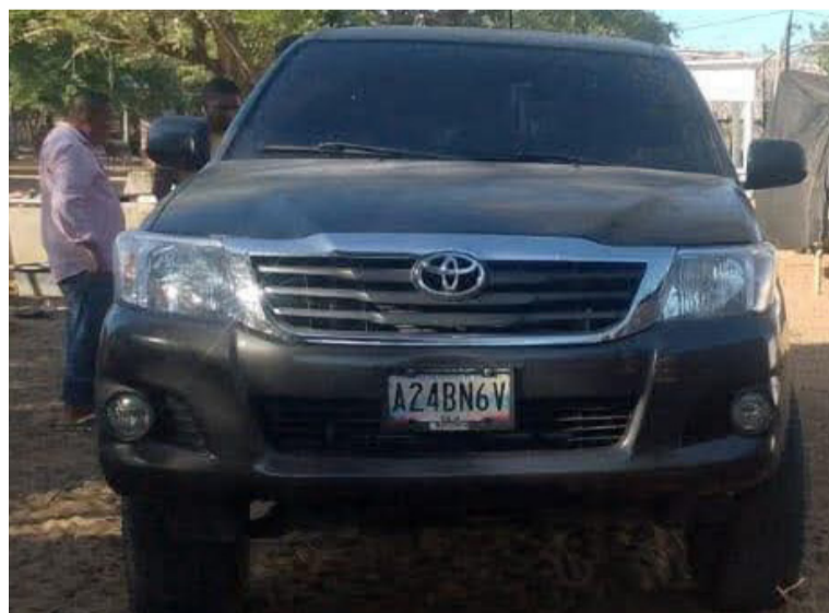
Esta es la camioneta Toyota Hilux que le fue hurtada mediante asalto a un docente en Maicao.