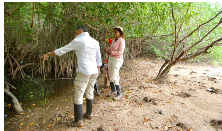
Durante la jornada, se socializaron los resultados alcanzados en el proceso de restauración ecológica de los manglares.

En el marco de la auditoría externa que realiza Icontec al Sistema de Gestión Integrado de Corpoguajira, la Corporación presentó el proyecto de restauración de manglares en el área protegida regional delta del Río Ranchería, desarro-