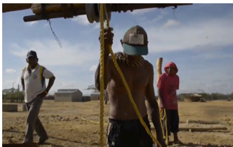
La Guajira sigue presentando los indicadores sociales más críticos del país, pese a ser un Departamento minero.

sino en su mala gestión. A lo largo de los años, los planes de desarrollo —tanto departamentales como municipales— han prometido soluciones estructurales que rara vez se ejecutan de forma sostenida. La fragmentación institucional, la debilidad administrativa y la corrupción han hecho que los diagnósticos se repitan sin que los resultados cambien.