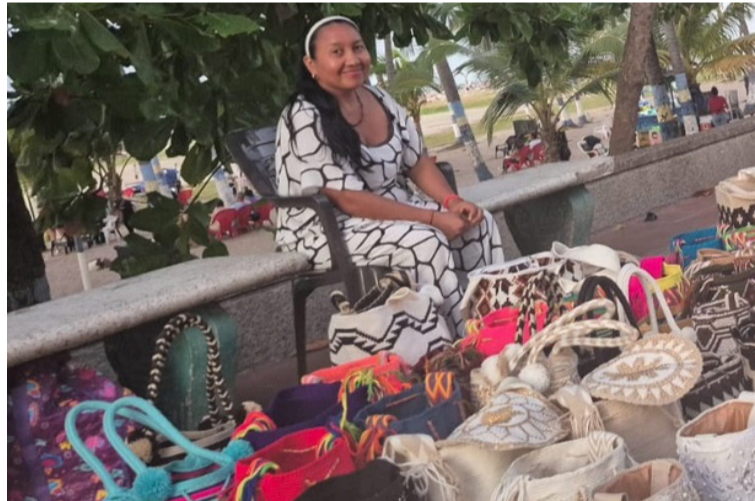
Los emprendedores seleccionados recibirán acompañamiento técnico, dotaciones, insumos y apoyo.

Esta iniciativa busca fortalecer los proyectos y emprendimientos locales que hacen parte de la economía popular, promoviendo el desarrollo productivo, la in-