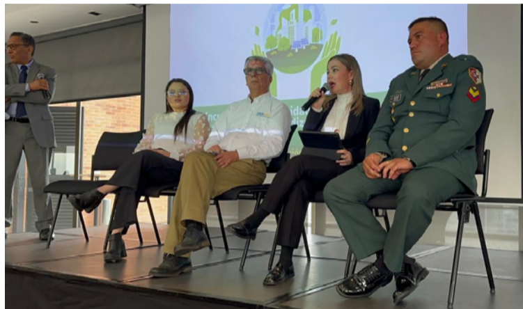
La estrategia de formación de Cerrejón promueve la excelencia técnica, la inclusión y el desarrollo local.

La estrategia de formación de Cerrejón no solo promueve la excelencia técnica, sino también la inclusión y el desarrollo local, al generar empleo, oportunidades de apren-