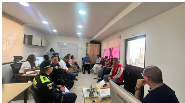
Se solicitó la intervención de la Procuraduría para atender los conflictos que se están presentando.

poder ofensivo de los dirigidos por Luis Enrique. El PSG capitalizó la ventaja numérica para dominar el control del balón y ejercer una presión constante. Lo sucedido generó un intenso debate en las redes sociales. Mientras algunos seguidores expresaron su apoyo al jugador y cuestionaron la decisión del árbitro ("Eso no es tarjeta roja. Lucho pierde el balón por falta de control..."), la mayoría de las críticas provinieron de hinchas del propio Bayern, quienes consideraron la acción "totalmente merecido, por desgracia" e imperdonable por dejar al equipo diezmado justo antes del descanso.