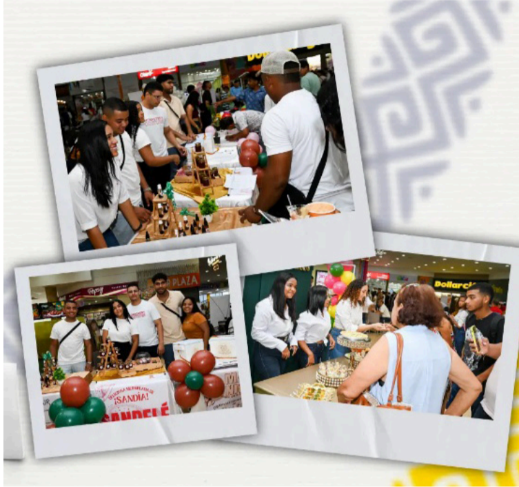
El objetivo de la jornada será fortalecer el desarrollo productivo en el ámbito externo del Distrito de Riohacha.

Este evento reunirá en un mismo lugar a estudiantes emprendedores del programa de Ingeniería Industrial y comunidad externa, permeando su perfil profesional desde el actuar en donde el ingeniero industrial con sus iniciativas podrá contribuir a la preservación, mejora o control de empresas mediante el desa-