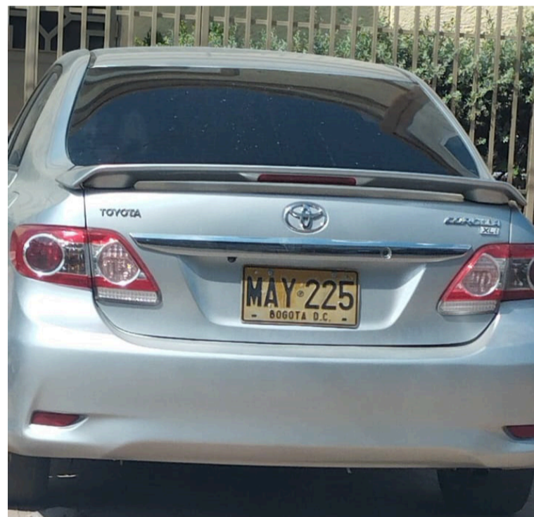
Las autoridades indicaron que en el atentado, afortunadamente no hubo personas heridas.