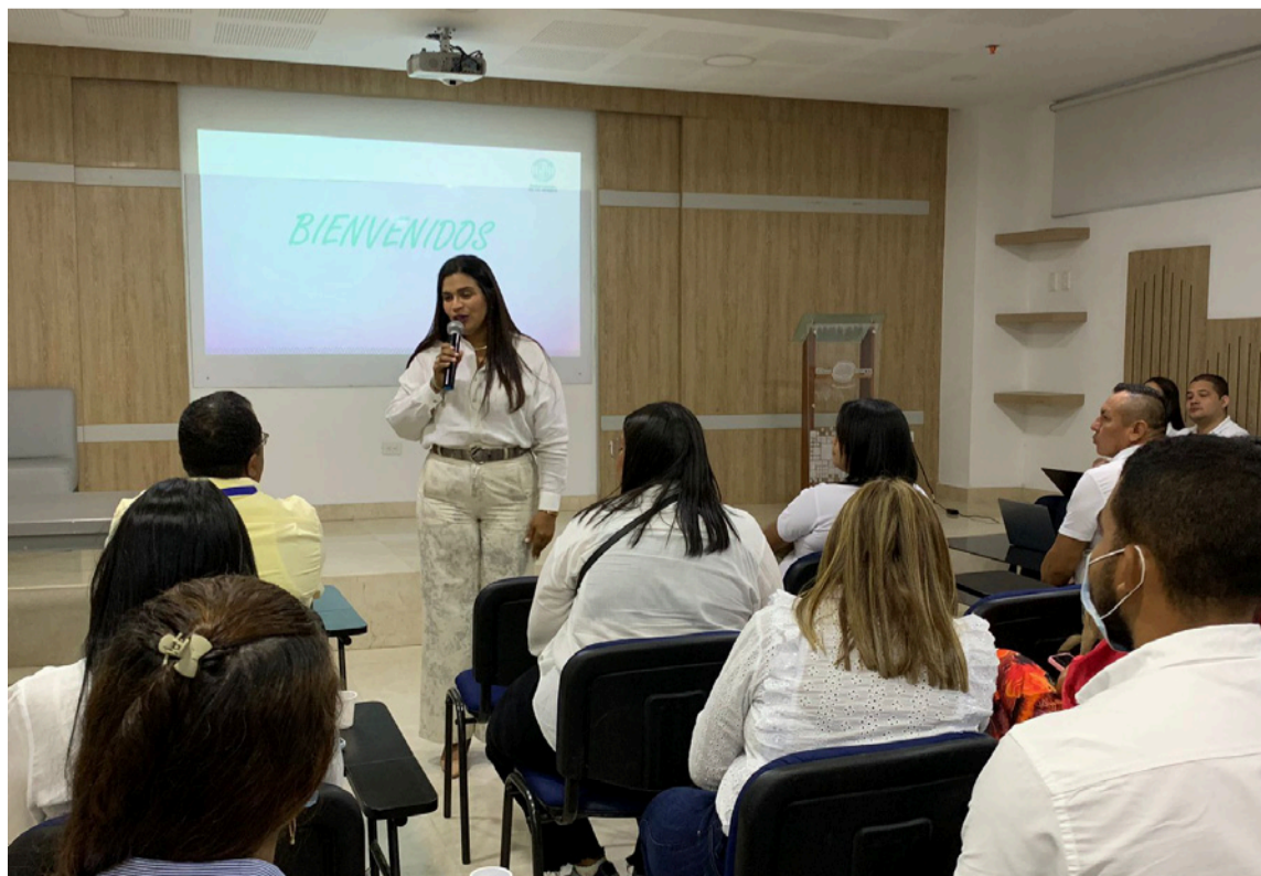
La jornada reunió a representantes de todas las EPS e IPS del municipio.

El seminario-taller también promueve la creación de rutas de respuesta conjuntas, el fortalecimiento de los planes hospitalarios de emergencia, y la construcción de una red de comunicación efectiva entre instituciones de salud, organismos de socorro y autoridades locales.