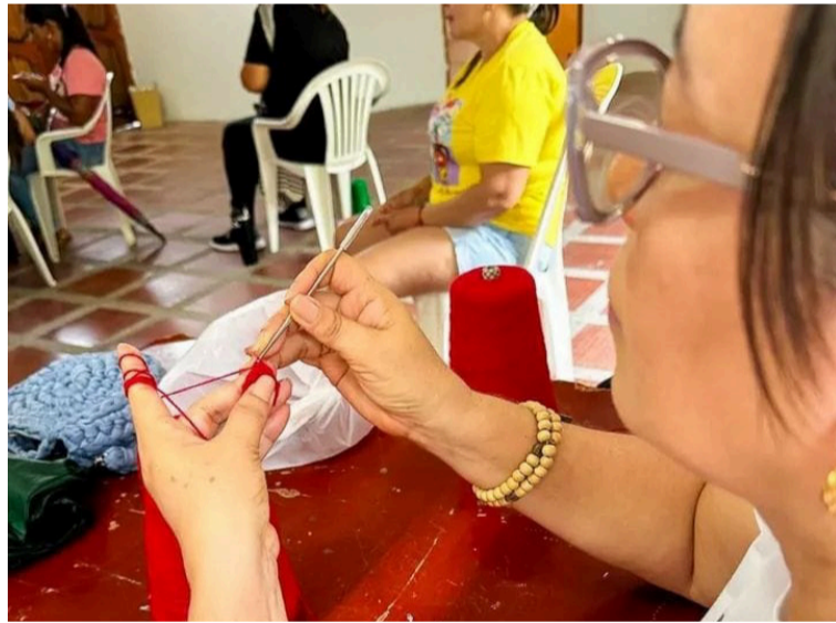
La actividad se convirtió en una puerta abierta al arte, al aprendizaje y al empoderamiento femenino en Urumita.

DESTACADO Con este curso se busca fortalecer las habilidades artesanales de las mujeres urumiteras, promoviendo la autonomía económica y la generación de ingresos sostenibles.