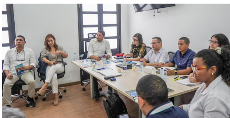
La Administración afirma que "se le paga a la prestación del servicio, miles de millones de pesos".

Riohacha exhibe una contradicción grave: muchos recursos públicos, contratos internacionales, discursos elevados... pero en los barrios sigue el agua que no llega, el alcantarillado colapsado, las calles que huelen a abandono. El título '¿con el agua al cuello?' no es metáfora superficial: es literal para muchos habitantes que viven con el peso de redes insuficientes, de subsidios que no transforman en bienestar, de certificados que no coinciden con su realidad y de un alcalde que dice una cosa y hace otra. Principio del formulario Final del formulario.