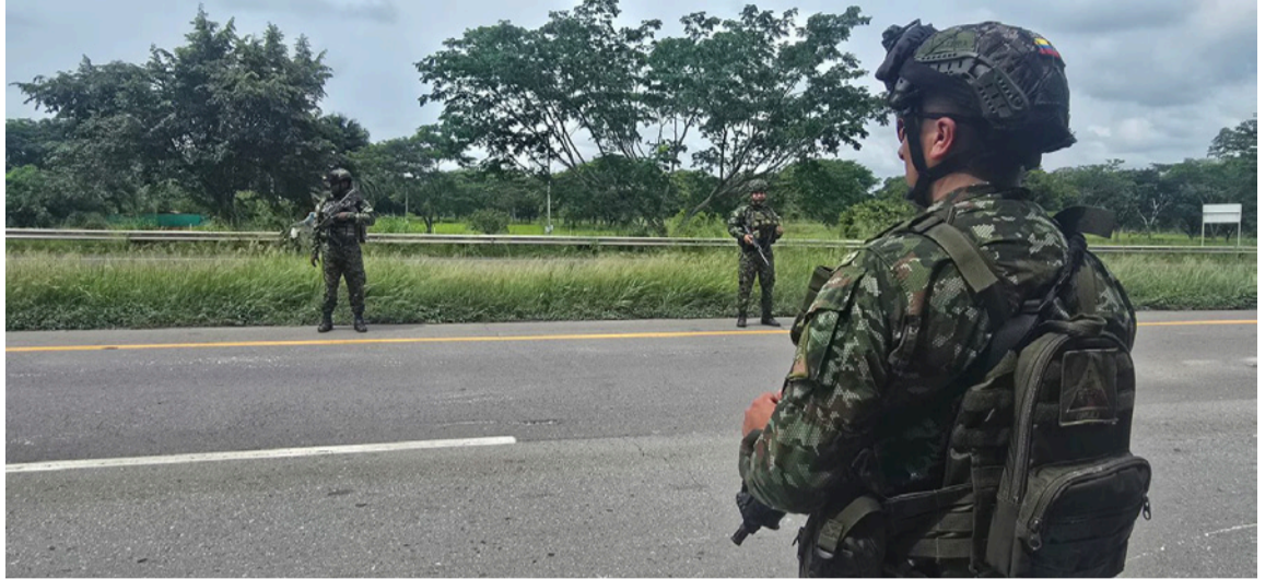
El Ejército abre sus puertas a hombres y mujeres entre los 18 y los 23 años.

La Décima Brigada del Ejército Nacional abre sus puertas a hombres y mujeres entre los 18 años y faltando un día para cumplir los 24, para que hagan parte del último contingente del año 2025 y vivan una experiencia que fortalezca su disciplina, liderazgo y amor por Colombia.