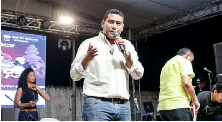
La feria impulsada por el alcalde, se consolida como una estrategia clave para la reactivación del comercio.

La feria inició con un colorido desfile en homenaje a la pluriculturalidad étnica y multicultural de Maicao,