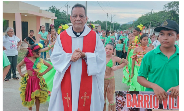
En la celebración participó el párroco de la iglesia San Martín de Porres, quien encabezó el recorrido del desfile.

Hijo de un noble español y una mujer afrodescendiente libre, Martín de Porres conoció desde niño el valor de la humildad y la compasión. A los quince años ingresó en el convento de Santo Domingo de Lima como donado, y allí floreció su vocación de servicio. Cuidaba a los