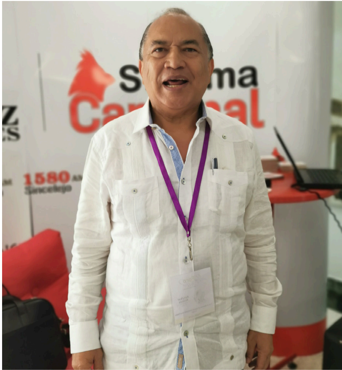
Asegura el exministro Amylkar Acosta que si algo lo ha caracterizado es la osadía.