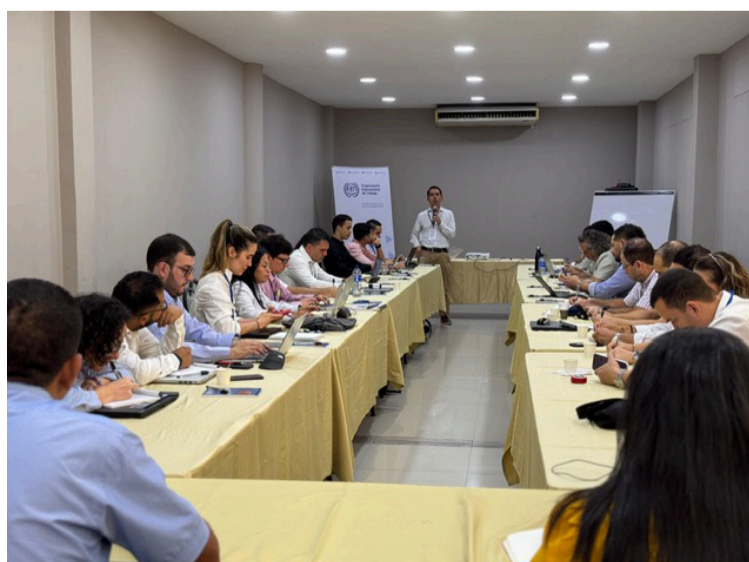
La OIT reconoce que una transición justa requiere de procesos participativos, y sostenidos de diálogo social.

DESTACADO El Position Paper constituye un esfuerzo conjunto por consolidar recomendaciones y orientaciones estratégicas que permitan alinear intereses empresariales, en torno a este propósito.