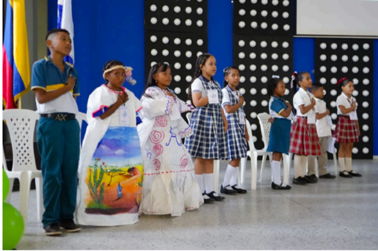
Este enfoque permitió fortalecer competencias de observación, análisis y acción y compromiso con la sostenibilidad.

A través del proyecto 'Mentes Ecoactivas', los niños identificaron pro-