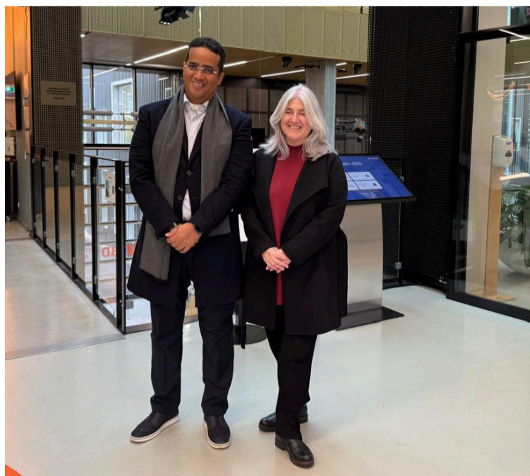
La embajadora precisó que el gobernador Aguilar, logró entablar relaciones con inversionistas daneses.

"Se hicieron contactos con fondos de inversión que es fundamental para