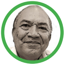
Por Amylkar Acosta Medina www.amylkaracosta.net

"El arte es largo y la vida es breve". Johann Wolfgang Von Goethe.