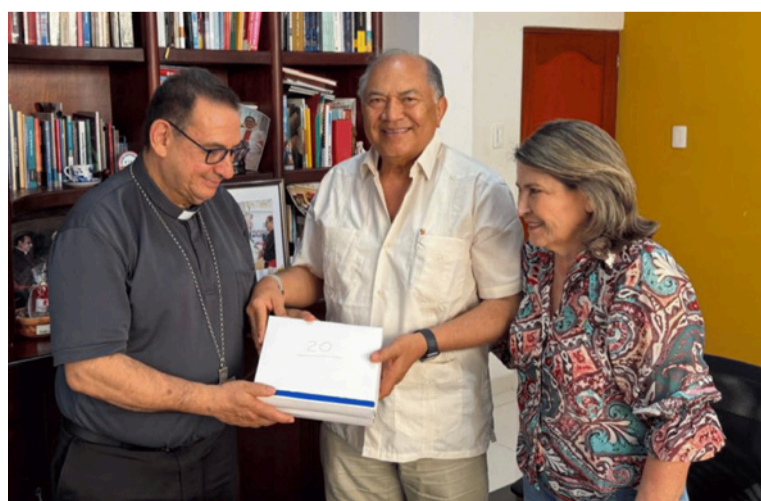
El exsenador Acosta expresó su gratitud a todas las personas que participaron en esta iniciativa solidaria.

Para ello, se priorizan acciones orientadas a asegurar recursos, fortalecer la sostenibilidad de los proyectos y optimizar la infraestructura existente, con el propósito de cumplir las metas del Gobierno nacional y garantizar resultados duraderos.