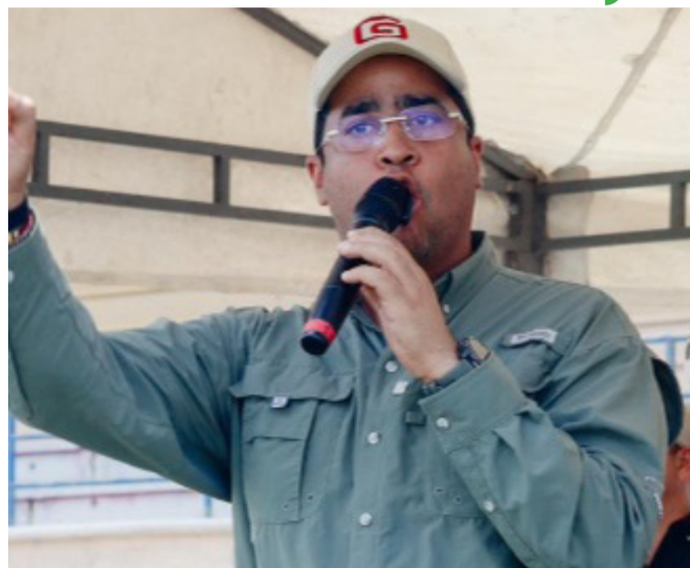
Aguilar expresó toda su solidaridad con las familias de las víctimas y con la comunidad de Distracción.

Finalmente el gobernador exigió a las autoridades competentes actuar de manera inmediata para esclarecer lo sucedido, capturar a los responsables y garantizar justicia.