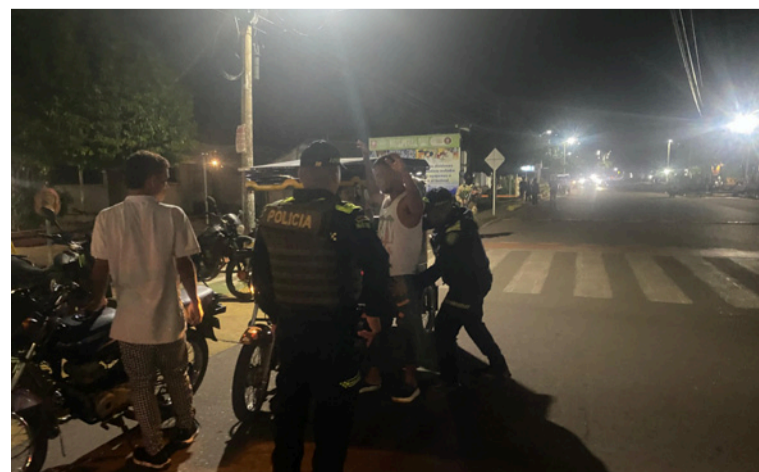
Se indicó que el plan de seguridad integral busca fortalecer la presencia de la Fuerza Pública en las calles.