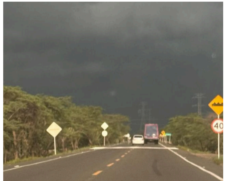
A partir de hoy y mañana jueves, se proyecta un incremento paulatino en las probabilidades de lluvias.

Por otro lado, aún restan 27 días para la culminación de la temporada de huracanes 2025, por lo que no se descarta la posible formación de nuevos ciclones tropicales en la cuenca del Caribe.