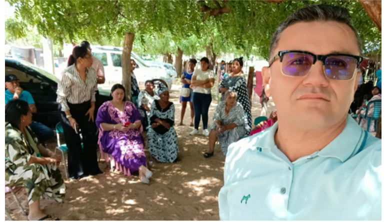
Los maestros contaron con el apoyo de Asodegua.

Tras la firma de un acta de compromiso, se abrió paso en la Troncal del Caribe para el tráfico vehicular en total normalidad.