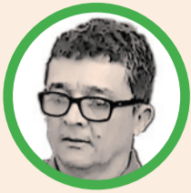
Por Luis Hernán Tabares Agudelo