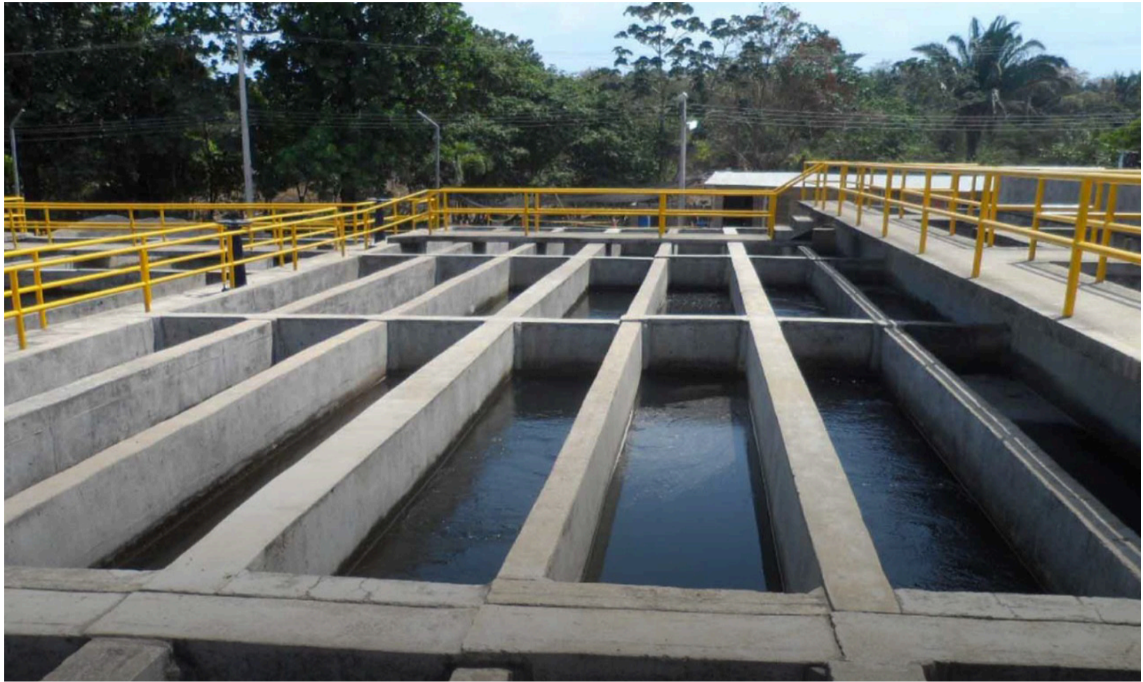
La ciudad parece estar 'al cuello' de sus propios servicios: muchas personas reciben agua de forma intermitente.