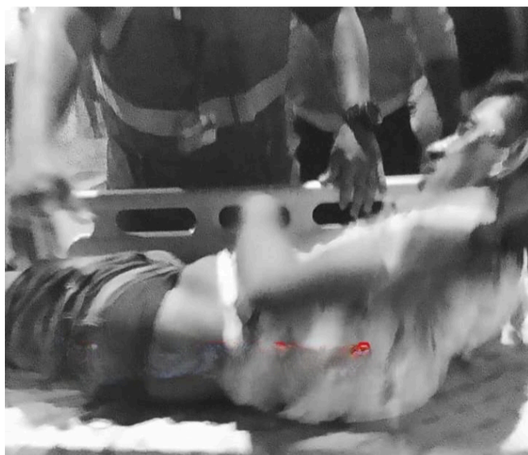
Se informó que el lesionado fue llevado de urgencia a un centro asistencial para la valoración médica.

un llamado para que los conductores cumplan las normas de tránsito y así evitar situaciones que pongan en riesgo su vida y las de los acompañantes.