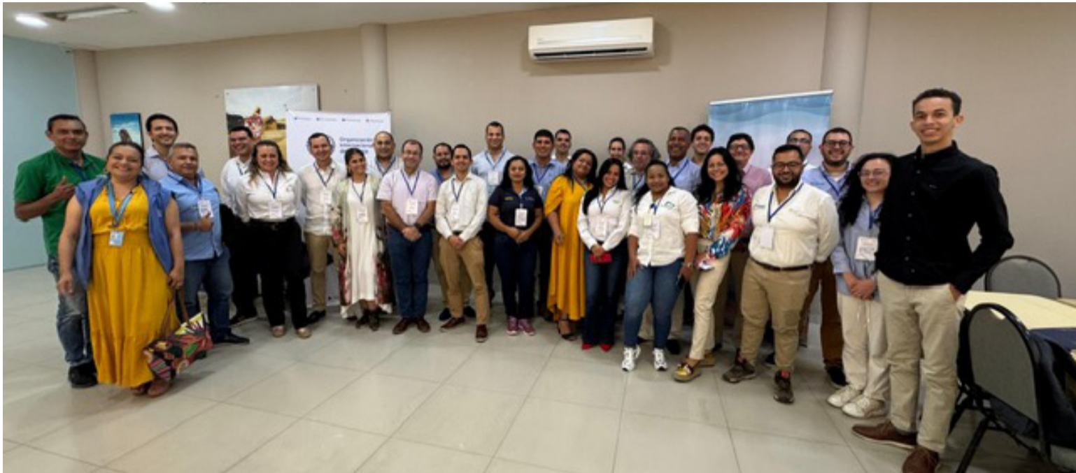
La Andi y la Mesa Más Guajira han venido promoviendo una transición energética justa.

La llegada inminente de los efectos del cambio climático plantea una serie de retos para la sociedad moderna en la forma como debe adaptar sus modos de vida y los sistemas productivos que, además de apuntar a la reducción de la huella de carbono para garantizar la preservación del equilibrio climático del planeta, pueda contribuir al mejoramiento de los estándares de calidad de vida de la población a través de la erradicación de la pobreza y de las brechas estructurales existentes en materia de empleo, formación y el acceso a demás servicios sociales básicos.