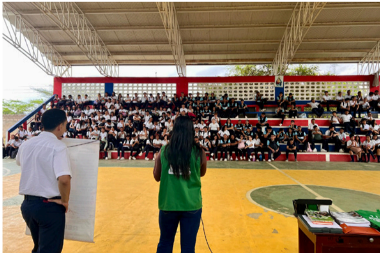
La actividad se enfocó en temas como manejo de residuos sólidos, residuos posconsumo y la educación ambiental.

Con el fin de promover la educación y sensibilización ambiental, Corpoguajira llevó a cabo una actividad dirigida a los es-