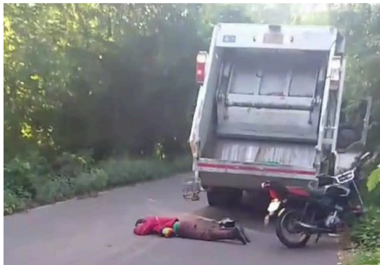
Ambos hombres fueron trasladados de urgencia al hospital de Dibulla donde son atendidos.

De acuerdo con la información preliminar, el siniestro se habría originado por un presunto exceso de velocidad, lo que provocó que los ocupantes perdieran el control del vehículo y terminaran gravemente lesionados.