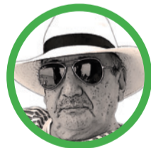
Por José Manuel Aponte Martínez