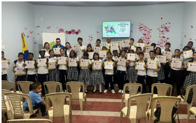
Los estudiantes del grado sexto, vivieron una experiencia de aprendizaje orientada al cuidado del ambiente.

Durante las jornadas, el equipo de Educación Ambiental de Corpoguajira lideró espacios pedagógicos y lúdicos centrados en tres ejes funda-