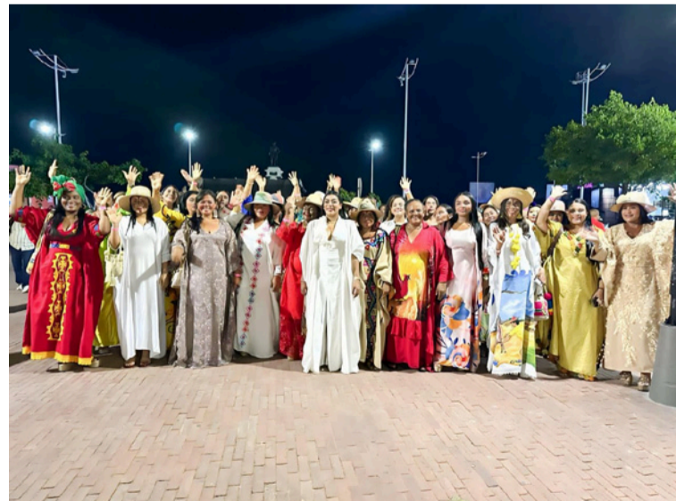
Las mujeres wayuú aportaron un toque de identidad y diversidad cultural a la cumbre de la Celac.

Una colorida y significativa representación de La Guajira se robó las miradas en la IV Cumbre de la Comunidad de Estados Latinoamericanos y Caribeños (Celac), celebrada