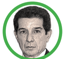
Por José Félix Lafaurie Rivera