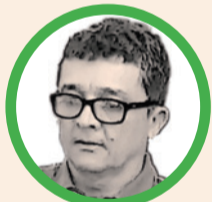
Por Luis Hernán Tabares Agudelo

En ambas etapas hacen lo contrario de lo que convendría hacer, porque sacan a crédito los insumos al por menor, con alto valor agregado al último eslabón de la cadena de intermediación”.