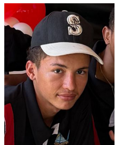
El joven se encuentra delicado de salud.

El joven que iba en la moto con sus dos hermanos, tuvo el accidente cuando perdió el control del vehículo y cayó a la vía que se encuentra inconclusa, al estudiante de 11°