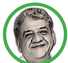
Por Jesualdo Fernández Valverde