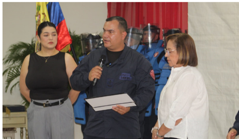
La alcaldesa de Villanueva, aseguró que esta declaratoria representa mucho más que un logro institucional.

En un emotivo acto realizado en el municipio de Villanueva, las autoridades nacionales y departamentales, junto con el Ejército Nacional de Colombia y organismos internacionales, oficializaron la de-