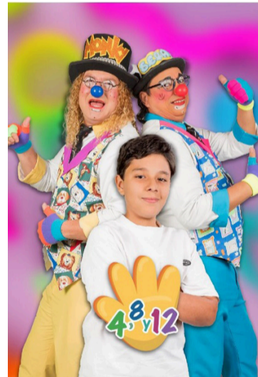
Reconocen a Telecaribe como televisión de calidad.

El canal regional reiteró su agradecimiento al público por el apoyo, la con-