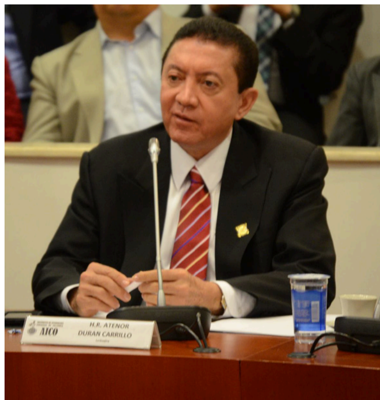
Durán expresó que apoyará la lista del partido de la U a la Cámara de Representantes, que aún no se conforma.

que tengo plena confianza y con el que he venido construyendo esa buena relación es con él, y vamos a seguir haciendo equipo", expresó.