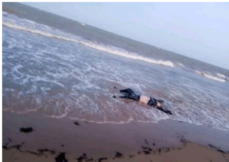
Habitantes habían reportado el hallazgo del cuerpo de un hombre que no pertenecía a la comunidad wayuú.

horas de la tarde del domingo, los habitantes habían reportado el hallazgo del cuerpo de un hombre que según las características, no pertenece a la comunidad wayuú, vestía suéter, pantalón y zapatos negros, y al parecer habría sido arrastrado por la corriente hasta la orilla de la playa.