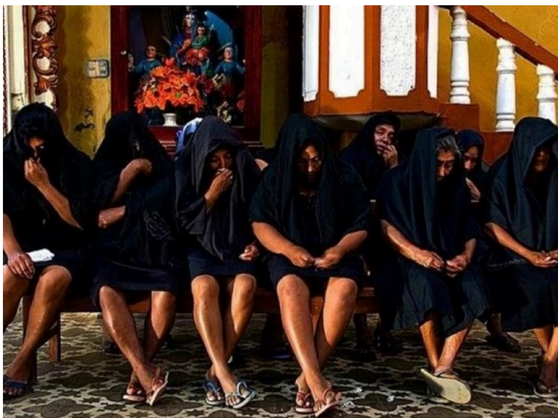
La tradición de los velorios en casa se ha perdido al igual que el llanto por la pérdida.

La modernidad no elimina el velorio tradicional, sino que lo transforma y coexiste con él, generando nuevas formas de despedida que se adaptan a los cambios sociales, religiosos y tecnológicos. Esto se manifiesta en velorios más secularizados, personalizados y a menudo más cortos, que pueden ocurrir en diversos espacios además de los hogares, como las modernas funerarias; hay que recordar siempre que lo que una vez hizo parte del cúmulo de tradiciones, frente a lo único que tenemos seguro en la vida es la muerte.