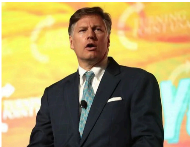
Las palabras de Landau consolidan un profundo desacuerdo estratégico y diplomático entre las dos naciones.

El subsecretario de Estado de Estados Unidos, Christopher Landau, se refirió ayer lunes, 10 de noviembre, al creciente tono de confrontación que marca la relación entre Washington y el Gobierno del presidente colombiano, Gustavo Petro.