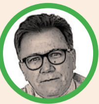
Por Indalecio Dangond