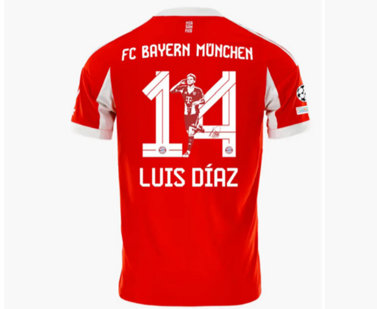
La nueva camiseta personalizable está disponible en la página web oficial del Bayern Múnich.

ferido, como Luis Díaz, o incluso su propio nombre. Las primeras imágenes de