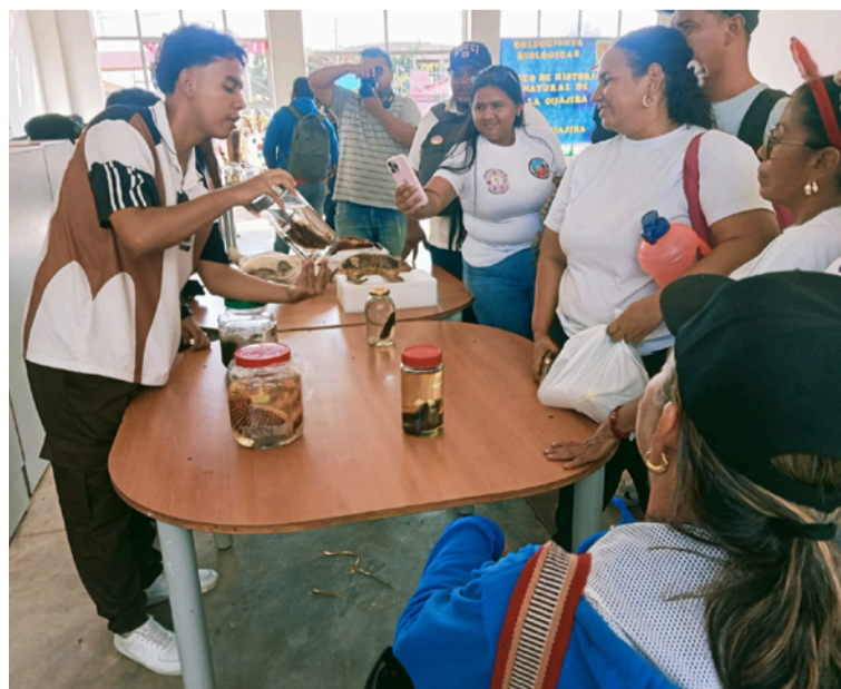
Los estudiantes hicieron un derroche de creatividad, esfuerzo y mucha entrega para ejecutar sus proyectos.