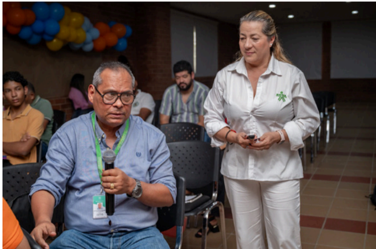
La iniciativa reafirma el compromiso de Uniguajira con el bienestar de las comunidades en el territorio.

participantes se destacaron la Secretaría de Salud Departamental, la Fundación Gabriell de Jesús, el Icbf, la Asociación Colombiana de Genética Humana, la Diócesis de Riohacha, la