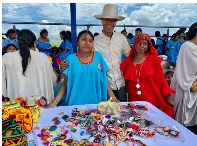
La actividad hace parte de las estrategias pedagógicas que se han puesto en marcha en la Institución.

en cada uno de los stands. La actividad en mención hace parte de las diferentes estrategias pedagógicas que se han puesto en marcha en la Institución Etnoeducativa y que han permitido que los estudiantes fortalezcan sus habilidades desde el emprendimiento, enriqueciendo los usos, costumbres y tradiciones del pueblo wayuú. Las artesanías y accesorios que en esta primera feria se dieron a conocer fueron elaboradas por los estudiantes.