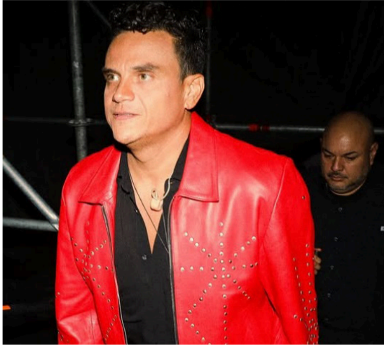
Silvestre Dangond está nominado en la categoría Mejor Álbum de Cumbia/Vallenato.

La Academia Latina de la Grabación anunció que Silvestre compartirá escenario con artistas como Ángela Aguilar, Residente, Fito Páez, Ricardo y Evaluna Montaner, entre otros talentos que representan la diversidad de la música latina. Esta participación marca un nuevo hito en la carrera del artista colombiano, quien además está nominado en la categoría Mejor Álbum de Cumbia/Vallenato