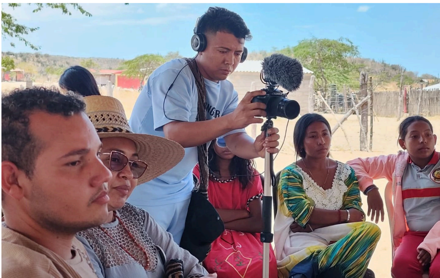
La producción eleva la voz del pueblo wayuú y reafirma su llamado a una transición energética con justicia.

La ceremonia de premiación se llevará a cabo de manera virtual a finales del mes de noviembre de 2025, donde se entregarán los reconocimientos a los ganadores de Ecuador, Colombia y México.