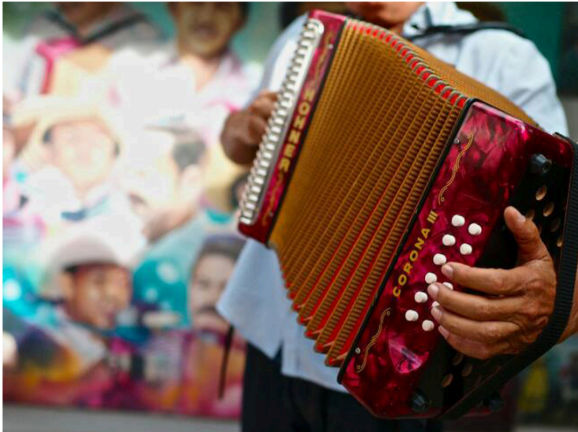
El acordeón es un instrumento que, al ser tocado con el corazón, aprendió a sentir.

Por eso, podemos afirmar que: 'la historia no miente', porque la verdad del alma no necesita defensa; se sostiene sola en