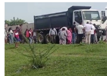
El percance vial solo dejó daños materiales.

En este hecho se vieron involucrados una motocicleta y un camión, cuando al parecer el pesado vehí-