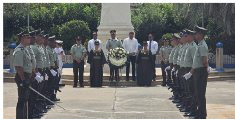
En un acto simbólico de respeto, se llevó a cabo una ofrenda floral en el parque Almirante Padilla de Riohacha.

DESTACADO El comandante del Departamento de Policía Guajira, expresó su orgullo por los 134 años de historia institucional y resaltó el compromiso de los policías que sirven con honor.