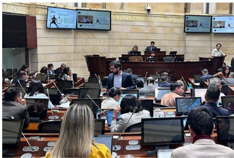
El 8 de febrero de 2026, vence el periodo para modificación de candidatos por revocatoria de la inscripción.

En tanto, el 25 de febrero de 2026, se realizará la inscripción de candidatos