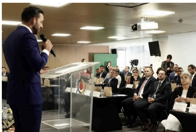
El órgano de control advirtió que el PGN 2026 contiene una reducción del 53 % en los recursos de inversión.

En total, los ejercicios de control fiscal a estas tres fuentes de financiamiento suman hallazgos fiscales por más de $443.232 millones.