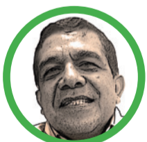
Por Hernán Baquero Bracho