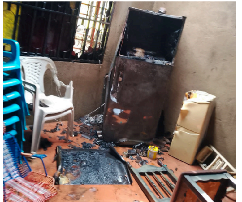
Los propietarios informaron que al momento del incendio, la vivienda se encontraba sola.

Un incendio estructural se registró en una vivienda ubicada en la vía que comunica al resguardo indígena de Tamaquito 2, en zona rural de Barrancas.