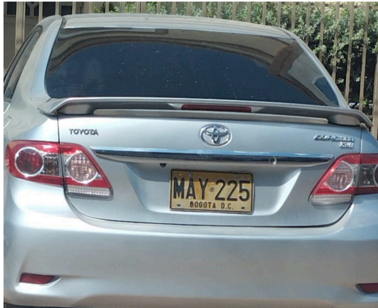
Javier Medina de Armas, conocido como 'Mandinga', lucha por su vida luego de ser víctima de un ataque a bala.

Estos desenfundaron un arma de fuego y dispararon contra el automóvil, logrando alcanzarlo con