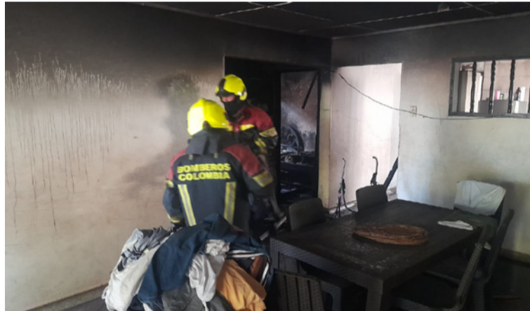
El propietario intentó sofocar las llamas con baldes de agua, pero el incendio ya se había propagado.

dos en la habitación principal mirando televisión, cuando escuché los gritos