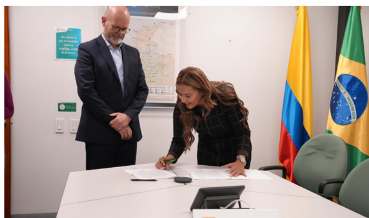
El convenio permitirá la construcción del esquema de suministro de agua para la comunidad de Jamuchencho.