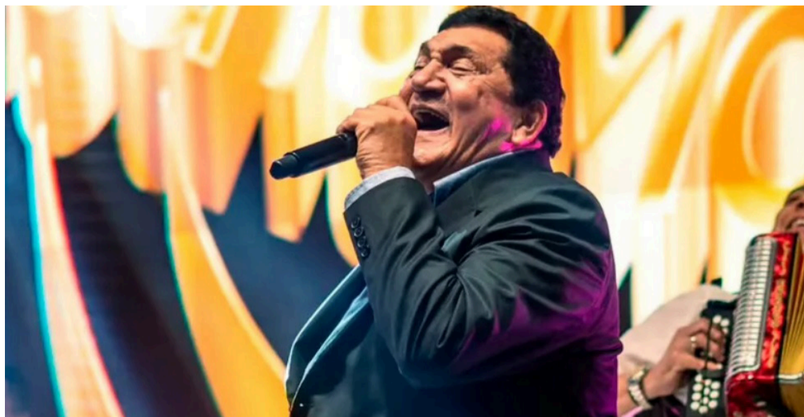
'Poncho' Zuleta no divide territorios cuando dice que el vallenato es de La Guajira.

Miembro de Sayco, Isaías Celedón Cotes escribe desde la frontera invisible entre razón y sentimiento. Su voz literaria busca sanar, recordar y celebrar lo esencial: que la música y la palabra son formas de resistencia del alma, y que todo lo que nace del corazón... permanece eterno.