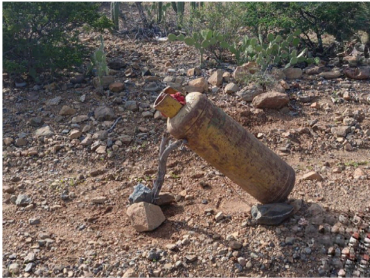
Militares hallaron y destruyeron de manera controlada siete artefactos explosivos improvisados del ELN.

El empleo de artefactos explosivos improvisados por parte del ELN constituye una grave violación a los Derechos Humanos y al Derecho Internacional Humanitario, al utilizar medios y métodos de guerra prohibidos que afectan de manera directa a la población civil. Estas acciones