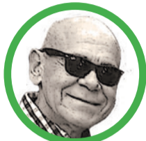
Por Isaías Celedón Cotes