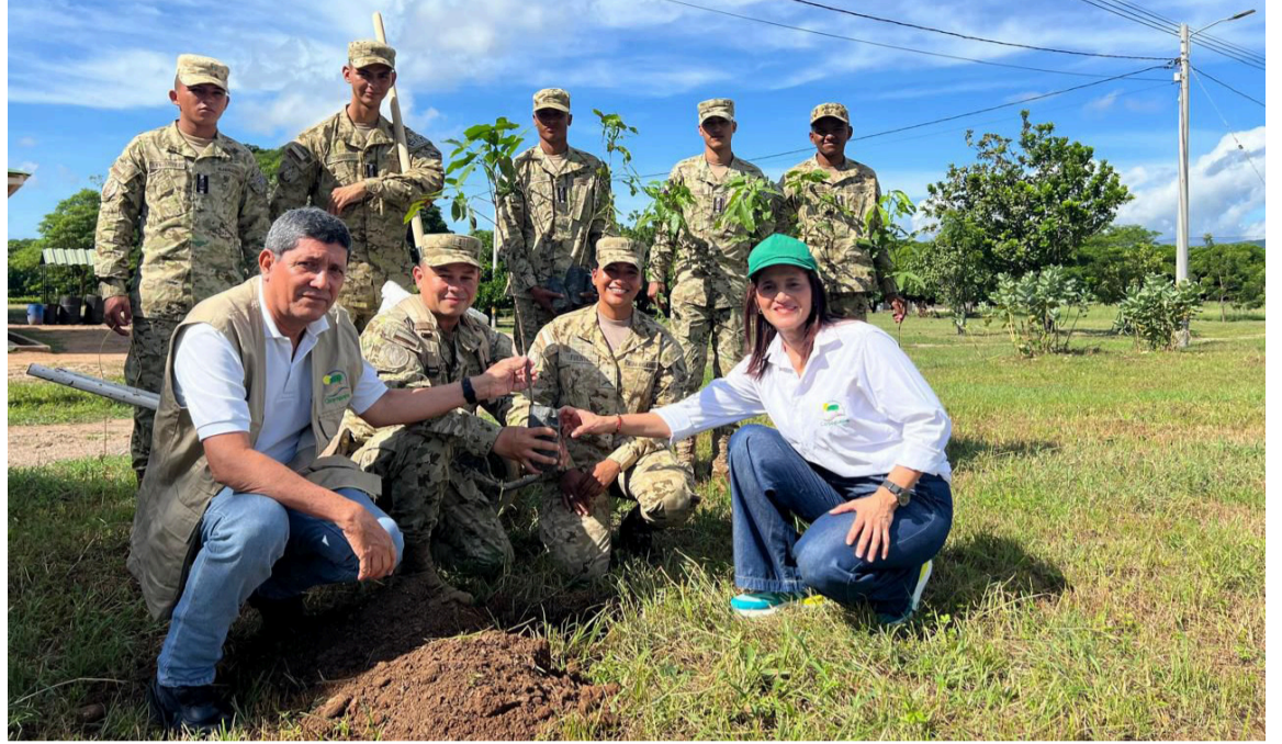
En la jornada se sembraron especies nativas como Corazón Fino y Roble, seleccionadas por su alto valor ecológico y adaptabilidad.

Para conmemorar el Día Internacional contra el Cambio Climático