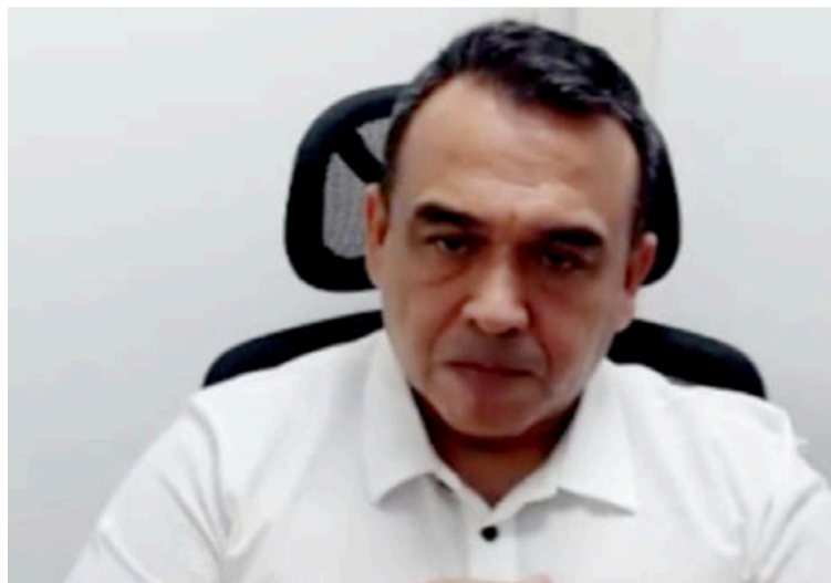
El alto oficial habría sometido a una auxiliar de Policía a actos indecorosos de tipo sexual en contra de su voluntad.

En medio de la agresión, la víctima logró salir de la habitación y le contó a una compañera lo sucedido. Este fue el origen de una investigación interna que derivó en una