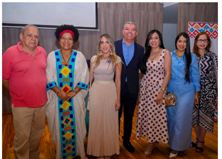
Durante las jornadas, se desarrollaron conferencias, talleres prácticos, presentaciones de avances científicos y actividades culturales.