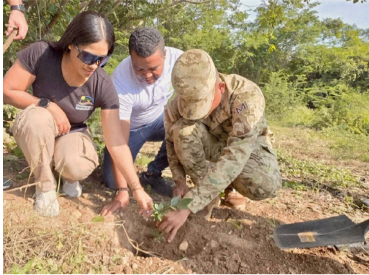
Directivo de Max Resource dijo que cada árbol sembrado representa una acción frente a la crisis climática global.

Como parte de esta iniciativa, Max Resource, empresa de prospección y exploración de cobre con presencia en el sur de La Guajira, se vinculó activamente con el aporte de más de 5.700 árboles,