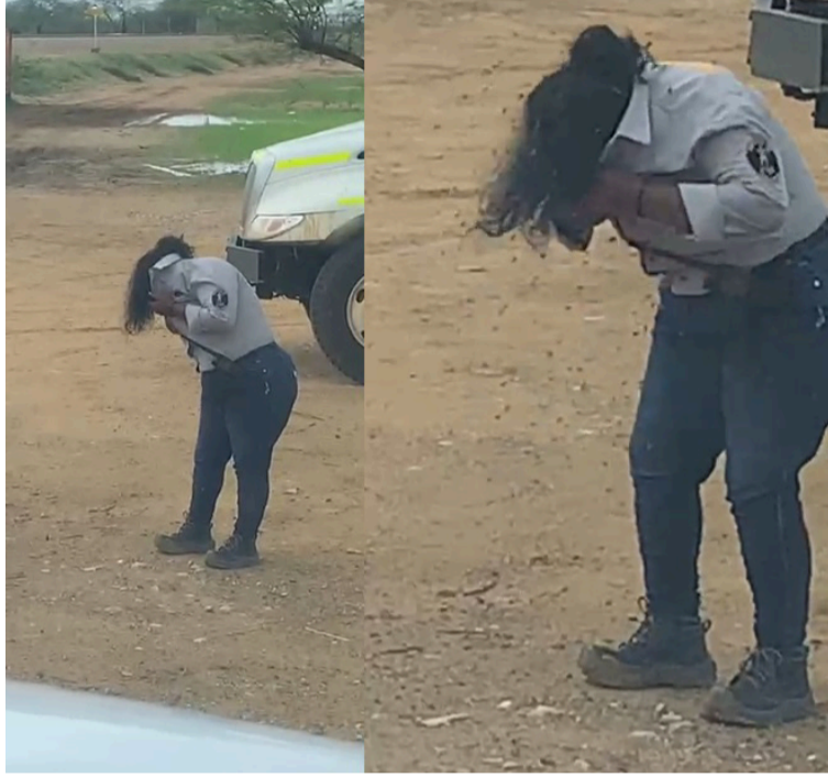
La mujer fue llevada hasta un centro asistencial donde se encuentra bajo observación médica.