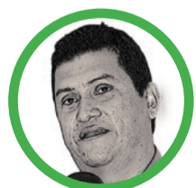
Por Henry Peñalver