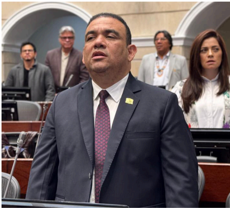
El senador dice que su compromiso es con la equidad tarifaria, la transparencia y la defensa del usuario.

El congresista señaló que en la región Caribe las obras para evitar las pérdidas técnicas con recursos públicos en la época de la extinta Electricaribe, fueron siniestradas, luego en el Gobierno anterior le dieron la gabela en el Plan Nacional de Desarrollo, de trasladarle esas pérdidas