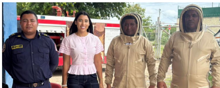
El equipamiento es importante para la protección de los bomberos al realizar trabajos urgentes con abejas.

El Cuerpo de Bomberos Voluntarios de Barrancas, recibió como donación tres vestidos para la recolección de abejas africanizadas,