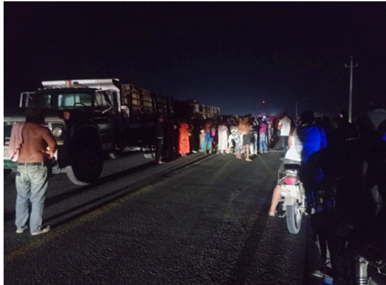
La víctima quedó tendido en la vía pública, y al costado el pequeño vehículo.

Se pudo conocer por parte de los testigos, que el hombre que se movilizaba en la motocicleta, al