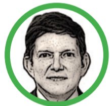
Por Wilson Ruiz Orejuela