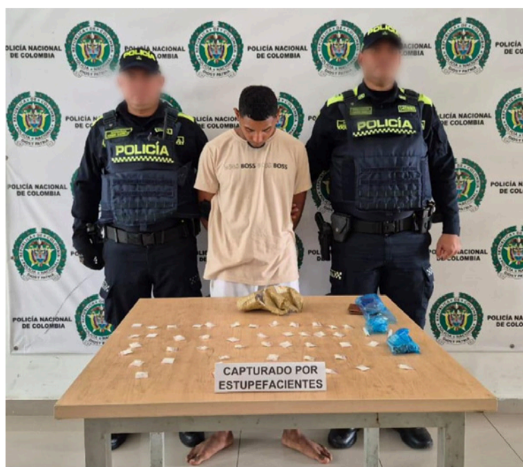
El capturado fue dejado a disposición de la Fiscalía URI en turno de Riohacha.

Gracias a la oportuna acción de uniformados adscritos al Departamento de Policía Guajira, fue capturado en flagrancia