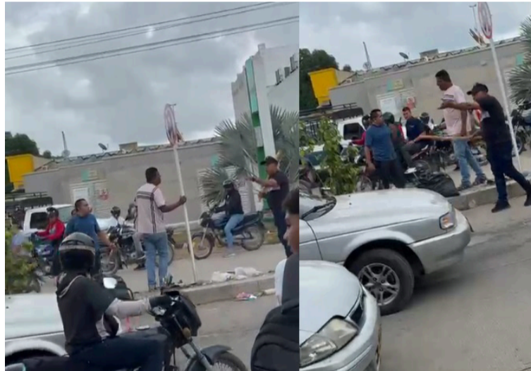
Las autoridades policiales llegaron al lugar de los hechos y lograron controlar la situación.

Hasta el lugar de los hechos llegaron las autoridades policiales quienes lograron controlar la situación y restablecer la movilidad vehicular en esta importante vía de la ciudad de Riohacha, además, iniciaron las indagaciones para determinar cómo ocurrió el accidente vial.