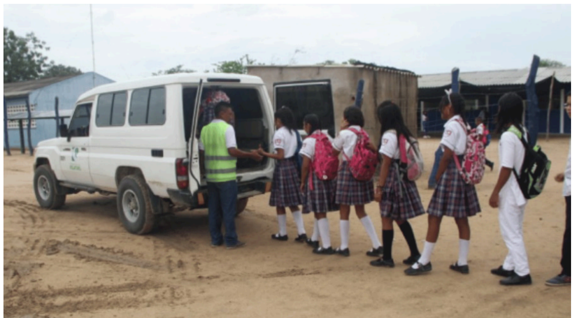
El juzgado había ordenado las gestiones contractuales para garantizar transporte escolar.

DESTACADO Los artículos 27 y 52 del Decreto 2591 de 1991 establecen los preceptos normativos para el cumplimiento del fallo de tutela y las sanciones a que hubiere lugar.