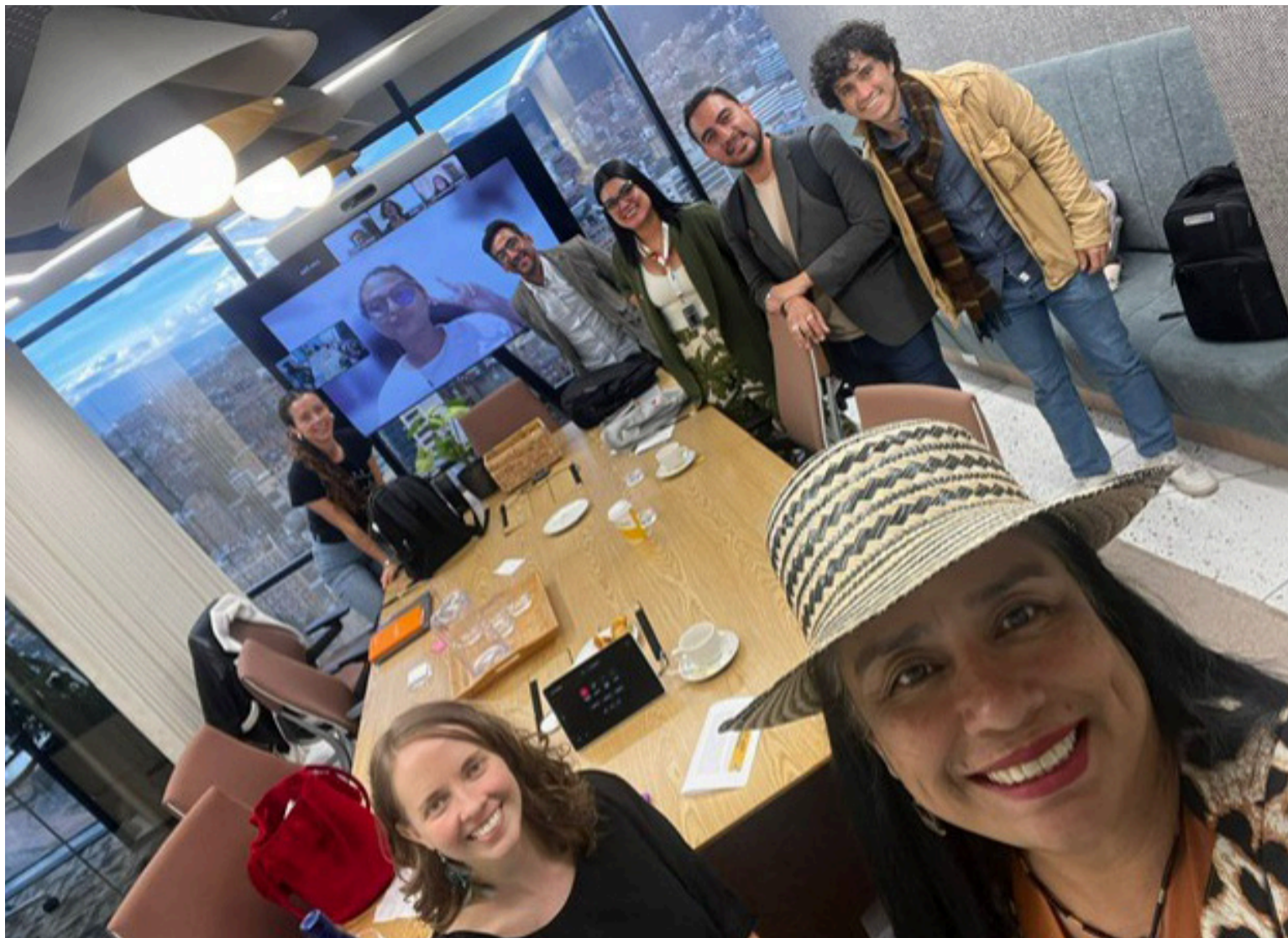
En los próximos 5 a 10 años se estima que en Colombia se invertirán 82 billones de pesos en transición energética.

‘Reimaginemos’ convocó una nueva sesión de ‘Diálogos para la Acción’