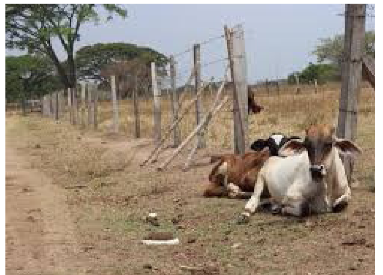
Los desconocidos ingresaron al predio rural 'El Encanto', ubicado sobre la vía nacional.

La señora afectada dio aviso a las autoridades de turno para proceder a las indagaciones correspondientes y dar con los autores del ilícito.