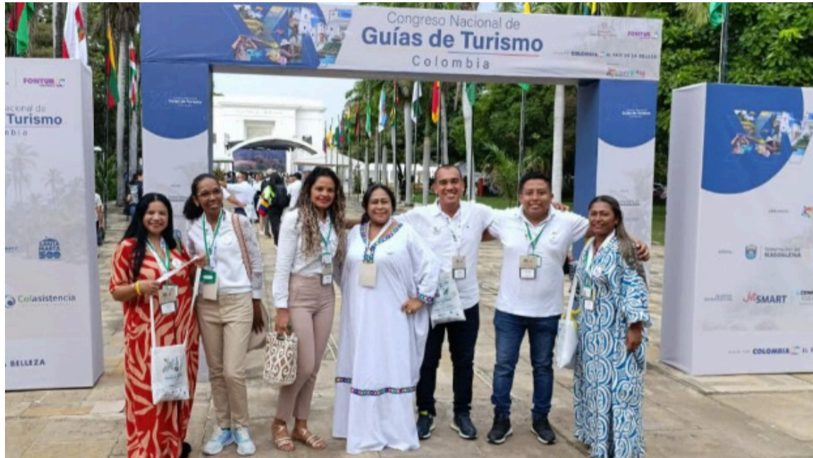
Según MinComercio, La Guajira recibe más de 350.000 visitantes anuales.

La participación en este evento fortalece el trabajo articulado que adelanta la Gobernación de La Guajira con el sector turístico, enfocado en la capacitación, profesionalización y promoción de experiencias seguras, sostenibles y de alta calidad. Así, como recientemente se vivió, en la entrega de vouchers