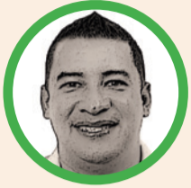
Por Breiner Robledo Meza