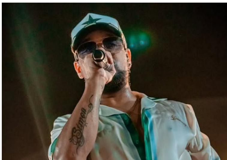
Un equipo de profesionales de la salud en Valledupar, siguen de cerca la evolución médica del artista.

Yáder Romero, destacado artista vallenato, fue sometido a una delicada cirugía de corazón abierto la tarde del martes 21 de octubre en la Clínica de Alta Complejidad del Caribe, en la ciudad de Valledupar.