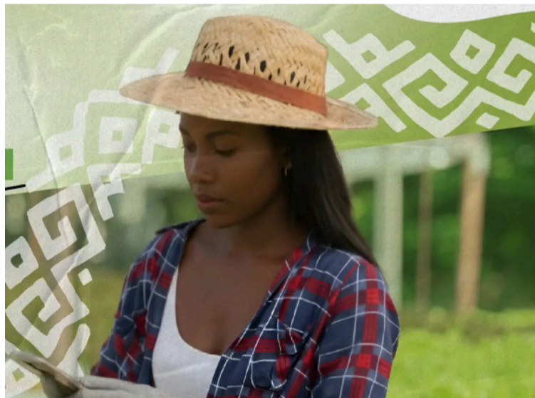
La actividad está dirigida a campesinos, apicultores, ganaderos y operadores turísticos locales.

DESTACADO Se brindarán herramientas concretas de marketing territorial para que campesinos, emprendedores y comunidades rurales puedan posicionar sus fincas como destinos agroturísticos.