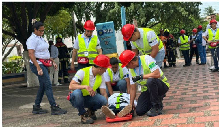
Durante el ejercicio, los brigadistas guiaron a los funcionarios hacia los puntos de encuentro.

Sin embargo, el secretario reconoció algunas falencias menores, entre ellas la demora en la llegada de la ambulancia, hecho que fue señalado por los organismos de socorro como un punto a mejorar. "Vamos a emitir las recomendaciones pertinentes, afirmó.