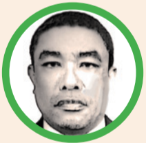
Por Osvalder Pérez Ustate

La reunión entre Petro y McNamara fue una fotografía del nuevo tablero: una relación que ya no se basa en subordinación, sino en intereses compartidos. Ojalá no se queden en discursos diplomáticos".