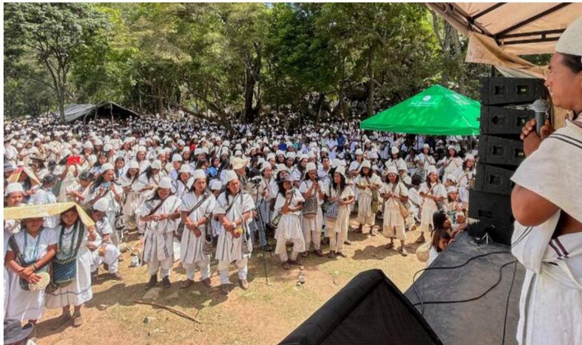
Desde el MinInterior se pide que se superen las dificultades presentadas.

En ese sentido, invitamos a algunos sectores del pueblo arhuaco de la Sierra Nevada a no recurrir a las vías de hecho, las cuales afectan los dere-