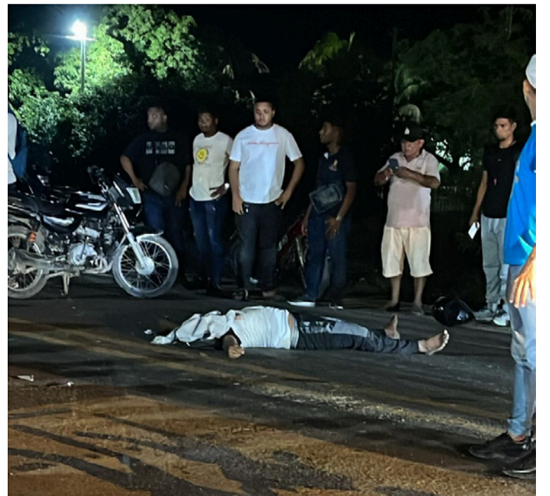
En el siniestro vial, las autoridades señalaron que un hombre de la etnia wayúu, habría perdido la vida.

Además, se espera un reporte oficial por parte de las autoridades para conocer en detalles cómo ocurrió este accidente vial y conocer la identidad de la persona fallecida.