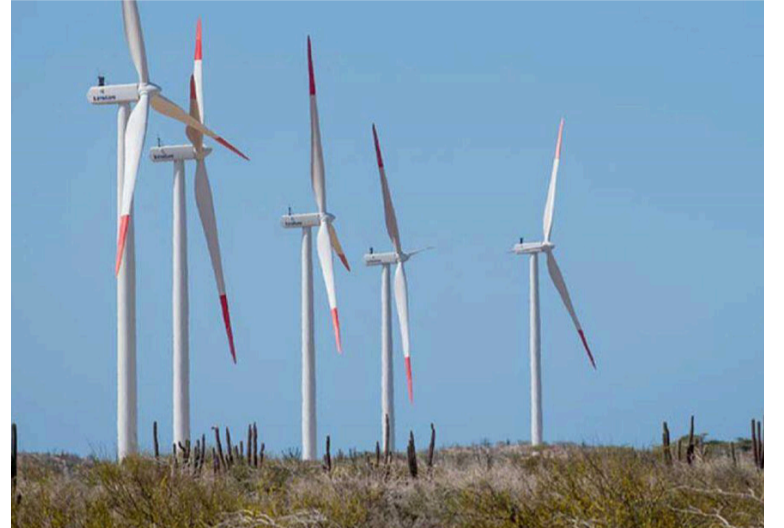
Actualmente, cuatro proyectos asociados a energías limpias en La Guajira se encuentran en evaluación.

ciudadana, la Anla reportó el impulso de la presencia institucional en territorio mediante trabajo coordinado con autoridades tradicionales wayúu, la implementación de la Escuela de Gobernanza Ambiental Étnica y la articulación con Mínimas, Ministerio de Ambiente y Desarrollo Sostenible, Sena y Corpoguajira para fortalecer capacidades locales. Además, se reconocieron 17 terceros intervinientes en actuaciones administrativas ambientales y se dio cumplimiento a compromisos del Pacto por La Guajira en materia regulatoria y compensaciones bióticas, garantizando transparencia en la toma de decisiones. Durante el periodo evaluado no se solicitaron Audiencias Públicas Ambientales en el Departamento; sin