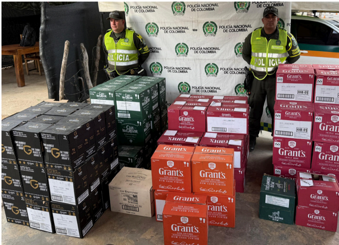
Operativos permitieron obtener importantes resultados en materia de seguridad vial.

ser verificada en los sistemas de antecedentes, registró un reporte activo por hurto violento, radicada ante la Fiscalía 166 de Medellín, Antioquia. El vehículo fue puesto a disposición de la autoridad competente.