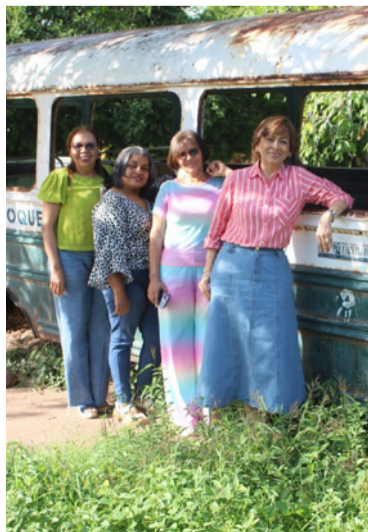
Se busca restaurar el tradicional bus escolar.

El objetivo de esta iniciativa es recuperar y preservar este símbolo del pasado educativo y cultural de