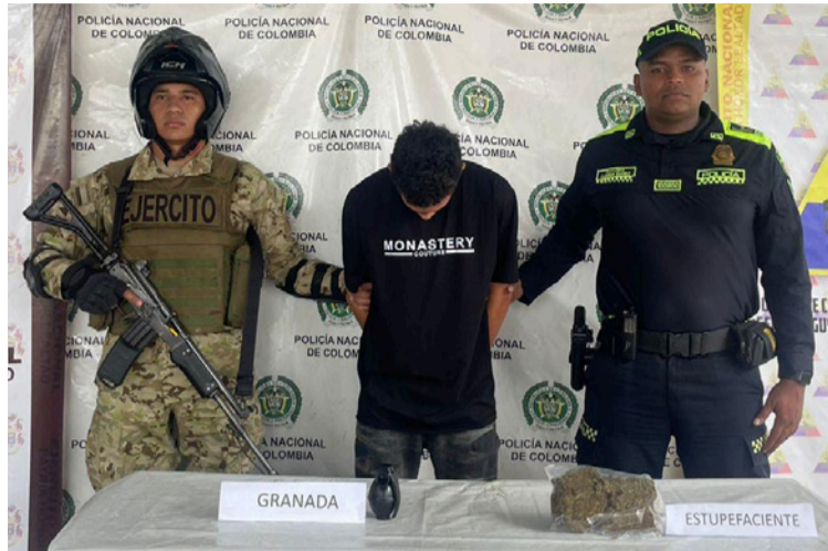
El capturado y elementos incautados, fueron dejados a disposición de la Fiscalía 5ª Especializada de Riohacha.

Alias 'El Mono' registra antecedentes por fabrica-