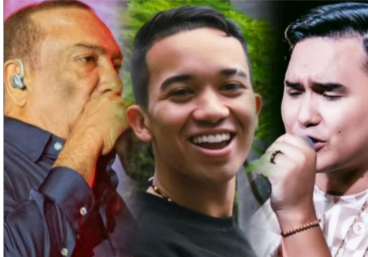
Hoy viernes 10 de octubre será la Noche de Compositores en el Samarian Social Club.

El Festival Mar de Acordeones tendrá los concursos de: Cantantes pre juvenil - Aficionado, Acordeoneros Prejuvenil - Aficionados - Profesional y Canción inédita (en homenaje a los 500 Años de Santa Marta).