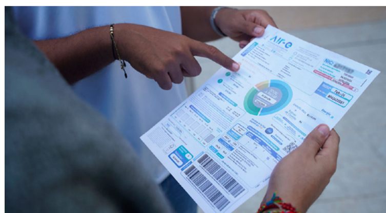
La disminución del precio del kilovatio/hora se convierte en un alivio para los bolsillos de las familias,

DESTACADO El logro se da gracias a la articulación institucional del Gobierno nacional entre el Ministerio de Minas, la Creg, la Superservicios y la misma empresa.