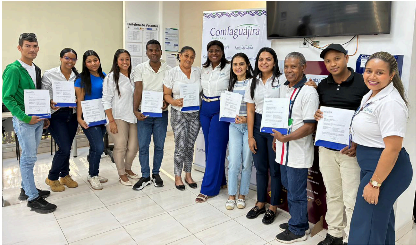
Comfaguajira felicita a los hogares beneficiarios e invita a toda la comunidad a mantenerse atenta a las próximas convocatorias.