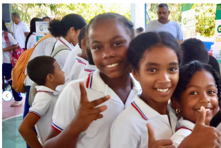
La educación del departamento de La Guajira vive momentos de alegría con frases como lo viejo se va.

sector educativo debido a la Intervención educativa. Llegaron gran cantidad de funcionarios del interior del país para enseñarnos a manejar nuestros propios recursos y lo que hicieron fue malgastar y derrochar.