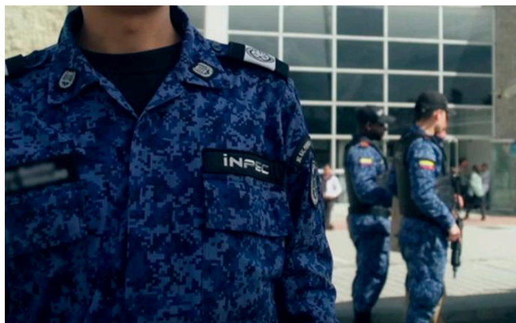
Hombres en motocicleta se acercaron a la entrada del penal amenazando de muerte a los dragoneantes.

El hecho ocurre en un contexto de creciente preocupación por la seguridad de los funcionarios del Inpec, tras la existencia de un 'Plan Pistola' que ha afectado a guardias en distintas regiones del país