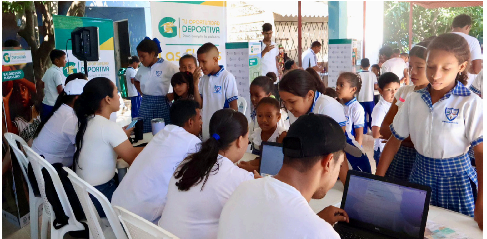
Atrás quedaron los tiempos de la intervención educativa departamental, lo que dejó muchos sinsabores.

Se recuerda cómo La Guajira, en años anteriores vivió un desgobierno total, especialmente en el