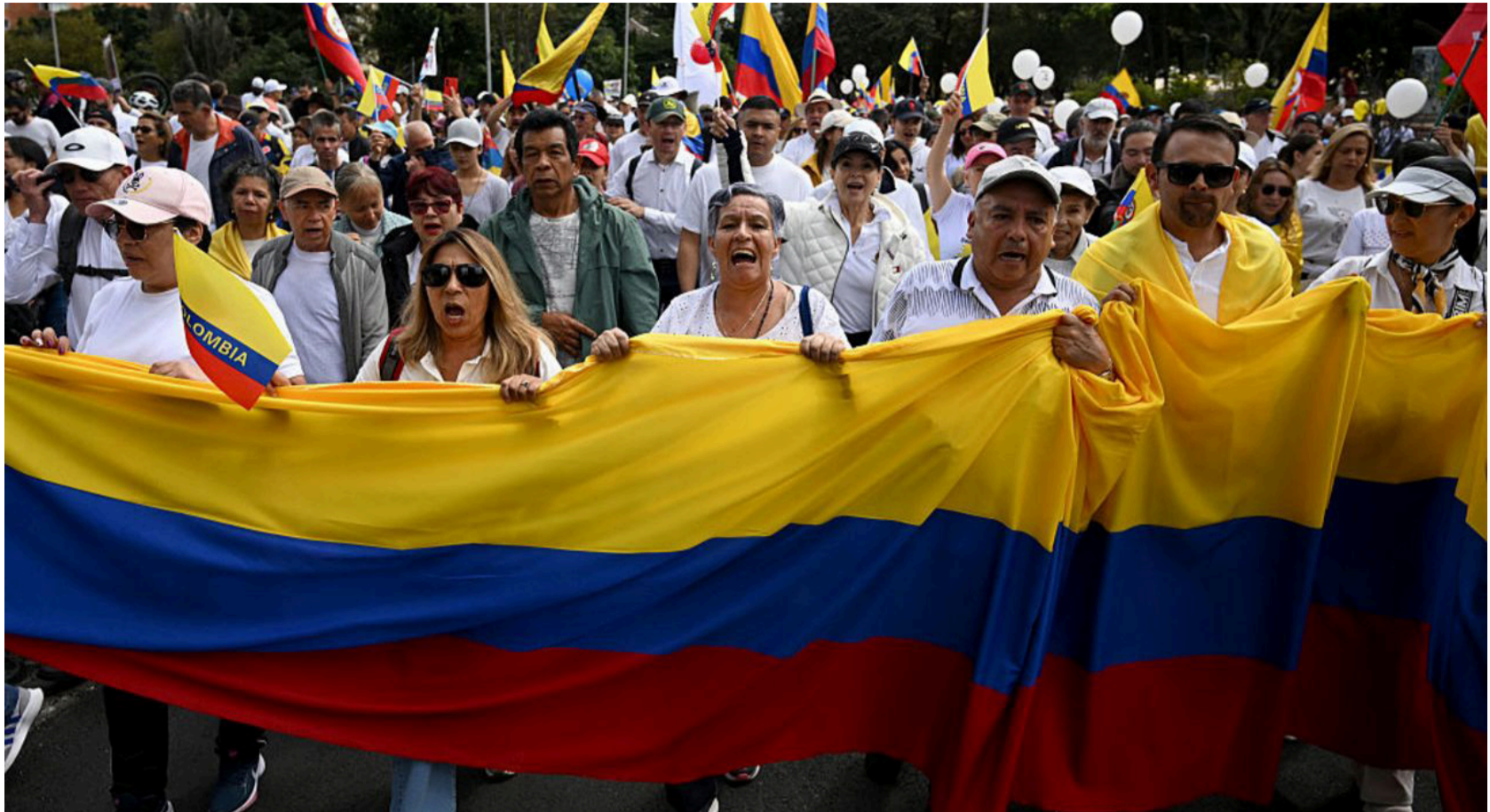
No podemos seguir eligiendo a quienes ven el poder como una mercancía, como algo que se compra y se vende.

Se debe elegir a quienes no se venden como vulgar mercancía