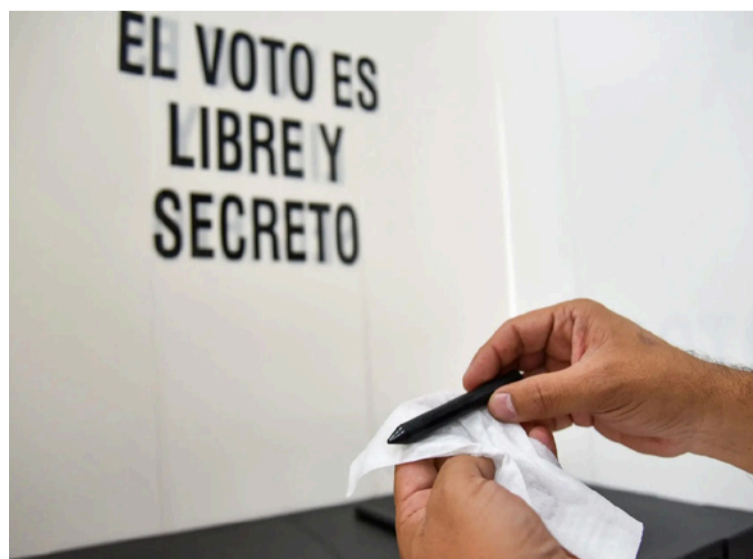
No votaré por partidos sino por personas que han demostrado integridad, no agachan la cabeza por dinero.

Y como dijo el filósofo de La Junta: "Se las dejo ahí..."