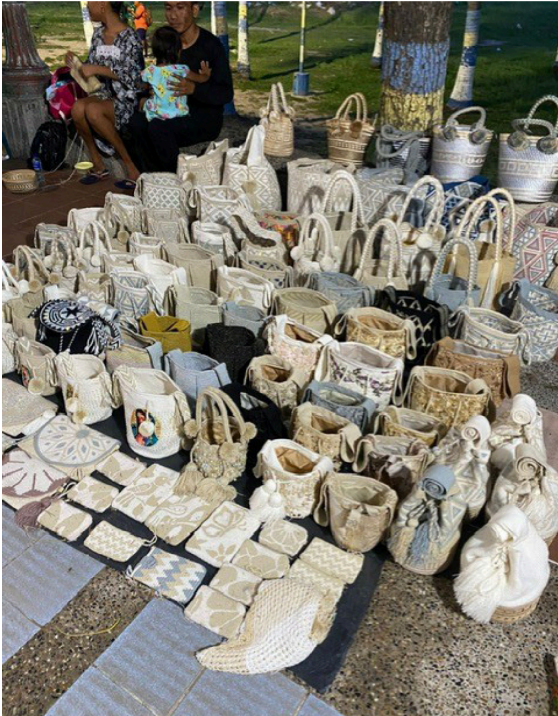
La creatividad de las tejedoras wayuú es inagotable: no hay dos diseños iguales.

La distinción legal blinda la marca, no la vida detrás del tejido, y su aplicación real solo beneficia a un conjunto reducido de alrededor de cuarenta personas o asociaciones, que de ninguna manera representan el total de la población que vive de