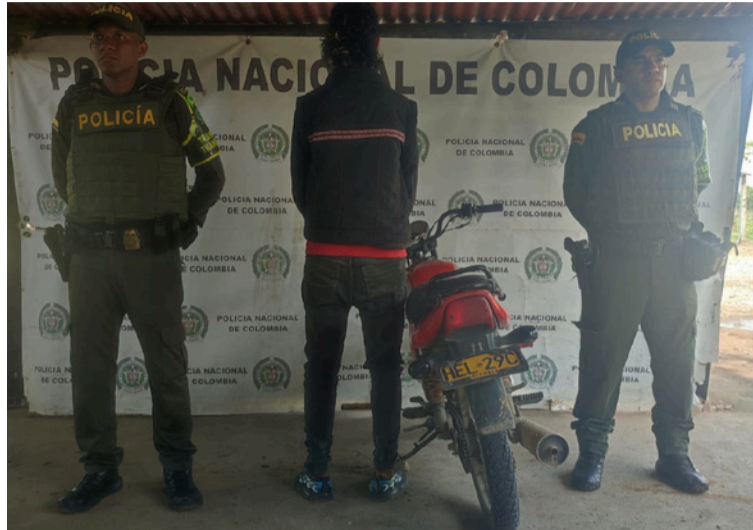
Se indicó que las capturas están relacionadas con delitos como falsedad marcaría y uso de documentos falsos.

El segundo caso se presentó en la vía Palomino-Riohacha, a la altura del kilómetro 71, jurisdicción de la capital guajira, donde fue capturado José