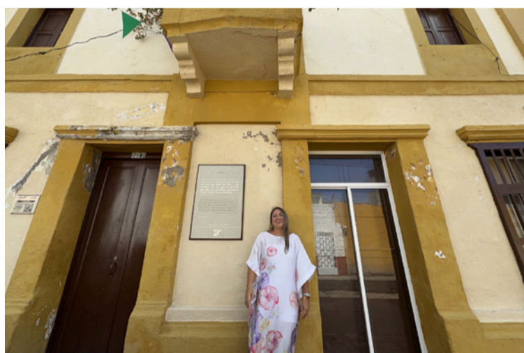
Casa donde pasaron la luna de miel los padres de Gabo y donde él fue concebido.

Por ello, la alianza entre los empresarios del sector turismo y las autoridades de este con los artistas, gestores culturales, y las instituciones del sector público es tan necesaria como urgente con el fin de fortalecer las capacidades de los actores, impulsar los procesos creativos y articular esfuerzos constantes para aprovechar los escenarios potenciales y reales que nos permitan dar a conocer a Colombia y al mundo, nuestro inmenso, invaluable, diverso y único crisol cultural.