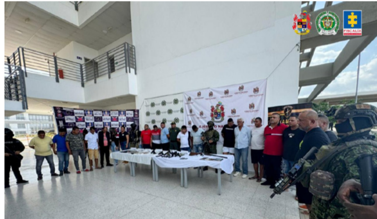
A estas personas se les señala de obtener fusiles y otros elementos en inmediaciones de Valledupar y Mingueo.

Por todo lo anterior, fiscales de la Delegada para la Seguridad Territorial imputaron a los 23 investigados, de acuerdo con su posible responsabilidad individual, los delitos de concierto para delinquir agravado; fabricación, tráfico y porte de armas, municiones de uso restringido, de uso privativo de las Fuerzas Armadas o explosivos; fabricación, tráfico, porte o tenencia de armas de fuego, accesorios, partes o municiones; uso de menores para la comisión de delitos; y tráfico, fabricación o porte de estupefacientes.