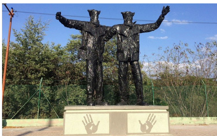
Monumento a los Embarradores, figura imprescindible en los carnavales de Riohacha.