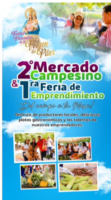
La Jagua del Pilar celebra a su patrona, la Virgen del Pilar, reafirmando su identidad y sus raíces.

Hoy viernes 10 de octubre, se disputará la gran final del cuadrangular, también a las 4:30 p.m., seguida de una tarde cargada de actividades culturales, recreativas y tradicionales, desde las 5:00 p.m., en el mismo escenario.