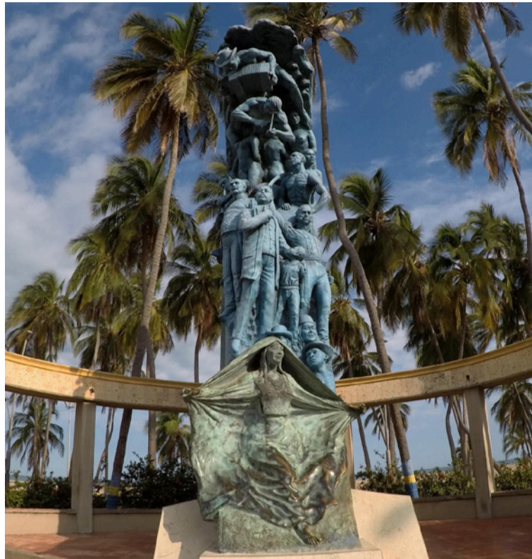
Monumento Identidad.

Alguna vez nos hemos preguntado: ¿Qué tan reconocida es nuestra his-