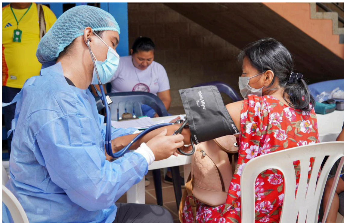
Se informó que esta jornada médica se llevará a cabo los días 11, 12 y 13 de octubre.

Durante tres días, más de 120 profesionales nacionales e internacionales, entre médicos, enfermeros, odontólogos y personal de apoyo, llegarán a