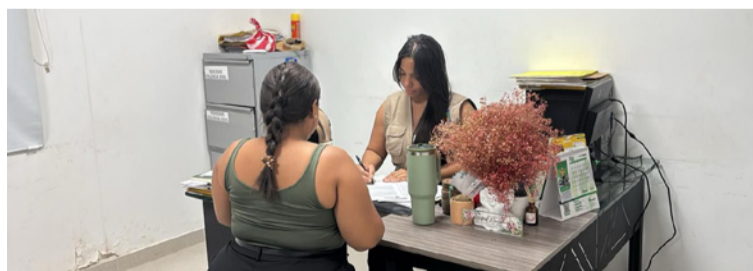
El logro refleja el esfuerzo por construir un San Juan más justo, seguro e incluyente.

al municipio como referente nacional en políticas de protección y equidad social, ratificando su compromiso con los derechos humanos y la convivencia pacífica.