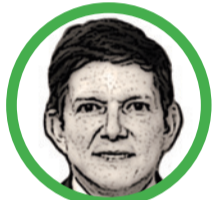
Por Wilson Ruiz Orejuela