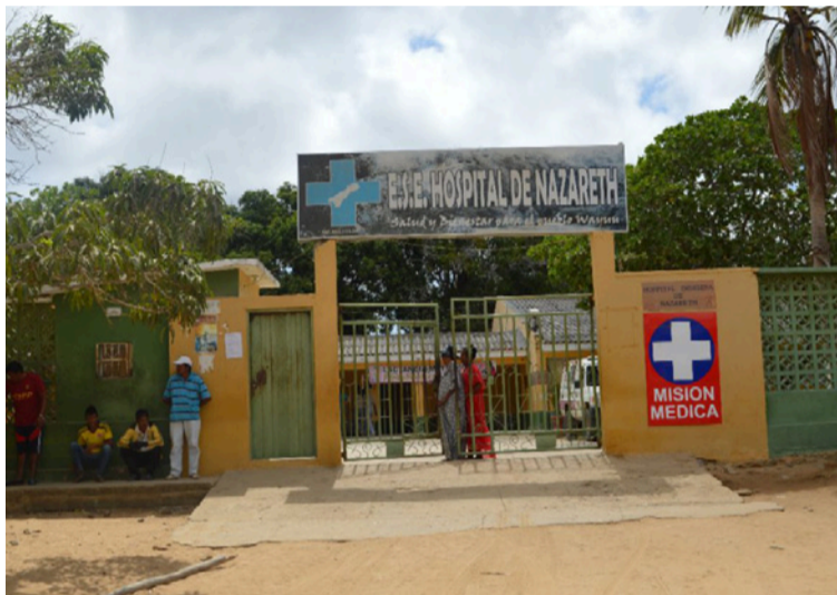
Los hospitales con una situación muy crítica son los de Barrancas, Hatonuevo, Manaure y el de Nazareth.

Precisó que los hospitales que se encuentran con una situación muy crítica