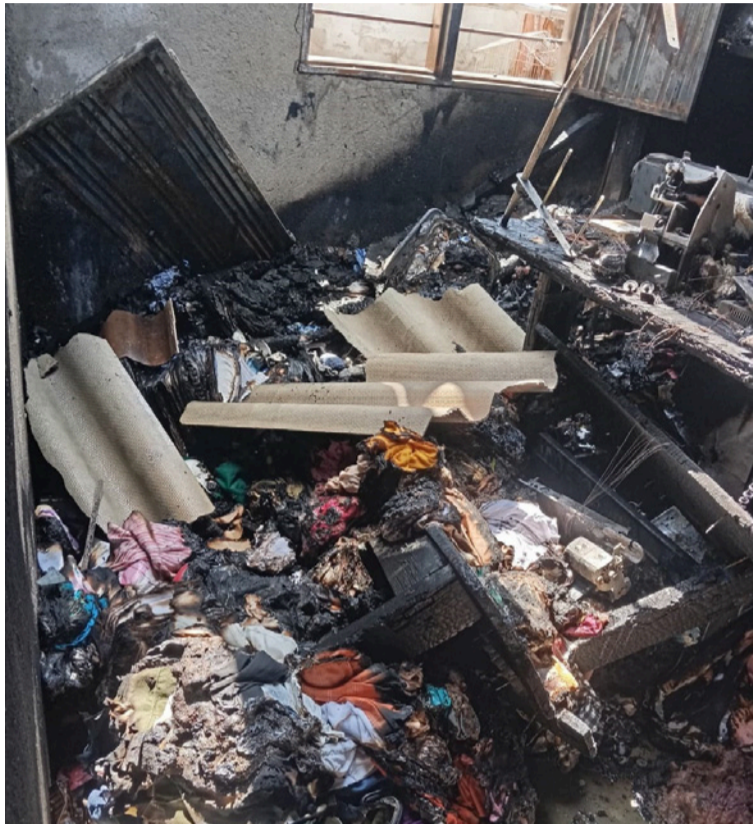
El incendio fue estructural y se debió a fluctuaciones de la energía que provocaron un cortocircuito.