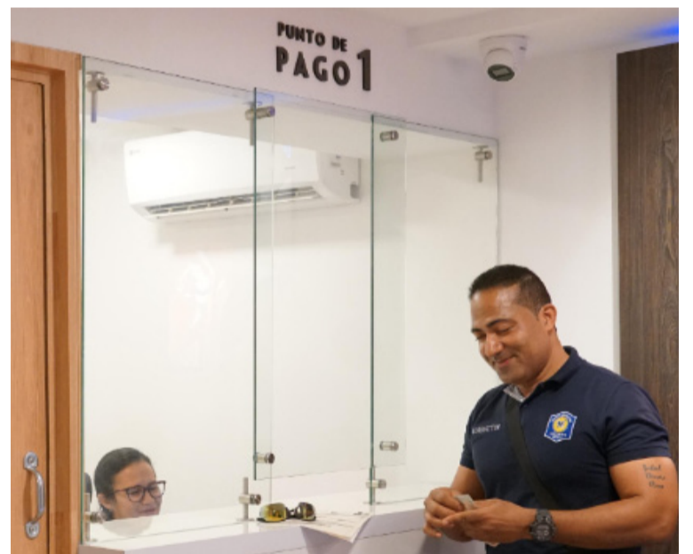
El nuevo punto busca acercar los servicios a la ciudadanía y ofrecer un espacio ágil y seguro.

Con este avance, la Gobernación de La Guajira continúa modernizando los servicios tributarios y facilitando el cumplimiento de los deberes ciudadanos, asegurando más eficiencia en la gestión y mayores oportunidades de inversión social en beneficio de todos los guajiros.