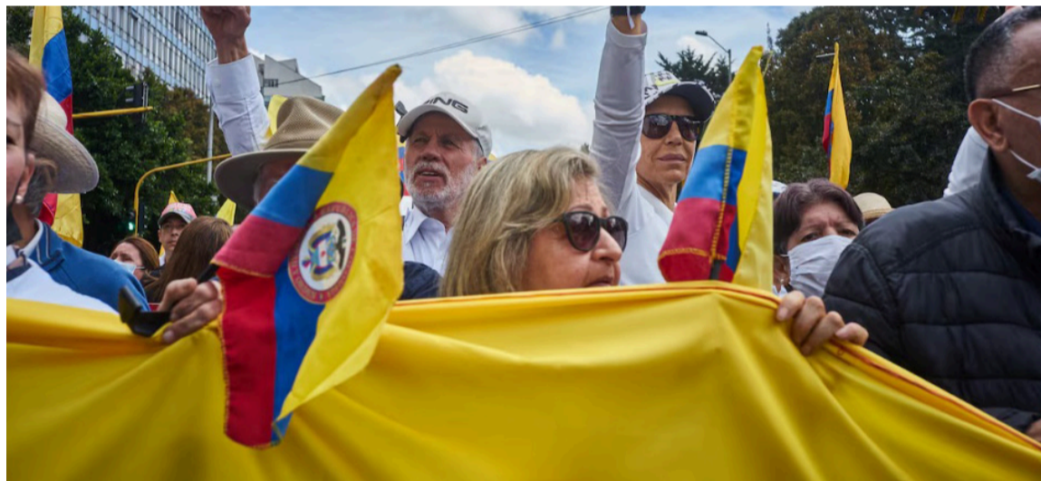
La oposición en sentido estricto se hace necesaria para crecer.

Con este Estatuto se ha logrado en principio institucionalizar la deliberación, la crítica, la fiscalización y los controles por parte de la oposición política que garantiza derechos.