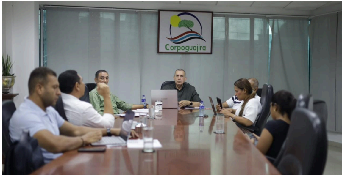
Se reafirmó el cumplimiento del Plan de Saneamiento y Manejo de Vertimientos.