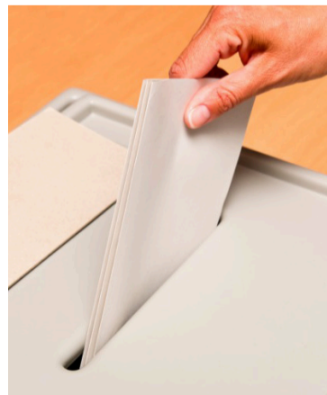
La PGN hará la verificación de estos sistemas.

El Procurador General de la Nación, Gregorio Eljach, que preside la Comisión Nacional de Control Electoral, lidera la conformación de un equipo interdisciplinario de expertos en vigilancia técnica, quienes serán los encargados de verificar la funcionalidad, capacidad y estricto cumplimiento de las especificaciones técnicas de las herramientas