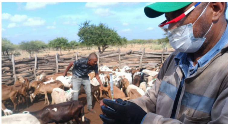
El propósito es proteger la salud animal y garantizar la seguridad alimentaria de las comunidades.

naure. El proceso de vacunación se está desarrollando con el apoyo de la Dirección Operativa para Prevención y Atención de Emergencias y Desastres de La Guajira, beneficiando inicialmente a las comunidades rurales de Ma-