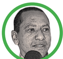
Por Jorge Nain Ruiz Ditta