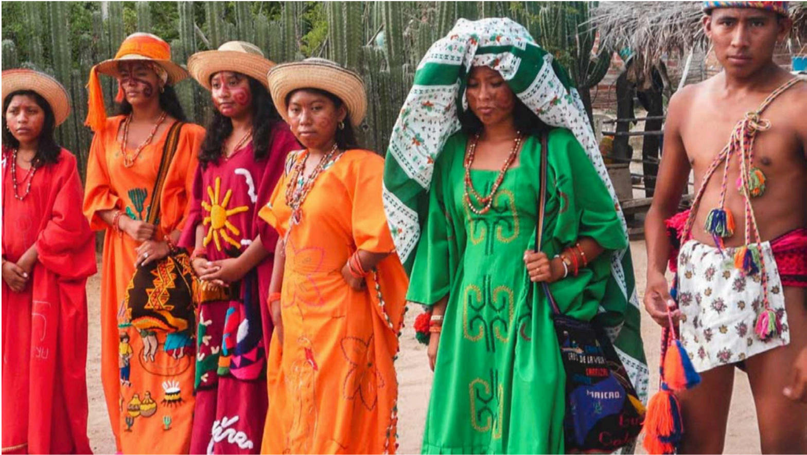
Toda una gran diversidad de culturas en nuestro territorio, antes de la llegada de los españoles.