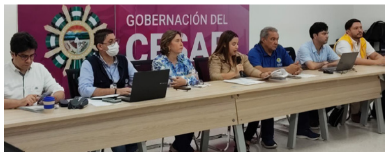
El objetivo era evaluar el cumplimiento a las órdenes judiciales de las sentencias de restitución.

La Dirección Territorial Cesar - La Guajira de la Unidad de Restitución de Tierras (URT) lideró una reunión del Subcomité Departamental de Tierras,