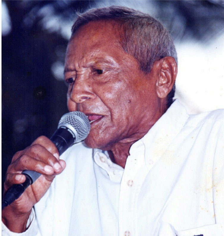
Máximo Movil Mendoza, compositor de las mujeres, la naturaleza, la tristeza y la injusticia.

Al lado de Hernando Marín Lacouture (q.e.p.d.) y Sergio Moya Molina, integró el famoso 'Trío de Oro' del folclor vallenato. Con estos dos colegas recorrió