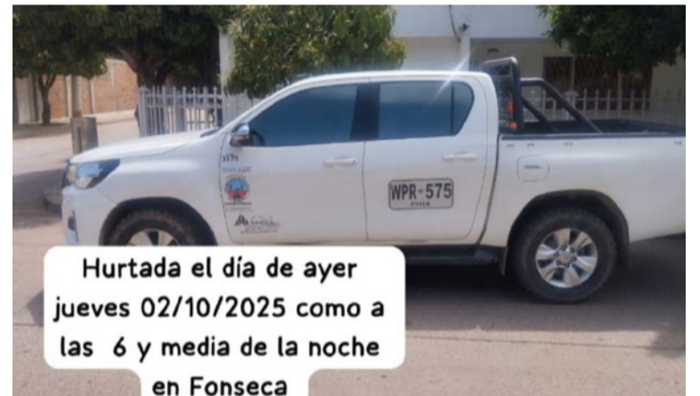
La víctima fue sorprendida por hombres armados que lo intimidaron y se lo llevaron con la camioneta.

Las autoridades tienen conocimiento de lo sucedido y se encuentran en las labores de búsqueda de la camioneta, además, solicitan a la sociedad civil