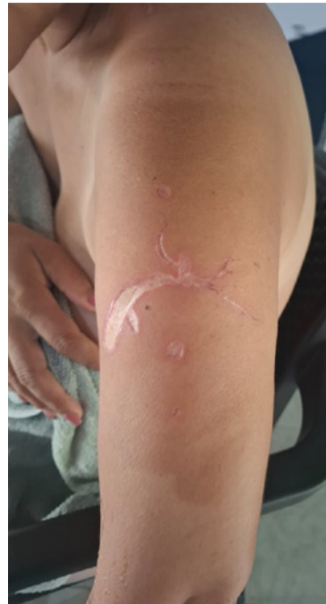
La mujer resultó herida con un abanico de techo.

quemó lo que había allí: cinco máquinas de coser, telas, una lavadora y costuras de clientes.