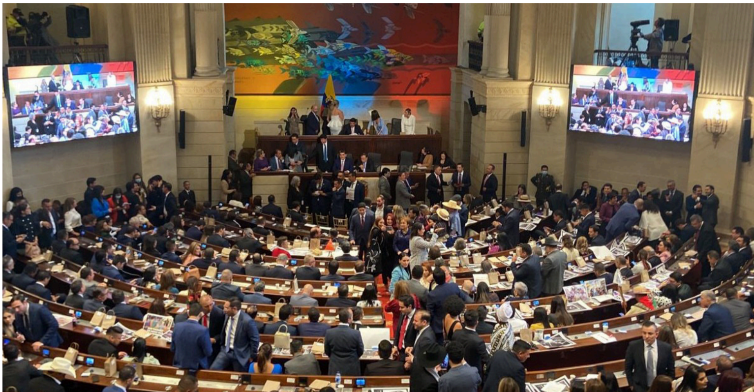
En Colombia no ha sido fácil declararse en contradicción ideológica de los poderes económicos y sociales.