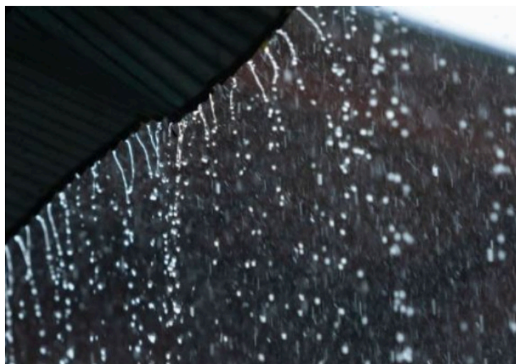
El mes de octubre es históricamente con los volúmenes de lluvia más altos en la península de La Guajira.

DESTACADO Las temperaturas oscilarán entre los 31 °C a 34 °C, los vientos serán calmos, lo que dará la posibilidad de desarrollo de nubosidad vertical de gran altura en la atmósfera.