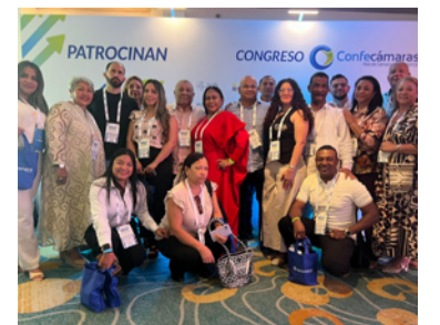
Se dieron cita empresarios de todos los sectores.

En el congreso se dieron citas empresarios de todos los sectores, visionarios y líderes de opinión que contribuyen al desarrollo social y económico del país.