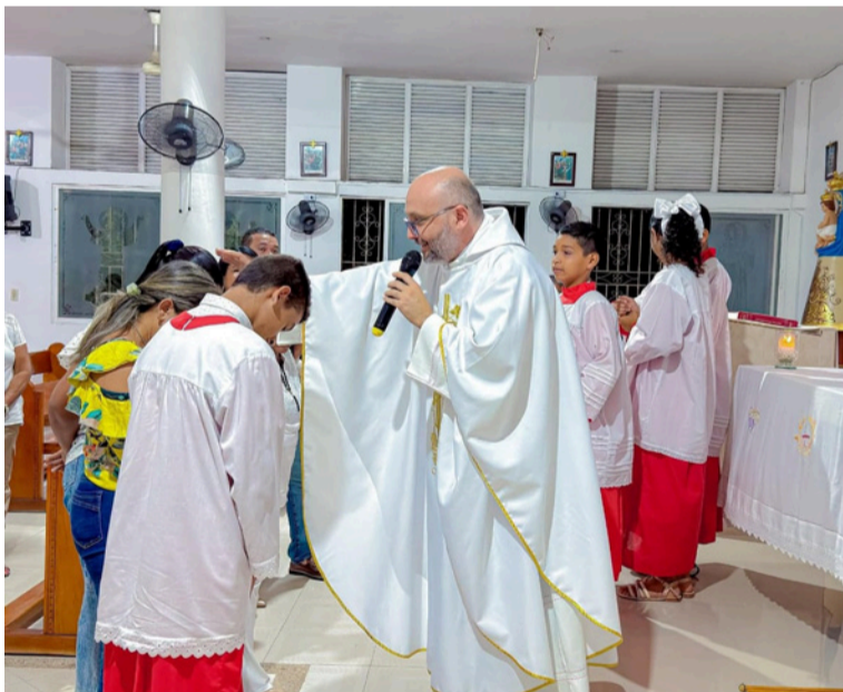
La celebración fue acompañada por feligreses, líderes comunitarios y representantes de diferentes sectores.