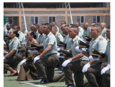
187 ascendieron al grado de Subintendente.

En un acto solemne realizado en el estadio de fútbol Federico Serrano Soto se llevó a cabo la ceremonia de ascenso de un personal del Nivel Ejecutivo y de patrulleros que alcanzaron el grado de Subintendentes de la Policía Nacional.