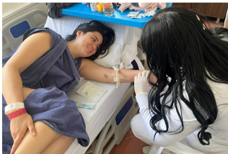
La endometriosis es el crecimiento de un tejido similar al revestimiento del útero por fuera de este.