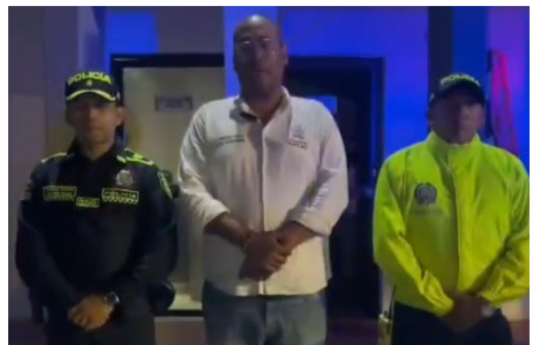
Los sujetos capturados tras labores de investigación estarían involucrados en atentados sicariales.

Las autoridades de Maicao continúan en la lucha contra la criminalidad y buscando la sana convivencia en la entidad, para recuperar la tranquilidad de los maicaeros que estaba afectada por diversos delitos.