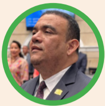
Por Antonio José Correa Jiménez