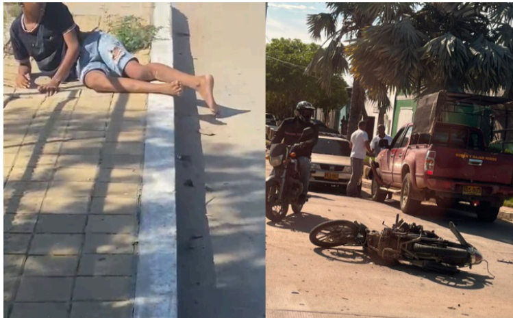
Se pudo conocer que el joven herido fue llevado hasta un centro asistencial, donde recibió atención.

El incidente se habría registrado entre una moto y una camioneta, en el que al parecer la imprudencia al conducir y el exceso de velocidad serían la causa del percance.