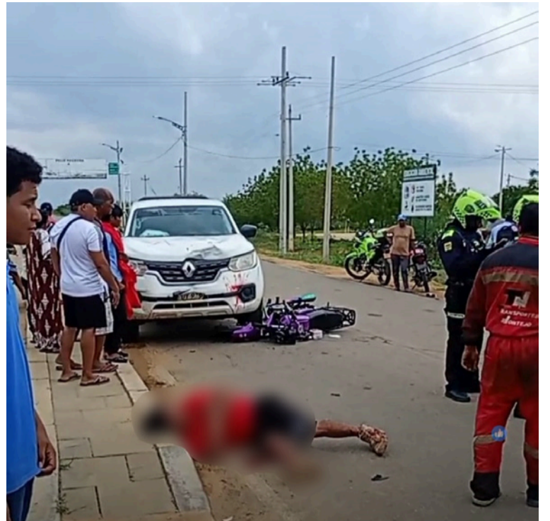
El hombre fue auxiliado y llevado hasta la urgencia de la E.S.E Hospital Armando Pabón López.

EL PRESENTE AVISO SE DESFIJA DE LA CARTELERA DE LA ALCALDÍA DISTRITAL EL DÍA 30 DE OCTUBRE DE 2025.