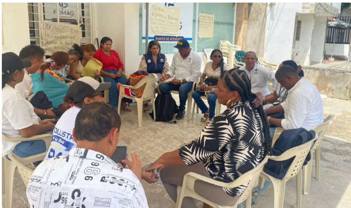
Docentes advierten que hay menores de edad, con enfermedades huérfanas.

En este momento, varios maestros pertenecientes a la Entidad Territorial Certificada Riohacha, que padecen enfermedades oncológicas