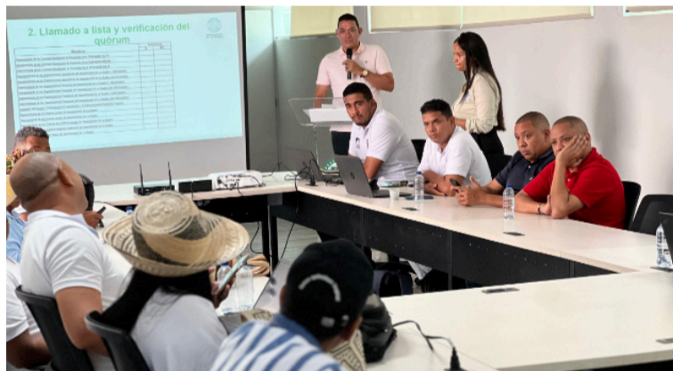
La Gobernación de La Guajira fortalece su compromiso con el impulso del sector productivo.

Durante la tercera sesión ordinaria del Consea 2025, realizada en el auditorio de la Gobernación de La Guajira, participaron representantes del ICA, la Mesa Nacional Integral Permanente de la Pesca,