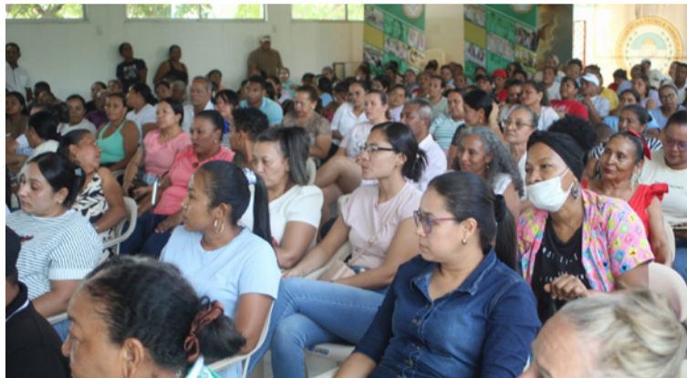
La Alcaldía municipal de Urumita reafirma su compromiso con el fortalecimiento del tejido empresarial local.