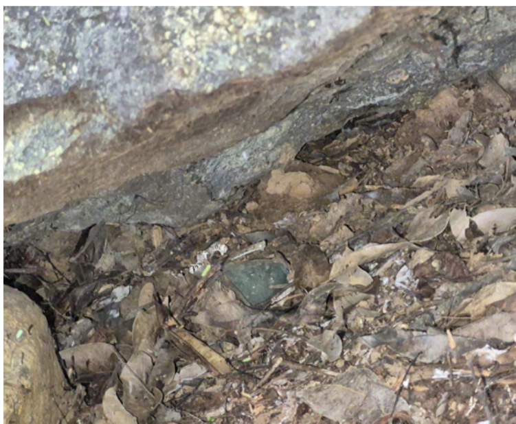
Según informó una fuente militar estas municiones pertenecerían al grupo criminal Clan del Golfo.

si hay más artefactos o municiones, con el fin de garantizar la seguridad en esta región de La Guajira.