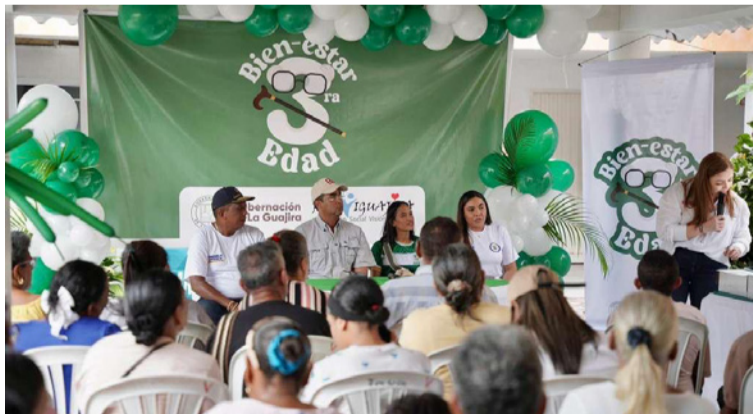
La Gobernación anunció que el programa se ampliará durante 2026 a los quince municipios del Departamento.

La iniciativa, que inició con la participación de los municipios de San Juan del Cesar, Villanueva, El Molino y Fonseca, se desarrolla a través de cinco componentes esenciales: fortalecimiento de la salud física, promoción del