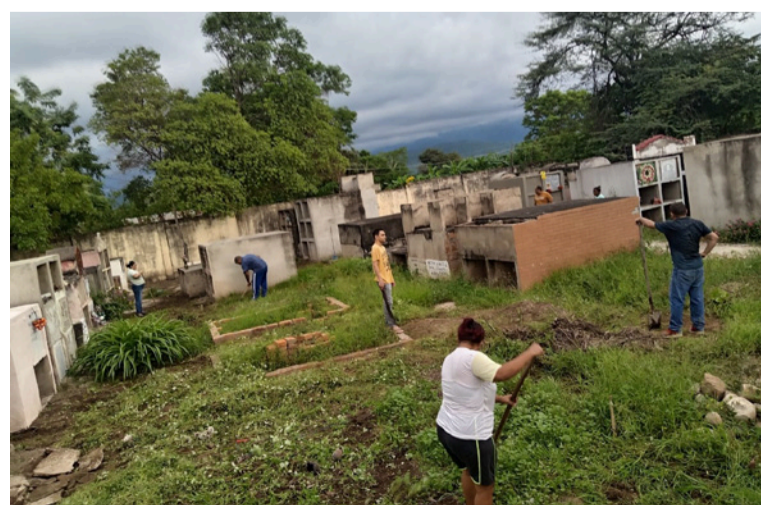
La comunidad adelantó una jornada de embellecimiento del cementerio local.

Con este tipo de espacios y proyectos, la Gobernación de La Guajira fortalece su compromiso con el impulso del sector productivo, promoviendo un desarrollo competitivo y articulado al progreso integral del Departamento.