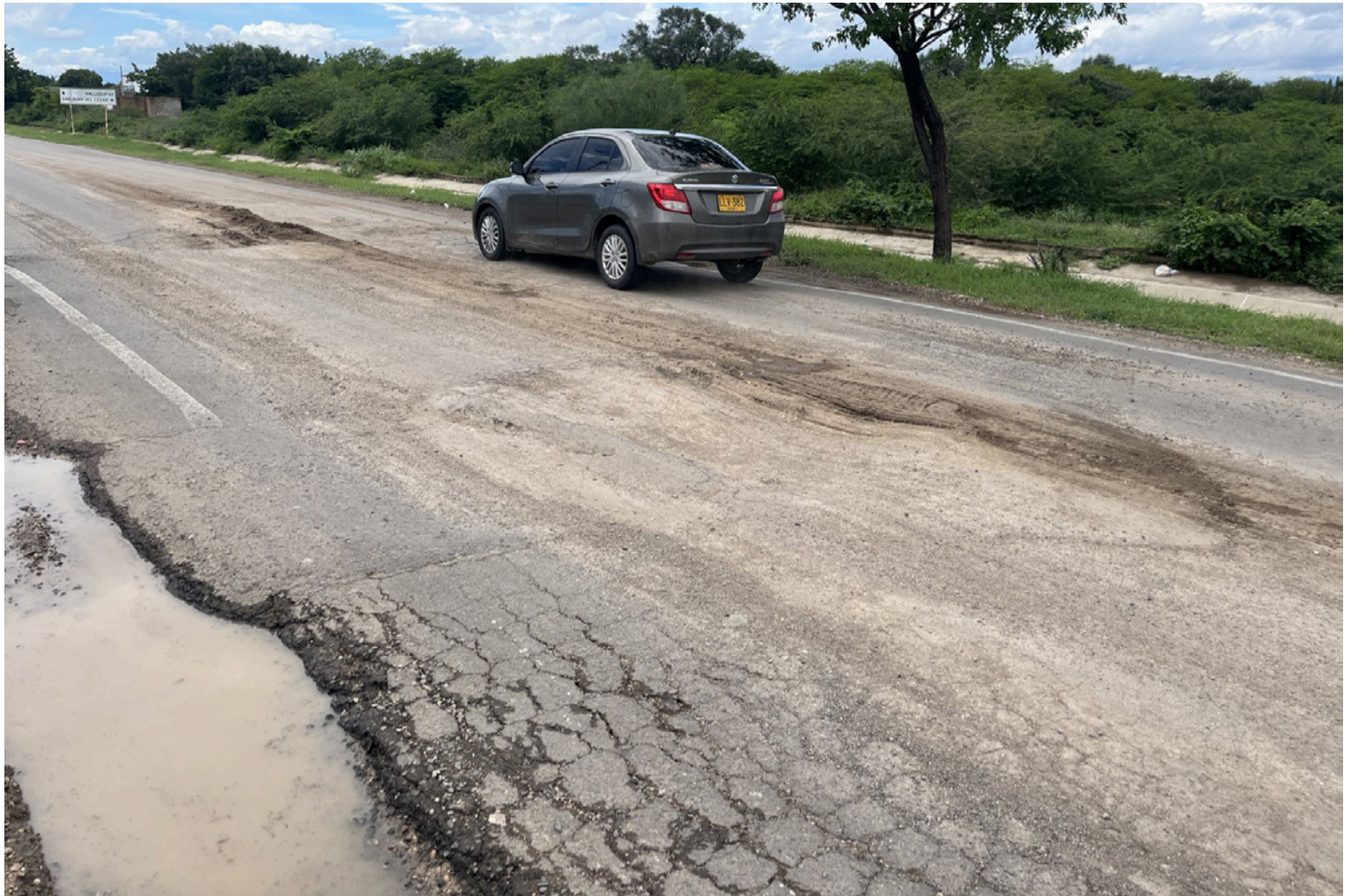
Ya hay en los mismos sitios reparados hace un tiempo, daños considerables que son factores de riesgo y peligros.

Todos los usuarios de esa vía vimos cómo se trabajaba, pero muchos por no ser ingenieros, en realidad no podíamos valorar la calidad técnica ni de materiales usados en esas reparaciones o rehabilitación de vías que hicieron. Como legos en esa materia y tipos de trabajos, no podíamos tampoco saber si esas eran las obras específicas para ciertos sitios de la vía, o si el reparar que hacían era lo conveniente y lo técnicamente correcto. Es decir, todo, como siempre ocurre, estaba en manos del conocimiento y la buena fe de los contratistas, de los interventores, de la Agencia Nacional de Infraestructura (ANI), y del Invías.