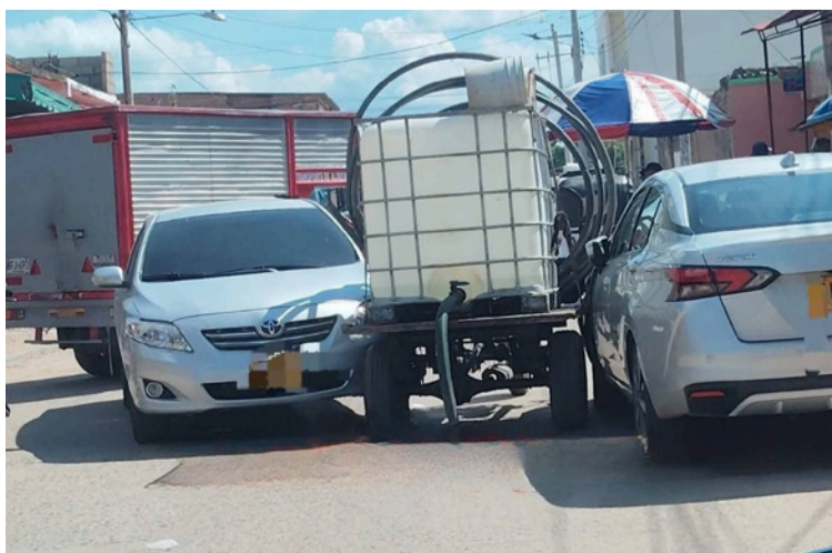
Las autoridades iniciaron las indagaciones para determinar las responsabilidades de este choque.

Uno de los vehículos se encontraba estacionado y fue impactado por el motocarro, seguidamente chocaron al otro automóvil, en hechos ocurridos en la carrera 19 con calles 13 y 14.