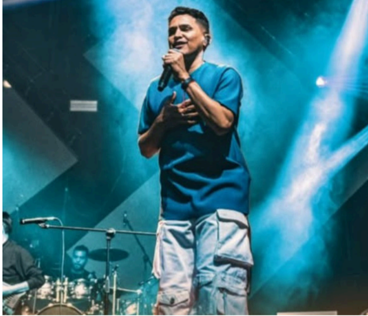
El artista villanuevero colgó los letreros de sold out, mostrando ese gran poder de convocatoria.

El público de diferentes países colmó los palcos y graderías de estos escenarios para vivir las emociones al ritmo de Celedón,