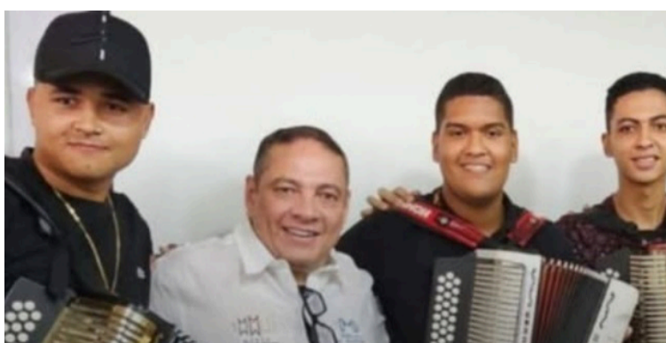
La formación de los estudiantes en estas áreas del folclor permite preservar las raíces del vallenato.

Julieth Peraza destacó que la formación de los estudiantes en estas áreas del folclor permite preservar las raíces del vallenato y su identidad cultural.