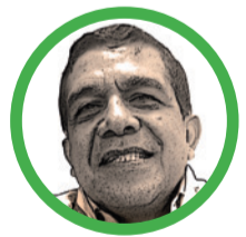
Por Hernán Baquero Bracho