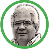
Por Rodrigo Daza Cárdenas