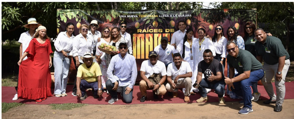
La comunidad se encarga de la comercialización a través de Nutrium S.A.

"Algo muy importante para resaltar de este proyecto, además de lo que aprenderemos, será que el producto será comprado por Postobón. Quiero agradecer a Cerrejón, porque estoy seguro de que en unos años se dirá que esta es una región donde se producen grandes frutos. Me siento muy complacido de hacer parte de