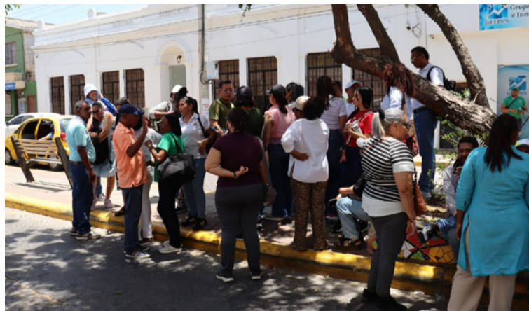
Los maestros llevarán a cabo la toma a Riohacha con participación de delegados de los diferentes municipios.

Los maestros defienden entre otras demandas la ley 91 de 1989, por medio de la cual se creó el Fomag; exigen el fortalecimiento del Fondo de Prestaciones Sociales del Magisterio-Fomag; exi-