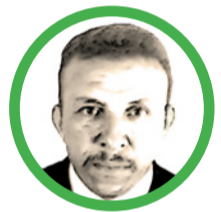
Por Alcibiades Núñez Manjarrés