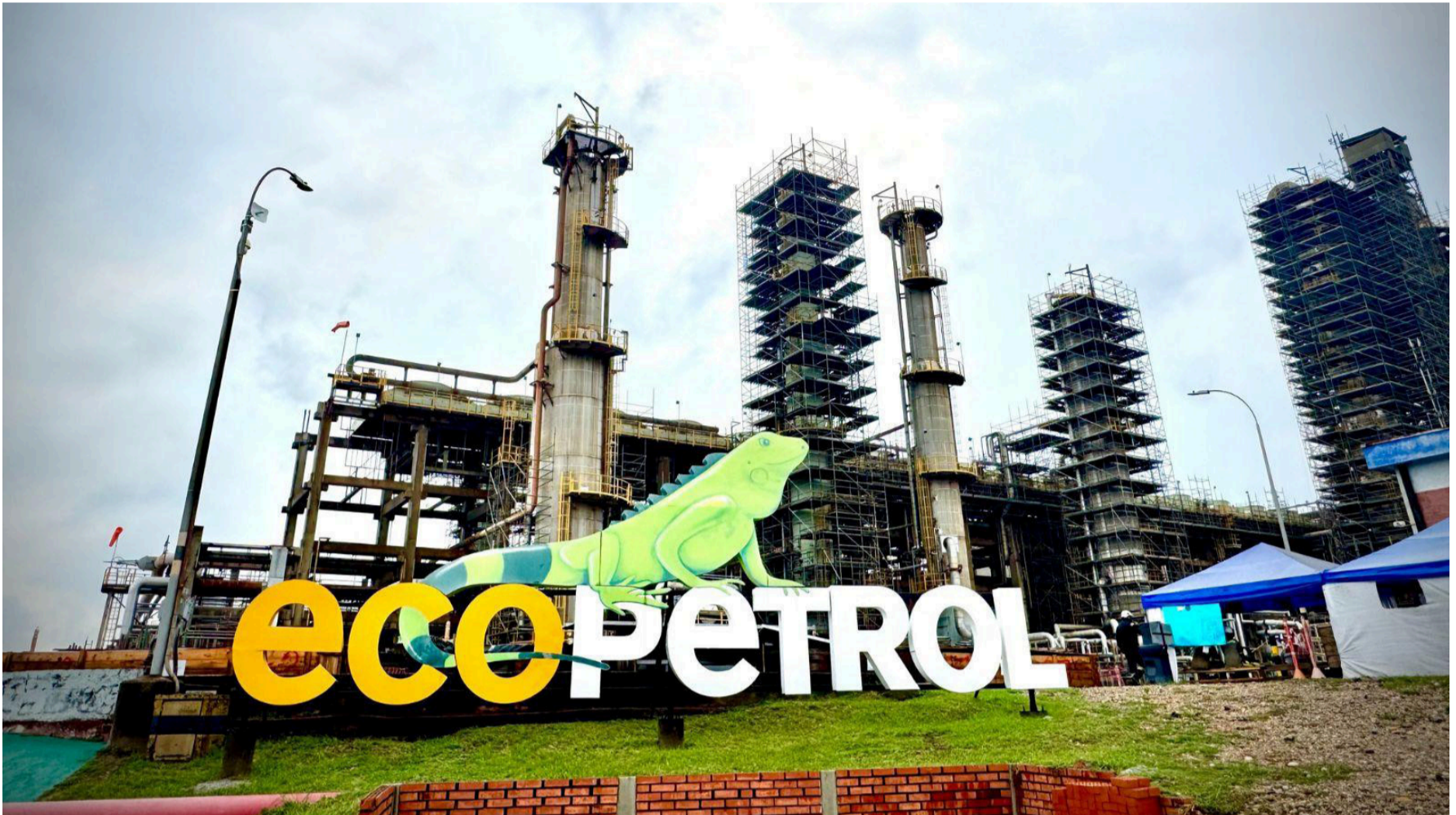
La verdad sea dicha, hoy por hoy esta es la inversión más rentable de cuantas posee el Grupo empresarial Ecopetrol en su portafolio.