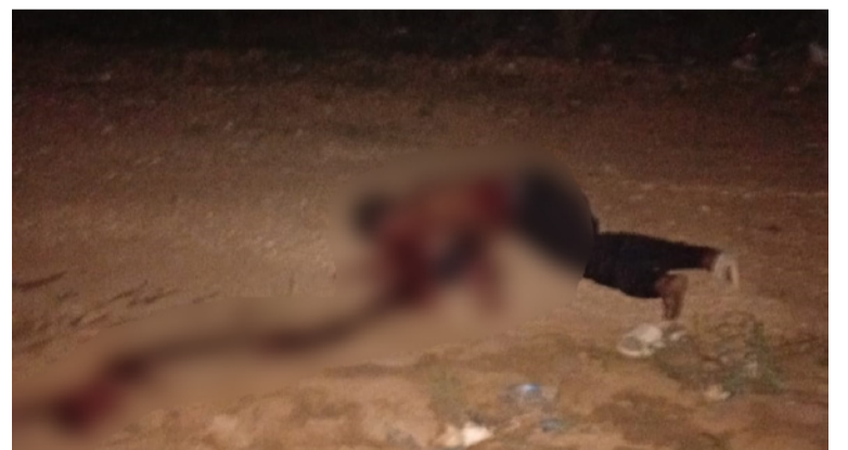
El hombre de la etnia wayuú está sin identificar, además presentaba impactos de bala en su humanidad.