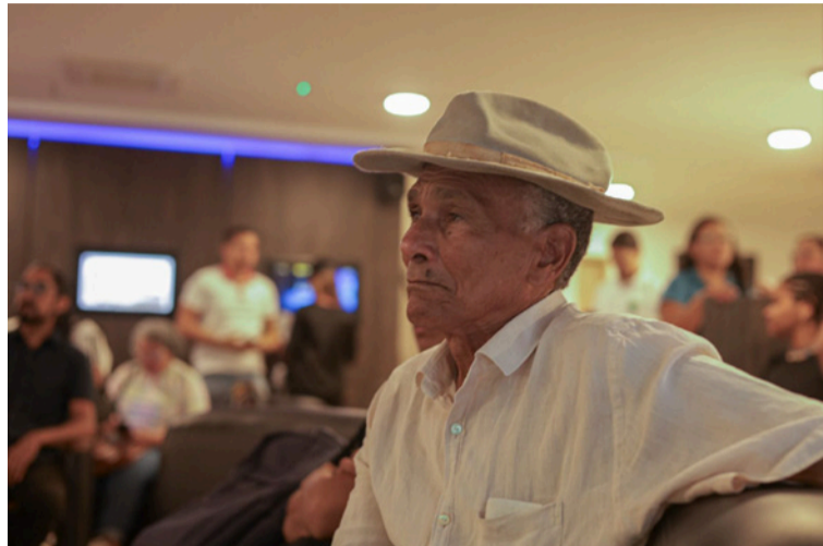
Con este tipo de iniciativas, Corpoguajira reafirma su compromiso con la formación ciudadana.