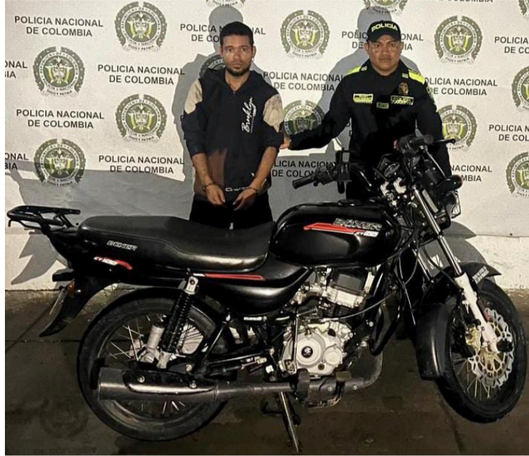
Según investigaciones, el capturado estaría presuntamente vinculado con otros hechos de hurto de motos.

"Este resultado es producto del trabajo constante de nuestros policías en las calles de Riohacha,