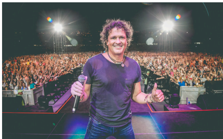
El cantante samario Carlos Vives ha guardado silencio frente a las críticas del folclorista Álvaro Álvarez.

Dueños de las agrupaciones 'Triple A' bájense a la vaina señores, que la masa no está pa bollo, después no digan que no se lo advertimos, como dice la publicidad de los circos.