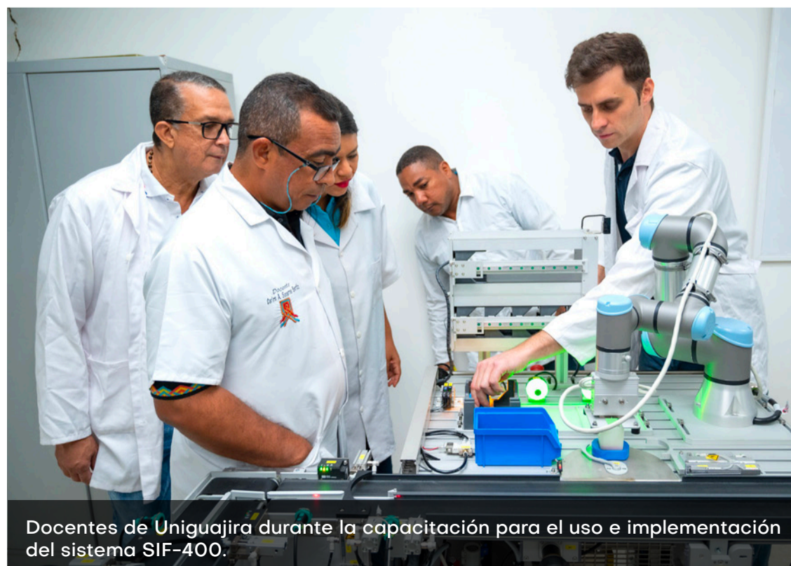
Docentes de Uniguajira durante la capacitación para el uso e implementación del sistema SIF-400.

Con este avance, la Universidad de La Guajira reafirma su compromiso con la innovación educativa y la formación de profesionales competentes, apropiados de la transformación digital e impulsores de la productividad y la sostenibilidad en la región Caribe y en Colombia.