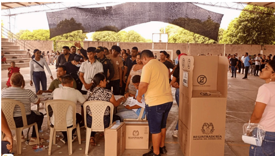
Los ciudadanos expresaron su inconformidad por la falta de organización.

En la mesa 1, varios votantes manifestaron haber llegado desde las nueve de la mañana, pero pasa-