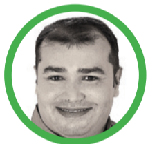
Por José Jaime Vega