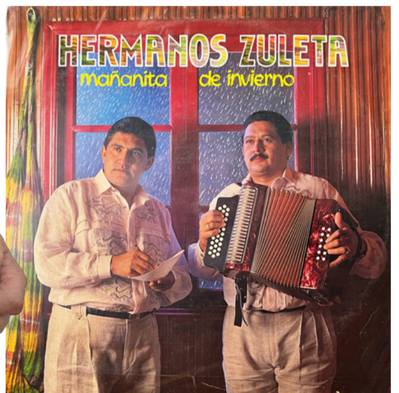
Carátula del disco 'Mañanita de invierno', Hermanos Zuleta, año 1993.