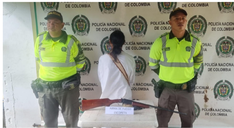
La Policía Nacional en La Guajira, logró importantes resultados contra el tráfico de armas y el contrabando.

DESTACADO Según dijo el coronel Diego Edison Montaña, los resultados reflejan el compromiso permanente de la Policía Nacional en La Guajira con la protección de la economía legal.