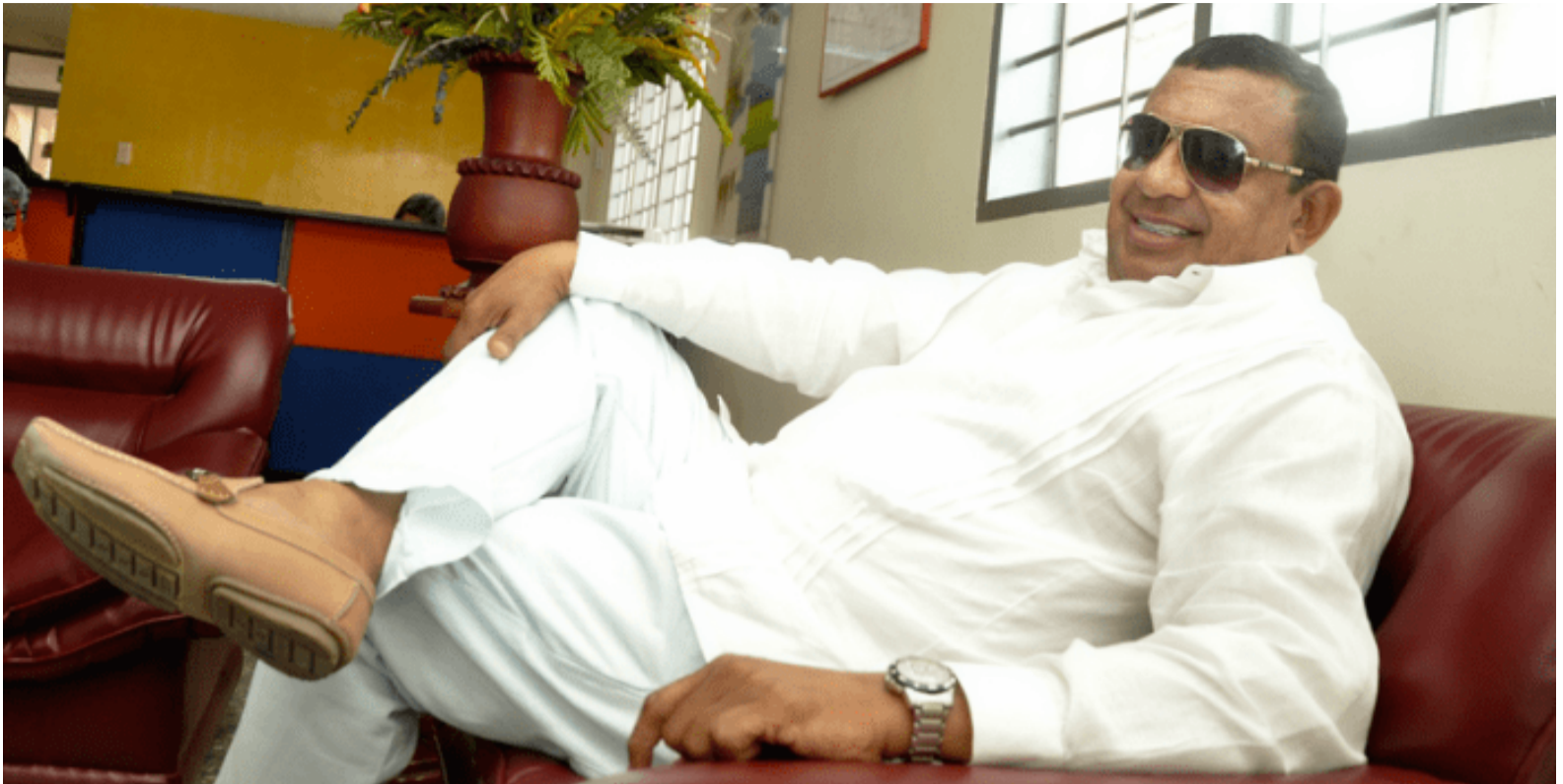
Álvaro Álvarez, 'Triple A', presidente del Festival Nacional de Compositores, descartó por redes sociales la millonaria propuesta de Carlos Vives para tocar en San Juan.