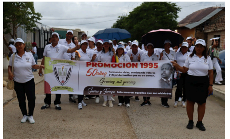
La jornada terminó en medio de risas, abrazos y mucha alegría por el reencuentro de compañeros.