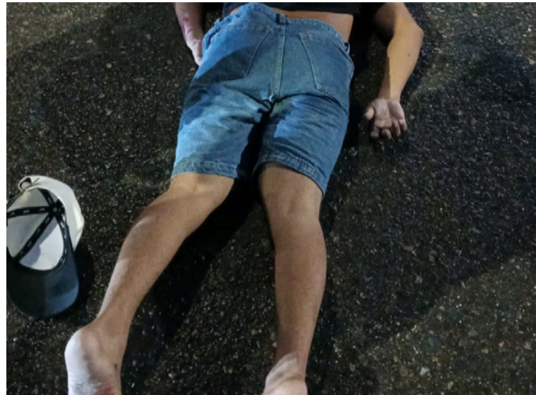
En el siniestro se vieron involucrados un automóvil y una motocicleta en la que se transportaban los tres jóvenes.

Clinivida donde se encuentra en estado crítico según lo informado por una fuente médica.