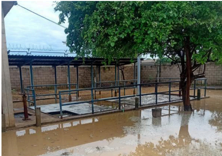
La entidad explicó que los rebosamientos se pueden presentar en cualquier sector de la ciudad.

Las Ebares se encuentran con niveles altos, lo que genera represamientos y rebosamientos de aguas residuales en los puntos más bajos del Distrito. A esta situación se suman las aguas del Riño que ingresan al sistema,