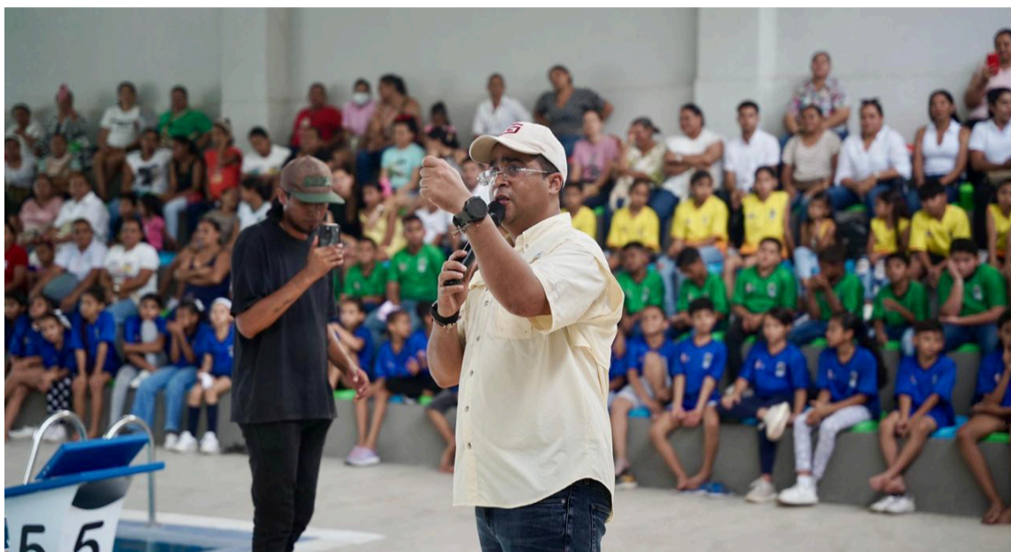
La visita a Urumita ratifica el compromiso de Aguilar de cumplir la palabra con hechos.

Otra acción del recorrido fue la inauguración de la piscina semiolímpica,