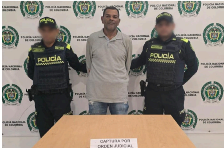
El ciudadano presentaba una orden de captura vigente emanada por el Juzgado Primero Penal.

El procedimiento se llevó a cabo en la calle 141 con carrera 37 del barrio Nuevo Horizonte, donde los uniformados realizaban actividades de registro y solicitud de antece-