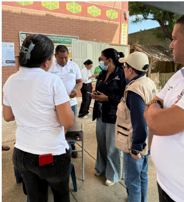
El servidor público, como ciudadano, conserva su derecho a expresar ideas, y a respaldar la democracia.

Desde el punto de vista jurídico, las inhabilidades e incompatibilidades de los concejales reguladas principalmente por la Ley 136 de 1994 y el régimen disciplinario de la Ley 734 de 2002 no contemplan la mera presencia en un evento público como una falta disciplinaria, salvo que exista prueba de que se utilizaron recursos públicos o que se haya ejercido presión indebida sobre los votantes. En el caso citado, no existe evidencia de tales conductas: no hubo uso de bienes institucionales, personal a cargo ni gastos públicos. Hubo, en cambio, una presencia cívica, pacífica y respetuosa del proceso electoral juvenil.