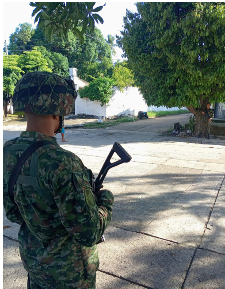
El Ejército, la Armada y Policía implementaron un amplio dispositivo de seguridad.

En desarrollo del Plan de Campaña Ayacucho Plus, el Ejército Nacional, a través de los soldados de la Décima Brigada, de manera conjunta y coordinada con la Armada Nacional, la Fuerza Aeroespacial Colombiana y la Policía Nacional, implementaron un amplio dispositivo de seguridad que permitió el desarrollo normal de la consulta popular llevada a cabo ayer domingo, 26 de octubre, en los departamentos de Cesar y La