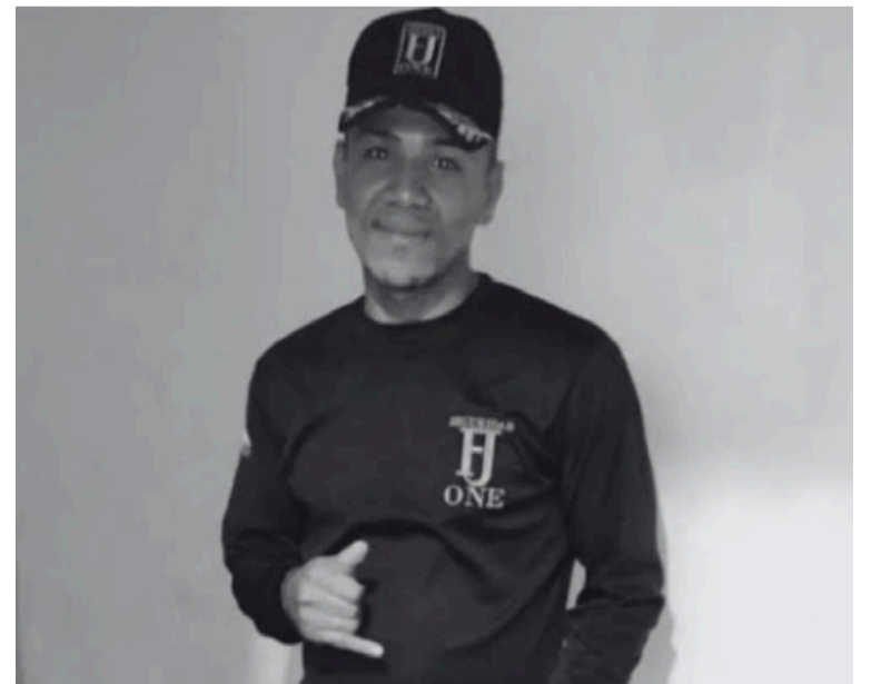
Según las autoridades, el ataque fue perpetrado por dos sujetos en motocicleta.

Sus familiares reclaman justicia y exigen la captura de los responsables, mientras la Policía Metropolitana de Valledupar informó que la investigación apenas se encuentra en sus etapas iniciales.