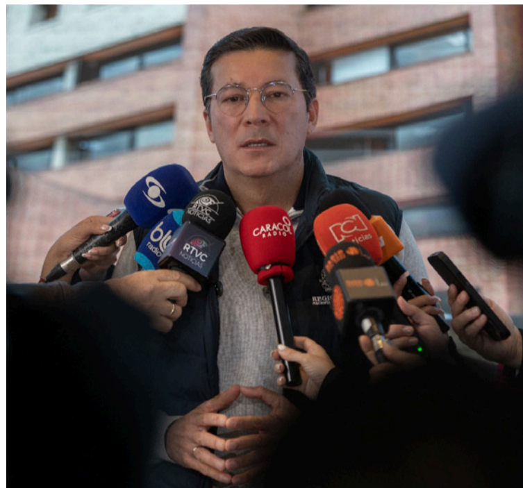
La Registraduría realizó seguimiento permanente a la jornada en todo el país para atender cualquier contingencia.

El registrador recordó que más de 38 millones de ciudadanos estaban habilitados para participar en estas consultas, cuyo cierre se llevó a cabo a las 4:00 de la tarde. Asimismo, reiteró su llamado a la calma y al compromiso cívico de los votantes, destacando el trabajo de los jurados y funcionarios desplegados en todo el país para garantizar la transparencia del proceso democrático.