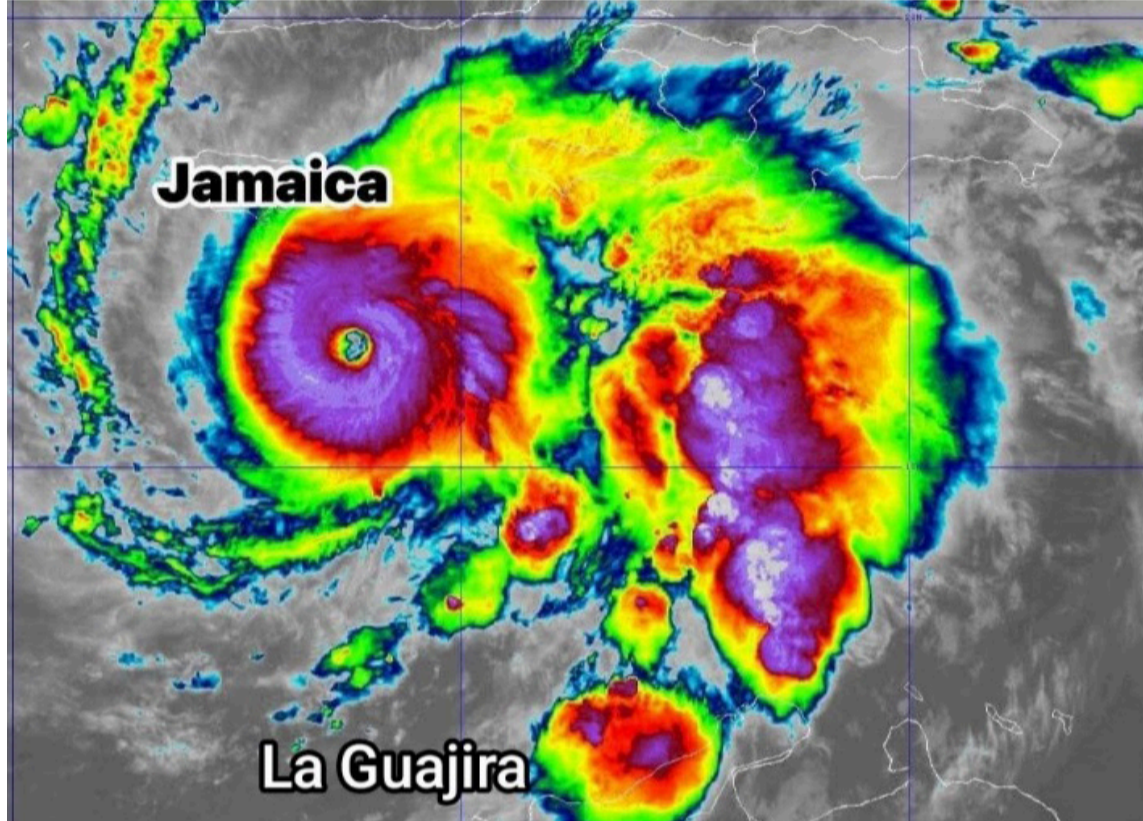
Podrían presentarse efectos indirectos en el departamento de La Guajira.

Ante esta situación, Corpoguajira recomienda asegurar objetos livianos o sueltos en patios, balcones y terrazas, y evitar refugiarse bajo árboles, estructuras metálicas o