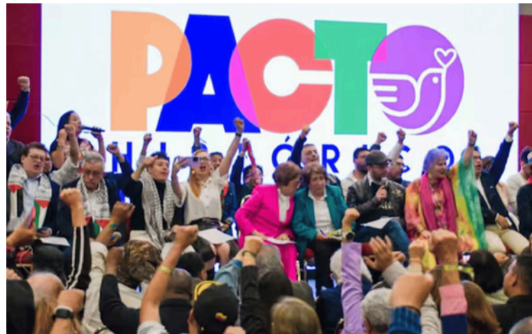
El PH buscó que se ampliara por una hora el cierre de las votaciones, porque varios puestos presentaron demoras.

No obstante, la Registraduría negó la solicitud asegurando que no existe soporte legal que permita modificar el horario de vo-