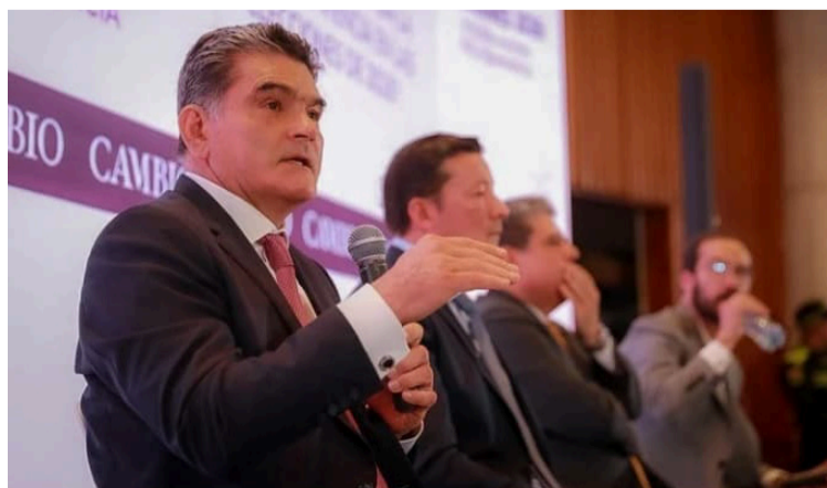
Gregorio, como sus amigos lo llaman, nació para servir a un país hoy convaleciendo por la falta de valores.

Hoy se desempeña con lujo de detalles como el procurador General de la Nación; Gregorio, como sus amigos lo llaman, nació para servir a un país hoy convaleciendo por la falta de valores; llegó él para trabajar por una paz política electoral orientando a la juventud para ejercer liderazgo con participación de las mujeres y los hombres que lleguen a controlar el accionar de las labores administrativas políticamente, así como las elegimos el próximo año para una paz electoral y una democracia participativa donde todo el territorio esté en paz para proteger la democracia, para el éxito de una paz electoral, paz política sin obstáculos, es lo que propone nuestro proceder, sobre todo velando por el respeto, la concordia, paz para no agredir, respeto por las diferencias, enfatizar, promover, y sobre todo velando por el respeto a las diferencias, enfatizó el ilustre procurador Gregorio Eljach Pacheco.