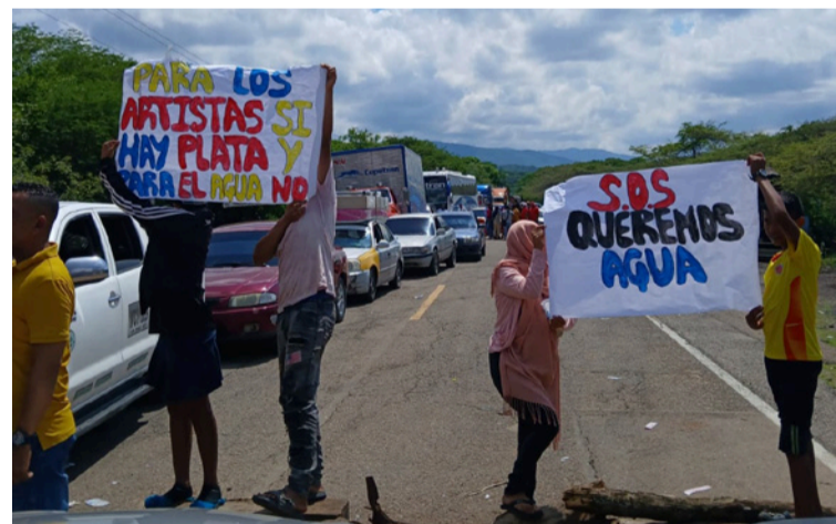
Tanto las autoridades tradicionales como la comunidad exigen acompañamiento institucional y soluciones.

Los hoy manifestantes reiteraron que su acción es pacífica, organizada y guiada por el diálogo, pero firme en la defensa de los derechos como pueblos indígenas. Cabe indicar que Cerrejón anunció que había entregado un pozo profundo, pero de acuerdo a las autoridades tradicionales esto nada más demoró un mes con el servicio de agua, y después, no han funcionado más.