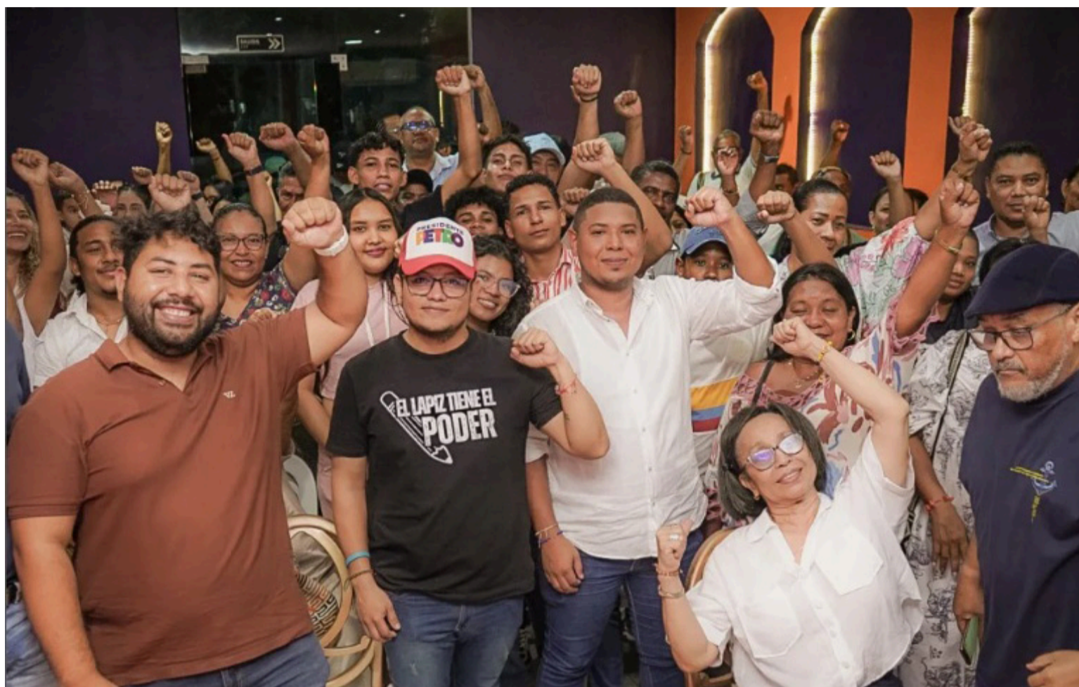
La consulta interna del PH, realizada el pasado domingo 26 de octubre, ha sacudido el tablero político regional.

El primer factor que explica este resultado es la reacción nacional y regional ante la ofensiva de la derecha, tanto en Estados Unidos —con el regreso del discurso autoritario de Donald Trump— como en Colombia, donde sectores radicales extremistas han