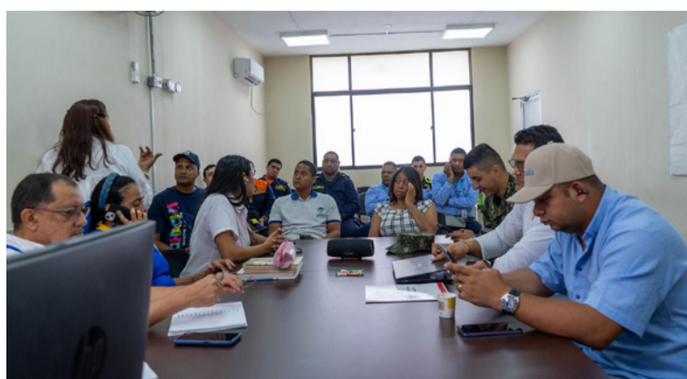
Para el secretario de Obras, la emergencia en la capital de La Guajira es delicada por las inundaciones.

Precisó que semana tras semana se ha venido acrecentándose la situación en la ciudad porque no ha dejado de llover, y por esa razón los miembros del consejo de Gestión del Riesgo, obligó a reunirse y a determinar que esa causal es determinante para que se decrete hasta la calamidad pública.