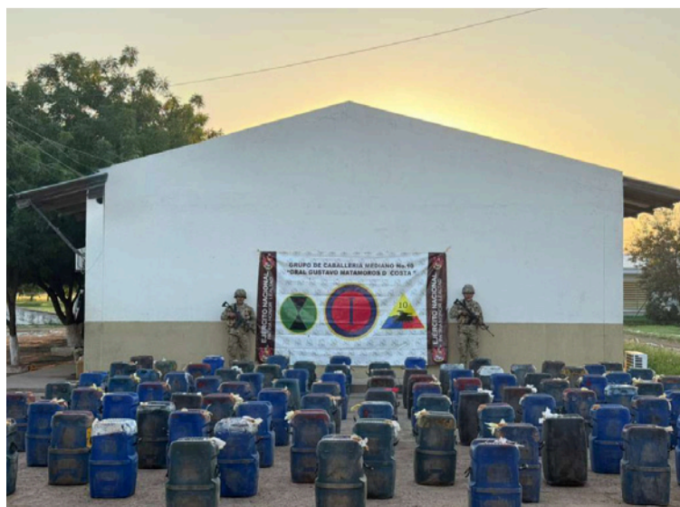
Este resultado afecta de manera significativa las economías ilícitas que delinquen en esta zona fronteriza.

la fuente militar, este resultado afecta de manera significativa las economías ilícitas que delinquen en esta zona fronteriza del departamento de La Guajira.