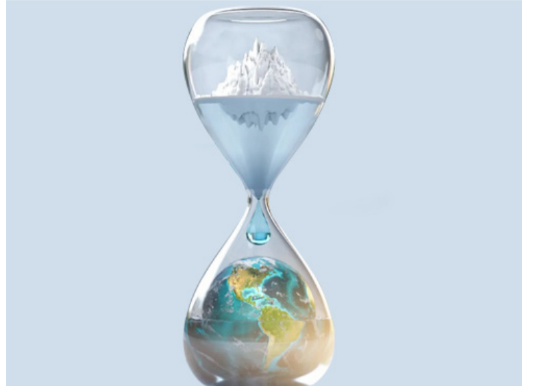
El evento busca justificar la necesidad de analizar los retos que el cambio climático impone sobre La Guajira.

La actividad se cumplió ayer miércoles 29 de octubre de 2025 en el salón 6207.