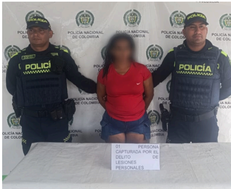
La mujer habría atacado con un objeto cortopunzante a varias personas que se encontraban departiendo.

El procedimiento se desarrolló tras el reporte recibido por la central de radio sobre una riña en la calle 8 con carrera 6 del barrio Villa Maicao, hasta donde acudieron las patrullas del cuadrante. Al llegar al lugar, los uniformados observaron a varias personas heridas siendo trasladadas hacia centros asistenciales por familiares y vecinos, y gra-