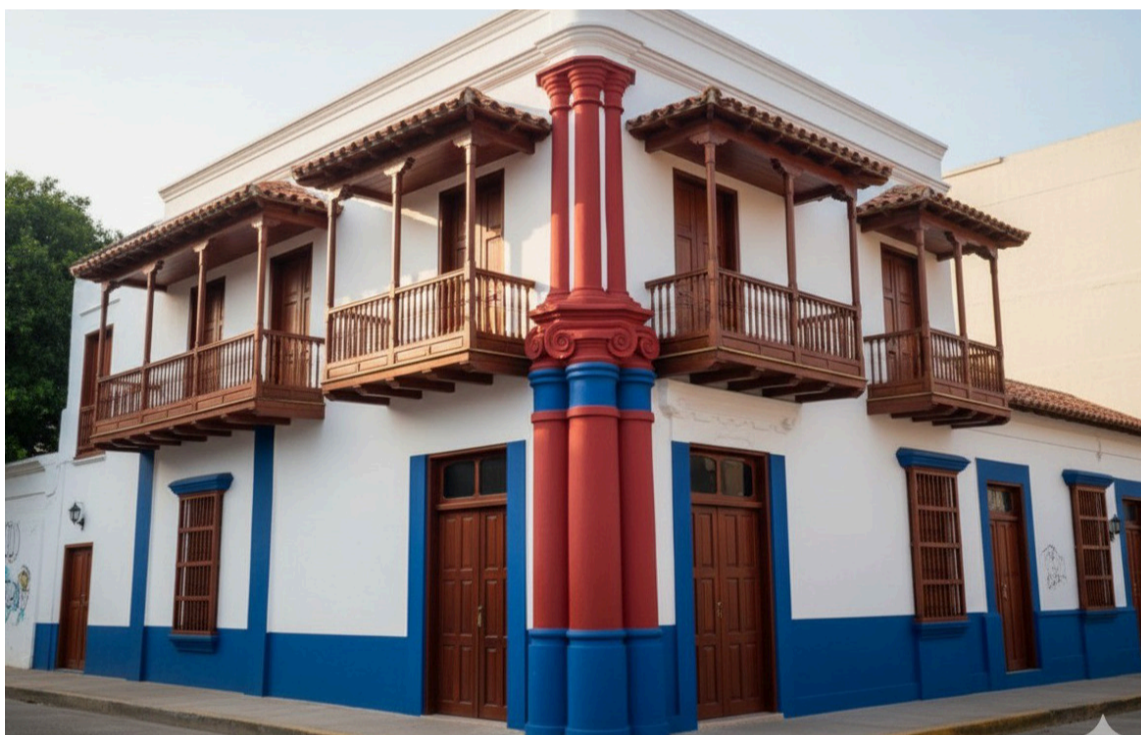
El centro histórico de Riohacha conserva el aroma del Caribe más antiguo.

acompañar. En lugar de desplazar, integrar. Autores como Loretta Lees y UN-Habitat proponen modelos donde la renovación urbana se apoya en la participación ciudadana, la vivienda asequible y la preservación del patrimonio cultural.