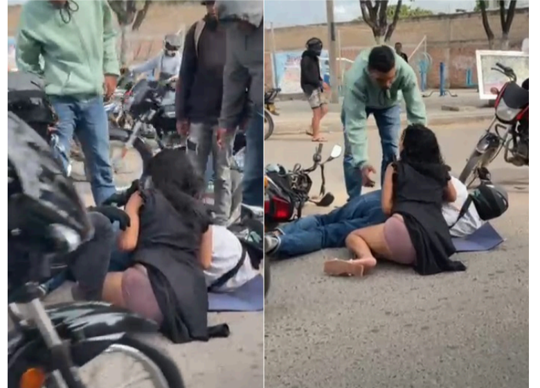
Al parecer habrían perdido el control de la motocicleta, lo que originó el fuerte impacto.

Las autoridades competentes llegaron al lugar del accidente para determinar el modo, tiempo y circunstancias en que ocurrieron los hechos, por