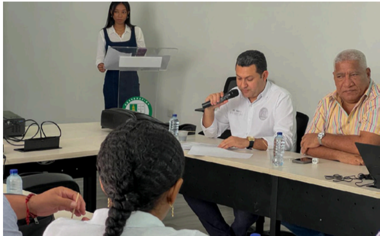
Esta campaña incluirá puntos de control y sensibilización en los 15 municipios de La Guajira.