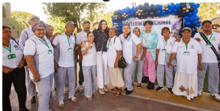
Estudiantes y adultos mayores se unieron en un ambiente de alegría y respeto, creando un espacio de encuentro.

La Alcaldía municipal de Barrancas, a través de la Secretaría de Salud, en conjunto con la Corporación Redes de Vida, llevó a cabo un emotivo encuentro intergeneracional que reunió a estudiantes de grado once de diferentes instituciones educativas y adultos mayores del municipio. El evento, que se realizó en el Parque Romero Gámez y Redondo, tuvo como objetivo promover la integra-