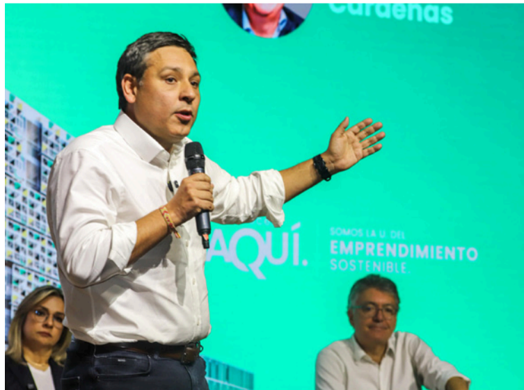
Lizcano advirtió que el país necesita un cambio inmediato en la forma de enfrentar la inseguridad.

Frente a este panorama, el precandidato presidencial Mauricio Lizcano advirtió que el país necesita un cambio inmediato en la forma de enfrentar la inseguridad. Su propuesta contempla tres grandes ejes: recuperación territorial con bloques de búsqueda e inteligencia mili-