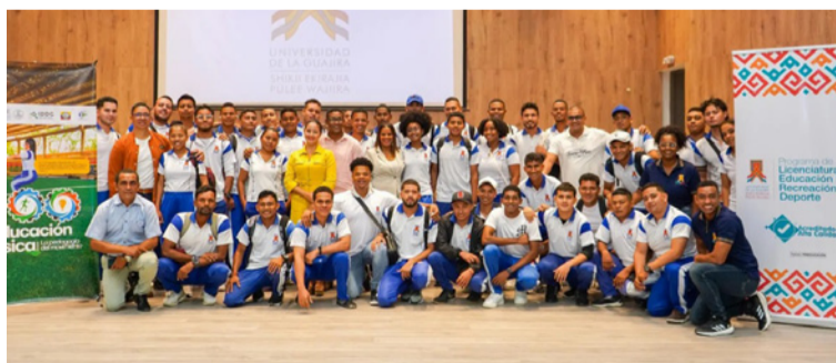
Se concluyó con la propuesta de fortalecer la planificación y la gobernanza del deporte.

La programación incluyó 22 exposiciones magistrales, 10 talleres, 2 conversatorios y la presentación del Museo de Educación Física.