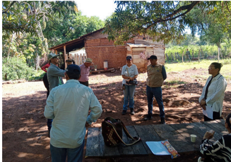
El desarraigo se impuso como única salida: dejaron atrás cultivos, animales y pertenencias.

Las noches se volvieron insoportables: en varias ocasiones la familia debía irse al monte para dormir entre el miedo y la zozobra. “Ellos iban de noche y nosotros salíamos corriendo a escondernos para que no nos mataran”, relató. El ultimátum fue