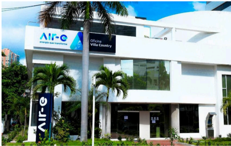
Después de tres años, no se ha podido solucionar el tema de la gran crisis que se está presentando en Air-e.

Agregó, que después de tres años la empresa Air-e Intervenida no ha podido