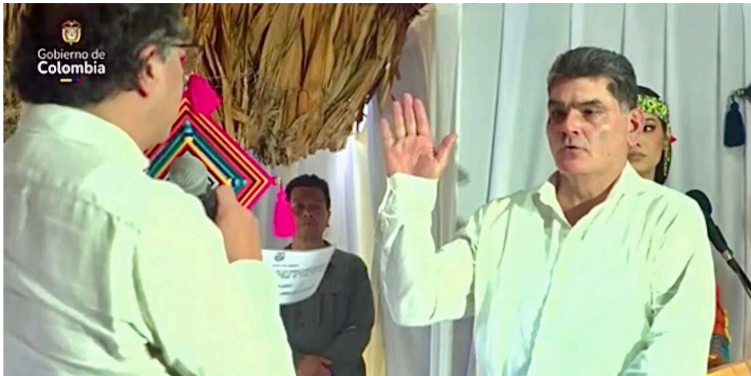
Un presidente que ejerza conforme a la normatividad legal no tiene necesidad de financiar compras de votos.

Se ha vuelto una costumbre en el Poder Ejecutivo absorber y meterse en el bolsillo, además del Poder Legislativo, el Poder Judicial, Fiscalía, Procuraduría, Contraloría, Defensoría del Pueblo, entre otras. La finalidad de abarcar todos los poderes, órganos disciplinarios, fiscales y penales, para hacer y deshacer sin intervención, controles, ni objeciones de ninguna autoridad competente que frene: abusos, arbitrariedades y corrupción del Poder Ejecutivo en los servicios públicos; quedando demostrada la falta de independencia por motivo de subordinación, amparo y protección en contradicción de funciones, atribuciones y facultades potestativas que omiten ejercerla o ignorarlo en procura de favorecimientos dudosos, quedando en el aire las garantías en la prestación del servicio por falta de confianza, parcialidad y estabilidad funcional.