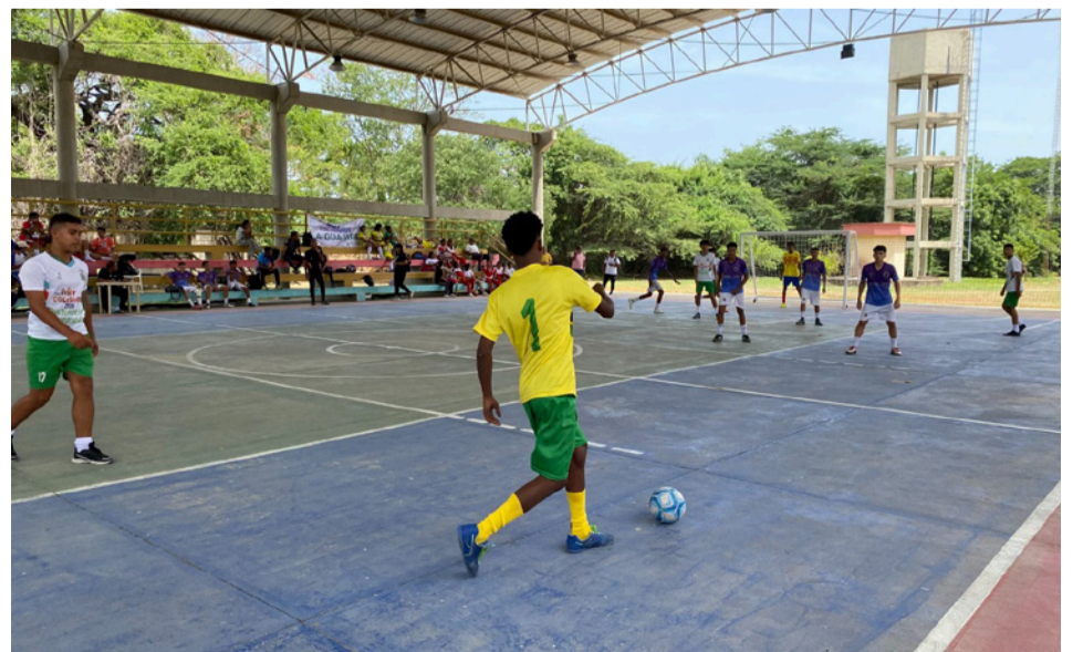
El Instituto Departamental de Deportes invita a toda la comunidad guajira a acompañar y apoyar este encuentro deportivo.