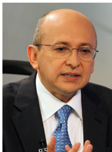
Eduardo Montealegre, ministro de Justicia.

El ministro de Justicia, Eduardo Montealegre, expresó una fuerte oposición a la decisión del gobierno de Estados Unidos de descertificar a Colombia en la lucha contra las drogas.