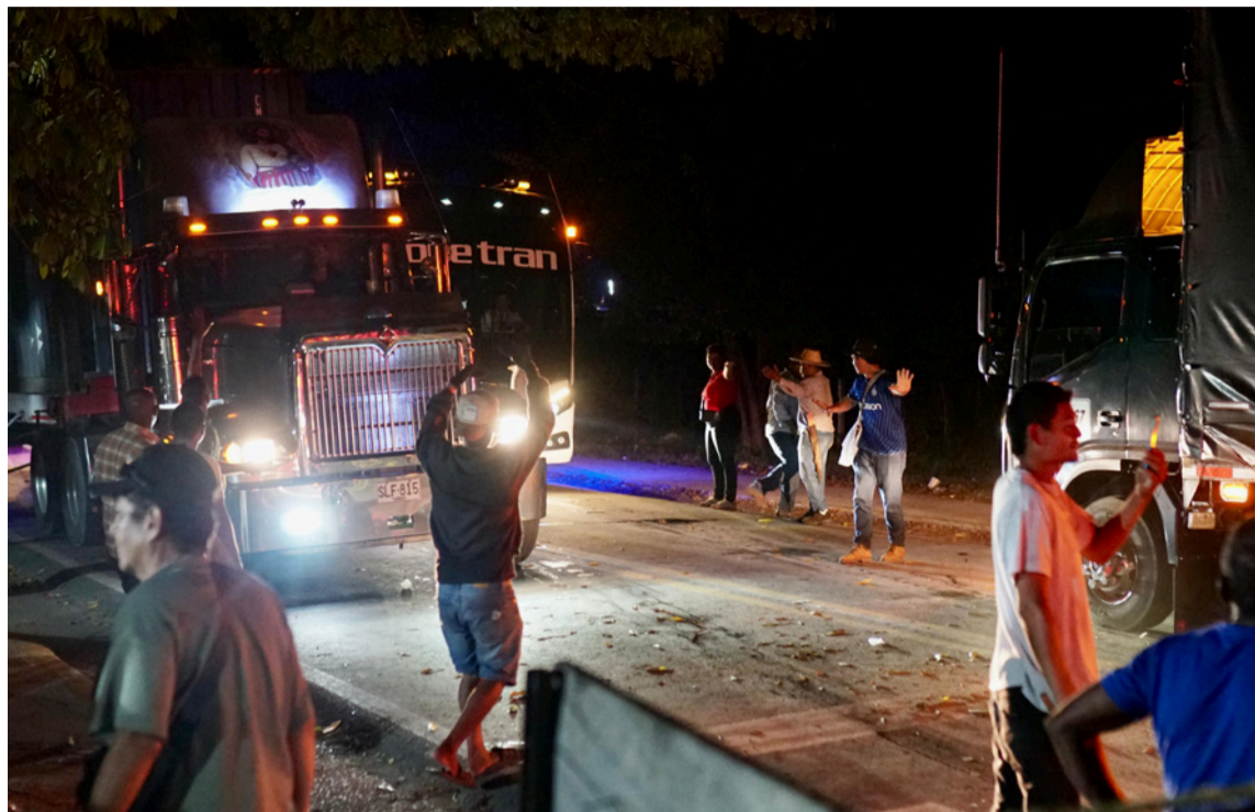
Tras el acuerdo, los representantes de las veredas decidieron suspender el bloqueo.

La Administración Municipal reiteró su compromiso de gestionar recursos adicionales ante el