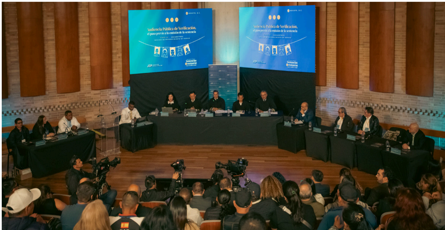
El Tribunal de Paz les impuso ocho años de sanción propia, que deberán cumplir a través de proyectos restaurativos.

E n cumplimiento del Acuerdo Final de Paz, la JEP emitió su primera sentencia restaurativa contra siete exintegrantes del último Secretariado de las extintas Farc-EP por la política de secuestros que extendieron por todo el país y que dejó al menos 21.396 hechos victimizantes.