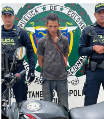
Esta persona fue dejada a disposición de la autoridad.