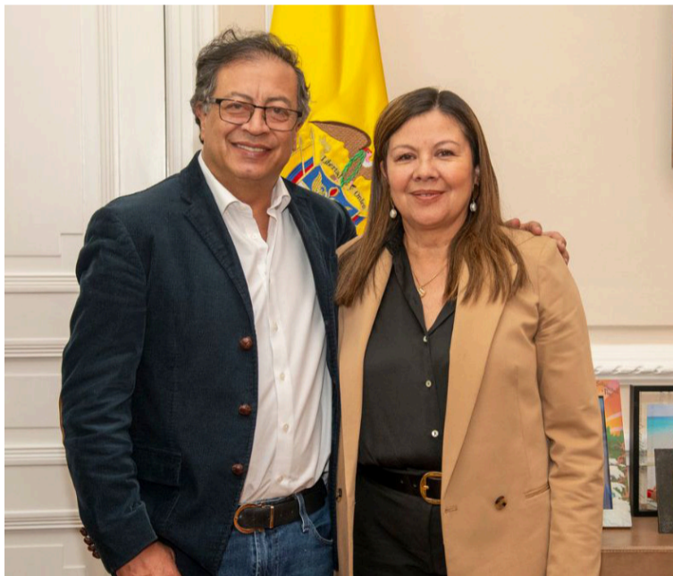
El presidente Gustavo Petro Urregio está incurriendo en lo mismo que antes en oposición cuestionaba.

Cuando compran la mayoría del Congreso aprueba a pupitrazo limpio los trámites negociados sin ni siquiera saber el contenido de lo que aprueban porque no se dan la tarea