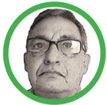
Por José Aragón Jiménez