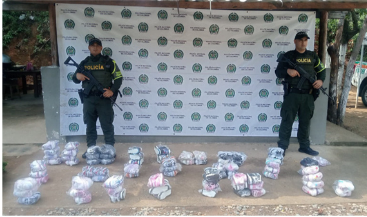
Se incautaron 140 pares de zapatos de diferentes marcas, avaluados en más de 120 millones de pesos.

En el kilómetro 36 de la vía Distracción-Cuestecita, jurisdicción del municipio de Hatonuevo, fue capturado Ricardo Manuel Márquez Urian, de 31 años, quien se movilizaba en una motocicleta Bajaj de placa DAW05F. El ciudadano portaba una licencia de tránsito falsa, motivo