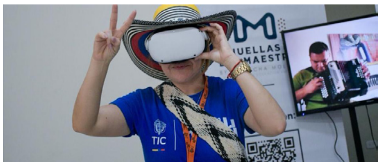
Los asistentes vivieron jornadas de aprendizaje, networking y conexión en la sede Sabana de la UPC.

Con títulos como Minecraft, Roblox y FC25, Némesis Expert demuestra que los videojuegos pueden enseñar de manera dinámica y didáctica, además de abrir la puerta al desarrollo de los esports en la región. Su participación en Colombia 4.0 visibilizó cómo en Valledupar también se gestan experiencias innovadoras que transforman la vida de los jóvenes.