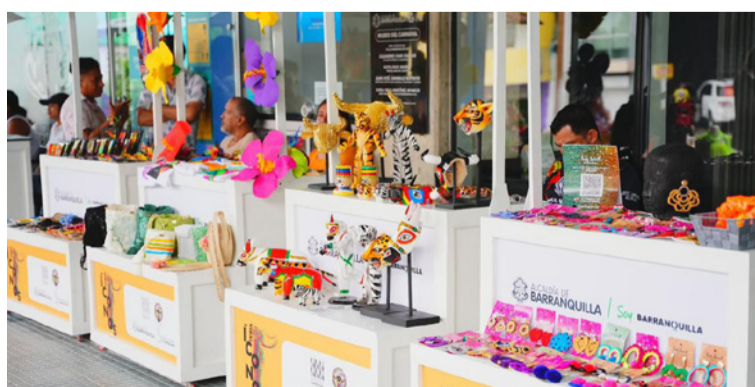
Con la Feria Carnaval Hecho a Mano, Edición Íconos, se continúa apostándole al talento local