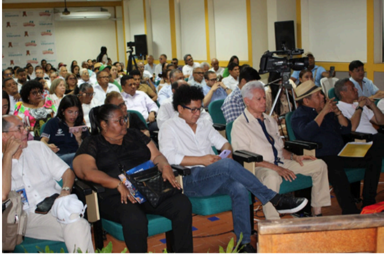
El foro dejó como conclusión la necesidad de seguir investigando y divulgando la vida y obra de Egidio Cuadrado.