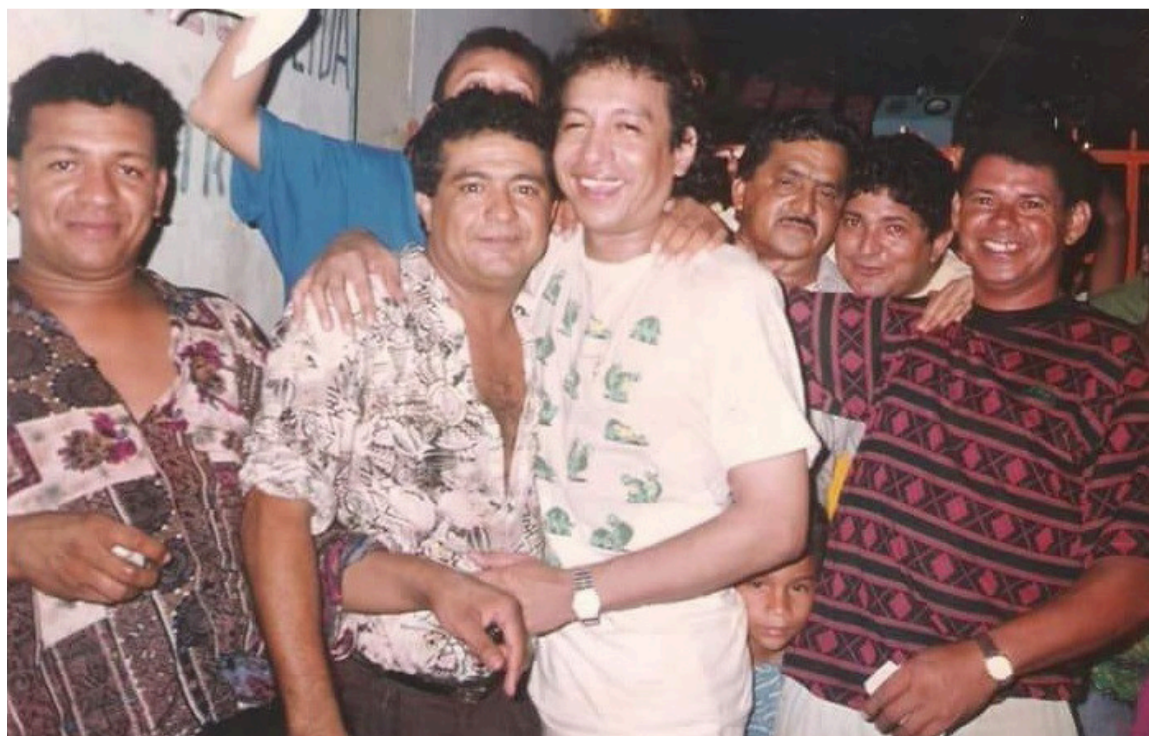
La Flotica Sanjuanera con Diomedes Díaz y Álvaro Álvarez.

de Diomedes Díaz al 'Triple A' en su obra musical en páginas exitosas dan cuenta de su gran amistad y consideración.