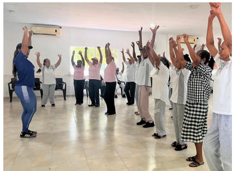
Las actividades estuvieron dirigidas a los pacientes del Hospital Nuestra Señora del Pilar.