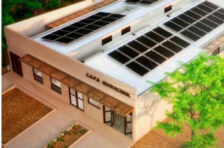
La propuesta les permite a miles de ciudadanos de La Guajira tener una salud predictiva, preventiva y resolutive.

Más de 394 mil personas en 10 municipios se beneficiarán de esta in-