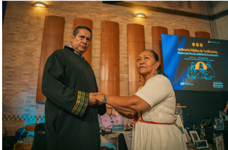
En ningún lugar del mundo los máximos responsables habían reconocido sus crímenes. Es un hito.