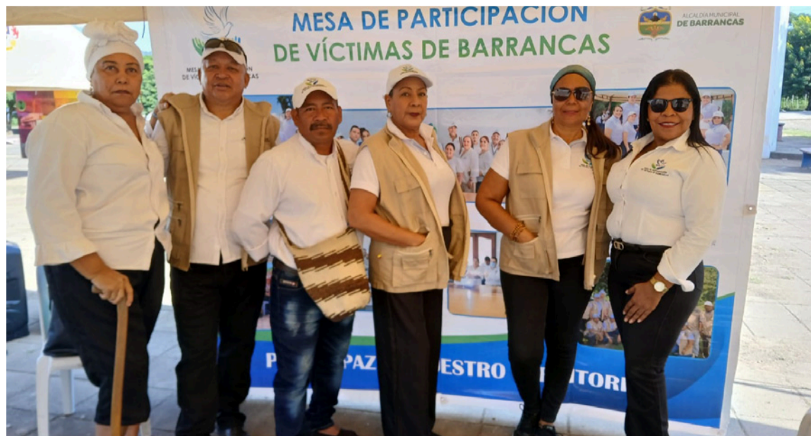
Se trató de una jornada para reflexionar sobre la importancia de la paz y la reconciliación.

Reitera la Mesa de Víctimas que “la conmemoración de la Semana de la Paz nos dio la oportunidad de reflexionar sobre la importancia de la paz y la reconciliación en nuestra comunidad. Fue un momento emotivo y significativo que nos recordó la importancia de trabajar juntos hacia un futuro más pacífico”.