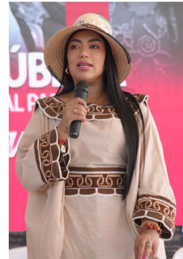
Martha Peralta, senadora del Pacto Histórico.

Con esta providencia, queda demostrado que las acusaciones que circularon en medios y redes sociales contra la senadora y otros integrantes del Pacto Histórico carecían de fundamento.