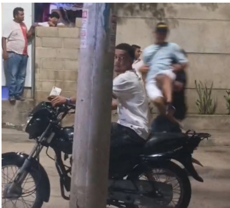
En video quedó registrado el momento en que la mujer saca de su bolso un puñal y ataca a su pareja.

El hecho ocurrió en la carrera 7 con calle 17 en el sector conocido como La Virgencita, donde funcio-