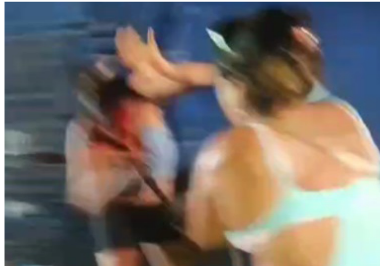
La pelea quedó registrada en cámara de celular que captó el momento de pánico que se vivió en ese sector.

Las autoridades ante estos hechos repetitivos que se presentan en el mercado nuevo de Riohacha no han hecho un pronunciamiento oficial, la violencia y otros delitos hacen parte de la cotidianidad de este sector que se ve afectado por la inseguridad.