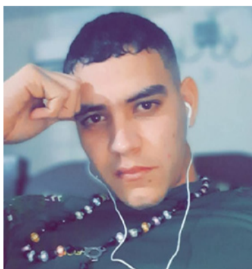
El joven se encuentra en estado crítico de salud.

Algunas personas que se encontraban en la zona lo auxiliaron y lo trasladaron hasta un centro clínico en la capital de La Guajira, donde lograron estabilizarlo, pero se encuentra