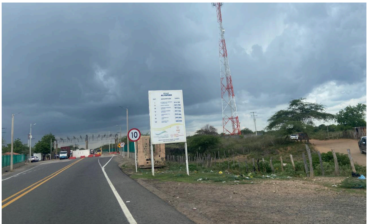
Lo más irónico es que este 'peaje paralelo' no busca reemplazar al Estado. Lo suple. Con elegancia. Con pragmatismo.