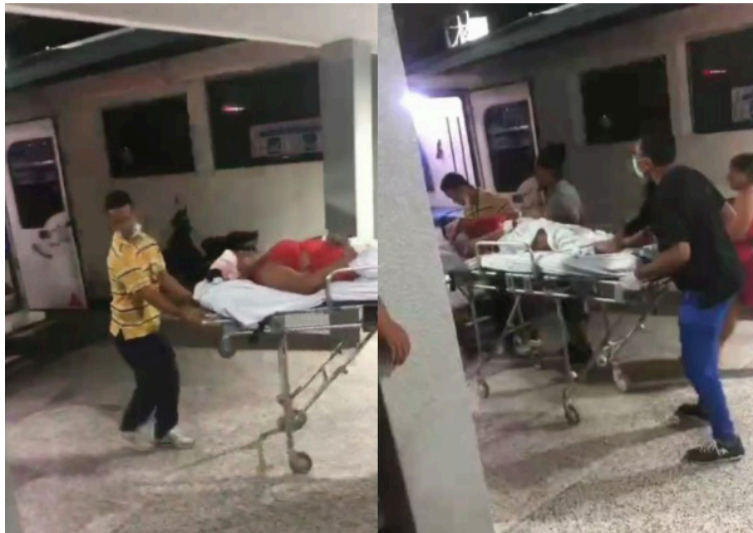
La víctima presenta una herida abierta en la cabeza, presuntamente ocasionada con un machete.