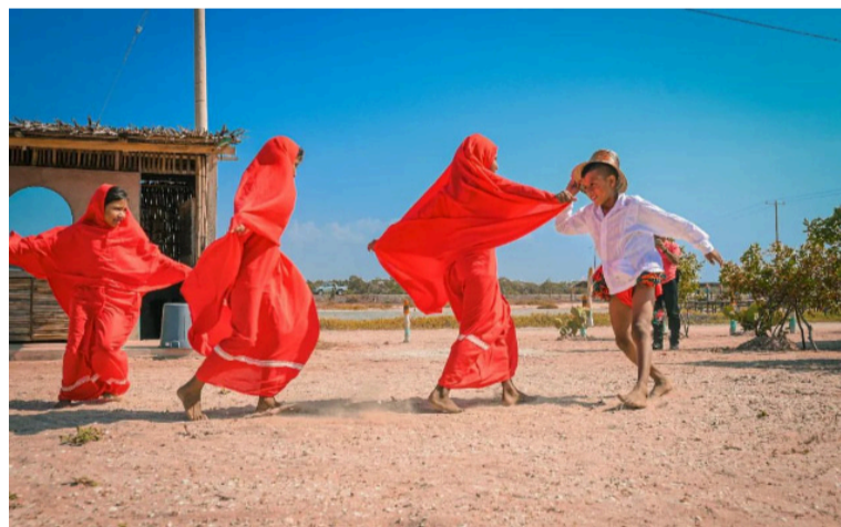
Los gestores culturales esperan un aumento importante de recursos para el presupuesto de la vigencia 2026.

A pesar de que el sector de la Cultura en el Distrito de Riohacha, para la vigencia de 2025 cuenta en el presupuesto con un total de $ 4.494.542.106, resultan insuficientes para apalancar el trabajo que realizan las diferentes organizaciones y gestores culturales.