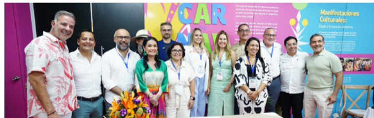
Este manifiesto se convierte en una hoja de ruta colectiva para proteger la diversidad cultural.

El manifiesto contiene cuatro compromisos principales para el fortalecimiento de los carnavales como motores de desarrollo y sostenibilidad.