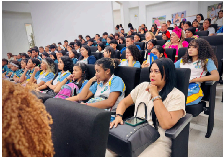
Las panelistas reflexionaron sobre los factores de riesgo que propician la explotación sexual comercial.

El foro fue posible gracias a la articulación del Sistema Nacional de Bienestar Familiar con entidades aliadas como las secretarías de Salud departamental y distrital, la Fundación Renacer y Save the Children, que aportaron al desarrollo de espacios