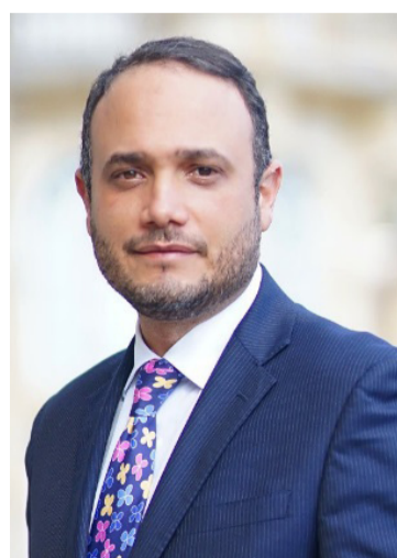
Alfredo Deluque, senador de la República.

Conocido como el "senador de las TIC", Alfredo Deluque ha promovido y apoyado leyes fundamentales para impulsar el uso de la tecnología como herramienta para cerrar