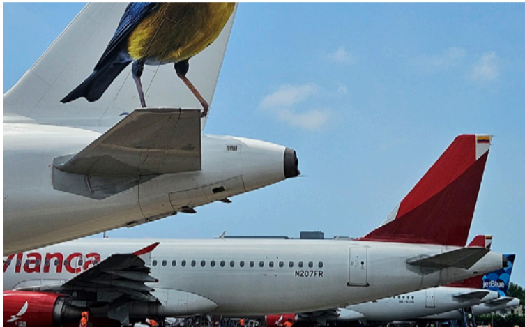
Esto reafirma que Colombia está comprometida con una aviación incluyente, sostenible y segura.

Este logro posiciona a Colombia como eje estratégico en las Américas, con voz y voto para