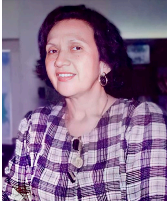
Consuelo Araujonoguera, amor y dedicación al folclor vallenato.

Sus palabras siguen sonando y se valora todo su aporte: "Aquí creamos y pusimos en marcha la defensa musical de nuestros propios valores y el sólo hecho de que después de 1968, cuando se llevó a cabo el Primer Festival de la Leyenda Vallenata, hayan surgido en toda Colombia muchos más; similares, parecidos, semejantes y en la mayoría de los casos exactamente iguales en contenido y mensaje, es la refrendación inequívoca de que lo que hicimos fue un acierto y lo sigue siendo como factor de unidad étnica y de aglutinamiento espiritual. Y esta, mejor que cualquiera es otra de las muchas conquistas que ha logrado el Festival de la Leyenda Vallenata".