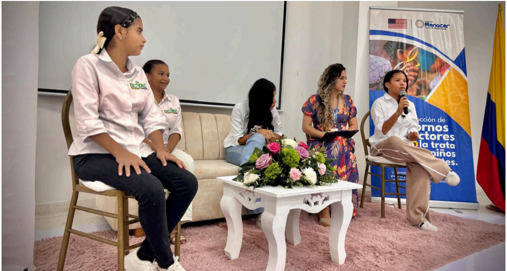
Las adolescentes abordaron temas críticos como la falta de orientación sexual, el impacto del abuso y la violencia sexual.