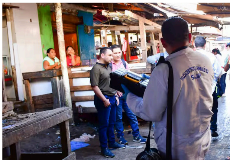
Las entidades destinatarias de la comunicación deben entregar informes sobre las medidas adoptadas.

La Procuraduría General de la Nación solicitó acciones urgentes a las secretarías de Gobierno y Salud por las recientes intoxicaciones ocurridas en Barranquilla, tras el consumo de un aparente licor adulterado distribuido en botellas de agua, que hasta el momento ha dejado 11 muertos y tres personas más hospitalizadas.