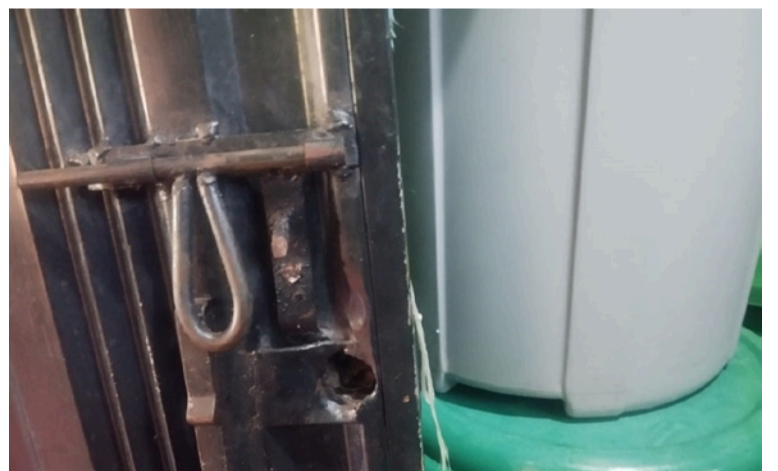
Se informó que los mismos padres de familia fueron los que se dieron cuenta del hurto.