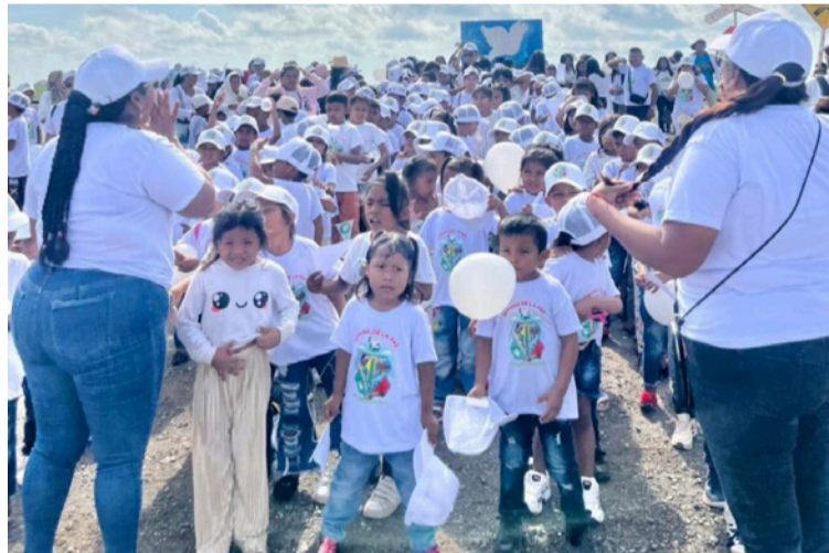
La caminata que partió de la sede educativa Youlepu hasta 4 Vías, tuvo participación de estudiantes y docentes.

La caminata que partió de la sede educativa Youlepu hasta Cuatro Vías, tuvo participación de estudiantes y docentes de sedes cercanas como Warawarao, Santa Ana, Olonokiou, Youlepu, Kululumana, Mouwasira, Pa-