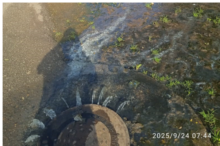
La Empresa de Servicios Públicos de Albania asegura que ya fue notificada de la situación.

La Empresa de Servicios Públicos de Albania asegura que ya fue notificada de la situación, sin embargo, no ha podido afrontar el rebosamiento de los manjoles.