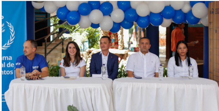
La donación incluye más de 14 mil elementos entre ollas, estufas, hornos, neveras y utensilios de cocina.