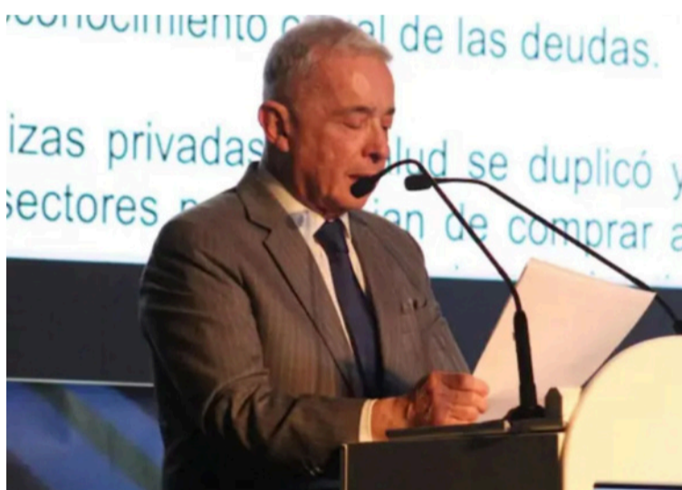
Uribe señaló que el incremento del gasto público ha generado un desequilibrio en las finanzas nacionales.

Durante su intervención, calificó el impuesto al patrimonio como una forma de "expropiación gradual", al argumentar