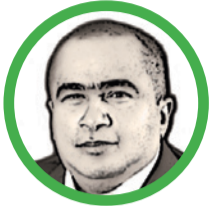
Por Arcesio Romero Pérez