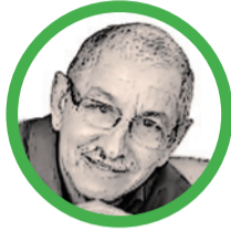
Por Juan Rincón Vanegas