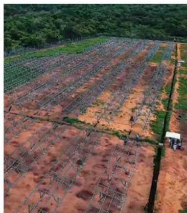
Se busca la descarbonización de la economía.

Con el objetivo de dar a conocer la apuesta del gobierno en cuanto a la acción climática y descarbonización de la economía acorde a los acuerdos climáticos internacionales, la Upme desarrollará hoy lunes 29 de septiembre en el municipio de Albania el foro ‘Transición Energética Justa (TEJ) en La Guajira: De la minería a la reconversión del territorio con visión social y ambiental’.