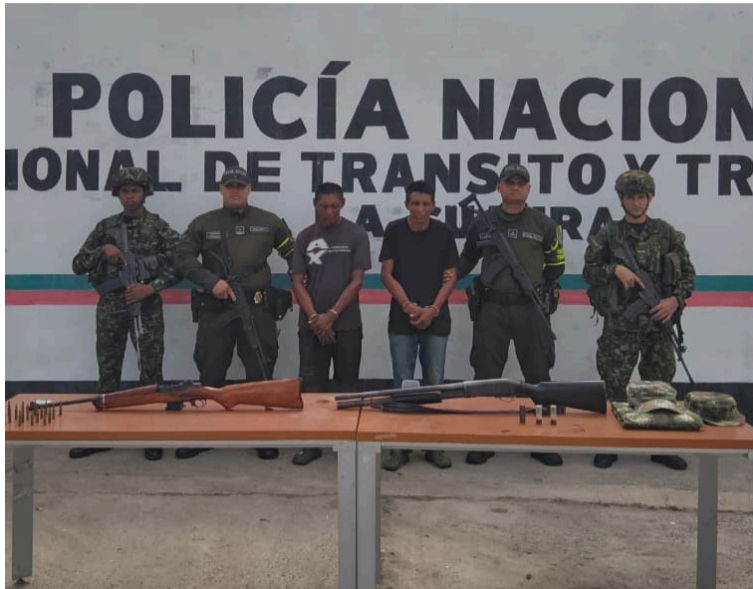
A estas personas se les vincula a hurtos cometidos a vehículos y personas en el corredor Riohacha-Manaure.

En el lugar fueron capturados los alias de 'Kalisep' y 'Víctor', a quienes se les incautó un fusil