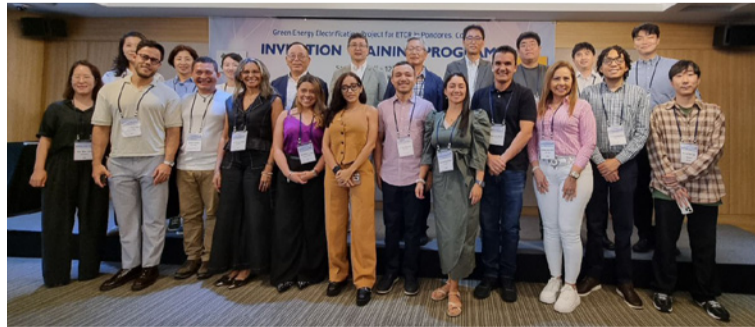
La capacitación está enfocada en el proyecto, que contempla la construcción de una planta solar fotovoltaica.

La visita se realizó en el marco del proyecto 'Electrificación de Energía Verde para el Etrc Ponedores', financiado por el Instituto para el Avance de la Tecnología (Kiat) del Ministerio de Comercio, Industria y Energía de la República de