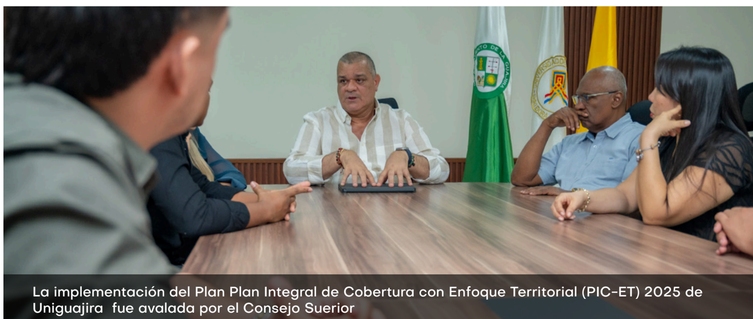
La implementación del Plan Plan Integral de Cobertura con Enfoque Territorial (PIC-ET) 2025 de Uniguajira fue avalada por el Consejo Superior