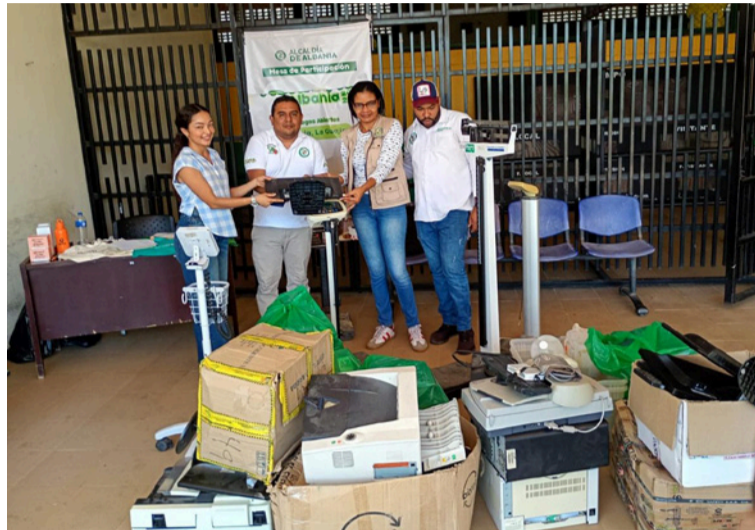
Corpoguajira reitera que es vital prevenir la contaminación del suelo, el agua y los ecosistemas.

“Agradezco especialmente a las instituciones educativas, muchas de las cuales dispusieron espacios para la recolección de los residuos, a cada una de las administraciones municipales, a los gestores, las empresas aliadas