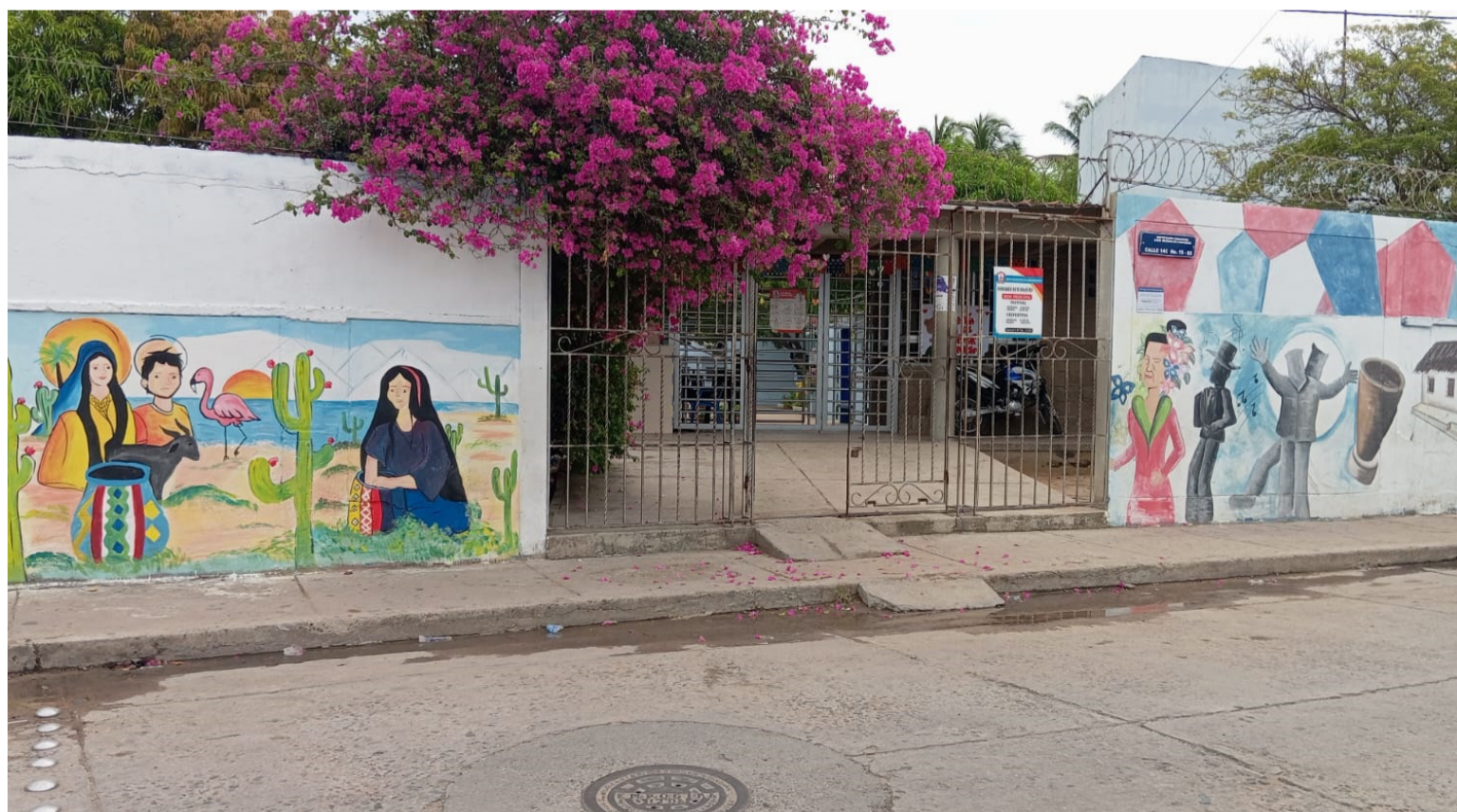
Según un comunicado de la rectoría de la IE, alrededor de 15 estudiantes presentaron ardor e irritación en la piel.

Por último, la institución señaló que el principal interés y razón de ser son sus estudiantes, su seguridad, su desarrollo pleno e integral. “Ofrecemos sinceras disculpas a estudiantes, padres de familia y comunidad en general por la situación presentada. Y garantizamos la toma de medidas necesarias para evitar este tipo de sucesos en adelante”, concluyó.