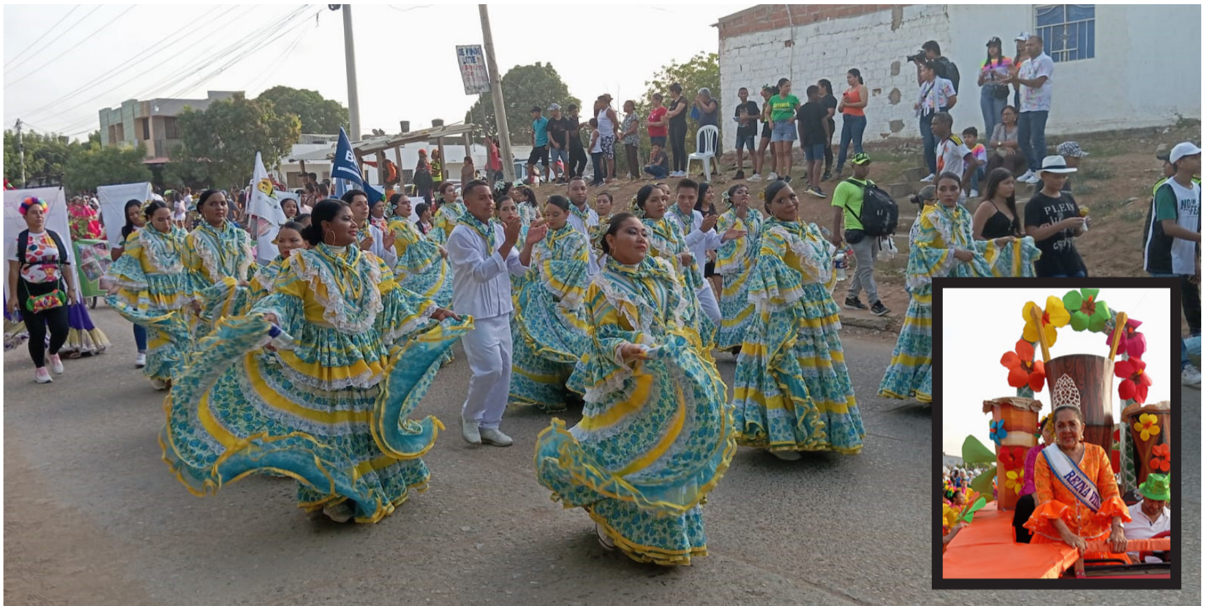
El Carnaval del Distrito de Riohacha es hoy la expresión más visible y, al mismo tiempo, la más vulnerable.