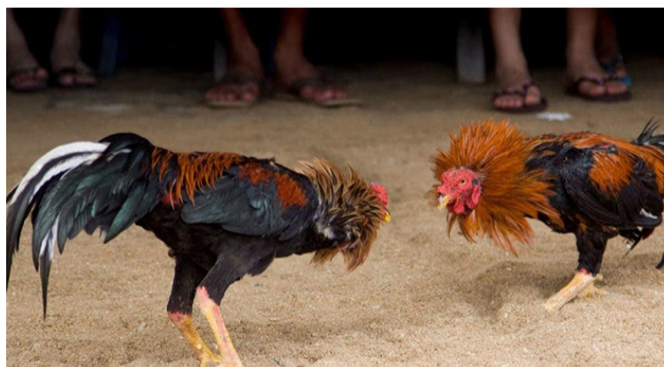
La Corte en fallo unánime declaró exequible la ley que deberá entrar en vigencia a partir del año 2027.

gallos y toros. Las corridas de toros son diferentes a las corralejas y coleos. Se han detectado torturas a los toros desde antes de enfrentar la cuadrillas de toreros, para estresarlos con encierros, ruidos y untada de aceite por los ojos antes salir al ruedo para el mancebo, comenzando por clavarle banderillas, los pican con arpones, ejecutado por jinetes montados a caballo y terminan sacrificándolo con una estocada, que no es otra que una espada de ace-