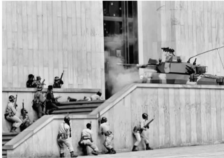
Hoy se realizarán actos de memoria y homenaje a las víctimas del holocausto del Palacio de Justicia.

Posteriormente, en horas de la tarde, se cumplirá el Acto Protocolario Memoria y Dignidad La Justicia Pervive en el que se hará una ofrenda floral a