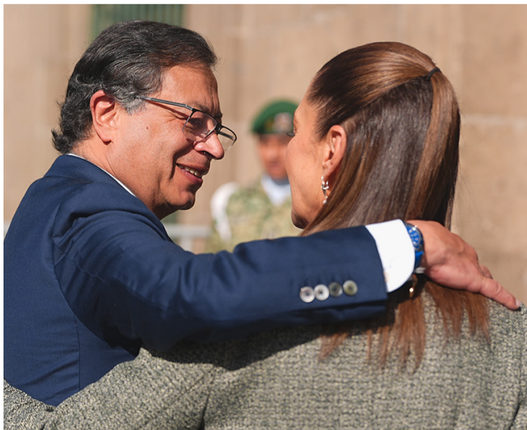
El mandatario colombiano confió en la ayuda de México “para encontrar con vida a estos jóvenes”.