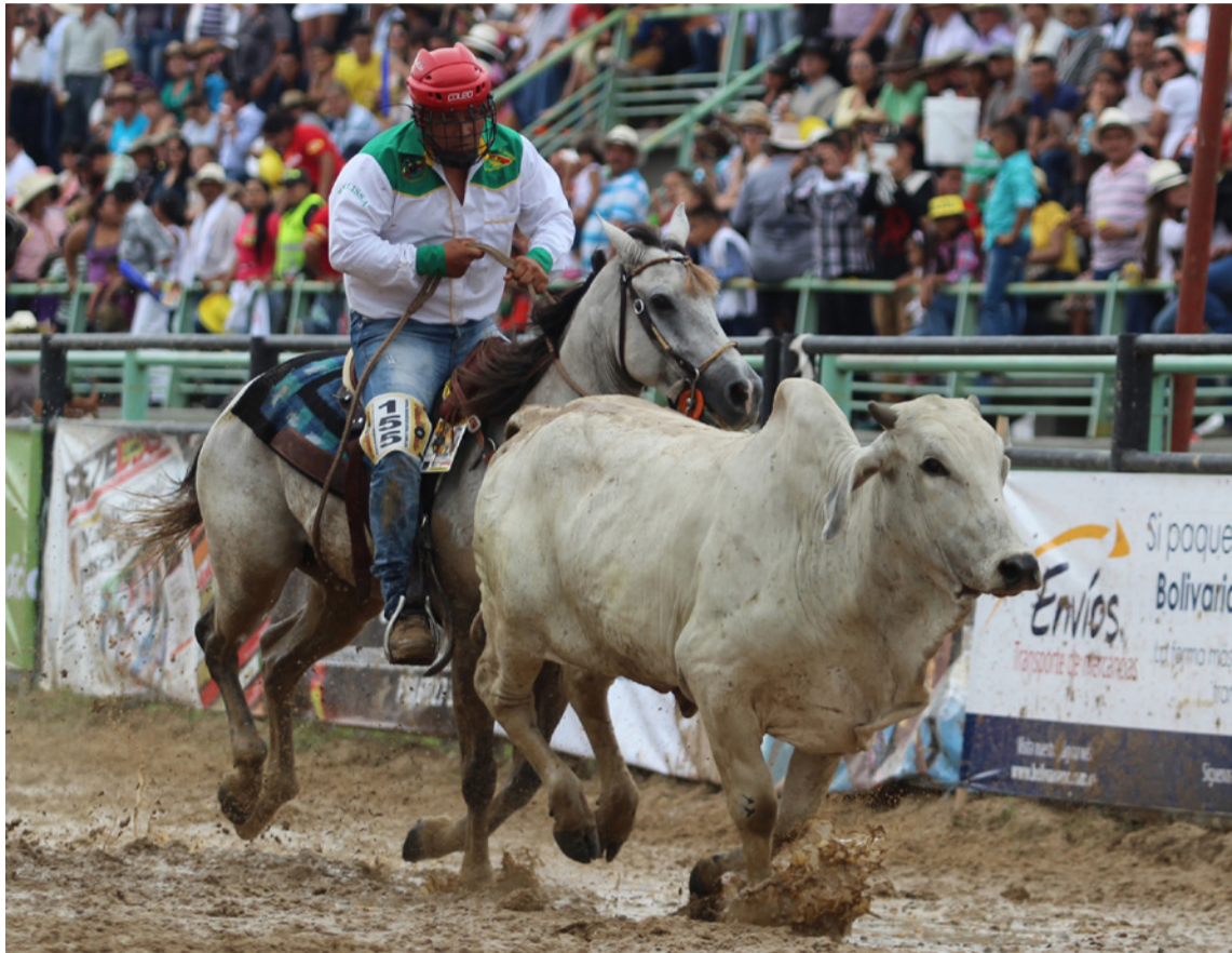
Los alcaldes están obligados a controlar las prohibiciones y denunciar los maltratos.

El objeto de la ley es la de reconocer respeto por la vida animal, sacrificada en galleras, corridas y corralejas de toros, becerradas y coleos; entre otros, utilizadas en espectáculos públicos socavando la integridad de un ser vivien-