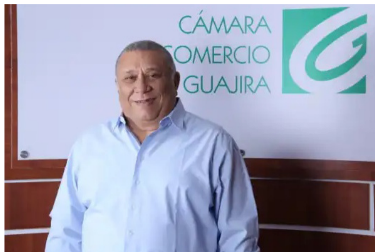
Romero recordó que con Fedecámaras se está atendiendo el tema y se cuenta con un protocolo de seguimiento.

En ese mismo sentido, el presidente de la