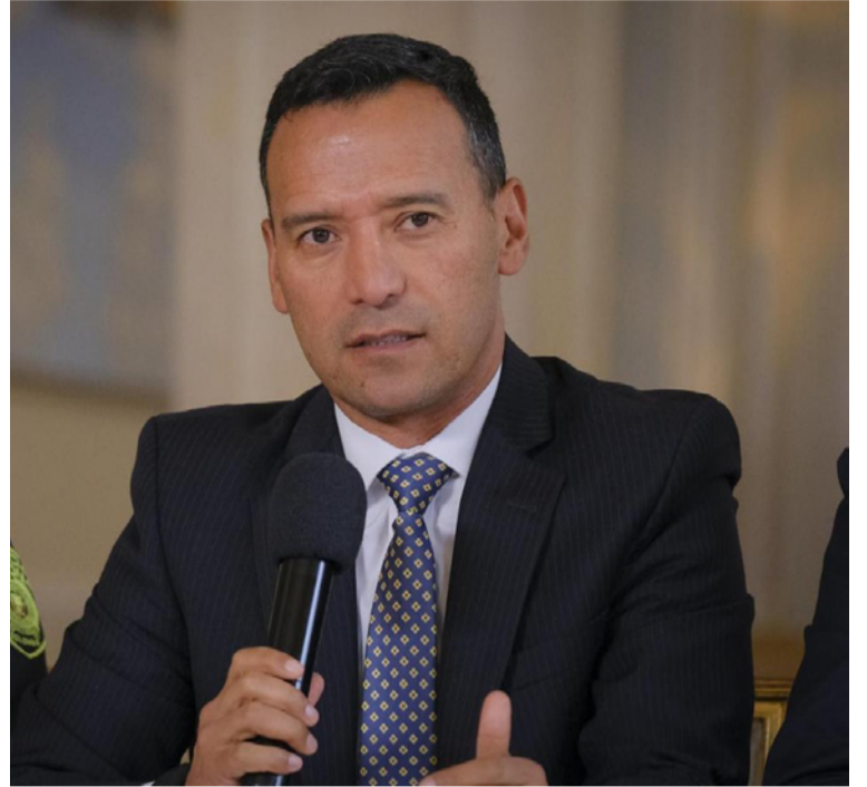
El ministro hizo un llamado a la comunidad nacional e internacional a rechazar y a denunciar los ataques.

Finalmente, hizo un llamado a la comunidad nacional e internacional a rechazar estos ataques y a denunciar a los responsables, asegurando que la Fuerza Pública continuará avanzando con toda la capacidad del Estado colombiano para proteger a las comunidades.