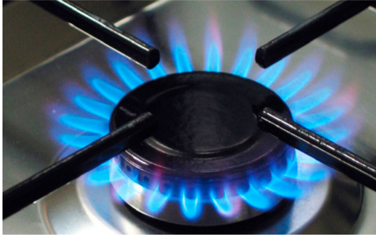
El jefe de Estado recordó que la importación de gas natural ha existido hace años y desde anteriores gobiernos.

El jefe de Estado recordó que la “importación