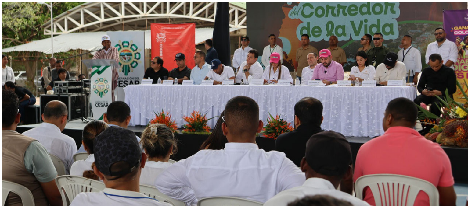
El Distrito Minero 'Corredor de Vida' comprende Codazzi, Becerril, Chiriguana, El Paso y La Jagua de Ibirico.

Los documentos Conpes garantizan recursos, lineamientos y seguimiento interinstitucional para proyectos de alto impacto, en este caso el 'Corredor de Vida' del Cesar.