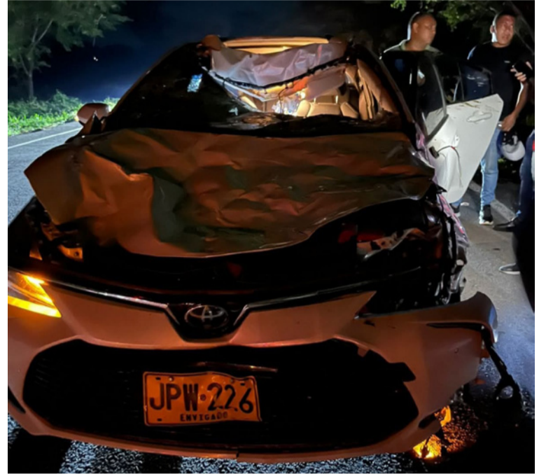
El auto Toyota Corolla colisionó contra una vaca que se encontraba atravesada en plena carretera.

Este siniestro vuelve a poner en evidencia la problemática de los animales sueltos en las vías del sur de La Guajira, una