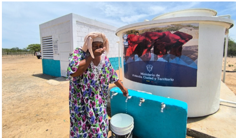
La inversión está orientada al ordenamiento territorial alrededor del agua y a cerrar brechas en acceso a agua.

En lo que respecta al componente de acceso a agua y saneamiento básico, se han gestionado inversiones por valor total de $445.864 millones, donde el aporte del Ministerio para este componente asciende a $433.785 millones, incluye $12.673 millo-