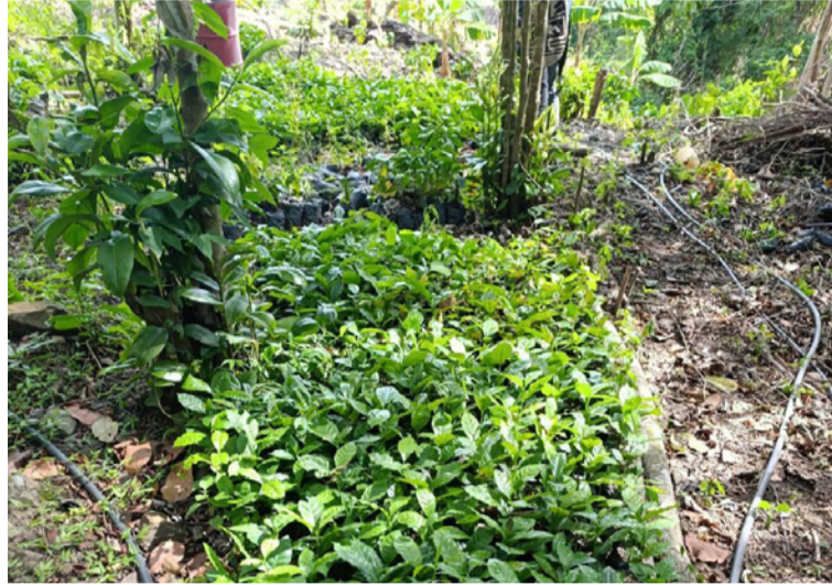
Los trabajos beneficiarán a 100 familias en los municipios de Fonseca, Barrancas, El Molino, Villanueva y Urumita.

Corpogujaira implementa acciones de conservación en la Serranía del Perijá que contemplan la restauración de 150 hectáreas de ecosistemas estratégicos, la siembra de sistemas agroforestales con café y árboles nativos, la instalación de biodigestores y estufas eficientes, además de la construcción de tres viveros para producir especies como roble, caracolí, guayacán y cedro.