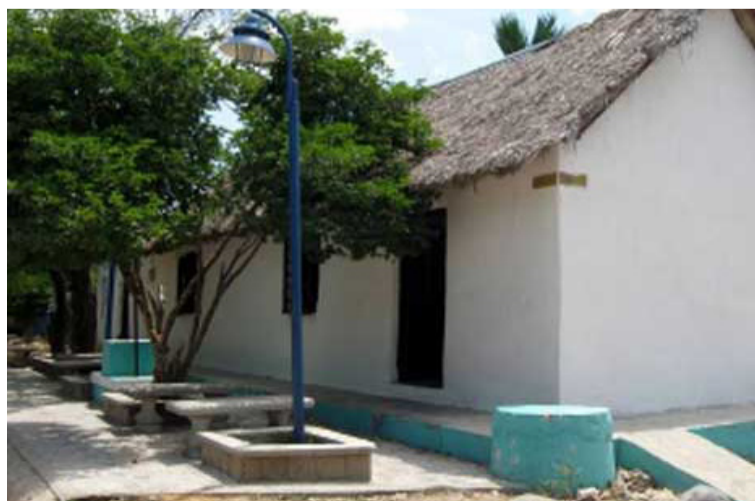
Casa Robles en el corregimiento de Camarones. Proteger la riqueza cultural es mandato constitucional.