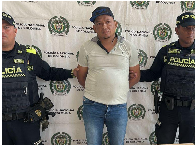
Uniformados capturaron a este sujeto señalado de agresión física contra su pareja sentimental.

Gracias a la intervención inmediata de los policías se evitó que continuaran las agresiones y se garan-