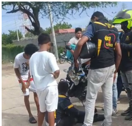
En ambos casos dos personas resultaron heridas y trasladadas a centros médicos.

El pasado sábado 20 de septiembre en el día del amor y amistad, se registraron dos accidentes de tránsito, en la que dos personas resultaron heridas y trasladadas a centros médicos.