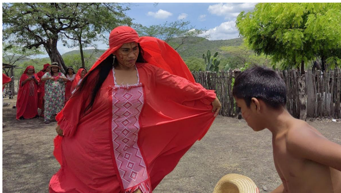
Se abre una ruta de confianza y cooperación que permitirá avanzar en soluciones reales.

Con estos espacios de diálogo se abre una ruta de confianza y cooperación que permitirá avanzar en soluciones reales para el bienestar de las comunidades wayuú, con el liderazgo compartido entre el Gobierno nacional y las administraciones locales.