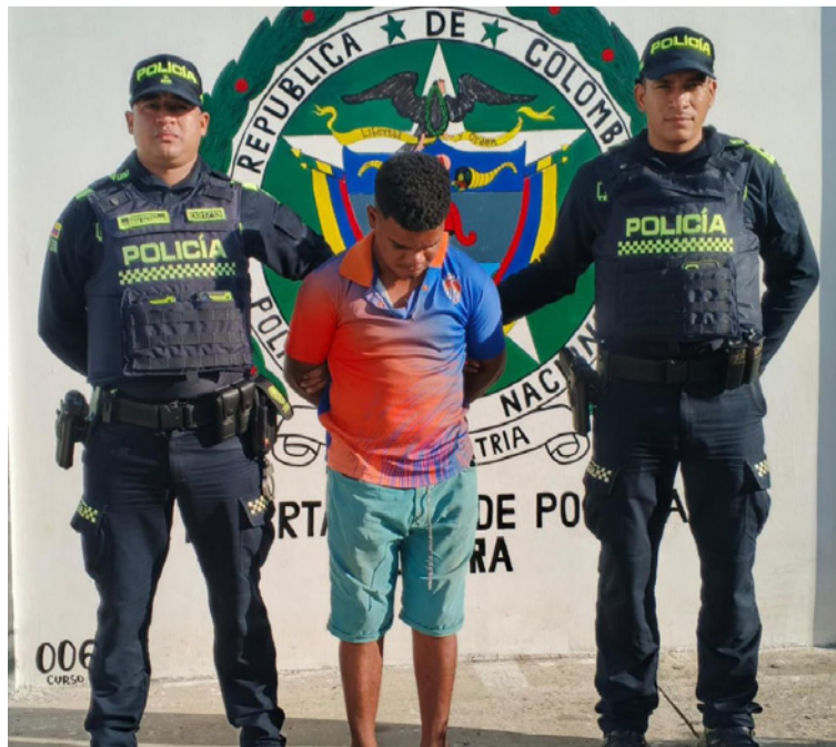
Esta persona fue capturada en flagrancia, señalada como presunta responsable de hechos de violencia.

El menor fue trasladado al Hospital San Rafael de Albania, donde recibió atención médica y acom-