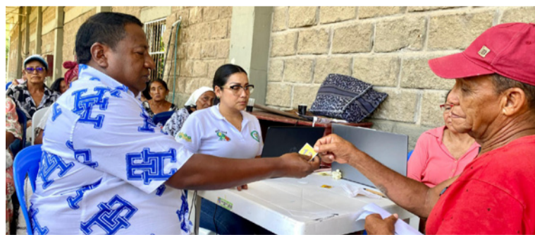
El programa Colombia Mayor está en transformación para responder a los marcos del Pilar Solidario.

La Secretaría de Desarrollo Económico de Albania, a través de Prosperidad Social, avanza en la búsqueda e inscripción de mujeres mayores de