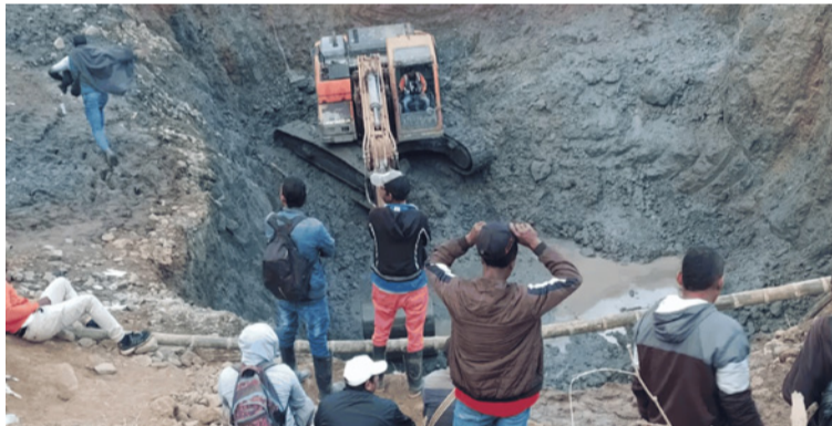
El alcalde de Santander de Quilichao, lamentó la tragedia y expresó su solidaridad con las familias de las víctimas.

Los trabajadores fueron localizados a unos 30 metros de profundidad, todos en el mismo punto, sin signos vitales. De acuerdo con las autoridades, la causa de muerte habría sido asfixia por fal-