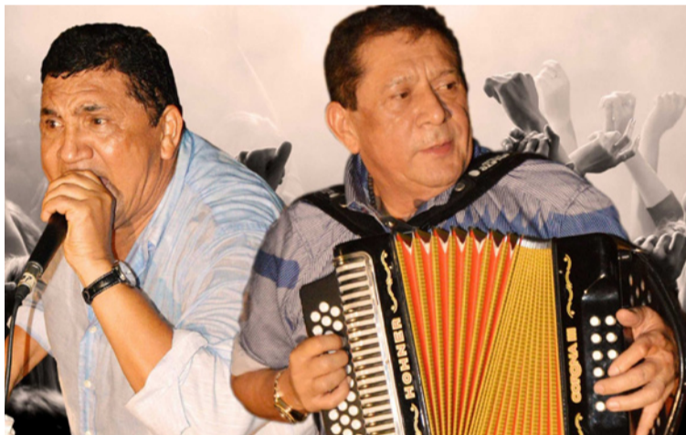
Poncho y Emiliano Zuleta, dos grandes de la música vallenata.