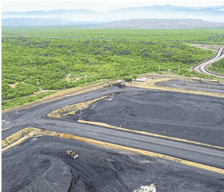
El congreso es una invitación a quienes buscan transformar la minería en una actividad más eficiente.

presentarán ponencias con el objetivo de impulsar mejoras en la gestión ambiental e industrial de la minería, tanto a nivel local como nacional e internacional.