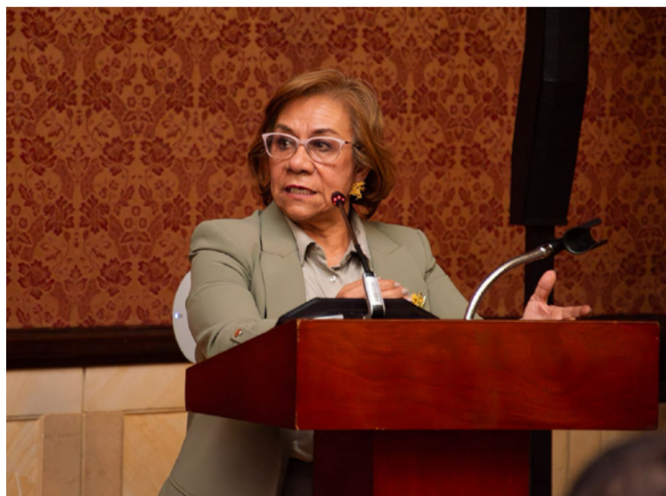
La canciller, Rosa Yolanda Villavicencio, encabezó el mensaje del Estado colombiano.

La canciller recalcó que reparar las deudas históricas con las comunidades afrodescendientes constituye una prioridad para el país. "Colombia hace un llamado a los estados para que aborden de manera directa las repercusiones del colonialismo y la esclavitud, cuyas secuelas aún se manifiestan en desigualdades socioeconómicas, exclusión, marginación y violencia. Reparar la deuda con los pueblos afrodescendientes víctimas de la trata de esclavos, la esclavización y el racismo estructural es una prioridad para el Gobierno