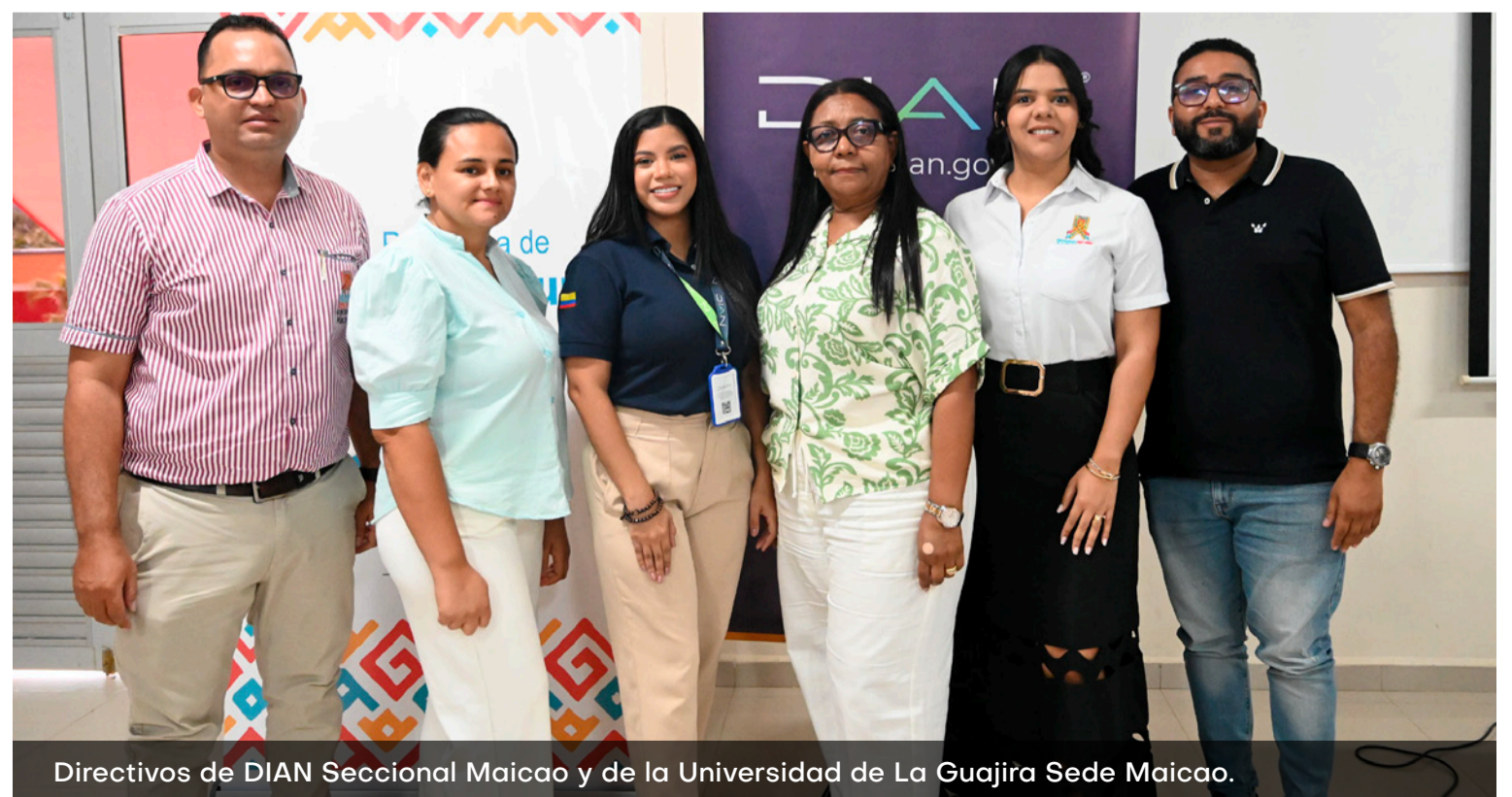
Directivos de DIAN Seccional Maicao y de la Universidad de La Guajira Sede Maicao.

Con esta alianza, la institución de educación superior y la Dirección de Impuestos y Aduanas Nacionales refuerzan su cooperación institucional, lo que aporta al bienestar ciudadano, la educación práctica de los futuros contadores públicos y al desarrollo económico del departamento y la nación.