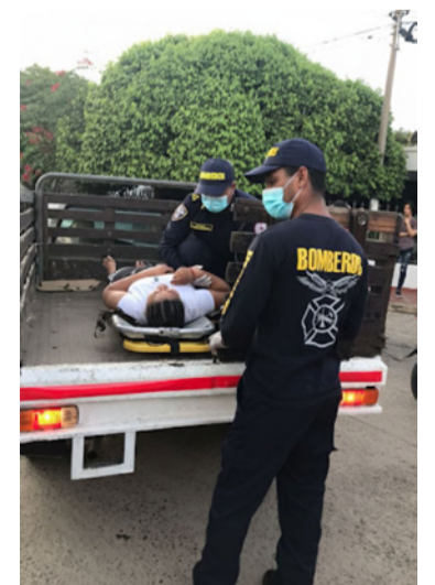
La mujer registraba dolor en el miembro superior derecho a la altura de la muñeca.