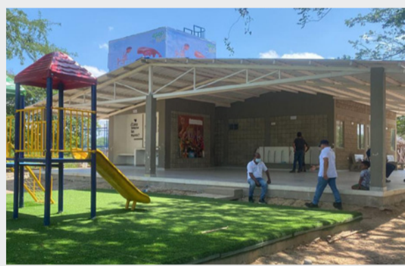
Centro de Producción que beneficia con acceso al agua potable a un total de 1.355 personas en la comunidad de Lejano Oriente, en Riohacha.