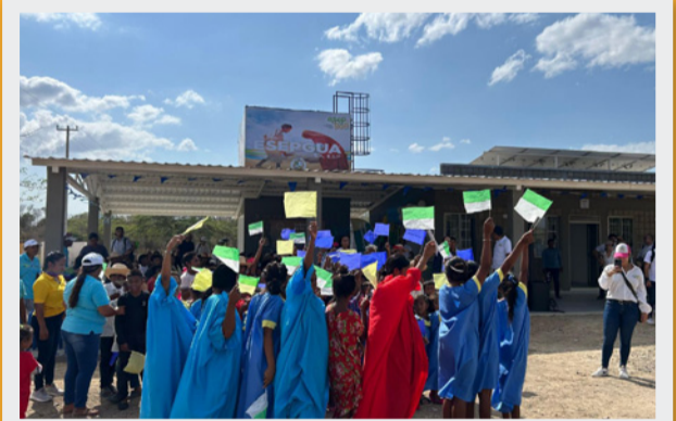
Centro de Producción que beneficia con acceso al agua potable a un total de 1.438 personas en la comunidad de Marañoncito, zona rura de Riohacha.