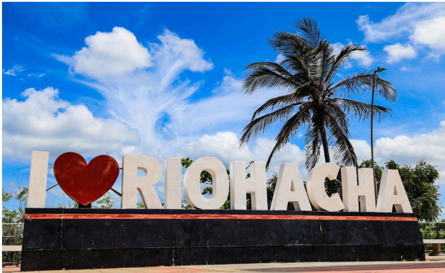
Riohacha es una capital de mar, tertulias, Carnaval, gastronomía y desafíos.

Riohacha 480 años de historias culturales, turísticas, familiares que se tejen desde la esencia macondiana del Caribe inmenso que encabeza La Guajira.