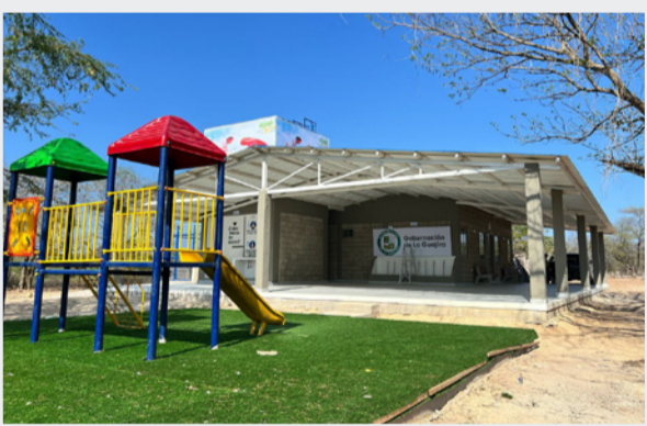
Centro de Producción que beneficia con acceso al agua potable a un total de 1.257 personas en la comunidad de Sinamaica, zona rura de Riohacha.

las familias, salud para los niños y alivio para las mujeres que por generaciones han cargado con esta necesidad. Nuestro compromiso es claro: cumplir con la palabra y seguir llevando agua, vida y futuro a cada rincón de Riohacha.