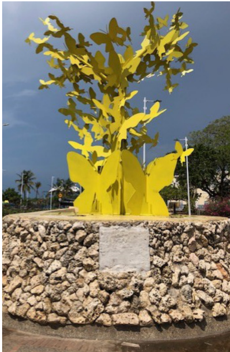
El gobernador dice que a Riohacha hay que presentarla al mundo, hay que abrirle canales y puntos para que respire.

Además se tiene proyectada la construcción de la