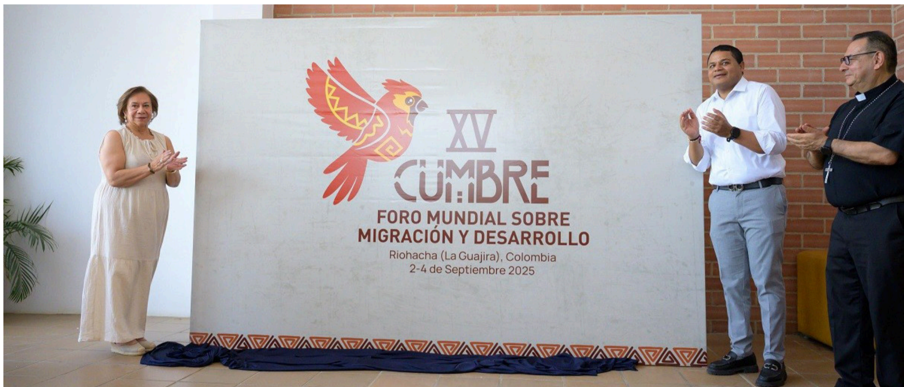
Riohacha fue sede de la XV Cumbre del Foro Mundial de Migración y Desarrollo.

La capital tiene un encanto distinto, más íntimo y real