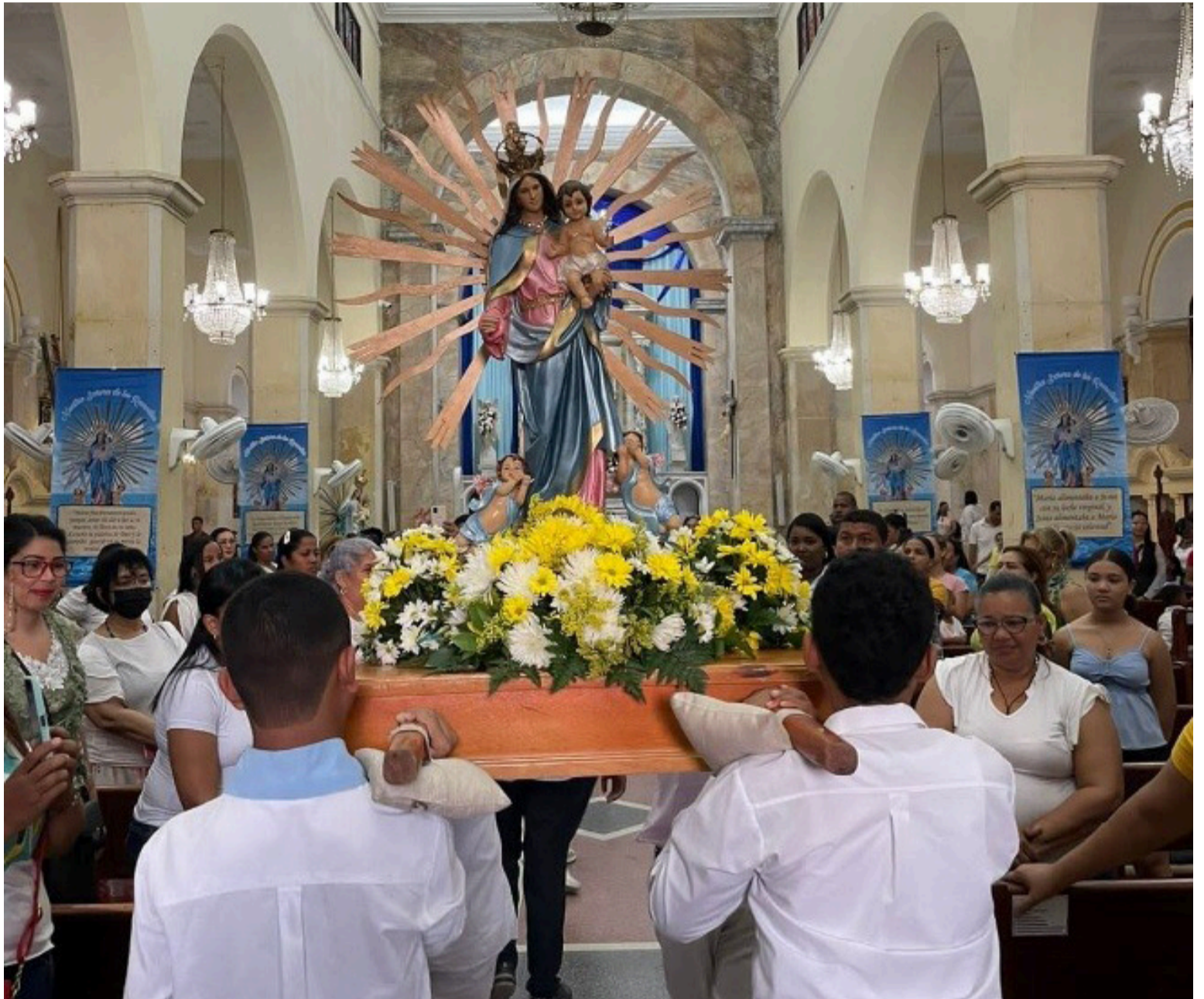
Riohacha se llamó Nuestra Señora de los Remedios del Río de la Hacha, en honor a la Virgen de los Remedios.