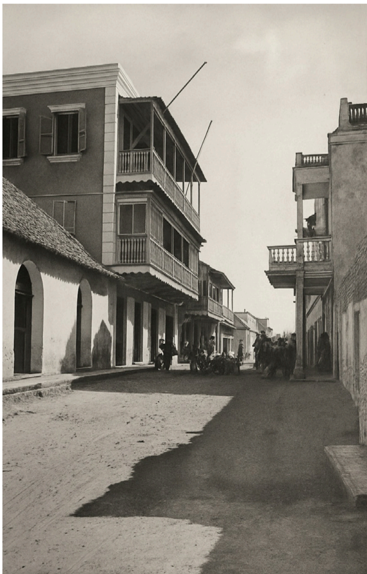
Si en algo coincidían sus habitantes era en la conveniencia.

Esta situación de constante peligro los llevó a mudar la ciudad a un lugar más resguardado.