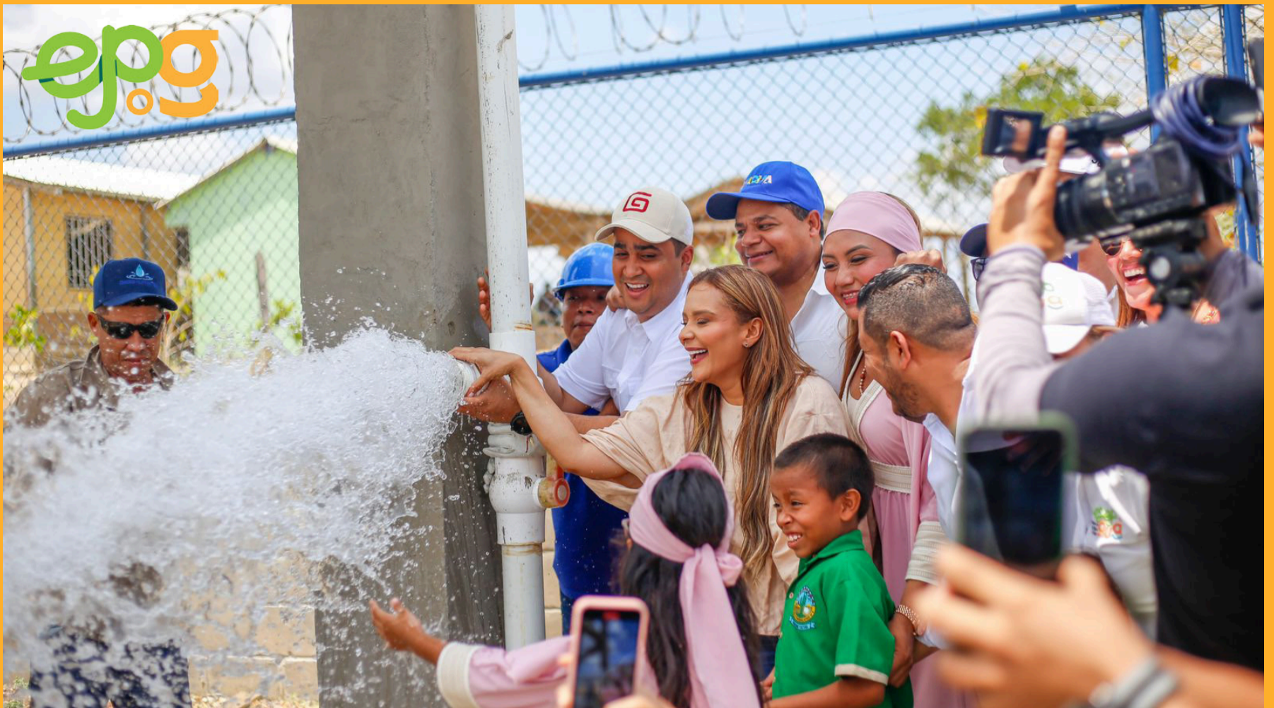
Centro de Producción que beneficia con acceso al agua potable a un total de 1.347 personas en la comunidad de Paraver, zona rura de Riohacha.