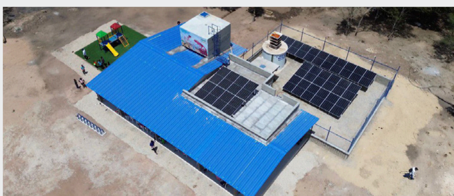
Centro de Producción que beneficia con acceso al agua potable a un total de 1.331 personas en la comunidad de Kanewakat, zona rural de Riohacha.