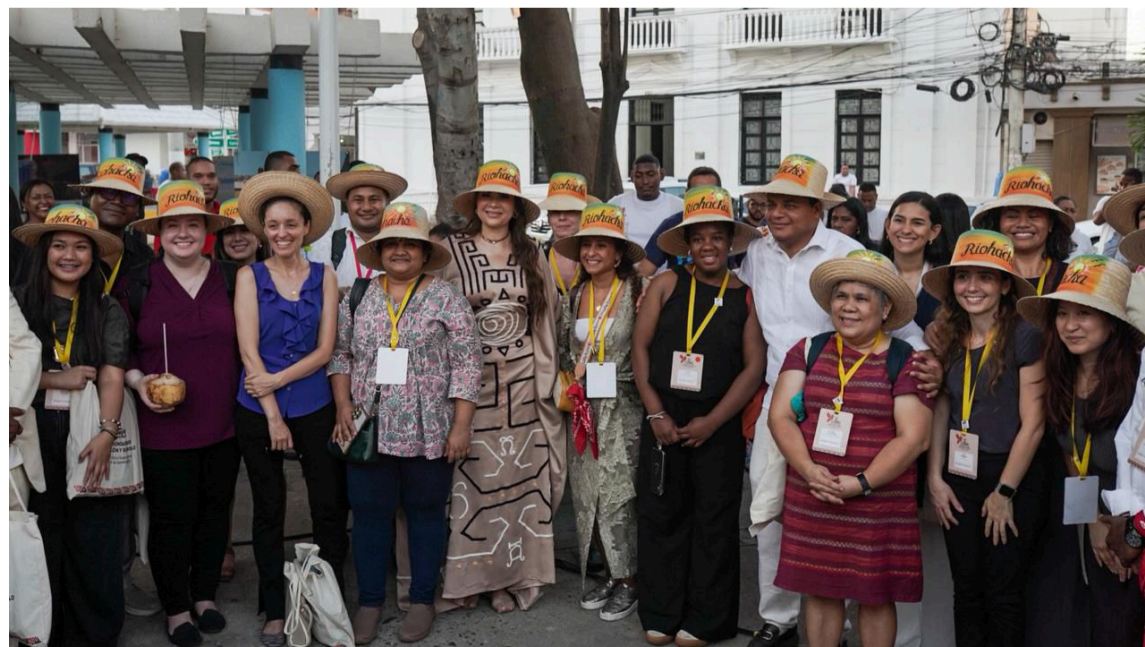
Con la visita de las diferentes delegaciones, la ciudad poco a poco se ha metido en el corazón del mundo.

Que estos 480 años nos encuentren orgullosos y que los próximos 20 nos preparen para mostrarle al mundo, en los 500 años, una ciudad que convirtió su potencial en realidades, que se consolidó como la capital de oportunidades de La Guajira y que seguirá cautivando corazones.