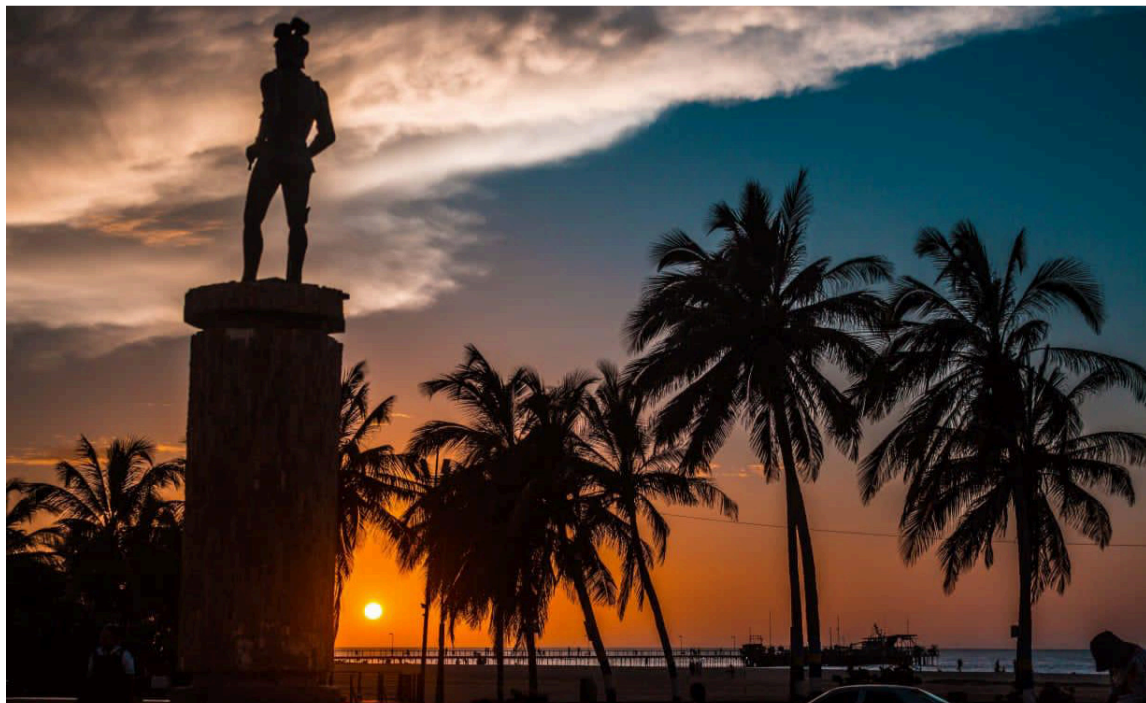
Quiénes estamos por fuera de Riohacha, extrañamos nuestro territorio en pleno, su mar, su río, sus calles y sus historias.

Riohacha 480 años, el tesoro que encabeza a Colombia.