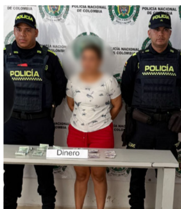
La mujer fue capturada por agentes de la policía.

Según lo informado de manera extraoficial, los propietarios del inmueble se percataron de lo sucedido y de manera inmediata dieron aviso a las autoridades policiales que llegaron hasta la vivienda para verificar lo denunciado, procedieron a detenerla y llevarla hasta la estación de Policía y lue-