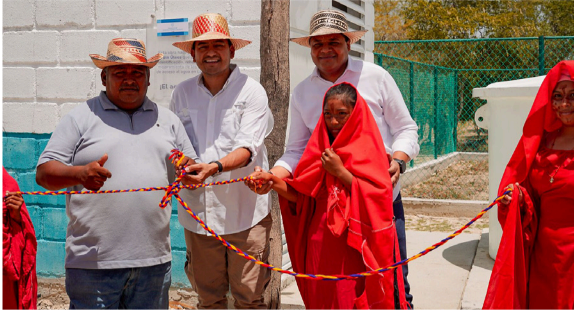
Son 232 sistemas de agua que el Gobierno Petro está entregando a comunidades wayuú.

De igual manera, se llevó a cabo la inauguración del mejoramiento del sistema