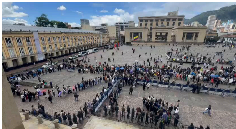
Lo más obscuro es ver cómo se instrumentaliza un sepelio y un cadáver aún insepulto con fines politiqueros.

E n junio advertimos que el atentado contra Miguel Uribe Turbay había fracasado no solo como hecho político, sino también como guión de conmoción emocional.