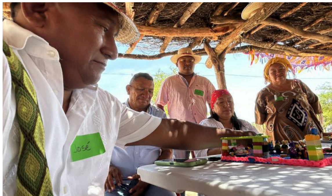
La Junta de Palabrerros wayuú, tiene la última palabra para dirimir los conflictos.