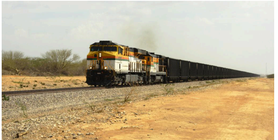
Cerrejón pidió a las comunidades acudir a los mecanismos que brinda la consulta.

Este proceso ha derivado en más de 2.000 iniciativas sociales orientadas a la generación de ingresos, fortalecimiento cultural, infraestructura,