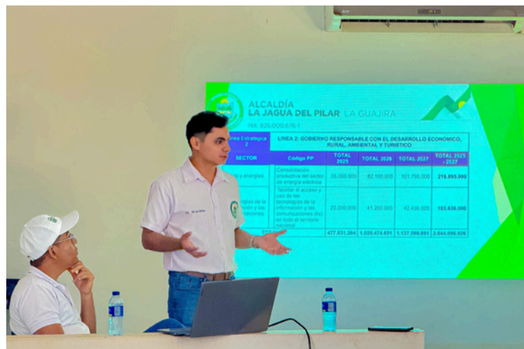
Los equipos sectoriales también realizaron de manera formal la solicitud de incorporación de sus iniciativas al plan.

para la ejecución de las acciones del Gobierno local, enfocadas en el desarrollo integral, la participación ciudadana y la inclusión de todos los sectores del municipio.