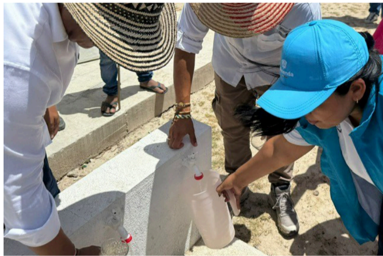
Se llevó a cabo la inauguración del mejoramiento del sistema de agua en la comunidad de Pesua.

El Gobierno nacional ha destinado una inversión superior a $529.036 millo-