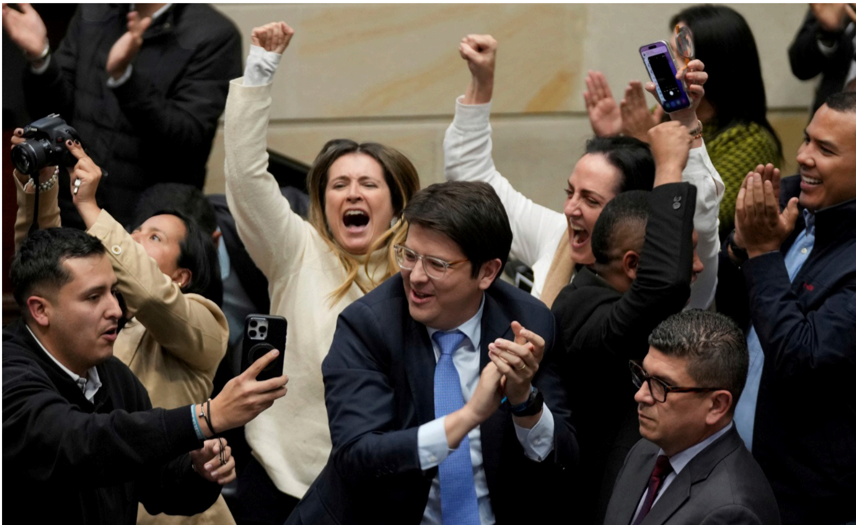
El paso de Miguel Uribe por el sector público no dejó un legado transformador, fue un obstáculo para reformas sociales.

Entre lágrimas televisadas la prensa y la política convierten una muerte en propaganda