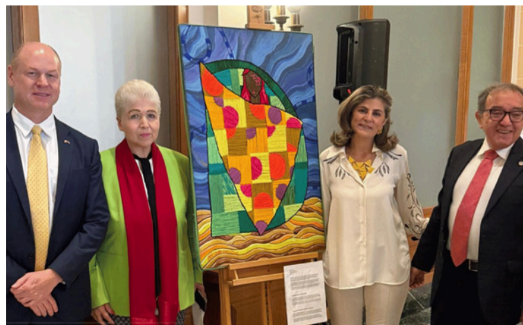
La pieza en óleo sobre hamaca, transforma un objeto tradicional en soporte artístico y símbolo cultural.

Wale’kerū invita a adentrarse en el universo de las mujeres wayuú, reconocidas como guardianas de un legado milenario. En este sistema social matriarcal, las mujeres desempeñan un papel esencial en la transmisión de conocimientos ancestrales y la preservación de prácticas como el tejido, símbolo de identidad colectiva y cohesión social de su pueblo. La obra se erige así como un homenaje a su liderazgo, su historia y su aporte inquebrantable a la preservación cultural.