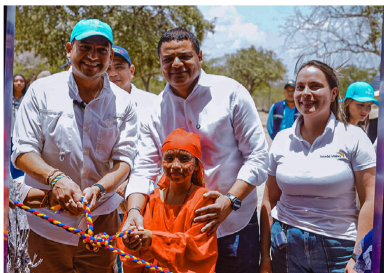
La inversión total en vivienda y hábitat realizada en el Departamento asciende a $136.126 millones.

nes en el departamento de La Guajira, orientada al ordenamiento territorial alrededor del agua y a cerrar brechas en acceso a agua, saneamiento y soluciones habitacionales. Esta inversión ha beneficiado a la fecha a más de 126.000 personas.