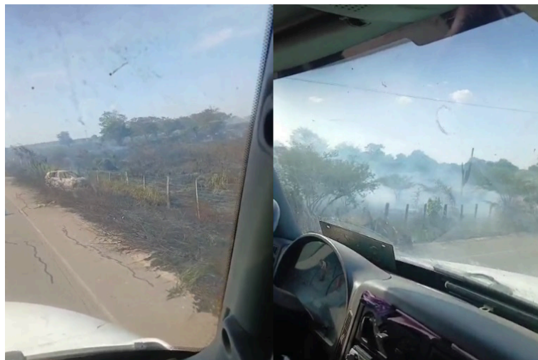
La incineración de un carro generó un incendio forestal y el humo habría causado el choque de dos camiones.