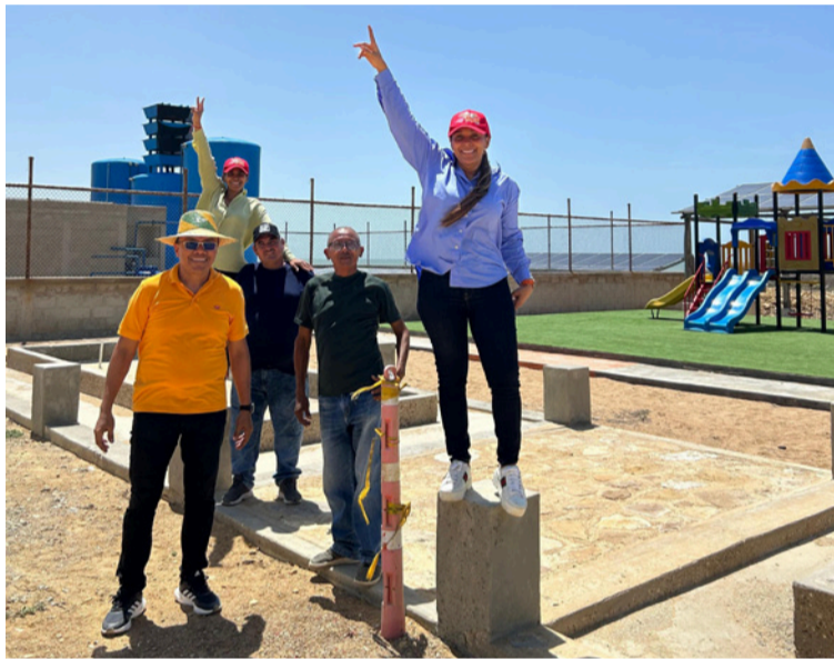
Durante seis meses, el equipo técnico de Esepgua permanecerá en la zona para la fase de prueba y puesta en marcha.

Este proyecto está ubicado a casi seis horas del