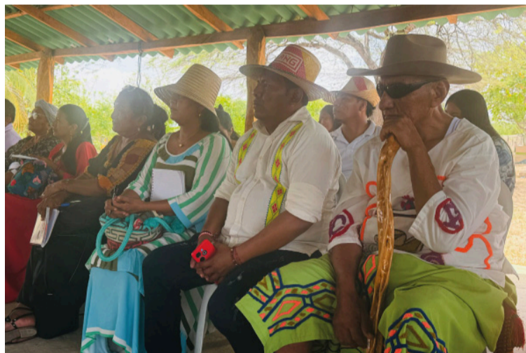
Los indios guajiros no fueron originarios de la península que hoy ocupan y que lleva su nombre.

La Junta de Palabrerros wayuú, tiene la última palabra para dirimir este grave conflicto que con sus leyes autorizadas por la Constitución Política Nacional deben darle solución a estos impases que podrían generar en una zona de riesgo como ocurría en la época de la conquista.