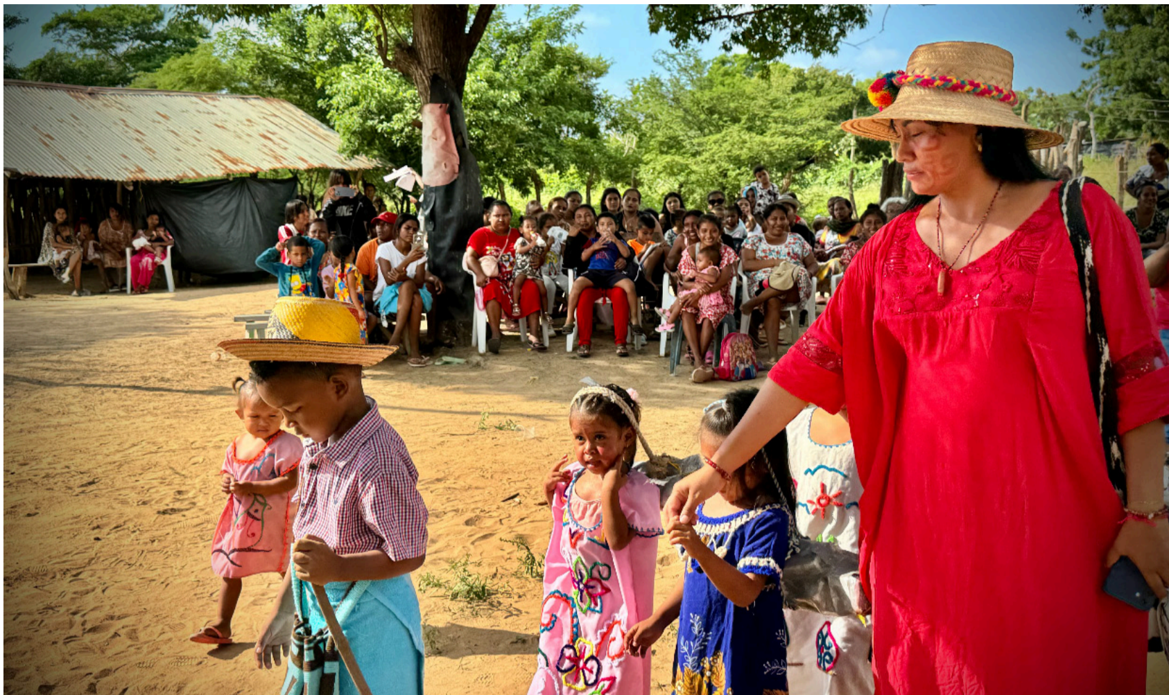
El pueblo indígena guajiro se convirtió en una página de historia bravia, se volvieron indomables, con lucha, tesón y resistencia.