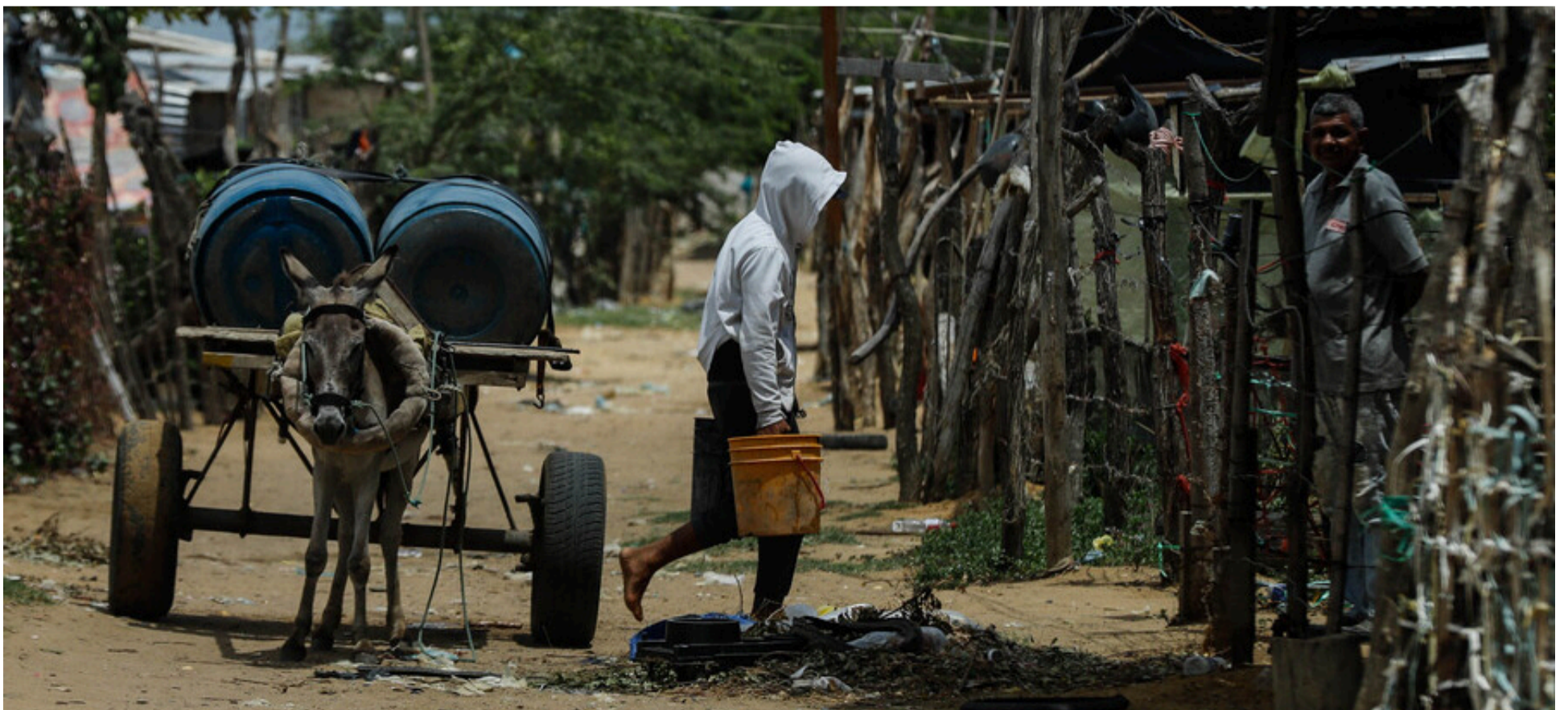
La desigualdad social es el reto por resolver, la brecha entre ricos y pobres sigue siendo una herida abierta, vivimos en un país de contrastes.

Colombia enfrenta desafíos enormes, pero la historia nos ha enseñado que los momentos más difíciles pueden ser el punto de partida para grandes transformaciones, apostemos por la educación, la justicia social, la seguridad, el medio ambiente y una democracia ética e inclusiva, la esperanza no es ingenuidad, sino el motor de quienes saben que el futuro está en nuestras manos, el papel de cada ser humano es manifestar enfoque, propósito y acción; con sentimiento cultural y de pueblo, mi opinión para ti.