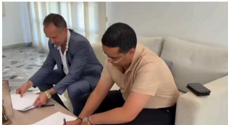
El acuerdo con el PMA busca recuperar el río Ranchería y proteger los manglares y bosques secos.

mejor mañana", expresó Nils Grede, director de país del Programa Mundial de Alimentos en Colombia. La Gobernación de La Guajira reafirma su compromiso de trabajar con aliados estratégicos para fortalecer sus capacidades institucionales, proteger el medioambiente y mejorar la calidad de vida de la población del Departamento.