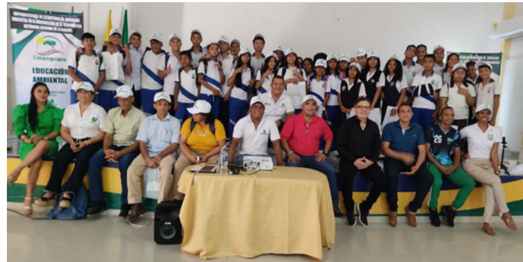
Se indicó que la iniciativa de educación, busca conectar a la comunidad con su entorno natural.

Sin duda la comunidad del sur del departamento