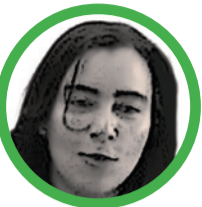
Por Yarlin Carolina Díaz Bonilla