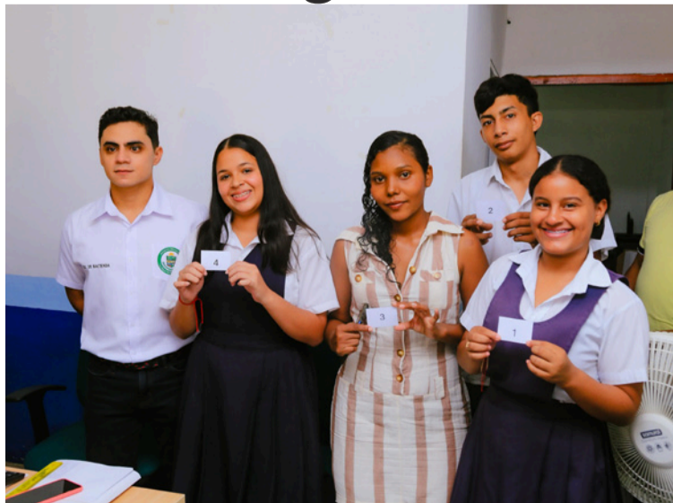
En el proceso democrático participarán cuatro listas independientes y dos partidos políticos.

Las listas están conformadas por estudiantes de los grados 9°, 10° y 11° de la Institución Educativa Técnica Agropecuaria Anaurio Manjarrez, así como por miembros de un núcleo familiar comprometido con el liderazgo juvenil, y representantes de los partidos ASI (Alianza Social Independiente) y Centro Democrático.