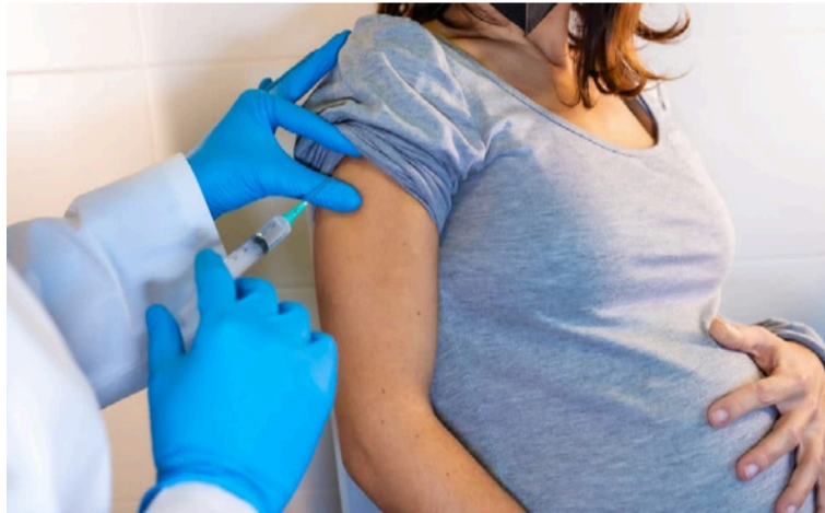
El proyecto que se realiza a través del PAI, busca alcanzar una cobertura del 95% en esta población.

Este proyecto que se realiza a través del Programa Ampliado de Inmunizaciones (PAI), busca alcanzar una cobertura del 95% en esta población, con el objetivo de reducir significativamente la morbilidad y mortalidad en la prime-