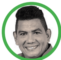
Por Coco Ramos

E ra un 12 de mayo de 1980. Para Urumita, un rinconcito escondido al extremo sur de La Guajira, extremo norte de Colombia, colmado de flores y calagualas, con bellos jardines, no sería un día normal.