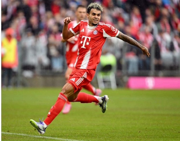
El jugador colombiano también destacó su entusiasmo por integrarse con sus nuevos compañeros.

El jugador también destacó su entusiasmo por integrarse con sus nuevos compañeros y su objetivo de contribuir al éxito del equipo. "Las impresiones son increíbles, me siento cómodo y feliz en estos primeros días. Cada vez iré conociendo más a mis compañeros para juntarnos y ayudar al equipo. Feliz por estar acá. Mis objetivos, como dije antes,