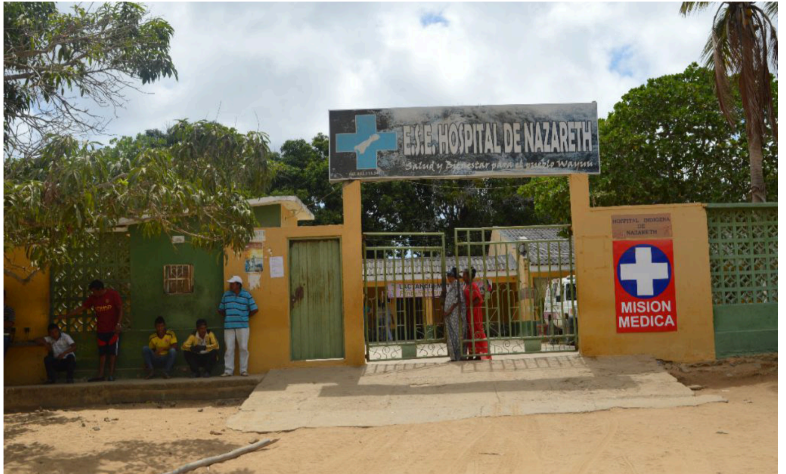
Los hospitales públicos necesitan mejoras en infraestructura para atender a un mayor número de pacientes.

No se pueden dejar de lado los riesgos y las preocupaciones de implementar un modelo donde los hospitales públicos serán la puerta de entrada de los pacientes al sistema para su atención, sin la preparación integral correspondiente. Aterrizando el tema a La Guajira quien cuenta con 16 hospitales públicos en 15 municipios (Uribe cuenta con dos, el local y el de Nazareth) con 1.073.851 de habitantes, sin con-