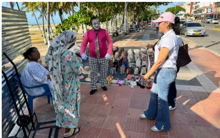
Se busca sensibilizar a vendedores y transeúntes sobre la importancia del cuidado del jardín de la Avenida Primera.

Corpoguajira realizó una jornada lúdica en la calle primera de Riohacha, con el objetivo de sensibilizar a vendedores y transeúntes sobre la importancia del cuidado del jardín