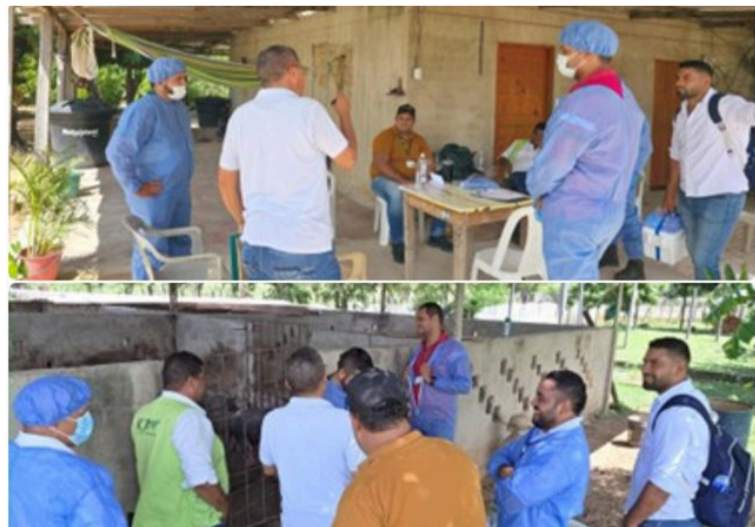
La Guajira, con más de 330 mil bovinos, y 83 mil porcinos es clave en la vigilancia epidemiológica nacional.

El simulacro refuerza el compromiso del ICA con el campo colombiano, la protección del estatus sanitario nacional y la construcción de un territorio rural más seguro, próspero y en paz.