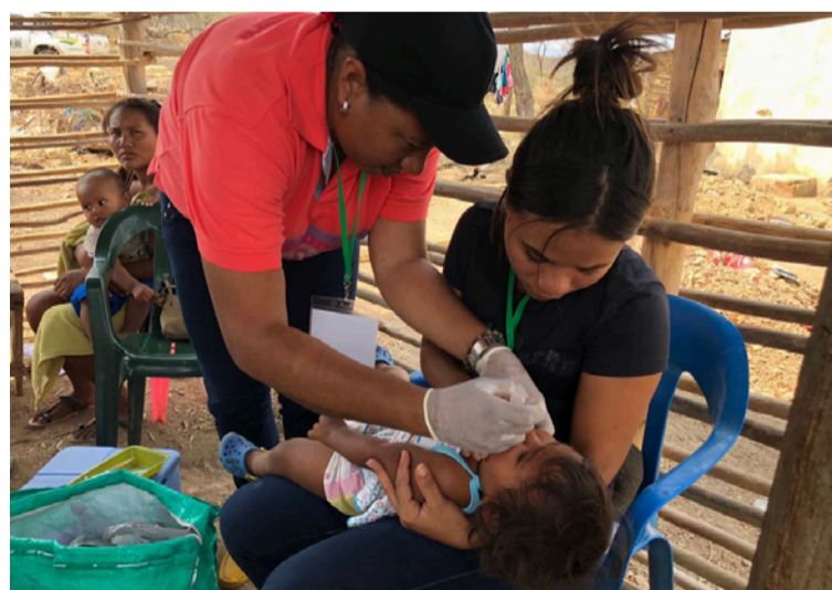
La tasa de mortalidad materna y los índices de mortalidad infantil asociados a la desnutrición son altos.

importante con la implementación del nuevo Decreto y se convertirán en gran medida en representantes de los pacientes.