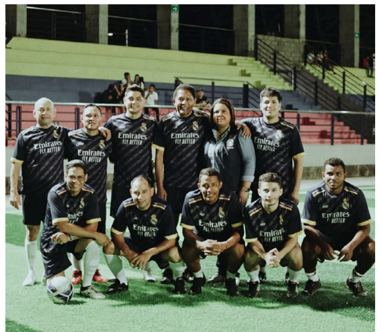
La actividad deportiva tuvo como objetivo fomentar los buenos hábitos de salud cardiovascular.

Desde la Administración municipal se reafirma el compromiso de seguir impulsando estas iniciativas que transforman y fortalecen el tejido social de Villanueva.