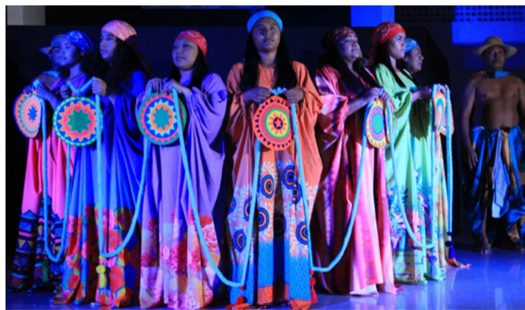
Los pueblos originarios son los guardianes de aproximadamente el 22% del territorio planetario.

En agosto se conmemora a los pueblos indígenas en el mundo y por tercera vez el Centro nacional de las Artes celebra el Encuentro de Pueblos Ori-