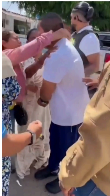
La captura de esta persona se efectuó en un sector de Punta Gallinas en la Alta Guajira, municipio de Uribia.

desde este punto de La Guajira, hacia la ciudad de Riohacha y luego para ir hasta Bogotá.