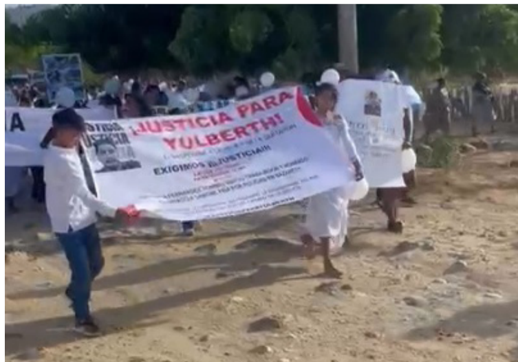
Familiares del joven wayuú están a la espera de que la Fiscalía General de la Nación entregue resultados.

Según lo manifestado por sus familiares, hasta la fecha no hay indicios de avances en la investigación por la muerte de Fernández Gómez, ocurrida el pasado 4 de