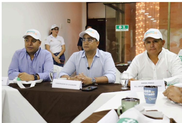
El objetivo es que los estudiantes sigan un proceso para que los resultados en las pruebas mejoren sustancialmente.

Agregó, que es injusto cuando se observa a los estudiantes de La Guajira, preocupados porque ellos no tienen los pun-