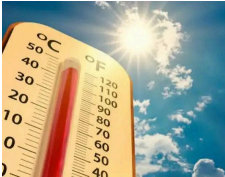
Será una semana calurosa con temperaturas entre los 36 a 39 °C y sensación térmica por encima de los 40 °C.

nes meteorológicas se estiman para lo que resta de la presente semana con predominio de tiempo mayormente seco en algunos lugares del sur de la península.