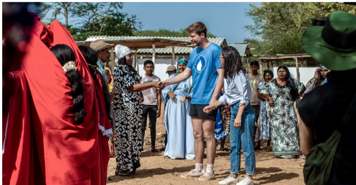
Esta es la primera campaña que apunta a romper la apatía frente al problema del agua.

MrBeast y Mark Rober liderarán la iniciativa mediante videos con llamado a la acción en sus plataformas, activando una red global de creadores para concientizar y pro-