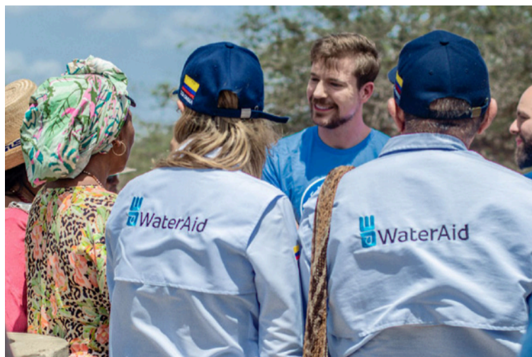
MrBeast y Mark Rober liderarán la iniciativa mediante videos con llamado a la acción en sus plataformas.

#TeamWater es la tercera campaña medioambiental a gran escala liderada por Donaldson y Rober, tras el éxito de #Tea-