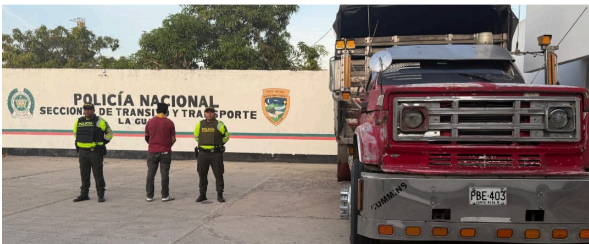
Todos los capturados fueron dejados a disposición de las respectivas fiscalías en turno.

cual también presentaba requerimiento por hurto, según una denuncia instaurada el 30 de agosto de 2023 ante la Fiscalía Capiv en Bogotá.