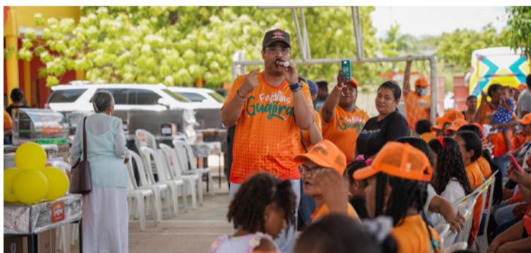
Tras recibir los insumos, las familias beneficiadas se preparan ahora para participar en el Festival del Chivo.