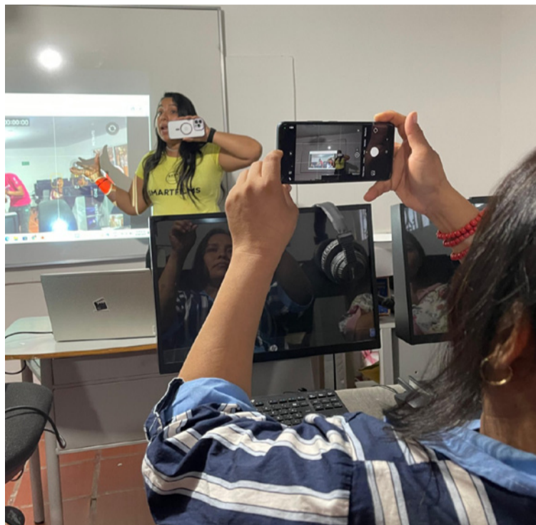
Los talleres están estructurados para ofrecer formación técnica y narrativa de manera accesible y eficaz.

Los talleres están estructurados para ofrecer formación técnica y narrativa de manera accesible y eficaz. Los asistentes