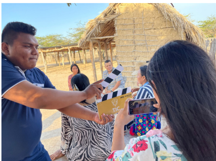
El departamento de La Guajira dijo presente y el festival recibirá historias de nuestra tierra.

aprenderán a optimizar el uso del celular, construir guiones, manejar planos e iluminación, y adquirirán conocimientos en dirección de actores, fotografía, sonido, edición y postproducción, así como en la gestión de derechos de autor y formatos de cesión.