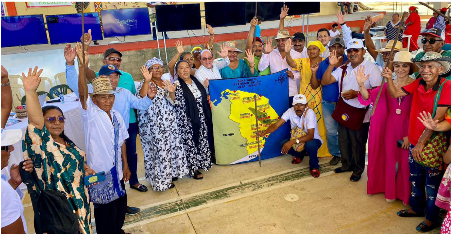
Es imperativo que el Estado implemente mecanismos más rigurosos para verificar la autenticidad de las reclamaciones étnicas.

Se aprovechan de los beneficios ajenos para vivir sabroso