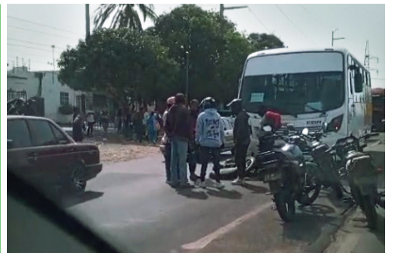
Las autoridades iniciaron indagaciones para determinar las responsabilidades en este accidente vial.