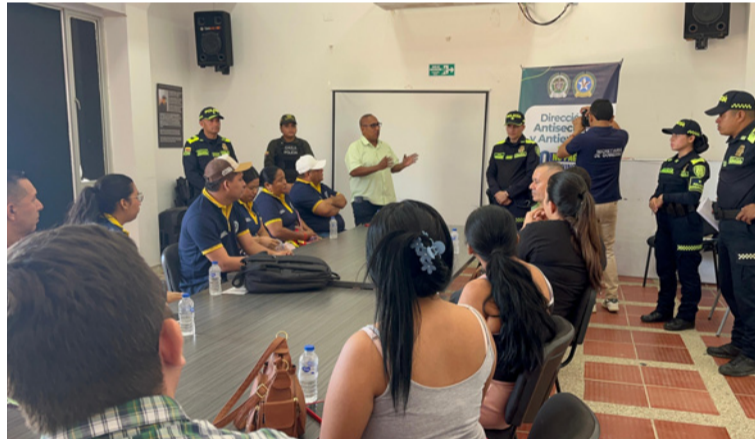
La comunidad fue invitada a denunciar si está siendo víctima de extorsión a través de la línea 165.

Durante estas actividades, se han llevado a cabo visitas puerta a puerta en los diferentes establecimientos comerciales y se