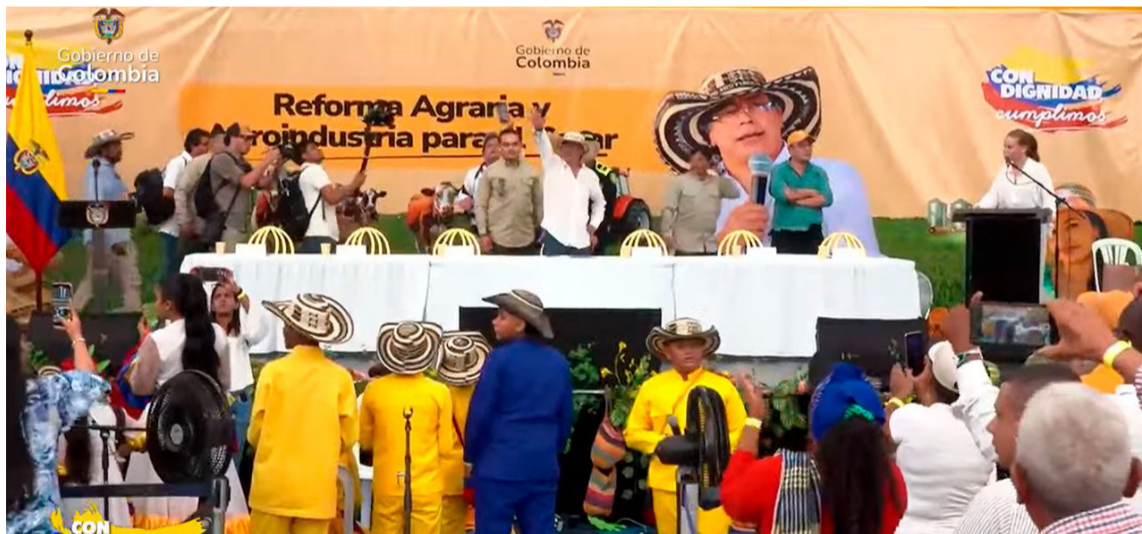
Se han entregado 31.128 hectáreas en el Cesar a más de cuatro mil familias.

En un evento considerado como histórico, centenares de familias campesinas e indígenas del Cesar, recibieron de manos del jefe de Estado las actas de entrega que los convierte en propietarios de tierra, insumos y activos para fortalecer sus proyectos agrícolas.