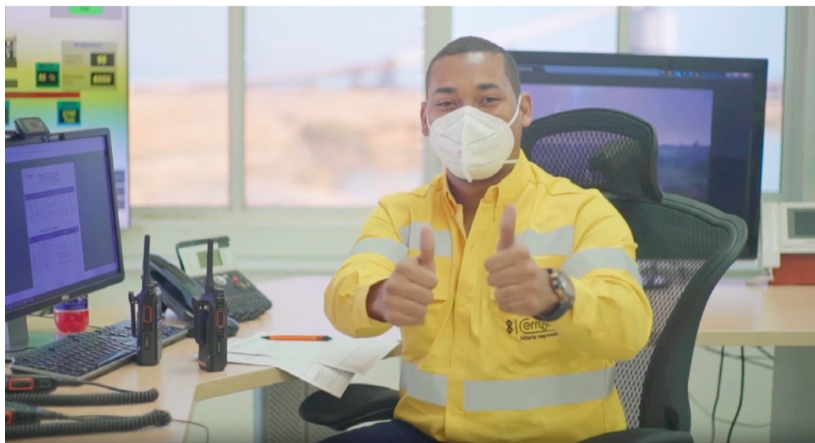
La corporación instó a las fuerzas vivas de La Guajira a una nueva visión de desarrollo.

De acuerdo con las cifras entregadas, en 2024 Cerrejón aportó más de 13.700 empleos directos,