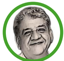
Por Jesualdo Fernández Valverde