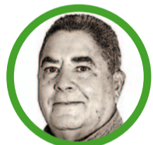
Por Álvaro López Peralta