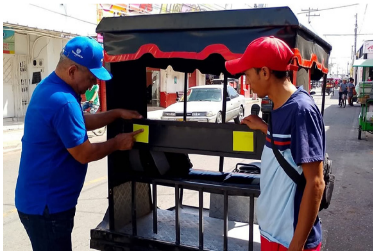
A los mototaxistas se les instalaron cintas reflectivas para mejorar la visibilidad nocturna y prevenir accidentes.

Con el propósito de reducir la siniestralidad y fomentar el respeto por las normas de tránsito, en Villanueva se llevó a cabo una jornada