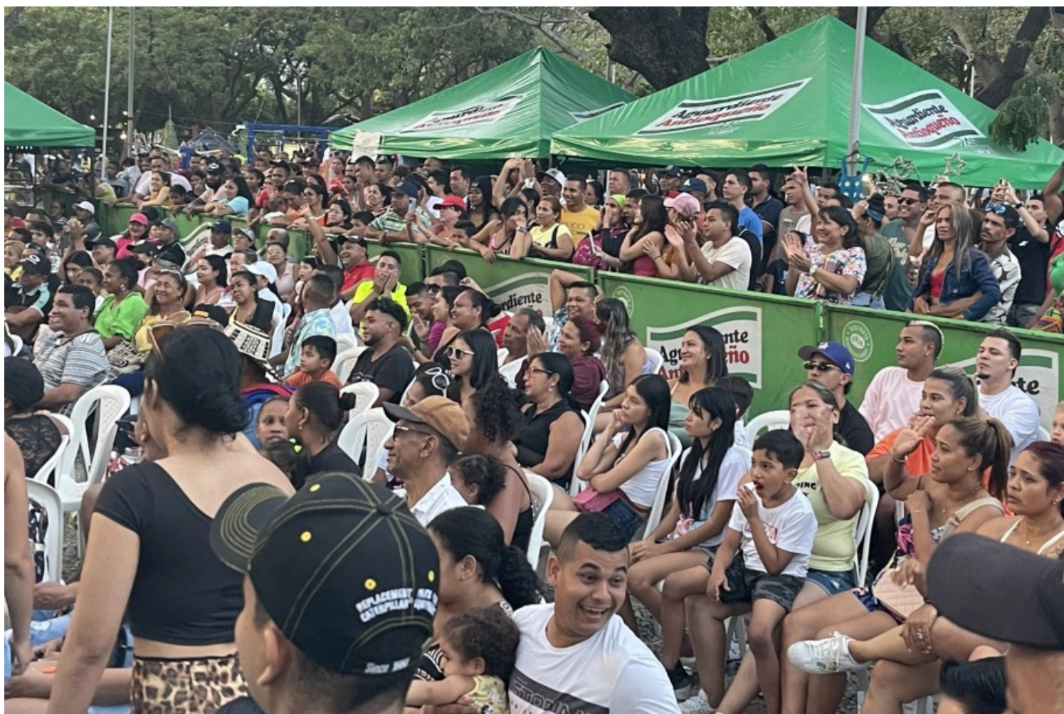
El próximo viernes 29 de agosto se abre el telón de la IV versión del Festival Ecológico, Un Canto al Río.

Un modus vivendi que le permite ser nómada musical