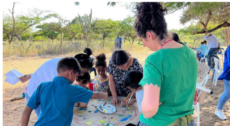
La protección de los derechos étnicos no puede convertirse en una puerta trasera para el fraude.

El problema fundamental radica en que la legislación colombiana privilegia el criterio subjetivo del autorreconocimiento sobre elementos objetivos de pertenencia