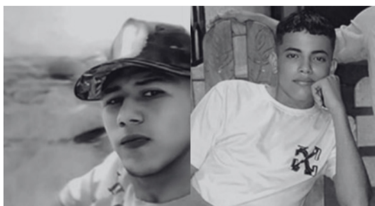
Campesinos de la zona alertaron a la comunidad sobre el hallazgo de los cadáveres de los jóvenes.

Familiares de las víctimas elevaron un enérgico llamado a las autoridades competentes por no haber acudido oportunamente al sitio del hallazgo para realizar las diligencias correspondientes. Ante esta situación, se vieron obligados a trasladar por sus propios medios los cuerpos sin vida hasta el casco urbano de Fundación.