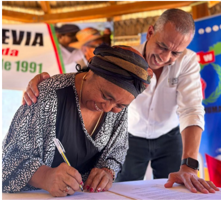
Durante la protocolización, se firman formalmente los acuerdos alcanzados con las comunidades tras los diálogos.

Cerrejón continúa avanzando en el cumplimiento de los compromisos adquiridos con las comunidades vecinas, en el marco de las consultas previas de la Sentencia T-704 de 2016 y de la línea de transmisión eléctrica.