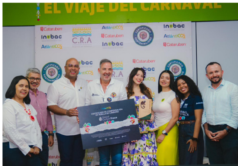
El Plan de Descarbonización 2026 es el resultado de un proceso técnico y participativo.

El Carnaval de Barranquilla ha dado un nuevo paso histórico hacia la sostenibilidad al medir su huella de carbono, realizar la caracterización ambiental de sus eventos y presentar oficialmente su Plan de Descarbonización 2026.