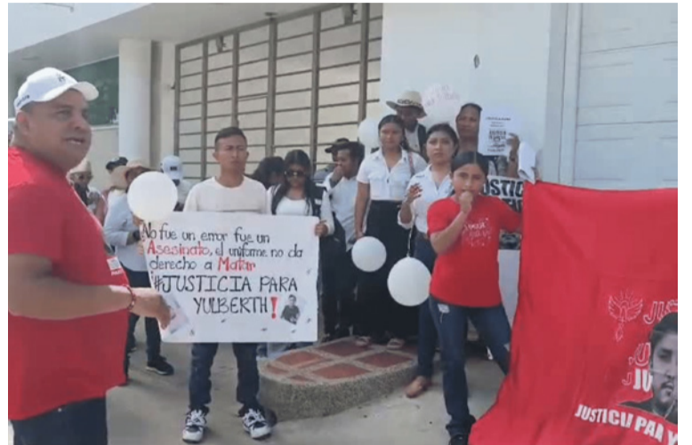
Dijeron los manifestantes que su propósito es lograr que la justicia actúe con transparencia y celeridad.

Por otra parte, los familiares han aclarado que en este hecho no hubo ningún enfrentamiento ni cruces de disparos, por lo que hay una situación confusa que la Fiscalía debe esclarecer y que sean judicializados los res-