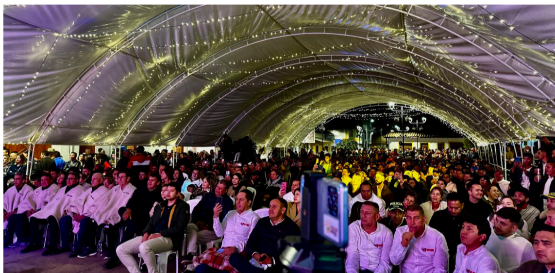
Estar un fin de semana en Nobsa, Boyacá, garantiza un reconocimiento social.

Hagamos una diferenciación del músico en general, que por naturaleza de su profesión debe viajar permanentemente a los lugares del país o del mundo donde es contratado y debe hacer sus presentaciones, ese es bien