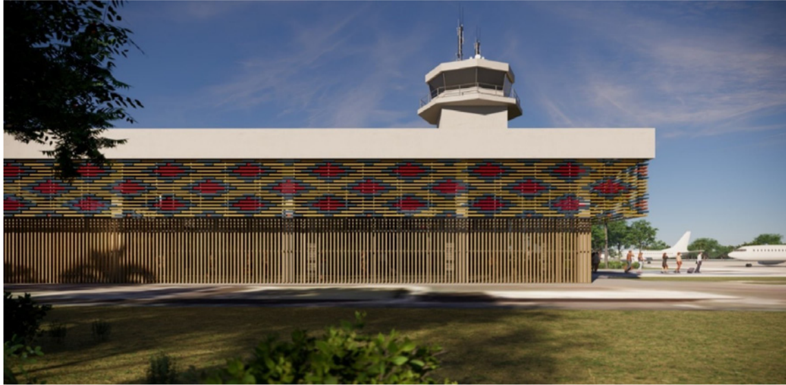
La nueva fachada de la terminal incorporará elementos inspirados en la cultura wayuú.

minal aérea tendrá una particularidad: su nueva fachada incorporará elementos inspirados en la cultura wayuú, como patrones geométricos, colo-