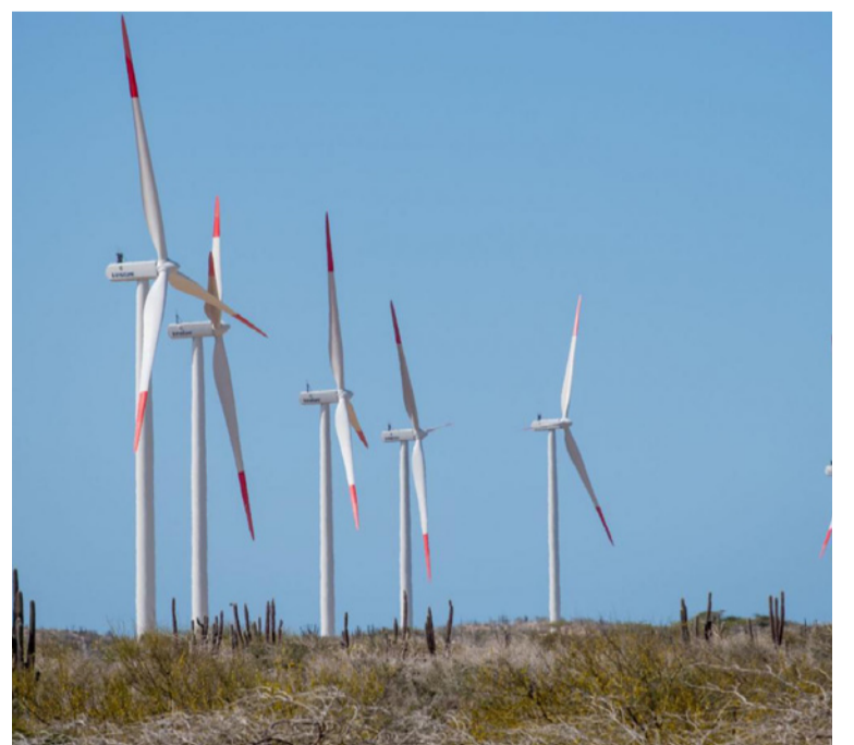
Así las cosas, La Guajira se convierte es un epicentro del conocimiento en energías renovables.