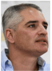
Andrés Julián Rendón, gobernador de Antioquia.

El partido Centro Democrático (CD), acusó a la Fiscalía General de la Nación de llevar a cabo una persecución judicial en contra del gobernador de Antioquia, Andrés Julián Rendón, tras revelarse que el mandatario habría sido objeto de interceptaciones telefónicas durante 71 días de manera irregular.