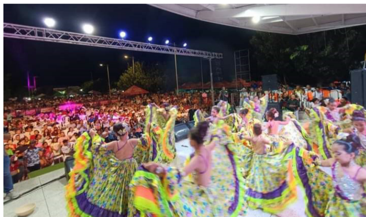
Un buen grupo de estos músicos nómadas, no los van a encontrar en cualquier festival del país.

Estar un fin de semana en Nobsa, Boyacá, el otro en Barrancabermeja, Santander, el siguiente en Fonseca, La Guajira y el próximo en Sahagún, Córdoba, participando como compositor en canción inédita, como guacharaquero y cantante en el concurso de acordeón aficionado, pero además, también en el concurso de piquería, te garantiza que con la calidad que sabes que tienes y el reconocimiento social de la misma, obtendrás unos ingresos semanales casi