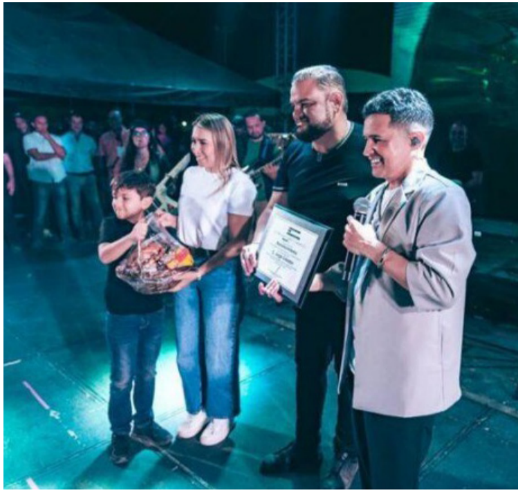
Jorge Celedón agradeció a Dios por esta nueva bendición y compartió este reconocimiento con sus seguidores.

El artista interpretó las canciones 'Lo que tú necesitas', 'No podrán separarnos', 'Te haré feliz', 'Pa-