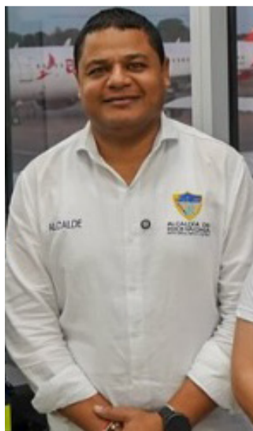
Genaro Redondo, alcalde de Riohacha.

La Universidad de La Guajira, reconocida como una institución inclusiva, acreditada e innovadora, ratifica, con este hecho, su papel como motor de transformación, esperanza y oportunidades para toda la juventud del Departamento.