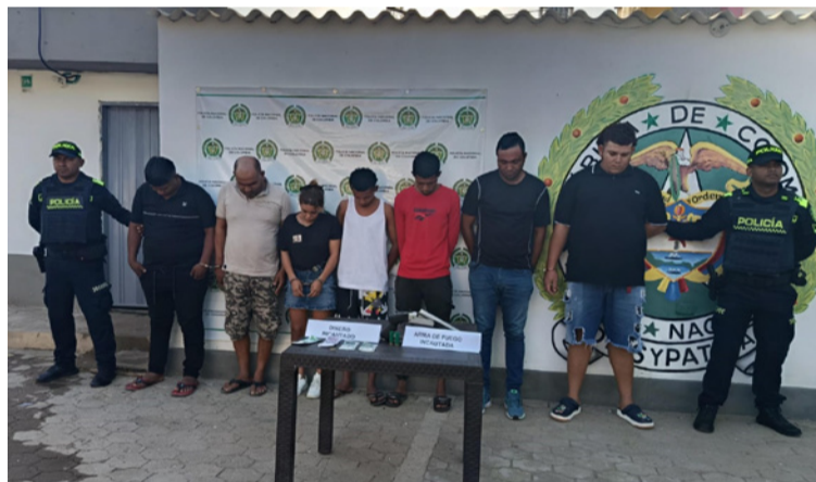
De acuerdo con una alerta ciudadana, al parecer los sospechosos pretendían cometer un hurto.

En el despliegue del plan, pudieron ubicar el automóvil cuando se desplazaba por la entrada al municipio, exactamente por el letrero de 'Bienvenido a Uribia'. Allí se movilizaban siete personas, a quienes les dieron la orden de Policía de descender del automotor para practicar una requisa. Al realizar el registro del vehículo, se encontró un arma de fuego tipo escopeta debajo del asiento trasero, lo que llevó a los ocupantes a ofrecer dinero para evitar el pro-