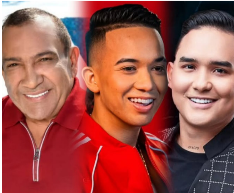
Están confirmados artistas de la talla de 'Beto' Zabaleta, Samuel Morales y Daniel Restrepo.

La versión número 29 del Festival Vallenato Mar de Acordeones de Santa Marta se realizará del 9 al 12 de octubre con una agenda que rinde homenaje a la tradición, la música y la cultura vallenata, patrimonio