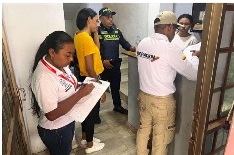
Se busca generar conciencia y la adopción de buenas prácticas en la utilización de los servicios turísticos.

También se busca generar conciencia, cultura de legalidad y la adopción de buenas prácticas en la utilización de los servicios turísticos. Por último, se dieron a conocer los canales de denuncia y las líneas de atención inmediata 123 de la Policía Nacional y el 141 del Icbf.