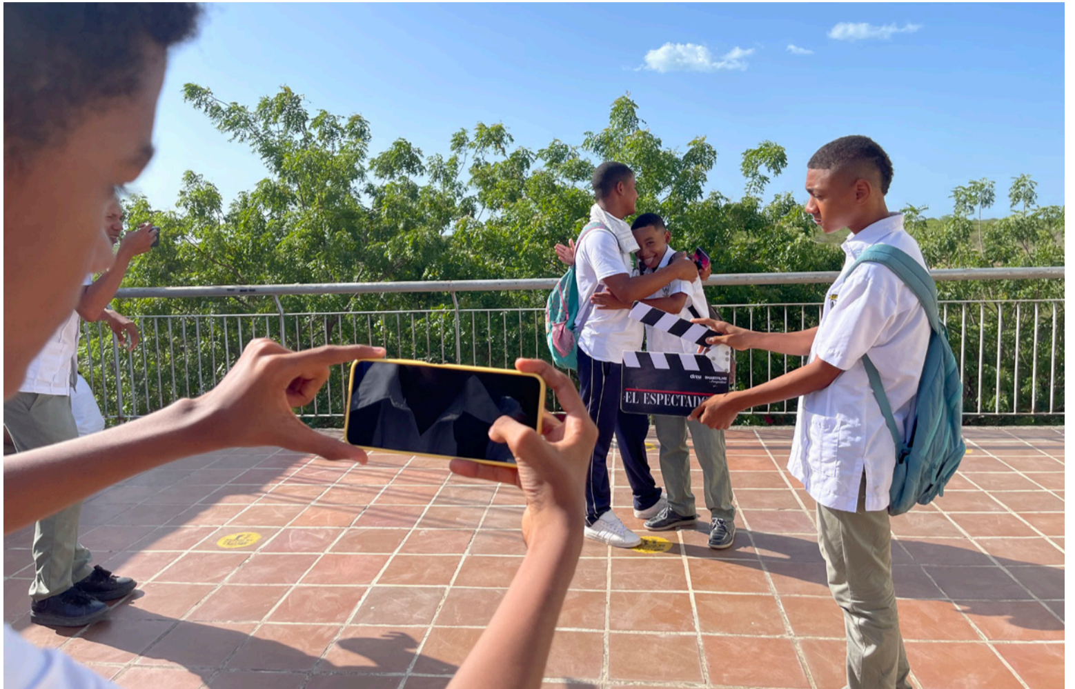
Se busca ofrecer herramientas para que las comunidades narren sus propias historias desde su realidad.

Es importante mencionar que los talleres están diseñados con un enfoque diferencial que busca empoderar a las comunidades étnicas, brindándoles oportunidades reales de acceso a la tecnología, la empleabilidad, la productividad y el emprendimiento. Smartfilms® en alianza con MinCIT (Ministerio de Comercio, Industria y Turismo) lleva más de 10 años trabajando en el firme propósito de democratizar el cine, desarrollando procesos formativos en producción audiovisual creativa que validan competencias clave para transformar vidas.